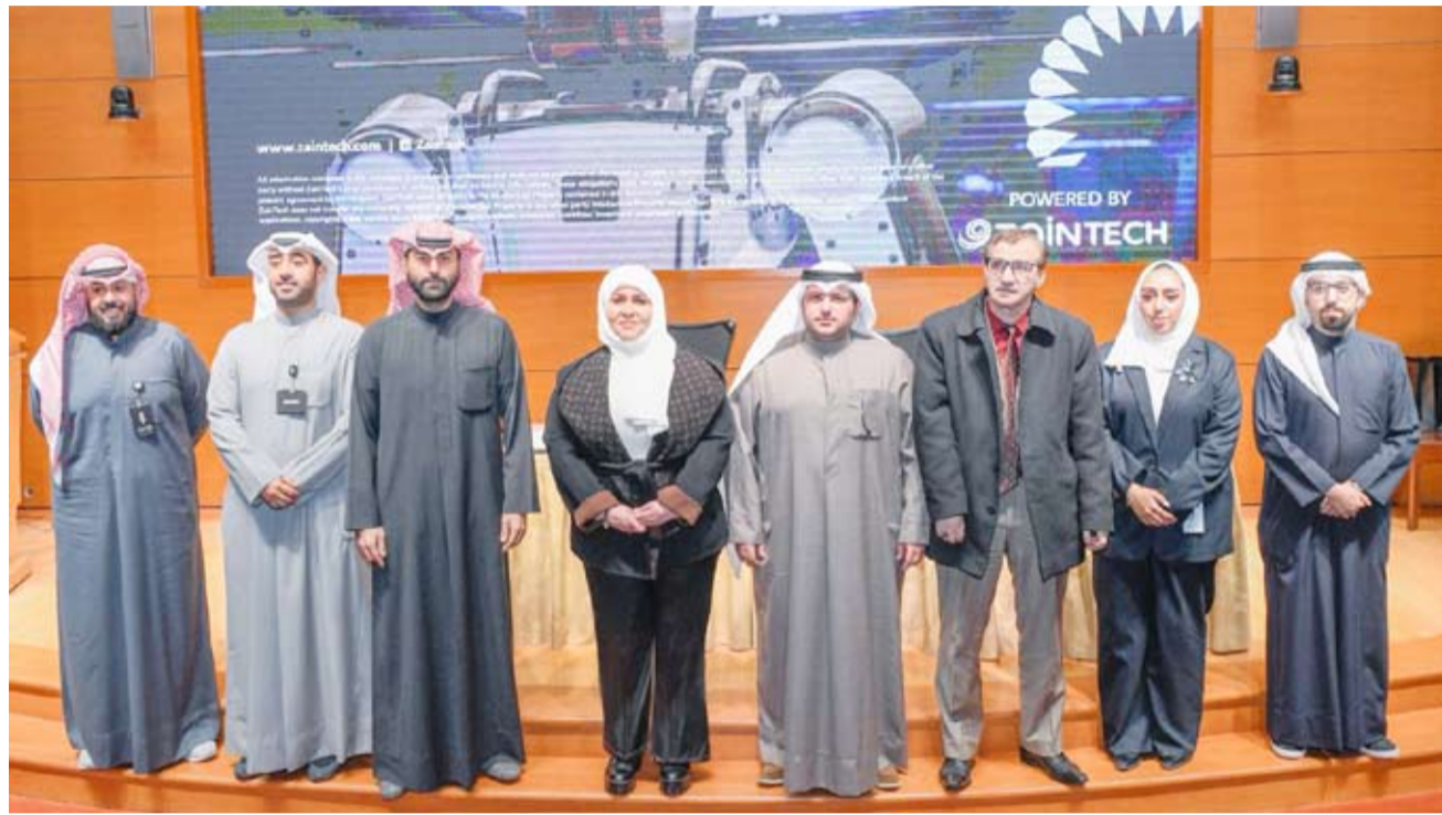
صورة جماعية للمشاركين

اتخاذ قرارات مستنيرة وتحسين الكفاءة التشغيلية وتعزيز تجارب العملاء.