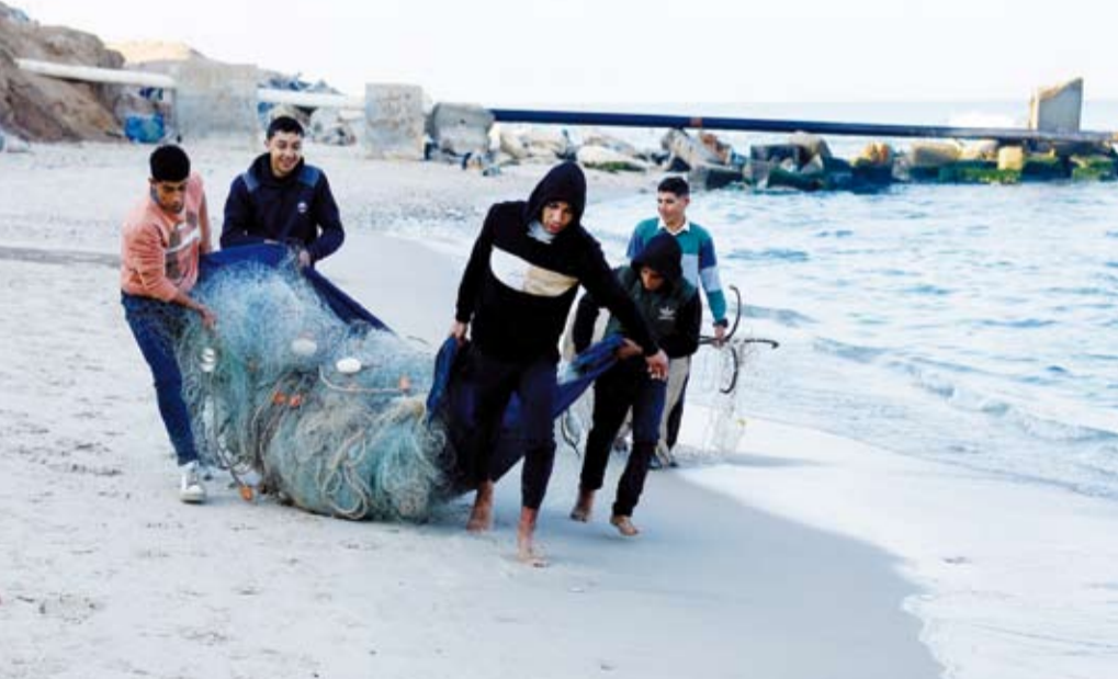
صيادون فلسطينيون في غزة