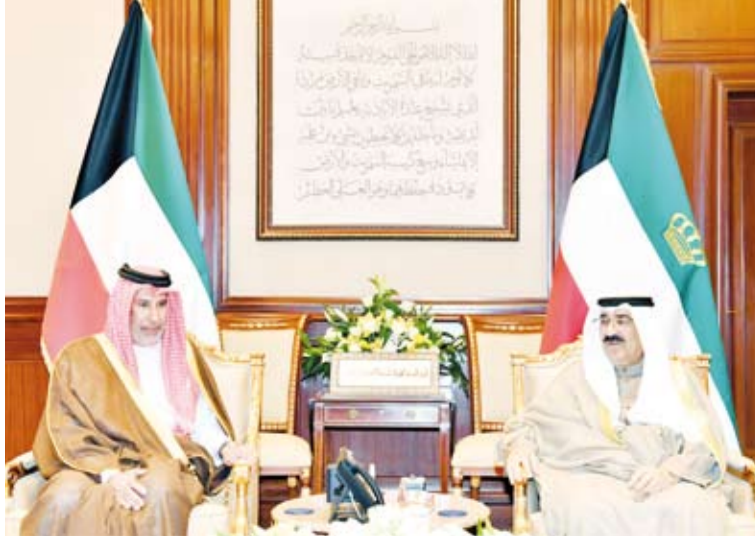
سمو أمير البلاد يستقبل الشيخ حمد بن جاسم

اللقاء كبار المسؤولين بالذلة. من جهة أخرى، بعث صاحب السمو أمير البلاد الشيخ مشعل لويس إيناسيو لولا دا سيلفا رئيس جمهورية البرازيل الاتحادية الصديقة، عبر فيها سموه عن خالص تعازيه وصادق مواساته بضحايا الفيضانات جراء الأمطار الغزيرة التي هطلت على ولاية ريو دي جانيرو، والتي أسفرت عن سقوط العديد من الضحايا والمصابين وتدمير للمرافق العامة وللممتلكات الخاصة. راجيا سموه للمصابين سرعة الشفاء وبأن يتمكن المسؤولون في البلد الصديق من تجاوز آثار هذه الكارثة الطبيعية.