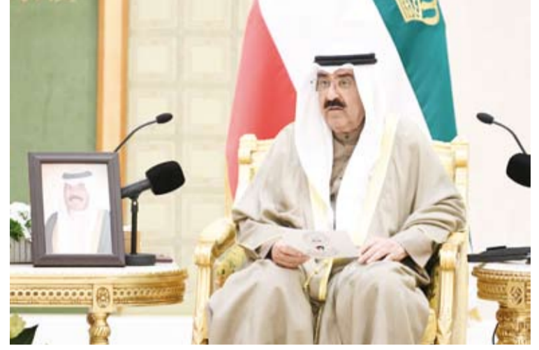
سمو أمير البلاد متحدثاً

صدر أمر أميري بلقب رئيس مجلس الوزراء وجاء فيه: -بعد الإطلاع على الدستور- وعلى الأمر الأميري الصادر بتاريخ 22 جمادى الآخرة 1445هـ الموافق 4 يناير 2024 بتعيين رئيس مجلس الوزراء، أمرنا بالآتي: مادة أولى: تكون مخاطبة رئيس مجلس الوزراء على النحو التالي: سمو الشيخ الدكتور محمد صباح الصباح - رئيس مجلس الوزراء، - على رئيس مجلس الوزراء والوزراء تنفيذ أمرنا هذا من تاريخ صدوره، وينشر في الجريدة الرسمية. أمير الكويت مشعل الأحمد الجابر الصباح صدر بقصر السيف في 5 رجب 1445 هـ الموافق: 17 يناير 2024.