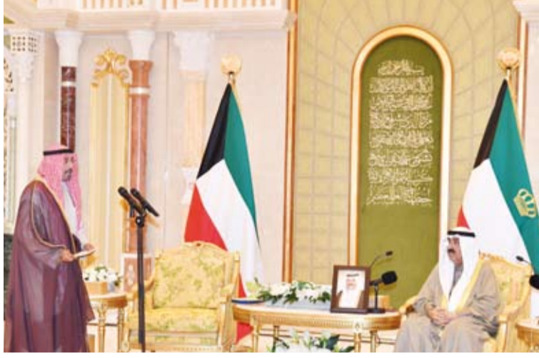
سمو الشيخ محمد الصباح يؤدي اليمين الدستورية