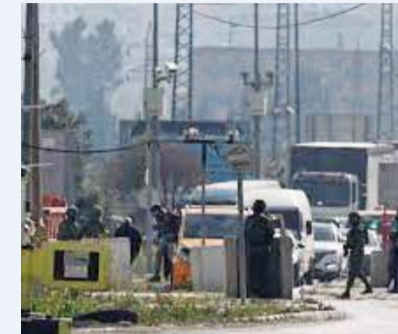
مركبات تابعة للجيش الاحتلال

نقل التلفزيون الفلسطيني عن الهلال الأحمر قوله، إن أربعة أشخاص قتلوا في قصف إسرائيلي بالطيران المسير على مخيم طولكرم في الضفة الغربية، في أعقاب غارة مماثلة أدت إلى مقتل ثلاثة فلسطينيين في نابلس.