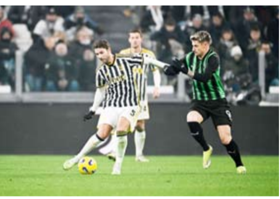
فوز مهم لليوفي في الكالتشيو

سجل المهاجم دوسان فلاهوفيتش ثنائية رائعة في الشوط الأول قادت يوفنتوس للفوز 3-صفر على ضيفه ساسولو ضمن دوري الدرجة الأولى الإيطالي لكرة القدم، ليحافظ فريق المدرب ماسيميليانو أليجرى على سجله خاليا من الهزائم في الدوري خلال 15 مباراة متتالية. واقتتح فلاهوفيتش التسجيل في الدقيقة 15 إثر تسديدة قوية من خارج منطقة الجزاء ثم أضاف الهدف الثاني في الدقيقة 37 إثر ركلة حرة من مدى بعيد. وأحرز البديل فيديريكو كيزيرا الهدف الثالث لأصحاب الأرض في الدقيقة 89.