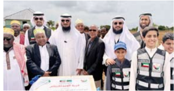
وضع حجر الأساس لإنشاء قرية الخنة لايتام