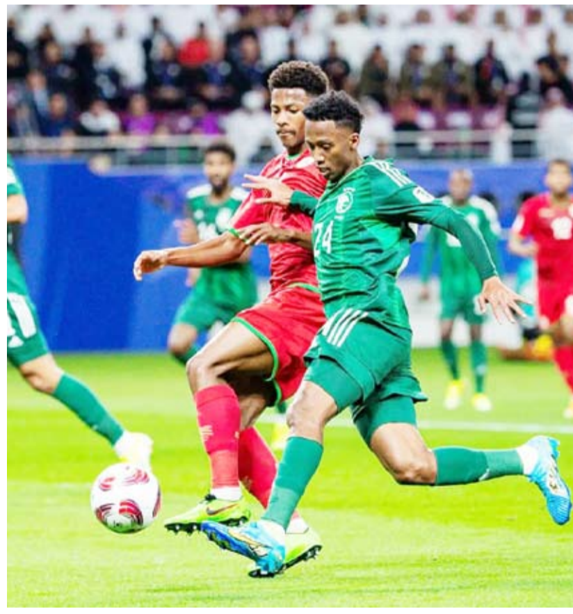
الأخضر كسر صمود عمان في الوقت القاتل

قلبت السعودية تأخرها أمام عمان وخرجت فائزة 2-1 في الرمق الأخير في مباراة يديرها الخليج على استاد خليفة ضمن منافسات من كأس آسيا لكرة القدم في قطر. وسجل عبد الرحمن غريب (78) وعلي البلهبي (90+7) هدفي السعودية، وصلاح البحياني (14) من ركلة جزاء هدف عمان. وكانت تايلاند تغلبت على قبرغيزستان 2-0 في وقت سابق ضمن المجموعة ذاتها، فقصرت أهداف المجموعة بفارق الأهداف عن السعودية.