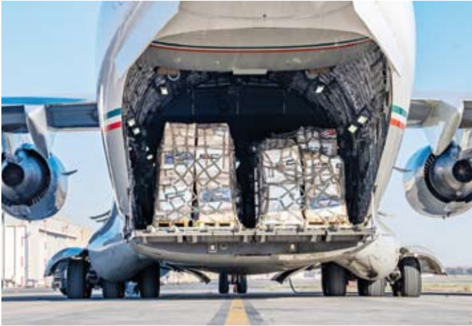
جانب من المساعدات الإغاثية المتنوعة في طريقها لقطاع غزة