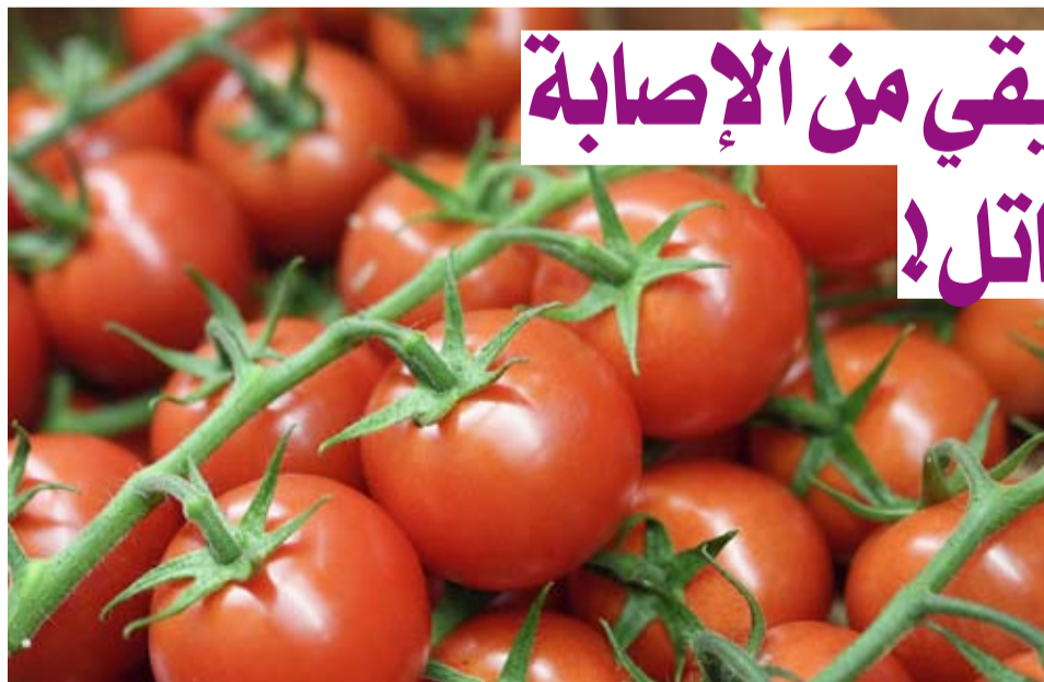
الطماطم تقي من الإصابة بارتفاع ضغط الدم

سنوات، 7056 رجلاً وامرأة تتراوح أعمارهم بين 55 و80 عاماً، وكان 5821 منهم يعانون من ارتفاع ضغط الدم، ما يزيد من خطر الإصابة بالنوبات القلبية وأمراض القلب والسكتة الدماغية وأمراض الكلى والخرف الوعائي وتمدد الأوعية الدموية. وقسموا المشاركين إلى 4 مجموعات اعتماداً على استهلاكهم من الطماطم، أقل من 44 غراماً، وبين 44 و82 غراماً، و82 إلى 110 غرامات، وأكثر من ذلك.