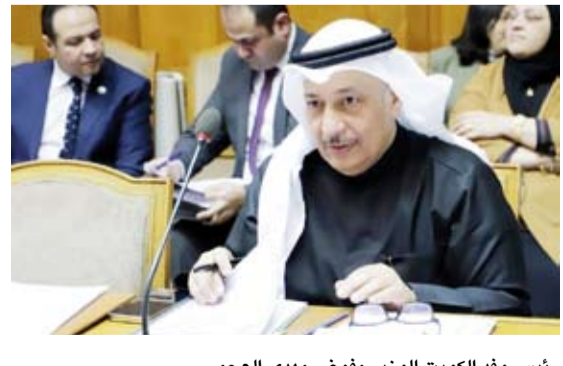
رئيس وفد الكويت الوزير مفوض مهدي العجمي

انطلقت يوم أمس، أعمال اجتماع اللجنة المشتركة من خبراء وممثلي وزارات العدل والداخلية والجهات المعنية في الدول العربية لتحديث مشروع (القانون العربي النموذجي لمكافحة المخدرات والمؤثرات العقلية) بمشاركة دولة الكويت. وقالت مدير إدارة الشؤون القانونية بجامعة الدول العربية الدكتورة مها بخيت في كلمتها الافتتاحية إن هذا الاجتماع الذي يعقد برئاسة اليمن يأتي تنفيذاً للقرارات الصادرة عن مجلس وزراء العدل والداخلية العرب بشأن دراسة وتحديث (القانون العربي النموذجي لمكافحة المخدرات والمؤثرات العقلية). وأوضحت بخيت أن خبراء وممثلي وزارات العدل والداخلية وبمشاركة وزارات