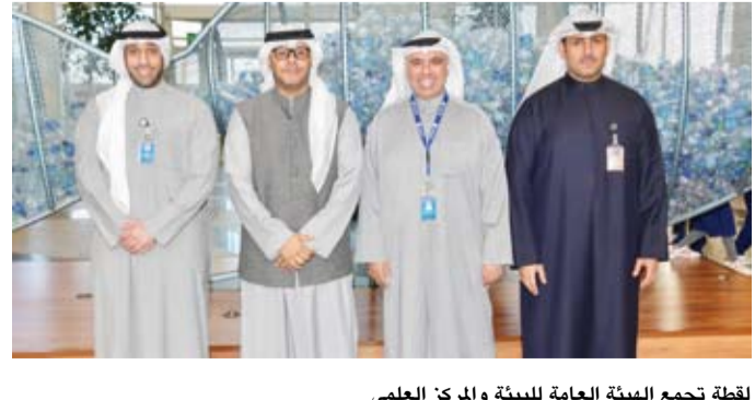
لقطة تجمع الهيئة العامة للبيئة والمركز العلمي