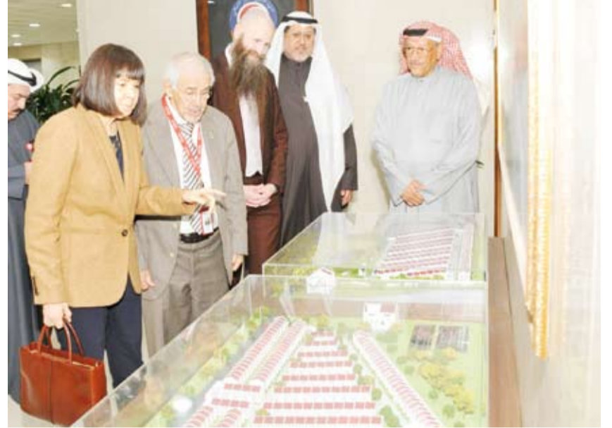
سفيرة الولايات المتحدة اطلعت على حجم البرنامج الإنساني الذي تنفذه جمعية الهلال الأحمر الكويتي

لـ (كوونا) بزيارة السفيرة الأمريكية إلى مقر الجمعية، مؤكداً حرصها على المشاركة في الجهود الإنسانية التي تقوم بها الكويت عبر تقديم الدعم والمساندة للمكثوبين جراء الكوارث الطبيعية أو الكوارث من صنع الإنسان، مؤكداً أن الزيارة تدعم التوجهات الإنسانية وتعزز مجالات تدخلات الإغاثية المختلفة. وقال السايير: إن الجمعية ستظل عند حسن ظن الجميع من خلال بذل المزيد من الجهود التي على مضامين العمل الإنساني وتحقق تطلعاتها التحديت. وذكر أن الاجتماع تطرق إلى المساعدات التي تقدمها الجمعية للمكثوبين والمتضررين جراء الكوارث الطبيعية أو من صنع الإنسان. وقدم عرضاً عن نشاطات الجمعية ودورها الإنساني على المستويين المحلي والخارجي مؤكداً عمق العلاقات بين البلدين في شتى المجالات واستمرار الجمعية في برامجها للتخفيف من المعاناة الإنسانية.