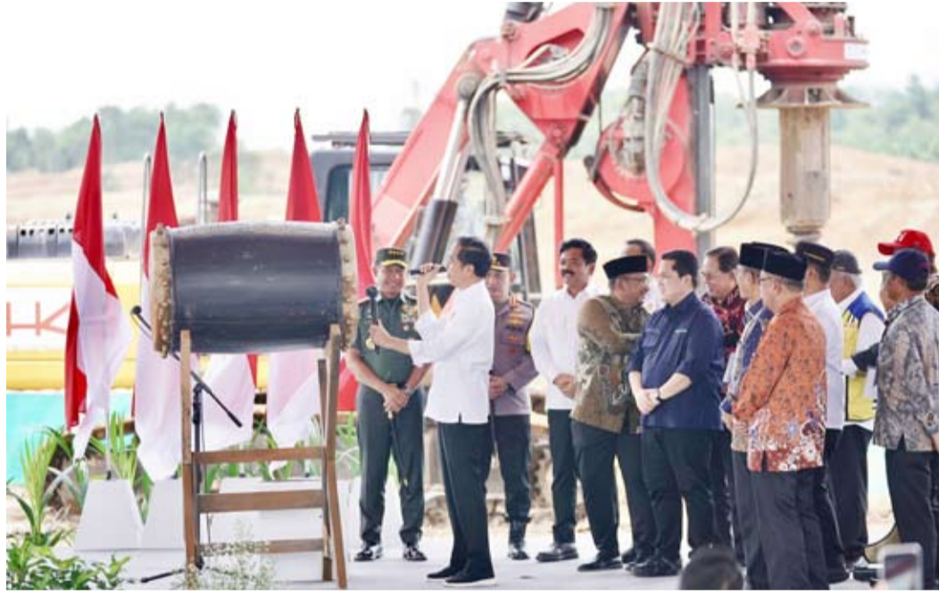
رئيس أندونيسيا يضع حجر الأساس للمسجد

ويقع المطار، الذي تبلغ تكلفته 4.3 تريليون روبية، على بعد حوالي 43 كيلومتراً من وسط نوسانتارا، وسيتم ربطه بطريق حالي وطريق يرسوم مرور بطول 23 كيلومتراً.