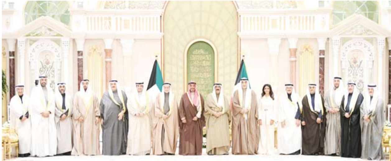
صاحب السمو الأمير وسمو رئيس الوزراء مع الحكومة الجديدة

بين السطور مع تأكيد التشكيل الحكومي الجديد وقسم الوزراء امام سمو الامير، سادت وسائل التواصل الاجتماعي حالة من الجدل كالعادة، فرأى البعض انه تشكيل دون الطموح، وتحفظوا على الكثير من الأسماء، بينما تفاعل آخرون، بأن رئيس الحكومة جاء بنهج إصلاحي وقادر على قيادة السفينة الى بر الأمان. اللائق هو تلك المظاهرة الشعبية في وداع «وزير الشعب» الشيخ طلال الخالد، حيث أكد أغلب المواطنين أنه كفي ووفى، دخل وخرج من الحكومة بثوب نظيف، آمين عودته في أقرب فرصة.