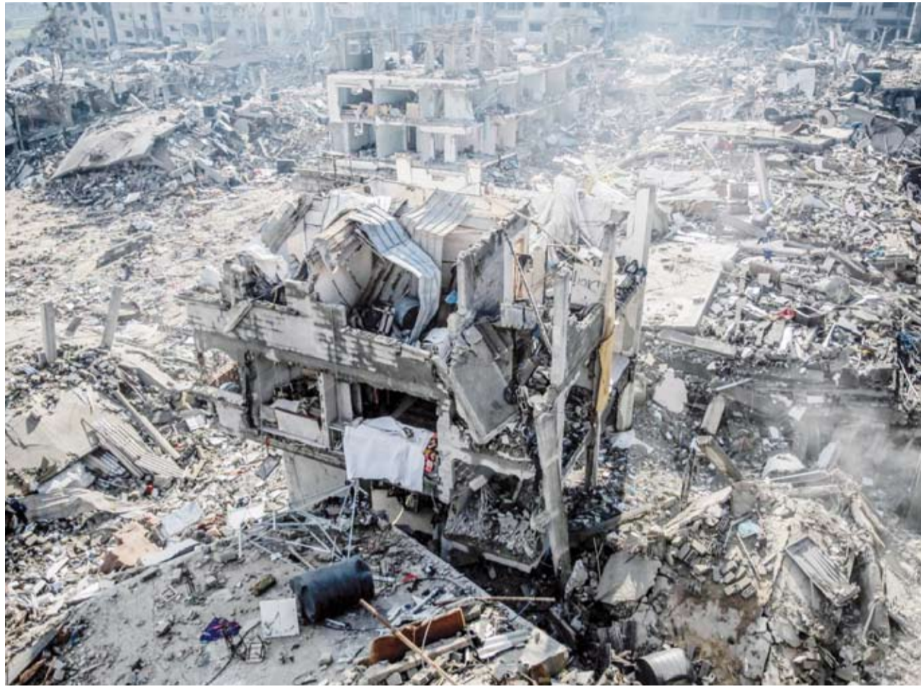
الدمار في حي الشيخ رضوان