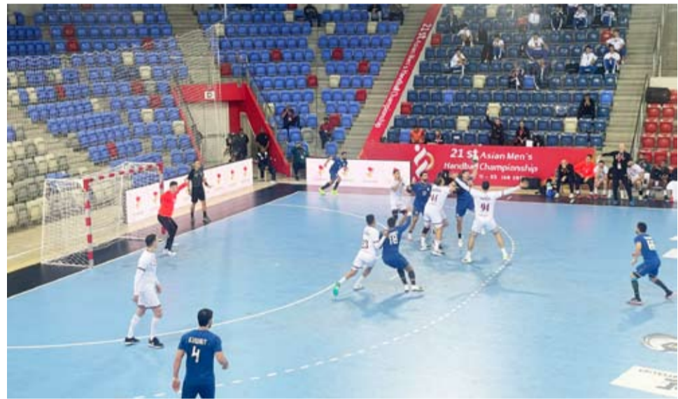
جانب من المباراة

خسر المنتخب الكويتي لكرة اليد اليوم الثلاثاء أمام نظيره القطري بنتيجة (20-24) ضمن الجولة الثالثة من مباريات المجموعة الأولى للبطولة الآسيوية ال 21 التي تستضيفها البحرين. وانتهى الشوط الأول بتقدم منتخب قطر على الكويت بنتيجة (14-8) وحاول الأخير الضغط في الشوط الثاني لحسم المباراة إلا أن المنتخب القطري أنهى المباراة لصالحه بنتيجة (24-20). وفي المجموعة ذاتها فاز منتخب الصين تايبيه على نظيره العماني بنتيجة (27-33) كما فازت الصين على نيوزلندا (13-36) ضمن مباريات المجموعة الثانية فيما تواجه كوريا الجنوبية منتخب إيران حاليا لتحديد بطل المجموعة. وستنتقل اليوم الخميس مباريات دور المجموعات الأساسي للبطولة