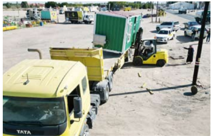
رفع سيارات «فود ترك»

الرقابي بإدارة النظافة العامة وإشغالات الطرق طوال شهر يناير الجاري، مؤكداً عدم التهاون في اتخاذ كافة الإجراءات القانونية حيال المخالفين لائحة النظافة العامة وإشغالات الطرق، وأوضح أن الحملة التي أطلقتها إدارة العلاقات العامة في البلدية تهدف إلى نشر الوعي المجتمعي بتوزيع بوسترات توعوية بلغات أجنبية تستهدف الجاليات الهندية والفلبينية والناطق باللغة الإنجليزية لتوعيتهم بمواعيد إخراج القمامة وإحكام غلق أكياس النفايات ووضعها داخل الحاويات، وقال: إن الحملة شملت جميع مناطق فرع بلدية محافظة الأحمدية من رقابة وإشراف متتابعة على النظافة العامة وعلى تنفيذ أعمال متطهري نظافة وشركات النظافة العامة والرقابة على الباعة المتجولين والعمل على تنفيذ القوانين واللوائح القرارات الصادرة بشأن النظافة العامة وأشغال الطرق داخل نطاق المحافظة.