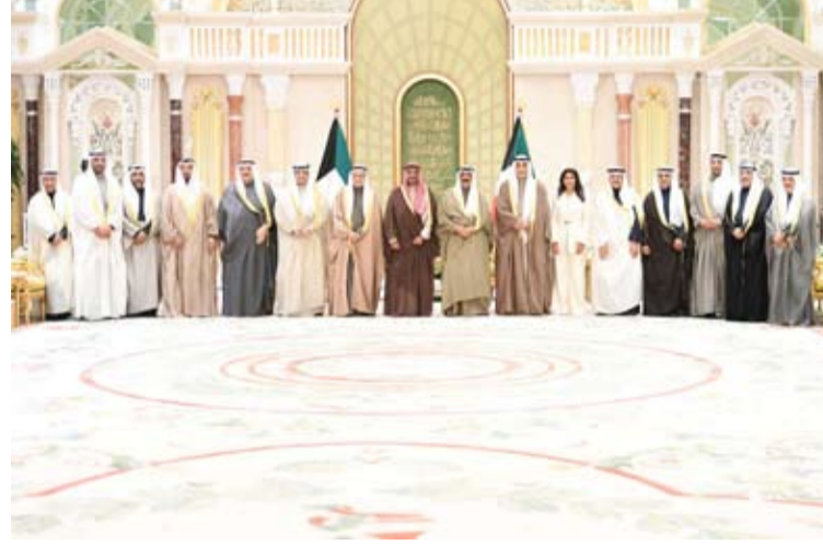
سمو الأمير يستقبل رئيس مجلس الوزراء وأعضاء الحكومة الجديدة