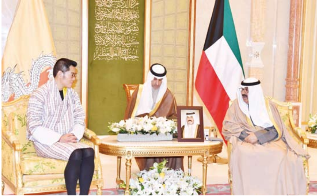
سمو ولي العهد يستقبل ملك بوتان

استقبل سمو ولي العهد الشيخ مشعل الأحمد، بقصر بيان، ظهر أمس، جلالة الملك جيغمي كيسار نامجيل وانجشوك ملك مملكة بوتان الصديقة والوفد المرافق، وذلك بمناسبة زيارته الخاصة للبلاد. حيث نقل سمو ولي العهد الشيخ مشعل الأحمد، لجلالته تحيات وتقدير صاحب السمو أمير البلاد الشيخ نواف الأحمد وتمنياته لجلالته بدوام الصحة والعافية ولشعب مملكة بوتان الصديقة المزيد من التطور والنماء.