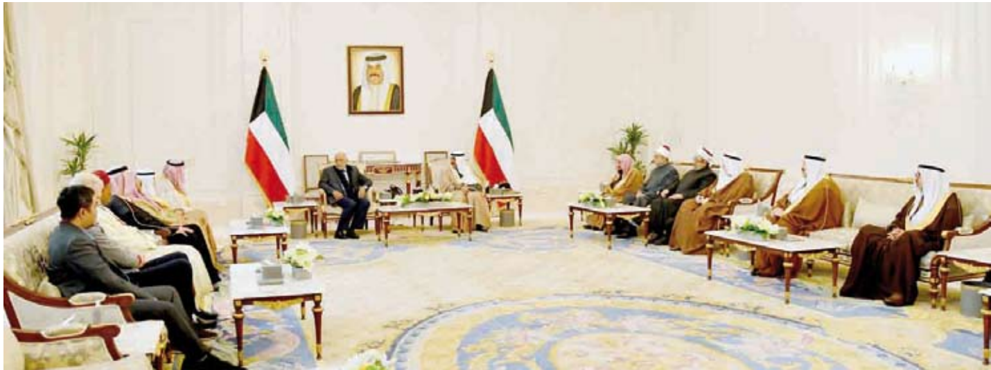
.. وسموه يستقبل رئيس وأعضاء مجلس أمناء المنظمة الإسلامية للعلوم الطبية