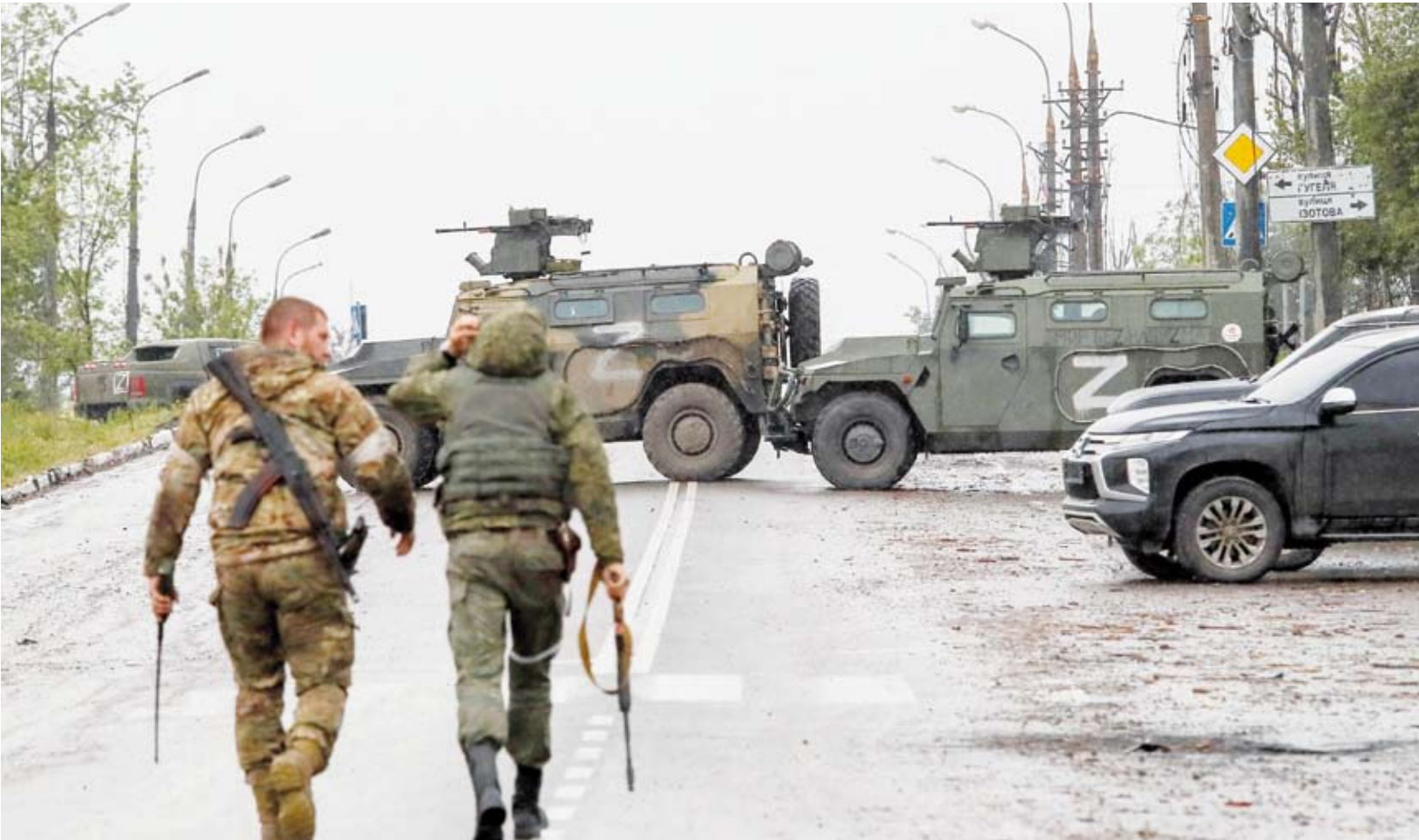
القتال في أوكرانيا

أعلن حاكم مدينة سيفاستوبول في شبه جزيرة القرم، أن الدفاعات الجوية الروسية أسقطت ثلاث طائرات من دون طيار فوق المدينة، مشيراً إلى إن القوات تواصل التصدي لهجوم في الوقت الحالي. وتعرضت سيفاستوبول مراراً لهجمات منذ بدء الهجوم الروسي على أوكرانيا في فبراير