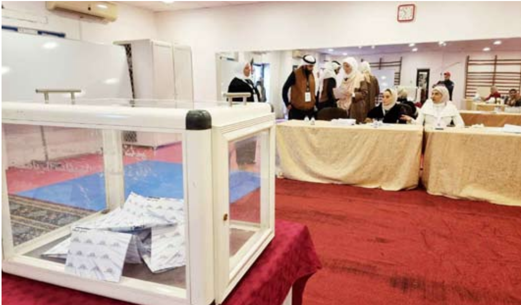
إقبال جيد على انتخابات الأندية