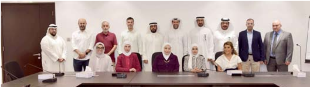
قبايدو البترول الوطنية المتدربين في بنك بوبيان

وتقدّم زين جوائزاً نقدية وعينية للاعبين والجامعين تصل قيمتها إلى 50 ألف دينار كويتي في الموسم الواحد، وهي أعلى قيمة جوائز في تاريخ الدوري الكويتي، بحيث تقدّم الشركة جوائزاً قيمة للاعبين والرياضيين تشجيعاً لهم للسعي وراء التميز في الأداء، فهي تؤمن أن دعم اللاعبين والأجهزة الفنية سيسهم في تألق الدوري وإضافة الحماس والمتعة،