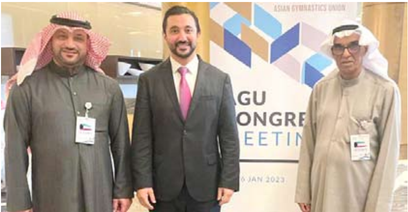
الدكتور صقر الملا مع رئيس الاتحاد فهد الصولة

الرياضية والفنية والإدارية الزاخرة في هذه اللعبة. وأوضح الصولة أن الملا سيكون إضافة مهمة للاتحاد إذ يعد من الكوادر القادرة على تطوير اللعبة والارتقاء بها بما يملكه من خبرات كبيرة في هذا المجال كونه كان لاعبا دوليا وتولى العديد من المناصب الرياضية والحكومية. وذكر أن تقلد الملا لهذا المنصب المهم في الاتحاد القاري دليل على تميز الكوادر الرياضية الكويتية وقدرتها على رسم خطط قابلة للتطبيق لتطوير هذه اللعبة ونشر ممارستها في كل الدول الآسيوية.