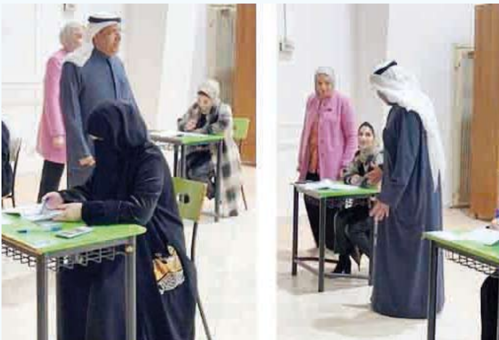
وزير التربية ووزير التعليم العالي والبحث العلمي تفقد اختبارات اليوم الأخير

باستمرار حجز 6 متهمين؛ الثانوية العامة ووجهت لهم تهمة غسل أموال، فيما أنكر المتهمون التهم من مسرعي اختبارات