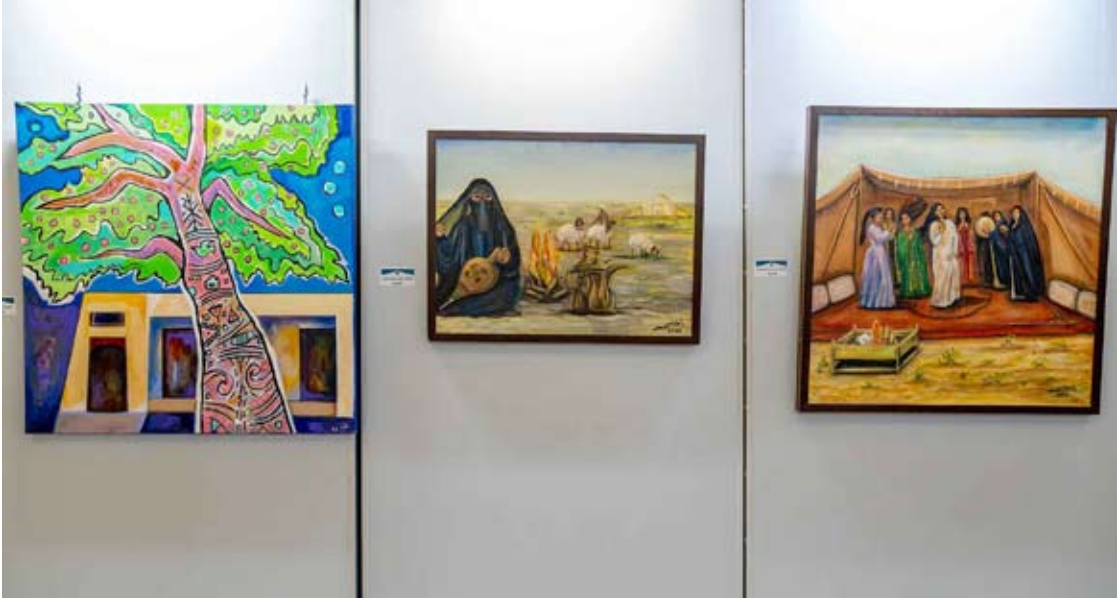
جانب من اللوحات المشاركة

حول البيئة البرية والبحرية وصوراً جميلة لها طابع خاص تبعث في النفس التفاؤل والبهجة.