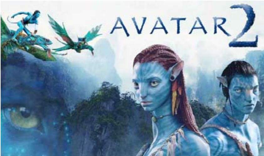
فيلم «أفاتار 2»

، وبطولة أنطونيو بانديراس وفلورنس بيو وسلمي حايك، فيلم الرسوم المتحركة "بوس إن بوتس: ذي لاست ويش" محافظاً على مركزه الذي احتله الأسبوع الماضي، بإيرادات بلغت 17.3 مليون دولار، من إخراج مارك فورستر، وبطولة توم هانكس ومانويل جارسيا رولفو و راتشيل كيلر وأن دانيال بينيدا.