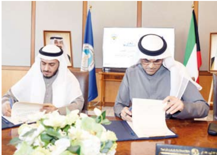
مدير «شؤون القصر» و«كل الأوقاف» خلال توقيع الاتفاقية