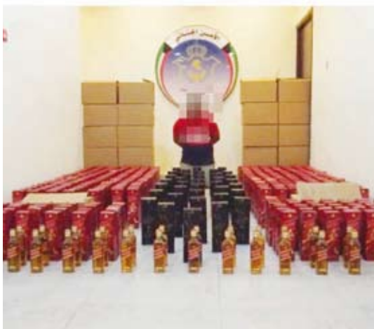
ضبط كمية كبيرة من زجاجات الخمر

وبتفتيش المخزن تم العثور على عدد (427) زجاجة خمر. وأكد أن المتهم أقر واعترف بأن المصبوبات تخصه هو وشريك له من نفس جنسيته إلا أن شريكه يوجد حالياً في يالده الاختصاص لاتخاذ الإجراءات القانونية اللازمة بحقه.