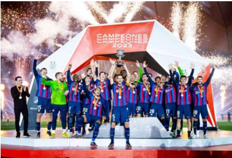
النادي الكتالوني يتوج بأول لقب في الموسم الحالي

توج برشلونة بأول القياه في الموسم الحالي، بعدما أحرز بطولة كأس السوبر الإسباني لكرة القدم، عقب فوزه الكبير 3 – 1 على غريمه التقليدي ريال مدريد، في المباراة النهائية للمسابقة، على ملعب الملك فهد بالعاصمة السعودية الرياض. وتسد برشلوة المباراة على مدار الـ90 دقيقة، وفرض نجومه سيطرتهم المطلقة على مجريات الأمور، وكان بإمكانهم مضاعفة النتيجة أكثر من مرة لولا رعونتهم في الكثير من الفرص المؤكدة التي سنحت لهم، في حين ظهر لاعبو الريال بشكل باهت للغاية، وبدوا وكأنهم أشباح في الملعب، ليثيروا قلق محبيهم في ظل منافسة الفريق على العديد من البطولات الأخرى خلال الموسم الحالي.