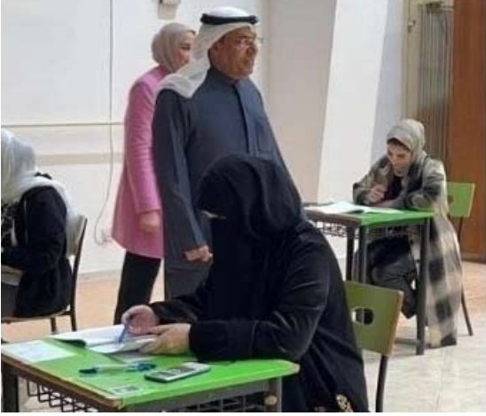
جانب من جولة وزير التربية

يضمن تحقيق العدل والمساواة بين الطلاب، وحصول كل منهم على حقه تطبيقاً لسياسة تكافؤ الفرص، فالوزارة تسعى لتحقيق تعليم ذي جودة و نوعية عالية لجميع فئات المجتمع من أجل بناء رأس المال البشري القادر على المشاركة في تنمية الوطن. داعياً الله التوفيق والنجاح لابنائنا الطلبة والطالبات مع نهاية الاختبارات للفصل الدراسي الأول للعام 2022 / 2023، وأن يحققوا أعلى مراتب التفوق