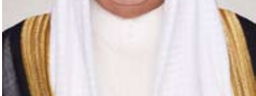
سمو الشيخ أحمد النواف

بعث سمو الشيخ أحمد النواف رئيس مجلس الوزراء، ببرقية تعزية إلى الرئيسة بيدبا ديفي بهانداري رئيسة نيبال الصديقة، ضمنها سموه خالص تعازيه وصديق مواساته بضحايا تحطم طائرة الركاب النيبالية في مقاطعة بوكار وسط نيبال.