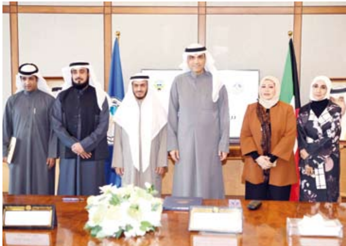
لغة جماعية خلال مراسم توقيع الاتفاقية