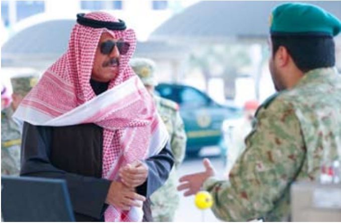
الشيخ فيصل النواف خلال جولته التفقدية

أداء المهام المناطة بهم على أكمل وجه. وذكر البيان، أن الشيخ فيصل النواف استمع إلى إيجاز عن قدرات المركز ومهامه والمشاركات التي يقوم بها وما يملكه من محطات رصد متطورة وأجهزة ومعدات حديثة للقيام بعمليات الرصد والتطهير.