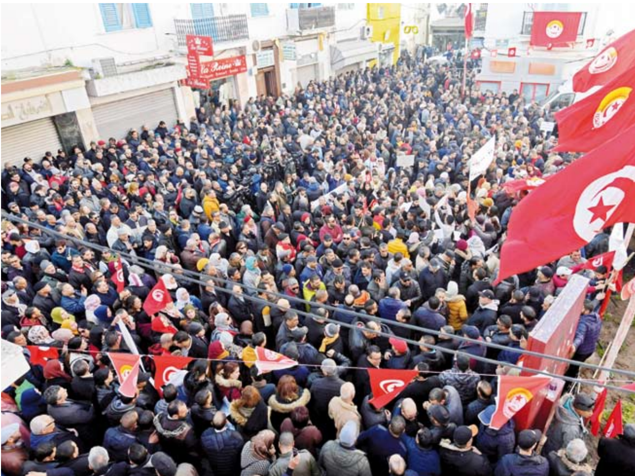
احتجاجات في تونس

إشارة الهرج بمدينة سبيطلة التابعة للمدينة نفسها. كما كشفت عن إحالة النيابة العامة 3 أطفال تتراوح أعمارهم بين 16 و17 سنة، وسيتمثلون أمامها في الأيام المقبلة.