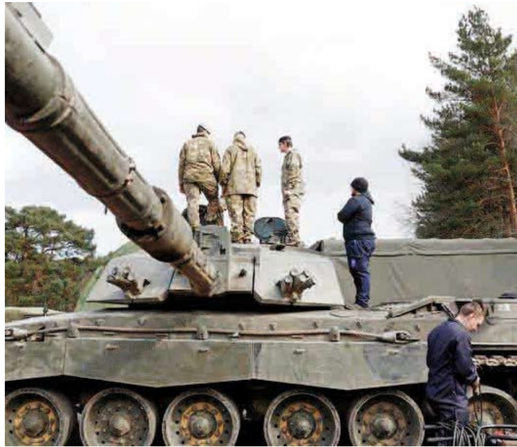
دبابات تشالنجر 2 البريطانية هل تحدث تغييرا في الحرب الأوكرانية الروسية؟