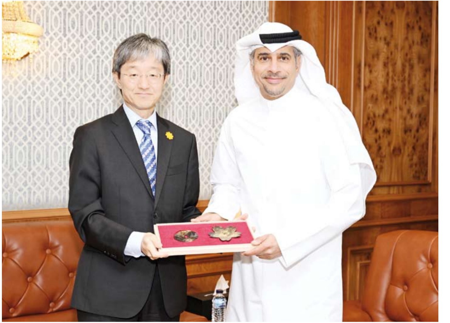
السفير الياباني يقدم درعا تذكارية لوزير «الشباب والرياضة»

توطيد علاقاتها مع اليابان والاستفادة من التجارب اليابانية الرائدة في تنمية قدرات الشباب وتطوير البنية التحتية الرياضية مشيدا بما حققته اليابان من نجاحات متميزة في هذا المجال.