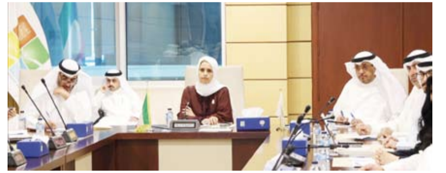
د. ريم الفليح ترأس الاجتماع

أكدت وزيرة الدولة لشؤون التنمية والاستدامة الدكتورة ريم الفليح، أمس، استمرار الاجتماعات التنسيقية للجهات الحكومية المعنية في ظل الأوضاع الراهنة التي تمر بها المنطقة لضمان رفع مستوى جاهزية ومتابعة أي تداعيات أو آثار بيئية محتملة على البلاد.