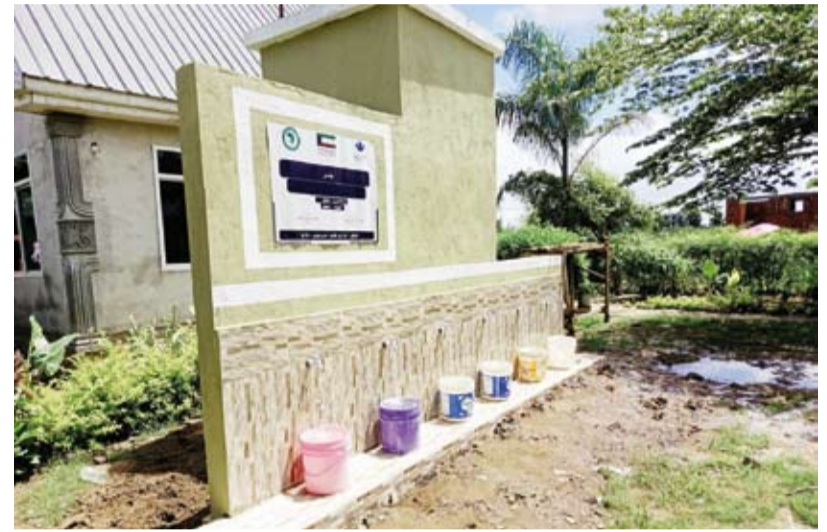
أحد آبار المياه

في الصميم 809 مواطنين ومواطنات تقدموا للمتعيين في الوظائف الإشرافية بالجمعيات التعاونية، اجتاز منهم 147 مرشحا الاختبارات التي أجريت للفوز بـ 48 وظيفة. تلك الوظائف متاحة في 17 جمعية موزعة في عدة مناطق على مستوى المحافظات، ووفق وزارة الشؤون، فإن 90 بالمئة من تقييم المتقدمين يعتمد على الاختبارات أما نسبة العشرة بالمئة فهي للمقابلات النهائية. لا شك أن هذا النهج يمثل نقلة نوعية لاختيار مسؤولي الجمعيات من مدير عام ومساعد مدير ورؤساء الأقسام، ويعد خطوة هامة نحو تكوين هذه الوظائف.. قواكم الله.