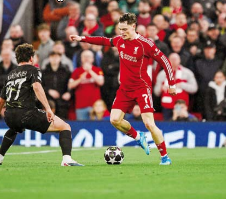
أداء سيلي لريدز أمام باريس

الذهاب الأسبوع الماضي على ملعب حديقة الأمراء، ويواجه سان جيرمان الفائز من ريال مدريد الإسباني وبايرن ميونيخ الألماني حيث فاز الأخير في مباراة الذهاب 2 / 1 بإسبانيا، قبل أن تتجدد المواجهة إياباً بينهما في ميونيخ.