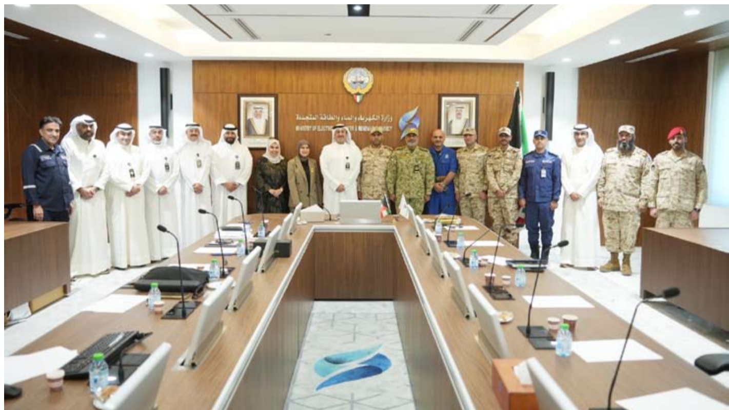
جانب من الاجتماع بين فريق العمل وأعضاء اللجنة

استعرض فريق العمل المعني بإنشاء المركز الوطني لإدارة الأزمات (أمان) مع رئيس وأعضاء لجنة الطوارئ في وزارة الكهرباء والماء والطاقة المتجددة أوجه التكامل المطلوبة لتعزيز أمن الطاقة والمياه باعتبارهما من الركائز الأساسية لاستقرار الاقتصادي والاجتماعي.