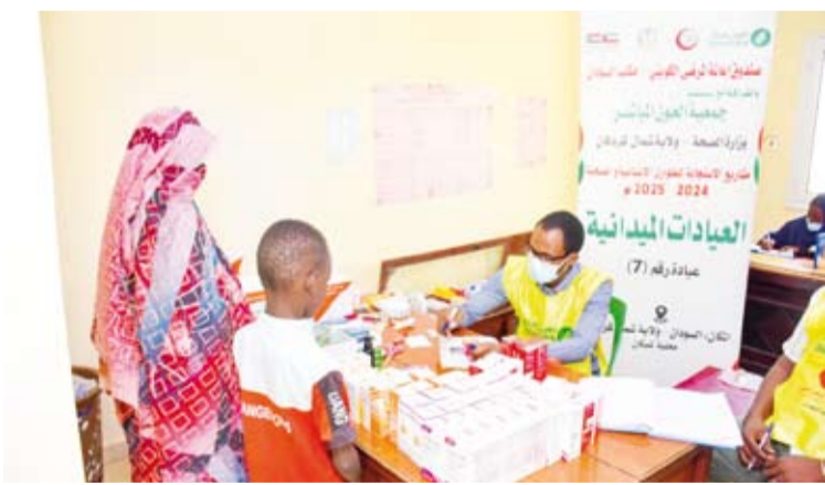
تقديم المساعدات الصحية

الظفيري: نفذت واحدة من أوسع عمليات الإسناد الإنساني