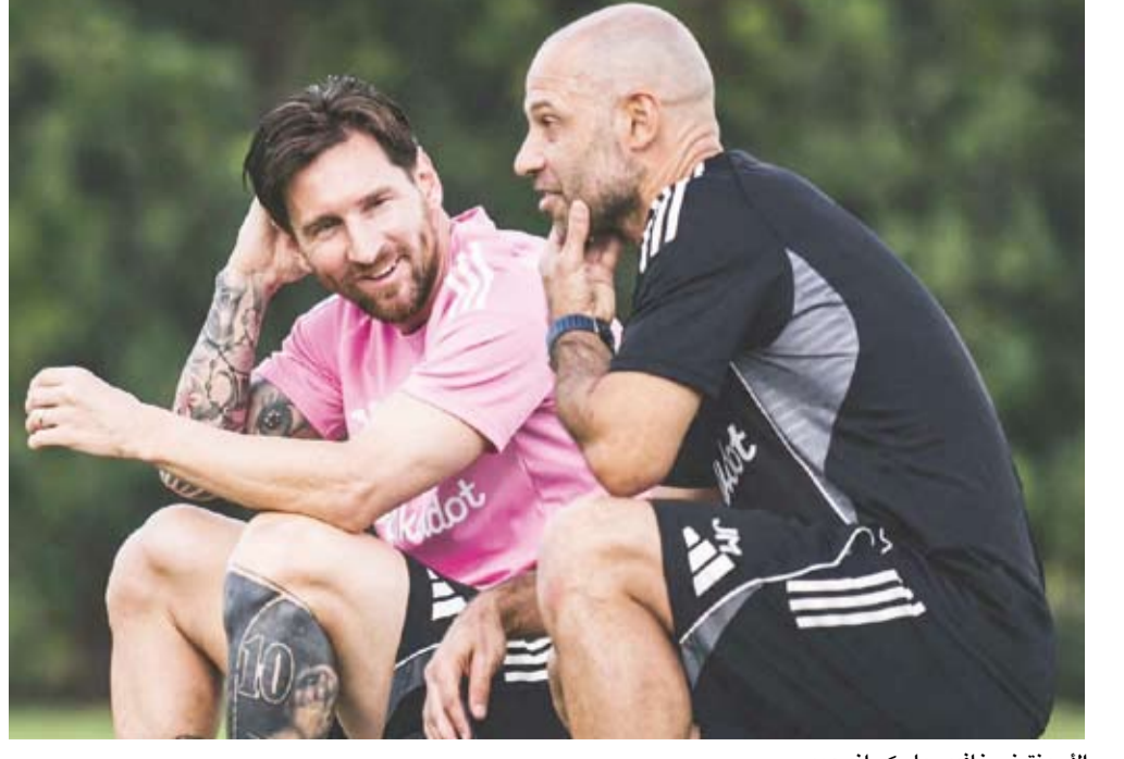
الأرجنتيني خافيير ماسكيرانو وميسي

أعلن نادي إنتر ميامي الأميركي، رحيل الأرجنتيني خافيير ماسكيرانو عن منصب المدير الفني للفريق وجاءت هذه الخطوة المفاجئة بعد أربعة أشهر فقط من قيادة ماسكيرانو لرفاق ليونيل ميسي لتحقيق لقب كأس الدوري الأميركي. وأوضح إنتر ميامي في بيان أنه أن ماسكيرانو، الذي زامل ليونيل ميسي سابقاً في برشلونه ومنتخب الأرجنتين قبل أن يتولى تدريبه، قرر مغادرة منصبه لأسباب شخصية. وقال ماسكيرانو في بيان صادر عن إنتر ميامي: «أود أن أشكر النادي على الثقة التي وضعها في شخصي، وكل موظف في المنظومة على الجهد الجماعي المبذول، وأخص بالشكر اللاعبين الذين جعلوا في إمكاننا أن نعيش لحظات لا تنسى». وتأتي هذه الاستقالة بعد أقل من أسبوعين من افتتاح إنتر ميامي للملعب الجديد بالقرب من مطار ميامي الدولي، وهو الملعب الذي شهد تعادل الفريق في أول مباراتين خاضهما عليه.