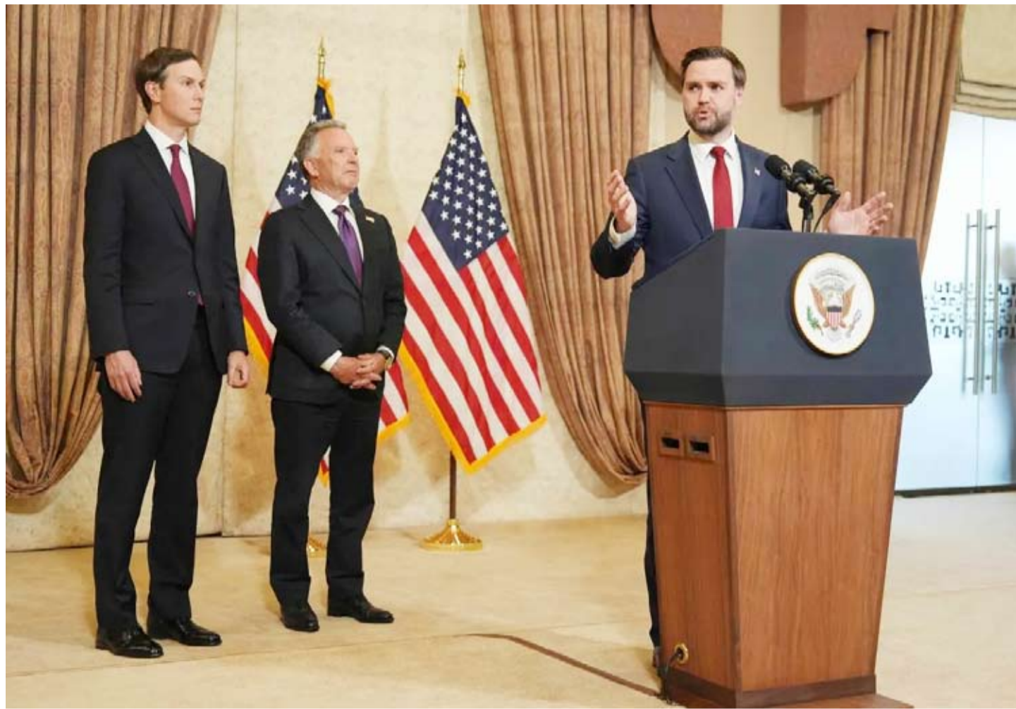
نهاية جولة المفاوضات الأولى في باكستان

وكان الاجتماع الذي عقد في بدايات هذا الأسبوع بالعاصمة الباكستانية، بعد 4 أيام من إعلان وقف إطلاق النار، أول لقاء مباشر بين مسؤولين أميركيين وإيرانيين منذ أكثر من 10 أعوام، كما كان الأعلى مستوى منذ الثورة الإسلامية الإيرانية عام 1979.