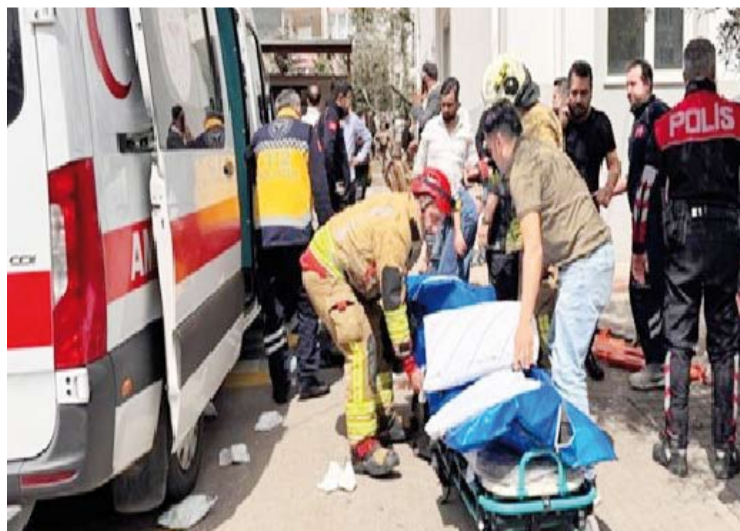
20 مصابا نتيجة إطلاق النار

أعلن مسؤول تركي أمس عن مقتل معلم وثلاثة طلاب وإصابة 20 آخرين على إثر إطلاق نار داخل مدرسة (أيسر جاليك) الثانوية في منطقة (أونكيشوبات) بمدينة قهرمان مرعش جنوبي تركيا. وجاء ذلك على لسان محافظ السولاية مكرم أونلوير في تصريح للصحفيين مضيفاً أن نفذ الهجوم هو أحد الطلاب الذي دخل المدرسة حاملا سلاحا يعتقد أنه يعود لوالده داخل حقيبته قبل أن يتنقل بين صفين ويطلق النار بشكل عشوائي. وفي سياق متصل أعلن وزير العدل التركي أكين غورك عبر منصة "إكس" للتواصل الاجتماعي أن مكتب المدعي العام