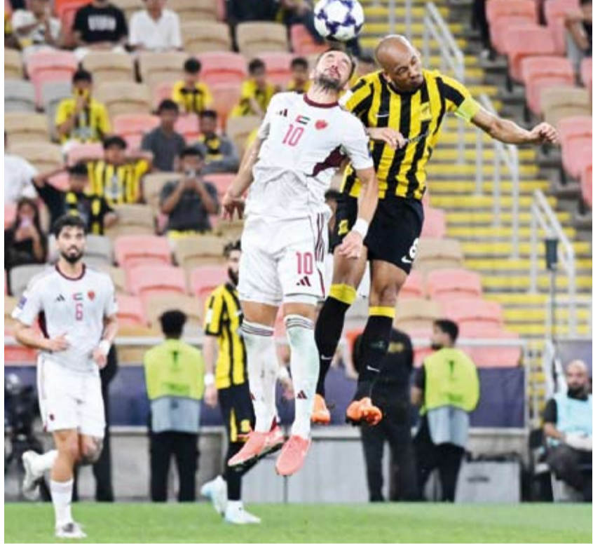
صراع هوائي على الكرة بين لاعبي الفريقين

وبفوزه يصعد (الاتحاد) إلى دور ربع النهائي لواجه (ماتشيدا زيلفيا) الياباني يوم الجمعة المقبل. وتستضيف مدينة جدة الأدار النهائية للبطولة خلال الفترة من 13 إلى 25 أبريل الحالي حيث تقام المنافسات على ملعب مدينة الملك عبدالله الرياضية ومدينة الأمير عبدالله الفيصل الرياضية. وتبدأ منافسات الدور ربع النهائي بعد غد الخميس على أن تستكمل بقية الأجزاء يوم الجمعة والسبت المقبلين فيما يقام الدور نصف النهائي في 20 و 21 أبريل على أن تجري المباراة النهائية في 25 أبريل على ملعب مدينة الملك عبدالله الرياضية.