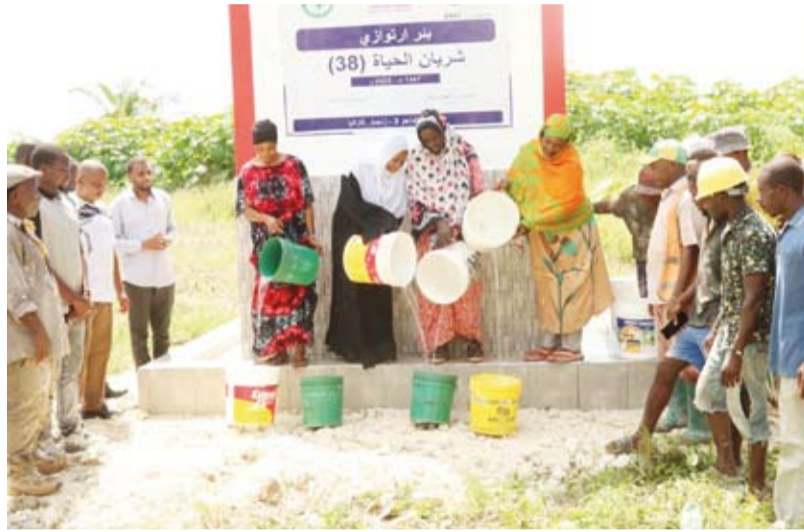
الآبار الارتوازية لخدمة 5 آلاف شخص