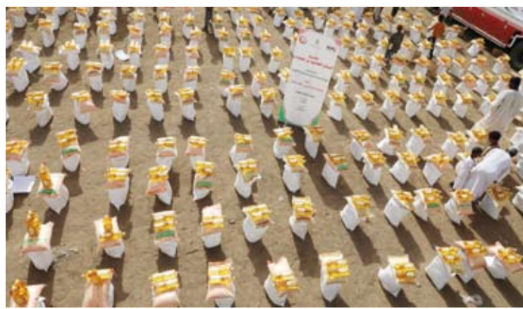
مشروع السلال الغذائية