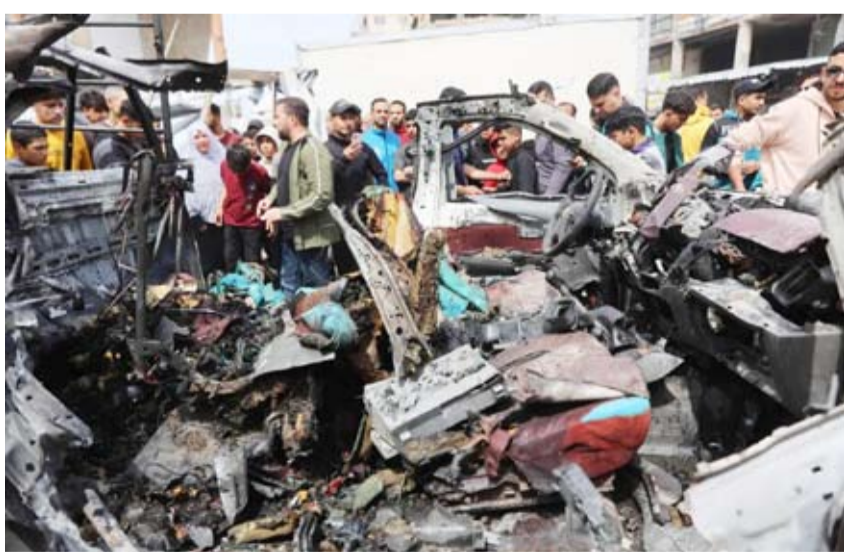
فلسطينيون في موقع حطام سيارة شرطة

إطلاق النار هي بضائع تجارية، بينما دخلت بعدد أقل مساعدات مقدمة من مختلف الدول العربية والإسلامية والدولية حتى المنظمات الأممية وغيرها، مبيهاً أنه «تم إبلاغهم من مسؤولين حكوميين في غزة أنهم تلقوا وعوداً بزيادة عدد الشاحنات والبضائع للمساعدة في انخفاض الأسعار».