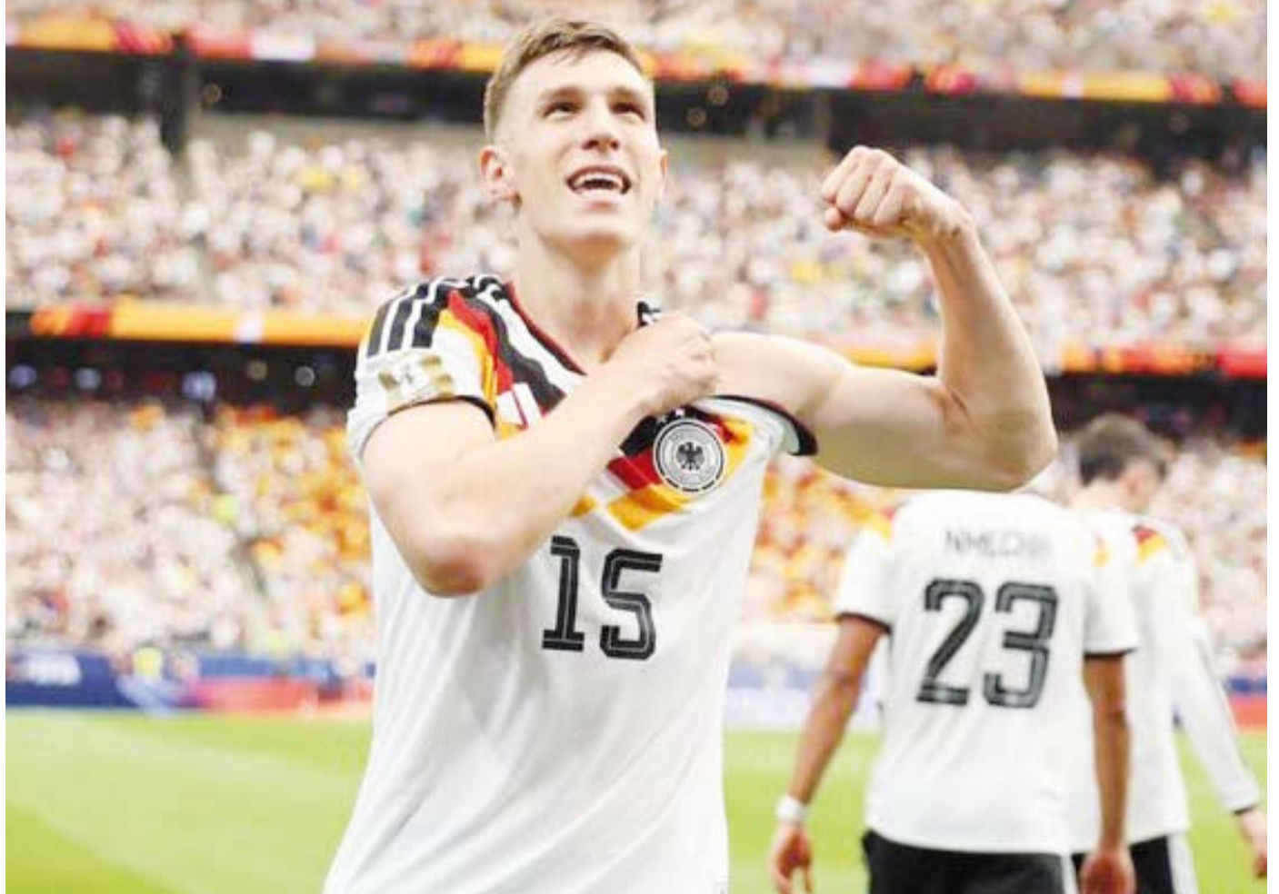
انذار شديد من الألمان للمنافسين

منتخب أوروبا يي يخوض النهائيات، وثاني أكثر المنتخبات عموماً بعد البرازيل (23)، تمكن المنتخب الألماني من تحقيق الفوز في مباراته الافتتاحية بعدما فشل في ذلك في النسختين الماضيتين في قطر 2022 وروسيا 2018.