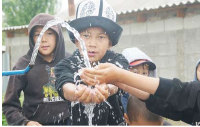
توفير المياه لآلاف المستفيدين