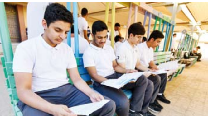
مراجعة المعلومات من قبل الطلبة