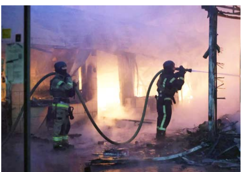
رجال إطفاء يخمدون حريق خلال غارة روسية

عن مقتل أربعة أشخاص على الأقل، وإصابة أكثر من عشرين آخرين، وفق السلطات. وشاهد مراسلون لـ«وكالة الصحافة الفرنسية» سكانا يركضون في الشوارع بحثاً عن ملاذ آمن، فيما كان وميض القصف يضيء سماء العاصمة التي أحمرت بلون الحرائق. وقال رئيس بلدية المدينة فيتالي كليتشكو إن حريقاً اندلع في كاتدرائية رقاد السيدة العذراء، في مجمع لأفراس الشهير للاديرة الكهفية في كييف، والمدرج في قائمة التراث العالمي لليونسكو. وتضررت واجهة الكاتدرائية بشكل كبير، ودمر جزء من سقفها، وعمت أكثر من عشر عربات إطفاء على تقطير النار، بحسب «وكالة الصحافة الفرنسية».