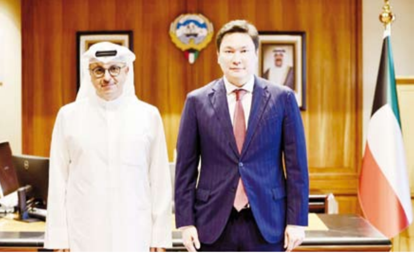
المخيزيم مستقبلا السفير يرزهان بكلييف

الناجحة بما يخدم المصالح المشتركة. وذكر البيان أن الجانبين أكدا على أهمية استمرار التنسيق والتواصل بما يسهم في تطوير آفاق التعاون الثنائي ويعزز العلاقات التي تجمع البلدين على مختلف الأصعدة. وأوضح أن اللقاء يأتي في إطار حرص الوزارة على تعزيز الشراكات الدولية وتبادل الخبرات الفنية والمعرفية بما يدعم جهود التنمية المستدامة ويواكب التوجهات المستقبلية في قطاعي الطاقة والمياه.