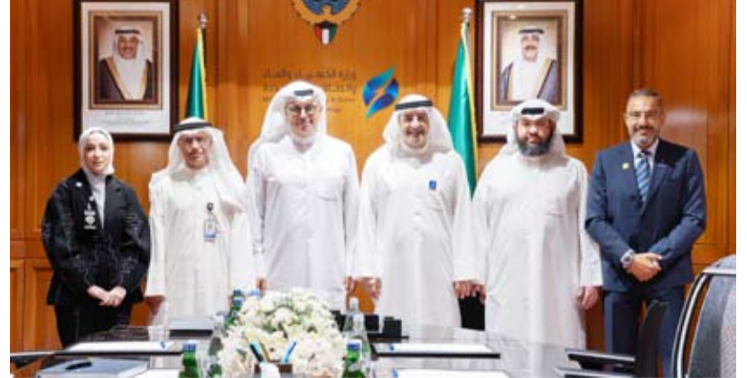
زيارة وفد بنك برناسة حمد مساعد السابر

وأعلن بنك وربة عن رعايته لمشاركة وزارة الكهرباء والماء والطاقة المتجددة في حملة «وقف» الوطنية، التي تهدف إلى نشر الوعي بأهمية ترشيد استهلاك الكهرباء والمياه وتعزيز ثقافة الاستخدام الأمثل للموارد، وذلك في إطار التزام البنك بمسؤولياته الاجتماعية ودعمه المستمر للمبادرات الوطنية الهادفة إلى تحقيق التنمية المستدامة. وتأتي هذه الرعاية امتداداً للشراكة القائمة بين البنك والوزارة في دعم الحملات التوعوية التي تستهدف مختلف شرائح المجتمع، وتساهم في تعزيز السلوكيات الإيجابية المرتبطة بالحفاظ على الموارد الطبيعية والحد من الهدر، لا سيما خلال فترة الصيف التي تشهد ارتفاعاً ملحوظاً في معدلات استهلاك الكهرباء والمياه.