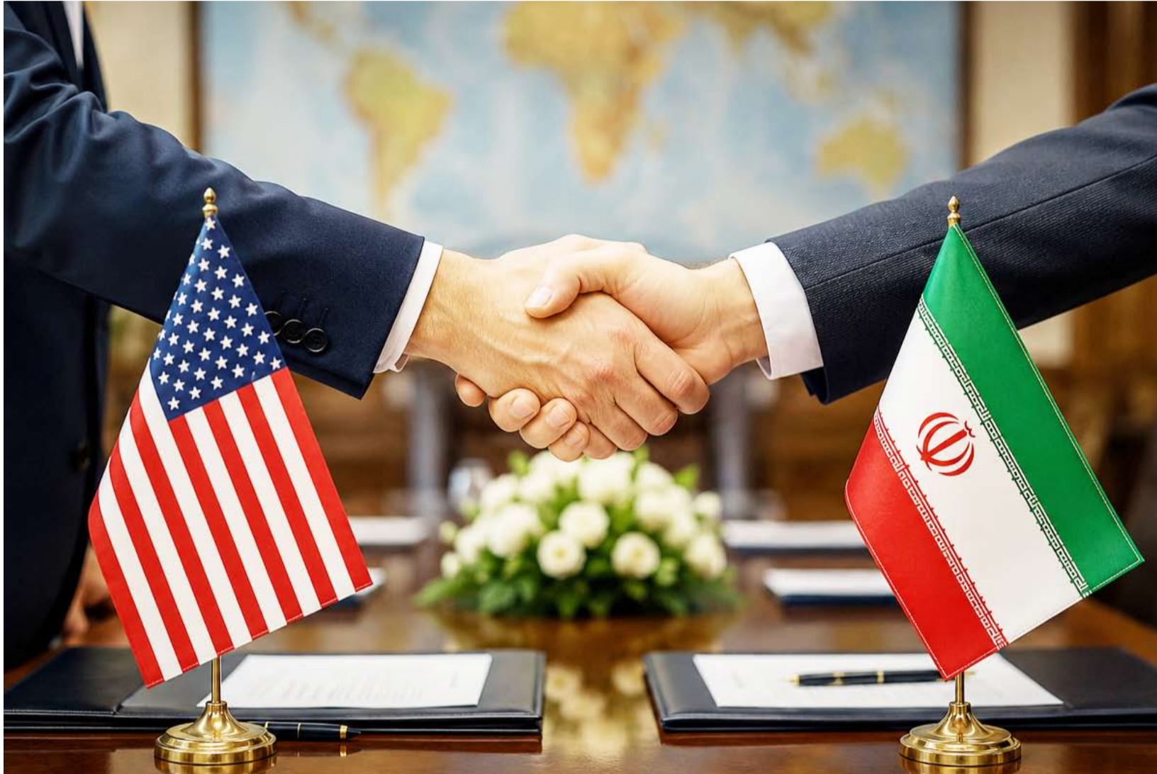
رود فعل إيجابية على مذكرة التفاهم

في أعقاب الإعلان الرسمي عن التوصل لاتفاق بين الولايات المتحدة وإيران لإنهاء الحرب وإعادة فتح مضيق هرمز، توالى ردود الفعل العربية والدولية المرحة بهذه الخطوة.