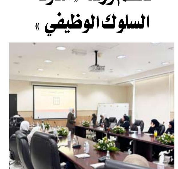
جانب من الورشة

نظمت الإدارة القانونية في بلدية الكويت ورشة عمل بعنوان «مدونة السلوك الوظيفي»، بحضور ممثلين من ديوان الخدمة المدنية وعدد من المحامين والمستشارين القانونيين والمهتمين بالشأن الوظيفي.