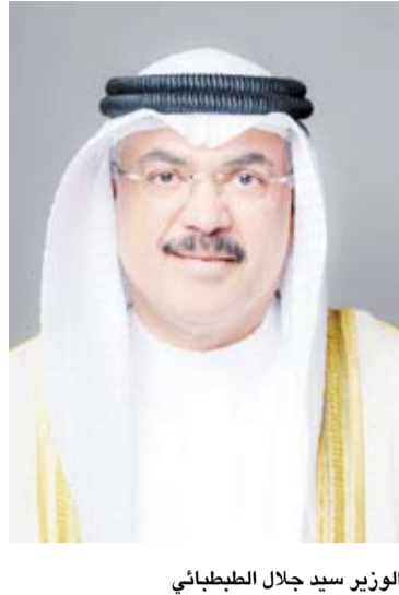
الوزير سيد جلال الطبيبائي

استكمال إجراءات القبول الجامعي والبعثات الدراسية في المواعيد المحددة. وأعدت وزارة التربية، أن هذه الترتيبات تأتي انطلاقاً من حرصها على تحقيق التوازن بين المتطلبات الأكاديمية والجوانب التنظيمية وتوفير بيئة امتحانات مستقرة تمكن الطلبة من أداء امتحاناتهم في أفضل الظروف الممكنة بما يدعم مسيرتهم التعليمية ومستقبلهم الأكاديمي.