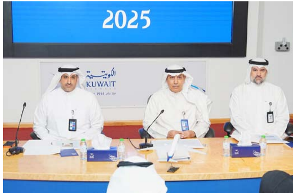
جانب من الجمعية العمومية

المستويين الإقليمي والدولي. وأفسد بيان الخسوط الكويتية مستمرة في تطوير أسطولها وتحديث خدماتها ومنظومتها الرقمية بما يساهم في رفع كفاءة العمليات التشغيلية وتحسين تجربة السفر للعملاء وتعزيز القدرة التنافسية للشركة على