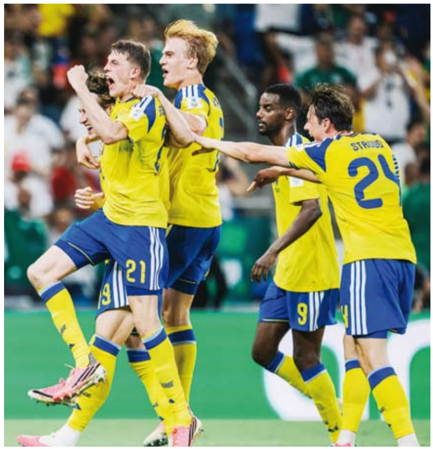
فرحة سويدية بالفوز الكبير على تونس