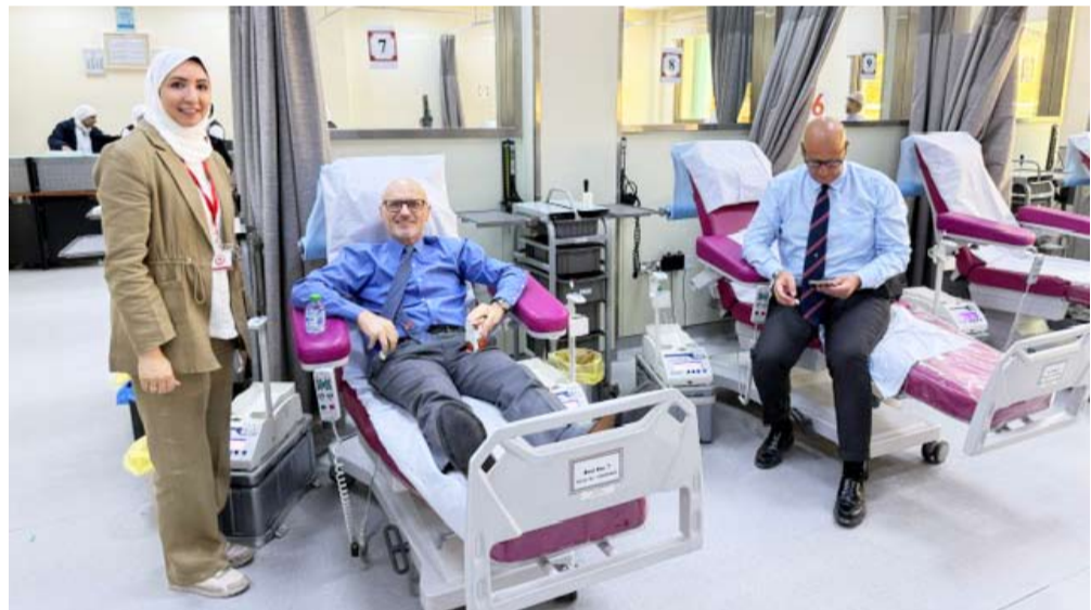
وخلال تبرعه بالدم