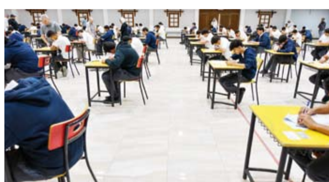
جانب من امتحانات نهاية العام الدراسي

وفق الإجراءات المعتمدة، تمهيداً لاعتماد النتائج وإعلانها بحسب الجداول الزمنية المحددة. وبيّنت أن النتائج ستُنحَاح للطلبة وأولياء الأمور فور اعتمادها رسمياً عبر الموقع الإلكتروني لوزارة التربية، وتطبيق الوزارة الإلكتروني، إضافة إلى تطبيق «سهل»، بما يضمن سهولة الوصول إلى النتائج وسرعة الحصول عليها من خلال القنوات الرقمية المعتمدة. متمنية لجميع الطلبة بالتوفيق والنجاح، وأن تتوج جهودهم التي بذلوا طوال العام الدراسي بنتائج متميزة تعكس مستوى اجتهادهم ومثابرتهم، مؤكدة استمرارها في تطوير المنظومة التعليمية بما يحقق تطلعات الطلبة وأولياء الأمور ويرتقي بجودة التعليم في دولة الكويت.