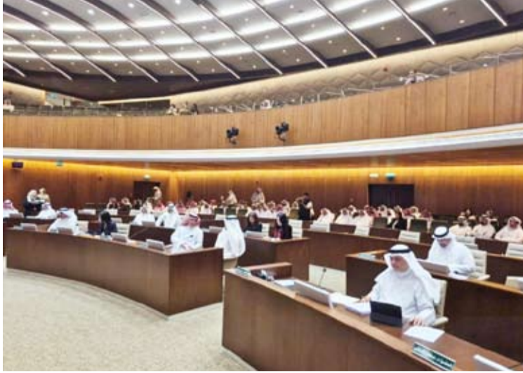
جانب من جلسة المجلس البلدي