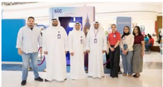
فريق عمل إدارة العلاقات العامة خلال افتتاح المعرض

رعت شركة الاتصالات الكويتية stc، الرائدة في تمكين التحول الرقمي وتقديم خدمات ومنصات مبتكرة للعملاء في الكويت، في Tourista Expo 2026، المقام في العاصمة مول، حيث عرضت خدماتها وباقاتها الشاملة للتجوال وحلول الاتصال الخاصة بها. ومن خلال مشاركتها، تواصلت stc مع الزوار انطلاقاً من التزامها بدعم عملائها بحلول اتصال موثوقة وسلسلة تساعدهم على البقاء على اتصال أيضاً كانوا، استعداداً لموسم السفر. تقدم stc خدمات التجوال حول العالم لتشمل أكثر من 150 دولة، فضلاً عن باقاتها المصممة خصيصاً لدول مثل الخليج وتركيا مع انترنت لامحدود، ويكتمل الاستفادة من خلال خدمة esim التي يتوفر الاشتراك فيها عبر موقع الشركة او من خلال التطبيق. وجمع Tourista Expo 2026 الذي أقيم في الفترة من 11 إلى 13 يونيو، بين العديد من شركات الطيران وكالات السفر ومقدمي الخدمات السياحية وغيرهم من مزودي الخدمات في هذا القطاع تحت مظلة واحدة، وكجزء من المعرض، رحبت شركة stc بالزوار في جناحها المخصص.