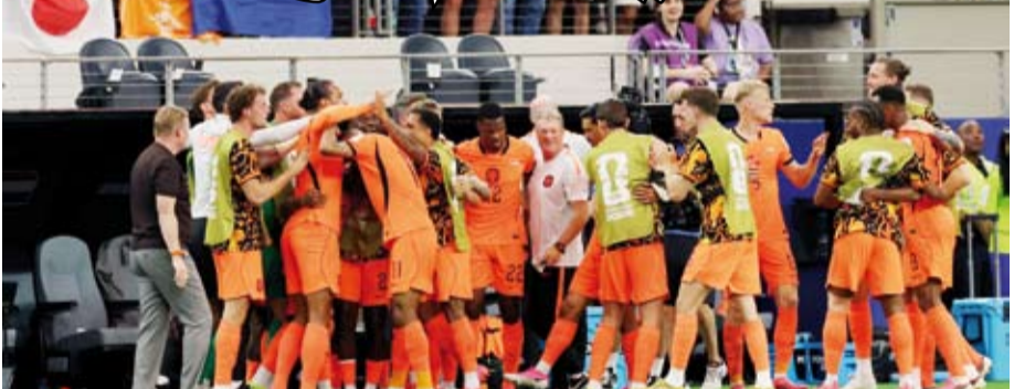
تعادل مخيب للطواحين أمام السامواري

التوالي. وسيلعب منتخب هولندا ضد السويد في مواجهة أوروبية خالصة بالجولة الثانية يوم 20 يونيو، بينما ستلقي اليابان مع تونس فجر اليوم التالي.