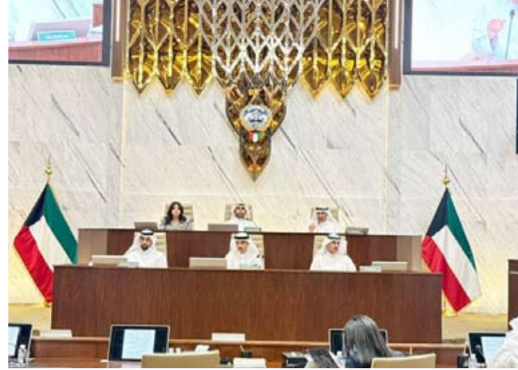
المحري مترشا الجلسة

تقسيم وتجزئة عقار الوثيقة بالقطعة رقم (9) بمنطقة الفينطيس.