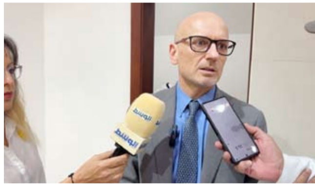
السفير الإيطالي متحددا للوسط