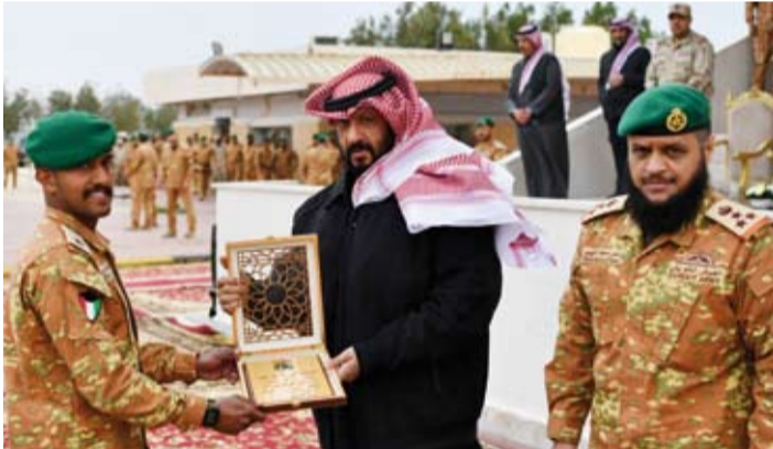
الشيخ طلال الخالد يكرم أحد الخريجين

من خلال الجهود التنسيقية التي تتم بين مختلف القطاعات العسكرية في البلاد، متمنياً للجميع دوام التوفيق والسداد والعمل لما فيه خدمة وطننا المعطاء، في ظل القيادة الحكيمة لحضرة صاحب السمو أمير البلاد القائد الأعلى للقوات المسلحة، وسمو ولي عهده الأمين. وحضر حفل تخريج دورة المغاوير الأساسية رقم (31) عدد من كبار قادة الجيش.