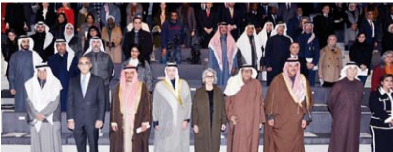
الشيخ سالم الصباح يتقدم الحضور

وأكد وزير الخارجية، الشيخ سالم الصباح، أمس، أن الثقافة والفن رافدان أساسيان لمقومات الدول وجزآن أصيلاً من العمل الدبلوماسي، جاء ذلك في كلمة ألقاها الشيخ سالم الصباح ممثلاً سمو الشيخ أحمد النواف رئيس مجلس الوزراء في رعاية وافتتاح مؤتمر (الفن والدبلوماسية: لغة الكويت المشتركة) في المركز الأمريكي في دار الآثار الإسلامية احتفاء بدور سفراء دولة الكويت بنشرهم روح التقبل والتفاهم بين البشر حول العالم واحتفالاً بمرور 40 عاماً على إسهار دار الآثار الإسلامية. وقال وزير الخارجية إن الدبلوماسية والفنون تتشاركان بأنهما صفتان تلازمان صاحبهما لتصبحان جزءاً أصيلاً لا يتجزأ خصوصاً الدبلوماسية وفن الشعر.