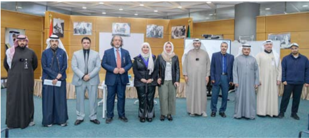
الشيخة تماضر الصباح تتوسط الحضور

نظمت إدارة العلاقات العامة في وزارة النفط، صباح أمس، حلقة نقاشية بعنوان «ظاهرة الزلازل» والتي حاضر فيها مدير برامج متخذي القرار لإدارة الأزمات البيئية في معهد الكويت للأبحاث العلمية ومشرف الشبكة الوطنية الكويتية لرصد الزلازل الدكتور عبدالله العنزي، وحضرها عدداً من موظفي الشؤون الفنية والاقتصادية في وزارة النفط والضيوف من الهيئة العامة للبيئة ووزارة الكهرباء والماء والطاقة المتجددة ومنظمة الاقطار العربية المصدرة للبترول (اوابك) والإعلاميين.