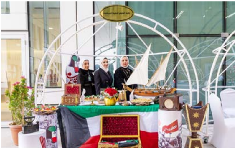
أجنحة لكليات وقطاعات جامعة الكويت مشاركة بالأعياد الوطنية وذكرى التحرير

يعكس انفتاح الكويت على الحضارات والثقافات المختلفة. وقدمت الجهات الحكومية فعاليات جذبت طلاب وطالبات الجامعة بينت خلالها طبيعة عملها وما تقوم به من دور مجتمعي في المشاركة بالاحتفالات الوطنية.