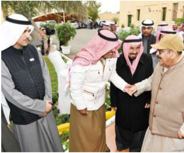
سمو الشيخ أحمد النواف يرحب بسمو ولي العهد

بحضور ممثل صاحب السمو أمير البلاد الشيخ نواف الأحمد، سمو ولي العهد الشيخ مشعل الأحمد، وسمو الشيخ أحمد النواف رئيس مجلس الوزراء وأسرّة آل الصباح الكرام، أقام الشيخ علي الجابر مأدبة غداء على شرف سموه، وذلك في مزرعة (عرايز) بمنطقة العبدلي.