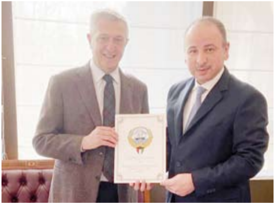
السفير ناصر الهين يستقبل فيليبو غراندي

معرباً عن خالص تعازي الكويت للضحايا والتمنيات للمصابين بالشفاء العاجل. وشرب زلزال جنوب تركيا وشمال سورية فجر 6 فبراير الحالي بلغت قوته 7,7 درجة أعقبه آخر بعد ساعات بقوة 7,6 درجة ومئات الهزات الارتدادية العنيفة ما خلف خسائر كبيرة بالأرواح والممتلكات في البلدين.