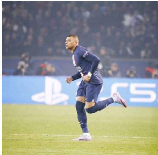
عودة أمبابي جاءت متاخرة

وقال مبابي الذي عاد للملاعب بعد غياب أسبوعين للإصابة: علينا أن نتذكر الجزء الأخير من المباراة: لقد تأخرنا بهدف ولكننا رأينا أننا قادرون على أن عاجهم. نحتاج إلى أن يتمتع كل لاعبيننا بصحة جيدة وأن نذهب إلى ميونخ للفوز والتأهل. وأضاف: لم يكن من المفترض أن أشارك اليوم ولكنني أردت مساعدة زملائي وجلب بعض الطاقة للفريق. لقد جربنا كل شيء. اليوم لا يمكنني فعل المزيد.