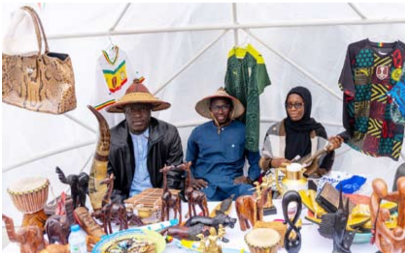
طلبة مبتعثون من السنغال مشاركون في احتفالات جامعة الكويت بالأعياد الوطنية