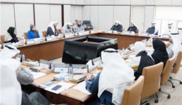
جانب من اجتماع اللجنة الاسكانية

وأكد الصقعي استمرار اللجنة الإسكانية في عقد الاجتماعات ورفع تقاريرها إلى المجلس ومتابعتها حتى ترى النور وتطبق على أرض الواقع في القريب العاجل بما يعود بالناتج المأمولة على الأسر الكويتية التي عانت الأسريين في السنوات الأخيرة بسبب أزمة الإسكان. ” نعلم أن الوضع السياسي اليوم مشحون وأن البلد في حالة شلل وأن المستفيدين من فوضى الإسكان سعدة بهذا الوضع وسيسعون إلى استثماره إلا أن المسؤوليه علينا كبيرة للقيام بالأمانة التي حملها لنا المواطنون