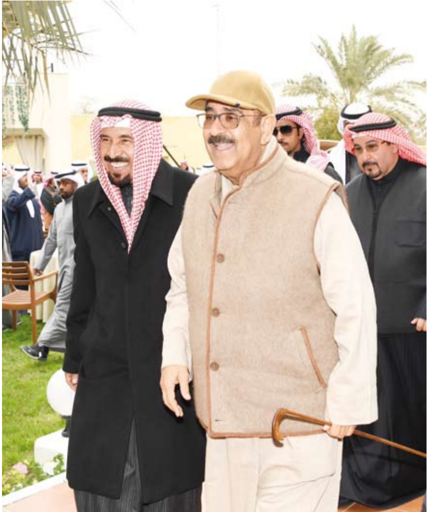
سمو ولي العهد لحظة وصوله وفي استقباله الشيخ علي الجابر