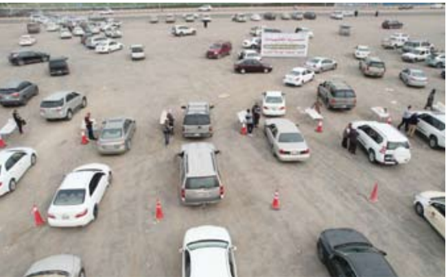
جانب من تنفيذ مشروع مصرف العشيات

المطيري أن المشروع يساهم في تعزيز التكافل والتراحم الاجتماعي وكل المبادئ الإنسانية والقيم النبيلة التي تتحقق عبر تخفيف معاناة الفقراء والمحتاجين. وتوجه رئيس جمعية الهداية الخيرية شكره وتقديره لأمانة العامة للأوقاف على دعمها للمشروع، وكذلك المحسنين الكرام، مؤكداً أن الجمعية مستمرة في تقديم كافة أشكال الدعم والعون والمساعدة للأسر المتعقة، لرفع المعاناة عنهم وإعانتهم وتخفيف الأعباء المعيشية عن كواهلهم، سائلاً العلي القدير أن يتقبل من الجميع صالح أعمالهم وأن يجعلها في موازين حسناتهم.