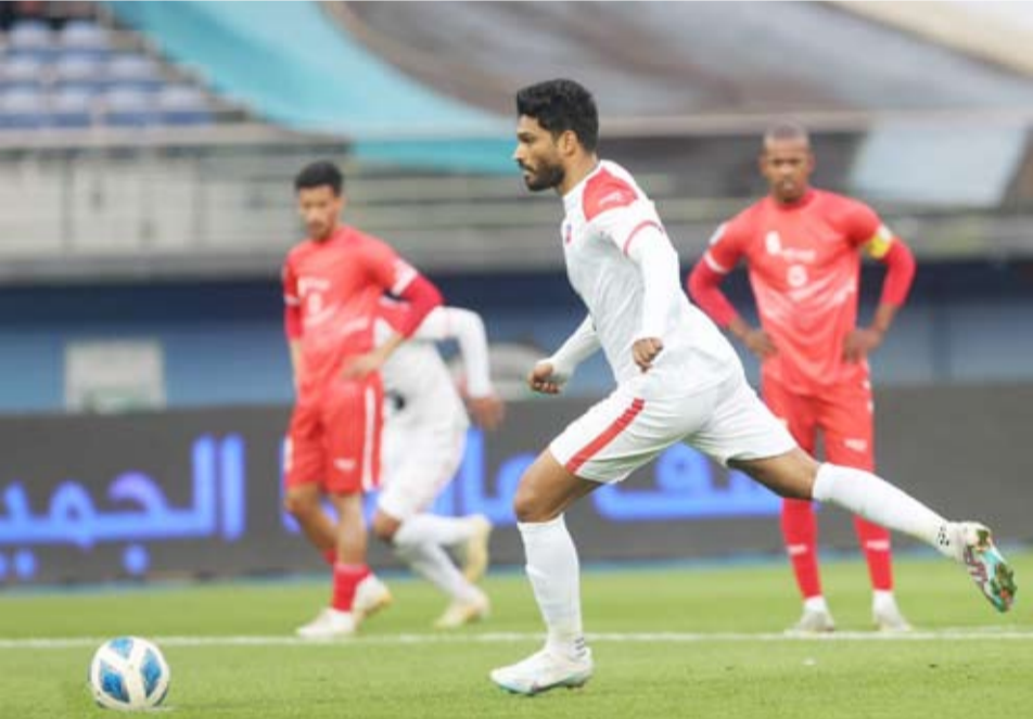
الأشاوس أوقفوا تقدم الأبيض