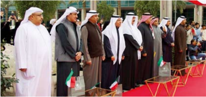
جانب من مشاركة وزير التربية ووزير التعليم العالي في الاحتفال

التعليم العالي السابق الدكتور علي المصنف كمدير عام للهيئة وكوزير للتربية إذ كان من الداعمين لكل قضايا وموضوعات الهيئة ودوره الفاعل في تبسيط إجراءات العمل بما يخدم مصلحة الطالب. بدوره أعرب الدكتور المصنف في كلمة له عن شكره وتقديره على تكريمه في الحفل، معبراً عن إمتنانه لجميع قيادات ومنسوبي الهيئة وعلى تعاونهم وتفاعلمهم الدائم خلال فترة تولىه الوزارة ودعمهم المستمر لمسيرة التعليم في البلاد.