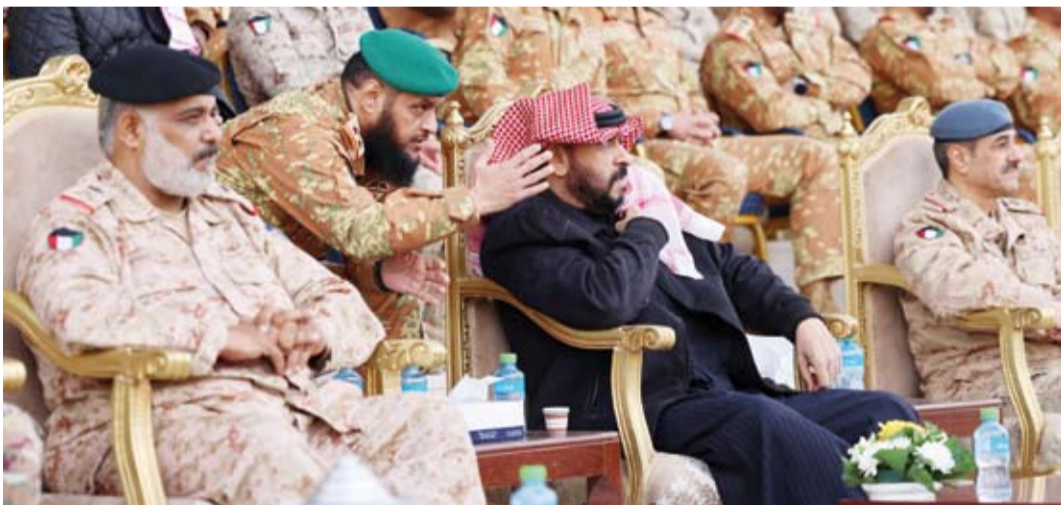
الخالد يتابع التمرين

بالتفوق القتالية القربية والجماعية بالطعن بالحراب والاشتباك الحر والقتال المتلاحم بالإضافة إلى مهارات التسلسل والنزول من ارتفاعات مختلفة في الميدان، وعمليات الكائن واختبارات الثقة، وعرضاً لعمليات القتال بالمناطق المبنية. بعد ذلك قام الشيخ طلال الخالد بتوزيع الشهادات والجوائز على الخريجين، كما هنأهم على إحرارهم لهذه النتائج الطيبة، معرباً عن شكره وتقديره إلى قيادة لواء المغاوير ومنتسبيه على ما بذلوه من جهد وعمل مخلص أثمر تخريج هذه الكوكبة من منتسبي الجيش الكويتي بهذا المستوى العالي من الكفاءة والقدرة والمهارة، ومع قرب الاحتفال بالأعياد الوطنية استذكر معاليه بكل مشاعر الفخر والاعتزاز التضحيات الجليلة والشجاعة النادرة التي أظهرها منتسبو اللواء في