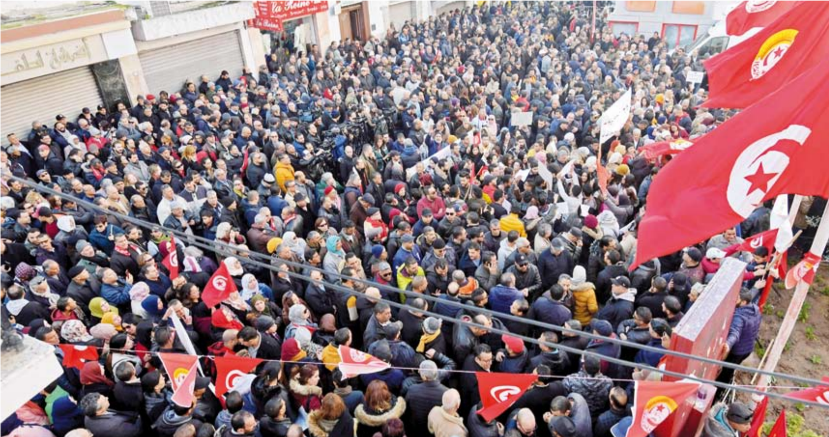
الاحتجاجات في تونس

أدان مفوض حقوق الإنسان التابع للأمم المتحدة، فولكر تورل، «تفاقم القمع» في تونس، إثر تنفيذ اعتقالات عدة شملت سياسيين وقضاة معزولين ورجل أعمال نافذاً.