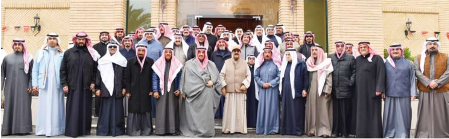
سمو ولي العهد في لقطة جماعية متوسطاً الحضور