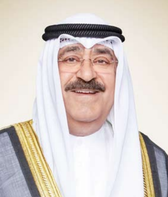
سمو ولي العهد الشيخ مشعل الأحمد

بعث سمو ولي العهد الشيخ مشعل الأحمد، ببرقية تهنئة إلى الرئيس ألكسندر فوتشيتش رئيس جمهورية صربيا الصديقة، ضمنها سموه خالص تهانیه العيد الوطني لبلاده، راجياً لفخامته وأفر الصحة والعافية.