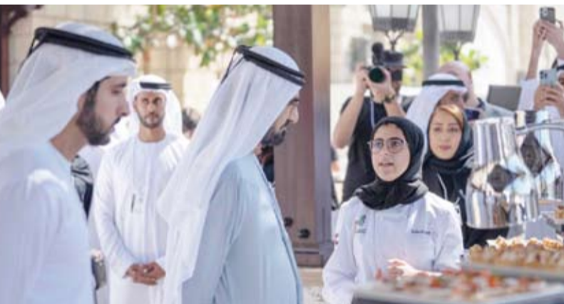
الطاهية عائشة العبيدي تشرح أطباقها لصاحب السمو الشيخ محمد بن راشد آل مكتوم

وأشار إلى أنه سيكون بالإمكان تحري هلال شهر رمضان المبارك ورؤيته بجلاء ووضوح حيث سيمكث مساء الأربعاء 22 مارس لمدة تصل إلى 52 دقيقة ويكون شكله مستويا تماماً.