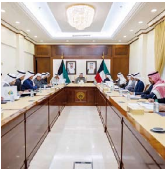
نائب وزير الخارجية يترأس اجتماع مجلس شؤون السلكين الدبلوماسي والتقني

ترأس نائب وزير الخارجية، السفير منصور العتيبي، أمس، اجتماعاً لمجلس شؤون السلكين الدبلوماسي والتقني في ديوان عام الوزارة بمشاركة مساعدي وزير الخارجية أعضاء المجلس حيث تم خلاله بحث المواضيع الواردة على جدول الأعمال. كما التقى نائب وزير الخارجية، السفير منصور العتيبي، بمساعد وزير دائرة العلاقات الخارجية للجنة المركزية للحزب الشيوعي الصيني تشو ري، وذلك بمناسبة زيارته الرسمية لدولة الكويت. وتم خلال اللقاء بحث أوجه العلاقات المتميزة بين دولة الكويت وجمهورية الصين الصديقة وسبل تطويرها في كافة المجالات.