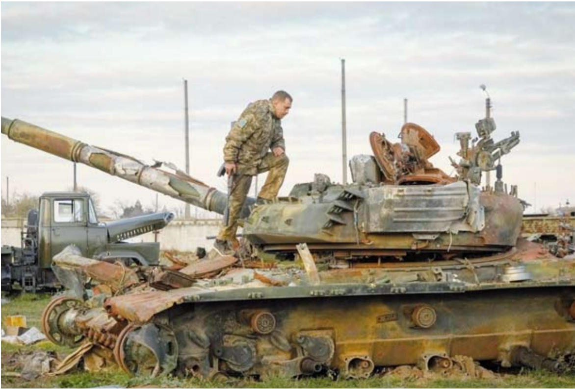
القتال في اوكرانيا

أسلحة بعيدة المدى وصواريخ مضادة للطائرات.