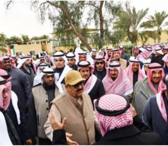
ترحيب كبير بحضور سمو ولي العهد