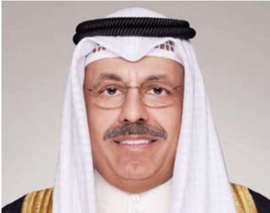
سمو الشيخ أحمد النواف

بعث سمو الشيخ أحمد النواف رئيس مجلس الوزراء، ببرقية تهنئة إلى الرئيس ألكسندر فوتشيتش رئيس جمهورية صربيا الصديقة بمناسبة العيد الوطني لبلاده. كما بعث سمو الشيخ أحمد النواف رئيس مجلس الوزراء، ببرقية تهنئة إلى الرئيس نيكو خريستودوليدس الرئيس المنتخب لجمهورية