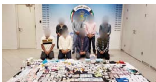
المتهمون مع المضبوطات

في ممارسة مهنة الطب دون ترخيص، فيما تبين أن الخالفة الأخرين كانوا يترددون على العيادة غير المرخصة بقصد الحصول على العلاج. وأوضحت أنه فيما يتعلق بالشبكة التي تعمل في توصيل الأدوية الحكومية مقابل مبالغ مالية التي كشفت عنها التحريات، فقد تم ضبط ثلاثة متهمين من الجنسية الآسيوية أيضاً يقومون بتوصيل الأدوية للمتهم الأول خارج الأطر القانونية. ولغنت إلى أنه باستكمال إجراءات البحث، تبين قيام مقيم من الجنسية الآسيوية يعمل في أحد المراكز الصحية الحكومية باستغلال وظيفته في سرقة الأدوية من المستشفى وبيعها للمتهمين ليصل مجموع المتهمين إلى ثمانية أشخاص من الجنسية الآسيوية.