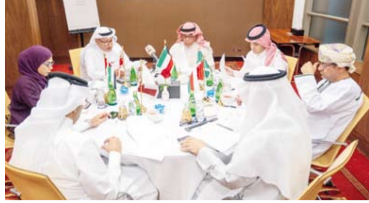
جانب من اجتماع مجلس إدارة اتحاد الصحفيين الخليجيين