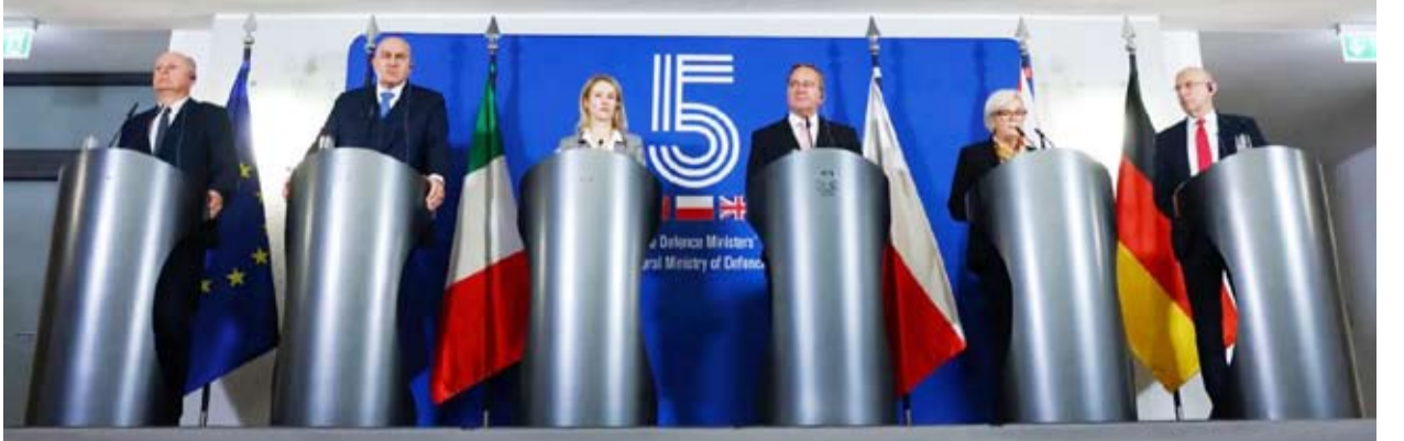
وزراء دفاع من دول الناتو

دفاعية «على غرار الأنظمة الدفاعية المضادة للمسيرات»، إضافة إلى «تعزيز تبادل المعلومات بين الحلفاء الأوروبيين». اتهمت دول أوروبية مراراً روسيا بشن حرب «هجينة»، أي حرب غير تقليدية إلى حد كبير، يمكن أن تشمل أعمال تخريب وحملات تضليل إعلامي وغيرها من الهجمات المسببة لاضطرابات.