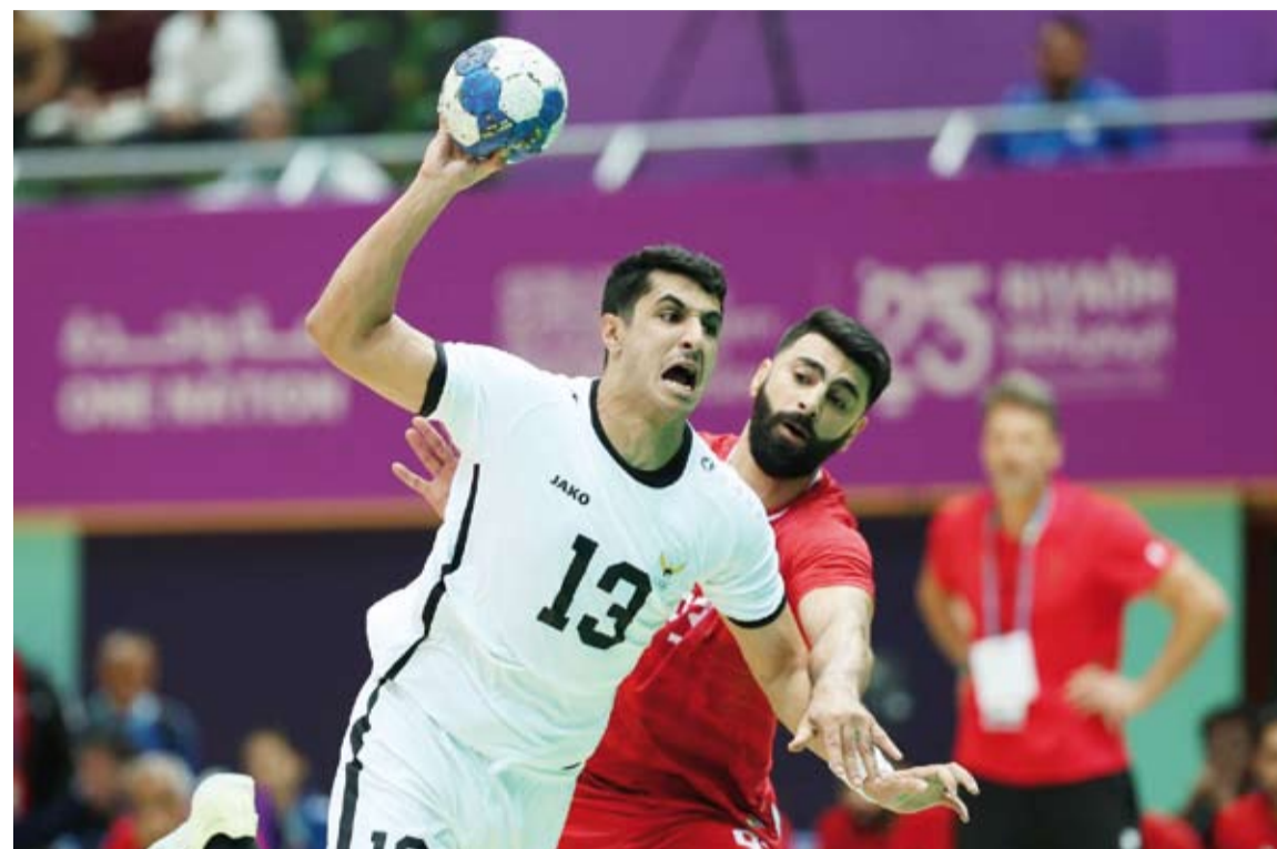
مباراة مثيرة بين الكويت والبحرين

أعلنت منصة البث التلفزيوني "ماجنتا تي في" أن الألماني بورغن كلوب، المدير الفني السابق لفريق ليفربول الإنجليزي لكرة القدم، سيعمل محلاً تلفزيونياً خلال نهائيات كأس العالم 2026 في الولايات المتحدة والمكسيك وكندا.