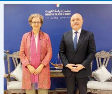
ممثل الشمالي يلتقي رئيس بعثة مفوضية إيريبي سياني

أكد سفير دولة الكويت لدى الهند مشعل الشمالي، أن مساهمات الكويت للمفوضية السامية للأمم المتحدة لشؤون اللاجئين ترسخ إيماننا وتفهمنا لالاعباء والمسؤوليات الجسام التي تقوم بها في كافة أنحاء العالم لتخفيف معاناة اللاجئين وتوفير سبل الحياة الكريمة لهم. وذكرت السفارة في بيان، أن ذلك جاء خلال لقاء السفير الشمالي برئيس بعثة المفوضية السامية للأمم المتحدة لشؤون اللاجئين في الهند جيزر المالديف إيريتي سياني، أول أمس، في «نيودلهي» والذي تناول فيه الشراكة الراسخة بين الكويت والمفوضية الأممية والتعاون المتميز المشترك بينهما منذ سنوات. وأضاف السفير الشمالي، أن دعم الكويت لأعمال وأنشطة المفوضية يشكل إحدى الدعائم الرئيسية لمواصلة عمل المفوضية بانتظام. من جانبها، أشادت سياني، بمساهمات الكويت الإنسانية للمنظمات المعنية بالشؤون الإنسانية بهدف القيام بمهامها على أكمل وجه، معربة عن شكر المفوضية وتقديرها لمساهمات الكويت السخية ودعمها المتواصل. واستعرضت سياني الأنشطة الإنسانية التي يقوم بها ويشرف عليها مكتب الهند في تقديم المساعدة والمساندة للاجئين وطالبي اللجوء في الهند من الجنسيات المختلفة.