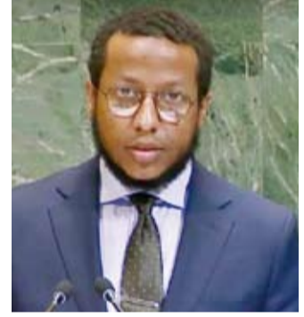
راشد فرحان يلقي كلمة الكويت

وسلط الضوء على الدور المحوري للمجلس الاقتصادي والاجتماعي في تعزيز التنسيق بين الوكالات ومتابعة تنفيذ الالتزامات الدولية وضمان تكامل الجهود بين الأبعاد الاقتصادية والاجتماعية والبيئية للتنمية المستدامة. وعلى الصعيد المحلي استعرض الملحق الدبلوماسي جهود الصندوق الكويتي للتنمية الاقتصادية العربية في دعم المشروعات الحيوية والبنى التحتية في الدول النامية وتعزيز الشراكات الإقليمية والدولية الهادفة إلى تحقيق النمو الشامل والمستدام. وبشأن بند تنفيذ نتائج المؤتمرات والقمة الأممية الكبرى أوضح فرحان أن ذلك يستدعي تعزيز الترابط بين الأجهزة الرئيسية للأمم المتحدة وتطوير آليات الرصد والمتابعة ورفع مستوى الشفافية والمسؤولية المشتركة في تنفيذ الالتزامات. وأكد في هذا الصدد على أهمية تكامل عمل المجلس الاقتصادي والاجتماعي مع المنتدى السياسي رفيع المستوى بما يسهم في تقييم التقدم المحرز في أهداف التنمية