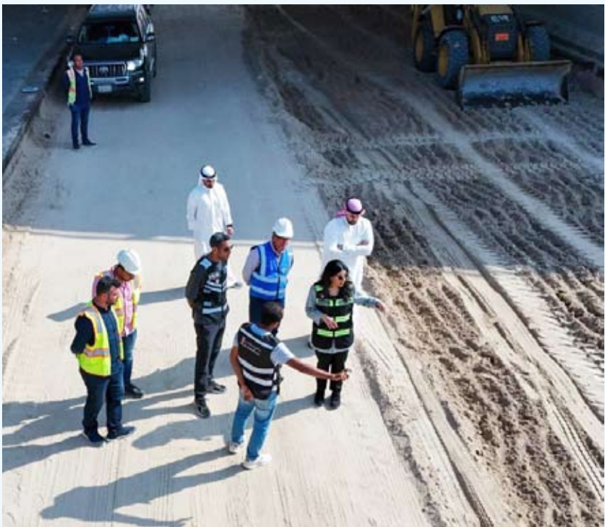
وزيرة الأشغال في أحد مواقع العمل

وأضاف العنزي أن المشروع يتضمن كذلك تجديد أعمدة الإنارة وأعمال الشبكة الهاتفية وشبكة الري، مبيّناً أن الأعمال تسير وفق البرنامج الزمني المحدد وبإشراف مباشر من قيادات الوزارة، تنفيذاً لتوجيهات الوزارة بضرورة تسريع وتيرة الإنجاز وتحسين الخدمات في المناطق السكنية