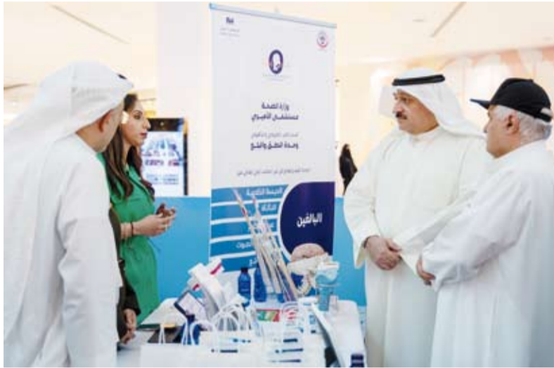
د. أحمد العوضي خلال الفعالية

أكد وزير الصحة الدكتور أحمد العوضي، أن تنظيم اليوم التوعوي بمناسبة اليوم العالمي للسكري الذي يصادف في الـ 14 من نوفمبر من كل عام يأتي في إطار خطة الوزارة واستراتيجيتها للتوعية الصحية والوصول المباشر إلى جميع أفراد المجتمع. وأضاف الوزير العوضي في تصريح صحفي خلال فعالية (صحة أفضل مع السكر) التي نظمتها الوزارة، أمس، في مجمع الأفنيوز، أن الفعالية شهدت مشاركة واسعة من عدة أقسام حرصت على نشر الوعي الصحي للطلاب والأطفال من خلال إجراء فحوصات السكري والضغط وتوزيع الأجهزة والكتيبات الإرشادية.