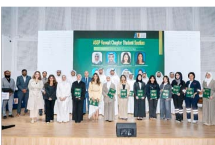
جانب من الفعالية

الأمريكية لبحر في السلامة داخل الجامعة يمثل فرصة ثمينة لاكتساب الخبرة العملية إلى جانب الدراسة