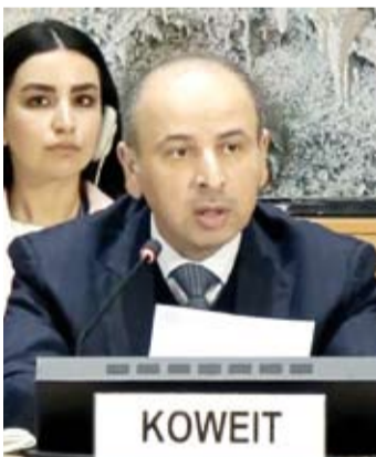
السفير ناصر الهين

شددت دولة الكويت، على ضرورة احترام سيادة السودان ووحدة أراضيها واستقلال قراره الوطني، مؤكداً أن المسار الأمثل لمعالجة الأزمة السودانية يمر عبر الحوار الوطني الشامل والحلول السياسية السلمية بعيداً عن أي إجراءات أو آليات لا تحظى بالتوافق أو بقبول الدولة المعنية. جاء ذلك في كلمة ألقاها المندوب الدائم لدولة الكويت لدى الأمم المتحدة والمنظمات الدولية الأخرى في «جنيف» السفير ناصر الهين، أول أمس، أمام مجلس الأمم المتحدة لحقوق الإنسان الذي يعقد جلسة خاصة حول الأوضاع في مدينة (الفاشر) السودانية. وعبر السفير الهين في الكلمة عن إدانة دولة الكويت واستنكارها الشديدتين للانتهاكات الجسيمة التي ارتكبتها قوات الدعم السريع إثر استهدافها المدنيين الأبرياء في (الفاشر)، مؤكداً رفض البلاد القاطع لأي ممارسات تمس الحماية الواجبة للمدنيين بموجب القانون الدولي الإنساني. وشدد على أهمية ضمان حماية السكان المدنيين وتيسير وصول المساعدات الإنسانية إلى مستحقيها من دون عوائق أو تأخير، وذلك التزاماً بالقواعد الدولية ذات الصلة وبما نص عليه إعلان جدة لعام 2023، مجدداً دعم دولة الكويت للجهود الإقليمية والدولية الرامية إلى إيقاف إطلاق النار واستئناف العملية السياسية وصولاً إلى تسوية سلمية شاملة ومستدامة.