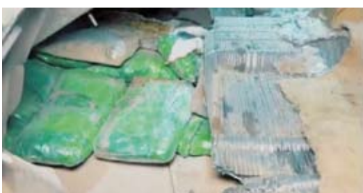
ضبط كميات كبيرة من المواد المخدرة

حيث تم رصد وضبط المركبة فور وصولها إلى ميناء الشويخ البحري القادمة من تلك الدولة إضافة إلى ضبط المتهم الذي قام بجلبها. وبينت أنه لضمان سلامة التفتيش تمت الاستعانة بفرق من قوة الإطفاء العام تحسباً لأي مخاطر محتملة عند فتح الأجزاء السرية للمركبة نظراً لخطورة بعض طرق وأساليب التهريب، وقد أسفرت الجهود المشتركة عن العثور على أكثر من 100 كيلو من مادي الحشيش والماریجوانا مخبأة بإتقان في أماكن متفرقة داخل المركبة.