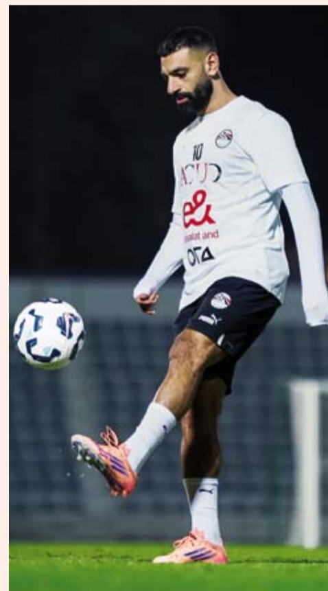
محمد صلاح لم يظهر بالستوى الموعود

تأهل منتخب أوزبكستان إلى نهائي بطولة كأس العين الدولية الودية وذلك بعد فوزه على نظيره المصري بهدفين دون رد في مباراة نصف نهائي البطولة المقامة في أبو ظبي. وتقدم منتخب أوزبكستان في الدقيقة الرابعة عن طريق أوسون أوروشوف، قبل أن يضيف اللاعب نفسه الهدف الثاني في الدقيقة 43.