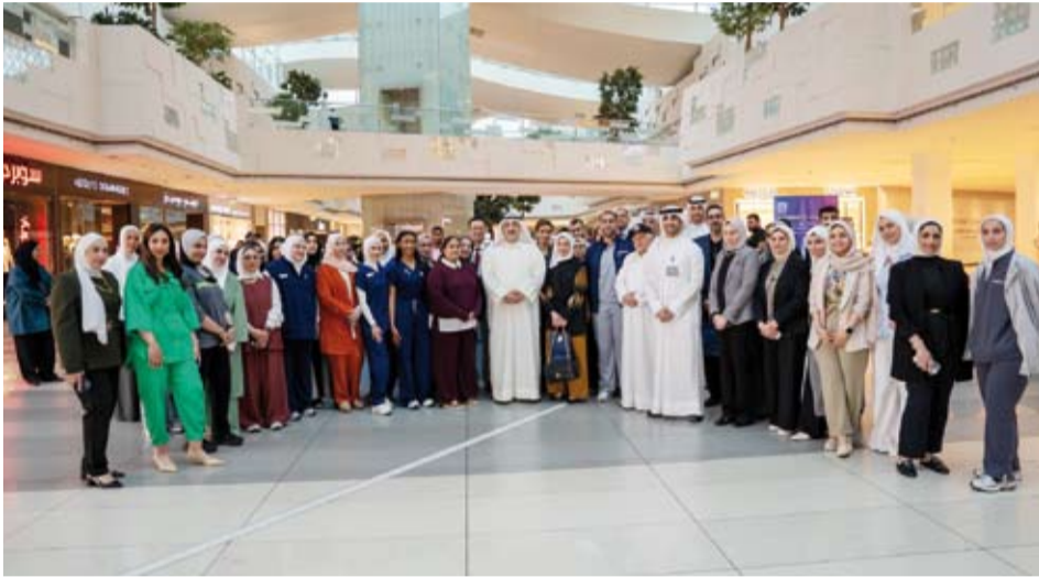
وزير الصحة في لحظة جماعية مع المشاركين