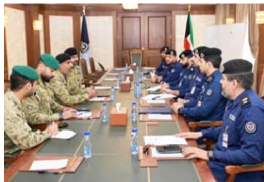
جانب من اجتماع الإطفاء والحرس الوطني

عقدت قوة الإطفاء العام اجتماعاً مع الحرس الوطني في مقر رئاسة القوة جرى خلاله بحث بنود بروتوكول التعاون المشترك بين الجانبين والاتفاق على وضع خطة زمنية لتفعيل بنود البروتوكول لعام 2026.