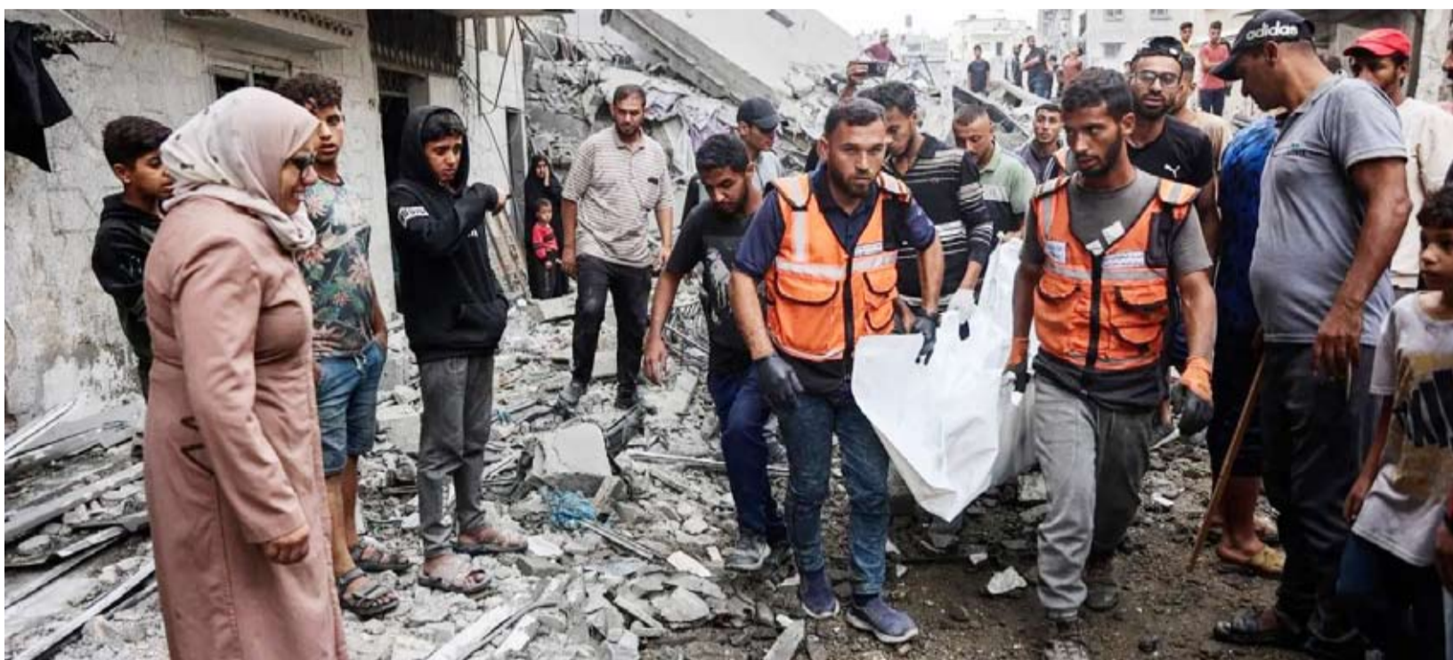
فلسطينيون يحملون جثثاً انتشلوها من بين الأنقاض

نقلت وكالة الأنباء السورية (سانا)، عن وزارة الدفاع قولها إن العاصمة دمشق تعرضت لهجوم بصاروخين من نوع «كاتوشا» أطلقا من أطراف المدينة باتجاه الأحياء السكنية في منطقة المزة ومحيطها، ما أسفر عن إصابة عدد من المدنيين وإلحاق أضرار مادية بالمكان. وقالت إدارة الإعلام والاتصال في وزارة الدفاع للوكالة الرسمية إنها باشرت التحقيق في ملابسات الهجوم، بالتعاون