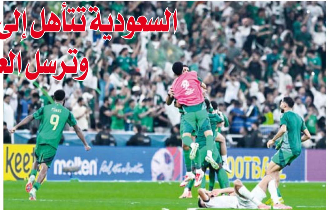
فرحة عارمة للأخضر السعودي بالتأهل للمونديال

التعادل الذي يمنحه بطاقة العُبور السابع إلى نهائيات كأس العالم، مستفيداً من فارق الأهداف مع نظيره العراقي. وفاز منتخب السعودية في الجولة الأولى على إندونيسيا 3-2، بينما تغلب المنتخب العراقي على نظيره الإندونيسي في الجولة الثانية 1-0. صفر ما رجح كفة المنتخب السعودي. وبلتقي العراق مع الإمارات، صاحبة المركز الثاني في المجموعة الأولى، ذهاباً وإياباً يومي 13 و18 نوفمبر المقبل، لتحديد المنتخب الذي سيمثل آسيا في الملحق العالمي، من أجل فرصة أخيرة لبلوغ كأس العالم التي تأهل إليها العراق مرة واحدة سابقة في عام 1986.