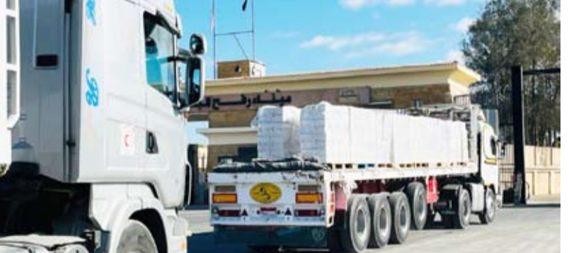
400 شاحنة تحمل 9700 طناً دخلت عبر معبر رفح