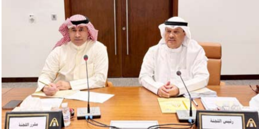
رئيس اللجنة ومقرها