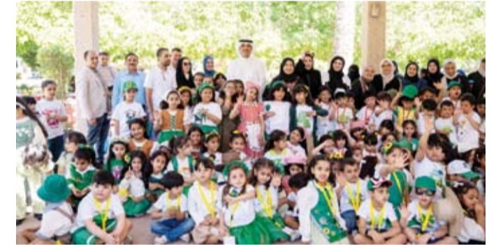
محافظ «الأحمدي» برفقة الطلبة والجهات التعليمية

وتعزيز المظهر الحضاري للمنطقة وتغرس في نفوس الشراء قيم المحافظة على البيئة. وأكد الشيخ حمود الجابر في ختام الفعالية، أن مثل هذه الأنشطة تعد استثماراً في وعي الأجيال القادمة لا سيما تفاعل المدارس والجهات للمشاركة، داعياً إلى استمرار مثل هذه المبادرات التي تجمع بين التعليم والقيم البيئية والتطوعية. ومن جهتهم عبر الطلبة عن سعادتهم بهذه التجربة العملية التي رسخت لديهم مفاهيم العمل الجماعي والمسؤولية تجاه البيئة والمجتمع وعززت روح الانتماء للوطن من خلال المساهمة في تجميل مدارسهم ومناطقهم.