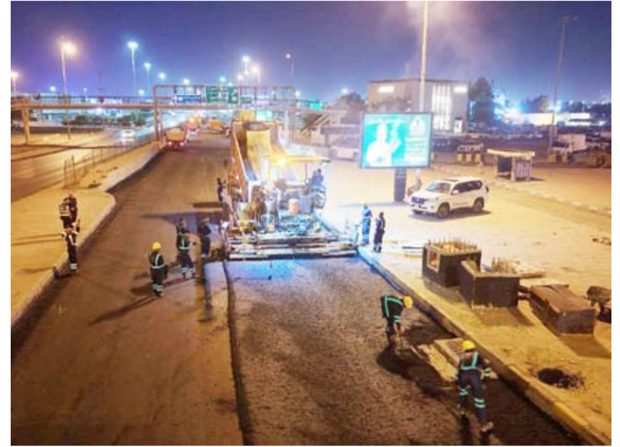
تمهيد الطريق و فرش الاسفلت

قالت وزيرة الأشغال العامة الدكتورة نورة محمد المشعان إن الوزارة تولي اهتماماً كبيراً بمتابعة مشاريع الصيانة الجذرية للطرق ميدانياً، حرصاً على تنفيذها وفق أعلى معايير الجودة والسلامة، وتسريع وتيرة الإنجاز بما يواكب تطلعات الدولة في تطوير بنيتها التحتية. وأشارت الدكتورة المشعان إلى أن فرق وزارة الأشغال تواجدت في موقع طريق الدائري الرابع مقابل منطقة الشويخ، للوقوف على آخر تطورات أعمال الصيانة الجذرية الجارية في المشروع، والتي تتضمن حالياً فرش طبقة أسفلت من النوع Type 1 ضمن نطاق الجديدة للصيانة. وأكدت الوزيرة أن فرق الإشراف تتابع سير الأعمال بشكل مستمر لضمان تنفيذها وفق الجدول الزمني المحددة والمواصفات الفنية المعتمدة، مشددة على أن الوزارة مستمرة في جهودها لرفع كفاءة شبكة الطرق وتعزيز مستوى الأمان لمستخدميها.