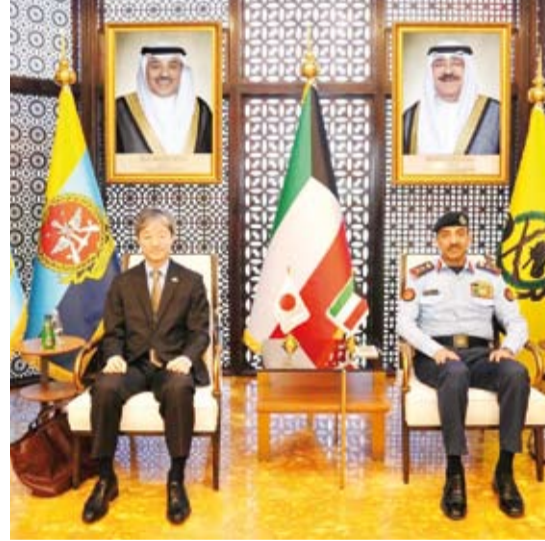
الفرق الركن خالد الشريهان مستقبلاً سفير اليابان كينيتشيرو موكاي

استقبل رئيس الأركان العامة للجيش الفريق الركن خالد الشريهان، بمكتبه صباح أمس، سفير اليابان لدى البلاد كينيتشيرو موكاي يرافقه الملحق العسكري الياباني العقيد ريو تاتسوكاوا. حيث تم خلال اللقاء تبادل الأحاديث الودية ومناقشة أهم المواضيع ذات الاهتمام المشترك ضمن محور الزيارة.