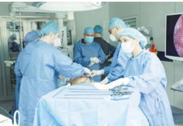
جانب من العملية الجراحية

وهو مما يؤشر إلى نجاح العملية، وبداية تعافي جسم المريض بفضل الله، فقد كان المريض قبل العملية لا يستطيع حتى شرب السوائل. وأكد السليمي، أن في هذه الحالات لا بد من التدخل الجراحي بعدة طرق منها تحويل مسار للمعدة، لكن هذه الطريقة ليست أفضل العلاجات، فكان أفضل علاج لهذا المريض هو تحويل مسار عند الجزء الثالث من الاثنى عشر، وهي عملية صعبة جداً بسبب قربها من الظهر بجانب العمود الفقري، فكان لا بد من تشريح الاثنى عشر لأنه يعتبر مخفياً بعكس المعدة والأمعاء.