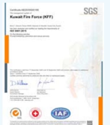
شهادة الأيزو (ISO 9001-2015) العالمية