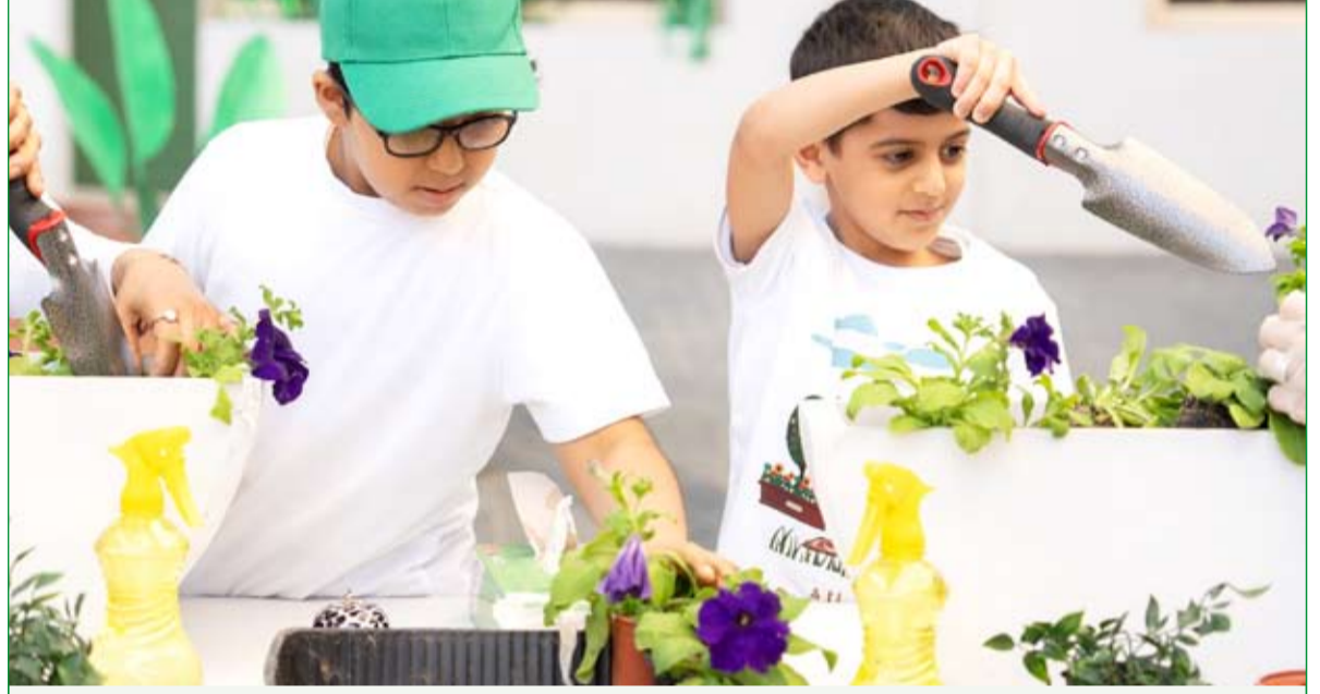
طلاب وطالبات عدة مدارس ساموا فيغرس الشتلات الزراعية

كما احتفلت مدارس وزارة التربية أمس بفعالية أسبوع التخضير التي تهدف إلى تعزيز الوعي البيئي لدى الطلبة وترسيخ مفهوم المحافظة على البيئة وزيادة المساحات الخضراء في محيط المدرسة.