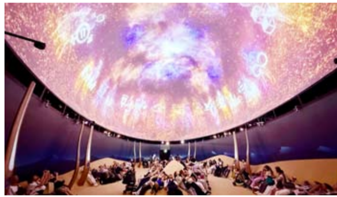
الجناح تفرد بتصميمه المعماري الجريء ومحتواه الجانبي