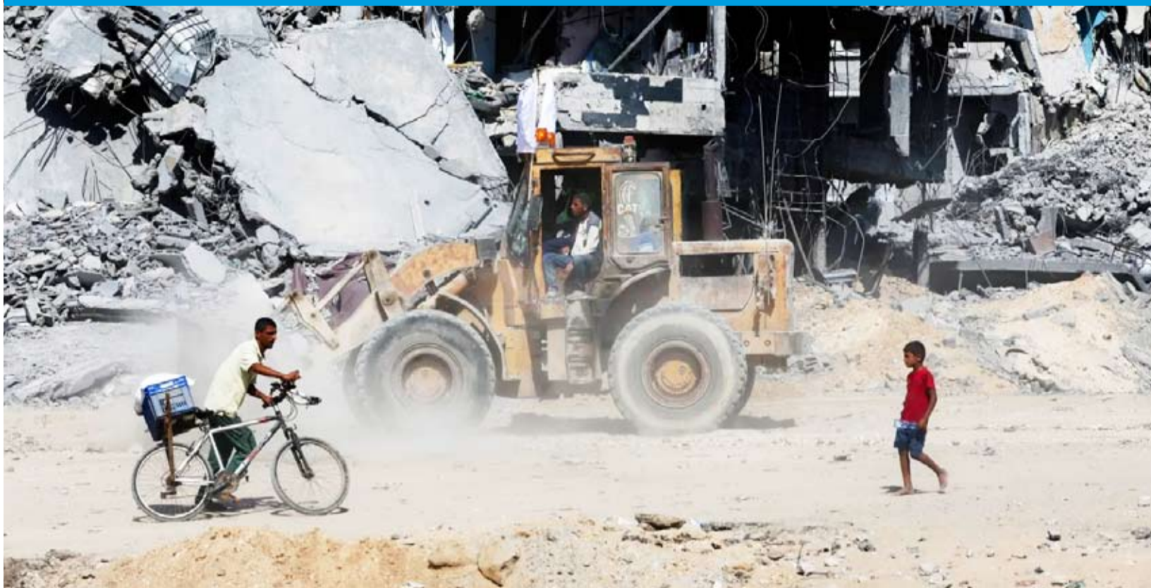
دمار واسع ومحاولة رفع الركام من الطرقات

واجه اتفاق وقف النار في غزة اختباراً مهماً، بعدما شوشت عليه خروقات للتهديد، فضلاً عن تأخر تسليم كل جثث الرهائن الإسرائيليين. ورغم أن الرئيس الأميركي دونالد ترامب، وحركة «حماس» أقادا بشكل منفصل قبل الاتفاق وبعده، فإن صعوبات تكتنف تسليم جثث الرهائن الـ28 التي تحتفظ بها الفصائل الفلسطينية دفعة واحدة؛ فإن إسرائيل حرصت على التصعيد بعد تسلّم 4 جثث فقط، وهددت بتقليص المساعدات التي تدخل إلى القطاع، ونقلت تقارير عن مسؤولين في تل أبيب إرجاء فتح معبر رفح مع مصر الذي كان مقرراً. وتزامن ذلك مع تحذير وجهه الرئيس ترامب لحركة «حماس»، وقال في تصريح بالبيت الأبيض: «إذا لم يتخلوا عن سلاحهم فسوف ننزع نحن سلاحهم». في غضون ذلك، قتلت إسرائيل نحو 9 فلسطينيين في هجمات داخل غزة، ما عدته «حماس» خرقاً واضحاً للاتفاق، بينما اتهم الجيش الإسرائيلي الضحايا بخرق «الخط الأصفر» الذي انسحب خلفه.