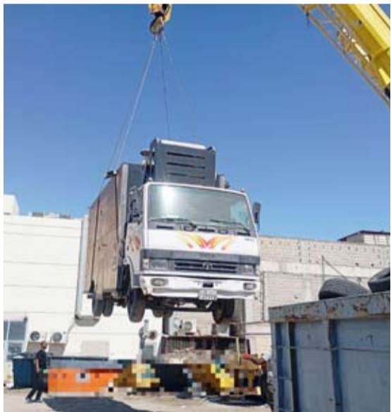
رفع سيارة مهمة

أعلنت إدارة العلاقات العامة في بلدية الكويت موافقة الفرق الميدانية لإدارات النظافة العامة وأشغال الطرق تكثيف جولايتها التفتيشية لرصد وإزالة مخالفات لائحتي النظافة وأشغال الطرق البلدية في كافة المحافظات وتفعيل الدور الرقابي للأجهزة الرقابية لتطبيق قوانين البلدية. وأوضحت أن إدارة النظافة العامة وأشغال الطرق بفرع بلدية محافظة مبارك الكبير يعمل جولايات وأسعة على المناطق السكنية وذلك لرفع مستوى النظافة وكل ما يعمل على إعاقة الطريق ويشوه المنظر العام ومنع رمي النفايات خارج الحاويات.