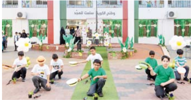
جانب من الفعاليات