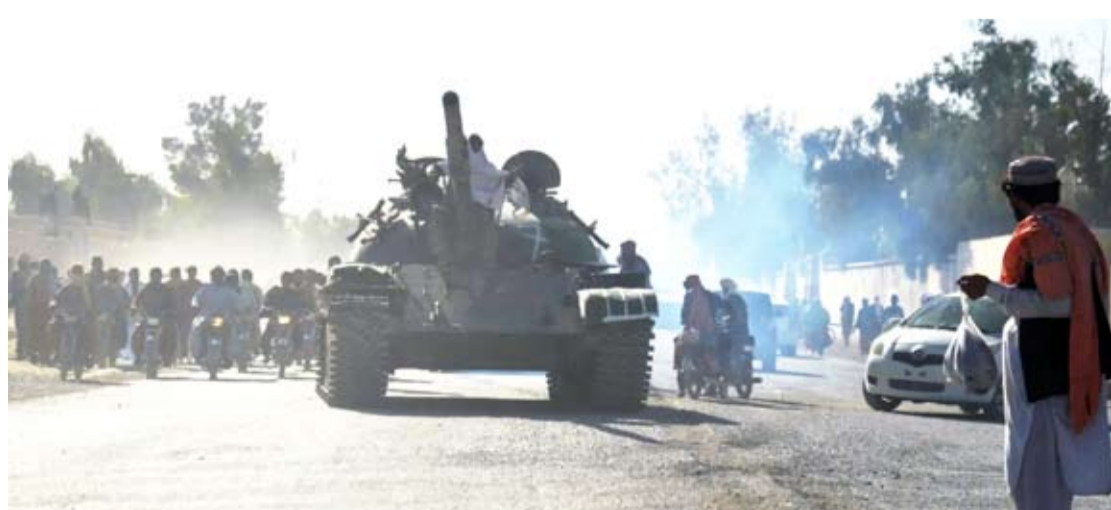
مقاتلون من طالبان يجهنون مناطق الاشتباكات الحدودية