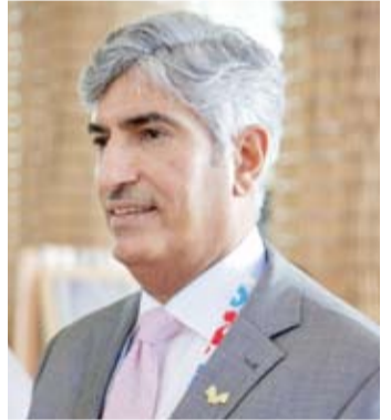
سفير الكويت لدى اليابان سامي الزمانان

الفترة من 13 أبريل الماضي إلى 13 أكتوبر الحالي بمشاركة 158 دولة ومنطقة، منها الكويت التي استقطبت جناحها حشوداً غفيرة من الزوار.