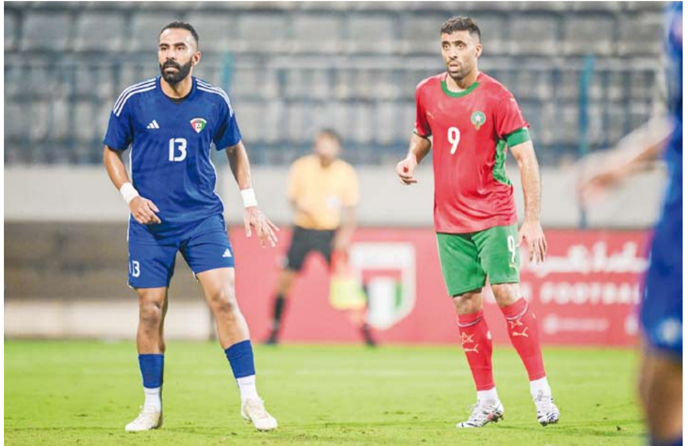
تجربة مفيدة للمنتخب الكويت الأول لكرة القدم أمام نظيره المغربي

المقبلة، وتأتي هذه المواجهة ضمن المعسكر التحضيري الذي يقيمه المنتخب الكويتي في دبي بهدف رفع الجاهزية الفنية والبدنية استعداداً للمرحلة القادمة من المنافسات الرسمية.