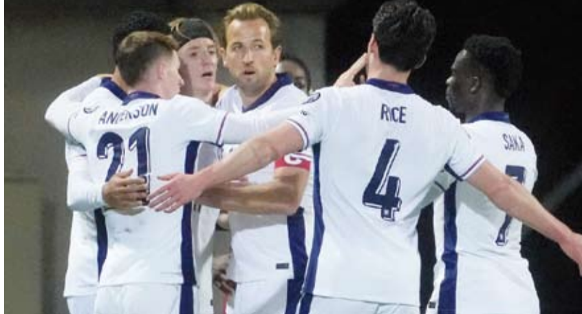
احتفال لاعبي إنجلترا بالتأهل

لأندورا الأخيرة. وفي أبرز مباريات التصفيات التي أقيمت اليوم، اقترب منتخب إسبانيا من التأهل إلى النهائيات، بعدما حقق فوزه الرابع بالعلامة الكاملة على ضيفه منتخب بلغاريا (4-0)، في المباراة التي جرت بينهما في مدريد ضمن الجولة الرابعة من المجموعة الخامسة. وسجل أهداف إسبانيا كل من كيل ميرينو في الدقيقتين (35)، و(57)، وأتاناس تشيرنيف لاعب بلغاريا بالخطأ في مرماه في الدقيقة (79)، وميكل أوباسابال من ركلة جزاء في الدقيقة (90+2). وبهذا الفوز، حافظت إسبانيا على صدارة المجموعة الخامسة برصيد 12 نقطة، متقدمة بفارق ثلاث نقاط عن تركيا، التي حققت فوزاً ساحقاً على جورجيا (4-1)، لتبقى على أمالها الضئيلة في التأهل المباشر.