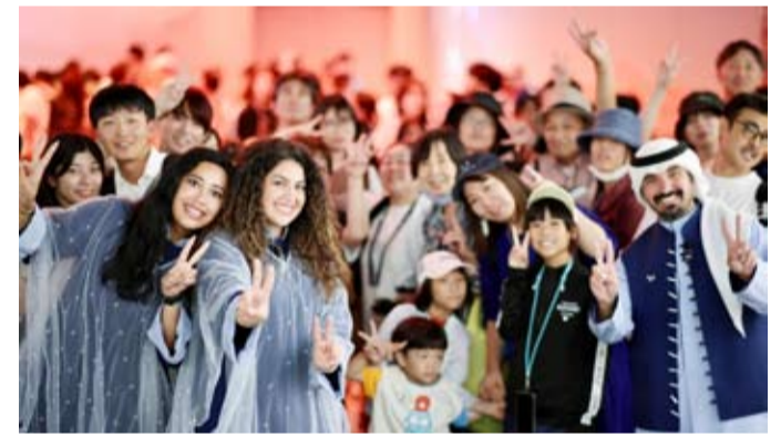
إقبال لافت على جناح دولة الكويت

نموذجٌ تحذى به في كيفية توظيف الدول لقواها الناعمة وتجبرتها الإبداعية لبناء الحضور الدولي وتعزيز الحوار العالمي. كما نال جناح الكويت إشادة خاصة على صعيد التجربة التوثيقية لما قدمه من تجربة طهي استثنائية. فقد نال المطعم الموجود داخل الجناح، في ثقل تكهات المطبخ الكويتي إلى الساحة العالمية. استوحى المطعم أطباقه من مكونات أصيلة وصفات تقليدية، مُقدماً للزوار تجربة فريدة تُمكنهم من تذوق أطباق الكويت التراثية الغنية، ليصبح بذلك أحد أكثر وجهات الطعام جذباً للزوار ضمن «إكسبو 2025 أوساكا».