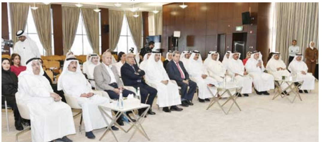
جانب من المشاركين في الندوة الحوارية

وتكريس قيم المسؤولية المهنية. واختتم المناعي كلمته بتقديم جليل الشكر إلى وزير الإعلام والثقافة ووزير الدولة لشؤون الشباب عبدالرحمن المطيري والقائمين بوزارة الإعلام على جهودهم في تسهيل تنظيم هذه الفعالية والتي جميع المشاركين والحضور الكرام على تواجدهم ومساهماتهم في إنجاحها.