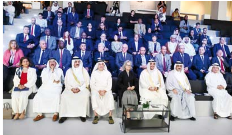
الوزير عبد الرحمن المطيري يتقدم الحضور