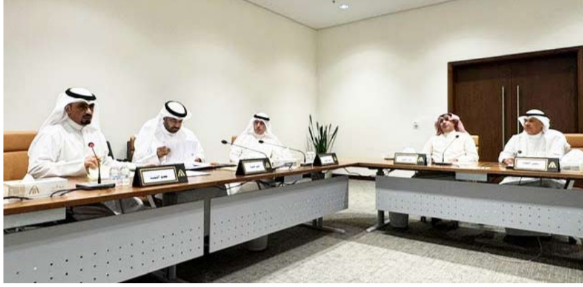
جانب من اجتماع لجنة الاحمدى