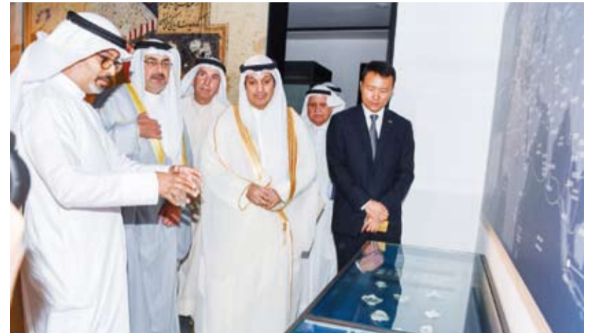
وزير الإعلام والثقافة والشباب عبدالرحمن المطيري خلال حفل افتتاح المعرض