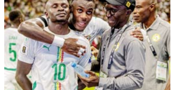
ساديو ماني يحتفل بهدفه في شبك موريتانيا

وأخيرة برصيد 5 نقاط. وأخيرة برصيد 7 نقاط، وجنوب السودان سادسة وأخيرة برصيد 5 نقاط.