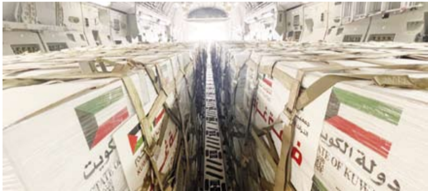
جانب من المساعدات الكويتية

تنفيذاً لتوجيهات صاحب السمو أمير البلاد الشيخ مشعل الأحمد، مشيراً إلى أن الجمعية عملت خلال الجسر الجوي الكويتي الثاني بالتعاون مع الجمعيات والمبرات الخيرية داخل الكويت وبالتنسيق مع الشركاء الإنسانيين المحليين والدوليين لضمان وصول المساعدات إلى مستحقيها. وأشار إلى أن هذه المساعدات سيتم توزيعها على عشرات الآلاف من الأسر المتضررة الأكثر احتياجاً داخل القطاع، مؤكداً أن وصولها يمثل بارقة أمل لسكان القطاع الذين يواجهون أوضاعاً إنسانية صعبة نتيجة الحصار ونقص المواد الغذائية الأساسية. وبيّن أن المساعدات تأتي في إطار التزام دولة الكويت الراسخ بدعم الشعب الفلسطيني الشقيق