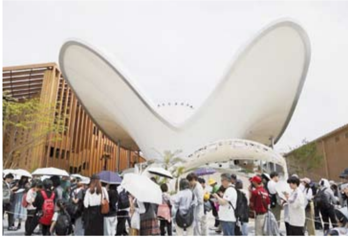
الجناح الكويتي في معرض «إكسبو أوساكا 2025»