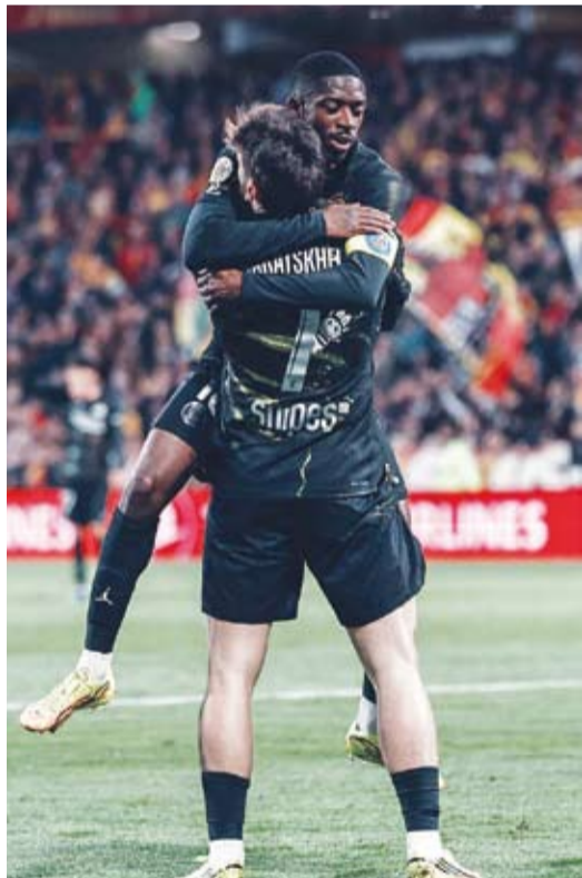
كفار اتسخيليا يحتفل مع ديمبيلي بعد الهدف

توج باريس سان جيرمان رسمياً بلقب بطل الدوري الفرنسي للمرة الخامسة تواليها والرابعة عشرة في تاريخه عندما تغلب على مضيفه وملاحقه لانس 2-0، في مباراة مؤجلة من المرحلة التاسعة والعشرين.