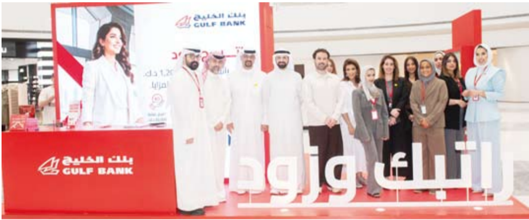
فريق بنك الخليج

المزايا التنافسية في السوق المصرفي، في إطار مساعيه المستمرة لمكافأة عملائه ومساعدتهم على تحقيق أحلامهم.