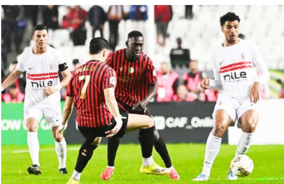
الزمالك المصري ينتظر حسم لقب الكونفيدرالية