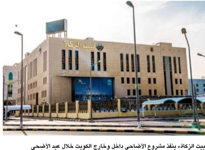
«بيت الزكاة» ينفذ مشروع الأضاحي داخل وخارج الكويت خلال عيد الأضحي