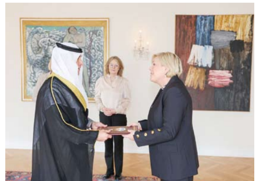
السفير محمد المحمد يقدم أوراق اعتمادها إلى رئيسة أيسلندا هالا توماسدوتير

قدم سفير دولة الكويت لدى أيرلندا محمد المحمد أوراق اعتماده إلى رئيسة أيسلندا هالا توماسدوتير سفيراً غير مقيم لدولة الكويت لدى بلادها. وذكرت سفارة دولة الكويت لدى أيرلندا في بيان تلقت (كونا) نسخة منه أمس، أن مراسم تقديم أوراق الاعتماد جرت، أول أمس، في القصر الرئاسي بعاصمة أيسلندا ريكيافيك. ونقل السفير المحمد خلال اللقاء تحيات صاحب السمو أمير البلاد الشيخ مشعل الأحمد وسمو ولي العهد الشيخ صباح الخالد لرئيسة أيسلندا وتمنياتها لدولة أيسلندا وشعبها الصديق دوام التقدم والازدهار.