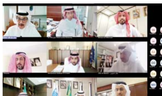
جانب من مشاركة جامعة الكويت في الاجتماع

مثلة بكلية الهندسة والبتترول مقترح مبادرة التعاون البحثي المشترك التي تهدف إلى دعم البحوث المشتركة بين الجامعات وإثراء الجانب المعرفي وتبادل الخبرات والتجارب البحثية بين الكليات المتخصصة في