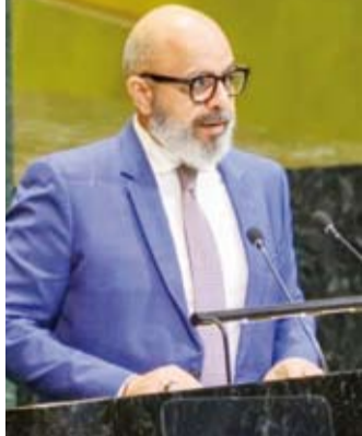
السفير طارق البنائي

شكل محطة محورية في ترسيخ نتائج التحرير من خلال الترحيب باستعادة سيادة الكويت واستقلالها وسلامتها الإقليمية وعودة حكمها الشرعية ووضع ترتيبات دولية مهمة شملت إيقاف إطلاق النار وترسيم الحدود ومعالجة ملف التعويضات والممتلكات والأسرى والمقودين. واعتبر تحرير دولة الكويت شاهداً على أن العمل الدولي الجماعي متى استند إلى الميثاق والقانون الدولي ووحدة الموقف قادر على ردع العدوان وإنصاف المظلوم واستعادة الحقوق وصون سيادة الدول واستقلالها ووحدة أراضيها. واستعرض مندوب الكويت، مسيرة البلاد الفاعلة داخل المنظمة الأممية في محطات عديدة ومن أبرزها عضويتها غير الدائمة في مجلس الأمن خلال الفترتين 1978-1979 و 2018-2019 حيث حرصت الكويت على أن تكون صوتاً داعماً للدبلوماسية الوقائية والحلول السياسية دولياً حاسماً للدفاع عن سيادة البلاد واستقلالها ووحدة أراضيها والتصدي لمحاولة محو كيان دولة عضو في الأمم المتحدة. واستشهد بان القرار (678) الصادر في 29 نوفمبر 1990 أتاح للدول الأعضاء المتعاونة مع حكومة الكويت استخدام جميع الوسائل اللازمة لتنفيذ قرارات مجلس الأمن ذات الصلة واستعادة السلم والأمن في المنطقة وهو ما أسهم في تحرير البلاد وعودة الشرعية وسيادتها على كامل أراضيها. وسلط السفير البنائي الضوء أيضاً على القرار (687) لعام 1991 الذي