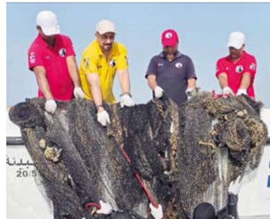
رفع الشباك العائقة