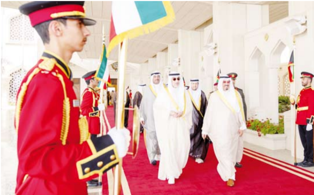
سمو الشيخ أحمد عبدالله لدى مغادرته البلاد

مقاليد الحكم. كما بعث سمو الشيخ أحمد عبدالله إلى الرئيس سانتياغو بينيا - رئيس جمهورية الباراغواي الصديقة بمناسبة ذكرى استقلال بلاده.