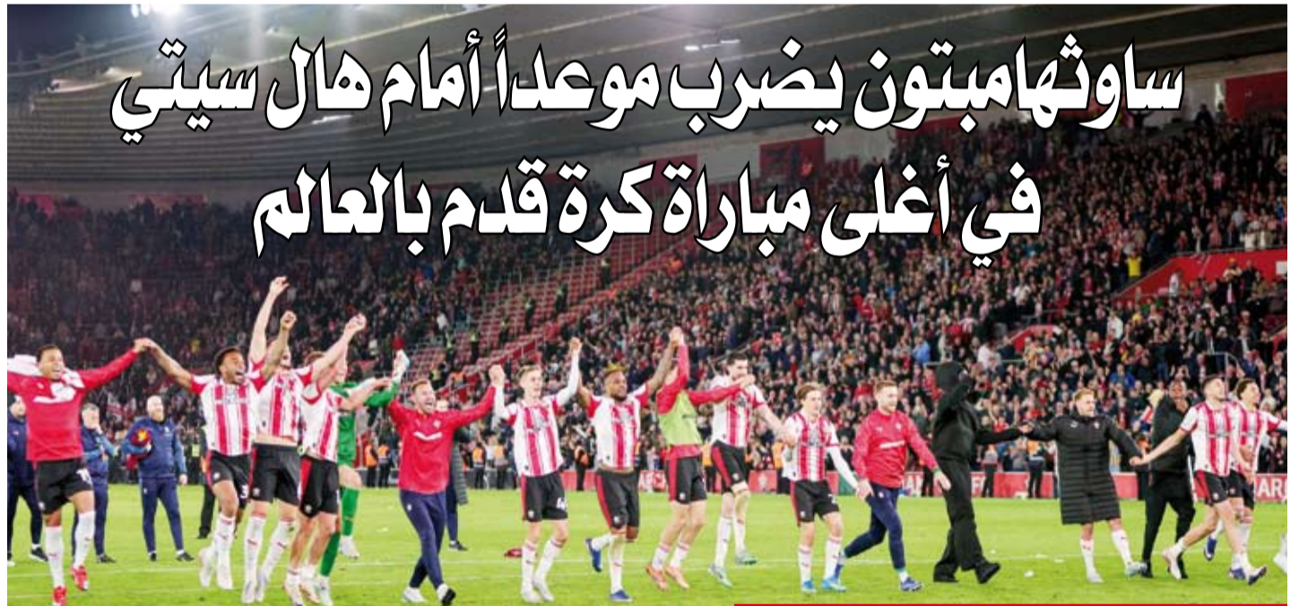
ساوثهامبتون على موعد مع مباراة فاصلة للعودة للدوري الإنجليزي الممتاز

سبقه وتأهل سيتي بعدما تغلب 2- صفر على ميلول. إلى ذلك يحمل هال سيتي الذي أنهى الموسم باحتلال المركز السادس، آخر البطاقات المؤهلة للمتحق الصعود، متخلفاً بفارق 10 نقاط عن ميلول ثالث الترتيب، بالعودة للدوري الممتاز بعد هبوطه عام 2020.