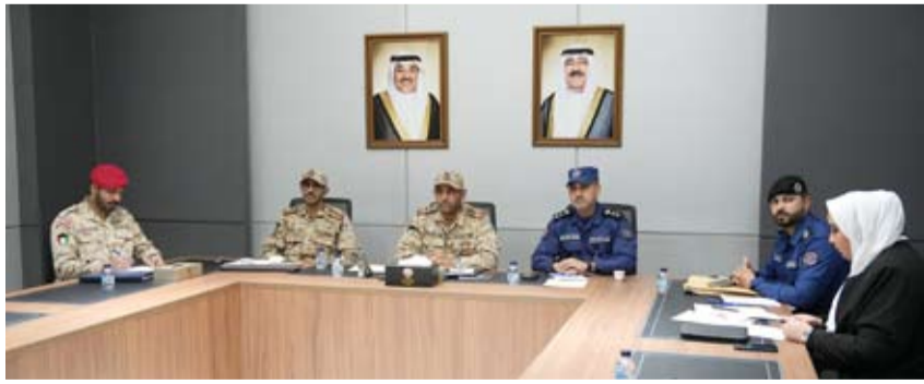
فريق «أمان» خلال الاجتماع التنسيق عبر تقنية الاتصال المرئي

التحديات المتسارعة. وأكد حرص الجانبين على تعزيز التعاون وتبادل الزيارات والخبرات بما يساهم في تطوير منظومات إدارة الأزمات والطوارئ بين البلدين الشقيقين. وقال الفريق في بيان اليوم الخميس إن الاجتماع تناول سبل تطوير آليات التنسيق وتبادل المعلومات بين الجانبين والإطلاع على أفضل الممارسات المتبعة في إدارة الحالات الطارئة ومدى جاهزية والاستجابة لمختلف أنواع الأزمات والكوارث. وأضاف أن الاجتماع تطرق إلى عدد من المبادرات المستقبلية المشتركة التي من شأنها تعزيز القدرات المؤسسية في إدارة الأزمات والكوارث بما يواكب