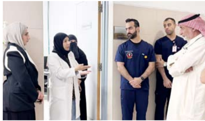
جولة في العيادة التخصصية لجراحة الوجه والفم والفكين