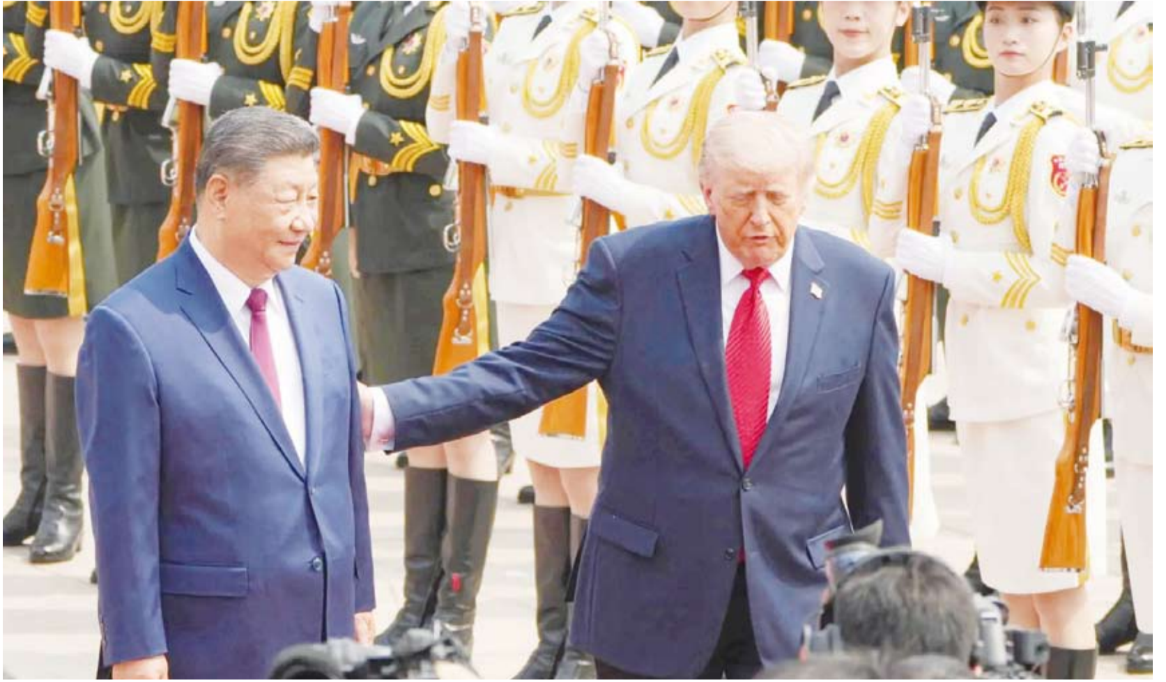
مراسم الاستقبال في قاعة الشعب الكبرى ببكين