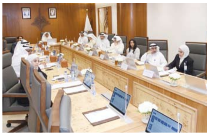
د. نادر الجلال خلال اجتماعه مع الهيئة العامة للتعليم التطبيقي والتدريب

العمل الكويتي وخطط الدولة التنموية مشيراً إلى أن هذه البرامج ستعتمد على التدريب التطبيقي المتقدم والتقنيات الحديثة بما يواكب المستجدات العالمية في مجالات التكنولوجيا والابتكار والتحول الرقمي.