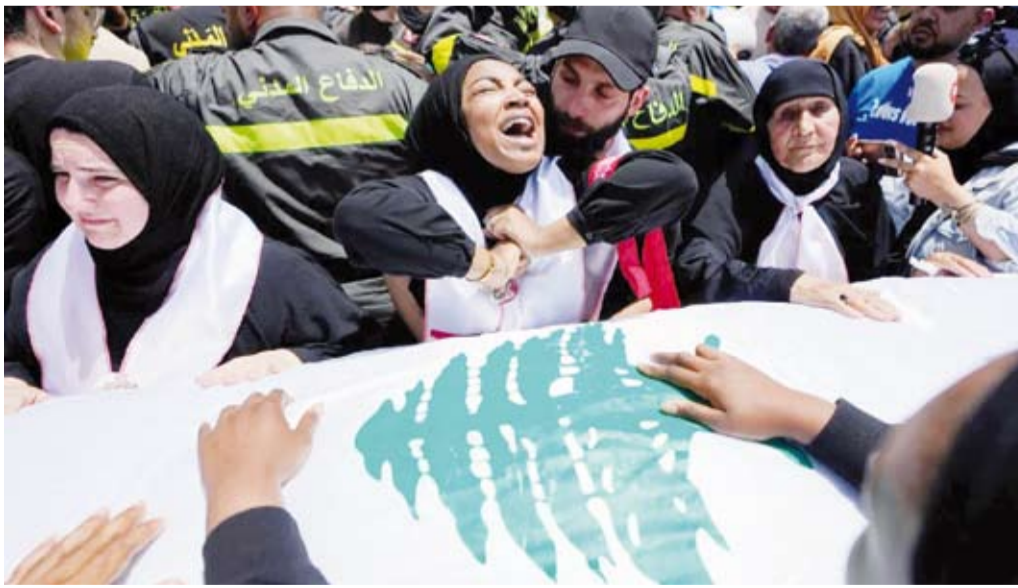
نساء ينتخبن على نعش عنصر في الدفاع المدني

صيفة شبيهة باتفاقية الهدنة الموقعة عام 1949، وأن بصيغة مطوّرة يصفها بعض المقربين منه بـ«الهدنة بلاس»، وتشمل هذه المقاربة مبدئياً تثبيت وقف إطلاق النار، ثم انسحاب القوات الإسرائيلية إلى الحدود، ووقف الاعتداءات، على أن يلي ذلك انتشار الجيش اللبناني، وتولية زمام الأمن في الجنوب، ومن ثم في كل لبنان، ويخلص المصدر إلى أن لبنان يريد من المفاوضات إنهاء حالة العداء لا اتفاقية سلام ترتبط بمسار عربي لم ينضج بعد.