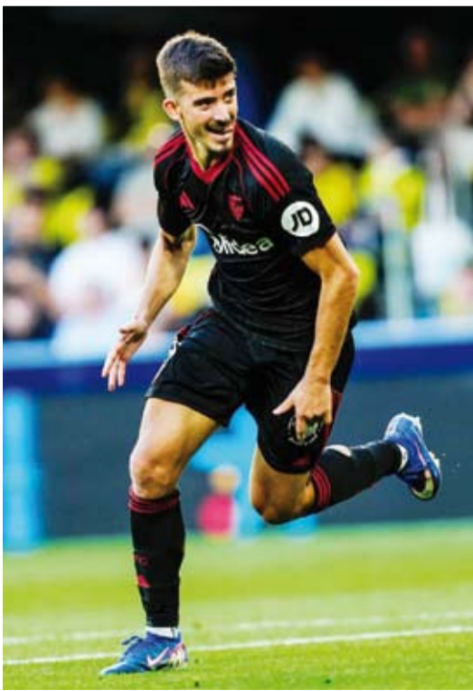
فوز مهم لإشبيلية على فياريال

عزز إشبيلية وإسبانيول حظوظهما في البقاء بفوزيهما الـثمينين على فياريال 3-2 وأنتيك بلباو 2-0 توالياً، من المرحلة السادسة والثلاثين من بطولة إسبانيا لكرة القدم.