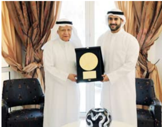
تكريم الشيخ مبارك فهد الجابر الصباح لإبراهيم العبدالمحسن

أكد المدير العام المشترك للإنتاج البرامجي المشترك لمجلس التعاون لدول الخليج العربية الشيخ مبارك فهد الجابر الصباح، أن ما بناه الجيل المؤسس من قيادات ومسؤولين يعد نبراساً تستلهم منه المؤسسة مسيرتها الحالية بما يواكب الرؤى الوطنية والتنموية لدول مجلس التعاون لدول الخليج العربية. وذكرت المؤسسة في بيان لـ (كونا) أمس، أن ذلك جاء خلال تكريم الشيخ مبارك فهد الجابر الصباح لأول مدير عام للمؤسسة إبراهيم العبدالمحسن بمناسبة مرور 50 عاماً على تأسيس المؤسسة.