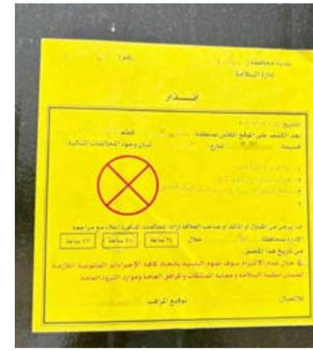
إنذار من البلدية

أعلنت إدارة العلاقات العامة عن قيام الفرق الرقابية لإدارة السلامة في محافظة حولي بالتفتيش على الاعمال الإنشائية وتوفير وسائل الامن والسلامة ورصد المخالفات في مواقع الإنشاء والترميم واتخاذ كافة الإجراءات الرقابية بحق المخالفين والتأكد من مدى الالتزام ببلوائح ونظم اعمال السلامة. وأكدت ان الجولة الميدانية التي قام بها الفريق الرقابي خلال هذا الاسبوع أسفرت عن توجيه 27 إنذار عدم الالتزام بأشراطات الامن والسلامة وتنفيذ 24 معاملة تنوعت ما بين رخصة سلامة وترخيص تشوين وشهادات