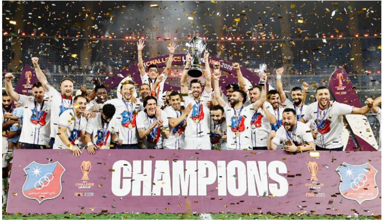
الأبيض الكويتي على منصة التتويج

هنا رئيس الاتحاد الآسيوي لكرة القدم الشيخ سلمان بن إبراهيم آل خليفة نادي الكويت الكويتي يفوز ببطولة دوري التحدي الآسيوي (2026). وقال رئيس الاتحاد الآسيوي لكرة القدم إن «الإنجاز الكبير» الذي حققه فريق نادي الكويت يجسد المكانة المتميزة التي يحتلها على الساحة الكروية القارية. وأضاف أن الفوز باللقب القاري جاء لترجم روح العزيمة والإصرار التي يتحلى بها أفراد فريق نادي الكويت الذي استفاد من خبرات نجومه ودعم جماهيره الكبيرة. وأعرب عن شكره وتقديره إلى الجهات الرسمية في دولة الكويت ممثلة في الاتحاد الكويتي لكرة القدم والأجهزة المعنية على جهودهم المتميزة في استضافة المباراة النهائية مشيداً بالترتيبات التنظيمية الدقيقة التي أسهمت في إنجاح الحدث الكروي القاري وإخراجه بصورة زاهية على كافة الأصعدة.