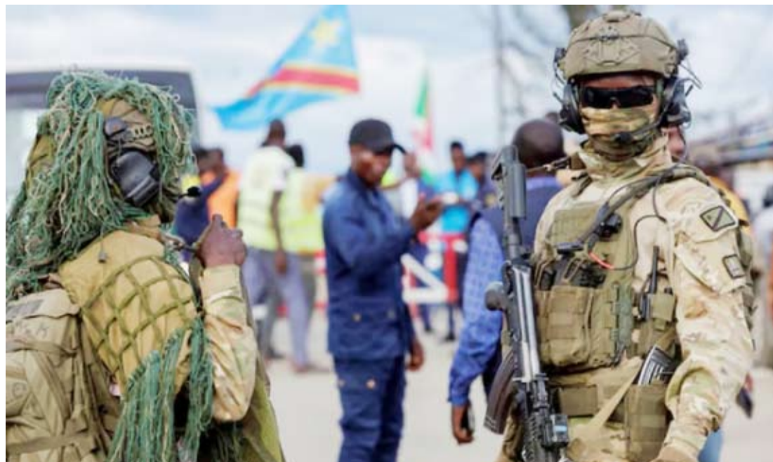
جنود يجرسون عملية إعادة اللاجئين الكونغوليين

مسجلة بذلك أول تحول ميداني كبير منذ أشهر، وفق ما نقلته «رويترز»، وإذاعة فرنسا الدولية. ووفقاً لتصريحات للجيش الكونغولي، فإن الانسحاب جاء استجابة لضغوط عسكرية من كينشاسا، وأخرى دبلوماسية من واشنطن. وكانت الحركة قد شنت هجوماً على مدينة أو فيرا المهمة استراتيجياً بشرق الكونغو، في ديسمبر الماضي، ضاربة عرض الحائط باتفاق سلام وقع قبل ذلك بوقت قصير بين الكونغو الديمقراطية ورواندا بواسطة أميركية، ما أثار غضب واشنطن.