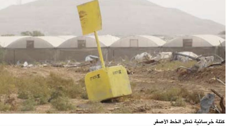
كتلة خرسانية تمثل الخط الأصفر

وقال مصدر رسمي لبناني لـ«الشرق الأوسط»، إن لبنان يسعى بقوة لدى واشنطن للحصول على وقف نار حقيقي قبل انطلاق المفاوضات، لكنه لم يكن قد حصل على إجابات بعد، ما يرجح فشل هذا المسعى. وأوضح المصدر أن لبنان غير قادر على مقاطعة المفاوضات، لعدم الوقوع في إحراج مع الجانب الأميركي الذي يلعب دوراً مساعداً للبنان، ولعدم تقديم الدراع لرئيس الوزراء الإسرائيلي بنيامين نتنياهو الذي يبدو واضحاً أنه غير راغب في هذه المفاوضات، وأشار المصدر إلى أن الوفد اللبناني سوف يدخل قاعة التفاوض لطرح موضوع وحيد هو وقف إطلاق النار، قبل الدخول في أي بحث آخر، من دون أن يجزم المصدر بإمكانية أن يعرقل هذا الأمر عملية التفاوض. وفيما أكد المصدر أن اللقاء بين الرئيس عون ونتنياهو «غير مطروح»، أوضح أن موقف الحركة يقوم على «انسحاب الاحتلال باتجاه حدود القطاع، وعودة الأوضاع إلى ما كانت عليه قبل السابع من أكتوبر».