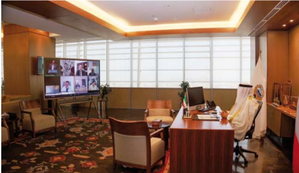
جانب من مشاركة وزير التربية في المؤتمر

الوزارة تواصل جهودها في تطوير منظومتها التعليمية وتعزيز مسارات التحول الرقمي والابتكار انسجاماً مع رؤية «الكويت 2035»