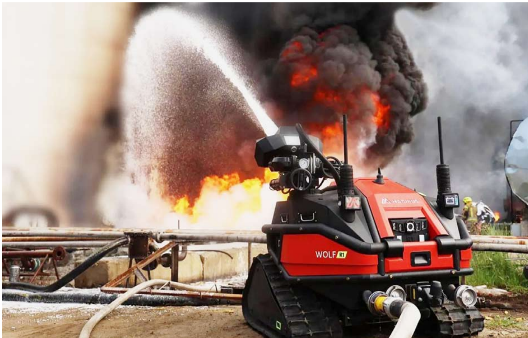
إطفاء حريق اندلع جراء هجوم روسي

أعلن الجيش الأوكراني أنه استهدف محطة نطف في منطقة كراسنودار بجنوب روسيا ومحطة أخرى لمعالجة الغاز في أستراليا. وذكر روبرت برودي القائد بالجيش الأوكراني أن الهجمات أدت إلى اندلاع حرائق في مستودعات، وفق «رويترز».