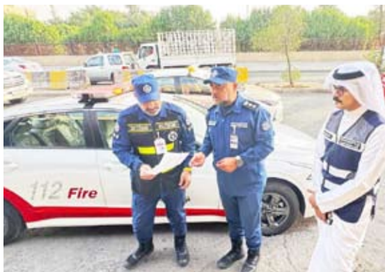
قوة الإطفاء والتجارة

نفذت قوة الإطفاء العام مساء أمس الأول بالتعاون مع وزارة التجارة والصناعة حملة تفتيشية في منطقة الشويخ الصناعية، حيث تهدف الحملة إلى رصد المباني المخالفة لاشتراطات السلامة والوقاية من الحريق.