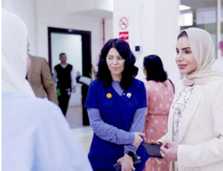
الهيئة تفقد هيئة الإعاقة