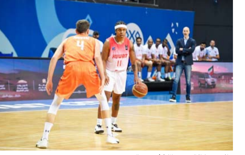
جانب من مباراة الكويت وكاظمة في دوري الدمج

قرر الاتحاد الكويتي لكرة السلة استكمال المباريات المتبقية من منافسات بطولة الدوري العام (فرق الدرجة الأولى - رجال) موسم (2025 - 2026). وجاء ذلك في بيان صادر عن (اتحاد السلة) وفي أعقاب قرار اللجنة المشتركة المعنية بدراسة عودة استئناف النشاط الرياضي (توقف في 28 فبراير الماضي جراء الظروف الاستثنائية بالبلاد والمنطقة واستؤنف في 6 مايو الجاري). وبحسب البيان قررت لجنة المسابقات في (اتحاد السلة) أن تستكمل الفرق الأربعة الأولى المتصدرة لبطولة الدوري (الكويت - القادسية - القرين - كاظمة) المنافسات بدءاً من الدور قبل النهائي.