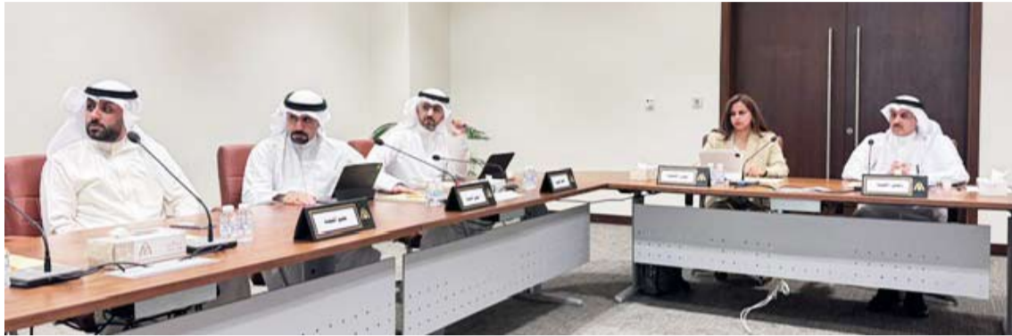
جانب من اجتماع لجنة الجهراء