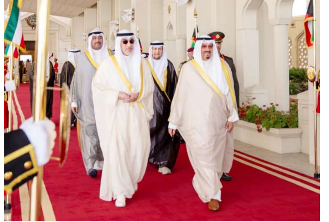
سمو رئيس مجلس الوزراء مغادراً إلى اليونان

نهج دولة الكويت ثابت وقائم على دعم الحوار والدبلوماسية وتعزيز الأمن والاستقرار والتعاون الدولي بما يسهم في ترسيخ السلام والتنمية في المنطقة والعالم.