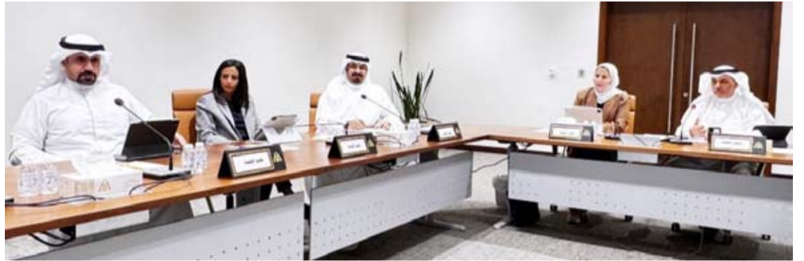
جانب من اجتماع لجنة العاصمة