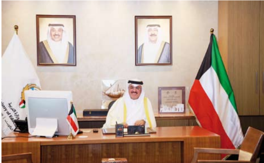
وزير التربية خلال حديثه في المؤتمر العام لمنظمة «إيسيسكو»

أكد وزير التربية سيد جلال الطبطبائي، إيمان دولة الكويت بأن بناء الإنسان يمثل الركيزة الأساسية لتحقيق التنمية المستدامة وصناعة مستقبل أكثر استقراراً وازدهاراً، وأن التعليم والثقافة والعلوم تمثل أدوات رئيسية لتعزيز الوعي وترسيخ الاعتدال وبناء مجتمعات قادرة على مواكبة التحولات العالمية.