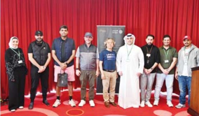
فريق البنك التجاري مع الفائزين

هذا، ويحرص البنك التجاري دائماً على توفير أفضل الخدمات والمنتجات المصرفية والخصومات مع شركائه الاستراتيجيين، بما يحقق الاستفادة لعملائه على مدار العام، حيث يمكن للعملاء الاطلاع على جميع المزايا التي يوفرها البنك من خلال صفحة البنك على الإنترنت ومن خلال تطبيق التجاري على الهواتف الذكية CBK Mobile App، والتواصل عبر خدمة الواتساب على رقم 888225-1 أو زيارة أقرب فرع للتجاري، وسيكون موظفو البنك في خدمةكم وعلى استعداد تام للرد على كافة استفساراتكم.