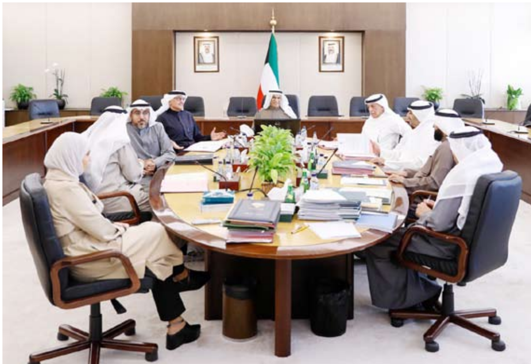
تقرير اللجنة التشريعية حول إعادة تحديد الدوائر الانتخابية أدرج على جدول أعمال الجلسة المقبلة

وتنفجر أسارير الجميع حينما يعلمون أن حالة سموه مستقرة والله الحمد، متضرعين إلى المولى تعالى أن يمن على سموه حفظه الله بالشفاء والعافية وأن يشملهم سبحانه وتعالى بعظيم لطفه وكرم عنايته ، مبتهلين إلى الباري جلّت قدرته أن يرفع الضرر عن سموه وأن يسبغ عليه وأفر الصحة وتنام العافية وأن يحفظه من كل مكروه .. اللهم آمين.