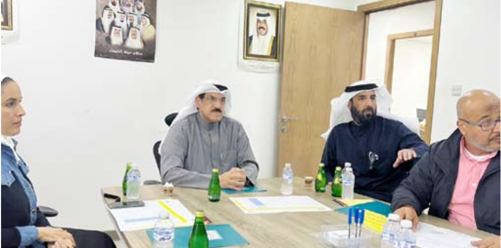
وزير «الأشغال» يستمع إلى شرح عن المشروع