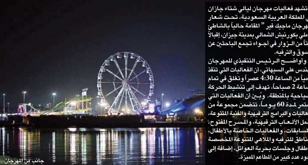
جانب من المهرجان

تشهد فعاليات مهرجان ليالي شتاء جازان في المملكة العربية السعودية، تحت شعار ”مهرجان ماجيك فير “ المقامة حالياً بالشاطئ الرملي بكورنيش الشمالي بمدينة جيزان، إقبالاً لافتاً من الزوار في أجواء تجمع الباحثين عن التسوق والترفيه.