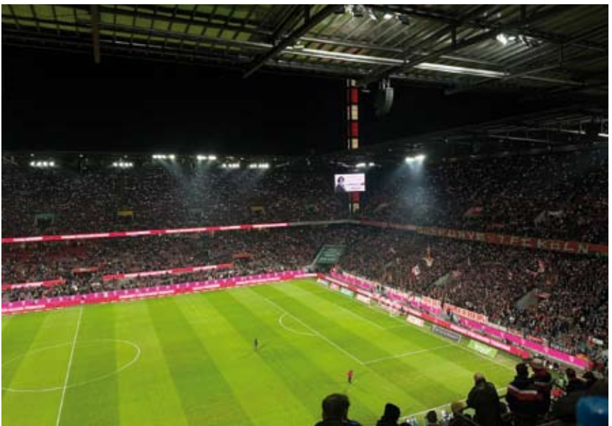
ملعب نادي كولن