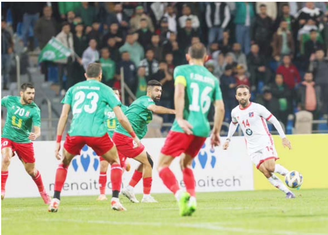
الكويت والعربي لتجاوز الإخفاق الآسيوي