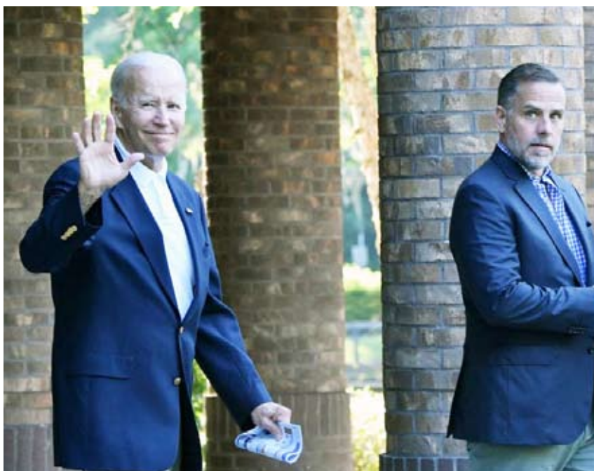
تحقيق رسمي مع بايدن بسبب أنشطة نجلة هانتر التجارية