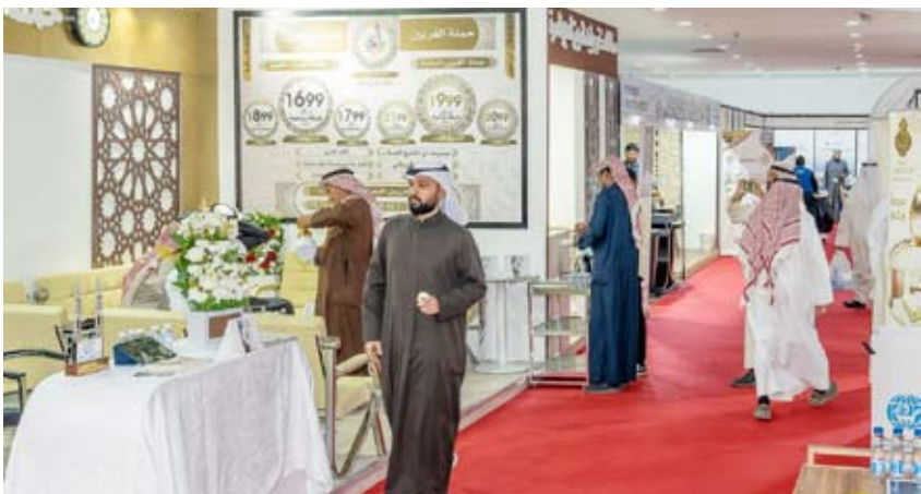
مشاركة الحملات والشركات المختصة بالحج بمعرض الحج والعمرة

وأكد العليم أنه تم قبول الحجاج وإرسال الرسائل النصية لقبولهم والتنويه لهم بمعرض الحج والعمرة حتى يتسنى لهم اختيار الحملات المناسبة لهم من خلال المعرض والتعرف على المزيد من المعلومات.