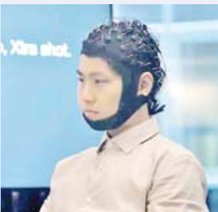
تطوير خوذة لقراءة الأفكار

وابتكر فريق من جامعة التكنولوجيا في سيدني هذه التقنية الثورية، وقال إنها يمكن أن تحدث ثورة في رعاية المرضى الذين أصبحوا صامتين بسبب السكتة