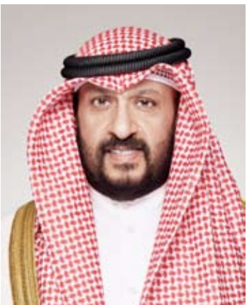
الشيخ طلال الخالد