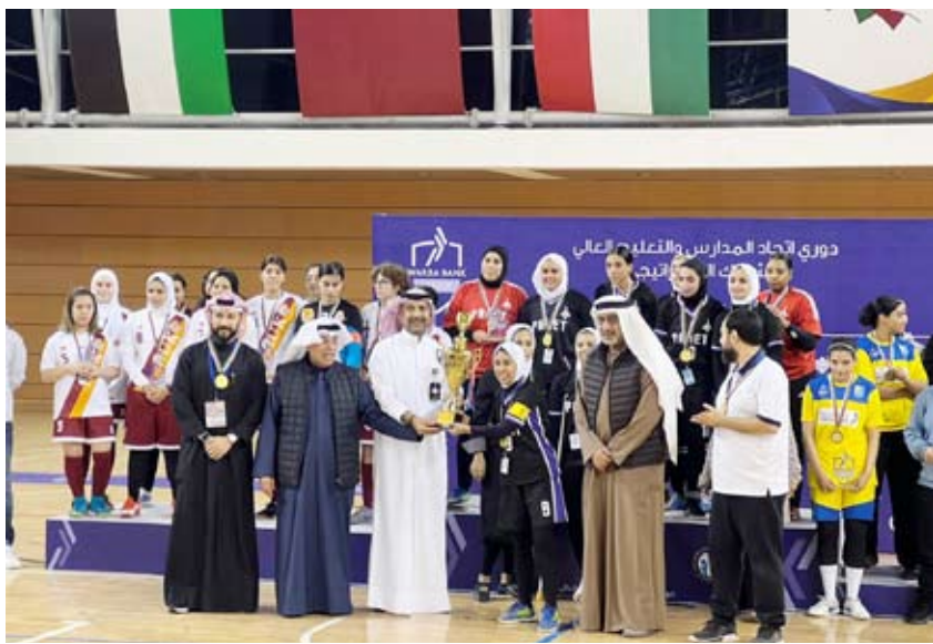
تتويج فريق (التطبيقي) بلقب مسابقة قدم الصالات للطلابات

ثلاث مسابقات في لعبة كرة القدم وهي اضافة لهذه المسابقة مسابقتان كرة القدم العشبية وكرة القدم للصالات