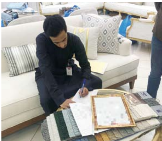
تحرير مخالفة في منطقة الضجيج