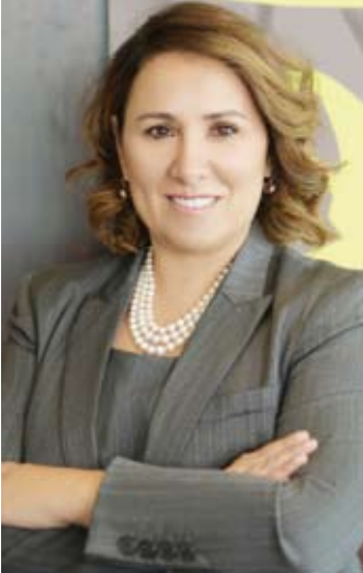
الشيخة اادانا الناصر

أعلنت شركة مشاريع الكويت (القابضة) عن استكمالها صفقة بيع حصة مُلكيتها في مجموعة الخليج للتأمين والتي تبلغ نسبتها 46.32 بالمئة لصالح إحدى شركات فيرفاكس فاينانشال هولدنجز، وذلك بعد نجاح المشتري في الحصول على كافة الموافقات الرقابية اللازمة. وبلغ إجمالي قيمة الصفقة 256.5 مليون دينار كويتي (832 مليون دولار أمريكي) بينما بلغت قيمة صافي الربح الذي حققته شركة المشاريع 73 مليون دينار كويتي (237 مليون دولار أمريكي). وكان قد تم تحديد سعر الشراء عند 2 دينار كويتي للسهم الواحد على أن يتم خصم 54 فلساً من هذا المبلغ وهي قيمة التوزيعات النقدية التي عملت مجموعة الخليج للتأمين على توزيعها عن عام 2022. ووصل معدل العائد الداخلي لشركة المشاريع خلال فترة الاستثمار إلى رقم مزدوج.