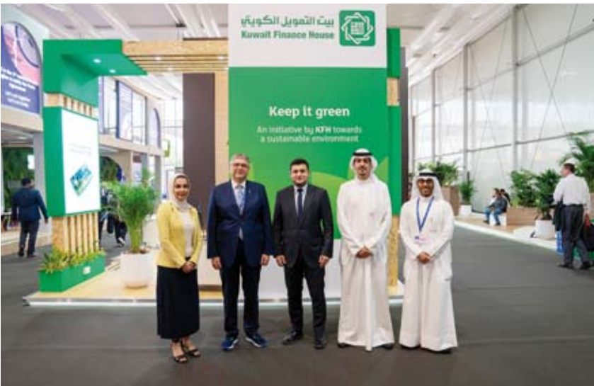
السعد والريخس مع ممثلين من برنامج الأمم المتحدة

اختتم بيت التمويل الكويتي «بيتك»، مشاركته الفاعلة في مؤتمر الأطراف للمناخ COP28 للأمم المتحدة التي استضافتها دبي في الفترة من 30 نوفمبر وحتى 12 ديسمبر. وجاءت مشاركة «بيتك» ضمن إطار التزامه بدعم المبادرات الخاصة بالاستدامة ومواجهة تداعيات التغير المناخي وتعزيز دور التمويل الأخضر.