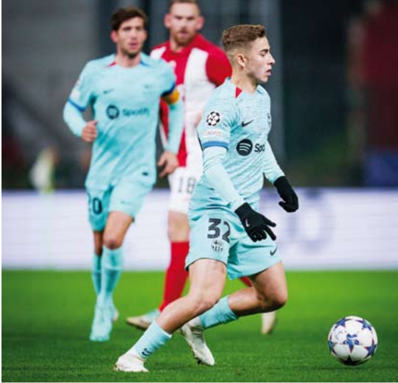
برشلونه وقع في فخ الهزيمة

التعادل. لكن مباشرة من ركلة البداية، نجح أنتويرب في حسم المباراة لصالحه بهدف سجله الشاب جورج إيلينيخينا. وبهذا يحقق أنتويرب أول انتصار بعد خمس هزائم في دور المجموعات في أول ظهور له في دوري أبطال أوروبا، لكنه ما يتذيل المجموعة وكان النادي الإسباني، الذي أراح لاعبيه الأساسيين، قد ضمن بالفعل إنهاء الدور الأول ضمن أول مركزين، لكن فوز بورتو 3-0 على شاختار دونيتسك في المباراة الأخرى بالمجموعة أكد صدارة برشلونة للمجموعة الهزيمة.