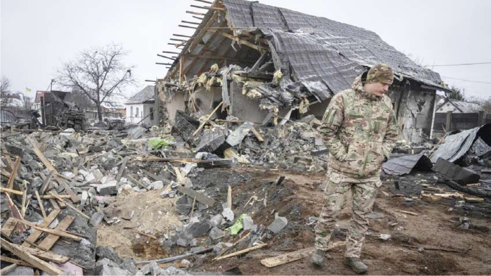
الحرب الروسية الأوكرانية مستمرة منذ 22 شهراً

منذ الخريف، ضاعفت روسيا هجماتها الجوية والبرية، على أمل تحقيق مكاسب على الأرض بعد فشل القوات الأوكرانية في هجومها المضاد الكبير في الصيف، والذي أدى إلى استنفاد جزء من احتياطياتها البشرية واحتياطات الذخيرة. وتريد موسكو أيضاً أن تضرب بقوة في وقت يبدو فيه أن قدرة الغربيين على دعم أوكرانيا تضعف، بعد عامين على اندلاع الحرب. وأعلن الرئيس الأوكراني فولوديمير زيلينسكي عن تعزيز الدفاعات الجوية لبلاده، بعد هجوم صاروخي روسي قوي على كييف.