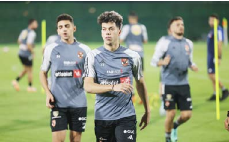
الأهلي المصري جاهز للاتحاد السعودي

أكد السويسري مارسيل كولر، المدير الفني للفريق الأول لكرة القدم بالنادي الأهلي المصري، أن فريقه بات جاهزاً لمواجهة اتحاد جدة السعودي في بطولة كأس العالم للأندية، القامة حالياً في السعودية. وقال كولر إنه سعيد بالمشاركة في البطولة مجدداً مع النادي الأهلي. وأضاف: النسخة الماضية من البطولة قدمنا مستوى جيداً، لكن هذه المرة هدفنا إظهار أداء أفضل، وأن تكون خطوط الفريق متقاربة مع تسجيل المزيد من الأهداف، لتحقيق نتائج طيبة.