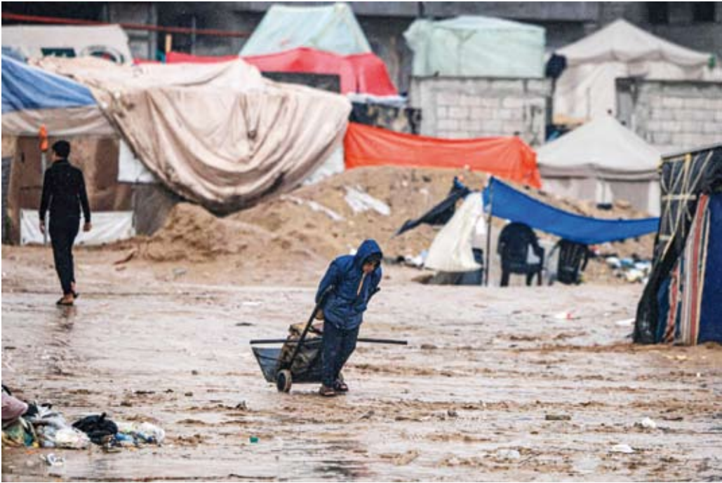
آلاف النازحين يعانون أوضاعاً صعبة

وأضاف أنه علم بوجود 15 إلى 30 حالة إصابة بالتهاب «الكبد الوبائي إيه» في خان يونس خلال الأسبوعين الماضيين، وأوضح أن «فترة حضانة الفيروس تتراوح من ثلاثة أسابيع إلى شهر، لذلك بعد شهر ستكون هناك قفزة في عدد حالات التهاب الكبد الوبائي إيه».