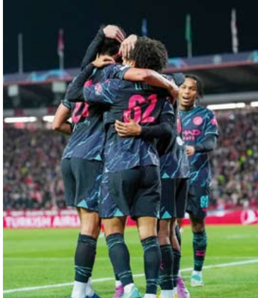
احتفال شباب السيتي

سجل ميكا هاميلتون خريج أكاديمية مانشستر سيتي هدفا في مباراته الأولى مع الفريق الأول ليتجنب حامل اللقب لخسارة في 20 مباراة متتالية في دوري أبطال أوروبا لكرة القدم بالفوز 3-2 على مضيفه رد ستار بلجراد في ختام دوري المجموعات. وسجل أوسكار بوب هدفة الأول مع الفريق وأضاف كالفن فيليبس هدفا من ركلة جزاء لسيتي الذي أنهى دور المجموعات برصيد 18 نقطة من ست انتصارات محققا العلامة الكاملة لأول مرة في تاريخ النادي. وأحرز هوانج إن-بيوم والكسندر كاتاي هدفين متاخرين في الشوط الثاني لرد ستار الذي أنهى المجموعة وله نقطة واحدة.