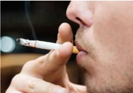
التدخين قد يتسبب بالخرف

توصلت دراسة أجراها باحثون في كلية الطب بجامعة واشنطن في سانت لويس أن التدخين من المحتمل أن يؤدي إلى انكماش حجم الدماغ. وتقول النتائج إن الإقلاع عن التدخين يمكن أن يمنع المزيد من فقدان أنسجة المخ، ولكن التوقف عن التدخين لا يعيد الدماغ إلى حجمه الأصلي.