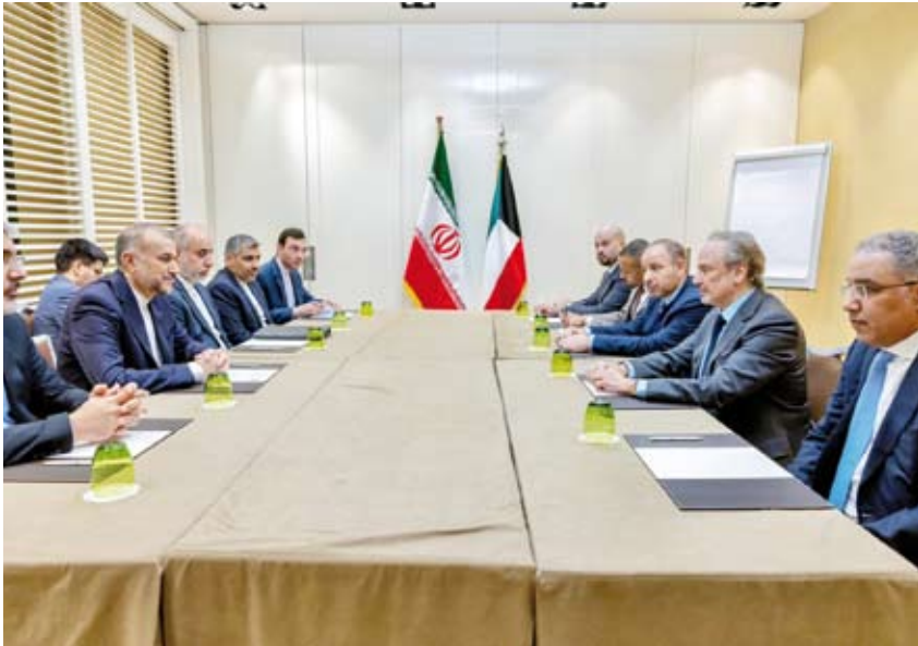
وزير الخارجية ونظيره الإيراني يبحثان بجنتيف الأوضاع في غزة