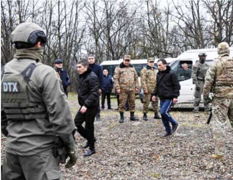
إطلاق سراح جنود أرمينيين

باشينيان، على شبكات التواصل الاجتماعي إن «31 جندياً أرمينياً تم أسرهم بين عامي 2020 و2023، وجندياً واحداً تم أسره في سبتمبر في ناغورنو كاراباخ، عبروا الحدود الأرمينية –الأذربيجانية، وهم في أرمينيا». بدورها، أكدت «اللجنة الأذربيجانية لأسرى الحرب» أن «عملية التبادل جرت في منطقة غاراخ على الحدود الأذربيجانية –الأرمينية»، وأن الجنود الأرمينيين خضعوا لفحص من قبل الصليب الأحمر. ونشر موقع «إنو.إيه زد (INEWS.AZ)» الإخباري في أذربيجان مقطع فيديو يظهر رجلين يرافقهما عناصر أمن مقنعون، واستجوبهما صحافيون بعدما أطلق سراحهما.