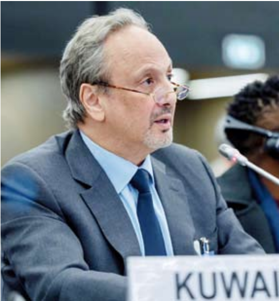
وزير الخارجية متحدثاً في المنتدى