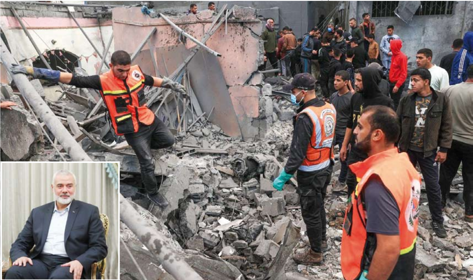
البحث عن شهداء أو ناجين وفي الكادر إسماعيل هنية رئيس المكتب السياسي لحركة «حماس»

قال إسماعيل هنية رئيس المكتب السياسي لحركة «حماس»، إن الحركة منفتحة على مناقشة أي مبادرات تقضي لوقف الحرب على قطاع غزة، وفق وكالة «أنباء العالم العربي». وأضاف هنية في كلمة متلفزة: «منفتحون على نقاش أي أفكار أو مبادرات تقضي لوقف العدوان، ونفتتح الباب على ترتيب البيت الفلسطيني على مستوى الضفة وقطاع غزة». وحذر زعيم «حماس» من أن «أي رهان على ترتيبات في غزة أو في القضية الفلسطينية