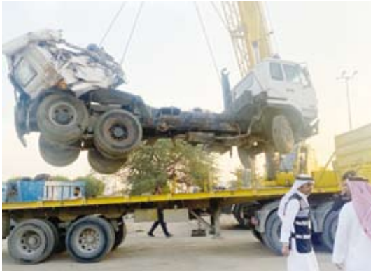
رفع لآليات ثقيلة مهمة