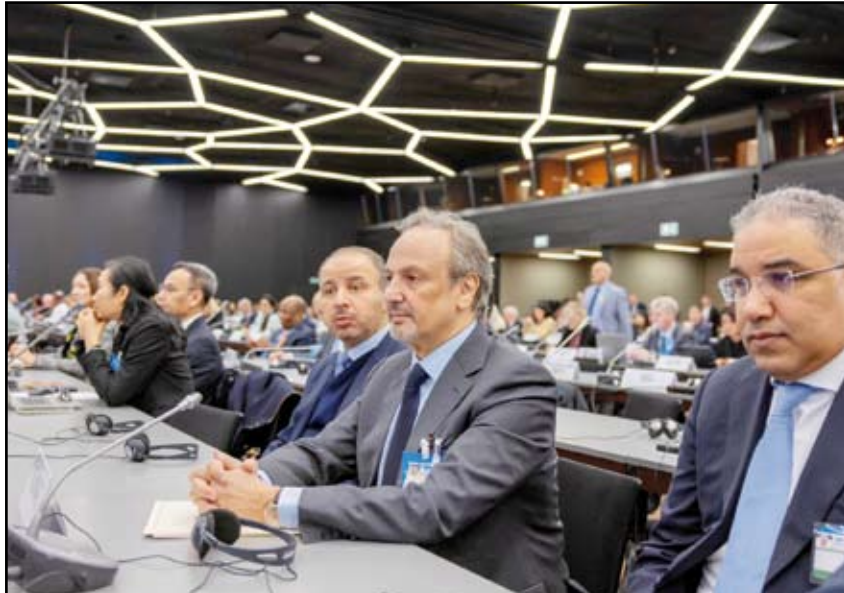
الشيخ سالم الصباح يتراس وفد الكويت