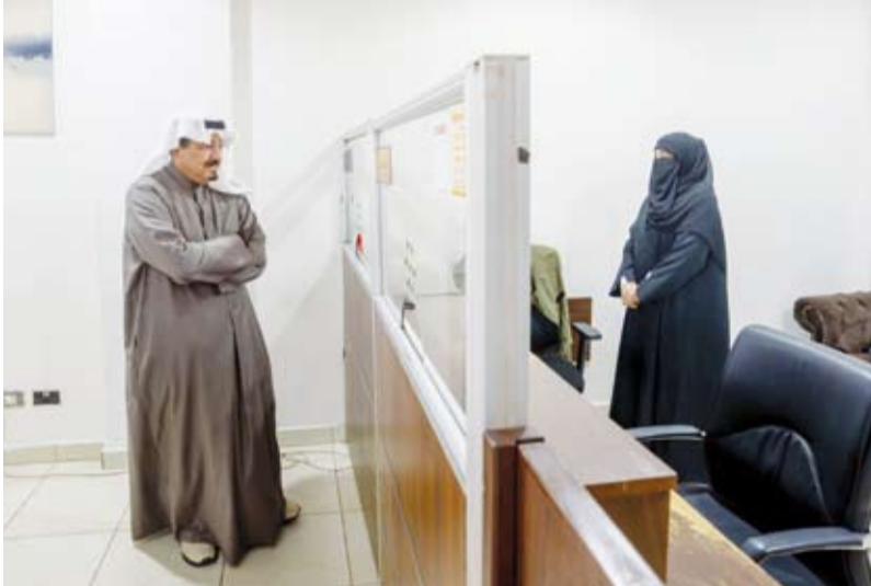
.. وسموه يستمع إلى شرح حول الإجراءات المتبعة