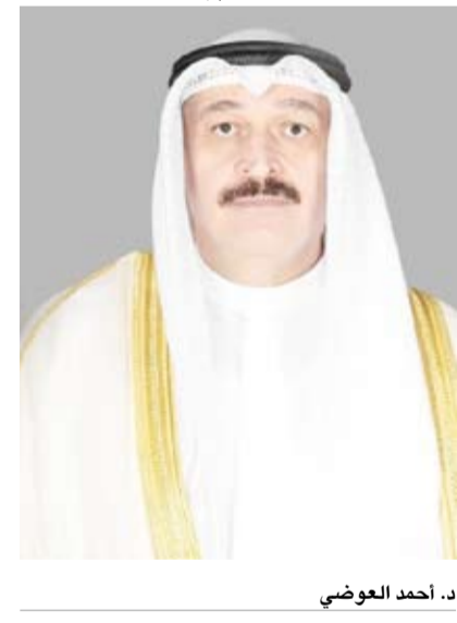
د. أحمد العوضي

أكد وزير الصحة الدكتور أحمد العوضي، أول أمس، جاهزية المنظومة الصحية في البلاد لاسيما في ظل الظروف الراهنة.