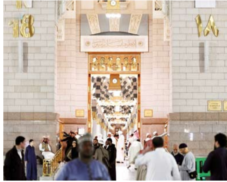
باب عمر بن الخطاب