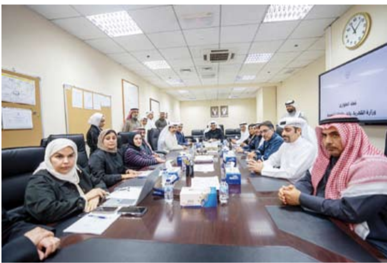
.. وسموه خلال اجتماعه مع وزير الكهرباء ومسؤولي الوزارة

وأشاد سمو رئيس مجلس الوزراء، بجهود العاملين بوزارة الكهرباء والماء والطاقة المتجددة وتقاني كادها في العمل خلال الظروف الراهنة لضمان استقرار الشبكة وتأمين احتياجات البلاد، مؤكداً دعم الحكومة الكامل لكافة التدابير المتخذة للحفاظ على استدامة الخدمات الحيوية.