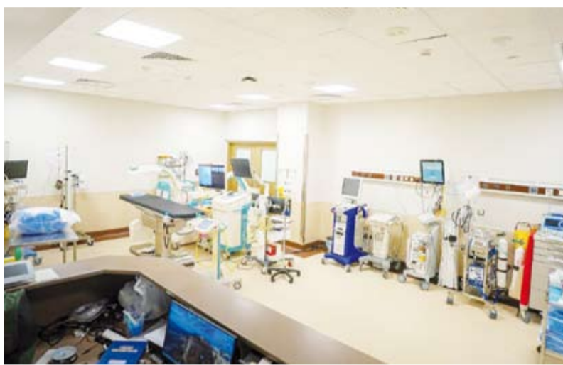
أجهزة إنقاذ الحياة والمستلزمات الطبية