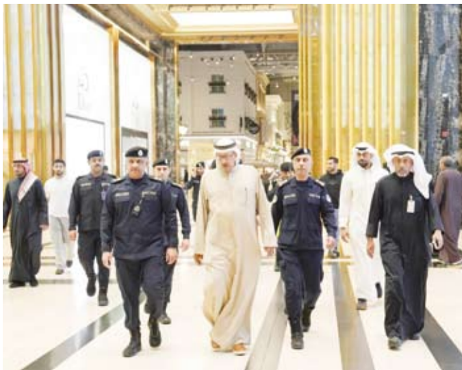
اللواء عبدالوهاب الوهيب خلال جولته التفقدية

قام وكيل وزارة الداخلية اللواء عبدالوهاب الوهيب، بجولة تفقدية شملت عدداً من المجمعات التجارية بهدف التأكد من الاستعدادات الأمنية ومتابعة آلية الانتشار الأمني للرجال داخل المجمعات وتواجد الدوريات خارجها.