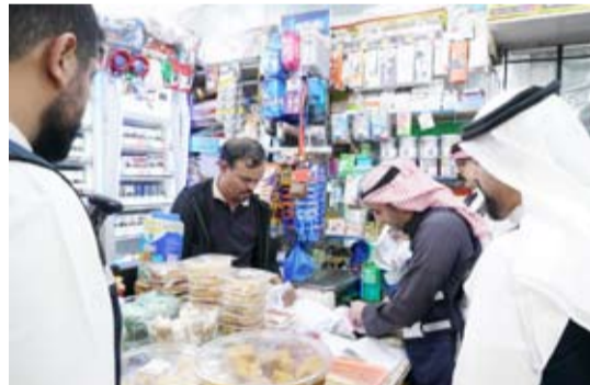
تفتيش على قوائم أسعار المعروضات بأحد المحال

محاضر الضبط شملت أيضاً مخالفات تتعلق بالبيع والشفاافية، ومن أبرزها: عدم إصدار فواتير قانونية للمستهلكين، التلاعب في العروض الترويجية غير المرخصة، عدم تحديد بلد المنشأ للسلع، مما يعد تضليلاً للمشتري، رصد منشآت تمارس أنشطة تجارية تختلف عما هو مدون في التراخيص الرسمية الممنوحة لها. وأكدت «التجارة» أنها باشرت اتخاذ كافة الإجراءات القانونية اللازمة بحق المنشآت المخالفة، مع توجيه إشعارات قانونية فورية للكيانات التي سجلت اختلافاً في طبيعة النشاط. وشددت الوزارة على أن فرق التفتيش تعمل على مدار الساعة لضمان انضباط الأسواق ومتابعة التزام كافة المحال بالقرارات المنظمة.