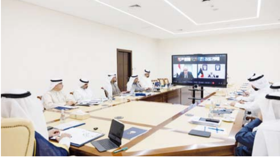
جانب من اجتماع المجلس الوزاري بين مجلس التعاون ومصر

متقدماً للشراكة الاستراتيجية القائمة على التاريخ المشترك ووحدة المصير وتكامل المصالح.