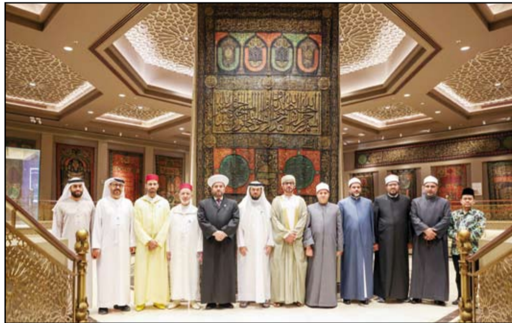
مجموعة من العلماء المشاركين في برنامج احياء ليالي رمضان

القرآني، مقدمين شكرهم لصاحب السمو حاكم الشارقة على اهتمامه بهذا الصرح الفريد.