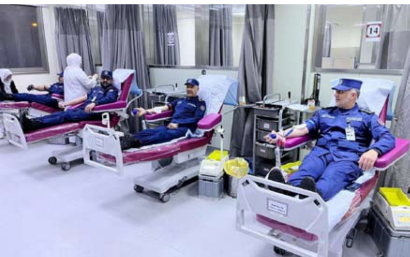
جانب من عملية التبرع بالدم

السريعة عليها للتقليل من نسبة الخسائر بالأرواح والممتلكات والحد من انتشار الحريق. وبين الغريب أنه في حال حدوث حريق يرجى عدم استخدام المصاعد واستخدام السلم وفي حال تعطل التيار الكهربائي ووجود أشخاص داخل المصعد الاتصال على هاتف الطوارئ وضبط النفس وعدم الارتباك وعدم محاولة فتح الأبواب أو الخروج لتفادي الخطر والجلوس والتنفس بهدوء وانتظار وصول فرق الإطفاء وضغط زر الإنذار لطلب المساعدة. ودعا الجميع إلى الاستمرار في الالتزام بالتعليمات الصادرة عن الجهات المختصة والتحلي بالهدوء والخفة، مؤكداً أن الجهات الحكومية تعمل بكامل أجهزتها على مدار الساعة بالتنسيق كامل وبكفاءة تامة واستعداد. كما دعت قوة الإطفاء العام، المواطنين والمقيمين لضرورة