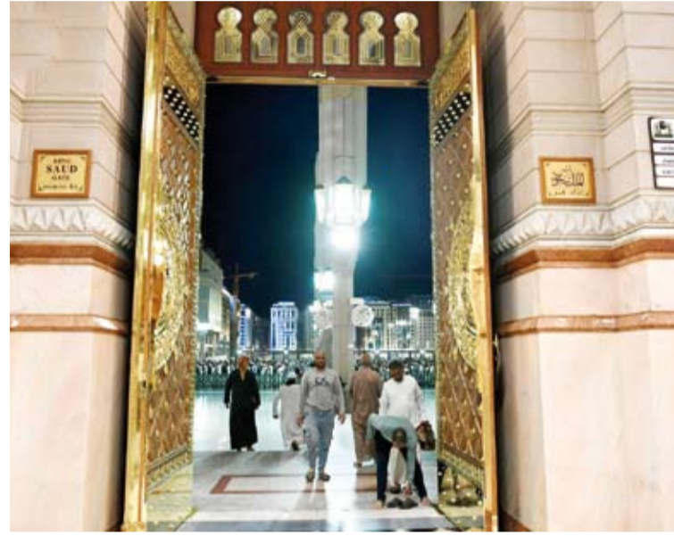
باب الملك سعود