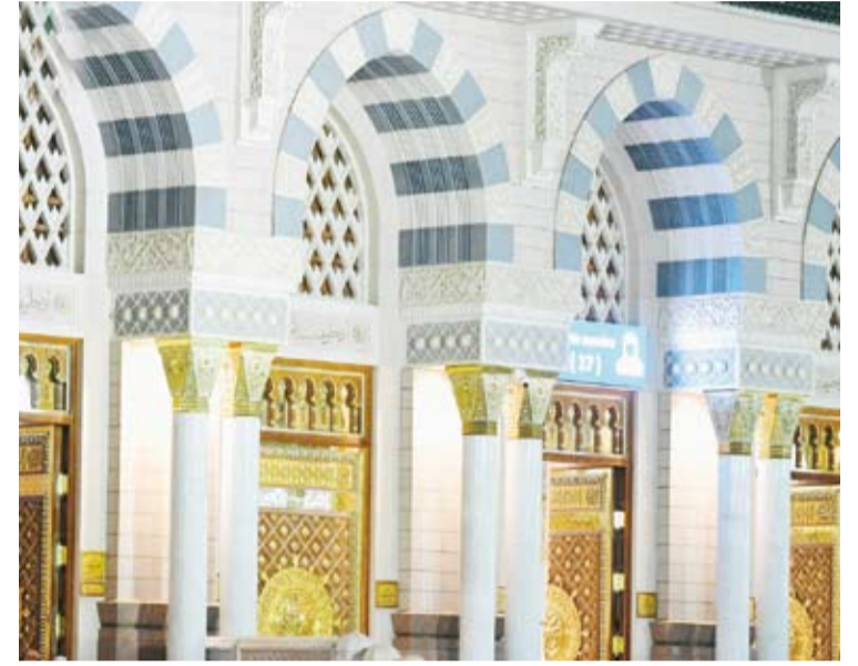
أبواب المسجد النبوي

وصقلها وطلائها بالذهب، وتثبيتها بطريقة التشبيك التقليدية دون استخدام المسامير. وتبقى أبواب المسجد النبوي الشريف شاهداً على تكامل الجمال الفني مع الدقة الهندسية، ورمزاً لعناية المملكة بالمسجد النبوي، وحرصها على تقديم صورة مشرقة تجمع بين أصالة العمارة الإسلامية وتطور التقنيات الحديثة.