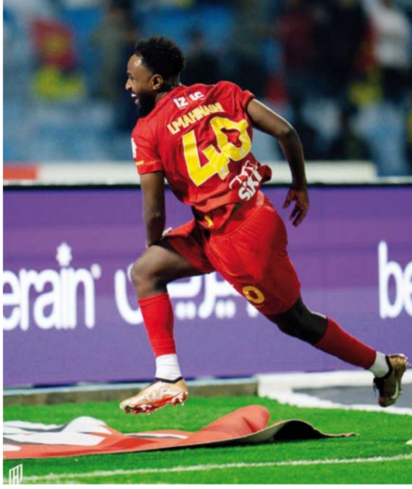
هزيمة مفاجئة للأهلي السعودي أمام القادسية