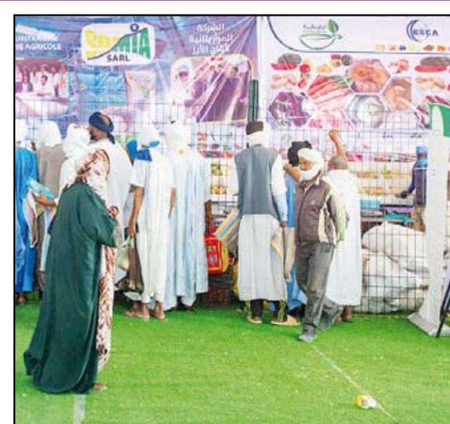
جانب من معارض رمضان في «نواكشوط»

في المقابل، أبدى بعض الزوار ملاحظات بشأن جودة اللحوم المعروضة، مطالبين بتحسينها لتكون في مستوى باقي المنتجات المتوفرة في المعرض.