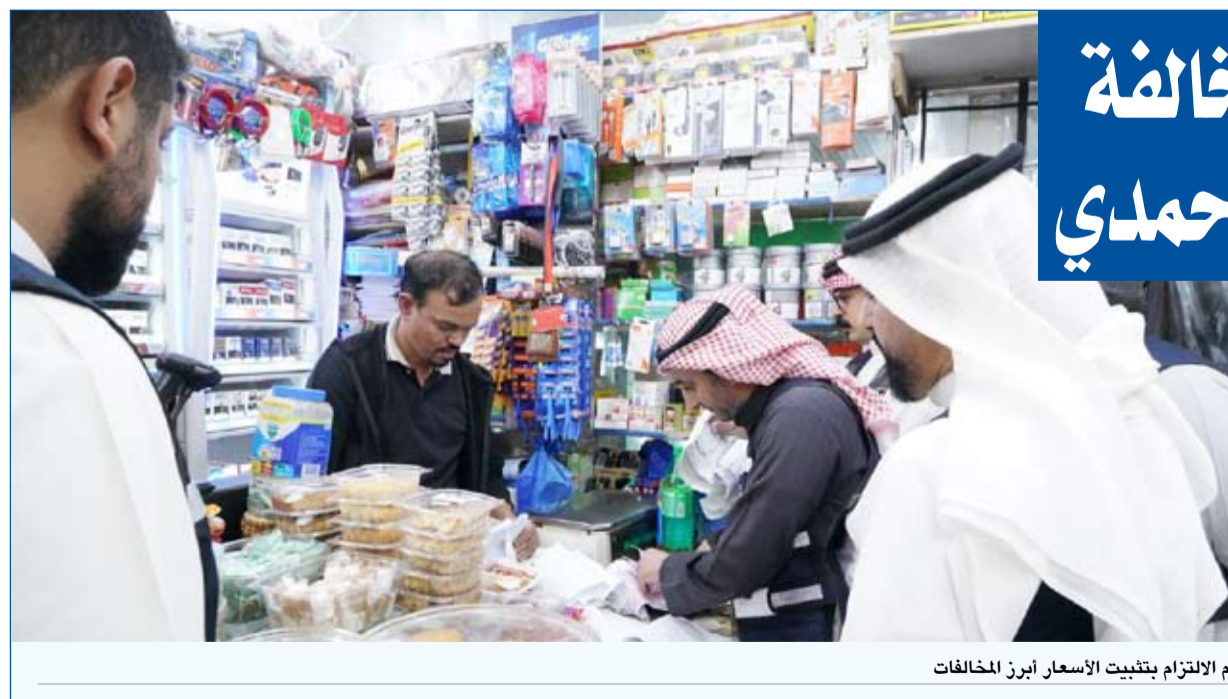
عدم الالتزام بتثبيت الأسعار أبرز المخالفات