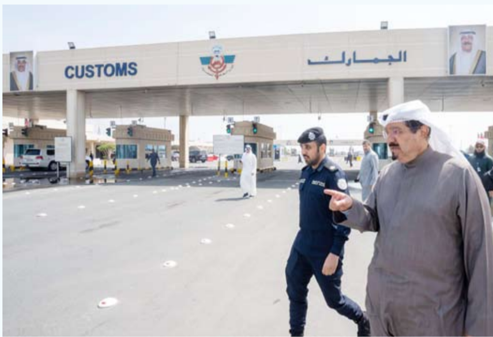
جانب من زيارة سمو الشيخ أحمد العبدالله إلى منفذ النويصيب

قام سمو الشيخ أحمد العبدالله رئيس مجلس الوزراء بزيارة تفقدية أمس إلى منفذ النويصيب الحدودي. واستمع سموه خلال الزيارة إلى شرح من المسؤولين حول الإجراءات المتبعة لتنظيم حركة الدخول والخروج والخطط التشغيلية المعتمدة ومستوى الاستعدادات للتعامل مع مختلف الحالات والمستجدات إضافة إلى آليات التنسيق بين مختلف الجهات المعنية بما يضمن انسيابية الحركة وتعزيز كفاءة التنقل عبر المنفذ. كما قام سموه بزيارة تفقدية إلى إدارة الطوارئ الطبية التابعة لوزارة الصحة برفقة وزير الصحة الدكتور أحمد العوضي. واطلع سموه في مركز العمليات التابع للإدارة على جاهزية الفرق الطبية ومستوى الاستعداد لتقديم خدمات الإسعاف والطوارئ.