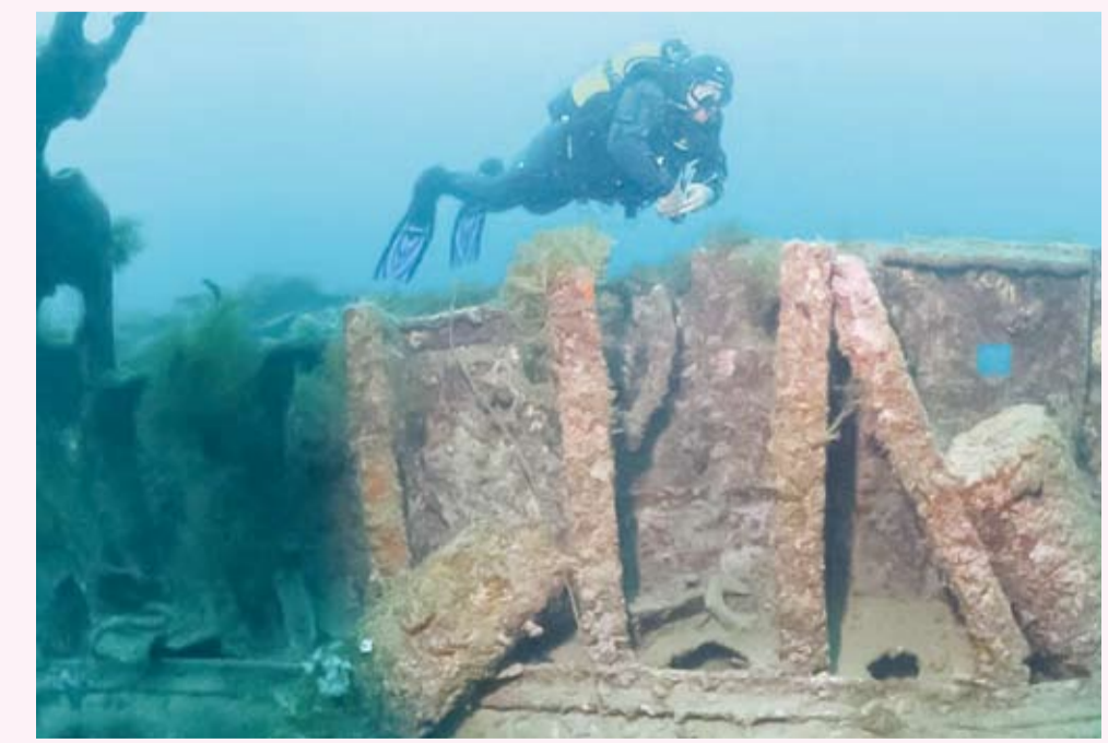
اكتشاف مقبرة لسفن شرق ليبيا

على امتداد أكثر من 100 متر في قاع البحر، تقع السفن الغارقة قبالة سواحل مدينة ظلمية - المعروفة تاريخياً باسم بطيموس شرقي مدينة المرج الليبية- لتكتشف بعثة أثرية بولندية تلك السفن لمعرفة جانب من تاريخ الملاحة والتجارة في البحر المتوسط. ويضم الموقع وفق بيان للبعثة البولندية شظايا هيكل سفن وبقايا شحنات وجراراً فخارية ومراسي حجرية، ما يرجح أن المنطقة كانت في فترات سابقة ميناءً نشطاً ومركزاً تجارياً مهماً في إقليم قورينا. وأوضح الباحثون أن الاكتشاف جاء بعد استئذان الفريق البولندي أعماله الأثرية عام 2023 عقب توقف دام نحو 12 عاماً، حيث أظهرت عمليات المسح البحري أجزاء من البنية التحتية للميناء القديم التي غمرتها المياه تدريجياً مع ارتفاع مستوى البحر عبر القرون، إلى جانب أعمدة وطرق مغمورة ومراسي وأدوات بحرية، فضلاً عن قطعة برونزية من ميزان روماني. وأُسفرت أعمال التنقيب على اليابسة عن العثور على طريق مخصص للعربات لم يكن معروفاً من قبل، وبقايا أبراج مرآقية يعتقد أنها كانت جزءاً من النظام الدفاعي للمدينة، إضافة إلى حجر طريق روماني يعود إلى القرن الثالث الميلادي. ويواصل فريق الترميم توثيق وترميم اللوحات الجدارية البيزنطية المكتشفة سابقاً في ظلمية، فيما تستعد البعثة البولندية للاحتفال بمرور 25 عاماً على عملها الأثري في ليبيا، مؤكداً أن المدينة لا تزال تخفي العديد من الشواهد التاريخية فوق الأرض وتحت الماء.