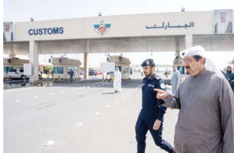
سمو الشيخ أحمد العبدالله يتفقد منفذ النويصيب الحدودي

الطوارئ بكفاءة عالية والحفاظ على سلامة المواطنين والمقيمين في البلاد.