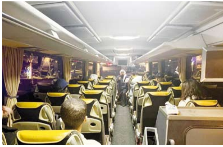
نقل مجموعة من المواطنين الكويتيين عبر حفلات نقل برية إلى الكويت