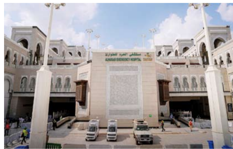
مستشفى الحرم للطوارئ