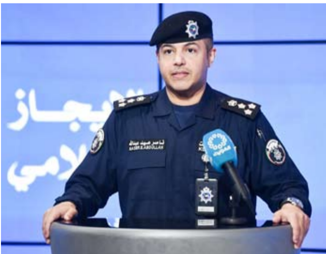
المحدث باسم وزارة الداخلية العميد ناصر بوسليب