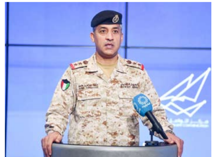
المحدث الرسمي باسم وزارة الدفاع العميد الركن سعود العطوان

يسهم في الحفاظ على أمن واستقرار البلاد، من جهته، أكد المتحدث باسم وزارة الداخلية العميد ناصر بوسليب (لكونا) أهمية استقاء المعلومات من وسائل الإعلام الرسمية، مؤكدة أن الإشاعات أو تداول الأخبار غير الدقيقة والمسؤولية في تداول المعلومات تقع على عاتق وسائل الإعلام الرسمية، داعياً المواطنين والمقيمين إلى عدم التصديق على الإشاعات أو تداولها، مؤكدة أن الجهات المختصة ستتحرك فوراً في حال اكتشاف أي إشاعة أو أخبار كاذبة، وستتخذ الإجراءات اللازمة لضمان سلامة المواطنين والمقيمين.