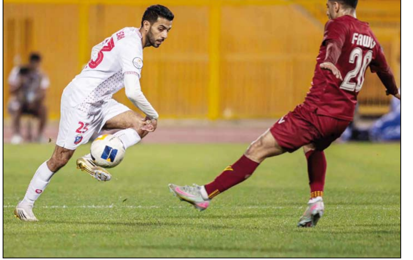
الأبيض يحافظ على صدارة دوري زين

المخافسات المحلية، على أن تبدأ الأندية تدريجياتها قبل هذا الموعد بأسبوع، وذلك وفق ما تقرره الجهات المختصة. وأكد الاتحاد الكويتي أن الموسم الكروي الحالي سيستكمل بالكامل، حيث لن يتم إلغاء أي مباريات أو بطولات تقام تحت مظلته، مشيراً إلى أنه أعد جدولاً متكاملًا بالمواعيد الجديدة للمباريات المتبقية في مختلف المسابقات.