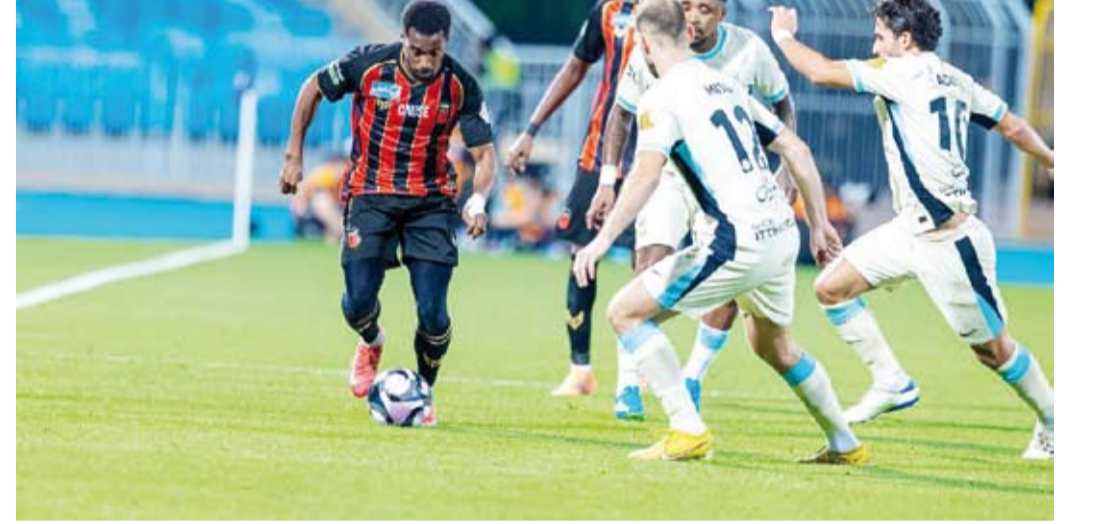
انطلاقاً قوية من لاعب الرياض وسط حصار اتحادي