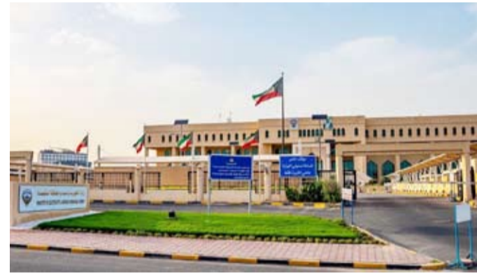
وزارة الكهرباء والماء والطاقة المتحدة