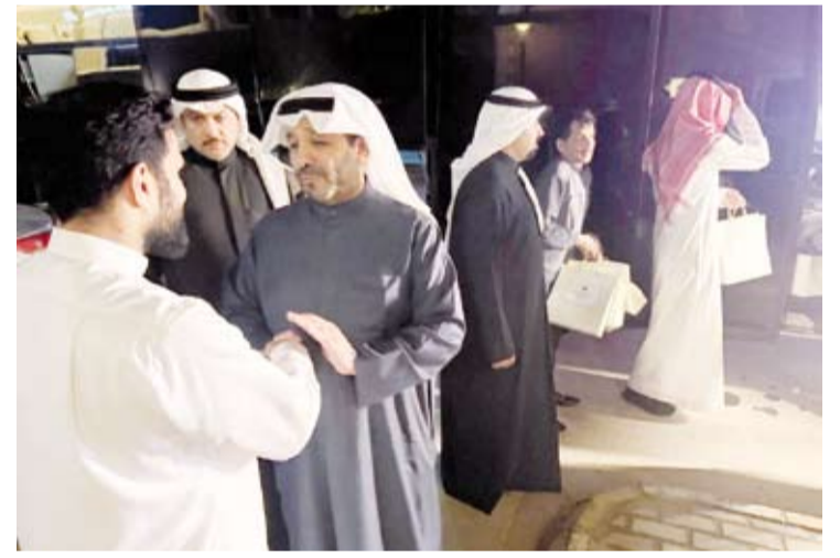
الشيخ صباح الناصر يشرف على نقل مجموعة من المواطنين

وأضاف الشيخ صباح، أن للمملكة مواقف تاريخية كبيرة وعظيمة مع دولة الكويت خالدة في ذاكرة التاريخ لا يمكن نسيانها وأن هذا الموقف قد لا يذكر أمام المواقف العظيمة المشرفة للمملكة. وسال الشيخ صباح الناصر، المولى عز وجل، أن يحفظ دولة الكويت والمملكة العربية السعودية من كل سوء وإن يديم عليهما نعمتي الأمن والأمان، متقدماً برفع أسمى آيات التبريكات إلى خادم الحرمين