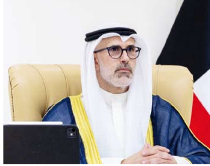
الشيخ جراح الجابر يترأس وفد الكويت المشارك في أعمال اجتماع المجلس الوزاري

جدد وزير الخارجية الشيخ جراح الجابر، إدانة دولة الكويت للعدوان الإيراني الأثم الذي استهدف دولة الكويت ودول مجلس التعاون لدول الخليج العربية والمملكة الأردنية الهاشمية منذ 28 فبراير الماضي، باعتباره انتهاكاً صارخاً لسيادة الكويت ودول (التعاون) والأردن وخرقاً فاضحاً للقانون الدولي والقانون الدولي الإنساني وميثاق الأمم المتحدة. جاء ذلك في كلمة القاها الشيخ جراح الجابر الخميس الماضي، خلال ترؤسه وفد دولة الكويت المشارك في أعمال اجتماع المجلس الوزاري المشترك الثامن بين مجلس التعاون لدول الخليج العربية والمملكة الأردنية الهاشمية الشقيقة والذي عقد عبر الاتصال المرئي.