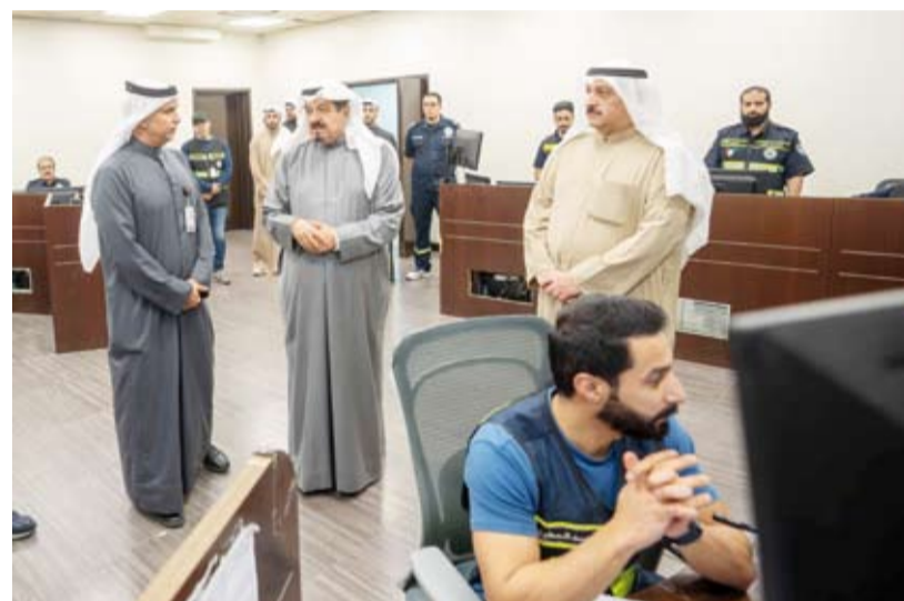
العبدالله يتفقد إدارة الطوارئ الطبية