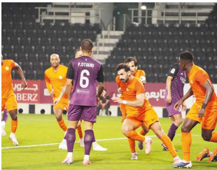
فوز كبير لأم صلال على متصدر الرتبة

قائمة هدافي الدوري ليحتل المركز الثالث متأخراً بفارق 5 أهداف عن روجر غيديس مهاجم الريان.