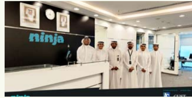
الجنابان خلال الاتفاق على الرعاية

أعلن تطبيق «نينجا» الرائد في تطبيقات التجارة الإلكترونية في دولة الكويت عن رعايته البلاطينية لنادي المحاسبة في جامعة الخليج للعلوم والتكنولوجيا (GUST)، وتأتي هذه الرعاية مواصلة لاهتمام التطبيق في مجال العلاقات العامة والفعاليات الموسمية، حيث يعتبر النادي من أنشط الأندية الطلابية الجامعية في دولة الكويت، ويحوي على أكثر من 5,500 مشارك في الندوات وورش العمل سنوياً، بالإضافة لأكثر من 3,000 طالب يشاركون بالفعاليات والأنشطة المتنوعة، كما ساهم بتنفيذ أكثر من 25 مبادرة مجتمعية بما فيها «حملة الإفطار الرمضانية» بقيادة الطلاب في دولة الكويت. ويسعى التطبيق لرفع الوعي من خلال هذه الرعاية، وتطوير المهارات وربط الطلاب بسوق العمل بما يتماشى مع الاستراتيجية المعمول بها في «نينجا».