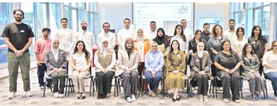
مشاركون في برنامج إنبات

الصحية، والأدب والإعلام، والعلوم الإنسانية، والهندسة وغيرها. «يواصل برنامج إنبات في عامه الثالث ترسيخ نجاحه من خلال الإقبال المتزايد على الشباب على المشاركة، وهو ما يعكس أثره الإيجابي في إعداد الجيل القادم من القادة في الكويت. وتؤكد شركة المشاريع من خلال هذا البرنامج التزامها بدعم مسيرة الشباب عبر تضم البرنامج الذي يمتد على مدى تسعة أسابيع بالتعاون مع en.v، وهي مجموعة لها خبرة في تطوير البرامج التدريبية التي تركز على مد الجسور بين أفراد المجتمع بمختلف أطيافهم لتعزيز التعاون والتواصل بينهم. وبهذه المناسبة قالت نائب رئيس أول