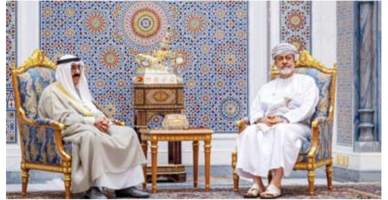
سمو أمير البلد وسلطان عُمان خلال اللقاء

اللقاءات الودية التي نحرص عليها، وتتوجها للروابط الأخوية المتينة بين بلدنا وشعبنا الشقيقين، واستكمالاً للنهج المشترك في تعزيز أواصر التعاون، وتؤكد حرصنا على تطوير الشراكة الثنائية القائمة على أسس من التفاهم والاحترام المتبادلين، والدفع بها إلى آفاق أوسع وأكثر شمولاً نحو مزيد من التكامل والترابط المنشودين في شتى المجالات والميادين، لتحقيق معها آمال وتطلعات شعبنا الشقيقين في بناء مستقبل أكثر ازدهاراً واستقراراً وبخدم مصالح بلدنا المتبادلة. وأجدد التأكيد على اعتزازنا بالعلاقات المتميزة مع الشقيقة العريضة سلطنة عمان، مغتنماً هذه الفرصة لأبعث إلى جلالتم أطيب التمنيات بصفور الصحة وتنام العافية ودوام التوفيق، راجياً لبلدكم وشعبكم الشقيق في ظل قيادتكم الحكيمة مزيداً من التقدم والرخاء.