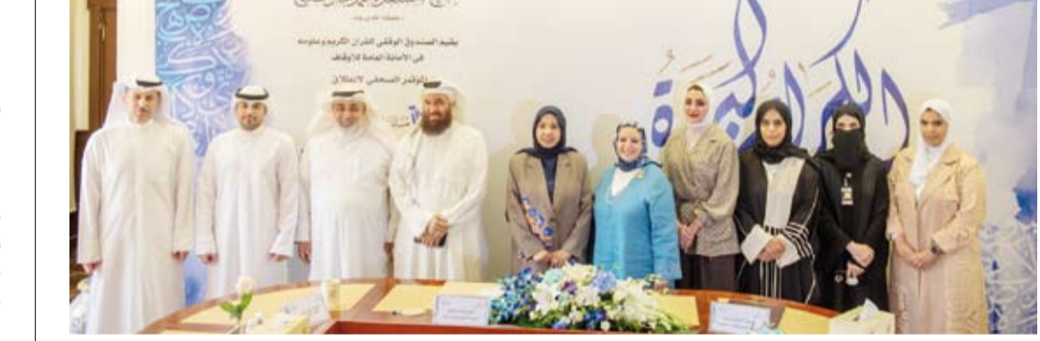
جانب من المؤتمر الصحافي للإعلان عن المسابقة

ودعت المواطنين باختلاف أعمارهم للمشاركة بهذه المسابقة التي ستعقد في بيئة روحانية تنافسية هيأتها الأمانة العامة للأوقاف.