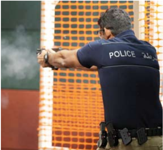
جانب من المنافسات

والشرطة وترسيخ مفهوم الرياضة كجسر تواصل يعكس وحدة الهدف والمصير المشترك لدول مجلس التعاون.