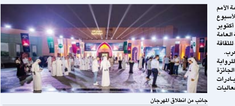
جانب من انطلاق المهرجان