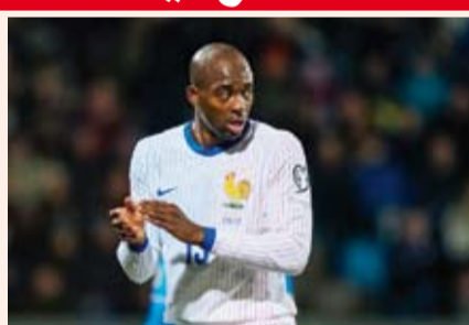
التعادل حسم مواجهة أيسلندا وفرنسا