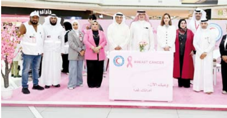
المشاركون في الحملة التوعوية

أطلقت جمعية الهلال الأحمر الكويتي امس حملة توعوية بعنوان (وعيك الآن.. أمانك غداً) ضمن فعاليات شهر التوعية بسرطان الثدي بهدف تعزيز الوعي الصحي لدى النساء وبأهمية إجراء الفحوصات الدورية المبكرة. وقال رئيس مجلس إدارة الجمعية خالد المغاسم في تصريح لوكالة الأنباء الكويتية (كونا) إن شهر أكتوبر يمثل مناسبة سنوية مهمة لتسليط الضوء على المرض من خلال التوعية وسبل الوقاية والكشف المبكر الذي يعد وسيلة فاعلة لرفع نسب الشفاء. وأضاف المغاسم أن الجمعية تحرص على دعم المبادرات الصحية والاجتماعية الهادفة لخدمة المجتمع الكويتي والتي تتسجم مع رسالتها الإنسانية وتعزز من شراكتها المجتمعية في نشر ثقافة الاهتمام بالصحة العامة. وأوضح أن الحملة التي انطلقت في مجمع (الأفنيوز) تتضمن معرضاً توعوياً بمشاركة متطوعي الجمعية ويقدم