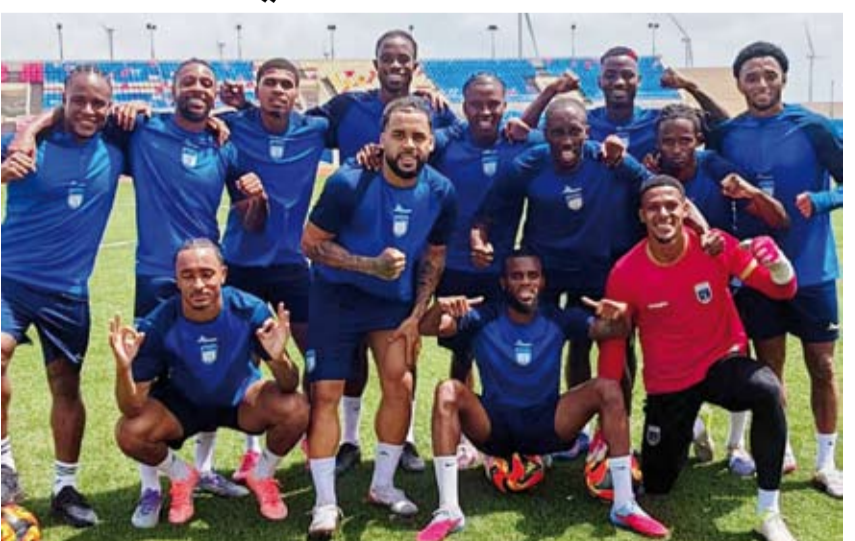
فرحة لاعبي الرأس الأخضر بالتأهل لكأس العالم