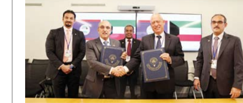
.. ويوقع اتفاقية قرض مع بلين