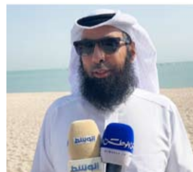
العتيبي متحدداً للإعلام