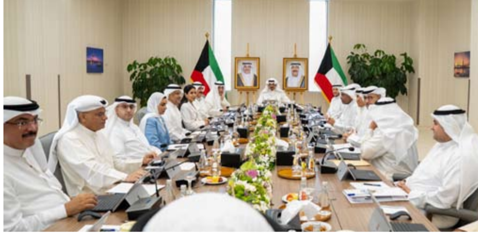
العبدالله يترأس اجتماع المجلس أمس

عقد مجلس الوزراء اجتماعه الأسبوعي صباح أمس في مشروع مركز الكويت لمكافحة السرطان الكائن بمنطقة الصباح الصحية برئاسة سمو الشيخ أحمد العبدالله رئيس مجلس الوزراء ، وبعد الاجتماع صرح نائب رئيس مجلس الوزراء ووزير الدولة لشؤون مجلس الوزراء شريدة المعشري بما يلي: