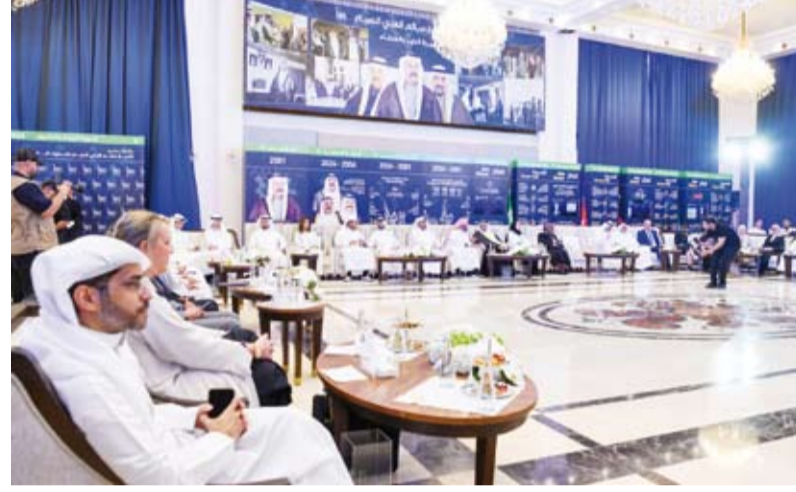
حضور كبير لحفل إطلاق مبادرة الذكاء الاصطناعي