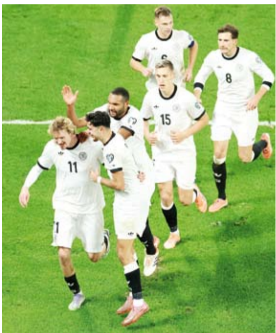
هدف يتيم بقود ألمانيا للفوز على أيرلندا الشمالية

ويتأهل متصدراً كل مجموعة مباشرة إلى النهائيات، بينما يخوض أصحاب المركز الثاني الملحق.