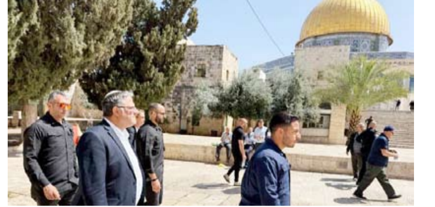
الوزير المتطرف والمستوطنون يندسون الأقصى برعاية أمن الاحتلال

من جانب آخر وبعد ساعات من التوقيع على اتفاق السلام في شرم الشيخ، اقتحم وزير الأمن القومي المتطرف في حكومة الاحتلال إيتمار بن غفير، المسجد الأقصى، كما اقتحم مستعمرون المسجد الأقصى في ثالث أيام ما يسمى «عيد العرش» اليهودي.