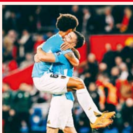
فرحة لاعبي بلجيكا بالفوز الكبير على ويلز

سجل كيفن دي بروين هدفين من ركلتي جزاء ليقود بلجيكا لعودة قوية بعد تلقي هدف مبكر، إذ تغلبت 4-2 خارج أرضها على ويلز ضمن تصفيات كأس العالم لكرة القدم 2026 واقتربت خطوة كبيرة من التأهل لنهائيات العام المقبل. وتقدم جو رودون بهدف لمنتخب ويلز في الدقيقة الثامنة على ملعب كارديف سيتي، لكن دي بروين سجل التعادل لبلجيكا من ركلة جزاء في غضون عشر دقائق قبل أن يمنحهم الظهير المخضرم توماس مونييه التقدم 2-1 في الشوط الأول.