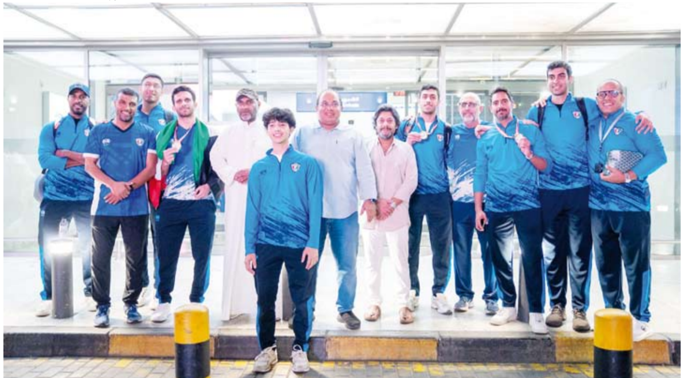
لفئة جماعية لأعضاء بعثة منتخب الكويت للاسكواش

أكد رئيس الاتحاد الكويتي للاسكواش وليد الصمعي أن تتويج المنتخب الوطني بلقب البطولة العربية التي اختتمت في العاصمة اللبنانية بيروت يعد إنجازاً وثمره لعمل جماعي وخطط واضحة. جاء ذلك في تصريح أدلى به الصمعي وهو رئيس الاتحاد العربي للعبة أيضاً عقب عودة بعثة المنتخب الوطني إلى البلاد. وقال إن تتويج منتخب الكويت بلقب البطولة العربية التي انطلقت في السادس من أكتوبر الجاري بعد فوزه بالمركز الأول في منافسات (الفرق) والمركزين الأول والثاني في منافسات (الفردي) ليس مستغرباً خاصة بعد