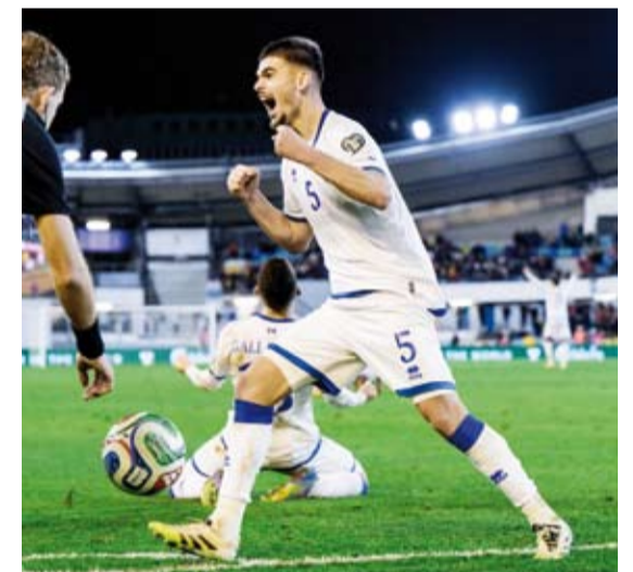
فرحة لاعبي كوسوفو بالفوز الثمين على السويد

الثانية بتصفيات أوروبا المؤهلة لكأس العالم 2026 في أميركا والمكسيك وكندا. ووقع منتخب كوسوفو رصيده إلى سبع نقاط، ليحتل المركز الثاني في المجموعة، فيما تجعد رصيد منتخب السويد عند نقطة واحدة في المركز الرابع والأخير. وسجل منتخب كوسوفو هدفة الوحيد عن طريق فيستنيك أسلاني في الدقيقة 32. وفي مباراة أخرى بنفس الجولة، خيم التعادل السلبي على مواجهة سلوفاكيا وسويسرا. ومكنت النتيجة منتخب سويسرا من الاحتفاظ بصدارة المجموعة برصيد عشر نقاط، فيما يحتل منتخب سلوفاكيا المركز الثالث برصيد ثلاث نقاط.