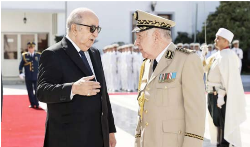
رئيس الجزائر مع رئيس أركان الجيش

وتنج الجيش الأسبوع الماضي في إنزال مؤن وعتاد عسكري مقره في المدينة (الفرقة السادسة مشاة)، لكن لا تزال الفجوة كبيرة في سد حاجة المواطنين من المواد الغذائية. وقالت «تنسيقية لجان مقاومة الفاشر»، وهي مجموعة حقوقية محلية، إن الفاشر شهدت قصفاً مدفعياً مكثفاً على أحيائها السكنية. وحملت، في بيان على موقع «فيسبوك»، الحكومة السودانية، وعلى وجه الخصوص قادة إقليم دارفور، مسؤولية «العجز والصمت أمام ما سمته الانهيار الكامل الذي يدفع ثمنه المزيد من أرواح الأطفال والنساء الأيرباء من المدنيين». وأضافت «التنسيقية» أن ما يحدث في الفاشر هو نتيجة لفشل القيادة وتحاولها نداءات الاستغاثة التي لم تتوقف يوماً عن إطلاق التحذيرات من الأوضاع المتدهورة في المدينة.