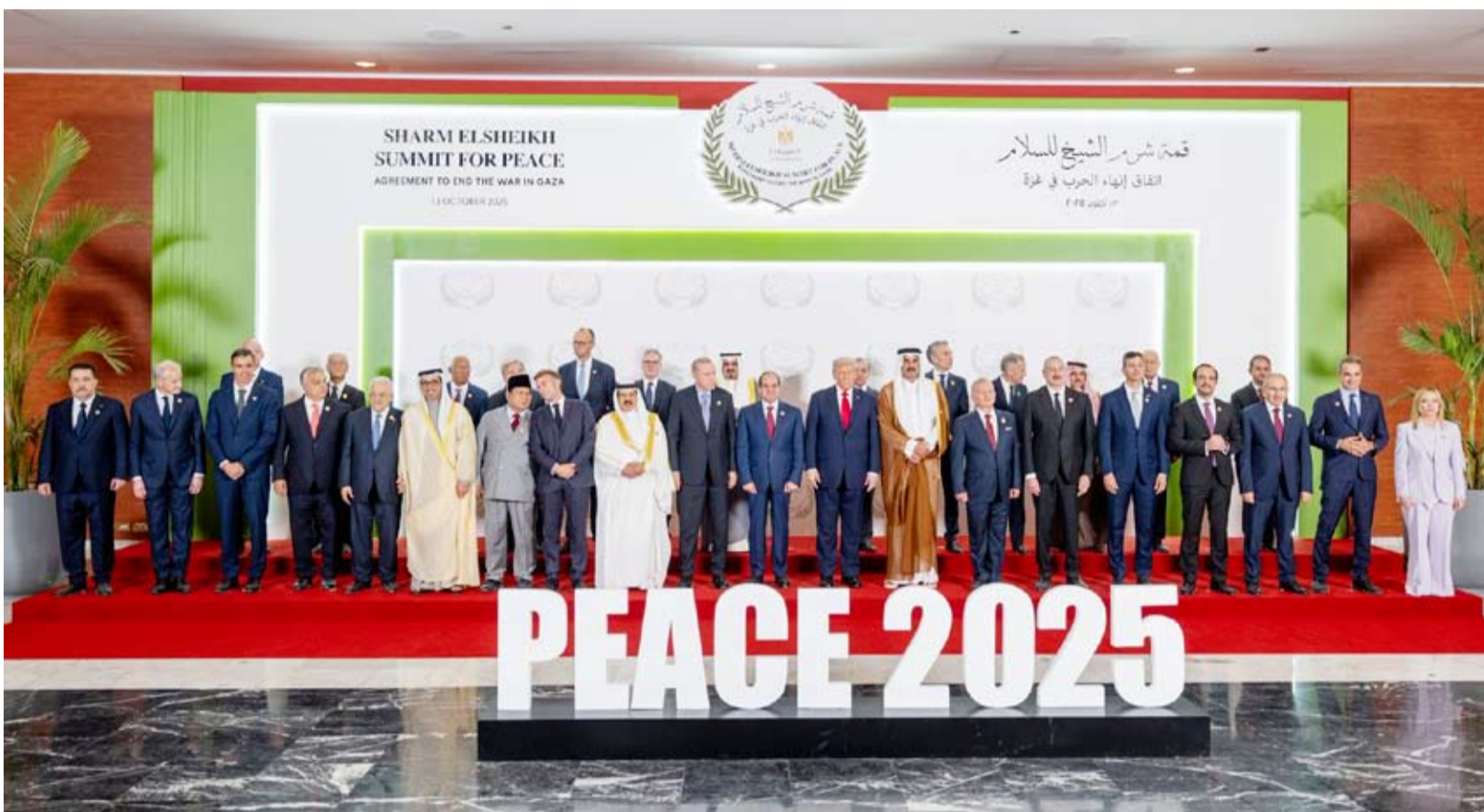
زعماء الدول المشاركة في القمة

وطالب الرئيس المصري، عبد الفتاح السيسي، خلال لقاء ترمب بشرم الشيخ، باستكمال مراحل اتفاق غزة. بدوره، أكد ترمب أن المرحلة الثانية من المفاوضات بشأن إنهاء الحرب في غزة بدأت بالفعل، مضيفاً: «نمر بغزة متميزة جداً في الشرق الأوسط».