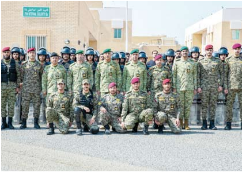
الفريق الركن حمد البرجس في لفتة جماعية خلال جولته التفقدية

قام وكيل الحرس الوطني الفريق الركن حمد البرجس، بجولة تفقدية في معسكر الصمود، شملت لواء المشاة الآلي ولواء الأمن الداخلي ومديرية الإسناد القتالي، وكان في استقباله قائد لواء التعزيز العميد الركن عبدالله صالح عبدالله. ونقل وكيل الحرس الوطني للمنتسبين تحيات قيادة الحرس الوطني ممثلة في الشيخ مبارك الحمود رئيس الحرس الوطني، والشيخ فيصل النواف نائب رئيس الحرس الوطني.