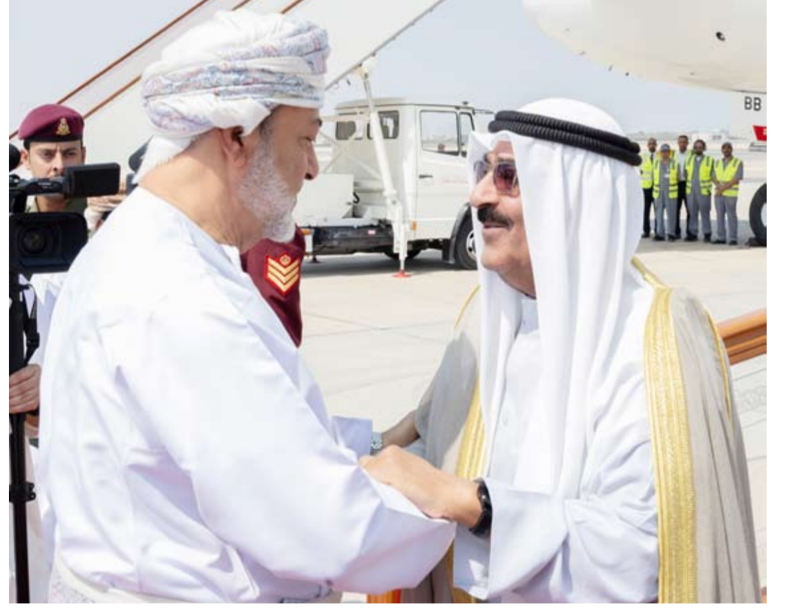
سمو الأمير وجمالية السلطان عمان خلال لقائهما أمس في مسقط

التقى سمو أمير البلاد الشيخ مشعل الأحمد، صباح أمس جلالة السلطان هيثم بن طارق سلطان سلطنة عمان الشقيقة أمس في قصر البركة العامر بالعاصمة مسقط. جرى خلال اللقاء تبادل الأحاديث الودية الطيبة التي عكست عمق العلاقات الأخوية الراسخة بين الجانبين وسبل دعم مسيرة التعاون الثنائي المشترك في شتى المجالات خاصة في مجال التعاون الاقتصادي بما يسهم في تطوير