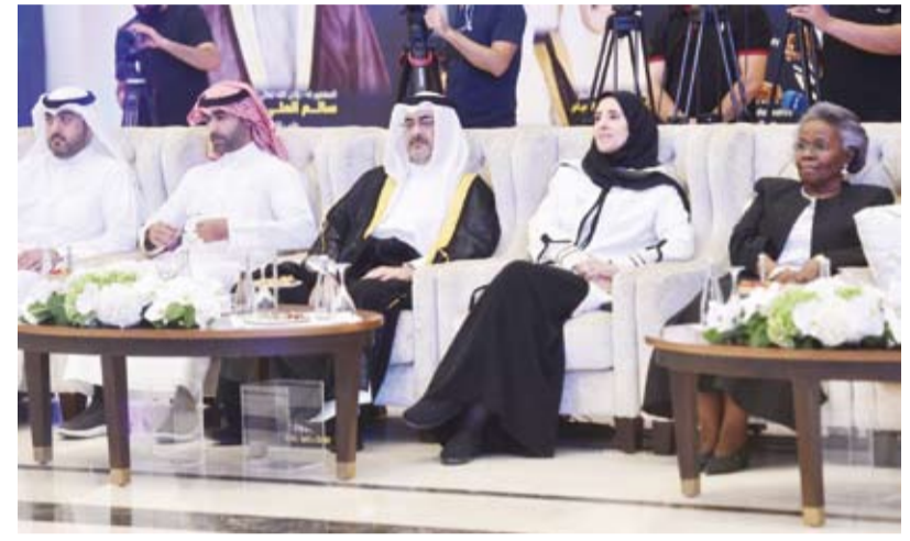
مخاطف العاصمة الشيخ عبدالله سالم العلي والشيخة عابدة سالم العلي يتقدمان الحضور

جديدة (2035) عبر برامج تدريبية متقدمة تفتح نوافذ للفكر الجديد والعقل المستنير وتحفز آلاف المواطنين على ابتكار حلول مناسبة لكثير من المشكلات المجتمعية. وأوضحت أنه تم اعتماد كبرى الجهات المتخصصة في مجال الذكاء الاصطناعي لتنفيذ المبادرة مسترشدين بتوجيهات صاحب السمو أمير البلاد الشيخ مشعل الأحمد وولي عهده الأمين سمو الشيخ صباح الخالد. من جانبه أكد محافظ العاصمة الشيخ عبدالله سالم العلي في كلمة مماثلة: إن لحظة إطلاق المبادرة فارقة في مسيرة وطن يؤمن بان المستقبل يصنع بالعلم والإبداع، إذ ستقود التغيير نحو تحول المعرفة إلى طاقة والطموح إلى إنجاز. وقال محافظ العاصمة: إن هذه المبادرة تأتي استجابة لرؤية جائزة سمو الشيخ سالم العلي الصباح للمعلومية في تمكين الإنسان الكويتي من المعرفة الرقمية والصناعة الذكية عبر منظومة من الشراكات العالمية والوطنية التي تستحق منا الإشادة والشكر، مضيفاً أن "الذكاء الاصطناعي أصبح لغة العصر الجديد ومحرك الإبداع والتقدم. بدوره أوضح عضو مجلس المساهمة والمساهمة المعلوماتية) بسام الشمري في كلمة مماثلة، أن