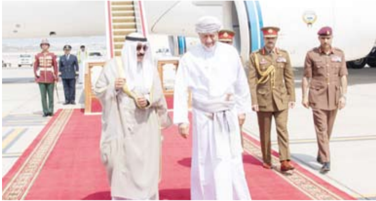
السلطان هيثم بن طارق مستقبلاً سمو أمير البلاد على أرض المطار