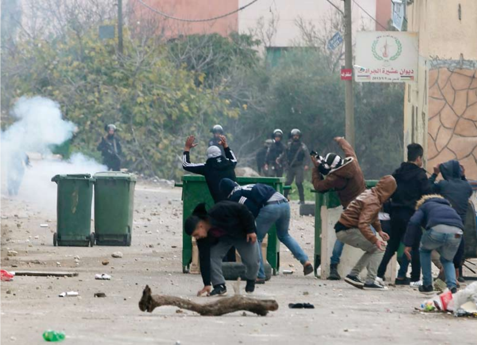
اشتباكات في الضفة

دعت فصائل فلسطينية السلطة لإلغاء اتفاق أو سلو بعد 29 عاماً على توقيععه، واصفة الاتفاق، في ذكراه، بأنه «خطيئة كبرى» أضرت بالقضية الفلسطينية. وصادف، الثالث عشر من سبتمبر الذكرى 29 لتوقيع اتفاقية أو سلو بين منظمة التحرير الفلسطينية والحكومة الإسرائيلية، عام 1993، وعرف آنذاك باسم «إعلان المبادئ حول ترتيبات الحكم الذاتي الانتقالي».