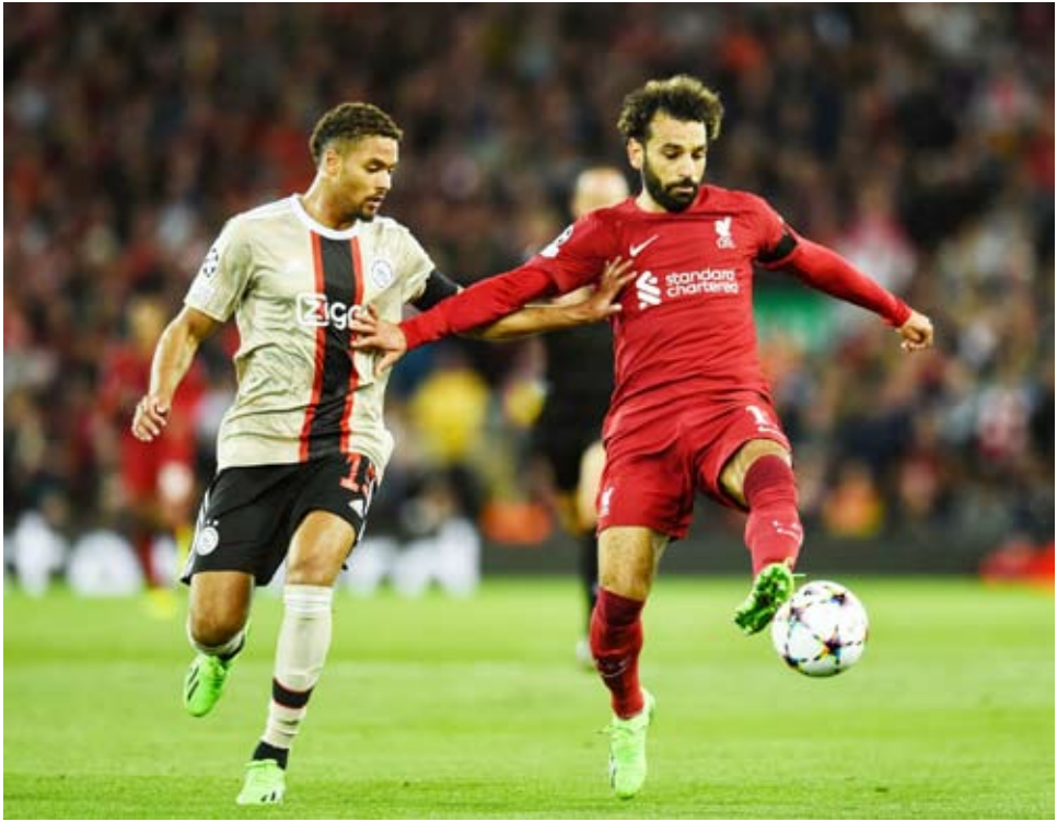
صلاح عاد الخالق ضد أياكس

قال الألماني يورغن كلوب بعد فوز فريقه ليفربول الصعب على أياكس أمستردام (2-1) أن الريزن قدّموا مباراة جيدة واستحقوا هذا الانتصار. وأكد كلوب أن المباراة كانت بين فريقين عريقين «كانت هناك معركة في وسط الميدان واستحقنا الفوز لأننا كنا في الاتجاه الصحيح» مشيراً إلى أن فريقه لم يصل إلى المثالية. ويرى كلوب أن انتكاس فريقه أصبح «معتاداً»، وأبلغ كلوب الصحفيين: نقوم بالعديد من الأمور الجيدة، وتقدم مباراة جيدة... ثم تهتز شباكك، نتقدم -1 صفر ثم تهتز شباكك من الفرصة الأولى للمنافس. لذا فالانتكاس أصبح معتاداً. وكال المدرب الألماني المديح لرد فعل فريقه بعد إدراك أياكس التعادل، وأضاف: لم أتفاجأ عندما سجل أياكس الهدف، ليس لأننا دافعنا بشكل سيء بل لأنه من المحتمل حدوث هذا الأمر في مثل هذه المواقف. وتابع: أليسون أنقذ كل التسديدات الأخرى، لكنها كانت التسديدة التي لم يمكن إبعادها. رد الفعل بأنه ما زال يمكننا التعامل مع هذه المواقف كان الأكثر أهمية.