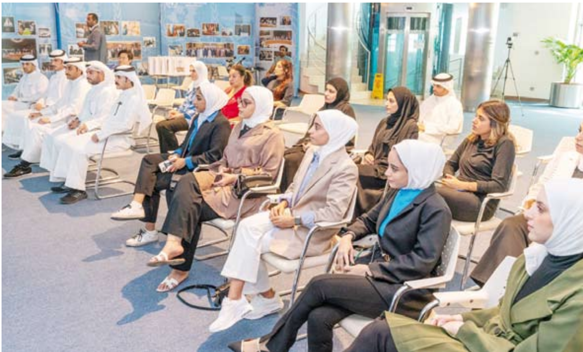
الطلبة الجامعيين خلال زيارتهم لمقر بعثة الأمم المتحدة في الكويت

بين 21 أغسطس الماضي ويستمر حتى 24 سبتمبر الجاري ويهدف البرنامج إلى تدريب الطلبة مختلف الفنون الصحفية.