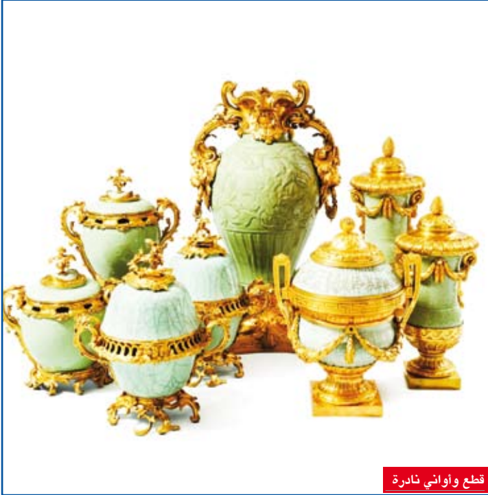
قطع واولني نادرة

والتي تجمع القطع التي يبحث عنها ذوو الذوق الرفيع من كل جيل. وزيارة هذا المكان الرائع تشبه الدخول إلى أحد أقسام قصر فرساي الزاخر بالتاريخ والثقافة. وتنتقل إلى عرض كل ما رأيناه على هواة جمع الأعمال الفنية وعشاق الفن في جميع أنحاء العالم.