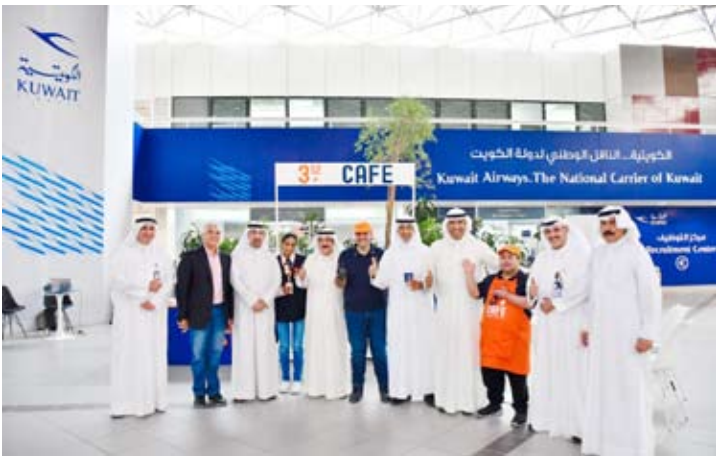
أمام مقهى 312

وتضمن برنامج الزيارة اجتماعات مع الوحدات التنظيمية المعنية وتقديم عدد من العروض المرئية بالاستعانة بالكفاءات المتخصصة داخل الهيئة، والتي تضمنت عرض أنظمة ومناذج عمل مختلفة لقطاع الأسواق وقطاع البعثات الأوراق المالية (الإيسكو) الاشراف واللجنة التوجيهية للتنسيق مع المنظمة الدولية لهيئات الأوراق المالية (الإيسكو) والتي من خلالها تم مناقشة المواضيع المطروحة والاجابة على كافة الاستفسارات خلال