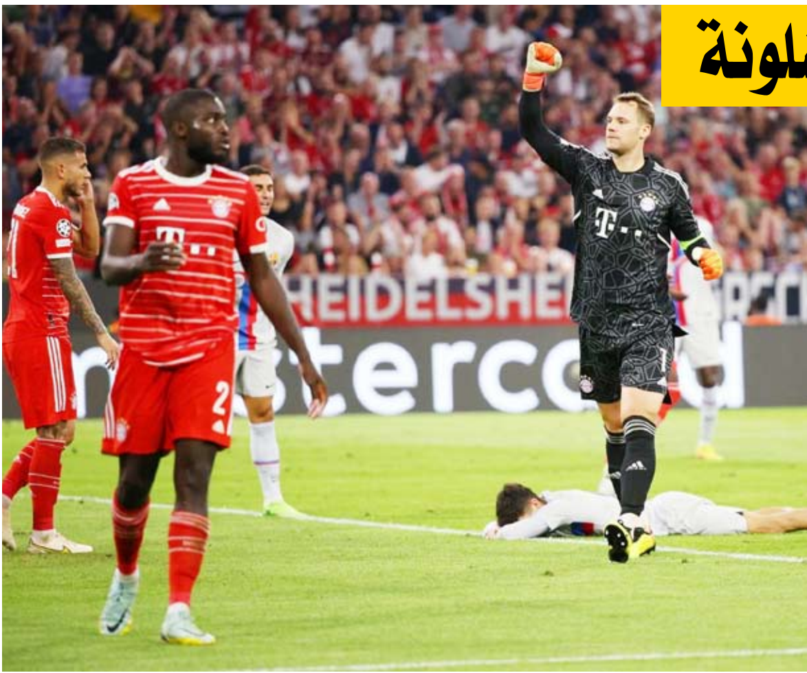
البايرن بالتخصص يتجاوز برشلونة

6 نقاط جمعها من الفوز في مباراتين وتسجيل 4 أهداف وعدم تلقي شباكه أية أهداف. بينما يتواجد برشلونة في المركز الثاني بجدول ترتيب المجموعة الثالثة بعد انتهاء الجولة الثانية برصيد 3 نقاط جمعها من فوز وهزيمة وتسجيل 5 أهداف وتلقي 3. ونجح بايرن ميونخ فض الاشتباك على صدارة المجموعة من خلال الحصول على نقاط المباراة كاملة والاقتراب من التأهل لدور الـ 16 والتقدم خطوة نحو المنافسة على اللقب في نسخته الحالية، حيث بدأ