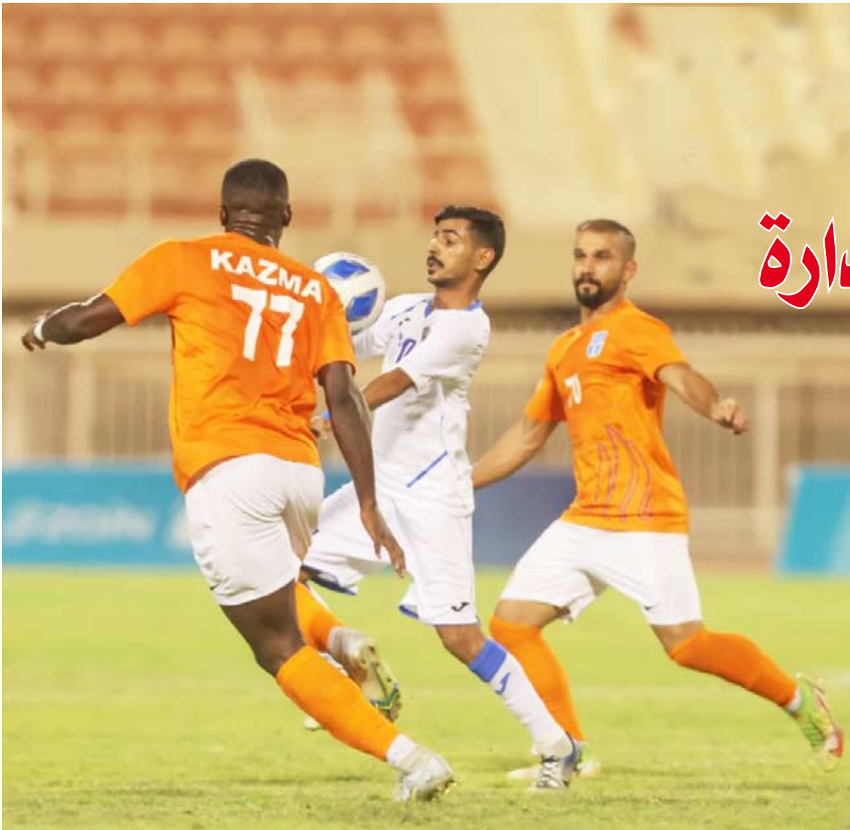
كاظمة لتعزيز الصدارة أمام النصر

تخطف مواجهة القادسية والجهراء في الجولة الرابعة بالدوري الكويتي الممتاز، الأنظار أهميتها في تحديد مستقبل الجهاز الفني للأصفر بقيادة ناصر الشطي، كما أن صاحب الضيافة أبناء القصر الأحمر تميزوا أمام الكويت وكاظمة. وانطلقت منافسات الجولة اعتباراً من أمس بمواجهة واحدة تجمع السالية والفحيحيل، على استاد عبد الله خليفة بنادي البرموك. فيما يلتقي اليوم القادسية مع الجهراء، على ملعب ستاد مبارك العيار، كما يلتقي في نفس كاظمة مع النصر. وتختتم مباريات الجولة غداً الجمعة بمواجهتي العربي والتضامن، والساحل والكويت، على أن يتوقف الدوري بعدها لمدة أسبوعين لتتوقف الدولي. ويحتل كاظمة الصدارة برصيد 7 نقاط، ويشارك الأهداف عن السالية، وفي المركزين الثالث والرابع الكويت والقادسية على الترتيب ولكل منهما 6 نقاط. ويتواجد النصر والجهراء في المركزين الخامس والسادس، على