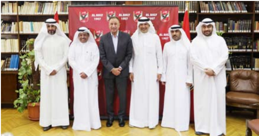
وفد اتحاد الكرة في ضيافة الأهلي المصري

بالعلاقة القوية بين الجانبين، وتطلعاته نحو تعزيز سبل التعاون بينهما خلال الفترة المقبلة. وشدد الشاهين على أن الأهلي قلعة رياضية عريقة تمثل واجهة مشرفة للرياضة العربية بما حققه من نجاحات كبيرة تخطت الحدود ووصلت إلى العالمية. وقام وفد الاتحاد الكويتي لكرة القدم بجولة في مقر الجزيرة تفقد خلالها منطقة دولا ببطولات وصالة الأمير عبد الله الفيصل وملعب مختار التتش والصب التذكاري للشهداء. وفي ختام الزيارة قام الخطيب بإهداء درع وعلم الأهلي ومقيص الفريق إلى أعضاء الوفد، الذي أهدى لرئيس النادي درع الاتحاد الكويتي لكرة القدم.