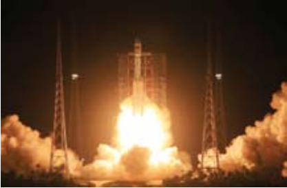
إطلاق القمر الصناعي

نجحت الصين في إرسال قمر اصطناعي جديد إلى الفضاء من مركز ونتشانغ لإطلاق المركبات الفضائية في مقاطعة "هاينان" الجزرية جنوبي البلاد.