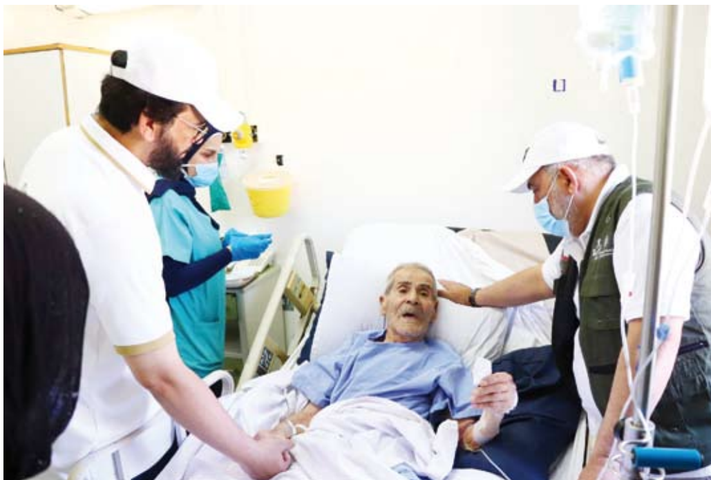
زيارة المرضى في المستشفى