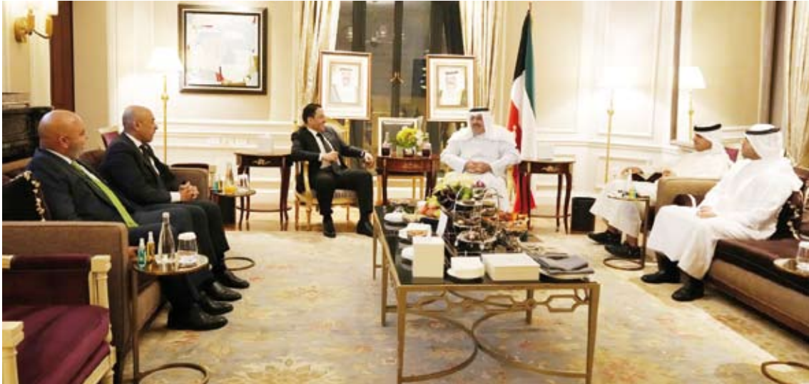
سمو رئيس مجلس الوزراء الشيخ أحمد النواف بعد وصوله إلى نيويورك

المختلفة في هذا الصدد. وأشار سموه إلى حرص دولة الكويت على مواصلة دورها الإنساني المميز في معالجة الكوارث والأزمات وإغاثة الشعوب المنكوبة ودعم جهود التنمية في مختلف دول العالم والتعاون مع الأمم المتحدة ووكالاتها وبرامجها المختلفة العاملة في هذا المجال.