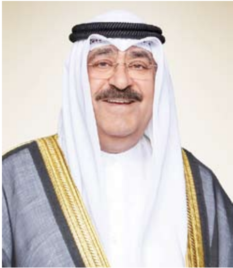
سمو نائب الأمير ولي العهد الشيخ مشعل الأحمد

استقبل سمو نائب الأمير ولي العهد الشيخ مشعل الأحمد، بقصر بيان، صباح أمس، رئيس مجلس الأمة السابق مرزوق الغانم. من جهة أخرى، بعث سمو نائب الأمير ولي العهد الشيخ مشعل الأحمد، ببرقية تهنئة إلى الرئيس رودريغو تشافيز روبلز رئيس جمهورية كوستاريكا الصديقة، ضمنها سموه خالص تهانئه بمناسبة العيد الوطني لبلاده، راجياً لفخامته وافر الصحة والعافية. كما بعث سمو نائب الأمير ولي العهد الشيخ مشعل الأحمد، ببرقية تهنئة إلى الرئيس نجيب بوكيلي رئيس جمهورية السلفادور الصديقة، ضمنها سموه خالص تهانئه بمناسبة العيد الوطني لبلاده، راجياً لفخامته وافر الصحة والعافية.