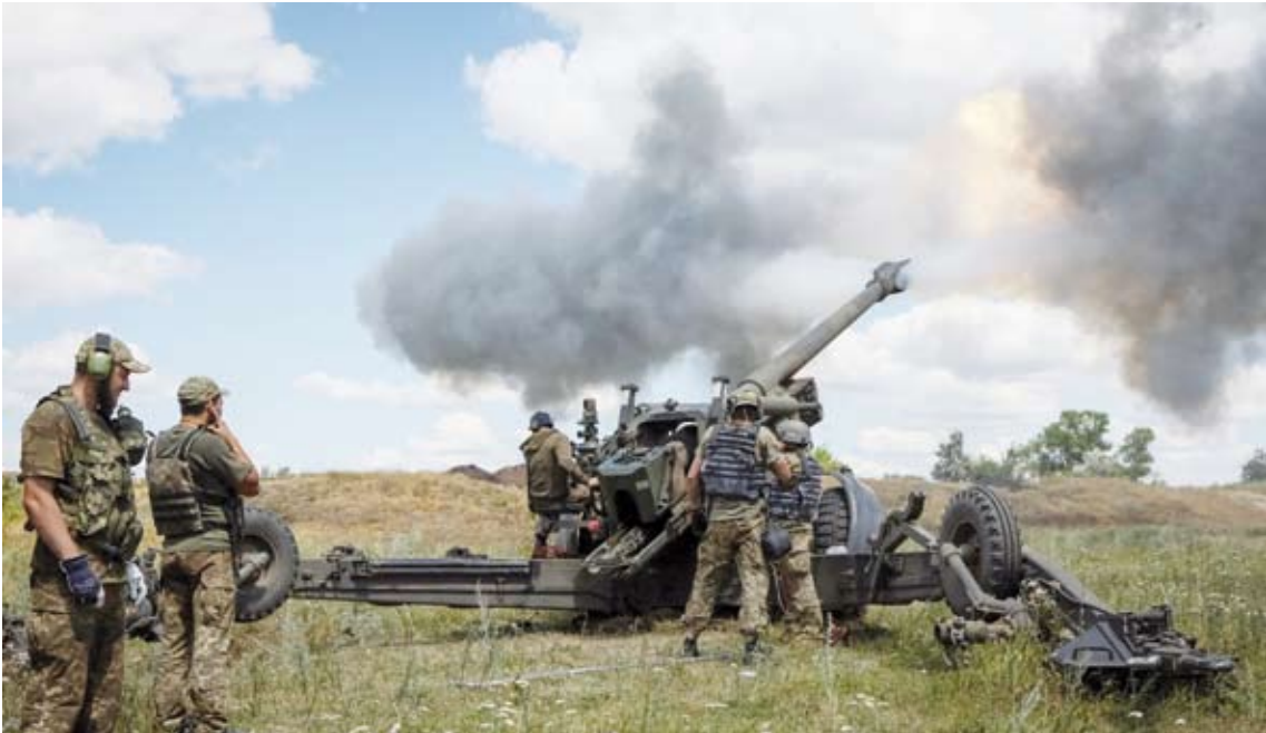
تقدم القوات الأوكرانية

في غضون ذلك، وجّهت الناطقة باسم الخارجية ماريا زاخاروفا انتقادات قوية لقرار الاتحاد الأوروبي حول التمييز بين فئات مختلفة من الروس الساعين إلى الحصول على تأشيرات دخول إلى الاتحاد (شينغن)، وقالت إن تقسيم الروس إلى «مقيدين» و«غير مقيدين» عند إصدار التأشيرات يعد «تدخلًا علنيًا سافرًا في الشؤون الداخلية لروسيا». وجاء ذلك في إطار ردّ زاخاروفا على تصريحات عضو المفوضية الأوروبية للشؤون الداخلية، إيلفا يوهانسون، التي قالت إن السباحة في الاتحاد الأوروبي بالنسبة للروس هي «امتياز». وحسب زاخاروفا، فإن التفسيرات التي قدمتها المفوضية الأوروبية، بتاريخ 9 سبتمبر الحالي، بشأن إجراءات معالجة ملفات التأشيرات الخاصة بالروس، تكرر «مبادئ تمييزية صريحة، تتمثل في زيادة الشك والتحيز ضد مواطنينا».