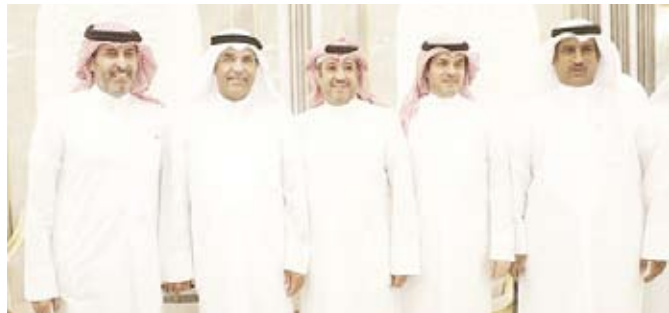
متعب الرتعان يتلقى التهاني

أقام النائب متعب الرتعان حفل استقبال على شرف أبناء الدائرة الرابعة في الجهرء، بمناسبة فوزه بالانتخابات لمجلس الأمة في فصله التشريعي السابع عشر، بعد حصوله على المركز الثالث في الدائرة.