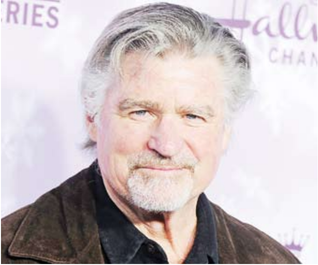
الممثل الأمريكي تريت ويليامز

توفي الممثل الأمريكي تريت ويليامز 71 عاماً بعد تعرضه لحادث سير. وذكرت صحيفة “ديلي ميل” البريطانية أن ويليامز، الذي ترشح في السابق لجائزة جولدن جلوب، توفي مساء أمس الأول عندما اصطدم سائق سيارة هوندا بحاول الدخول لساحة لتوقف السيارات بويليامز، الذي كان يقود دراجته البخارية ويسير في الاتجاه المعاكس. وكان ويليامز، الذي يعرف بأدواره في مسلسل “يفرود” و “هير”، يقضي عطلة نهاية الأسبوع في منزله في ولاية فيرمونت قبل ساعات من وقوع الحادث. وأكدت الشرطة أن ويليامز كان يرتدي الحوذة وقت وقوع الحادث. ويشار إلى أن ويليامز متزوج من الممثلة بام فان سانت، ولديهما ولد وبنت.