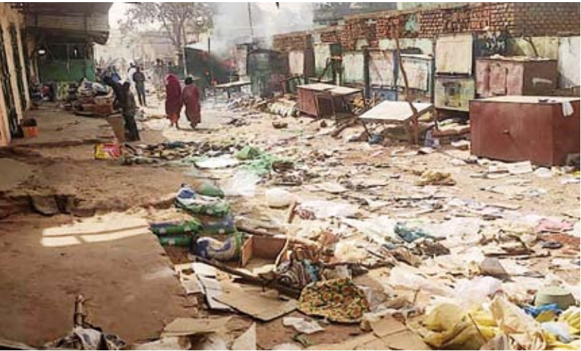
دمار جراء الحرب

وتشريد مئات الآلاف داخليا وخارجيا إلى دولة تشاد المجاورة، واكتفى حاكم الإقليم بوصف ما يحدث في إقليمه بأن ما يدور يستوجب تحقيقاً دولياً.