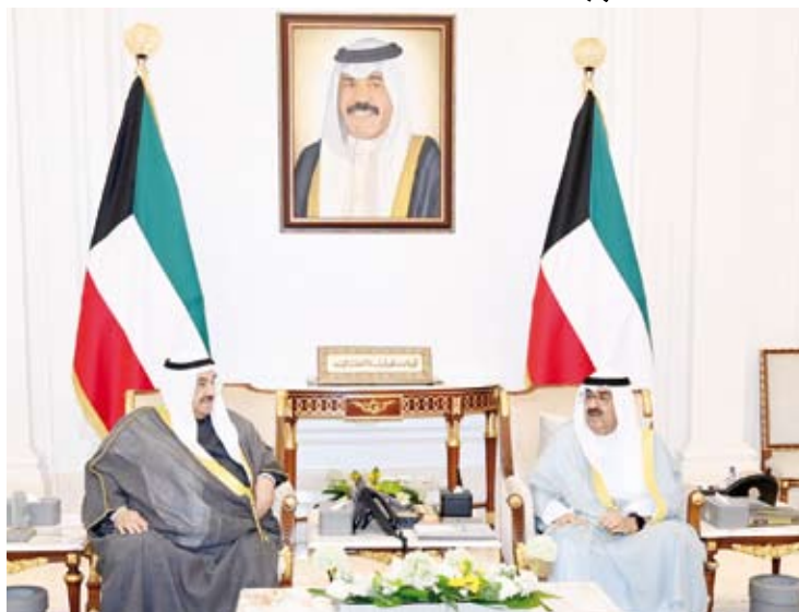
سمو ولي العهد يستقبل سمو الشيخ ناصر المحمد

استقبل سمو ولي العهد الشيخ مشعل الأحمد، بقصر بيان، صباح أمس، على التوالي سمو الشيخ ناصر المحمد رئيس مجلس الوزراء الأسبق، كما أجرى سموه اتصالاً هاتفياً مع سمو الشيخ جابر المبارك رئيس مجلس الوزراء الأسبق.