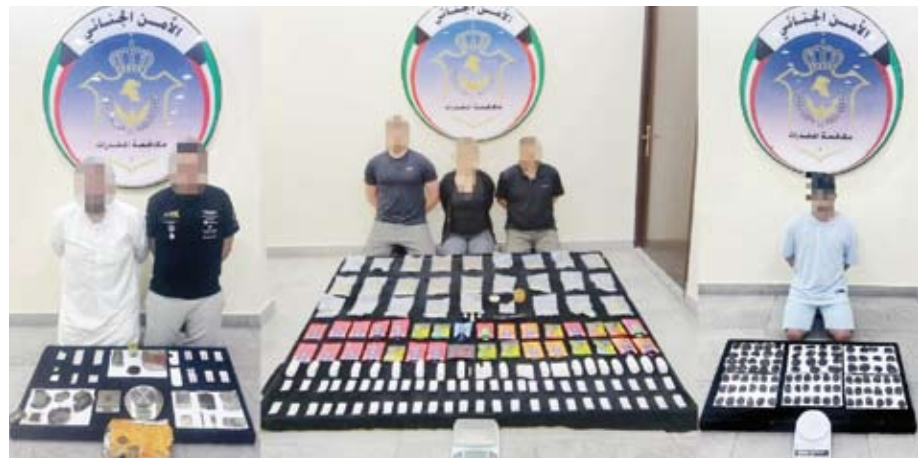
المتهمون مع المضبوطات

ومواجهة تجار السموم وكل من يحاول الإضرار بشباب الوطن، موجهاً بضرورة تضافر جهود الجميع للقضاء على تجار المخدرات ومروجيها. وأهابت وزارة الداخلية، بالجميع التعاون مع رجال الأمن والإبلاغ عن أية ظواهر سلبية على هاتف الطوارئ (112) والخط الساخن للإدارة العامة لمكافحة المخدرات.