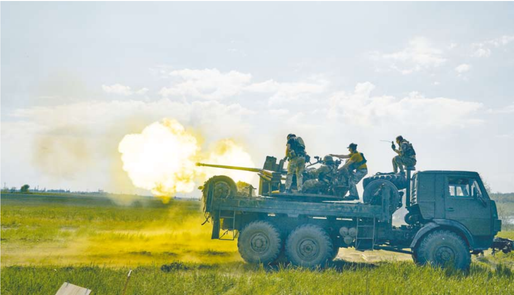
استمرار الهجوم المضاد في أوكرانيا

أكد الرئيس الأوكراني فولوديمير زيلينسكي أنّ الهجوم المضادّ الذي شنته قواته أخيراً ضدّ القوات الروسية بعدما أعدت له طوال أشهر «صعب» لكنه «يمضي قدماً»، وذلك بعيد إعلان كييف استعادتها السيطرة على سبع قرى، وفقاً لوكالة الصحافة الفرنسية.