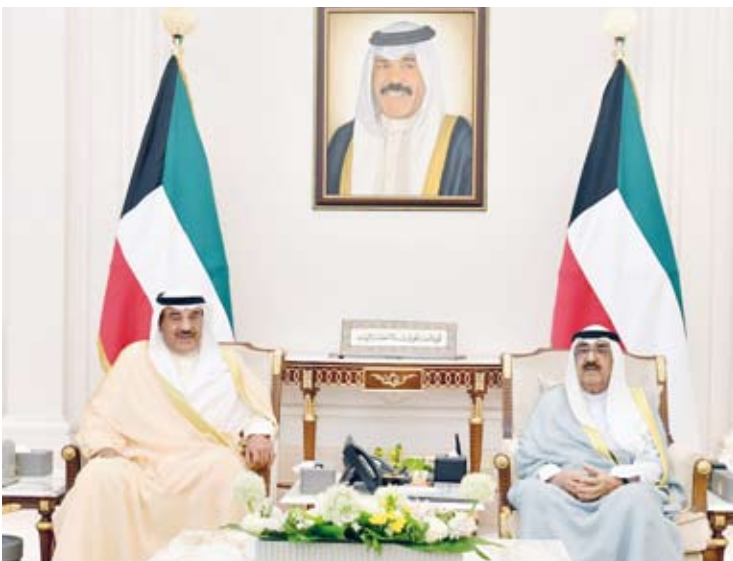
.. وسموه يستقبل سمو الشيخ صباح الخالد