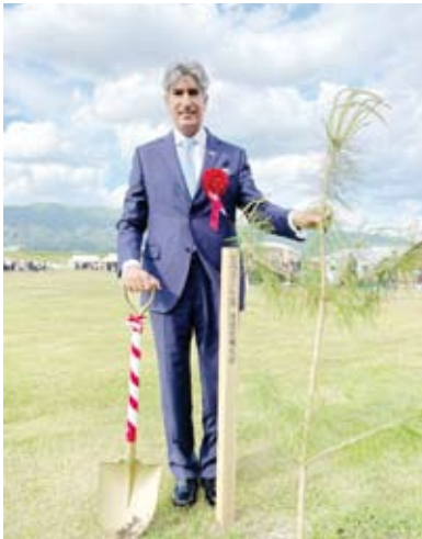
السفير سامي الزمان أثناء زراعة شجرة صنوبر باسم الكويت

شارك سفير دولة الكويت لدى اليابان سامي الزمانان في حفل خاص أقيم بمحافضة (ايواتي) بحضور إمبراطور اليابان ناروهيتو، تخليداً لضحايا كارثة أعنف زلزال ضرب اليابان في مارس عام 2011 ونجم عنه موجات تسونامي تسببت في أزمة إنسانية واقتصادية في آن واحد. ووفق بيان تلقته (كونا) أمس، ألقى الإمبراطور ناروهيتو كلمة بعد دقيقة صمت حداداً على أرواح ضحايا الكارثة جدد فيها شكره وتقديره لجميع الدول التي وقفت الى جانب شعب اليابان خلال محنته وساهمت في دعم جهود إعادة الإعمار. بعد ذلك قام سفير الكويت بـزراعة شجرة صنوبر باسم دولة الكويت في حديقة (ريكويز) تاكادا) المخصصة لذكرى ضحايا الكارثة تعبيراً عن الصداقة المتينة بين البلدين والشعبين الصديقين.