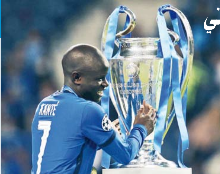
الفرنسي نجولو كانتي

ويتطلع اتحاد جدة لإبرام صفقات مميزة هذا الصيف، من أجل الاستعداد للمشاركة المنتظرة في كأس العالم للأندية بالملكة العربية السعودية.