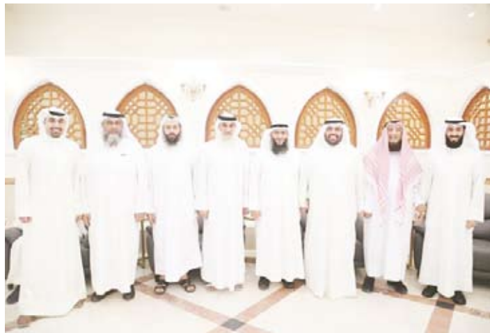
جراح الفوزان وعلام الكندري وبعض الحضور يتوسطهم حمد العبيد

استقبل النائب حمد العبيد مهنتيه بمناسبة فوزه بانتخابات مجلس الامة 2023 في حفل استقبال على شرف أبناء ونأخبي وأهالي الدائرة الثالثة، مساء أمس الأول في صالة الميلم بالعدلية، بمناسبة فوزه بانتخابات أمة 2023.