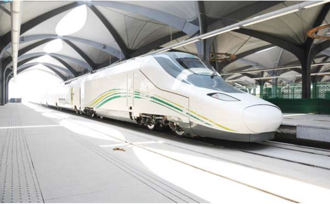
قطار الحرمين السريع

رفعت الخطوط الحديدية السعودية عدد رحلات قطار الحرمين السريع المتاحة خلال موسم حج هذا العام، لتتجاوز 3400 رحلة، بعدد مقاعد يتجاوز 1.5 مليون مقعد، حيث ستكون الرحلات متاحة بين المحطات كافة لتصل إلى 126 رحلة في اليوم الواحد لمختلف الوجهات التي يصلها القطار بين مكة المكرمة والمدينة المنورة، مؤكدة اكتمال خططها التشغيلية لنقل ضيوف الرحمن.