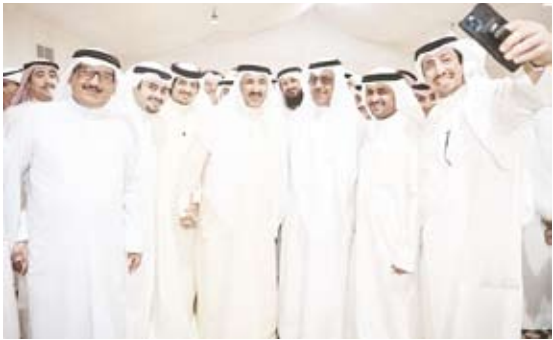
مبارك الخرينج مهنتا سعد الخنفور

استقبل النائب سعد الخنفور مهنتيه في حفل استقبال على شرف أبناء الدائرة الرابعة بمناسبة نجاحه في انتخابات مجلس الأمة للفصل التشريعي السابع عشر بمنطقة اشبيلية. وقال الخنفور «شكرا من القلب، شكرا بحجم السماء، شكر لكل من منحني الثقة، شكرا لكل من أغفاني منها، شكرا للدائرة الرابعة، شكرا للوزاري وأهلي وربعي، وأعدكم أن أكون كما كنا وسنبقى معكم بحقوقكم، وفي واجباتكم، ومعكم بكل ما أمكنا، وببض الله وجهكم إخواني الناخبين وأخواني الناخبات.