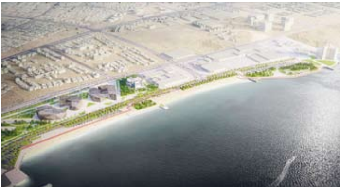
صورة افتراضية لشكل المشروع النهائي