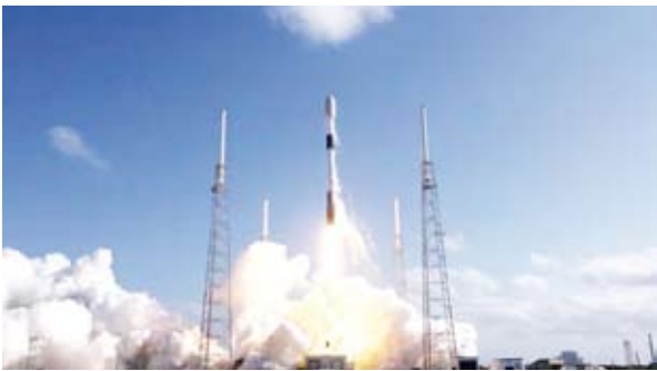
إطلاق 72 قمر صناعي صغير

أطلقت مؤسسة تكنولوجيا استكشاف الفضاء الأمريكية “سبيس إكس” 72 قمراً صناعياً صغيراً إلى الفضاء، لبدء مهمة مشاركة تسمى “ترانسبورت-8”.