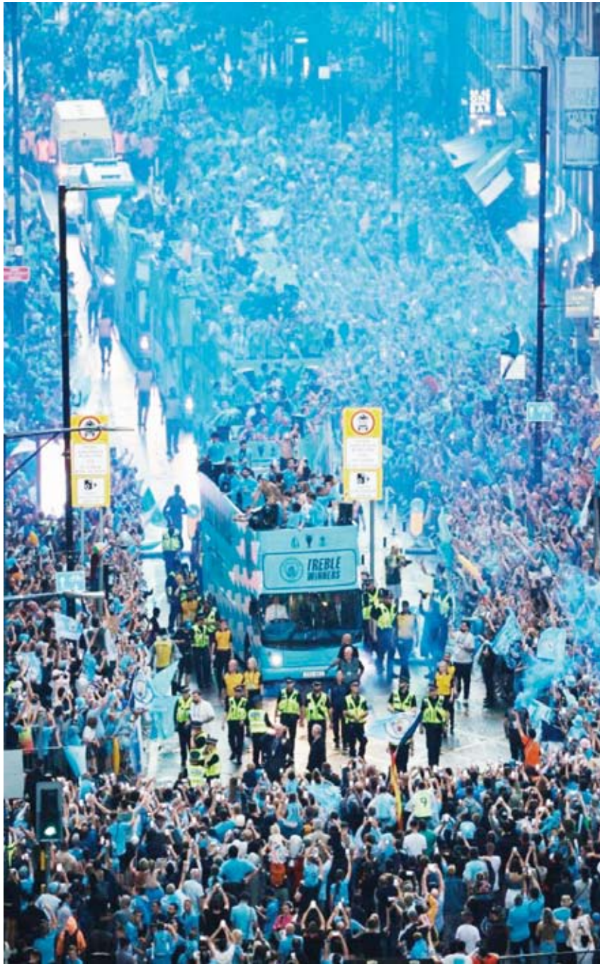
استقبال أسطوري لحافلة السيتي

وقال غوارديولا الذي كان يدخل السيجار بعد وصول الفريق إلى وسط مدينة مانشستر، في الوقت الذي وضع في إيرلنغ هالاند ورفاقه الميداليات الذهبية على أعناقهم.