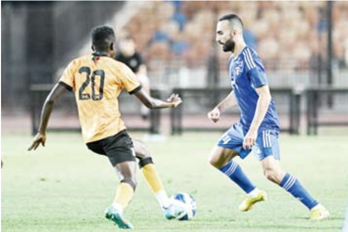
أداء مقنع للأزرق استعداداً للمشاركة في بطولة جنوب آسيا

تغلب منتخب الكويت على زامبيا، بنتيجة (3-0)، في المباراة الدولية الودية التي جمعت بينهما على استاد القاهرة في إطار معسكر الأزرق المقام في مصر، والمستمّر حتى 17 يونيو الجاري.