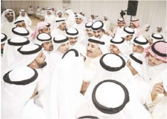
الخنفور محاطا بمحبيه

وقال العبيد: «انقدم بعد شكر الله عز وجل بالشكر لإخواني وأخواتي ناخبي الدائرة الثالثة وأهل الكويت جميعا، وأشكر ثقتكم الغالية وستجدونني بإذن الله كما عهدتموني، سأناأ الله عز وجل أن يعينني على حمل الأمانة