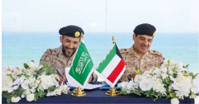
اللواء الركن بحري سيف الهملان واللواء الركن بحري منصور العتيبي

استضافت الكويت، أمس، الاجتماع التسقي الثاني الكويتي - السعودي لمناقشة وتعزيز مجالات التعاون والتنسيق المشترك في مجال العمليات البحرية بين القوتين في البلدين الشقيقين. وذكرت رئاسة الأركان في بيان صحفي، أن أمر القوة البحرية اللواء الركن بحري سيف الهملان استقبل بقاعة محمد