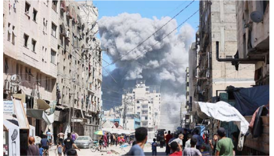
الاحتلال يكثف من استهداف المباني في غزة ويناقش خطة التهجير

رغم إجماع مجلس الأمن على إدانة الاعتداء الصهيوني على سيادة دولة قطر الشقيقة، إلا أن عدم اتخاذ موقف حاسم وحازم وراعي للانتهاكات المتكررة للكيان المحتل، تجاه دول المنطقة، سواء في سورية أو لبنان أو اليمن، إضافة إلى جرائم الإبادة التي يرتكبها في قطاع غزة، يمثل ضوء أخضر لمزيد من الاعتداءات والانتهاكات، بدعم وحماية أميركية مستمرة. الكيان المحتل لم يكتف بذلك، ولن يكتفي لأن قاداته المجرمين لا يعرفون سوى لغة البلطجة واستخدام القوة لسلب حقوق الآخرين، إلى متى يظل المجتمع الدولي عاجزاً عن مواجهة الهيمنة والغطرسة الصهيونية؟!؟