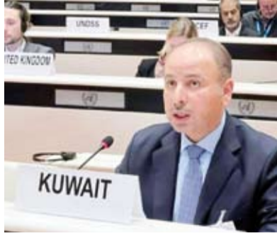
السفير ناصر الجبير

أعربت دول مجلس التعاون لدول الخليج العربية، أول أمس، عن قلقها إزاء استمرار ظاهرة عمالة الأطفال وأشكال الرق المعاصرة والتحديات المرتبطة بهما لا سيما في البيئات الريفية وأثناء النزاعات المسلحة. جاء ذلك في كلمة ألقاها المندوب الدائم لدولة الكويت لدى الأمم المتحدة والمنظمات الدولية الأخرى في «جنيف»، السفير ناصر الجبير، بصفتها رئيس مجلس سفراء دول مجلس التعاون، أمام مجلس الأمم المتحدة لحقوق الإنسان المنعقد في جنيف في دورته 60. وألقى السفير الجبير الكلمة في إطار الحوار التفاعلي مع المقرر الأممي الخاص المعني بالرق المعاصر الذي لفت إلى تواصل ظاهرة عمل واستغلال ملايين الأطفال في أعمال خطيرة لا سيما في البيئات الريفية ومناطق النزاع رغم الالتزام العالمي بالقضاء على هذه الظاهرة بحلول 2025. وأكدت دول مجلس التعاون في الكلمة أهمية تعزيز التعاون الدولي وبناء شراكات متعددة الأطراف ودعم الجهود الأممية المشتركة للقضاء على هذه الممارسات. وأشار السفير الجبير، في الوقت نفسه، إلى ما حققته دول مجلس التعاون في مجال حماية الأطفال من خطوات كبيرة حيث كانت من بين أوائل المجموعات الإقليمية التي صادقت بشكل كامل على اتفاقية منظمة العمل الدولية رقم (182) المعنية بأسوأ أشكال عمل الأطفال إلى