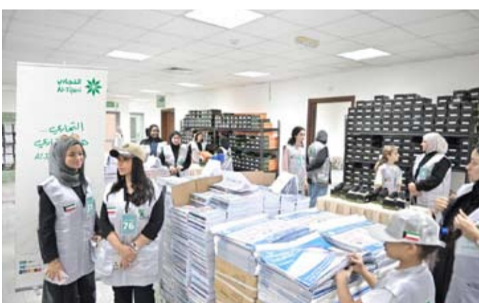
معرض الحقيبة والكسوة المدرسية