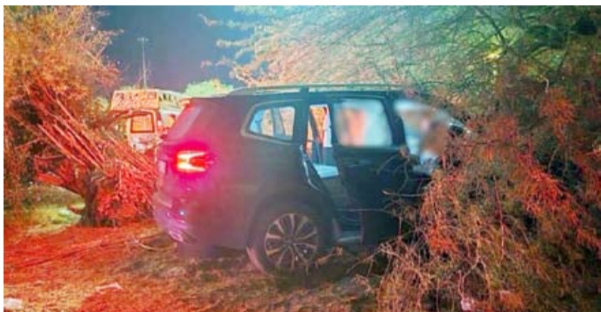
السيارة بعد الحادث

وأُسفر الحادث عن حالتين وفاة وإصابة 4 أشخاص، وتم التعامل مع الحادث وتسليم الحالات إلى الجهات المختصة.