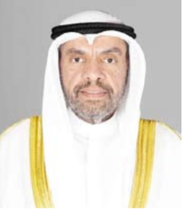
وزير الخارجية عبدالله الجبير