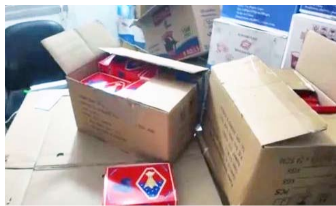
مواد غذائية متفوية الصلاحية

بالتعاون والتنسيق المشترك بين وزارة الداخلية والهيئة العامة للغذاء والتغذية، وفي إطار الجهود المستمرة لحماية الصحة العامة والتصدي لظواهر الغش التجاري، تمكن قطاع مديريات الأمن ممثلاً في مديرية أمن حولي من ضبط متهمين - أحدهما سوري والأخر هندي - بعد أن تبين قيامهما بتحويل منزل مؤجر في منطقة مشرف إلى موقع لتصنيع مواد غذائية مغشوشة وبيعها بطرق مخالفة للقانون.