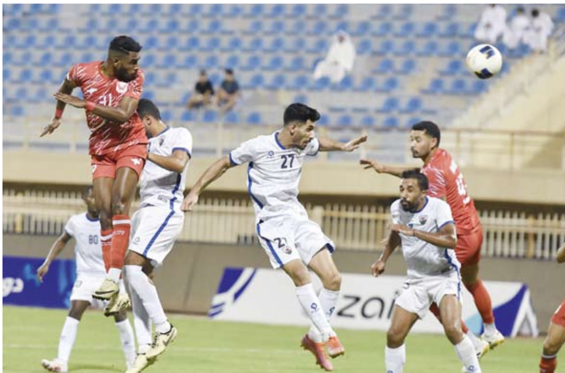
الفحيحيل انتزع ثلاث نقاط ثمينة من ضيفه الجهراء