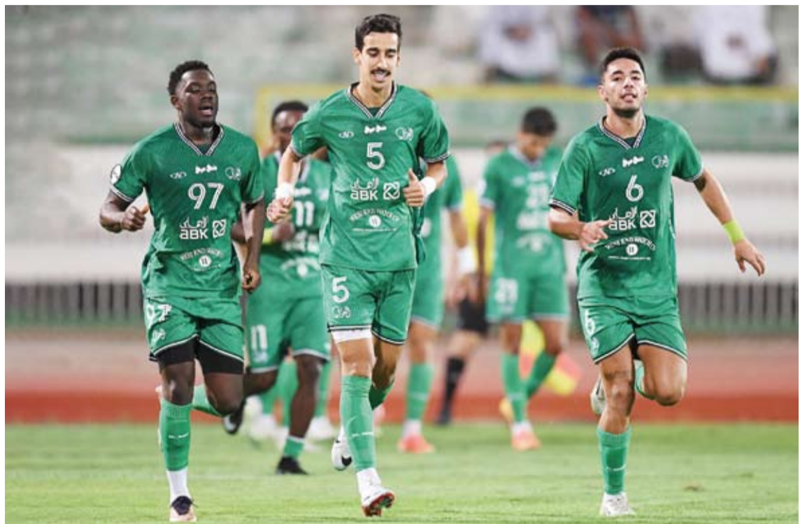
بداية قوية للعربي أمام الشباب

الثاني عن طريق دا سيلفا بالدقيقة الـ 84 ليواصل تالقه باحرازه الهدف الثالث (هاتريك) بالدقيقة الـ 92 ليقود فريقه لتحقيق الفوز. وحصد الفحيحيل النقاط الثلاث الأولى له في الدوري فيما بقي الجهراء دون رصيد من النقاط.