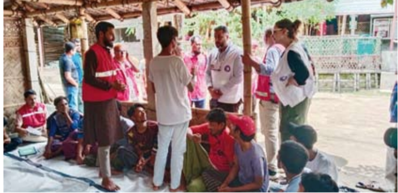
وفد جمعية الهلال الأحمر الكويتي ونظرائهم بالهلال الأحمر البنغلاديشي خلال الزيارة