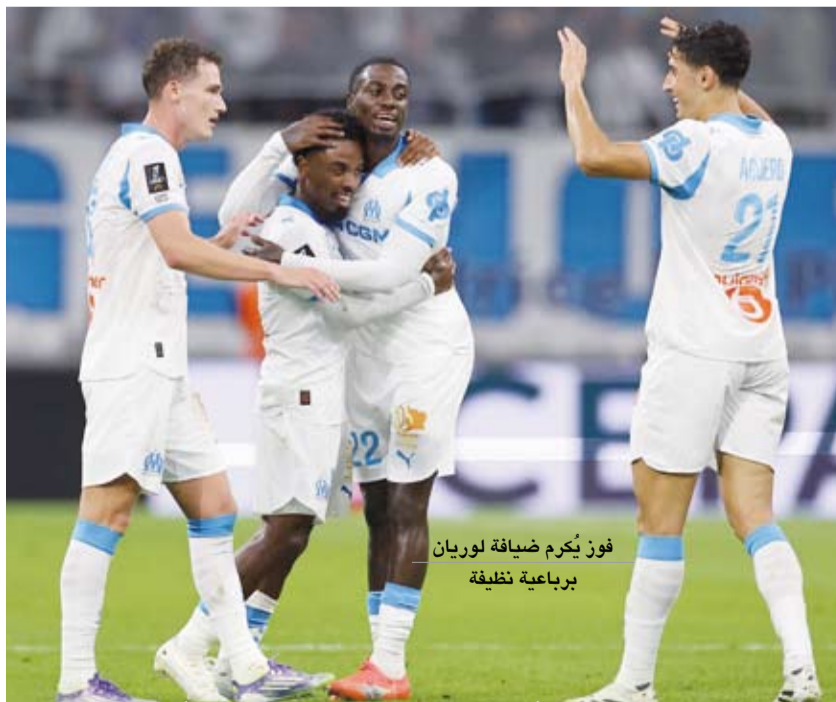
فوز يُكرّم ضيفه لوريان برعاية نظيفة

فاز أولمبيك مارسيليا على ضيفه لوريان بأربعة أهداف دون رد في المباراة التي جمعتهما في افتتاح الجولة الرابعة من الدوري الفرنسي لكرة القدم. وسجل أهداف أولمبيك مارسيليا كل من ماسون