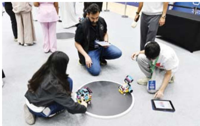
مسابقة الروبوتات ذاتية التشغيل باستخدام