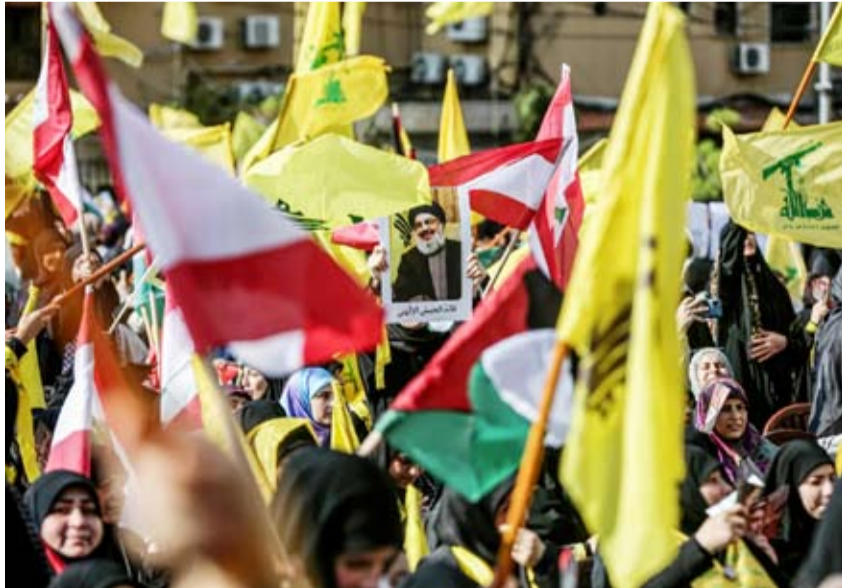
مناصرون لـ«حزب الله» بالضاحية الجنوبية

الاستراتيجية «لا تتعارض إطلاقاً مع مبدأ حصرية السلاح إنما تشدد عليه»، لافتاً في تصريح لـ«الشرق الأوسط»، إلى أن «اختيار استراتيجية الأمن الوطني هدفه عدم العودة للاستراتيجية الدفاعية التي كانت تتخذ هدفاً وسبباً للمماطلة بحصرية السلاح التي باتت أمراً نهائياً ومحسوماً».