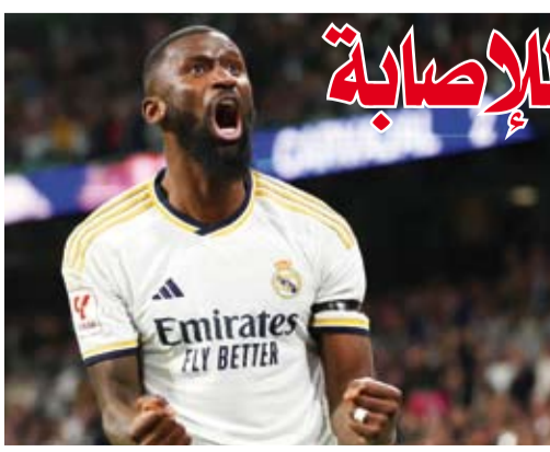
الألماني أنتونيو روديجر

يغيب قلب الدفاع الألماني أنتونيو روديجر عن فريقه ريال مدريد الإسباني لكرة القدم نحو شهرين بسبب إصابة في عضلة ساقه اليسرى. وتعرض اللاعب البالغ 32 عاماً، للإصابة خلال تدريبات الجمعة، ومن المقرر خضوعه لمزيد من الفحوص الطبية خلال الأيام القليلة المقبلة، لكن صحيفة «أس» اليومية المحلية أشارت إلى أن الإصابة «خطيرة». وأعلن في بيان له أن الفحوص أظهرت إصابة لاعبه «في عضلة الفخذ المستقيمة»، من دون تحديد