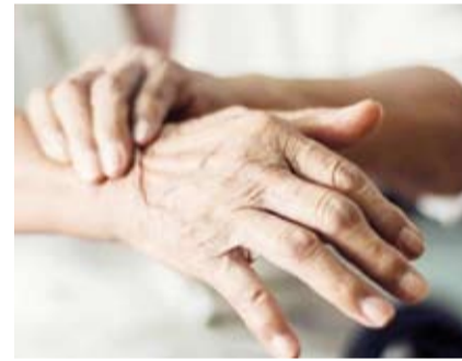
8 ملايين شخص حول العالم يعانون من مرض باركنسون

اكتشف علماء معهد غلاستون، سبباً مدهشاً لموت الخلايا العصبية المنتجة للدوبامين، وهي خلايا حاسمة للحركة الجسدية السلسة، في مرض باركنسون. وأظهرت الدراسات على الفئران أن استمرار فرط نشاط هذه الخلايا العصبية لأسابيع يؤدي إلى تدهورها، حيث تفقد أو لا وابطها ثم تموت في النهاية. وهذه النتائج تعكس ما يلاحظ في المرضى من فقدان انتقائي للخلايا العصبية، حيث تنهار الخلايا المجهدة في المادة السوداء، وهي بنية من الدماغ المتوسط مسؤولة عن الحفاة والحركة بشكل أساسي في النهاية. وتحتوي مجموعات معينة من خلايا الدماغ على قدرة التحكم في دقة وتنسيق حركات الجسم. عندما تظل هذه الخلايا في حالة نشاط مفرط لفترات طويلة، تبدأ في التدهور وتموت في النهاية. ولاحظ باحثون في معهد غلاستون هذه العملية مؤخراً، ما يقدم رؤى جديدة حول ما قد يحدث بشكل خاطئ في أدمغة المصابين بمرض باركنسون. ويعاني أكثر من 8 ملايين شخص حول العالم من مرض باركنسون، وهو اضطراب تدريجي في الدماغ يؤدي إلى العرشة وبطء الحركة وتصلب العضلات وصعوبة في المشي والتوازن.