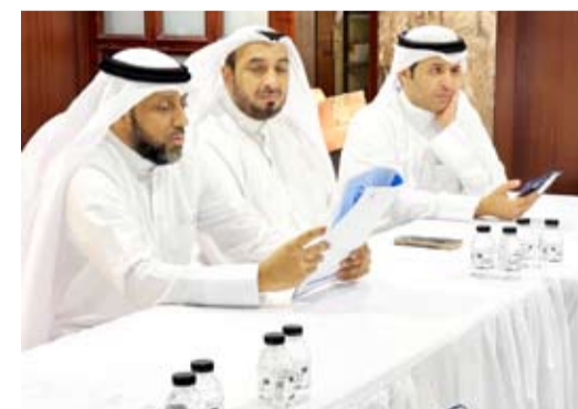
جانب من الجمعية العمومية

اعتمدت الجمعية العمومية لجمعية الحياة الخيرية مكتب التدقيق المالي الخارجي لحسابات الجمعية، وذلك ضمن جدول أعمال اجتماع أعضاء الجمعية في مقرها ببرج دسمان.