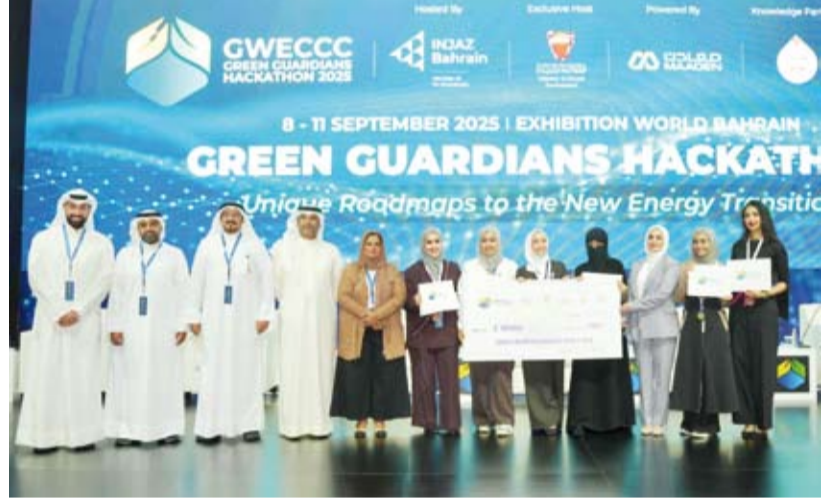
فريق كلية الهندسة والبتترول المشارك في الهاكاثون

المقدم يمكن للكويت بحلول العام 2060 أن تحقق الحياد الكربوني الكامل عبر الاعتماد على 70 بالمئة من الطاقة المتجددة و20 بالمئة من الطاقة النووية ارتفاعاً من نسبة لا تتجاوز (0.14 بالمئة) للطاقة المتجددة اليوم لتكون الكويت نموذجاً رائداً في المنطقة للتحول نحو الطاقة النظيفة.