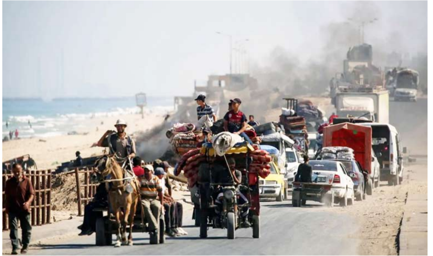
فلسطينيون أثناء إخلائهم مدينة غزة

أقرت الجمعية العامة للأمم المتحدة، «إعلان نيويورك» المؤيد لحل الدولتين وإقامة الدولة الفلسطينية المستقلة بأغلبية 142 صوتاً مقابل اعتراض 10 أعضاء وامتناع 12 دولة عن التصويت. والإعلان، المكون من سبع صفحات، هو ثمره مؤتمر دولي انعقد في الأمم المتحدة في يوليو الماضي استضافته السعودية وفرنسا عن الصراع المستمر منذ عقود. وقاطعت الولايات المتحدة وإسرائيل هذا المؤتمر.