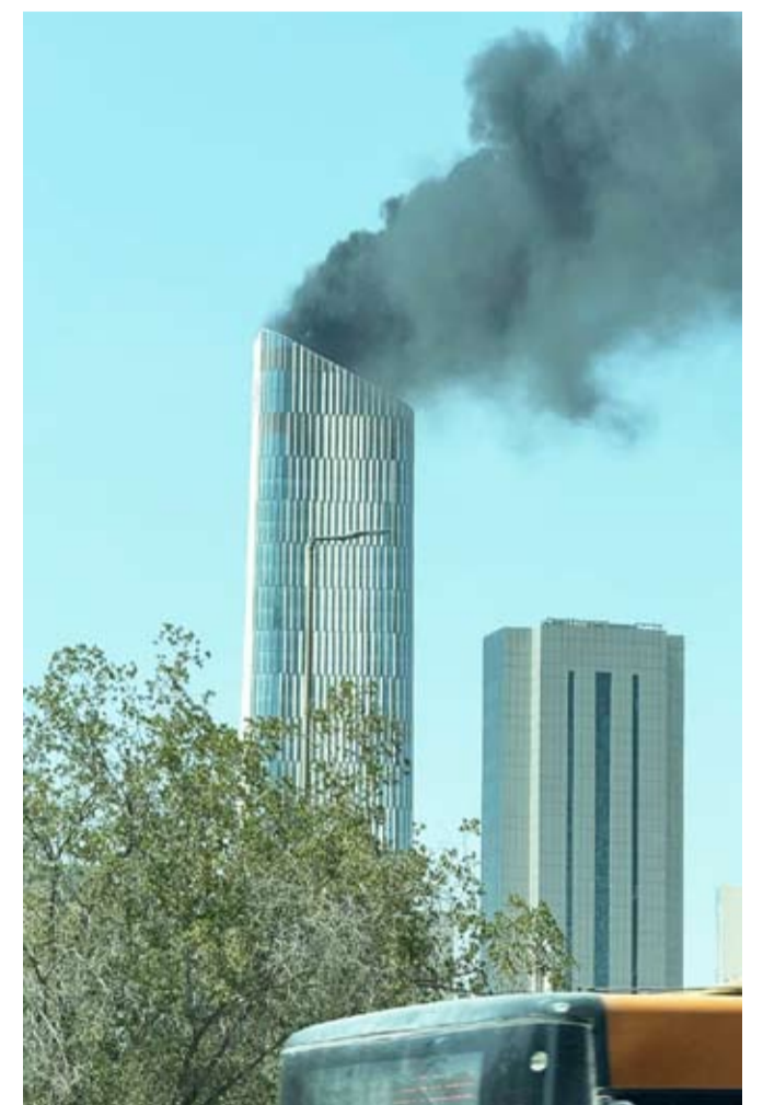
فرق الإطفاء كافحت الحريق وسيطرت عليه دون إصابات

سيطرت فرق إطفاء مركزي الهلال والمدينة ظهر أمس، على حريق في سطح برج قيد التشطيب لمقر «بوبيان» الجديد بمنطقة شرق. وأشارت قوة الإطفاء العام في بيان على حسابها في منصة «إكس»، إلى أن فرقها كافحت الحريق