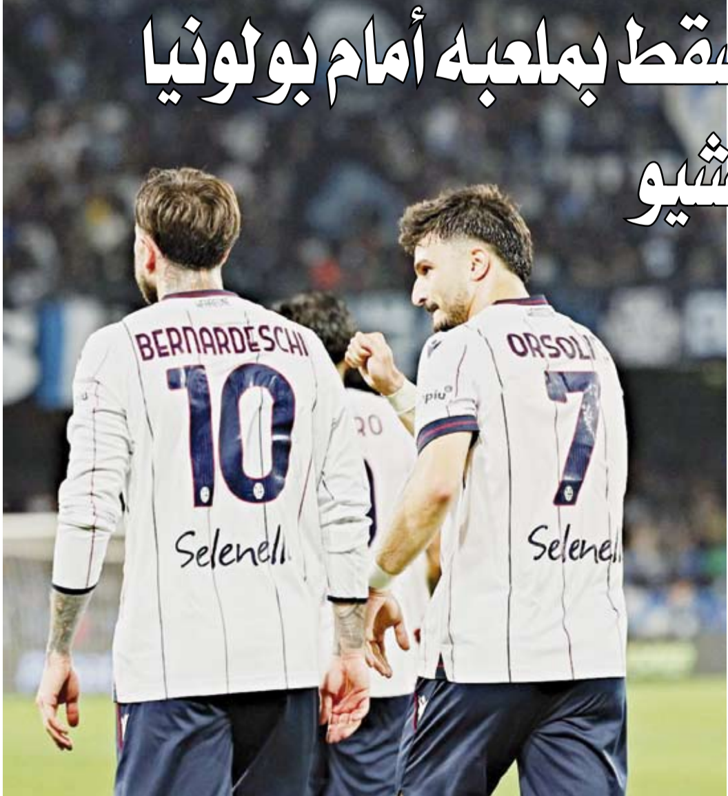
بولونيا يصعق نابولي في عق داره

فاز بولونيا على مضيفه نابولي 2-3، ضمن منافسات الجولة 36 من الدوري الإيطالي لكرة القدم. ورفع بولونيا رصيده إلى 52 نقطة في المركز الثامن، بفارق ست نقاط خلف أتالانتا صاحب المركز السابع.