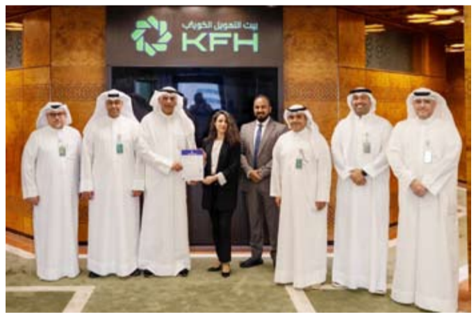
مسئولو بيت التمويل الكويتي والشركة المانحة وتسليم الشهادة