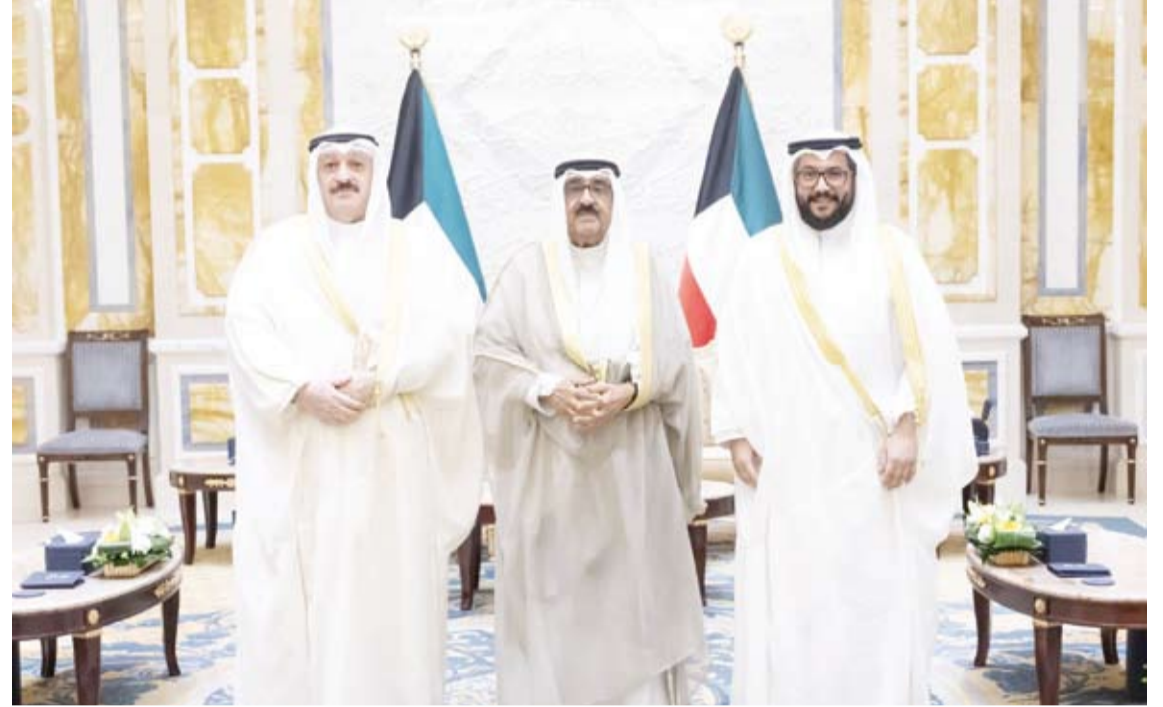
سمو أمير البلاد يستقبل وزير الصحة ووكيل الوزارة

استقبل صاحب السمو أمير البلاد الشيخ مشعل الأحمد، أمس، وزير الصحة الدكتور أحمد العوضي، حيث قدم لسموه، وكيل وزارة الصحة صباح الخالد، أمس، وزير الصحة واستقبل سمو ولي العهد صباح الخالد، أمس، وزير الصحة الدكتور سلمان الصباح، وذلك بمناسبة تعيينه بمنصبه الجديد.