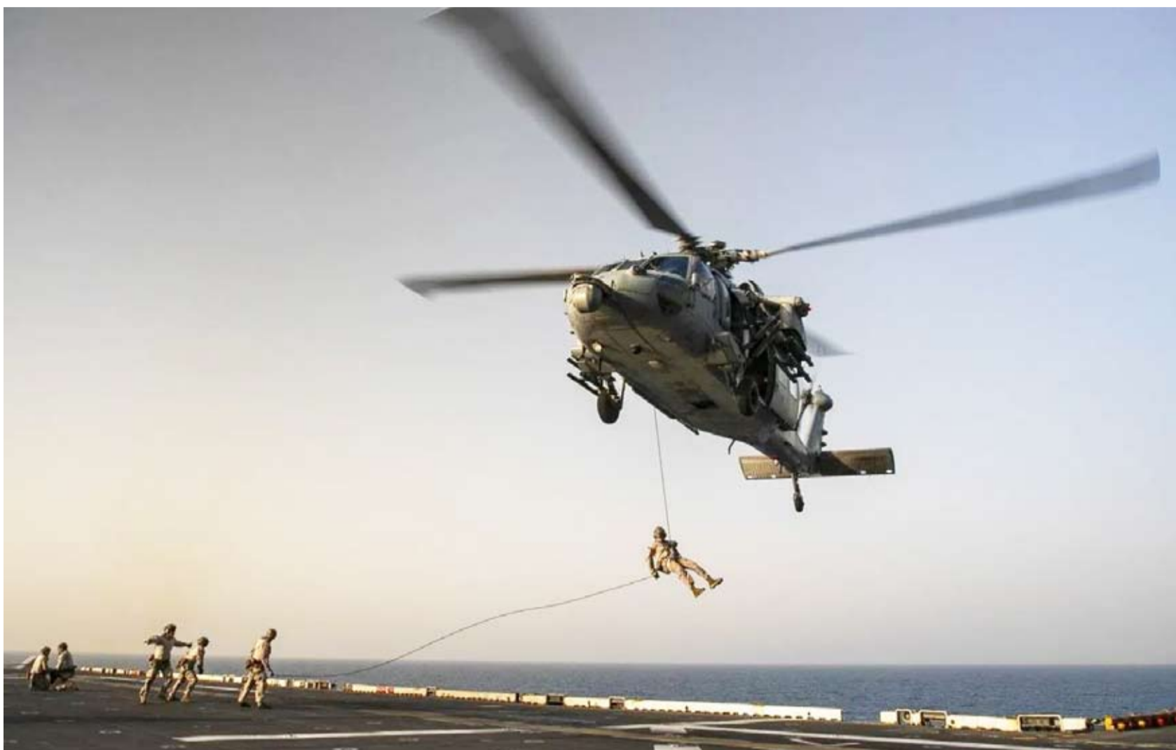
السفينة الهجومية «يو إس إس تريبولي»

قالت طهران إن مطالبها بإنهاء الحرب وإعادة فتح مضيق هرمز تمثل «حقوقاً مشروعة» وليست تنازلات، وذلك غداة رفض الرئيس الأميركي دونالد ترمب ردها على مقترح واشنطن، في تطور عمق المازق الدبلوماسي، وأبقى وقف إطلاق النار هشاً، وسط تصعيد متقطع في مختلف الجبهات.