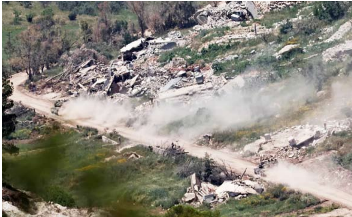
قوة صهيونية تناور في الجانب اللبناني من الحدود

تحولت الهدنة اللبنانية - الإسرائيلية إلى اشتباك يومي مفتوح يتوسع تدريجياً من القرى الحدودية نحو الداخل اللبناني، مع اتساع رقعة الغارات الإسرائيلية وإنذارات الإخلاء لتشمل بلدات تقع شمال الليطاني، وصولاً إلى مشغرة وقلبا في البقاع الغربي شرقاً.