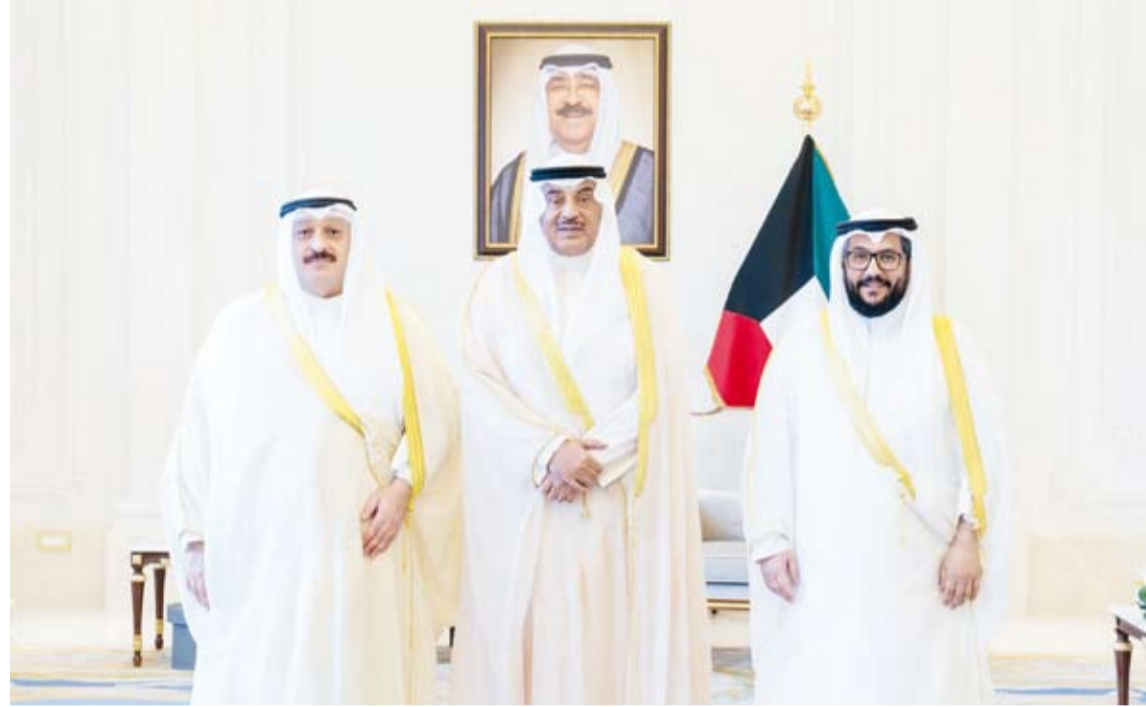
سمو ولي العهد مستقبلاً وزير الصحة ووكيل الوزارة