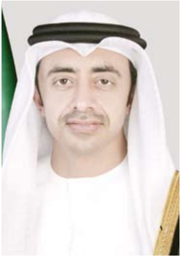
الشيخ عبد الله بن زايد