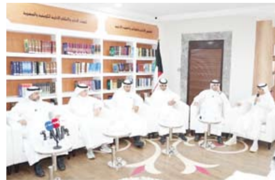
جانب من اللقاء المفتوح

أكدت وزارة العدل الكويتية، أول أمس، الحرص على تطوير الإجراءات ورفع كفاءة العمل في الإدارة العامة للخبراء بما يدعم تحقيق أعلى معايير الجودة والإنجاز ويعزز كفاءة وجودة الخدمات المقدمة.