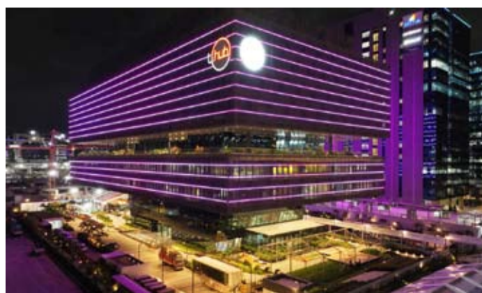
الهند تجتكر 2026 .. إنجازات رسخت مكانة الهند كلاب رئيسي في قطاع الفضاء

الناشئة في مجال التكنولوجيا المتقدمة نسبة كبيرة من منظومة الشركات الناشئة في الهند التي تضم أكثر من 10000 شركة.