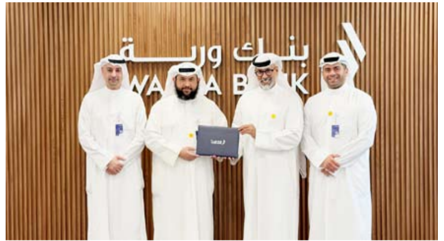
جانب من توقيع مذكرة التفاهم

في خطوة تعكس التزامه المتواصل بدعم مبادرات الاستدامة وترسيخ دور كمشريك فاعل في التنمية البيئية والاجتماعية، أعلن بنك وربة توقيع مذكرة تفاهم مع شركة ايكو لحاضنات الأعمال، بهدف بناء إطار تعاون مشترك يسهم في دعم الشباب والمبدعين في دولة الكويت، وتحويل الأفكار الابتكارية في مجالات البيئة والطاقة المتجددة إلى مشاريع عملية قابلة للنمو والتوسع، بما يعزز من توجه الدولة نحو الاقتصاد الأخضر والتنمية المستدامة.