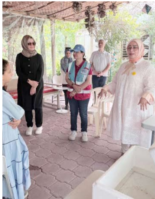
السفيرة التركية تشارك في الفعالية