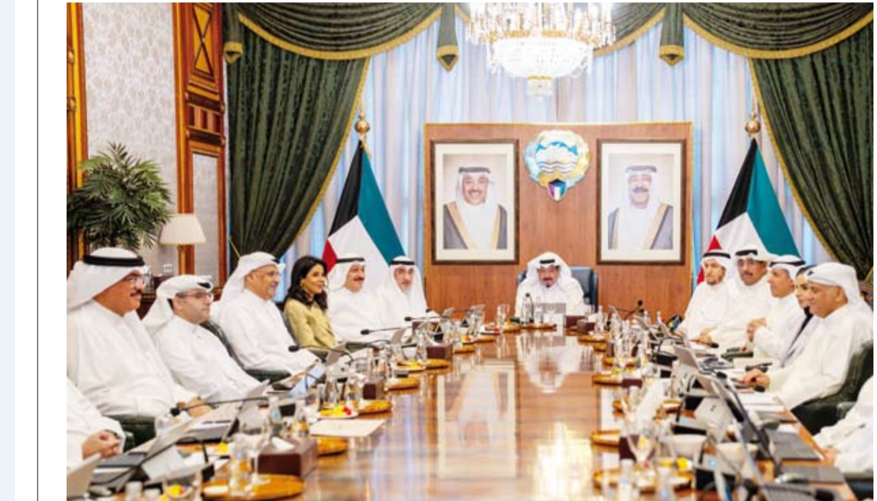
العبدالله يترأس اجتماع المجلس

مؤكداً التزام دولة الكويت التاريخي والناثب بمبادئ حسن الجوار ورفض استخدام أراضيها وأجوائها في شن أي أعمال عدائية ضد أي دولة مندداً على أن الأعمال العدائية التي تشنها إيران على تعد صارخ على سيادة دولة الكويت وانتهاك جسيم للقانون الدولي وميثاق الأمم المتحدة وتحد سافر للإرادة الدولية ولقرار مجلس الأمن رقم (2817) لعام 2026 مؤكداً على تحمل إيران المسؤولية الكاملة عن هذه الأعمال العدائية وعلى احتفاظ دولة الكويت بحقها الكامل والأصيل بالدفاع عن النفس وفقاً للمادة 51 من ميثاق الأمم المتحدة وبتخاذها ما تراه مناسباً من إجراءات للدفاع عن سيادتها وحماية شعبيها والمقيمين على أراضيها بما يتوافق مع القانون الدولي.