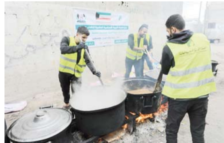
تجهيز الوجبات الغذائية على الأطفال في مخيمات القطاع

الغذائية للمستفيدين على مدار فترة التنفيذ. وأكد حرص الهيئة الخيرية الإسلامية العالمية على استدامة التدخلات الغذائية وتوسيع نطاقها بما يضمن وصول الدعم إلى أكبر شريحة ممكنة من الأسر المتضررة ووفق آليات منظمة تراعي الاحتياج الفعلي وتحقق أثر إنساني مستداماً للأسر الفلسطينية.