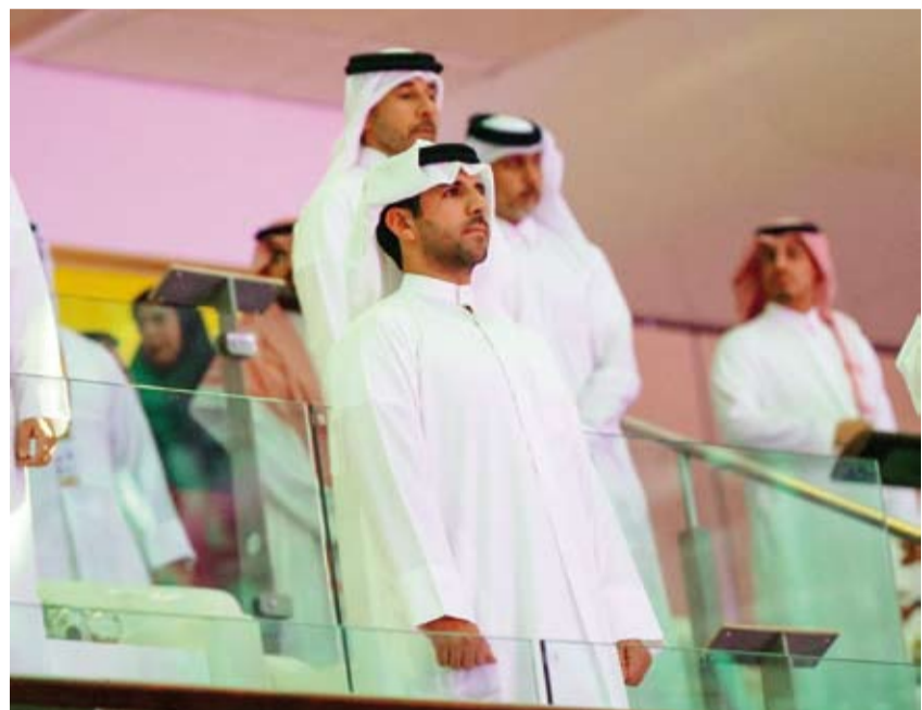
رئيس اللجنة الأولمبية الكويتية الشيخ فهد ناصر الصباح