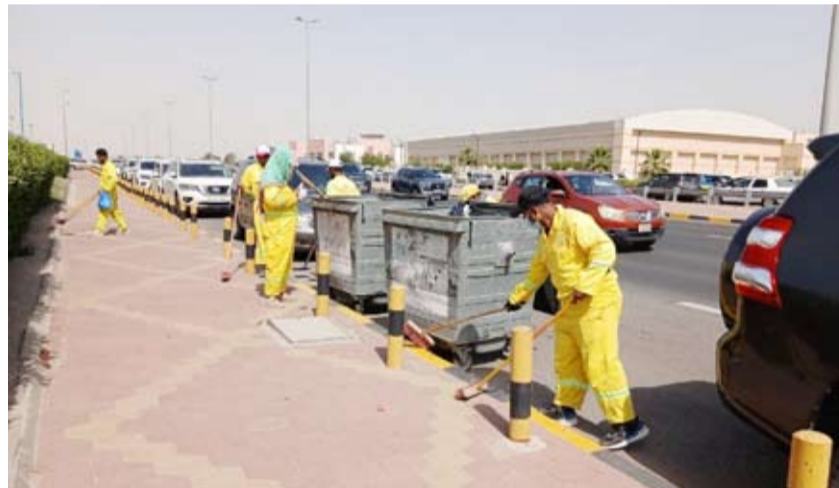
تنظيف مواقف ستاد جابر