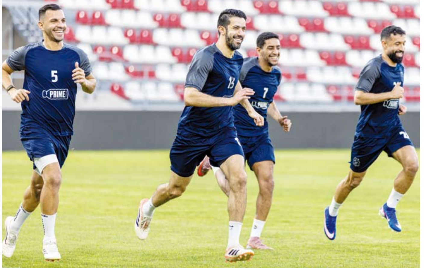
تغاول في صفوف الأبيض الكويتي لانتزاع لقب التحدي الآسيوي