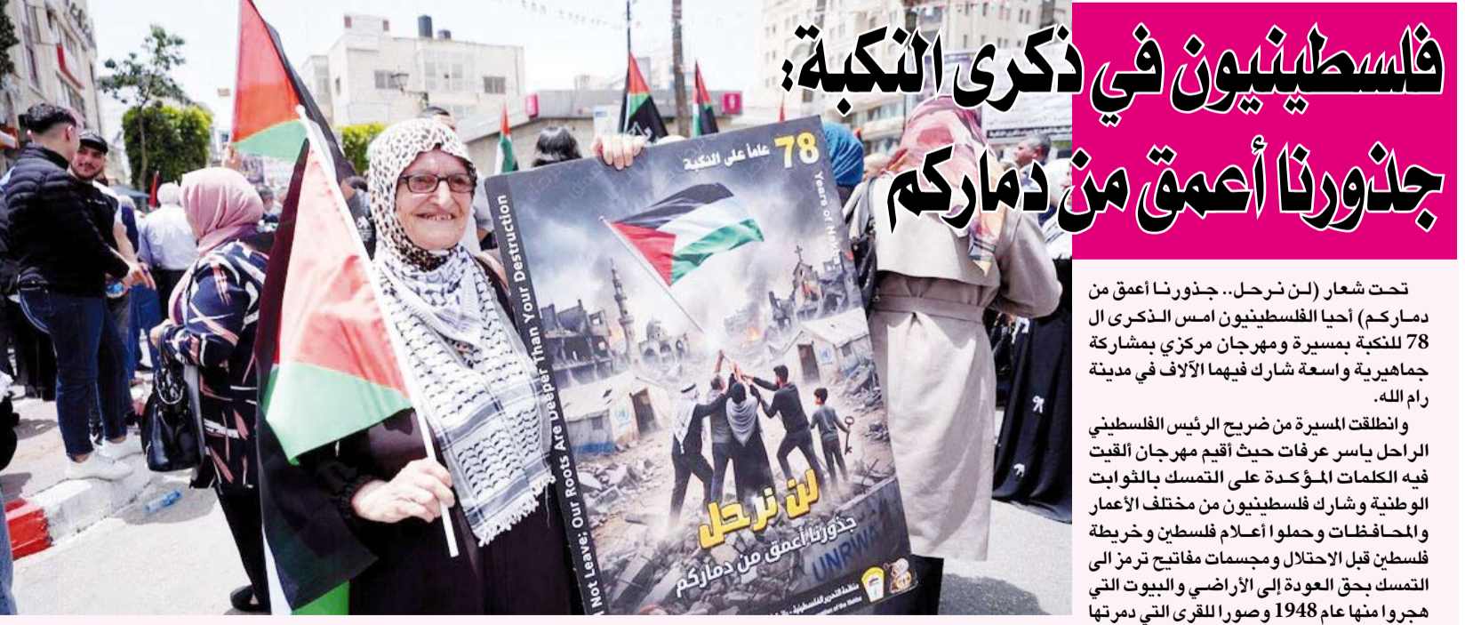
آلاف الفلسطينيين شاركوا أمس في الذكرى 78 للنكبة

أعلنت مؤسسة عبدالعزيز سعود البابطين الثقافية، بالتعاون مع البرلمان العربي، أسماء الفائزين بالدورة الثانية من جائزة (عبد العزيز سعود البابطين للإبداع في خدمة اللغة العربية) وكان محور هذا العام (تعليم اللغة العربية للناطقين بغيرها) بوصفه أحد أهم مسارات الاستثمار الثقافي في تعزيز حضور اللغة العربية عالمياً. وقال رئيس مجلس أمناء المؤسسة، سعود البابطين ل (كويتا) أمس: إن الجائزة تمثل ركيزة استراتيجية ضمن مشروع المؤسسة لدعم اللغة العربية، مضيفاً أن التركيز على تعليم العربية لغير الناطقين بها لم يعد خياراً ثقافياً بل ضرورة حضارية تفرضها التحولات العالمية المتسارعة. وأوضح البابطين أن المؤسسة تراهن على بناء منظومة معرفية متكاملة تعزز كفاءة تعليم اللغة العربية وفق أحدث الممارسات العالمية وتسهم في تخريج أجيال قادرة على التواصل الحضاري بلغتنا العربية، مؤكداً أن الشراكة مع البرلمان العربي تعكس نموذجاً متقدماً للعمل المؤسسي المشترك في خدمة الهوية الثقافية العربية وتعزيز حضورها دولياً.