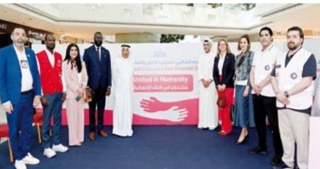
جانب من المشاركين في الفعالية

أطلقت جمعية الهمال الأحمر الكويتي، أمس، فعالية (متحدون في كنف الإنسانية) في مجمع الأفيون بمناسبة اليوم العالمي للصليب الأحمر والهمال الأحمر تأكيداً على أهمية التضامن الإنساني وتعزيز قيم العمل التطوعي. وقال رئيس مجلس إدارة الجمعية خالد المغاسم (كونا): إن الاحتفاء بهذه المناسبة الإنسانية من شأنه أن يسلط الضوء على الدور الحيوي الذي