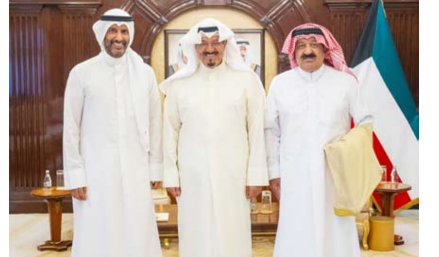
سمو رئيس الوزراء مستقبلاً اليوسف والغانم

استقبل سمو الشيخ أحمد العبدالله رئيس مجلس الوزراء أمس وزير الدولة لشؤون الشباب والرياضة الدكتور طارق الجلاهية ورئيس مجلس إدارة الاتحاد الكويتي لكرة القدم الشيخ أحمد اليوسف ورئيس مجلس إدارة نادي الكويت الرياضي خالد الغانم حيث قدموا لسموه دعوة لحضور نهائي كأس التحدي الآسيوي لكرة القدم بين فريق نادي الكويت الرياضي وفريق سفاي رينغ الكمبودي المقرر إقامتها على استاد جابر الأحمد الدولي.