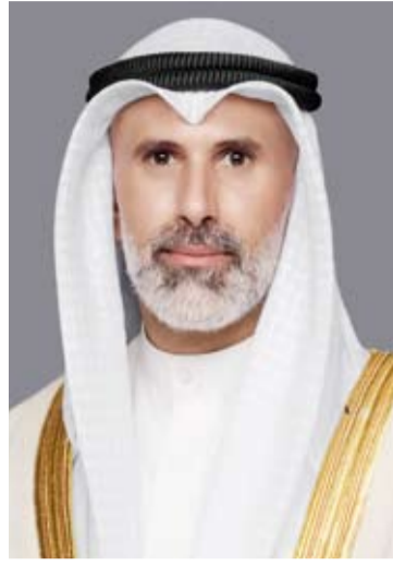
الشيخ جراح الجابر