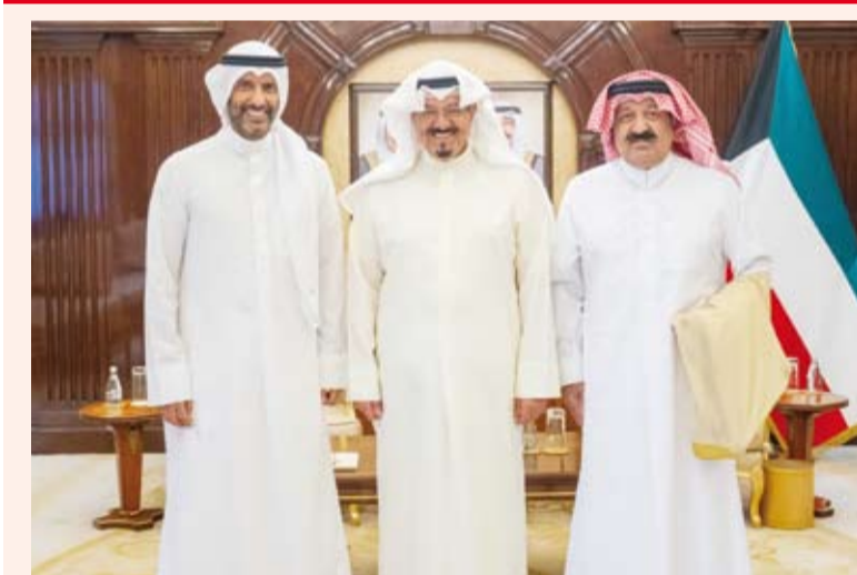
العيدالله خلال استقباله اليوسف والغانم

استقبل سمو الشيخ أحمد عبدالله الأحمد الصباح رئيس مجلس الوزراء وزير الدولة لشؤون الشباب والرياضة الدكتور طارق حمد الجاهمة ورئيس مجلس إدارة الاتحاد الكويتي لكرة القدم الشيخ أحمد اليوسف الصباح ورئيس مجلس إدارة نادي الكويت الرياضي خالد علي الغانم حيث قدموا لسموه دعوة لحضور نهائي كأس التحدي الآسيوي لكرة القدم بين فريق نادي الكويت الرياضي وفريق سفاي رينغ الكمبودي المقرر اقامتها على استاد جابر الأحمد الدولي.