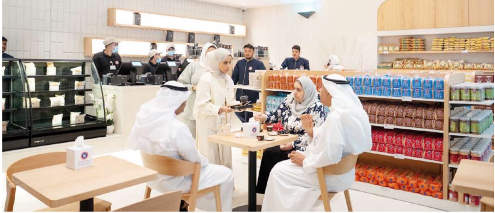
جانب من افتتاح منفذ بيع جديد للمطاحن في مجمع الوزارات

بيعت في مجمع الوزارات الحكومي يأتي بدافع حرصها على التواجد بمختلف المناطق في البلاد لتأدية المهام المطلوبة منها مشيراً إلى امتلاكها الامكانيات والمقومات المطلوبة لتحقيق ذلك لما تتميز به من تنوع في المنتجات المقدمة للمستهلك. استمرار لحظة وزارة المالية وهي الوزارة المسؤولة عن مجمع الوزارات لاستقطاب أفضل الشركات للمأكولات والخموات المتميزة ذات الجودة العالية بدافع حرصها لتلبية احتياجات الموظفين والمراجعين.