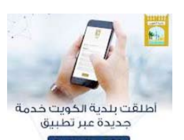
أطلقت بلدية الكويت خدمة جديدة عبر تطبيق Baladia 139

تستغرق 72 ساعة حداً أقصى. وبين أن البلدية حرصت على أن تكون طريقة التقديم في التطبيق سهلة وسريعة إذ يتولى المستخدم اختيار نوع الشكاوى ثم أخذ صورة المخالفة وموقعها وبعد المعالجة يصل للمستخدم تنبيه مرفق بصورة للموقع بعد الانتهاء. وذكر أن التطبيق يهدف أيضاً إلى تفعيل الدور الرقابي لمفتشي ومراقبي البلدية كما يتولى قياس أداء الموظفين من خلال سرعة تعاملهم مع الشكاوى مبيناً أن لدى كل مدير إدارة ومدير فرع لوحة تحكم (داش بورد) يسمح له من خلالها بمتابعة سرعة الإنجاز علاوة على رصد إحصائية شهرية بنوع كل بلاغ والوقت المنجز لإنهائها.