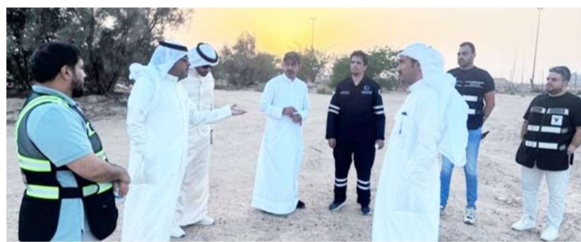
وكيل الأشغال أثناء زيارته لمدينة صباح الأحمد

أعمدة مباشرة فيها، مما أدى إلى إتلاف الطبقات الجديدة واضعاف كفاءتها والتأثير سلباً على جودتها، ونود التنويه بأن هذه الممارسات وإن كانت محدودة حتى الآن، فإن استمرارها قد يترتب عليه أضرار أكبر مستقبلاً، الأمر الذي يشكل هدراً للمال العام