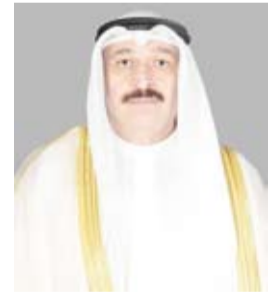
وزير الصحة د. أحمد العوضي

الأدوية وصرها وتسييرها إلى جانب تنظيم الإعلانات وخدمات التوصيل بما يضمن ممارسات مهنية آمنة وشفافة ومسؤولة.