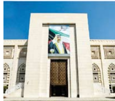
أعربت وزارة الخارجية، أمس، عن تعاطف دولة الكويت ومواساتها لدولة قطر الشقيقة لوفاة ثلاثة من منتسبي الديوان الأميري القطري وإصابة آخرين إثر حادث مروري أليم وقع في مدينة شرم الشيخ بجمهورية مصر العربية أثناء أداءهم مهام عملهم.

أعربت وزارة الخارجية، أمس، عن تعاطف دولة الكويت ومواساتها لدولة قطر الشقيقة لوفاة ثلاثة من منتسبي الديوان الأميري القطري وإصابة آخرين إثر حادث مروري أليم وقع في مدينة شرم الشيخ بجمهورية مصر العربية أثناء أداءهم مهام عملهم. وقالت (الخارجية) في بيان صحفي: تتقدم دولة الكويت بخالص التعازي وصادق المواساة إلى الأشقاء في دولة قطر قيادة وحكومة وشعباً بهذا المصاب الجليل، سائلين المولى عز وجل أن يتغمد المتوفين بواسع رحمته ويستكنهم فسيح جناته وأن يمن على الصابين بالشفاء العاجل. من جهة أخرى، أعربت وزارة الخارجية، أمس، عن قلق دولة الكويت البالغ حيال التصعيد والاشتباكات المسلحة التي شهدتها المناطق الحدودية بين جمهورية باكستان الإسلامية وأفغانستان والتي قد تتسبب سلباً على الأمن والسلم في المنطقة. وذكرت (الخارجية) في بيان لها، أن دولة