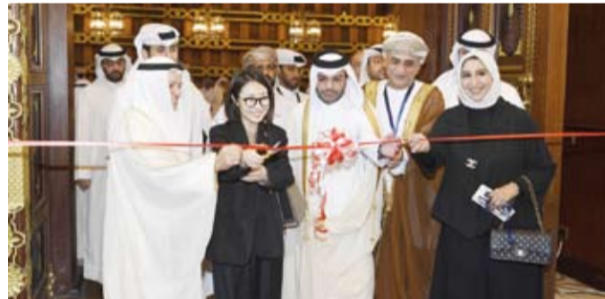
افتتاح المنتدى الدولي للذكاء الاصطناعي والرقمنة والمؤتمر الخليجي لإدارة الأرشفة والوثائق والمحفوظات