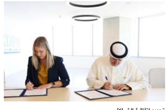
تجديد اتفاقية الشراكة