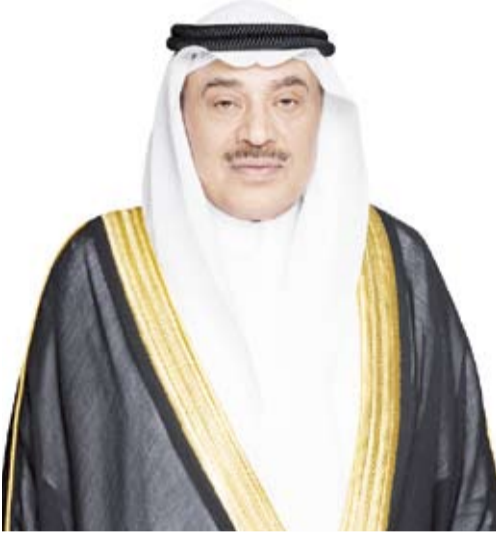
سمو ولي العهد الشيخ صباح الخالد

استقبل سمو ولي العهد الشيخ صباح الخالد، بقصر بيان، صباح أمس، سمو الشيخ أحمد العبدالله رئيس مجلس الوزراء. كما استقبل سمو ولي العهد رئيس الحرس الوطني الشيخ مبارك الحمود، كما استقبل سمو، النائب الأول لرئيس مجلس الوزراء وزير الداخلية الشيخ فهد اليوسف. من جهة أخرى، بعث صاحب السمو أمير البلاد الشيخ مشعل الأحمد، ببرقية تعزية إلى أخيه صاحب السمو الشيخ تميم بن حمد آل ثاني أمير دولة قطر الشقيقة، عبر فيها سموه عن خالص تعازيه وصادق مواساته بضحايا الحادث المروري المؤسف، الذي وقع في مدينة شرم الشيخ بجمهورية مصر العربية. من منسبي الديوان الأميري أثناء أداء مهام عملهم. سائلاً سموه، المولى تعالى، أن يتغمد الضحايا بواسع رحمته ومغفرته ويستكنهم فسيح جناته وأن يلهم ذويهم جميل الصبر وحسن العزاء ويمن على المصابين بسرعة الشفاء والعافية.