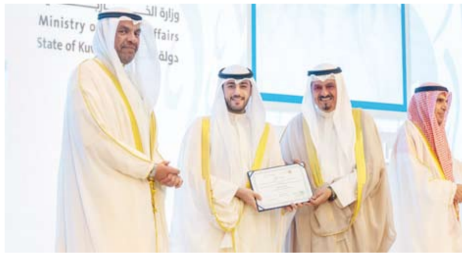
العبدالله يكرم أحد الخريجين

تخرجه اليوم، يمثل الإنطلاقة لخدمة الوطن ومصالحه متعدداً هو وزملاؤه الخريجون بتقديم أفضل ما يملكونه من قدرات وامكانيات للوصول إلى هذه الغاية وتحقيق هذا الهدف الأسمى. وفي ختام الحفل، قام سمو رئيس مجلس الوزراء بتكريم الدفعتين التدريبيتين العاشرة والحادية عشرة 2024 / 2025 من برنامج (طموح) في معهد سعود الناصر الصباح الدبلوماسي الكويتي.