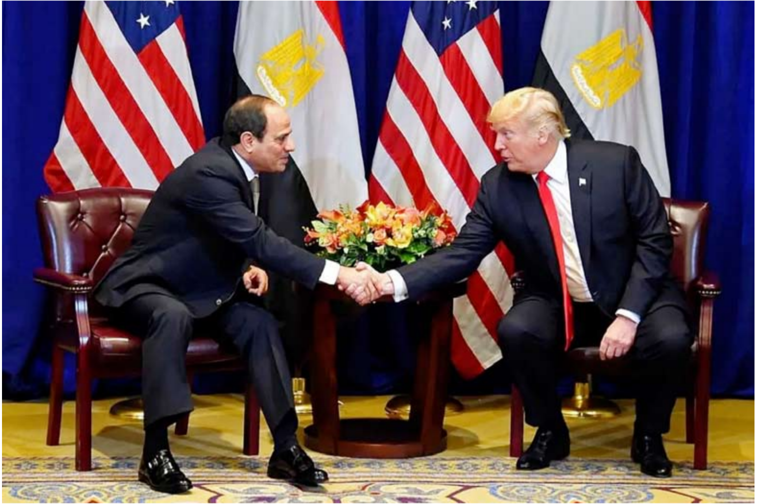
الرئيس ترامب ونظيره المصري

وقال وزير الدفاع الإسرائيلي يسرائيل كاتس، إن التحدي الرئيسي لإسرائيل بعد عودة الرهائن سيكون التأكد من تدمير جميع أنفاق حركة «حماس» في قطاع غزة؛ إما بصورة مباشرة، أو عبر الألية الدولية التي أنشئت تحت قيادة الولايات المتحدة. وأضاف وزير الدفاع الإسرائيلي أن «هذا هو الهدف الأساسي من تنفيذ المبدأ المتفق عليه لنزع السلاح من غزة ونزع سلاح (حماس)». وقال إن «التحدي الكبير لإسرائيل بعد مرحلة استعادة الرهائن سيكون تدمير كل الأنفاق الإرهابية لـ (حماس) في غزة»، مضيفاً أنه أصدر تعليمات للجيش بالاستعداد لتنفيذ هذه المهمة. وأكد مسؤول في حركة «حماس» أن مطلب نزع سلاح الفصائل الفلسطينية الذي جاء في خطة الرئيس الأميركي دونالد ترامب للسلام في غزة «خارج النقاش».