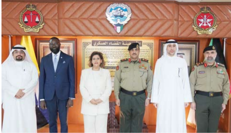
السفيرة الشبيخة جواهر الصباح واللواء حقوقي عويد محمد الهطلاني وبعض المشاركين

حضور نائب رئيس الأركان العامة للجيش اللواء الركن طيار صباح الجابر الأحمد الصباح، افتتحت صباح أمس الدورة التدريبية (القانون الدولي الإنساني) بهيئة القضاء العسكري والتي تُعقد خلال الفترة من 12 ولغاية 16 أكتوبر 2025 بالتعاون مع اللجنة الدولية للصليب الأحمر.