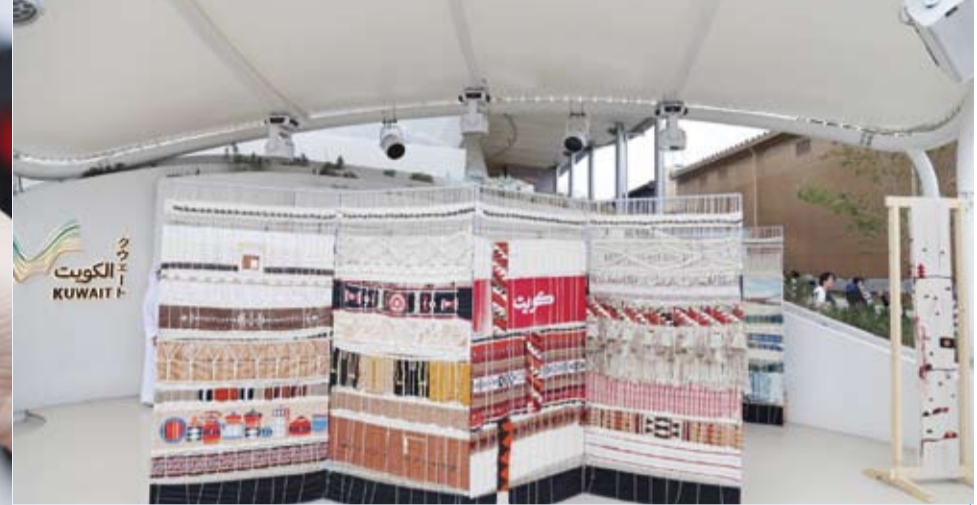
جانب من العرض الحي لجمعية السدو

العالمي بقيمة السدو كفن تراثي أصيل يجمع بين الجمال والوظيفة وإبراز جهود الكويت في صنوف الحرف التقليدية ودعم التمكين الاقتصادي للنساء الحرفيات من خلال التدريب والإنتاج والتسويق المستدام. وأوضحت أن مشاركة جمعية السدو تمت بحضور كل من الرئيسة الفخرية لجمعية السدو الحرفية الشيخة الطاف سالم العلي والمدير العام للجمعية الشيخة بيبى الصباح، اللتين أكدتا أهمية حضور السدو في المحافل الدولية باعتباره سفيرا للتراث الكويتي ورسالة تواصل ثقافي بين الشعوب. وأكدت أن مشاركة (جمعية السدو) في (إكسبو أوساكا 2025) تأتي ضمن جهودها المستمرة للتعريف بالحرف الكويتية وتبادل الخبرات مع المجتمعات الدولية بما يعزز مكانة الكويت كدولة رائدة في المحافظة على التراث الثقافي والحرف اليدوية التقليدية.