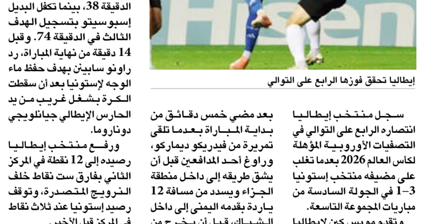
إيطاليا تحقق فوزها الرابع على التوالي