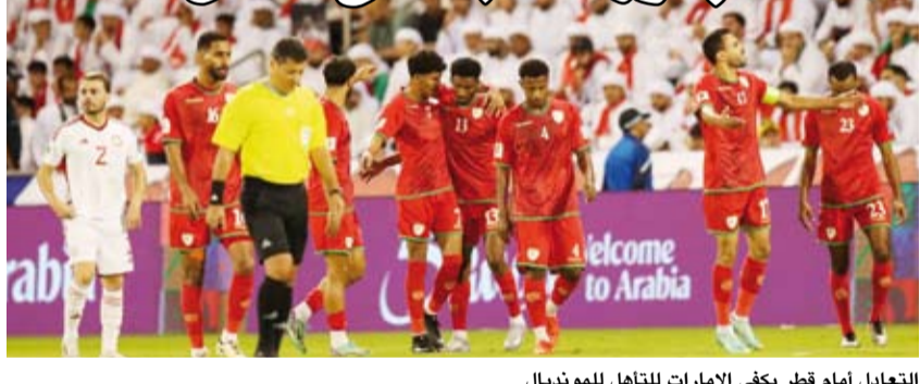
التعادل أمام قطر يكفي الإمارات للتأهل للمونديال

قلب منتخب الإمارات الطاولة على نظيره العماني وهزمه بنتيجة هدفين مقابل هدف ضمن منافسات الدور الرابع من التصفيات الآسيوية المؤهلة لكأس العالم 2026 لكرة القدم بالولايات المتحدة وكندا والمكسيك. وانتهى المنتخب العماني الشوط الأول متقدماً بهدف واحد بعد التعادل السلبي أمام قطر في الجولة الأولى، ليتراجع للمركز الثالث، بأمل فوز الإمارات بنتيجة كبيرة على قطر لانتزاع المركز الثاني والتأهل إلى الملحق العالمي بين القارات في الدور الخامس والأخير من التصفيات.