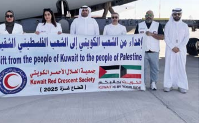
الجهات الرسمية المشاركة بالرحلة الإغاثية الـ 19

بتقديم المساعدة للأشقاء الفلسطينيين في القطاع. وأضاف أن هذه الجهود المستمرة تعكس حرص الكويت على الوقوف إلى جانب الأشقاء ودعم القضايا الإنسانية العادلة في كل مكان، كما تعكس مكانة الكويت باعتبارها مركزاً للعمل الإنساني. وأعرب عن الشكر للمجميات الخيرية الكويتية المشاركة في تجهيز شحنات المساعدات لصلحة أهالي «غزة» وكذلك لسفارة دولة الكويت لدى مصر وجمعية الهلال الأحمر المصري على استقبال المساعدات في مطار العريش وضمأن وصولها بسرعة إلى المتكوبين بغزة. يذكر أن جمعية الهلال الأحمر (الكويت) تولت تجهيز المساعدات الإنسانية في الرحلة المقدمة من (جمعية فضاء الأعمال الإنسانية) وتأتي مكملة لعملها في تجهيز مساعدات سابقة بلغت حتى الآن 19 طائرة موزعة على 4 طائرات إلى الأردن و15 طائرة إلى مصر.