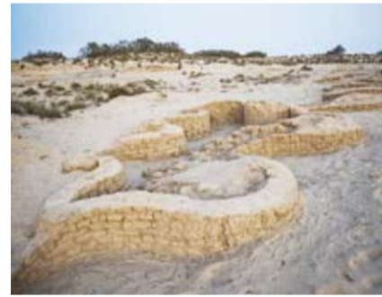
قلعة عسكرية من عصر الدولة الحديثة

أعلنت وزارة السياحة والآثار المصرية، أول أمس، الكشف عن قلعة عسكرية من عصر الدولة الحديثة بالقرب من ساحل البحر الأبيض المتوسط شمال شبه جزيرة سيناء شمالي شرق مصر. وأوضحت الوزارة، أن هذا الكشف يعود للبعثة الأثرية المصرية العاملة بموقع تل الخروبة الأثري، لافتة إلى أن هذه القلعة تعد واحدة من أكبر وأهم القلاع المكتشفة على طريق حورس الحربي، حيث تبلغ مساحتها نحو 8000 متر مربع، أي ما يعادل ثلاثة أضعاف مساحة القلعة التي تم اكتشافها بالموقع نفسه في ثمانينيات القرن الماضي، والتي تقع على بعد نحو 700 متر جنوب غرب القلعة الحالية. وأشار البيان إلى أن الكشف تضمن جزءاً من سور جنوبي القلعة بطول نحو 105 أمتار وعرض 2.5 متر، يتوسطه مدخل فرعي بعرض 2.20 متر، بالإضافة إلى أحد عشر برجاً دفاعياً تم الكشف عنها حتى الآن.