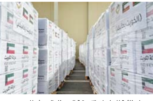
وصول طائرة المساعدات الكويتية إلى مطار العريش المصري

بتقديم المساعدة للأشقاء الفلسطينيين في القطاع. وأضاف أن هذه الجهود المستمرة تعكس حرص الكويت على الوقوف إلى جانب الأشقاء ودعم القضايا الإنسانية العادلة في كل مكان، كما تعكس مكانة الكويت باعتبارها مركزاً للعمل الإنساني. وأعرب عن الشكر للمجميات الخيرية الكويتية المشاركة في تجهيز شحنات المساعدات لصلحة أهالي «غزة» وكذلك لسفارة دولة الكويت لدى مصر وجمعية الهلال الأحمر المصري على استقبال المساعدات في مطار العريش وضمأن وصولها بسرعة إلى المتكوبين بغزة. يذكر أن جمعية الهلال الأحمر (الكويت) تولت تجهيز المساعدات الإنسانية في الرحلة المقدمة من (جمعية فضاء الأعمال الإنسانية) وتأتي مكملة لعملها في تجهيز مساعدات سابقة بلغت حتى الآن 19 طائرة موزعة على 4 طائرات إلى الأردن و15 طائرة إلى مصر.