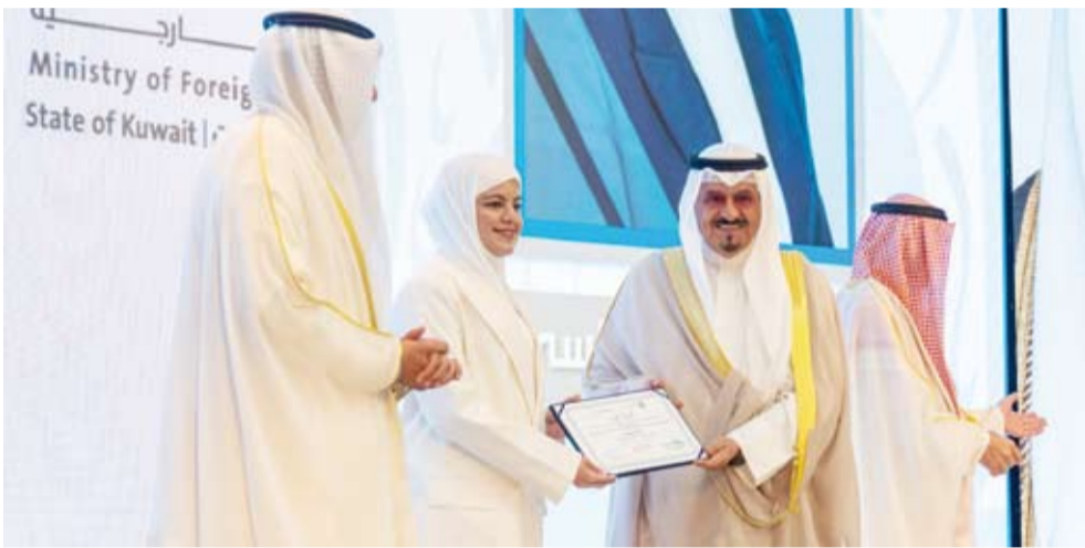
سموه يكرم إحدى الخريجات

«الخارجية» تواصل أداء رسالتها النبيلة في تمثيل البلاد والعمل على تعزيز علاقاتها مع دول العالم