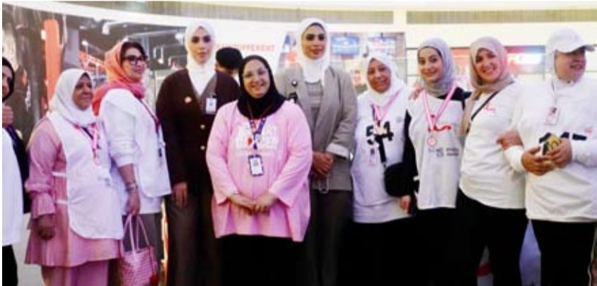
جانب من المشاركات