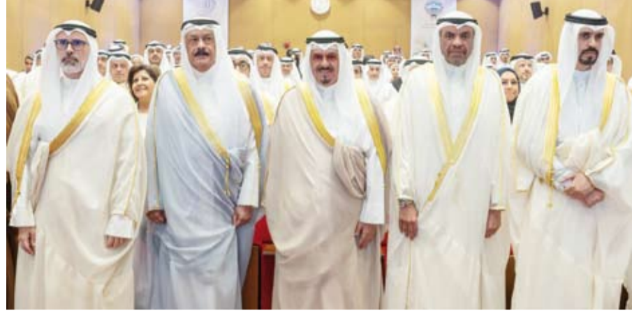
سمو الشيخ أحمد العبدالله رئيس مجلس الوزراء يتقدم الحضور

تحت رعاية وحضور سمو الشيخ أحمد العبدالله رئيس مجلس الوزراء، أقيم أمس، حفل تخرج برنامج (طموح) للمتقنين الجدد في وزارة الخارجية للدفعتين التدريبيتين العاشرة والحادية عشرة 2024 / 2025 في معهد سعود الناصر الصباح الدبلوماسي الكويتي. وحضر الحفل رئيس ديوان رئيس مجلس الوزراء عبدالعزیز الدخيل، ووزير الخارجية رئيس مجلس إدارة معهد سعود الناصر الصباح الدبلوماسي الكويتي، عبدالله الجحيا، ومدير عام هيئة تشجيع الاستثمار المباشر الشيخ الدكتور مشعل جابر الأحمد وعدد من كبار المسؤولين في الدولة وديوان رئيس مجلس الوزراء ووزارة الخارجية.