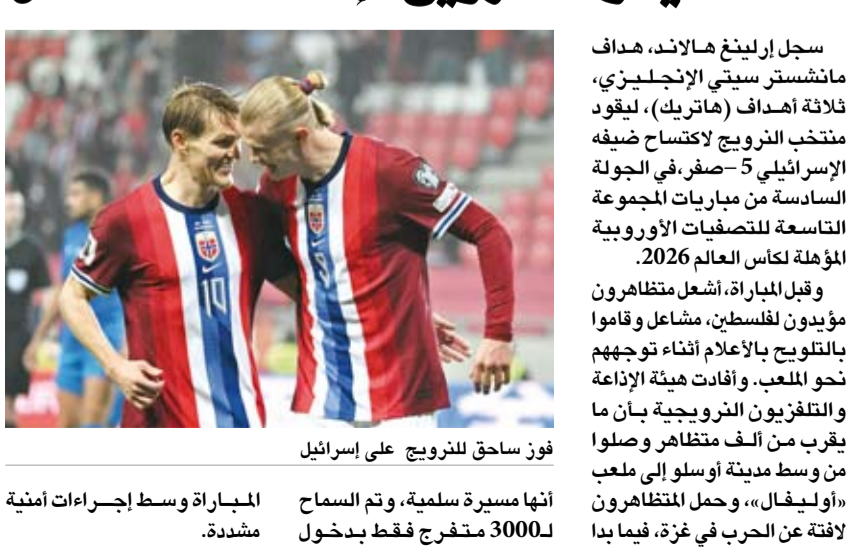
فوز ساحق للنرويج على إسرائيل

سجل إرلينغ هالاند، هداف مانشستر سيتي الإنجليزي، ثلاثة أهداف (هاتريك)، ليقود منتخب النرويج لاكتساح ضيفه الإسرائيلي 5-0، صفر، في الجولة السادسة من مباريات المجموعة التاسعة للتصفيات الأوروبية المؤهلة لكأس العالم 2026. وقبل المباراة، أشعل متظاهرون مؤيدون للفلسطين، مشاعل وقاموا بالتلويح بالأعلام أثناء توجههم نحو الملعب، وأفادت هيئة الإذاعة والتلفزيون النرويجية بأن ما يقرب من ألف متظاهر وصلوا من وسط مدينة أوسلو إلى ملعب «أوليفال»، وحمل المتظاهرون لافتة عن الحرب في غزة، فيما بدا