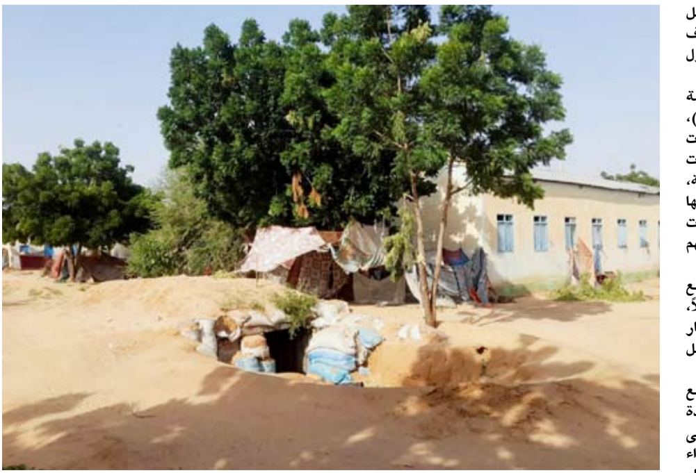
ملجأ تحت الأرض يحتمي فيه النازحون

أوقعت مجزرة داخل أحد مخيمات النازحين في مدينة الفاشر، عاصمة ولاية شمال دارفور، عشرات القتلى والجرحى، وتدمير منازل حرقاً يسكنها. وقالت «تنسيقية لجان مقاومة الفاشر»، (مجموعة حقوقية محلية)، أمس، إن طائرات مسيرة تابعة لقوات الدعم السريع» غارت بمسيرات مدفعية حارقة، استهدفت عدداً من المواقع من بينها مركز إيواء المدنيين النازحين، وقتلت العشرات منهم، لا تزال جثث بعضهم تحت الأنقاض. وأضاف، في بيان على موقع «فيسبوك»، «أنه تم إحصاء 60 قتيلًا، بينهم نساء وأطفال ورجال من كبار السن لقوا حتفهم حرقاً واختناقاً داخل مساكنهم المدمرة، مشيرة إلى أن جثث بعضهم لا تزال تحت الأنقاض. وذكر البيان أن الوضع في الفاشر فاق حد الكارثة والإبادة الجماعية، وأن مئات القتلى والجرحى سقطوا جراء القصف المدفعي العشوائي خلال الأيام القليلة الماضية.