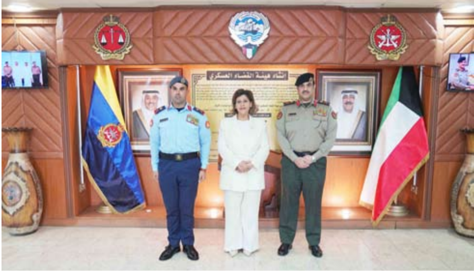
النائب الركن طيار صباح الجابر والسفيرة الشبيخة جواهر الصباح واللواء حقوقي عويد محمد الهطلاني