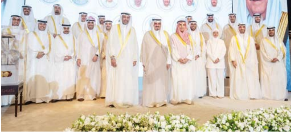
سمو رئيس مجلس الوزراء في لقطة جماعية مع الخريجين