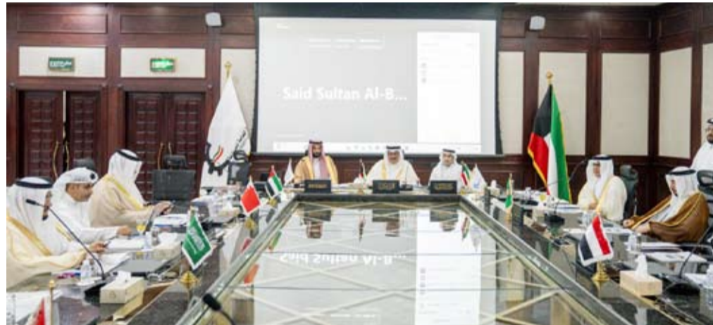
جانب من الحضور في الاجتماع

وأوضح أن القرارات التي سيتم اتخاذها خلال هذا الاجتماع ستشكل خريطة طريق للمرحلة المقبلة بما يضمن توافق معايير المركز مع أفضل الممارسات الدولية وبما يسهم في تعزيز تنافسية اقتصادات دول مجلس التعاون الخليجي. وأكد أن الهيئة تتطلع إلى نقاشات أعضاء مجلس الإدارة وتوجيهاتهم التي ستدعم جهود المركز في تقديم خدمات اعتماد بمعايير عالمية متقدمة. وتمن الجبدي جهود أعضاء مجلس الإدارة على التنظيم معرباً عن تطلعاته في أن يثمر الاجتماع قرارات ناجحة.