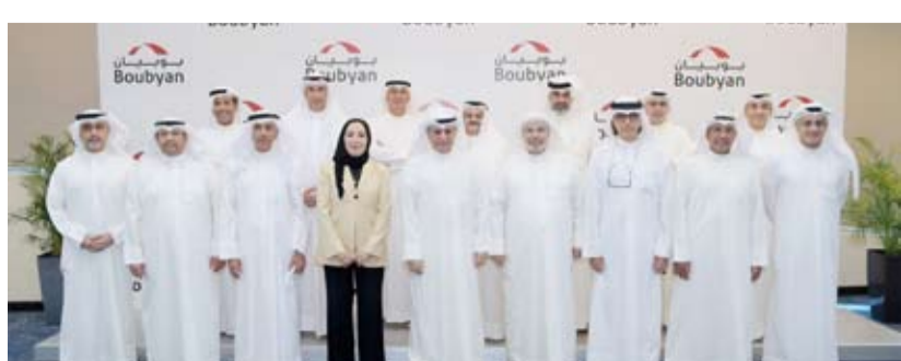
أعضاء مجلس الإدارة مع العضوين المكرمين

الأثر الأكبر في ترسيخ مكانة بنك بويان وتعزيز ثقة عملائه وشركائه، وهو ما انعكس في النتائج المحيطة التي حققها البنك على مختلف المستويات. وأشار إلى أن هذا التكريم يجسد القيم المؤسسية التي يحرص بنك بويان على ترسيخها، مؤكداً أن ما تحقق من إنجازات لم يكن ليرى النور إلا بتكامل أدوار القادات، واستمرارية تطوير القدرات المؤسسية في مراحل مختلفة من رحلة النجاح، والسعي الدائم نحو تحقيق نمو مستدام يليق بتاريخ البنك ومستقبله.