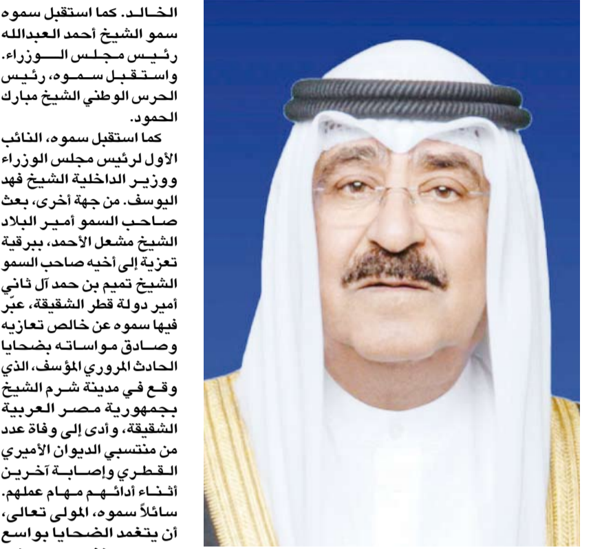
سمو أمير البلاد الشيخ مشعل الأحمد استقبل صاحب السمو أمير بقصر بيان، صباح أمس، البلاد الشيخ مشعل الأحمد، سمو ولي العهد الشيخ صباح