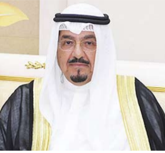
سمو الشيخ أحمد العبد الله

بعث سمو الشيخ أحمد العبدالله رئيس مجلس الوزراء، ببرقية تعزية إلى صاحب السمو الشيخ تميم بن حمد آل ثاني أمير دولة قطر الشقيقة، ضمنها سموه خالص تعازيه وصادق مواساته بضحايا الحادث المروري المؤسف الذي وقع في مدينة شرم الشيخ بجمهورية مصر العربية والشقيقة وأدى إلى وفاة عدد من منتسبي الديوان الأميري القطري وإصابة آخرين أثناء أداءهم مهام عملهم. من جهة أخرى، بعث سمو الشيخ أحمد العبدالله رئيس مجلس الوزراء، ببرقية تهنئة إلى الرئيس تيودور أوبايانغ نغويما مباسوغو رئيس جمهورية غينيا الاستوائية العبدالله رئيس مجلس الوزراء، ببرقية تهنئة إلى الرئيس تياواكيكولاتي لالابالافو رئيس جمهورية غينيا الاستوائية العبدالله رئيس مجلس الوزراء، ببرقية تهنئة إلى الرئيس تياواكيكولاتي لالابالافو رئيس جمهورية غينيا الاستوائية ببرقية تهنئة إلى صاحب الجلالة الملك فيليب السادس ملك مملكة إسبانيا الصديقة بمناسبة ذكرى العيد الوطني لبلاده.