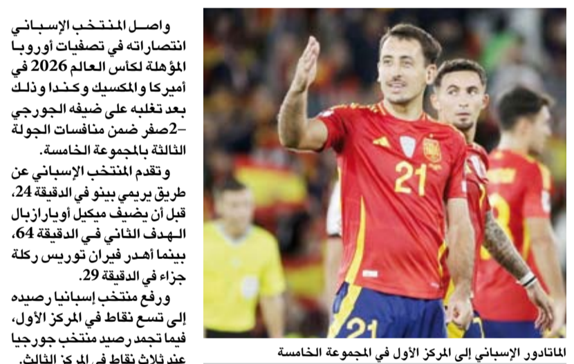
الماتادور الإسباني إلى المركز الأول في المجموعة الخامسة

واصل المنتخب الإسباني انتصاراته في تصفيات أوروبا المؤهلة لكأس العالم 2026 في أميركا والمكسيك وكندا وذلك بعد تغلبه على ضيفه الجورجي 2-0 ضمن منافسات الجولة الثالثة بالمجموعة الخامسة. وتقدم المنتخب الإسباني عن طريق بريمي بينو في الدقيقة 24، قبل أن يضيف ميكيل أويارزابال الهدف الثاني في الدقيقة 64، بينما أهدر فيران توريس ركلة جزاء في الدقيقة 29. ورفع منتخب إسبانيا رصيده إلى تسع نقاط في المركز الأول، فيما تجرد رصيد منتخب جورجيا عند ثلاث نقاط في المركز الثالث.