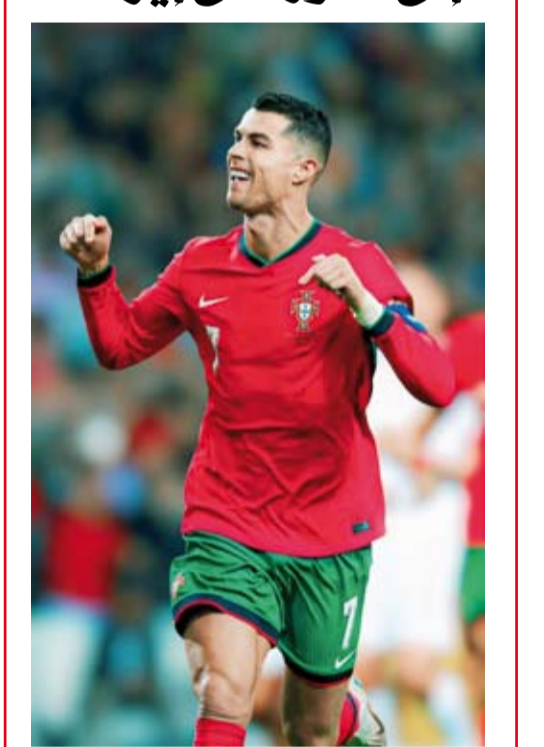
رونالدو شارك في فوز البرتغال على إيرلندا

فازت البرتغال بشق الأنفس على صيفتها إيرلندا بهدف متأخر من روين نيفيز لاعب الهلال السعودي، لتقترب خطوة من التأهل إلى كأس العالم 2026 التي ستقام في الولايات المتحدة وكندا والمكسيك. وواجه المنتخب البرتغالي صعوبة كبيرة على ملعب «جوزيه فالادي» معقل سيورتنغ لشبونة رغم تهديد مرمى إيرلندا بـ30 محاولة هجومية منها 6 تسديدات على المرمى، إذ تصدى الحارس كويمين كيليهير لمحاولات كريستيانو رونالدو وفيتينيا ونونو ميديزي. ووقف الحظ في وجه الأسطورة كريستيانو رونالدو قائد النصر السعودي بعدما اصطدمت إحدى كراته بالقائم، بينما أهدر ركلة جزاء في الدقيقة 75 تصدى لها الحارس الإيرلندي. وانقذ روين نيفيز منتخب بلاده من التعثر على أرضه بعدما ارتقى لعرضية فرانسيسكو ترينكاو وسجل هدف الفوز في الدقيقة 91. ورفعت البرتغال رصيدها إلى النقطة التاسعة في صدارة المجموعة، إذ تحتاج إلى الفوز على المجر في الجولة المقبلة لضمان التأهل إلى المونديال بشكل رسمي.