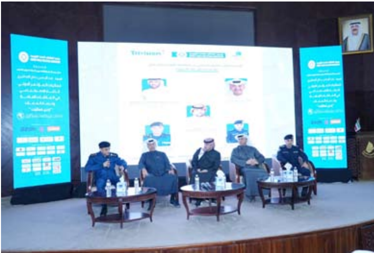
جانب من المؤتمر

وأكد أن الحكومة الكويتية رصدت 7 مليارات دينار من أجل التحول الرقمي العمل في جميع الجهات الحكومية وستشهد الكويت الفترة المقبلة رقمنة جميع الخدمات.