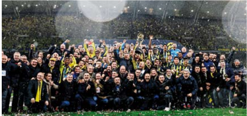
جانب من احتفال فتربخشة

قادما من (لاسيو) الإيطالي بتسديدة أرضية زاحفة من خارج منطقة الجزاء بعد تمريرة من ليفيبتن مرجان. وفي الشوط الثاني ومن ركلة ركنية نفذها الإسباني ماركو أسينسيو من الجهة اليسرى وصلت الكرة إلى الهولندي جايدن أوستروولدي عند القائم القريب ليحولها مباشرة بتسديدة خلفية في الشباك معززا بذلك تقدم فريقه بهدف ثان في الدقيقة 48. وكان (فتربخشة) قد تاهل للنهائي على حساب (سامسون سيور) بعد فوزه عليه في نصف النهائي بهدفين نظيفين فيما تغلب (غلطة سراي) في نصف النهائي الثاني على (طرابزون سيور) بأربعة أهداف مقابل هدف واحد.