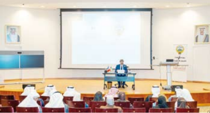
جانب من البرنامج التدريبي

الثقافة القانونية وتبادل الخبرات وجهت الدعوة إلى عدد من الجهات المعنية من بينها المجلس الأعلى للقضاء ومعهد الكويت للدراسات القضائية والقانونية ونخب من الأكاديميين من جامعة الكويت وجامعات أخرى بما يعزز الحوار المؤسسي والتكامل المعرفي بين الجهات القانونية الوطنية. من جهته قال المستشار بمجلس الدولة الفرنسي جان لوك مات في تصريح مماثل أنه سيتناول خلال مشاركته في البرنامج التدريبي آلية تعامل سلطات الدولة مع الضريبة لاسيما توزيع سلطة الضريبة بين الدول وكيفية تحديد صلاحياتها في ظل الاتفاقية الضريبية الدولية. وذكر المستشار مات أنه سيستعرض أيضا التجربة الفرنسية في ممارسة الدولة لسلطاتها تجاه المواطنين والإمكانيات التي تغفلها للفرد عبر الاحترام التام للقوانين والحرية بما يهدف لفهم القانون وتطبيقه بالشكل الصحيح.