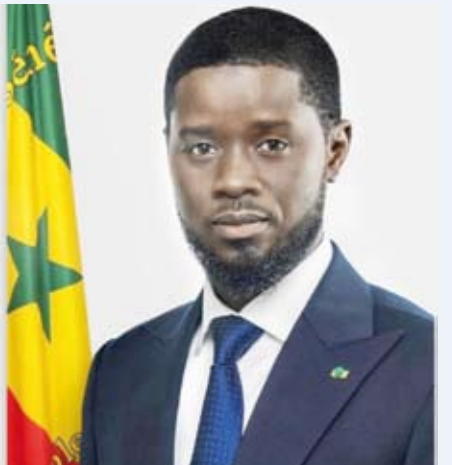
الرئيس بشيرو جوماي فاي

يصل إلى البلاد اليوم الاثنين الرئيس بشيرو جوماي فاي رئيس جمهورية السنغال الصديقة والوفد الرسمي المرافق له في زيارة رسمية يجري خلالها مباحثات رسمية مع صاحب السمو أمير البلاد الشيخ مشعل الأحمد الجابر الصباح.