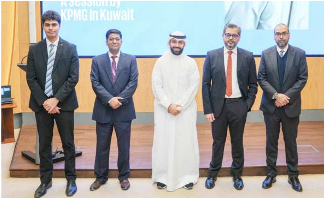
مشاركون في الجلسات التوعوية

اثنين من السنوات الأربع السابقة ضريبة لا تقل قيمتها عن 15 ٪ على الدخل الخاضع للضريبة المحققة في الكويت.