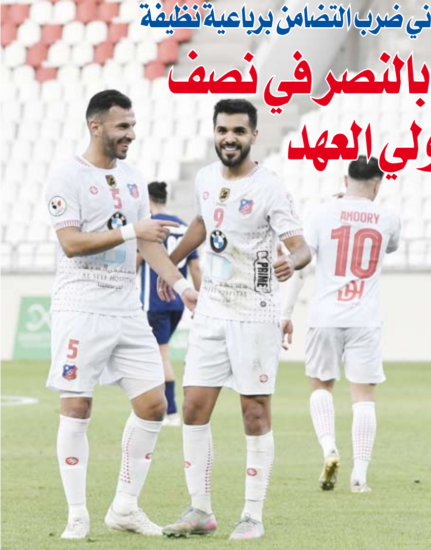
فرحة لاعبي الكويت بالفوز

تاهل فريق نادي الكويت الى نصف نهائي بطولة (كأس سمو ولي العهد) لكرة القدم بعد فوزه على نظيره برقان بثلاثة أهداف دون رد ضمن مباريات دور الثمانية من البطولة.