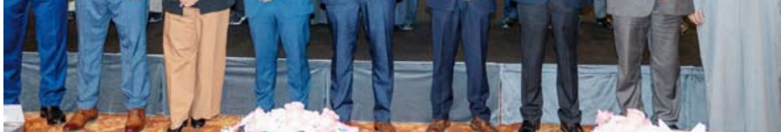
جانب من الحضور والمشاركين

أكد وزير الصحة الدكتور أحمد العوضي أن الاستثمار في برنامج مكافحة العدوى هو الاستثمار الأكثر حصة وتأثيراً فهو يمثل السد المنيع الذي يخفف معدلات العدوى المرتبطة بالرعاية الصحية ويوجد بالتالي السريية ويخفف الأعباء الاقتصادية عن كاهل المنظومة الصحية ويعزز جسور الثقة بين المجتمع ومؤسساته الصحية. جاء ذلك في كلمة افتتح بها أمس المؤتمر الدولي لمنع ومكافحة العدوى بتنظيم مشترك بين مستشفى المواساة الجديد ومركز الكويت للوقاية من الأمراض ومكافحتها. وأكد الوزير العوضي أن انعقاد المؤتمر ليس مجرد استكمال لمسيرة علمية بل تجسيد لإيمان عميق بأن قضايا منع ومكافحة العدوى عابرت حين الإجراءات الفنية لتصبح الركن الركين في جودة الرعاية الصحية والضمانة الأولى