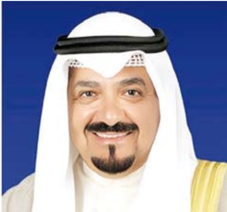
سمو الشيخ أحمد العبد الله

بعث سمو الشيخ أحمد العبدالله رئيس مجلس الوزراء حفظه الله ببرقية تهنئة إلى صاحب الجلالة السلطان هيثم بن طارق المعظم سلطان عمان الشقيقة وذلك بمناسبة ذكرى تولي جلالته مقاليد الحكم.