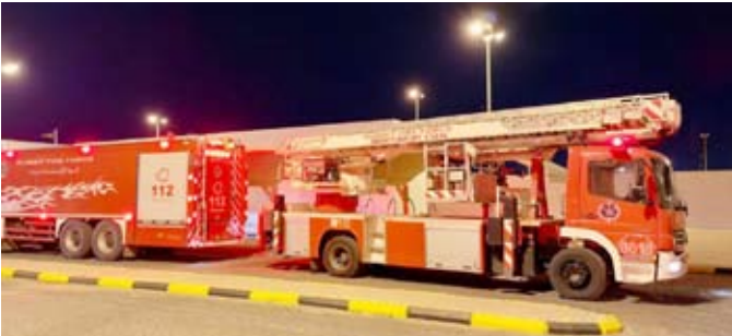
السيطرة على الحريق

الإطفاء يعرض المنشآت لغرامات مالية وعقوبات قانونية قد تصل إلى الإغلاق الإداري، مؤكداً أن هذه الإجراءات تأتي