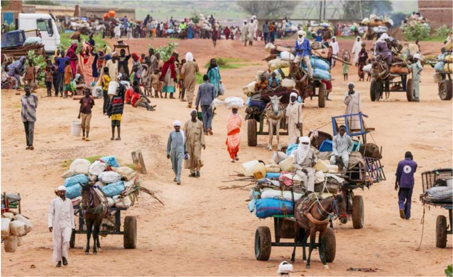
آلاف اللاجئين بمخيم أدري الحدودي في تشاد

وتقع مدينة الطينة على الشريط الحدودي الفاصل بين السودان وتشاد؛ حيث تنقسم إلى مدينتين تحلمان الاسم نفسه: الطينة السودانية، والطينة التشادية، ولا يفصل بين شطريها سوى مجرى مائي موسمي. ويستطيع السكان التنقل بين جانبي الحدود دون عوائق تذكر، في ظل روابط اجتماعية وثقافية، وغالباً إثنية، ممتدة عبر حدود البلدين.