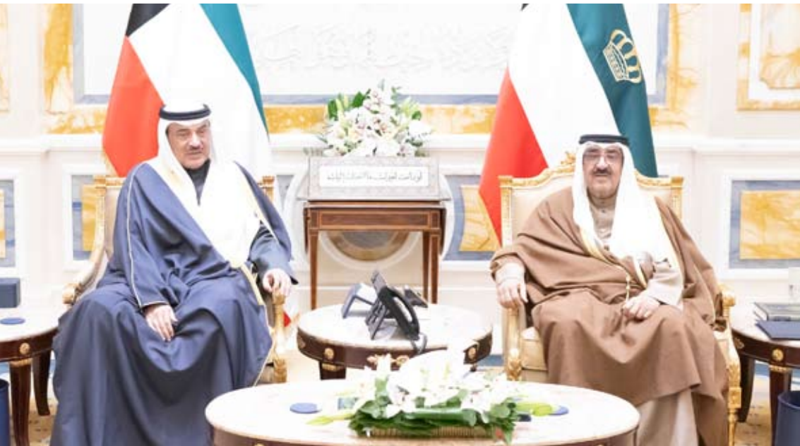
سمو الأمير مستقبلا سمو ولي العهد

واستقبل سموه رئيس الحرس الوطني الشيخ مبارك حمود الجابر الصباح. كما استقبل سموه النائب الأول لرئيس مجلس الوزراء ووزير الداخلية الشيخ فهد يوسف سعود الصباح