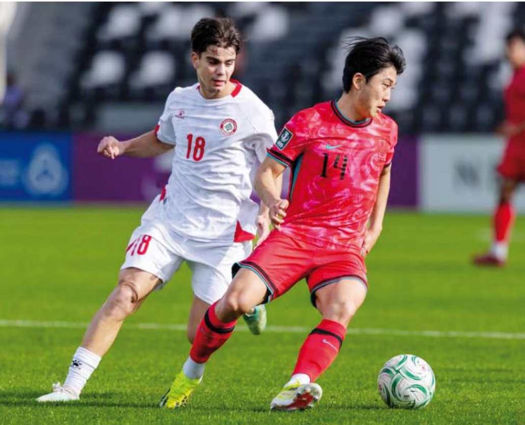
جانب من مباراة كوريا الجنوبية ولبنان