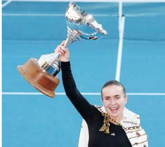
الأوكرانية إيلينا سفيتولينا

توجت الأوكرانية إيلينا سفيتولينا بلقب بطولة أوكلاند المفتوحة للتنس، بعد أن فازت على نظيرتها الصينية وانغ شين يو في المباراة النهائية بواقع (6 و3) و(7-6).