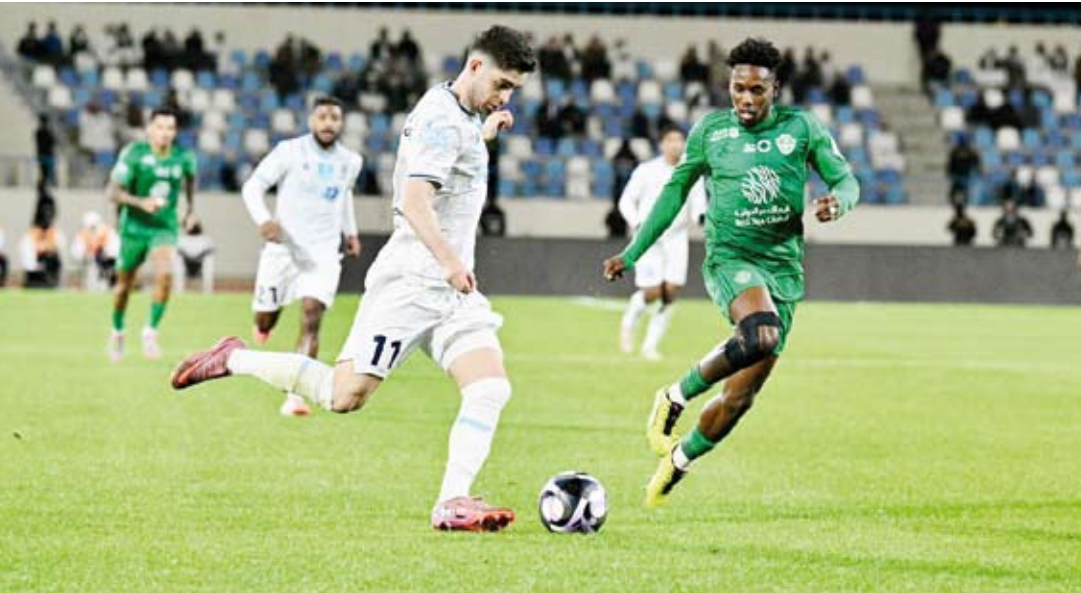
الأهلي إلى المركز الرابع

فاز فريق (الأهلي) على نظيره (الأخدود) بهدف نظيف ضمن منافسات الجولة ال14 من دوري (روشن) السعودي لكرة القدم. وسجل الهدف الوحيد في المباراة التي أقيمت على ملعب مدينة الأمير هذلول بن عبدالعزيز الرياضية بنجران الإنجليزي إيفان تونوي في الدقيقة 58.