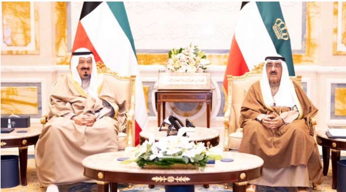
سمو الأمير مستقبلا سمو رئيس مجلس الوزراء