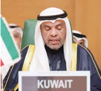
اليحيا خلال كلمته في المؤتمر

كما أنها تخلق بيئة مشتع يسهل استغلالها من قبل الجماعات المتطرفة والإرهابية.