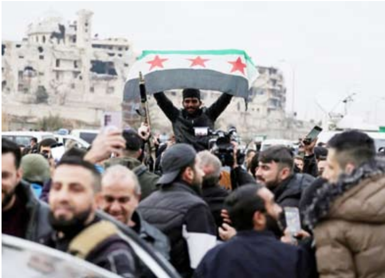
احتفالات بدخول حلب

حسمت الحكومة السورية الأوضاع لمصلحتها في حلب، كبرى مدن شمال البلاد، مرغمة القوات الكردية على إخلاء حبي الأشرقية والشيخ مقصود. وفي وقت رجّح محللون أن تفتح هذه التطورات الباب أمام المسار الدبلوماسي، أعلنت واشنطن أنها مستعدة لـ«تيسير الحوار» بين الأكراد ودمشق.