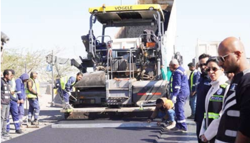
المشعان تتابع صيانة الطرق

الكيلو 27 في الاتجاهين. وبيّنت «الأشغال» أن نطاق الأعمال لا يقتصر على الطرق السريعة فحسب، بل يشمل أيضاً تنفيذ أعمال صيانة في 36 منطقة سكنية موزعة على مختلف المحافظات، حيث تتضمن الأعمال معالجة وصيانة عدد من القطع داخل تلك المناطق، وفق أولويات تهدف إلى إعادة تأهيل تلك الشوارع وتحسين طبقات الرصف.