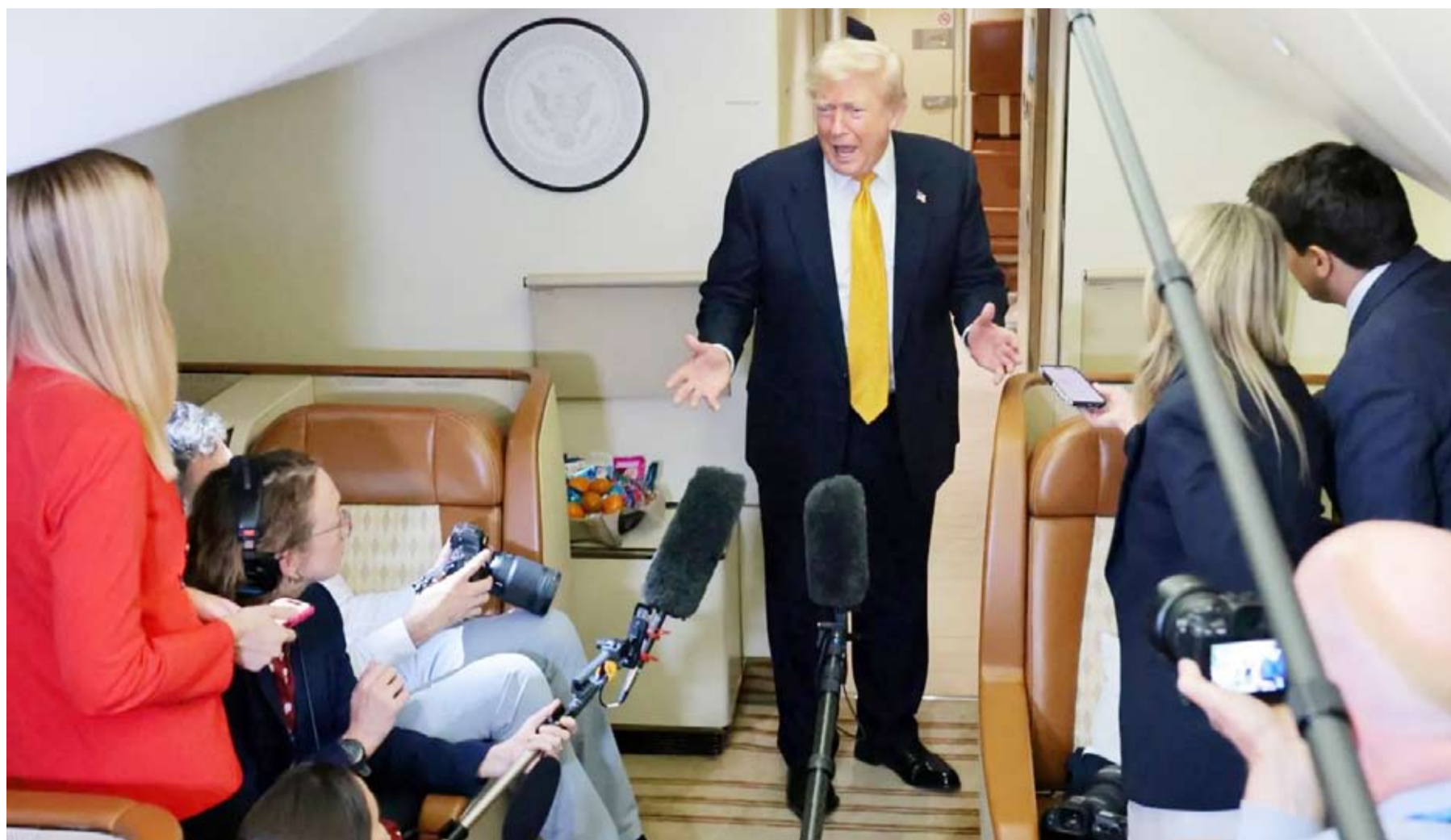
ترامب يتحدث للصحافيين على متن الطائرة الرئاسية الجديدة

أعلن الرئيس الأميركي دونالد ترامب، أن الولايات المتحدة وافقت على إجراء محادثات مع إيران بعد أن طلبت طهران، عبر الوسطاء، مواصلة المفاوضات، لكنه أضاف أن وقف إطلاق النار المتفق عليه بين البلدين في يونيو قد «انتهى». وكتب ترامب على منصة «تروث سوشيل» قائلاً: «طلبت منا جمهورية إيران الإسلامية مواصلة المحادثات، ووافقنا على ذلك، لكن الولايات المتحدة أبلغتها، بعبارة لا لبس فيها، بأن وقف إطلاق النار قد انتهى».