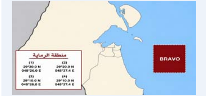
خريطة توضيحية للموقع البحري (BRAVO)

أعلنت وزارة الداخلية ممثلة بالإدارة العامة لجناح طيران الشرطة تنفيذها تمرين رماية بالذخيرة الحية في الموقع البحري (BRAVO)، وذلك مثال يوم الأحد حتى يوم الثلاثاء المقبل من الساعة 6 إلى 10 صباحاً. وذكرت (الداخلية) في بيان، أمس، أن التمرين سيتم تنفيذه بالمنطقة الواقعة ما بين جزيرة (عوهه) وجزيرة (كبر) على ارتفاع 3000 قدم ونزولاً فوق سطح البحر. وأهابت بجميع مرتادي البحر والصيدان وأصحاب القوارب ضرورة عدم الاقتراب من موقع التمرين خلال الأوقات المحددة والالتزام بالتعليمات الصادرة حفاظاً على السلامة العامة. وأضافت أن تنفيذ هذا التمرين يأتي ضمن البرامج التدريبية المعتمدة الهادفة إلى رفع مستوى الجاهزية والكفاءة العملية وتعزيز قدرات الطواقم الجوية على تنفيذ مهامها وفق أعلى معايير الأمن والسلامة.