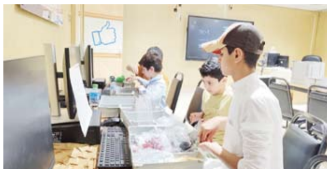
الأندية المدرسية الصيفية تقدم أنشطة متنوعة

وبين السعيد أن التسجيل متاح من خلال الحضور الشخصي إلى أحد المراكز الخمسين للتسجيل، أو عبر موقع وزارة التربية - الخدمات الطلابية، داعياً الطلبة وأولياء الأمور إلى المبادرة بالتسجيل والاستفادة من البرامج والأنشطة التي يقدمها النادي، لما لها من دور في إكساب الطلبة مهارات عملية وخبرات جديدة، وتنمية قدراتهم الإبداعية، وإعداد جيل قادر على الابتكار والإنتاج وخدمة المجتمع.