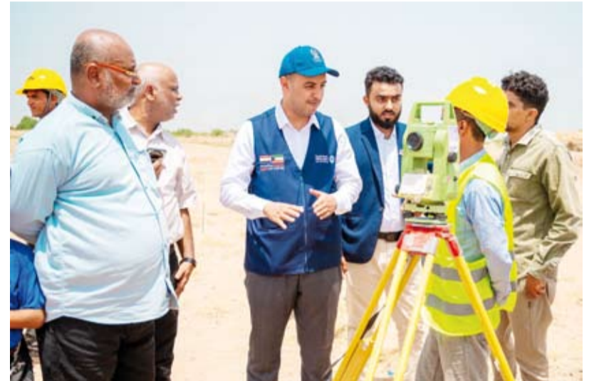
جانب من أعمال تدرشن العمل بالقرية السكنية