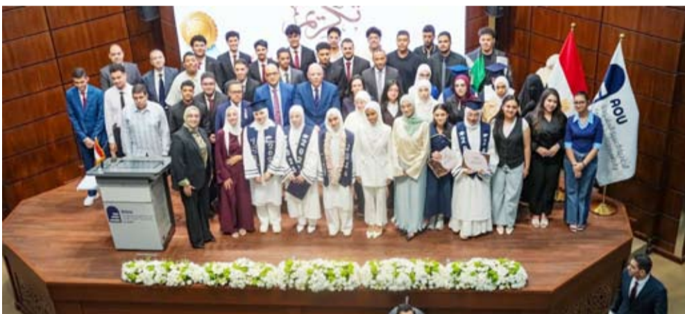
السفير المصري والقنصل العام بتونس الفائقين والفائقات

◆ تفوق الطلبة المصريين في الثانوية العامة الكويتية يمثل مصدر فخر واعتزاز لمصر