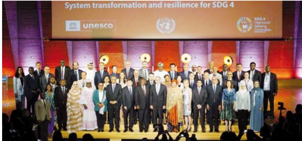
الطبيباني في لقطة جماعية للمشاركين