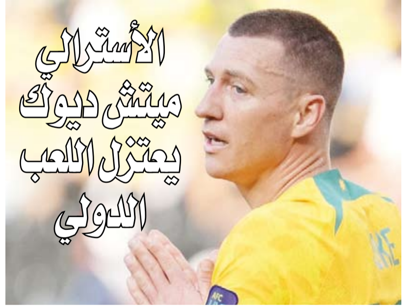
المهاجم الأسترالي ميتش ديوك

وكان هالاند قد أفتتح التسجيل لمنتخب النرويج بضربة رأس متقنة بعد التغلب على غابرييل ماجالهايس، مدافع منتخب البرازيل، في الدقيقة 79 من عمر اللقاء، ثم مع وصول عدد الأهداف لـ90، تسلم مهاجم مانشستر سيتي الإنجليزي الكرة على ركن منطقة جزاء البرازيل، ولمسها بيمينه، ثم يساره ليروضها لنفسه قبل أن يطلق تسديدة قوية أيسبغت الشباك في الزاوية السفلية للرمي، متجاوزة الحارس اليسون بيكر. وحصل هدف هالاند على 34 في المائة من أصوات مستخدمي موقع «فيفا» الإلكتروني الرسمي حول العالم، متفوقاً بذلك على هدف الأرجنتيني ليونيل ميسي الذي سجله في مرمى منتخب مصر (25 في المائة)، بينما حل هدف المغربي عن الدين أوانحي الذي أحرزه من تنفيذ متقن لركلة ثابتة ضد كندا في المركز الثالث وحافظ فريق المدرب ستوليه سولياكن على تقدمه حتى الوقت المحتسب بدلًا من الضائع، رغم ركلة الجزاء التي أحرزها نيمار لمنتخب البرازيل في اللحظات الأخيرة.