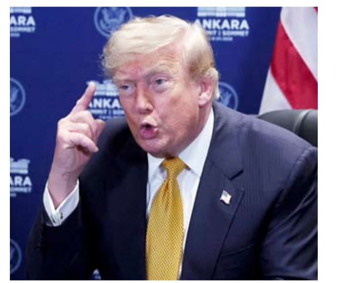
الرئيس الأميركي دونالد ترامب

وأكد خامنئي في تدويته على منصة «إكس» الأمريكية، أمس، أنه سيواصل السير على النهج الذي رسمه والده. وقال في رسالته: الانتقام مطلب شعبنا، ولا بد أن يتحقق، وسيؤدي الأحرار في العالم قريباً جزءاً من هذه المهمة الإلهية.