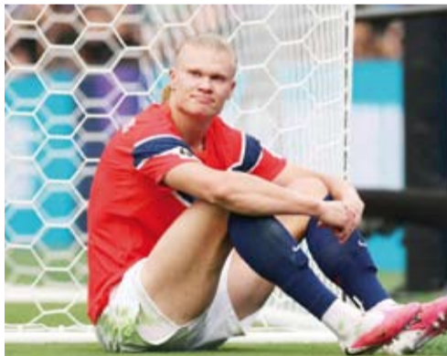
إيرلينغ هالاند يحتفل بهدفه في شبك البرازيل

فاز هدف الدولي النرويجي إيرلينغ هالاند الثاني في انتصار منتخب بلاده 2-1 على البرازيل بدور الـ16 لبطولة كأس العالم 2026، بالمرحلة الثالثة من تصويت جائزة هدف البطولة المقدمة من الاتحاد الدولي لكرة القدم (فيفا).