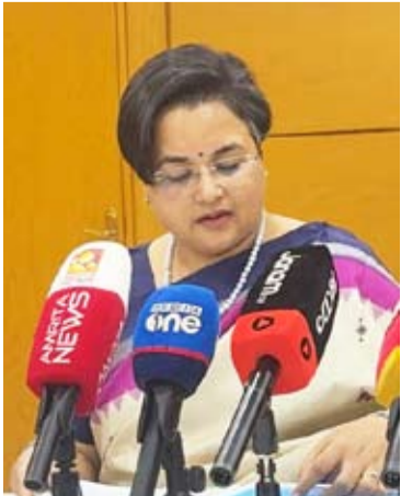
السفيرة الهندية بالكويت

العلاقات الثنائية والتطورات الأمنية في المنطقة، إلى جانب انعكاسات الأوضاع الإقليمية على الأمن والاستقرار الإقليمي والعالمي. وأكدت أن الوزير حظي باستقبال حافل من الجانب الكويتي، وهو ما يعكس متانة العلاقات التاريخية بين البلدين وحرص القيادتين على مواصلة تعزيز الشراكة الثنائية. وفيما يتعلق بلقاء الوزير مع أبناء الجالية الهندية في الكويت، أوضحت السفيرة أن الهدف من اللقاء كان الاستماع إلى أفراد الجالية والاطلاع على أوضاعهم في ظل الظروف الراهنة، مشيرة إلى أن السفارة كانت على تواصل مستمر معهم، وأن الوزارة في نيودلهي كانت تتلقى تقارير يومية عن أوضاعهم.