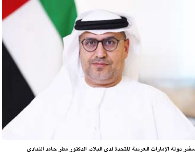
سفير دولة الإمارات العربية المتحدة لدى البلاد، الدكتور مطر حامد النيادي

وأسمت في تعزيز وتوحيد الرؤى وتبادل الخبرات بما يخدم المصالح المشتركة لدول الخليج. واختتم النيادي تصريحه بالدعاء بأن يعم الأمن والسلام والاستقرار منطقة الخليج والعالم، مؤكداً أن التواصل بين قيادتي الكويت والإمارات سيبقى ركيزة أساسية لتعزيز التضامن الخليجي ومواجهة التحديات المشتركة.