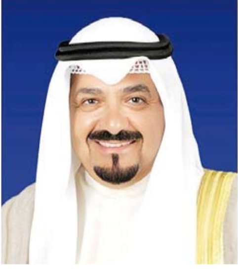
سمو الشيخ أحمد العبدالله