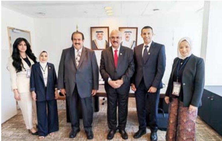
وزير التربية مع مندوب الكويت لدى «اليونسكو» د. علي المصطفى

أكثر من نصف مليون طالب وطالبة واصلوا تعليمهم عن بُعد خلال الظروف الاستثنائية بنسبة حضور تجاوزت 58%