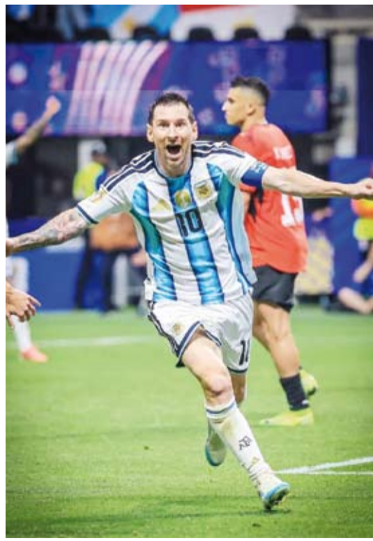
ميسي الورقة الرابعة لمنتخب التانغو

يسعى فيها المنتخب الإنجليزي إلى بلوغ الدور نصف النهائي للمرة الأولى منذ موندiales روسيا 2018. ويعول المنتخب النرويجي على هدافه إرلينغ هالاند، الذي يعيش فترة استثنائية بعدما سجل سبعة أهداف في أربع مباريات، فيما يراهن المنتخب الإنجليزي على قائده هاري كين، الذي لعب دوراً حاسماً في قيادة منتخب إنجلترا إلى ربع النهائي بفضل أهدافه المؤثرة في الأدوار الإقصائية. وتختتم مواجهتها الأحد منافسات الدور ربع النهائي، على أن يحجز الفائز آخر بطاقتين إلى الدور نصف النهائي، الذي تستضيفه مدينة أتلانتا يوم 15 يوليو الجاري.