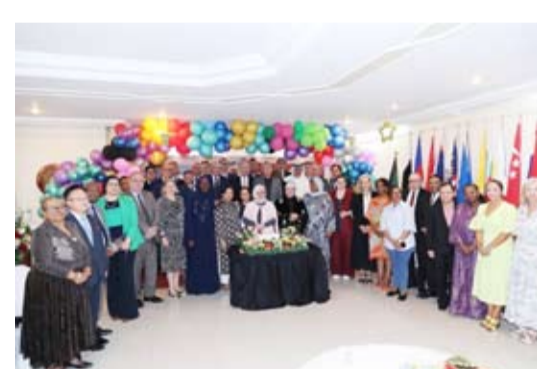
سفيرة تركيا متوسطة الدبلوماسيةين

أقامت سفيرة جمهورية إندونيسيا لدى البلاد ليينا مارينا أمسية وداعية على شرف سفيرة جمهورية تركيا لدى توبا نور سوفنر، بحضور عدد من السفراء ورؤساء البعثات الدبلوماسية والشخصيات الرسمية.