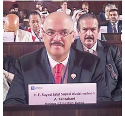
وزير التربية خلال مشاركته في قمة تحويل التعليم +4