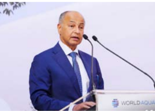
الكاتب حسين المسلم

حقق الاتحاد الدولي للألعاب المائية أعلى تصنيف في مراجعة حوكمة الاتحادات الدولية التي تجريها الرابطة الدولية للاتحادات الرياضية الأولمبية، بعد حصوله على فئة A1 في نسخة 2026، ليؤكد مكانته بين أبرز الاتحادات الرياضية الدولية من حيث الشفافية والنزاهة والمساءلة. ويمثل هذا الإنجاز تنويعاً لمسيرة إصلاحات شاملة بدأها الاتحاد منذ عام 2021، حيث انتقل من الفئة C في مراجعة 2019-2020 إلى A2 في 2024، وصولاً إلى أعلى تصنيف هذا العام.