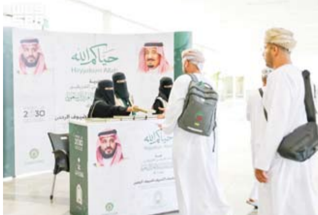
توزيع المصاحف على الحجاج

وزعت وزارة الشؤون الإسلامية والدعوة والإرشاد في المملكة العربية السعودية، ممثلة بفرعها في منطقة مكة المكرمة من خلال مكتب أعمالها بمطار الملك عبدالعزيز الدولي بجدة، 374660 نسخة من هدية خادم الحرمين الشريفين من المصاحف الشريفة بمختلف الإصدارات على الحجاج المغادرين عبر المطار منذ بدء مغادرة الحجاج من 12 ذي الحجة وحتى اليوم 23 من ذي الحجة للعام 1447هـ، ضمن جهودها الرامية إلى توديع ضيوف الرحمن.