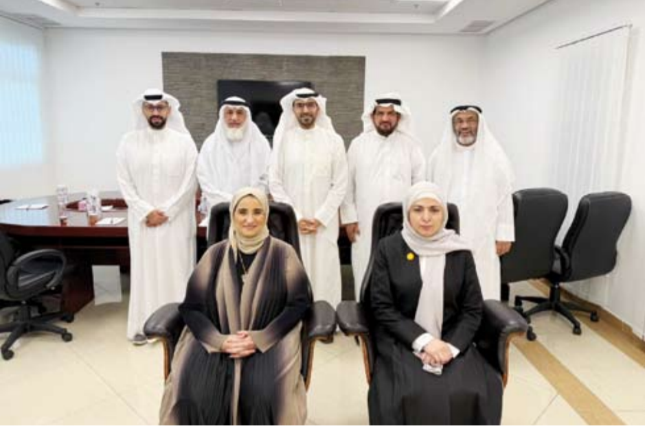
مجلس إدارة اتحاد الجمعيات والمبرات الخيرية