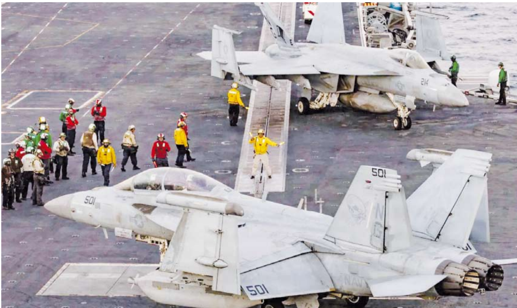
مقاتلة أميركية تنقل من حاملة طائرات في بحر العرب

جولة من الضربات الجوية على أهداف عدة في إيران، ووصفت تلك الأهداف بأنها كانت تشكل خطراً على القوات الأميركية وعلى الملاحة في مضيق هرمز. ومباشرة بعد استئناف واشنطن لهجماتها المشتركة العليا (مقر خاتم الأنبياء) في إيران إغلاق مضيق هرمز أمام جميع السفن، ومن بينها أنقالت النقط والسفن التجارية، مؤكدة أن أي سفينة تحاول المرور ستعرض لإطلاق النار.