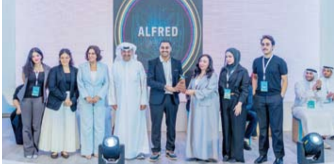
الخشتي والمطيري يُكرمان أحد الفرق الفائزة في فئة الجامعات

ورعت زين فئة «أفضل منتج مبتكر» التي هدفت إلى تشجيع الطلبة على تطوير أفكار إبداعية ومنتجات ذات أثر إيجابي ومستدام، وتكريم المشاريع التي أظهرت قدرة واضحة على توظيف الابتكار في معالجة التحديات المجتمعية والبيئية والاقتصادية، بما يتناسب مع توجه الشركة نحو دعم الحلول الشبابة القابلة للنمو والتأثير. وللجنة الثمانية على التوالي، تعاونت زين وإنجاز مع شركة «سنستل» في مبادرة «إبطال الاستدامة» ضمن مسابقة «برنامج الشركة»، الهادفة إلى تعزيز مفاهيم الاستدامة بين الطلبة، وتشجيعهم على تبني ممارسات وحلول مبتكرة تخدم المجتمع والبيئة، وترسخ أهمية التفكير المسؤول في تصميم المشاريع الريادية منذ مراحلها الأولى.