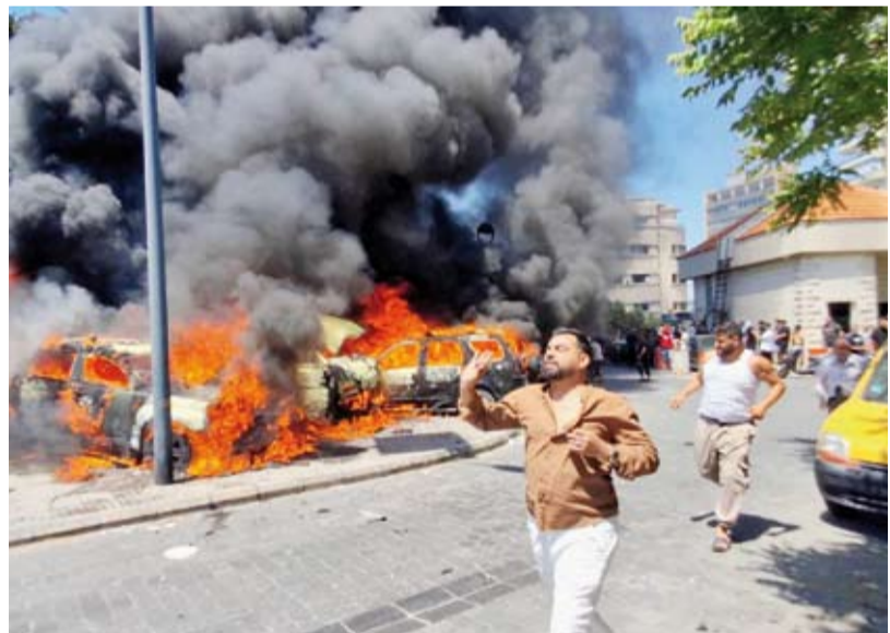
سكان يفرون أمام سيارات محترقة بعد هجوم صهيوني

حاضر في مفاوضات باكستان أيضاً. يسعى الجيش الإسرائيلي للتقدم على محورين على الأقل خارج «الخط الأصفر» الذي سبق أن أعلنه في جنوب لبنان، عبر توغلات محدودة تعرضت لضربات بمسيرات والصواريخ الموجهة التي أطلقها «حزب الله»، واستعاض عن ذلك بقصف جوي عنيف أدى إلى تدمير واسع في القرى المحيطة. وشن الجيش الإسرائيلي هجمات جديدة في مسعى للتوسع في محيط قلعة الشقيف في النبطية، محط قلعة الشقيف في النبطية، باتجاه كفر تبنيث وتلة على الطاهر الاستراتيجية، كما حاول التقدم في القطاع الغربي باتجاه بيوت السباد ومجدول زون. وقالت مصادر جنوب لبنان لـ«الشرق الأوسط».