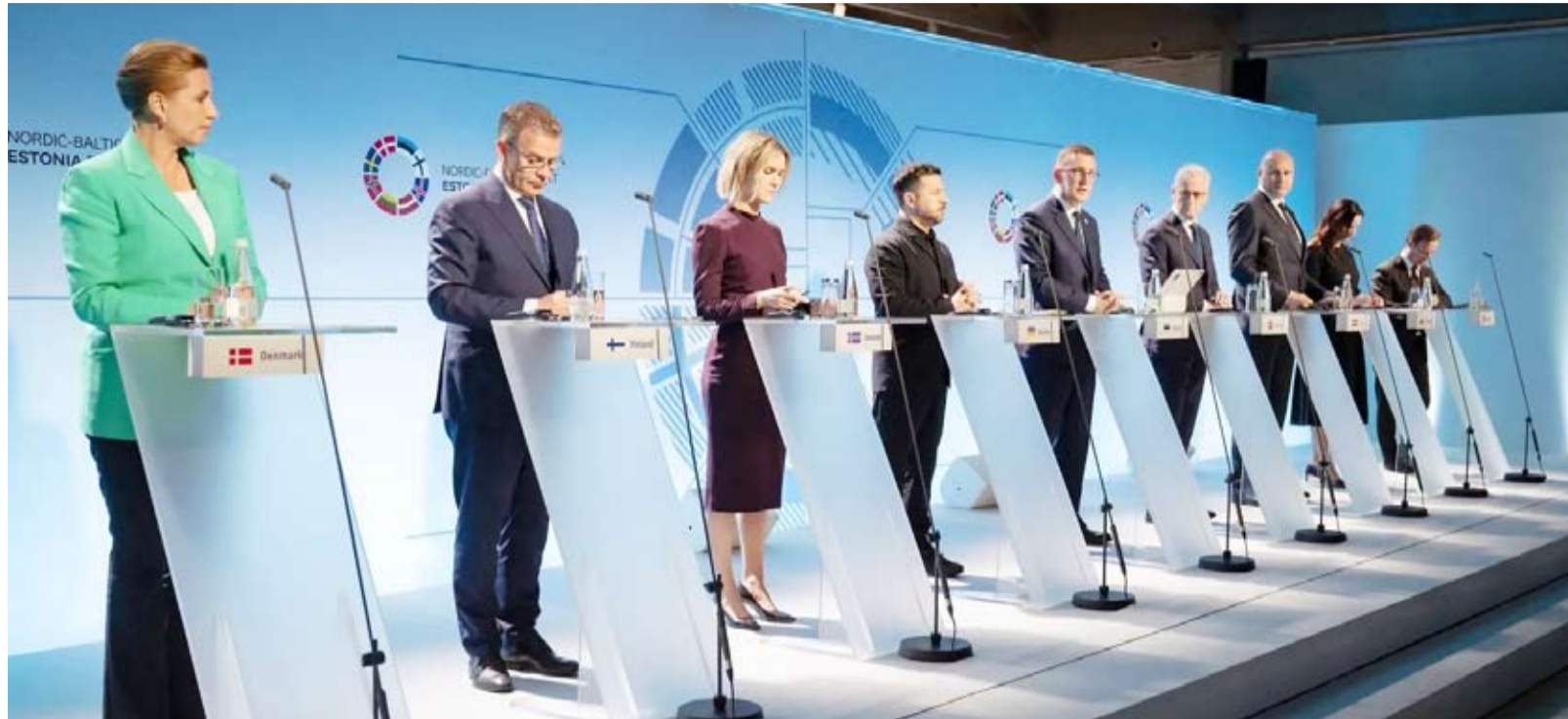
قمة رؤساء وزراء دول الشمال ودول البلطيق 2026

أعلن الرئيس فولوديمير زيلينسكي، أن كييف استهدفت خلال الليل منشأة عسكرية روسية تبعد مئات الكيلومترات شرق موسكو بصواريخ أوكرانية الصنع، في استخدام نادر لأبرز أسلحة بلاده المحلية. فيما أكدت وزارة الدفاع الروسية أن الهجمات الأوكرانية استهدفت عمق الأراضي الروسية خلال الليل، وأنه جرى اعتراض 326 طائرة مسيرة في أنحاء البلاد. وعلى الرغم من تعذر التحقق من هذه الادعاءات من مصادر إعلامية مستقلة، فإن الأرقام تشير إلى هجوم أوكراني واسع النطاق.