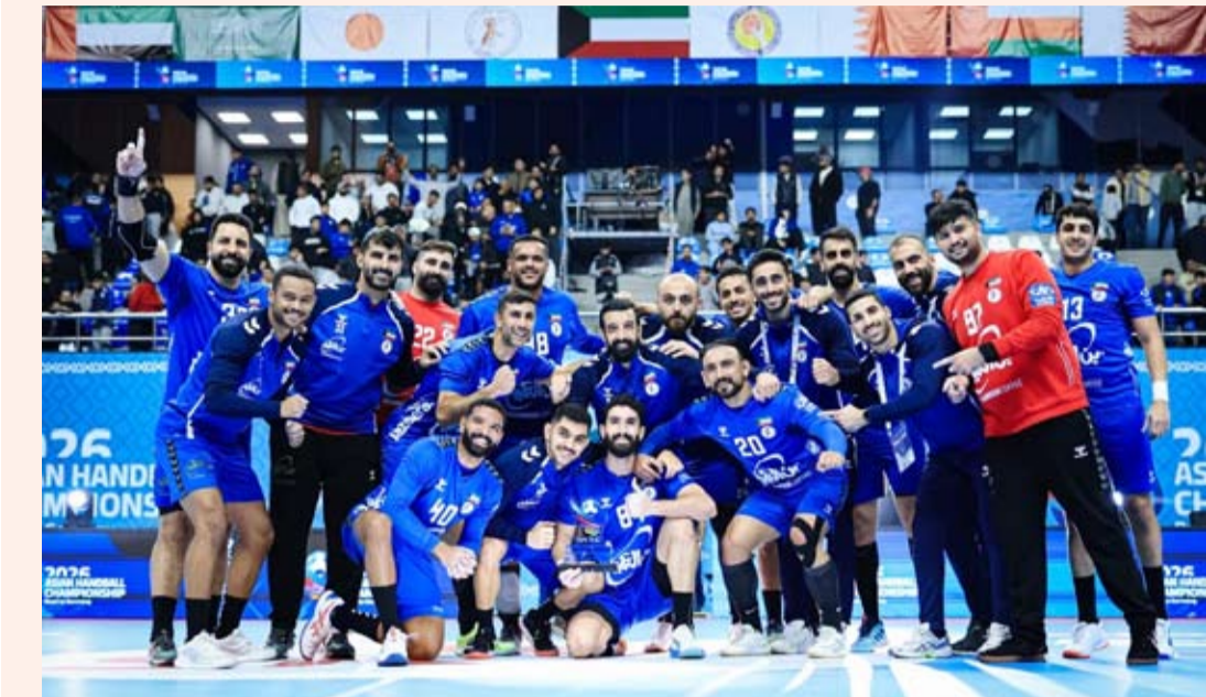
فريق الكويت المتأهل لكأس العالم لكرة اليد

وضعت قرعة بطولة كأس العالم لكرة اليد (ألمانيا 2027) منتخب الكويت في المجموعة الرابعة (D) إلى جانب منتخبات فرنسا والبرازيل والأرجنتين. وأسفرت قرعة نسخة الـ30 من البطولة المقرر إقامتها في الفترة (13 - 31 يناير المقبل) عن تقسيم المنتخبات المشاركة إلى 8 مجموعات.