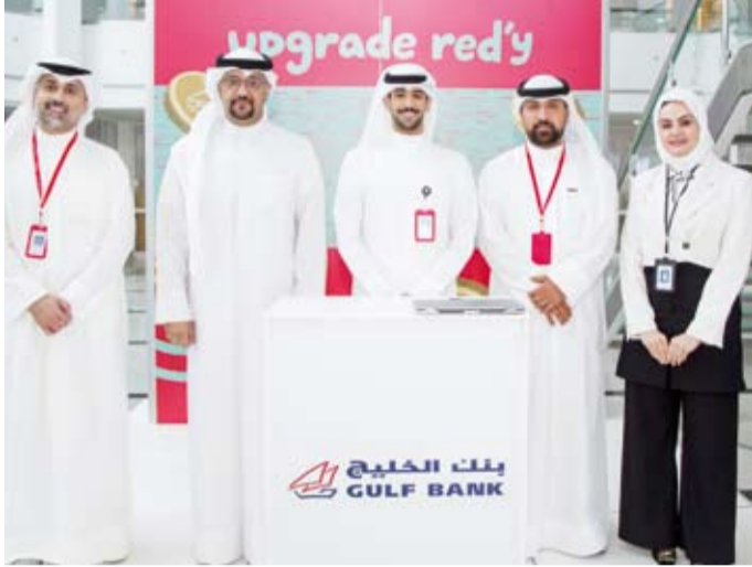
فريق مبيعات بنك الخليج

بفخاء منذ بداية مشوارهم الأكاديمي. تهدف هذه الحلول إلى تمكين الشباب من بناء مهاراتهم أساسية من خلال أدوات تساعد على تتبع المصروفات، ووضع الميزانيات، واتخاذ قرارات مالية مدروسة. وقد أبدى الطلبة اهتماماً كبيراً بالمزايا التي يوفرها الحساب والبطاقة، مثل التحكم ببطاقة الدفع، والعروض الحصرية، والمكافآت عند الشراء، إلى جانب الدعوات لحضور فعاليات مختارة تعزز نمط حياتهم وتواكب تطلعاتهم.