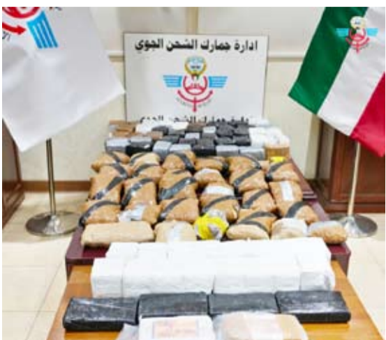
إحباط كميات كبيرة من المواد المخدرة

أعلنت الإدارة العامة للجمارك الكويتية، أول أمس، إحباط عملية إدخال 86 كيلوغراماً من المواد المخدرة عبر الشحن الجوي القادمة من المملكة المتحدة. وقالت «الجمارك» في بيان صحفي: إن رجال إدارة جمارك الشحن الجوي تمكنوا من ضبط شحنة امتعة شخصية قادمة من المملكة المتحدة مكونة من 3 حقائب تحتوي على كميات كبيرة من المواد المخدرة. وأوضحت أن ذلك جاء تنفيذاً لتوجيهات النائب الأول لرئيس مجلس الوزراء ووزير الداخلية الشيخ فهد اليوسف وبحضور رئيس الإدارة العامة للجمارك يوسف النوياف ونائبه لشؤون المنافذ والبحث والتحري الجمركي صالح العمر وبالتعاون والتنسيق مع وزارة الداخلية ممثلة في الإدارة العامة لمكافحة المخدرات. وأفادت بأن عملية التفتيش أسفرت عن ضبط ما يقارب الـ 63 كيلوغراماً من مادة