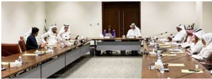
جانب من اجتماع اللجنة