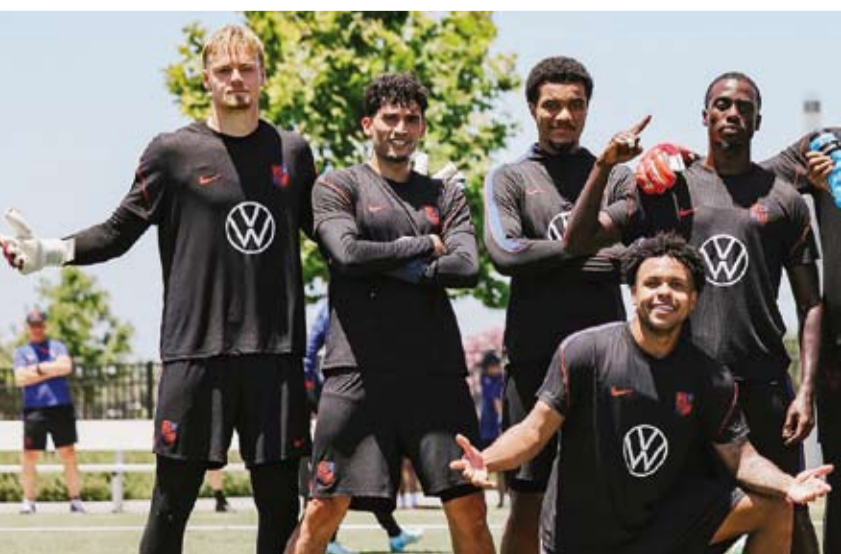
جانب من استعدادات الولايات المتحدة

وتبدأ الولايات المتحدة التي تشارك للمرة الـ12 في الموندリアル، مشوارها على ملعب «سو فاي ستاديوم» في لوس أنجلوس بحضور وزير خارجيتها، ماركو روبيو، ممثلاً لإدارة الرئيس دونالد ترمب.