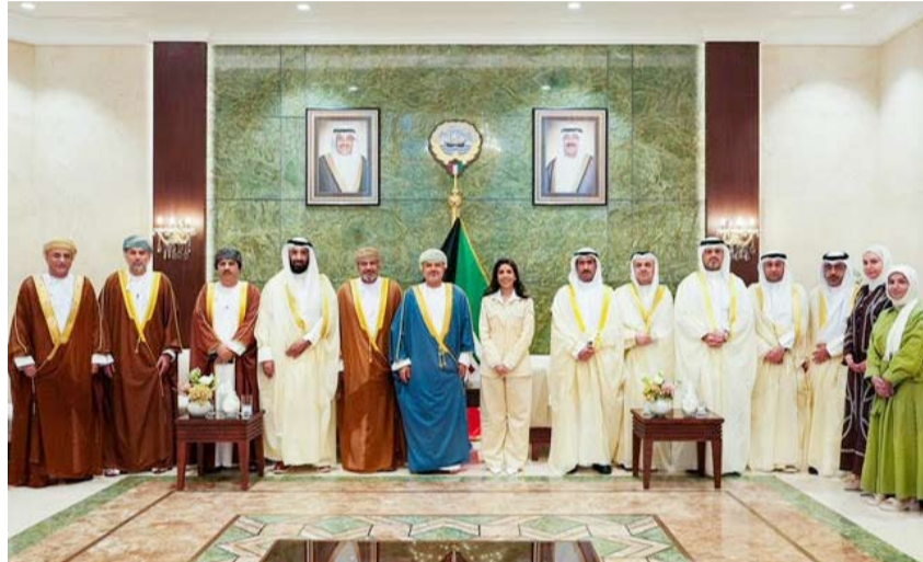
المشعان مستقبلة المعولي والوفد المرافق له

استقبلت وزيرة الأشغال العامة الدكتورة نورة المشعان، المهندس سعيد بن حمود المعولي وزير النقل والاتصالات وتقنية المعلومات في سلطنة عُمان، وذلك في إطار تعزيز العلاقات الثنائية وتبادل الخبرات بين البلدين الشقيقين.