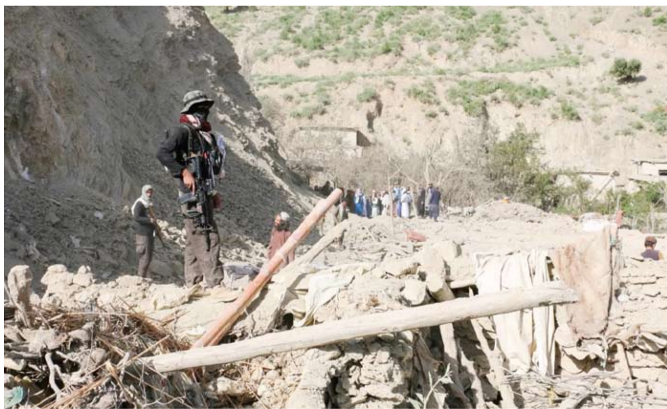
عنصر من «طالبان» فوق انقاض موقع قصفته باكستان

استأنفت باكستان ضرباتها الجوية على الأراضي الأفغانية، حسب ما أفاد مسؤولون في البلدين، في تصعيد يُعد الأكثر دموية منذ أسابيع، بعد فترة هدوء نسبي استمرت أسابيع عدة. ورأى مراسل «وكالة الصحافة الفرنسية»، منزلاً مُدمراً بالكامل في ولاية خوست (جنوب شرق أفغانستان)، حيث عمل سكان على حفر القبور لدفن ضحايا هجوم وقع ليلاً. وقال الناطق باسم الحكومة الأفغانية ذبيح الله مجاهد، إن «11 طفلاً وامرأة ورجلاً مسناً قتلوا» في الضربات على مقاطعات خوست وكونار وباكتيكا.