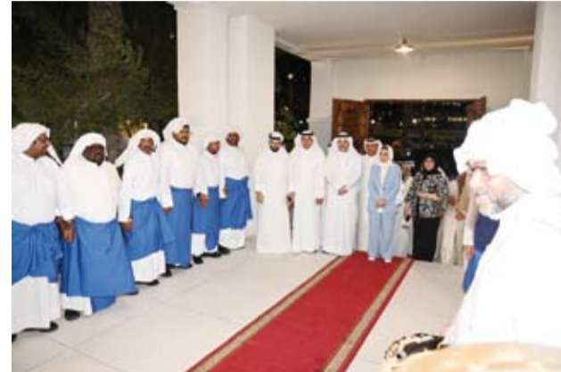
د. أمثال الحويلة خلال افتتاحها مقهى الشميمري الشعبي

افتتحت وزيرة الشؤون الاجتماعية وشؤون الأسرة والطفولة الدكتورة أمثال الحويلة، أول أمس، مقهى الشميمري الشعبي في منطقة شرق بالكويت العاصمة بعد الانتهاء من أعمال تطويره، مؤكدة حرصها على الارتقاء بالمرافق الاجتماعية والمحافظة على الطابع التراثي. وقالت الحويلة في تصريح صحفي بهذه المناسبة: إن المقاهي الشعبية تمثل جزءاً أصيلاً من الموروث الكويتي ومتنفساً اجتماعياً يجمع مختلف فئات المجتمع. وأكدت حرص وزارة الشؤون على تطوير مثل هذه المرافق بما يواكب احتياجات مرافقها ويحافظ على هويتها.