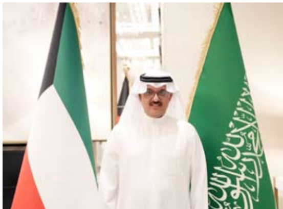
الأمير سلطان بن سعد

وأكد الحرص على العمل مع السفراء بروح الفريق الواحد بما يخدم العمل الدبلوماسي ويعزز أطر التعاون والتنسيق المشترك. وتوجه بجزيل الشكر وعظيم الامتنان إلى حكومة دولة الكويت ممثلة في وزارة الخارجية وكوادرها على ما