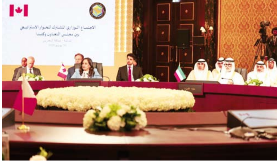
وزير الخارجية مترشداً وفد الكويت في الاجتماع

ترأس وزير الخارجية الشيخ جراح الجابر، أول أمس، وفد دولة الكويت المشارك في الاجتماع الوزاري المشترك للحوار الاستراتيجي بين مجلس التعاون لدول الخليج العربية وكندا، والذي عقد في مملكة البحرين الشقيقة. وقالت وزارة الخارجية الكويتية في بيان: إن اجتماع وزراء خارجية دول مجلس التعاون الخليجي ووزيرة خارجية كندا أنيتا آناند، شهد التأكيد على متانة العلاقة التي تجمع دول مجلس التعاون وكندا وروابط الصداقة التاريخية بين الجانبين. كما تم بحث سبل تعزيز العلاقات الخليجية - الكندية والأخذ بمجالات الشراكة إلى آفاق أرحب وأكثر شمولاً ولا سيما في القطاعات التجارية والاستثمارية والأمن الغذائي والطاقة والخدمات اللوجستية بما يخدم المصالح المشتركة.