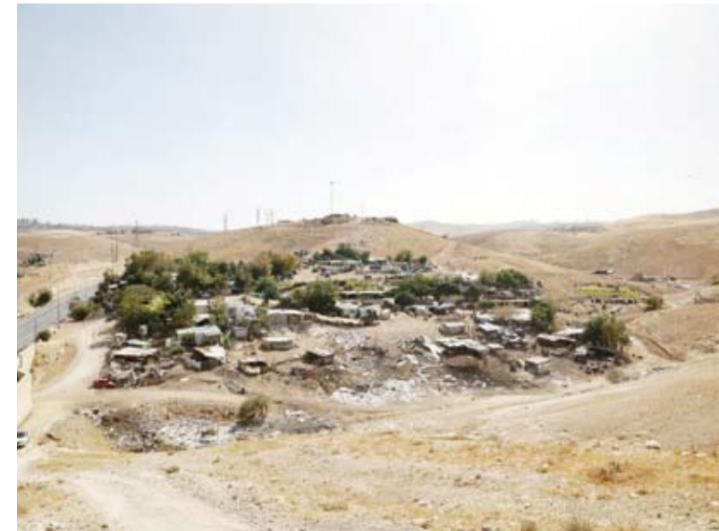
مساكن فلسطينية في «الخان الأحمر»

فحكومة اليمين المتطرف لم تعد تكتفي بتوسعة مستوطنة «معاليه أدوميم» الفاخرة، واحتلالها مساحةً واسعة فوق الخان، بل خططت لضم كل تلك الهضاب، إلى القدس، ضمن مشروع «E1»، المنير للجدل، والذي يهدف لإنهاء حلم الدولة الفلسطينية القابلة للتواصل.