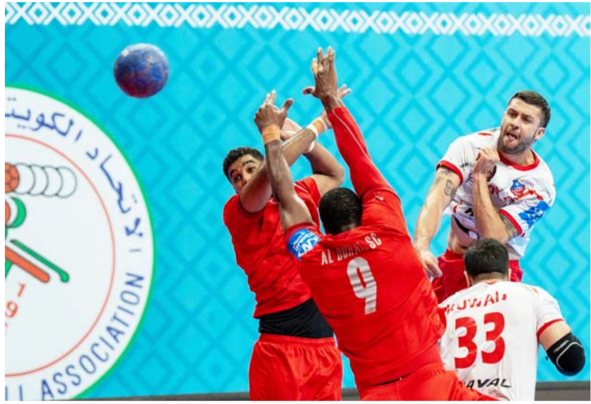
لاعب الكويت يتخطى دفاعات الدحيل ويصوب كرة قوية

جسدت البطولة الآسيوية الـ28 للأندية أبطال الدوري لكرة اليد للرجال والمؤهلة إلى كأس العالم للأندية (مصر 2026) والمقامة في دولة الكويت لقاء الخليجية ما يؤكد المكانة المرموقة التي وصلت إليها كرة اليد الخليجية على مستوى القارة. وجاءت منافسات البطولة بأجواء عالمية حملت نكهة خليجية جمعت أبناء منطقة الخليج كأنها كتبت بشعار (خليجنا واحد) وسط حضور جماهيري وإعلامي كثيف عكس روابط الأخوة وأكد على العمق التاريخي والارتباط العريق والممتد والمصير الواحد المشترك.