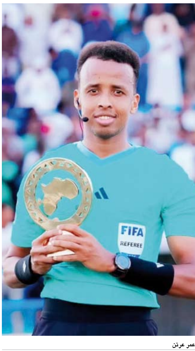
الحكم عمر عرتن

اختار الاتحاد الأوروبي لكرة القدم «ويفا» الحكم الصومالي عمر عرتن الذي منع من دخول الولايات المتحدة قبيل انطلاق كأس العالم 2026، لإدارة مباراة الكأس السوبر الأوروبية، وفق ما أعلنت الهيئة الكروية الخميس. وقال «ويفا» في بيان: عقب مشاورات مع الاتحاد الشفيق، الاتحاد الإفريقي لكرة القدم «كاف» قرر ويفا تعيين الحكم الصومالي عمر عرتن لإدارة مباراة الكأس السوبر الأوروبية 2026، ومن المقرر أن تقام المباراة التي تجمع بين باريس سان جرمان الفرنسي بطل دوري أبطال أوروبا وأستون فيلا الإنكليزي بطل مسابقة الدوري الأوروبي (يوروبا ليغ) في 12 أغسطس بمدينة سالزبورغ النمسية. وقال رئيس الاتحاد الأوروبي للعبة، السلوفيني ألكسندر تشيفيرين، المدير بعرتن، واصفا إياه بأنه «حكم شاب ومتميز، لكنه يتمتع بخبرة كبيرة، وقد أثبت كفاءته في أعلى مستويات المناقصات التابعة للاتحاد الإفريقي لكرة القدم». وأضاف تشيفيرين «كرة القدم وجدت لتقريب الناس من بعضهم البعض، ويوفا يريد أن يظهر احترامه لعمر عرتن ومهاراته التحكيمية الاستثنائية التي أهلتها لتلعب هذا التكليف المرموق». وأوضح «ويفا» أن تعيين عرتن يأتي في إطار انفتاح تعاون مع «الكاف» بهدف تعزيز الشراكة والتعاون بين الاتحادين.