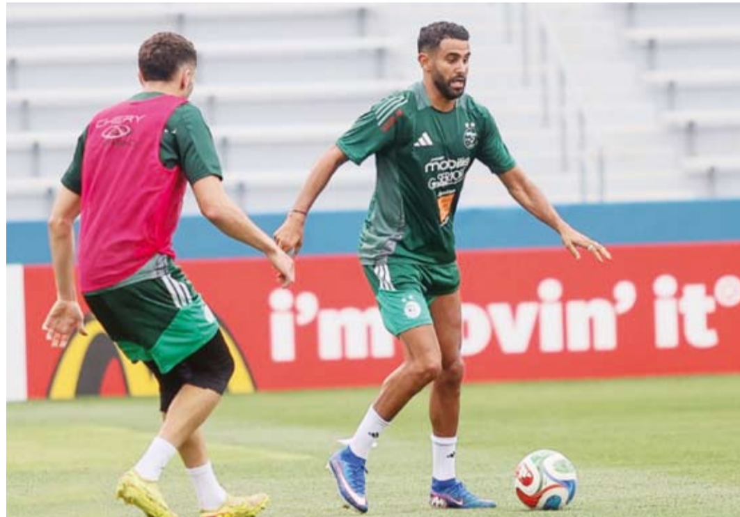
رياض محرز أحد أهم نجوم منتخب الجزائر في الموندリアル