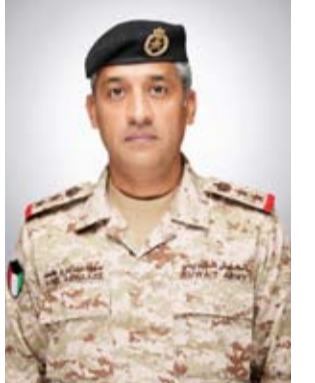
العقيد الركن سعود العطوان

أعلنت وزارة الدفاع أن القوات المسلحة رصدت خلال الـ 48 ساعة الماضية 24 طائرة مسيرة معادية داخل المجال الجوي الكويتي، مؤكدة التعامل معها وفق الإجراءات المتبعة. وقال المتحدث الرسمي باسم وزارة الدفاع العقيد الركن سعود العطوان في بيان صحفي: إن العدوان الإيراني الأثم نتج عنه أضرار مادية محدودة دون وقوع إصابات بشرية. وأضاف العقيد الركن العطوان أن القوات المسلحة تؤكد استمرارها في أداء مهامها وواجباتها بكفاءة في إطار من الجاهزية والاستعداد بما يعزز أمن الوطن ويحفظ سلامة المواطنين والمقيمين.