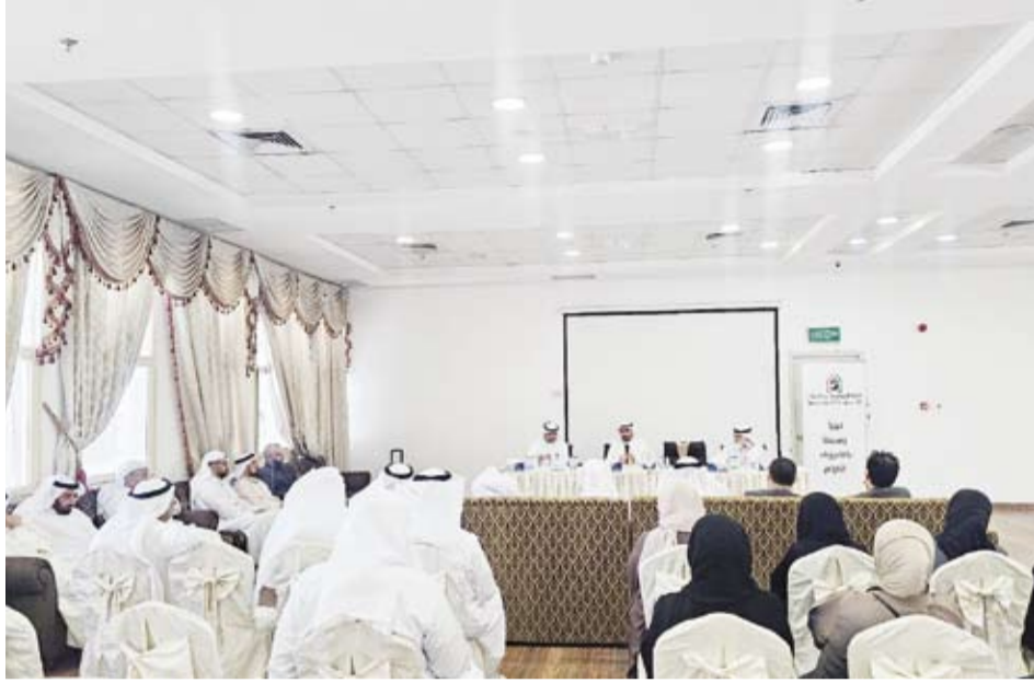
جانب من الجمعية العمومية

عقد اتحاد الجمعيات والمبرات الخيرية، جمعياته العمومية العادية وغير العادية بحضور ممثلين عن وزارة الشؤون الاجتماعية، حيث صادق أعضاء الجمعية العمومية بالإجماع على التقريرين الإداري والمالي، واعتمدا الموازنة التقديرية، وأقروا تعيين مراقب الحسابات، في تأكيد يعكس الثقة بمسيرة الانحياز وجهوده في تعزيز العمل الخيري والإنساني وترسيخ مبادئ الحوكمة والشفافية والإستدامة.