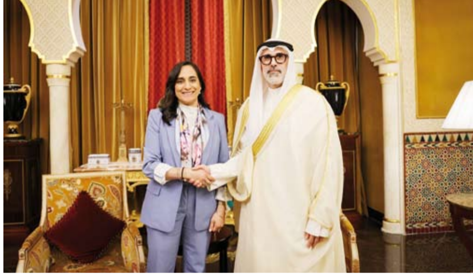
الشيخ جراح الجابر ووزيرة خارجية كندا أنيتا آناند