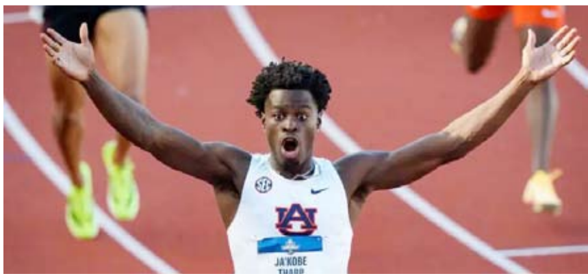
العداء الأمريكي جاكوبي ثارب

حطم العداء الأمريكي جاكوبي ثارب الرقم القياسي العالمي لسباق 110 أمتار حواجز، بعدما سجل زمن قدره 12.75 ثانية خلال تصفيات بطولة الرابطة الوطنية لرياضة الجامعات الأمريكية المقامة في ولاية أوريغون. وتجاوز ثارب الرقم القياسي السابق البالغ 12.80 ثانية، والمسجل باسم مواطنه أريس ميريت منذ السابع من سبتمبر 2012.