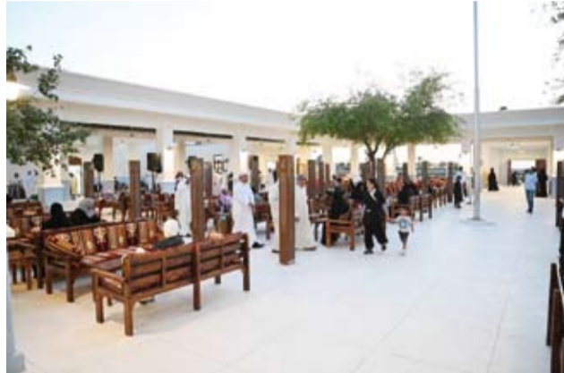
جانب من الجلسات الشعبية في المقهى