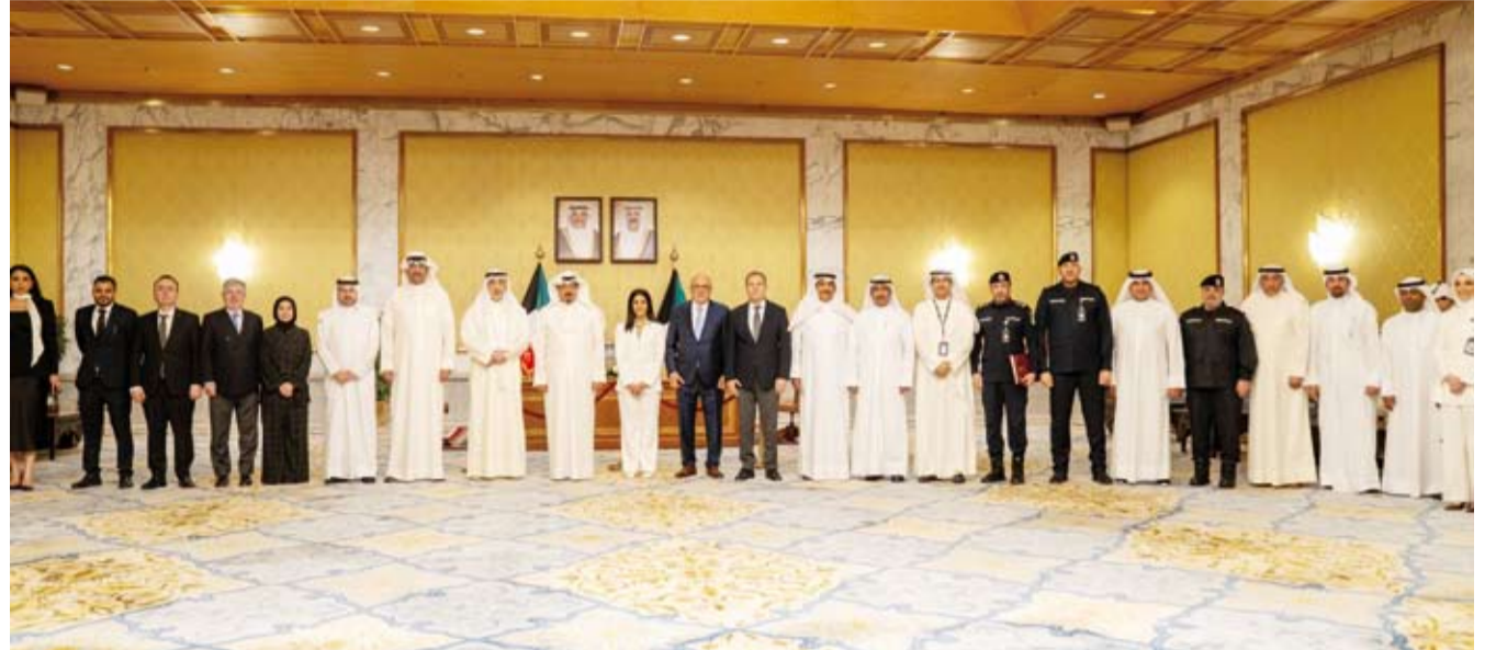
سمو الشيخ أحمد العبدالله خلال حضوره توقيع 3 جهات حكومية عقوداً مع شركة ليماك

اللوجستي في المنطقة فضلاً عن مساهمته في خلق فرص اقتصادية وتنموية متعددة ودعم خطط التنويع الاقتصادي واستقطاب الاستثمارات وتوفير فرص عمل بما يرسخ مكانة الكويت على خارطة المشاريع التنموية الكبرى في المنطقة ويواكب تطورات الدولة نحو مستقبل أكثر تطوراً واستدامة.