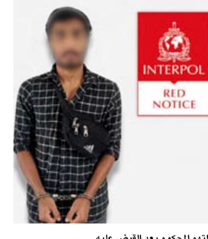
المتهم المحكوم بعد القبض عليه

في قضية غسل أموال. وأوضح أن ذلك يأتي في إطار التعاون الأمني المشترك بين دولة الكويت ودولة الإمارات العربية المتحدة والتنسيق المباشر بين الإدارة العامة للشرطة الجنائية العربية والدولية «الإنتربول الكويتي» ونظيرتها في دولة الإمارات العربية المتحدة».