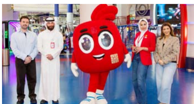
فريق بنك الخليج

في إطار جهوده المستمرة لمكافحة عملائه وتعزيز الوعي المالي لدى الأجيال الناشئة، نظم بنك الخليج يوماً ترفيهياً ممتعاً للأطفال من عملاء حساب neo، وذلك بالتعاون مع مركز Funtiki. أحد أكبر المراكز الترفيهية في الكويت. وقد شهدت الفعالية إقبالاً واسعاً من الأطفال وأولياء أمورهم، الذين شاركوا في مجموعة متنوعة من الأنشطة التعليمية والترفيهية المصممة خصيصاً لغرس قيم الادخار والتوفير لدى الناشئة، إلى جانب فرصة التعرف على الخدمات المصرفية المميزة التي يوفرها البنك لعملاء حساب neo من الأطفال. وسلط فريق بنك الخليج خلال الفعالية الضوء على أهمية الادخار والتخطيط المالي والإدارة المسؤولة للأموال. كما تم تعريف الأطفال بأساسيات التعامل مع المال بطريقة مبسطة ومناسبة لأعمارهم، بما يساعدهم على بناء علاقة صحية مع مفهوم الادخار والإنفاق. وذلك إلى جانب التوعية بأهداف حملة «لنكن على دراية».