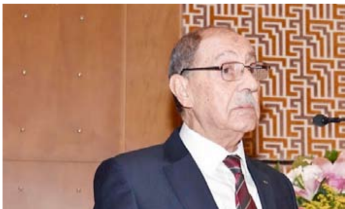
السفير الجزائري عمر بلحاج

وبالنسبة للتشاشيرة فالسفر تسهل منحها للإخوة الكويتيين، وعدد الكويتيين الذين يزورون الجزائر في ارتفاع كل سنة. الجالية الجزائرية نوعية في الكويت: وقال بلحاج أن عدد أبناء الجالية الجزائرية المقيمة في الكويت يتعدى 2000 جزائري، وهي جالية نوعية تساهم في الجهود الوطنية الكويتية، يعمل أغلبها في المجال التقني، فضلاً عن صحافيين وإعلاميين وأساتذة جامعات وطيارين ومدربين رياضيين، بالإضافة إلى مجالات أخرى.