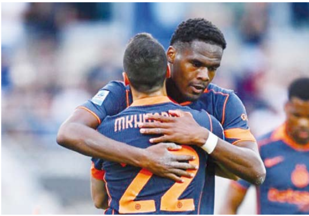
فون كبير لإنتر حامل اللقب

عاد إنتر، المتوج الأحد الماضي باللقب، منتصرا من معقل لاتسيو (3-0)، في المرحلة 36 من الدوري الإيطالي لكرة القدم، في أفضل «بروفة» لنهائي الكاس الذي يجمعه بينادي العاصمة في 13 مايو الحالي على الملعب ذاته. وحسم إنتر اللقب في المرحلة الماضية بتوسيعه الفارق مع بطل الموسم الماضي نابولي إلى 12 نقطة، مع بقاء ثلاث مراحل على نهاية الموسم.