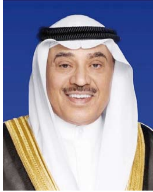
سمو ولي العهد الشيخ صباح الخالد

استقبل سمو ولي العهد الشيخ صباح الخالد، أمس، سمو الشيخ أحمد عبدالله رئيس مجلس الوزراء، كما استقبل سموه، النائب الأول لرئيس مجلس الوزراء ووزير الداخلية الشيخ فهد اليوسف. واستقبل سموه وزير الدفاع الشيخ عبدالله العلي. من جهة أخرى، بعث سمو ولي العهد الشيخ صباح الخالد، ببرقية تهنئة إلى السيدة لويز آر بور، ضمنها سموه خالص تهانئه بمناسبة تعيينها حاكمة عامة لكندا الصديقة، متمنياً سموه لفخامتها كل التوفيق والنجاح ولكندا وشعبها الصديق المزيد من الرقي والنماء.