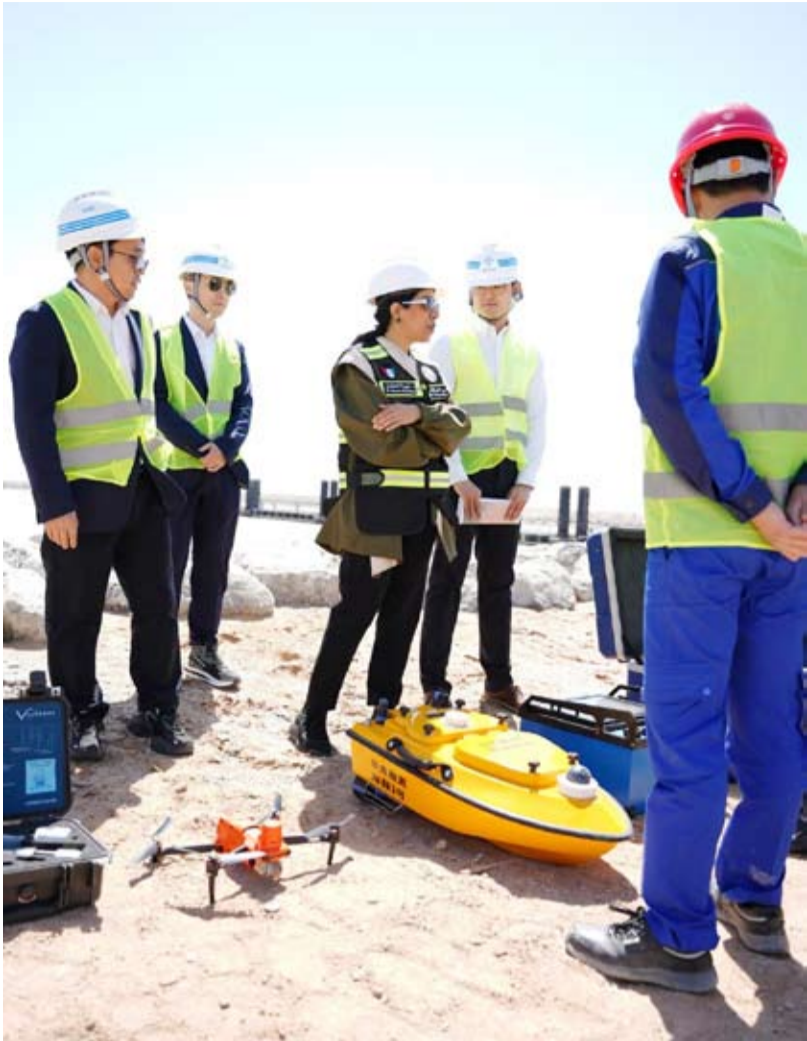
المشعان في أحد المواقع

مستخدميها ويحد من الأعطال والمشكلات المرورية. وأضافت أن الوزارة تعمل على تكثيف الجهود الميدانية خلال المرحلة الحالية لضمان سرعة الإنجاز وتقليل التأثير على الحركة المرورية، مؤكدة أن مشاريع الصيانة الجذرية تأتي ضمن رؤية تطويرية شاملة لتحسين البنية التحتية ودعم خطط التنمية في البلاد.