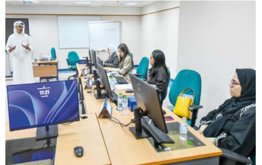
جانب من البرنامج التدريبي