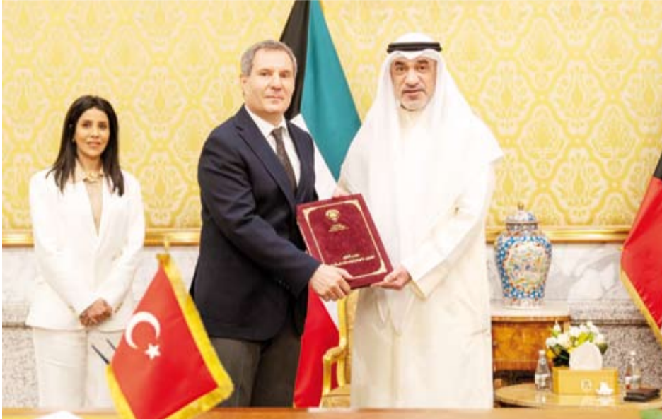
النائب الأول لرئيس مجلس الوزراء الشيخ فهد اليوسف خلال توقيع أحد العقود