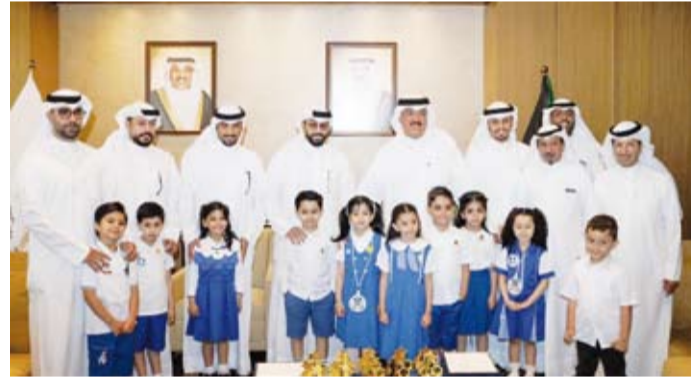
وزير التربية مكرمًا الفائزين بالمراكز الأولى لمبادرة (طفل يقرأ)

الطلبة وتنمية الوعي والمعرفة وصل المهارات اللغوية والفكرية. وقالت وزارة التربية في بيان: إن ذلك جاء خلال استقبال الوزير الطيبطائي لجنة تحكيم المسابقة القادمة من دولة الإمارات العربية الشقيقة بمناسبة انطلاق التصفيات النهائية للموسم العاشر والتي تهدف إلى اختيار ممثلي الكويت بالتصفيات الختامية من بين 60 طالباً وطالبة تأهلوا للمرحلة النهائية بعد اجتيازهم مراحل التصفية المختلفة على مستوى المناطق التعليمية والمدارس المشاركة.