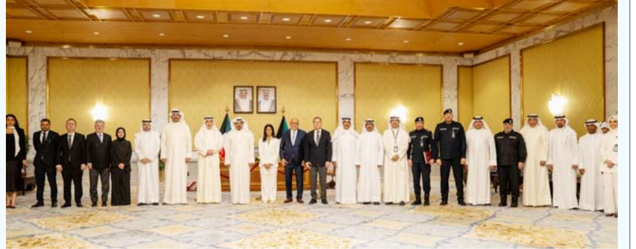
العيدالله خلال حضوره مراسم التوقيع

بحضور سمو الشيخ أحمد عبدالله الأحمد الصباح رئيس مجلس الوزراء وقعت ثلاث جهات حكومية عقوداً مع شركة ليماك التركية العالمية لاستكمال المراحل الأخيرة من مشروع مبنى الركاب الجديد بمطار الكويت الدولي (T2) في خطوة جديدة تعكس التزام الدولة بمواصلة تنفيذ المشاريع التنموية الكبرى وتسريع وتيرة الإنجاز في أحد أهم المشاريع الاستراتيجية والحيوية في البلاد. حضر مراسم التوقيع النائب الأول لرئيس مجلس الوزراء ووزير الداخلية الشيخ فهد اليوسف ووزير الدفاع الشيخ عبدالله العلي