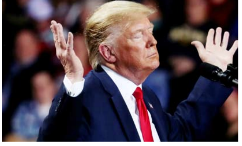
الرئيس الأمريكي: لم أقل أن الحرب انتهت!

قال الرئيس الأمريكي دونالد ترامب، أمس، إن الولايات المتحدة يمكن أن تتحرك ضد إيران عسكرياً لأسبوعين إضافيين، لضرب كل هدف من الأهداف المحددة، مضيفاً أن إيران هزمت لكن هذا لا يعني القضاء عليها تماماً.