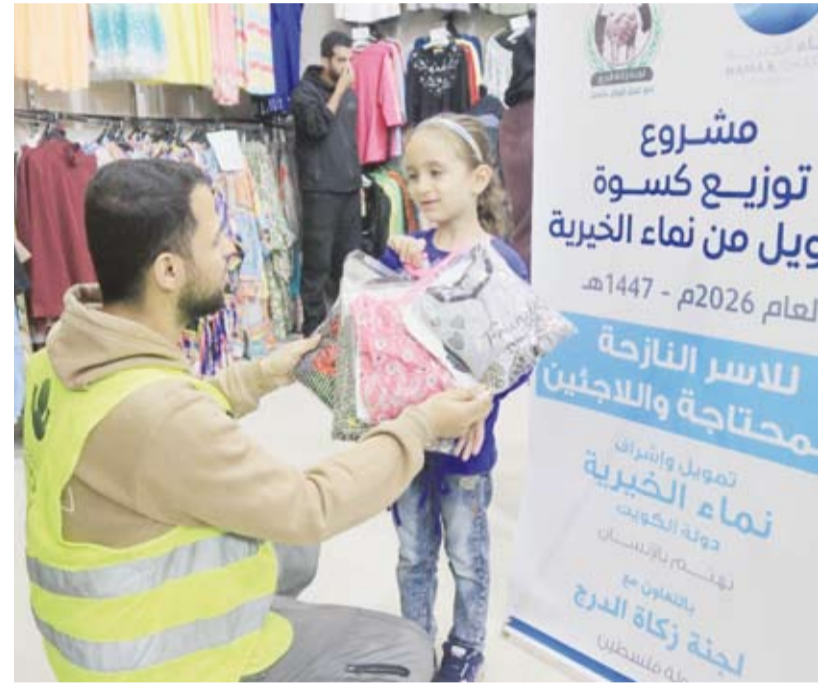
توزيع كسوة العيد على الأطفال

العاجلة للأوضاع المعيشية القاسية التي يواجهها أهالي شمال قطاع غزة في ظل النقص الحاد في المواد الغذائية، مبيناً أن المشروع أسهم في توفير احتياجات غذائية طازجة للأسر الأكثر احتياجاً لا سيما الأطفال وكبار السن. وبيّن أن تنفيذ مشروع توزيع الكسوة يهدف إلى تخفيف الأعباء المعيشية وإدخال الفرحة على الأسر الفلسطينية في ظل الظروف