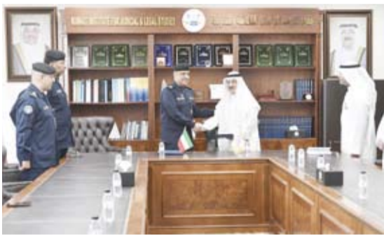
جانب من حفل توقيع مذكرة التفاهم