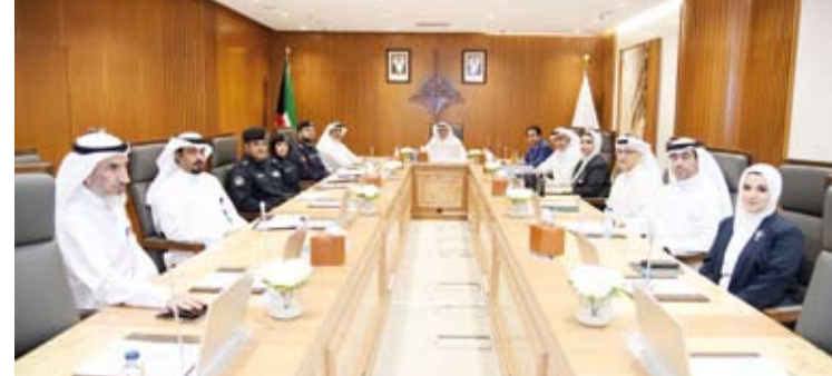
جانب من الاجتماع الموسع