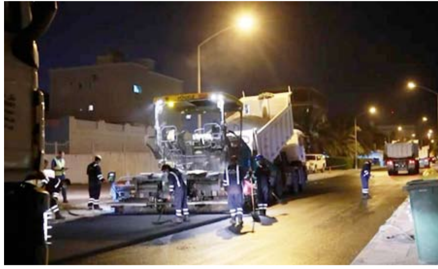
جانب من الأعمال

من جهة أخرى أعلنت وزارة الأشغال العامة وبالتعاون مع الإدارة العامة للمرور تغلق طريق الدائري السادس القادم من الجهراء باتجاه المسيلة وتحويل الطريق الى طريق 604 باتجاه كبد لأعمال تركيب حواجز جسر (صباح الناصر) من الثانية عشر ليلا الى الساعة العاشرة صباحا ابتداء من الغد الى فجر الخميس المقبل.