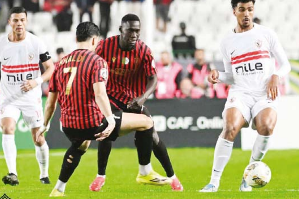
جانب من اللقاء الحار بين الزمالك واتحاد العاصمة

أسقط اتحاد العاصمة الجزائري ضيفه الزمالك المصري المقصود عدديا في الرق الأخير 1-0 على ملعب 5 جويلية، في العاصمة الجزائرية في ذهاب نهائي كأس الاتحاد الأفريقي «الكونفدرالية» بنسختها الثالثة والعشرين، السبت، منتزعا أفضلية ولو طفيفة قبل مواجهة الإياب في القاهرة الأسبوع المقبل.