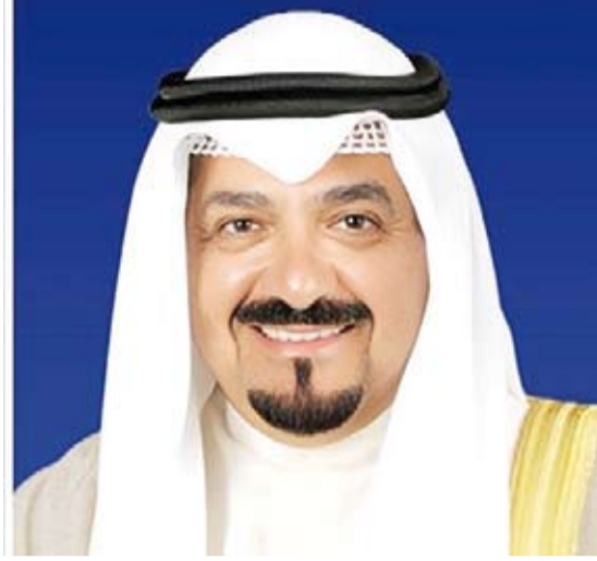
سمو الشيخ أحمد عبدالله

بعث سمو الشيخ أحمد عبدالله رئيس مجلس الوزراء، ببرقية تهنئة إلى السيدة لويز آر بور، ضمنها سموه خالص تهانئه بمناسبة تعيينها حاكمة عامة لكندا الصديقة.