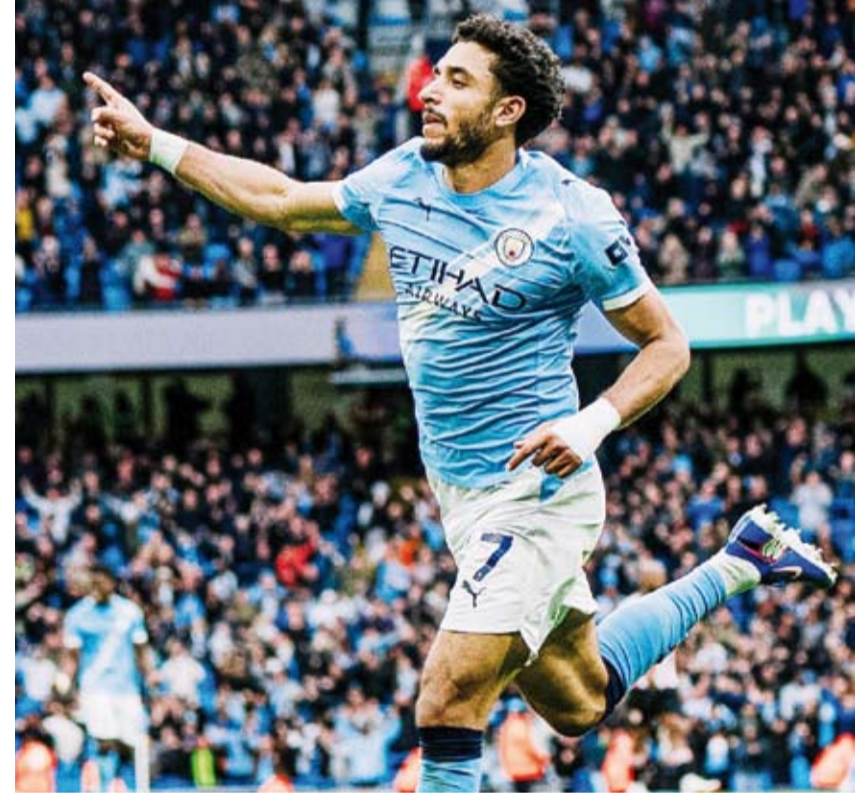
عمر مرموش يسجل في فوز السيتي

بقية مانشستر سيتي في صراع اللقب بفوزه على برنتفورد 3-0، السبت في المرحلة 36 من الدوري الإنجليزي لكرة القدم، فيما انتهت مواجهة ليفربول وتشلسي بتعادل مشوق 1-1.