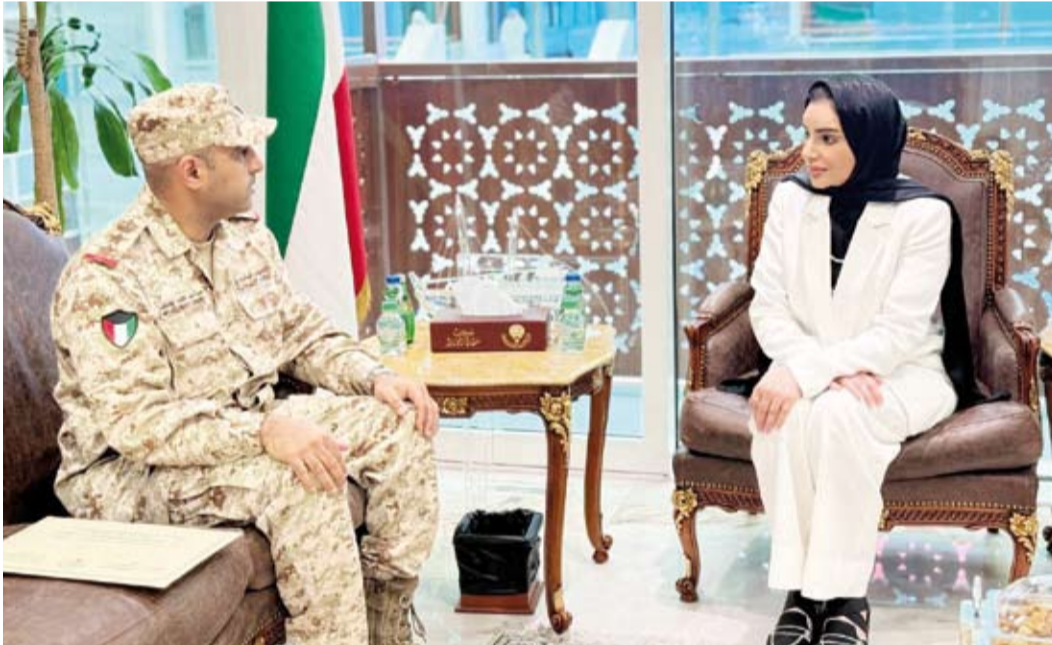
د. أمثال الحويلة خلال لقائها رئيس فريق «أمان»

بحثت وزيرة الشؤون الاجتماعية وشؤون الأسرة والطبولة الدكتورة أمثال الحويلة، أمس، مع رئيس فريق العمل المعني بإنشاء مركز لإدارة الأزمات والكوارث على المستوى الوطني (أمان) آخر المستجدات المتعلقة بأعمال الفريق وخطته الحالية. وقالت الوزيرة الحويلة في تصريح صحفي عقب اللقاء: إن الاجتماع تناول التنسيق بشأن أعمال الفريق التابع لقرار مجلس الدفاع الأعلى والذي يجعل بإشراف من وزير الدفاع لتعزيز الجاهزية الوطنية في مواجهة الطوارئ. وأوضحت أنه تم استعراض أبرز الجهود المبذولة لإنشاء المركز إضافة إلى مناقشة مراحل العمل الحالية وآليات التنسيق والتعاون بين الجهات المعنية بما يدعم تكامل الأدوار خلال الأزمات. وأكدت الحويلة أهمية استمرار التعاون والتنسيق المشترك بما يسهم في دعم توجهات الفريق وتحقيق الأهداف المرتبطة بتطوير منظومة وطنية متكاملة لإدارة الأزمات والكوارث في البلاد.