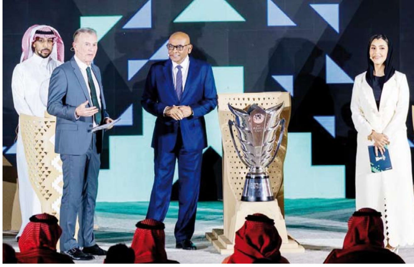
جانب من مراسم إجراء القرعة في العاصمة السعودية الرياض

أكد رئيس الاتحاد الآسيوي لكرة القدم النائب الأول لرئيس الاتحاد الدولي لكرة القدم الشيخ سلمان آل خليفة أن نهائيات كأس آسيا السعودية 2027 ستكون استثنائية بكل المقاييس معتبرا أن البطولة تمثل منصة لإبراز التطور المتنامي لكرة القدم الآسيوية وتعزيز مكانة كأس آسيا على الساحة الدولية. وقال الشيخ سلمان في تصريح صحفي بمناسبة حفل كرة البطولة «إن الاتحاد الآسيوي يواصل مواكبة التطور الكروي في القارة في ظل الاتساع التاريخي في شعبية اللعبة وقاعدتها الجماهيرية وفي إطار التعاون بين الاتحاد القاري والاتحادات الوطنية الأعضاء».