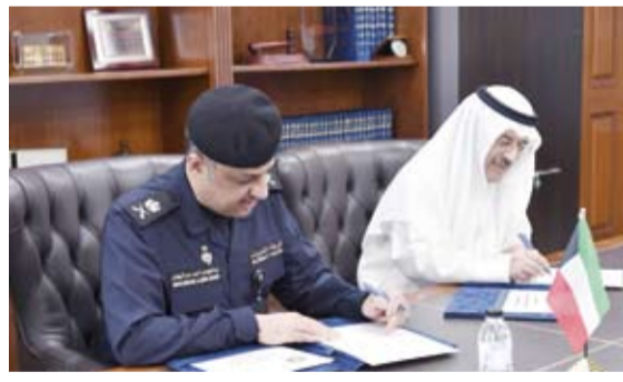
المستشار بدر المسعد يوقع مذكرة تفاهم مع اللواء عبدالوهاب الوهيب

وقّع معهد الكويت للدراسات القضائية والقانونية مع وزارة الداخلية مذكرة تفاهم تعنى بتعزيز التعاون وتبادل الخبرات والمعلومات في مجال التدريب والاستفادة من الوسائل والإمكانيات المتاحة لكل منهما بغية تكوين كوادر وطنية على قدر كبير من الكفاءة. وأكد مدير المعهد المحامي السدي وقع المذكرة مع وكيل (الداخلية) اللواء عبدالوهاب الوهيب، أن المذكرة تهدف إلى تعزيز أطر التعاون المشترك بالمجالات ذات الاهتمام المتبادل لاسيما في مجالات نشر الوعي القانوني والتدريب والتأهيل. وقال: إن المذكرة تهدف أيضاً إلى تبادل الخبرات العلمية والعملية وتنظيم البرامج والدورات وورش العمل بما يسهم في دعم وتطوير الدورين الأكاديمي والتدريب.