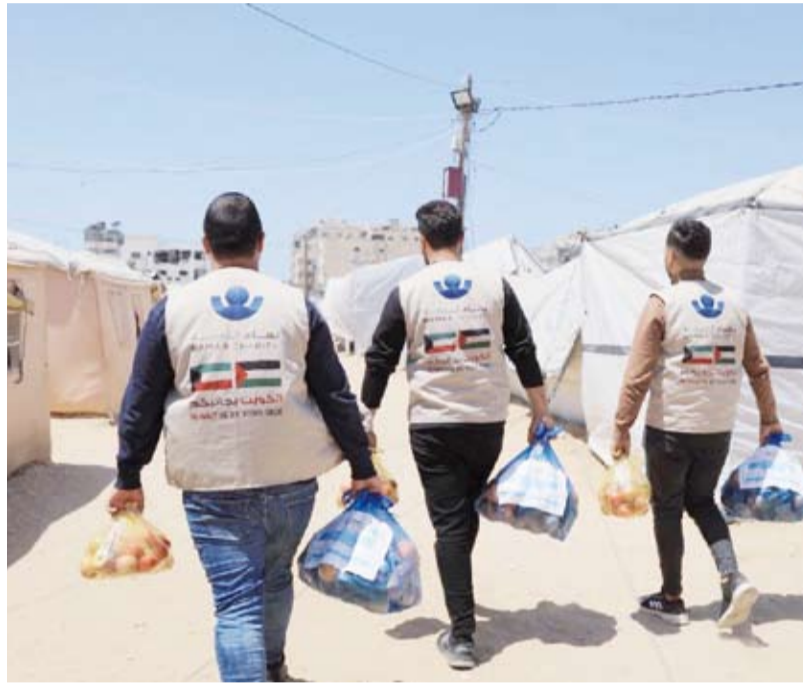
.. وتوزيع الخضار والفواكه