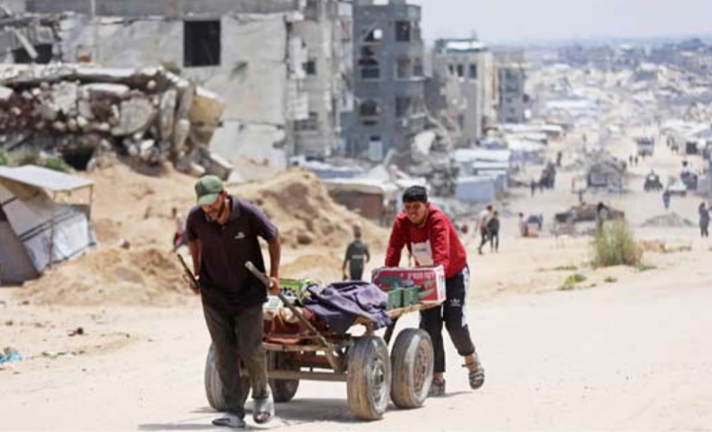
فلسطينيون نازحون في جباليا شمال غزة

رئيس الوزراء الإسرائيلي حول المسار المستقبلي، وتعمل مع جميع الأطراف لتحويل هذا الالتزام إلى إجراءات ملموسة، وهذا يتطلب اتخاذ قرارات لتحقيق التقدم»، دون أن يحدد تلك القرارات. المصدر المصري أوضح أن ذلك اللقاء الذي جمع ملادينوف بنتنياهو، لم يكن ناجحاً، وشهد تقديم ورقة عمل لرئيس الوزراء الإسرائيلي تتضمن مسارات التحرك الجديدة التي سيتم العمل عليها في الفترة المقبلة، إلا أن اللقاء لم يحقق تقدماً، ولم يكن جيداً..