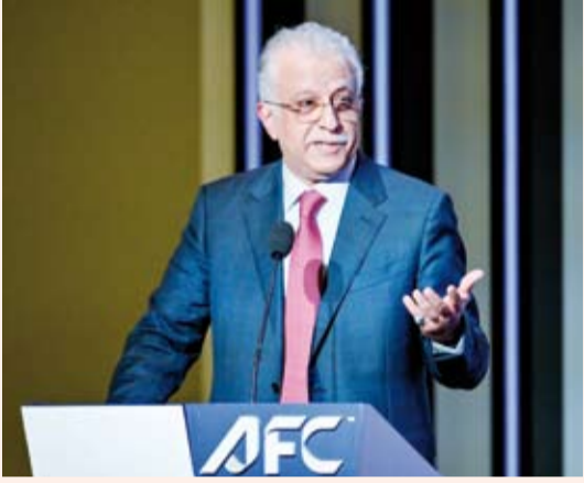
الشيخ سلمان آل خليفة

أكد رئيس الاتحاد الآسيوي لكرة القدم النائب الأول لرئيس الاتحاد الدولي لكرة القدم الشيخ سلمان آل خليفة أن نهائيات كأس آسيا السعودية 2027 ستكون استثنائية بكل المقاييس معتبرا أن البطولة تمثل منصة لإبراز التطور المتنامي لكرة القدم الآسيوية وتعزيز مكانة كأس آسيا على الساحة الدولية. وقال الشيخ سلمان في تصريح صحفي بمناسبة حفل كرة البطولة «إن الاتحاد الآسيوي يواصل مواكبة التطور الكروي في القارة في ظل الاتساع التاريخي في شعبية اللعبة وقاعدتها الجماهيرية وفي إطار التعاون بين الاتحاد القاري والاتحادات الوطنية الأعضاء».