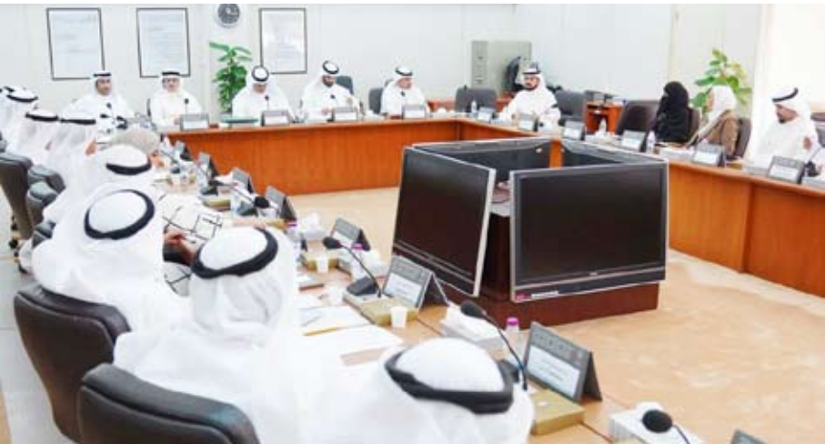
جانب من اجتماع لجنة شؤون التعليم والموارد البشرية

قبل بداية دور الانعقاد المقبل. وذكر البيان إن ذلك جاء استنادا إلى المادة (53) من اللائحة الداخلية وبناء على الاجتماعات المشتركة المتعددة بين لجنة شؤون التعليم والثقافة والإرشاد والموارد البشرية والتي تونقشت خلالها الموضوعات المتعلقة بالجمع بين الوظيفة والدراسة والدرجة على جدول أعمال اللجنتين.