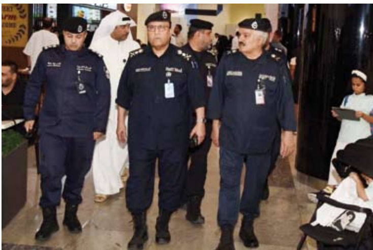
الفريق أنور البرجس خلال الجولة التفتيدية

لجميع العاملين في المطار لما يقومون من دور كبير ببرز الوجه الحضاري المشرف لدولة الكويت باعتبارهم واجهة الدخول إلى البلاد.