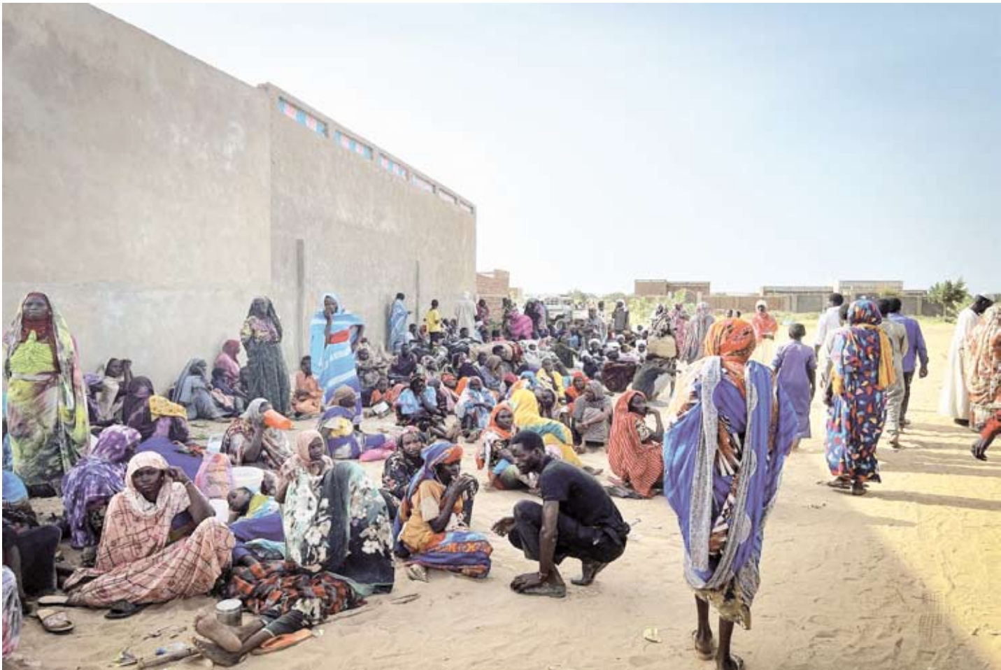
النازحين في السودان

قتل وأصيب العشرات من المدنيين والعسكريين، في معارك ضارية بين الجيش وقوات «الدعم السريع» في أحياء مختلفة من مدينة أمدرمان، أكبر مدن العاصمة السودانية الخرطوم، فيما وصف شهود ومصادر عدة القصف الجوي والمدفعي بأنه الأكثر كثافة وقوة طيلة فترة الحرب التي اندلعت في 15 أبريل، ما أدى إلى شلل تام للحياة وتوقف حركة المواصلات العامة. وقال شهود لـ«الشرق الأوسط» إن ما لا يقل عن 20 مدنيًا قتلوا وأصيب عشرات آخرون خلال الاشتباكات العنيفة التي دارت بين الطرفين منذ صباح أمس في مناطق واسعة من مدينة أمدرمان، واستمرت حتى ساعة متأخرة من الليل بدون توقف، وهو ما أكدته وزارة الصحة التي أعلنت أن المستشفيات استقبلت أكثر من 20 مدنيًا لقوا حتفهم جراء القصف والاشتباكات، مشيرة إلى أن أعداد الضحايا في تزايد.