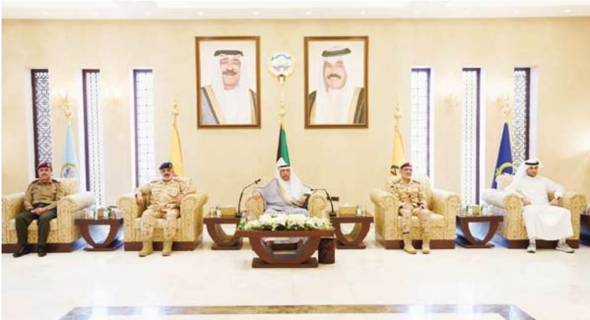
جانب من حفل ختام المسابقة