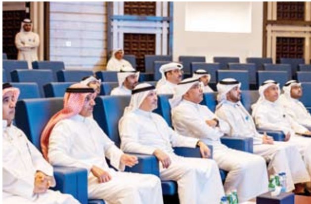
الشيخ سالم الصباح خلال الزيارة

العربي، وذلك من خلال خلق منصة للمناقشة والتباحث حول التحديات الأمنية على المستويين الإقليمي والدولي وتنمية الفهم المشترك وتقريب وجهات النظر بين الأطراف ذات الصلة.