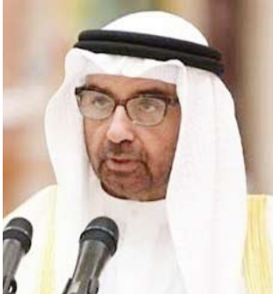
وزير المالية بالوكالة