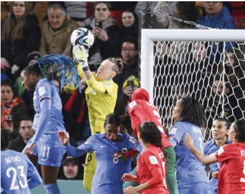
لاعبات المغرب قُدمن مستويات مميزة خلال كأس العالم

تاهل منتخب فرنسا إلى دور الثمانية ببطولة كأس العالم لكرة القدم للسيدات، إقامة حالياً في أستراليا ونيوزيلاندا، بعدما تغلب على المنتخب المغربي 4 - صفر خلال المباراة التي جمعتهما في دور الـ16 من البطولة.