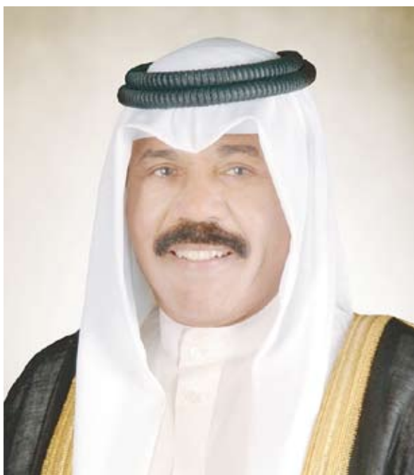
سمو أمير البلاد الشيخ نواف الأحمد

بعث صاحب السمو أمير البلاد الشيخ نواف الأحمد، ببرقية تهنئة إلى الرئيسة حليمه يعقوب رئيسة جمهورية سنغافورة الصديقة، عبر فيها سموه عن خالص تهنائه بمناسبة العيد الوطني لبلادها، متمنياً سموه لفخامتها موفور الصحة والعافية ولجمهورية سنغافورة وشعبها الصديق كل التقدم والازدهار.