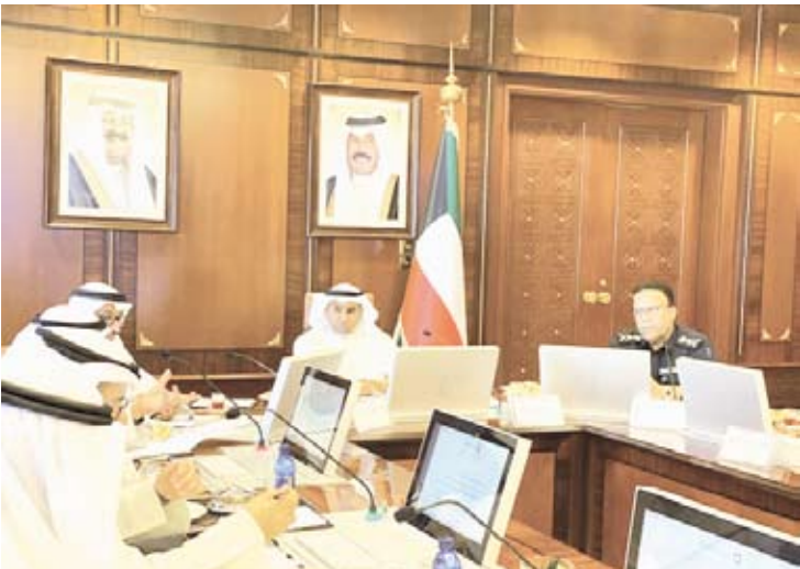
جانب من اجتماع اللجنة التنسيقية للإشراف على «سهل» و«سهل لأصحاب الأعمال»

أكد وزير الدولة لشؤون البلدية ووزير الدولة لشؤون الاتصالات، فهد الشلعة، ضرورة العمل على أخذ خطوات تطويرية تسهم في تعزيز تجربة المستخدمين للخدمات الإلكترونية للحكومة للأفراد وأصحاب الأعمال عبر تطبيقي (سهل) و(سهل لأصحاب الأعمال). وقال الشلعة في تصريح له (كونا) أمس، عقب ترؤسه اجتماع اللجنة التنسيقية للإشراف على تطبيقي (سهل) و(سهل لأصحاب الأعمال): إن اتخاذ مثل هذه الخطوات التطويرية يتم من خلال تعاون الجهات الحكومية لرفع مستوى جودة ما تقدمه من خدمات ومنتجات رقمية. وأوضح أن اللجنة التنسيقية مستمرة في الدفع بزيادة أثر جهود الجهات الحكومية نحو تطوير آلية تقديمها للخدمات الإلكترونية عملاً بتوجه الدولة وترسيخاً لخطّة عمل الحكومة فيما يخص مفهوم الحكومة المنجية وتمكينها رقمية. وأضاف أن اللجنة عقدت اجتماعها من أجل توحيد فرق العمل وتكثيف الجهود العاملة وهي ماضية في تحقيق واستكمال رؤية الدولة التنموية، مشيراً إلى أن هذا التوجه يعكس الرغبة الجادة لدى القيادات الحكومية لوضع خطط في هذا الشأن وتنفيذها لتكون جميع المعاملات الحكومية إلكترونية ومن مكان واحد.