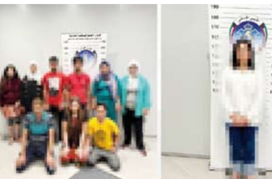
ضبط 10 أشخاص بتهمة ممارسة الرذيلة

ذكرت الإدارة العامة للإعلام الأمني بوزارة الداخلية، أنه في إطار استمرار متابعة ورصد كافة الظواهر الخارجة عن القانون والآداب العامة، تمكن قطاع الأمن الجنائي ممثلاً بإدارة حماية الآداب العامة من ضبط فتاة من جنسية أسبوية بتهمة ممارسة الرذيلة مقابل مبالغ مالية، وذلك عن طريق حساب على مواقع التواصل الاجتماعي، كما تم ضبط (9) أشخاص من جنسية أسبوية بموقعين في منطقة المهولة لممارسة الأعمال المنافية، وتم إحالته لجهات الاختصاص لاتخاذ كافة الإجراءات القانونية اللازمة بحقهم. من جهة أخرى، تمكن قطاع الأمن العام ممثلاً في مديرية أمن الجهراء (إدارة العمليات والدوريات)