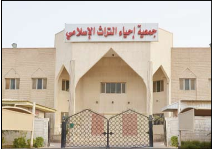
جمعية إحياء التراث الإسلامي

بتوفير دعاة على دراية بلغة كل جالية ليسهل التواصل وتبليغ دين الله. وأوضحت الجمعية بأنها تقدم العديد من الأنشطة الدعوية والخيرية والثقافية التي تخدم هذه الجاليات، سواء كانوا عمالة منزلية أو غيرهم، فهم بحاجة إلى من يلقي في قلوبهم بذور الهداية، وذلك من خلال طرح مشاريع عديدة للدعوة إلى الإسلام بالحكمة والموعظة الحسنة، ومتابعة المهتدين الجدد، وإقامة الدروس الشرعية، وتوزيع المصاحف والكتب، بالإضافة إلى تنظيم رحلات العمرة.