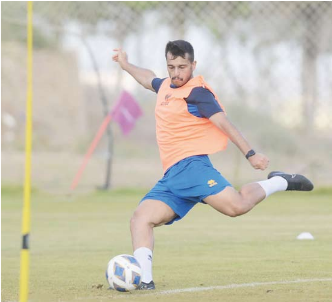
جانب من تدريبات الفريق في مصر

ولفت مدرب الأصفر إلى أن المباريات الودية فرصة لتصحيح الأخطاء والوصول لمعدل بدني مميز، معرباً عن ثقته في اللاعبين وقدرتهم على تحقيق هذا الأمر.