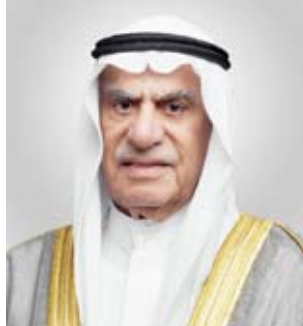
رئيس مجلس الأمة