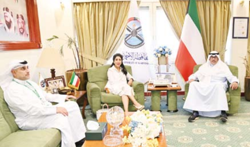
محافظ الأحمدى مستقبلاً «التجاري»

باللقاء المخمر الذي تناول جوانب دعم العمل المشترك في مجالات المسؤولية الاجتماعية وعدداً من الأنشطة والفعاليات التي ستتنظمها المحافظة خلال العام الحالي، والتي سوف يقوم البنك والمحافظة برعايتها بما يعود بالنفع والفائدة على جميع فئات المجتمع ويحقق التنمية المستدامة لوطننا الحبيب.