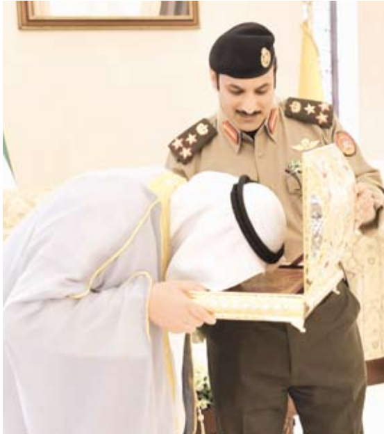
... ويقبل القرآن الكريم