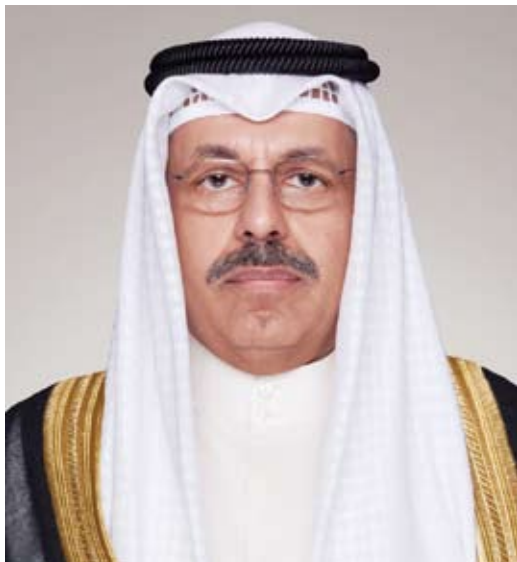
سمو الشيخ أحمد النواف

بعث سمو الشيخ أحمد النواف رئيس مجلس الوزراء، ببرقية تهنئة إلى الرئيسة حليمه يعقوب رئيسة جمهورية سنغافورة الصديقة بمناسبة العيد الوطني لبلادها.