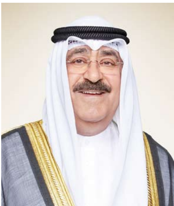
سمو ولي العهد الشيخ مشعل الأحمد

بعث سمو ولي العهد الشيخ مشعل الأحمد، ببرقية تهنئة إلى الرئيسة حليمه يعقوب رئيسة جمهورية سنغافورة الصديقة، ضمنها سموه خالص تهنائه بمناسبة العيد الوطني لبلادها وراجياً لفخامتها دوام الصحة والعافية.