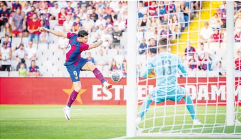
ليفاندوفسكي يسجل الهدف الأول

أعلن نادي برشلونة بطل الدوري الإسباني تعاqude مع لاعب الوسط الشاب نوح دارفيتش، ذي الأصول العراقية، من صفوف فرايبورغ الألماني. وضم برشلونة اللاعب البالغ عمره ”16 عاماً” بعقد يمتد حتى 2026 وسيشارك مع الفريق الريدف في دوري الدرجة الثالثة الإسباني. ودفع برشلونة 2ر5 مليون يورو