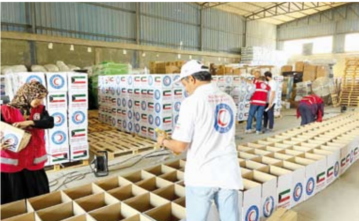
جانب من تجهيز مساعدات جمعية الهلال الأحمر الكويتي للشعب السوداني