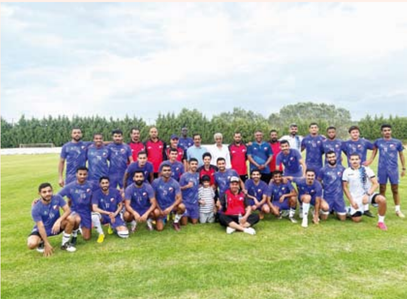
لاعبو خيطان في معسكر تركيا