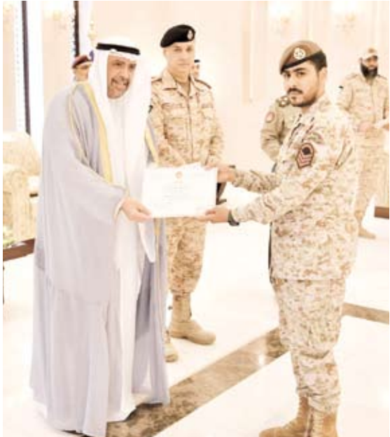
وزير الدفاع يوزع الشهادات والجوائز على الفائزين