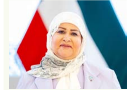
الشيخة تماضر الخالد الصباح

المستوى مع الشركاء الاستراتيجيين مثل الاتحاد الأوروبي والهند واليابان إلى جانب التحضير للملتقيات الإعلامية البترولية التي تعزز حضور دول المجلس ودورها الريادي على المستويين الإقليمي والدولي. وأكد أن التعاون الخليجي في قطاع النفط والطاقة ظل على الدوام نموذجا يحتذى في التنسيق المشترك لمواجهة مختلف التحديات لافتاً إلى أن هذا الاجتماع يمثل فرصة ثمينة لتبادل الرؤى والمقترحات وتطوير المبادرات التي تدعم استدامة القطاع وتعزيز مكانة