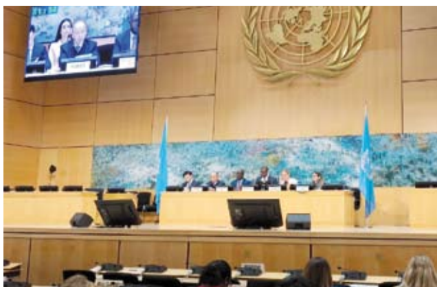
اجتماع مجلس الامم المتحدة لحقوق الإنسان

أكد وزير الخارجية عبدالله الجحيا، أن العلاقات التاريخية الراسخة الممتدة لأكثر من 126 عاماً بين دولة الكويت والمملكة المتحدة الصديقة تحظى باهتمام متواصل للتطور والنماء في شتى المجالات بما يحقق المصالح والتطلعات المشتركة للبلدين الصديقين. وقال الوزير الجحيا لـ (كوئنا)، أمس، عقب زيارة سمو ولي العهد الشيخ صباح الخالد إلى المملكة المتحدة إن هذه العلاقات الوثيقة تظل نموذجاً للصدقة المتينة والتعاون البناء في مختلف المجالات. وأضاف أن الزيارة جاءت تجسيدا لأواصر الشراكة والصدقة التي تجمع البلدين حيث التقى سمو ولي العهد بصاحب السمو الملكي الأمير وليام ولي عهد المملكة المتحدة أمير ويلز في قصر