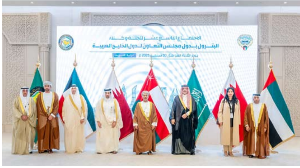
المشاركون في اجتماع لجنة وكلاء وزارات البترول بدول مجلس التعاون الخليجي

انطلقت في الكويت أعمال الاجتماع الـ19 للجنة وكلاء وزارات البترول بدول مجلس التعاون لدول الخليج العربية بمشاركة وكلاء وزارات النفط والطاقة في الدول الأعضاء في إطار التحضيرات للاجتماع لجنة التعاون البترولي على مستوى وزراء النفط والطاقة.