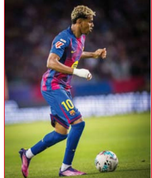
لامين يامال أمل برشلونة في حسم اللقاء

تتجه الأ نظار اليوم الأربعاء إلى القمة النارية بين باريس سان جيرمان حامل اللقب، وبرشلونة بطل إسبانيا، فيما يسعى أرسنال لتأكيد حضوره القوي في دور الميادين هذا الموسم، ضمن الجولة الثانية من دوري الأبطال الأوروبي لكرة القدم. على الملعب الأولمبي في مونتجوك، وبانتظار عودة الفريق الكاتالوني إلى كامب نو، يواجه سان جيرمان أحد أكبر اختياراته هذا الموسم، في ظل أزمة إصابات كبيرة تثقل كاهل فريق العاصمة الفرنسية. ويتقدم قائمة المصائب نجمه الأبرز عثمان ديمبيلي المتوج بجائزة الكرة الذهبية لأفضل لاعب في العالم الأسبوع الماضي، بعد عروضة الكبيرة الموسم الماضي الذي شهد تسجيله 35 هدفاً.