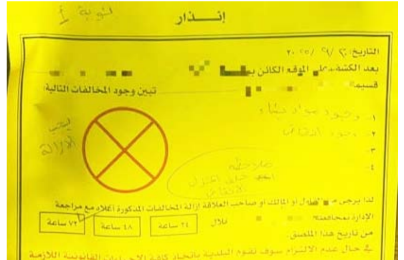
ملصق مخالفة وتنبية

أعلنت إدارة العلاقات العامة عن قيام الفرق الرقابية لإدارة السلامة في محافظة الفروانية بالتفتيش على الأعمال الإنشائية وتوفير وسائل الأمن والسلامة ورصد المخالفات في مواقع الإنشاء والتريم واتخاذ كافة الإجراءات الرقابية بحق المخالفين والتأكد من مدى الالتزام بلوائح ونظم أعمال السلامة.