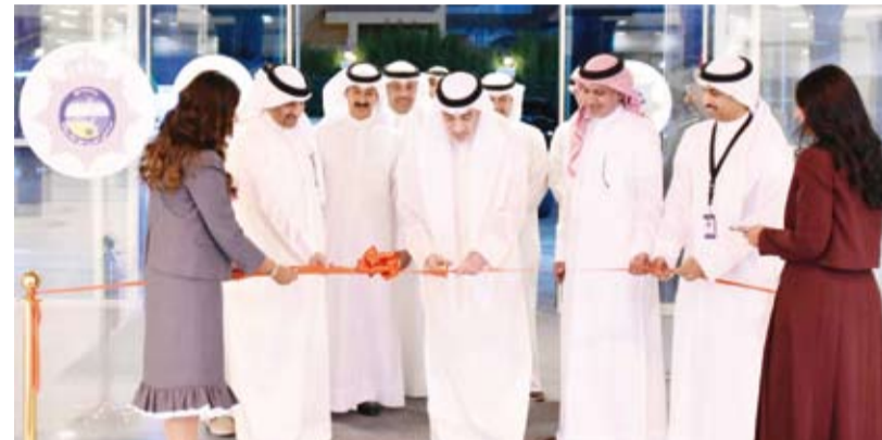
الشيخ فهد اليوسف يشهد افتتاح المرافق الجديدة لنادي ضباط الشرطة