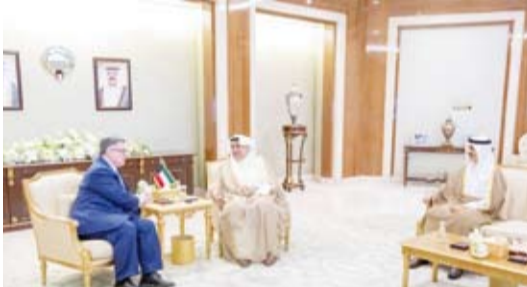
العلي والجابر يستقبلان القائم بالأعمال في سفارة الولايات المتحدة