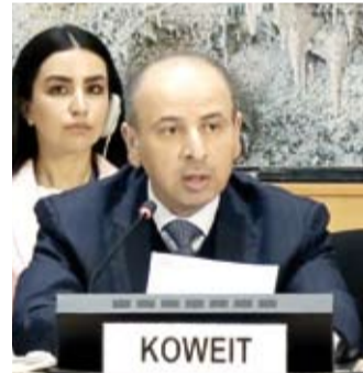
السفير ناصر الهين متحدثاً

الهين: ضرورة التوصل إلى اتفاق قوري وشامل لوقف إطلاق النار في «غزة»