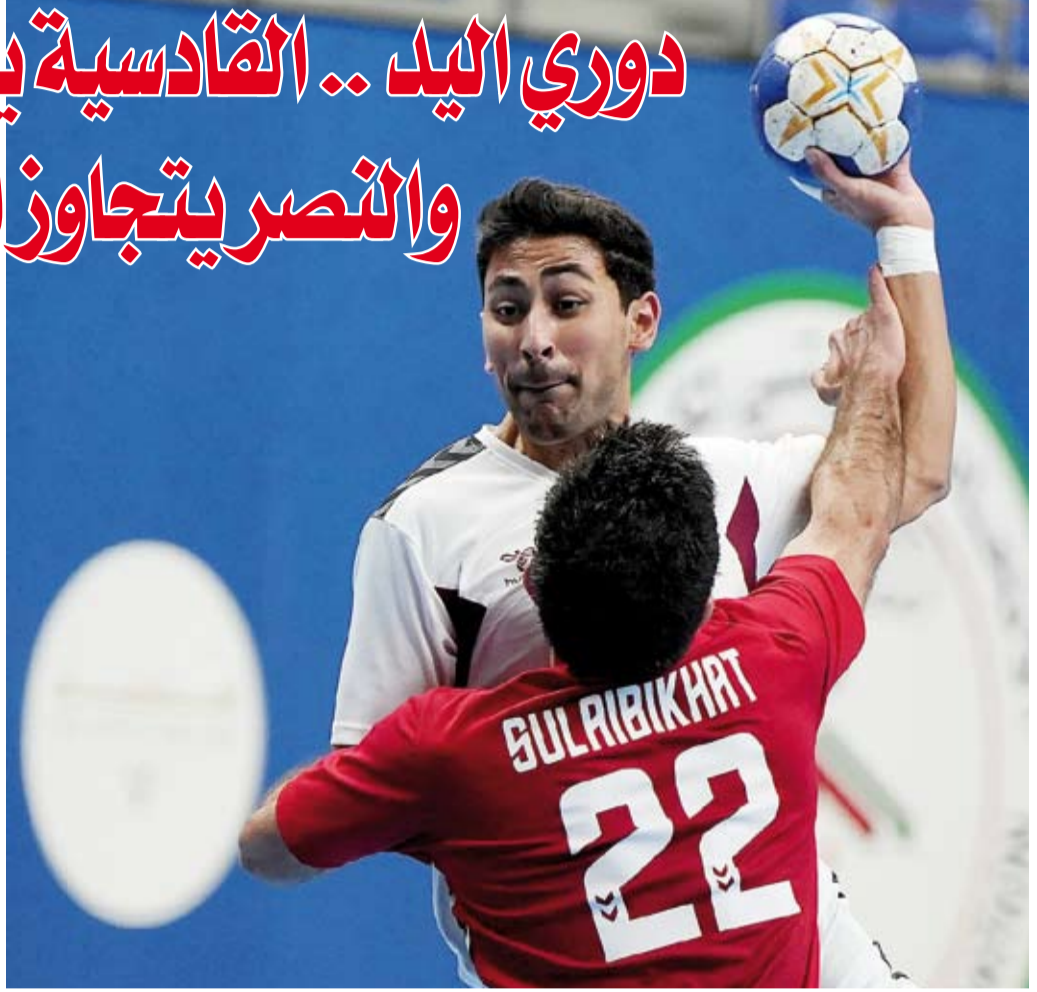
جانب من مباراة النصر والصليبيخات

جاءت المباراة سريعة وحماسية ورغم خروج الصليبيخات متقدماً في الشوط الأول (16-13) إلا أن عزيمة لاعبي النصر مكنتهم من خطف الفوز فيما مني المنافس بخسارته الرابعة هذا الموسم.