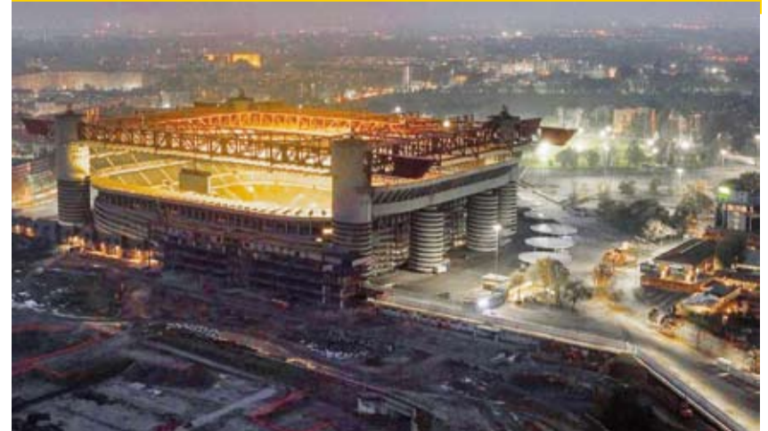
ملعب سان سيرو

وافق مجلس مدينة ميلانو على بيع ملعب سان سيرو والأراضي المحيطة به إلى ناديي ميلان وإنتر ميلان المحليين مقابل 197 مليون يورو (230 مليون دولار)، مما يمهد الطريق لهدمه وبناء استاد جديد. وأنشئ ملعب سان سيرو عام 1926 بسلامته والحل ونية المذهلة التي تحيط بالجزء الخارجي للاستاد، وقد تم تجديده لاستضافة كأس العالم 1990 لكنه يفقر للمرافق الموجودة في ملاعب كرة القدم الأوروبية الأخرى. ويرى ناديي ميلان وإنتر ميلان، اللذان يتقاسمان منذ فترة طويلة استخدام الملعب التاريخي، أن