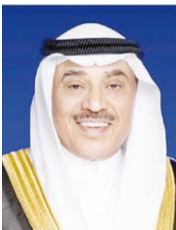
سمو ولي العهد الشيخ صباح الخالد

عاد سمو ولي العهد الشيخ صباح الخالد والوفد الرسمي المرافق لسموه، فجر أمس، إلى أرض الوطن، وذلك بعد الزيارة الرسمية إلى المملكة المتحدة الصديقة. ورافق سموه، وفد رسمي ضم وزير الخارجية عبدالله الجحيا وكبار المسؤولين. وقد بعث سمو ولي العهد الشيخ صباح الخالد، ببرقية تعزية إلى صاحب السمو الملكي الأمير وليام ولي عهد المملكة المتحدة الصديقة أمير ويلز هذا نصها: «صاحب السمو الملكي الأمير وليام أمير ويلز تحية طيبة وبعد... ونحن نغفور المملكة المتحدة لبريطانيا العظمى وإيرلندا الشمالية الصديقة بعد اختتام زيارتنا الرسمية يسرني أن أعرب لسموكم باسمي وباسم أعضاء الوفد المرافق عن خالص الشكر وعميق الامتنان لاستقبال الودي والحفاوة البالغة التي أحاطتونا بها طوال فترة الزيارة والتي جسدت منانة الروابط التاريخية الوثيقة بين بلدنا الصديق والممتدة جذورها لأكثر من 125 عاماً والقائمة على أسس متينة من الاحترام