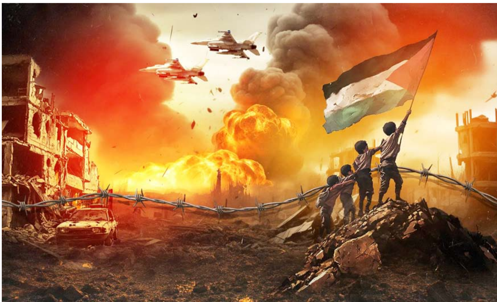
دمار هائل في غزة نتيجة الحرب

وأكد الشيخ محمد بن عبد الرحمن آل ثاني رئيس الوزراء وزير الخارجية القطري في البيان، استعداد بلاده «لمواصلة الانخراط في العمل للوصول لنهاية للحرب في قطاع غزة في إطار مبادرة الرئيس الأميركي».