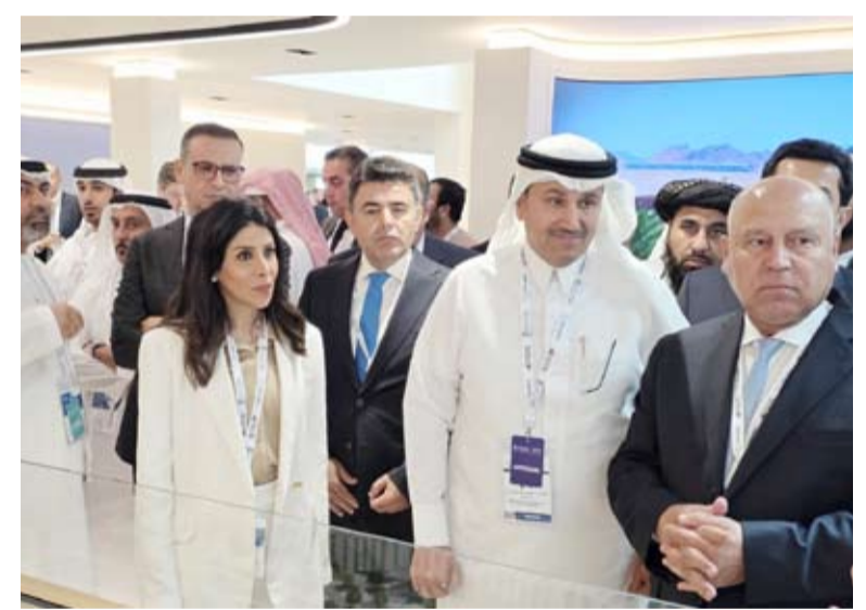
افتتاح المؤتمر العالمي للسكك الحديدية والنقل والبنية التحتية «جلوبال ريل 2025»

أكدت وزيرة الأشغال العامة د. نورة المشعان أمس أن مشاركة دولة الكويت في المؤتمر العالمي للسكك الحديدية والنقل والبنية التحتية "جلوبال ريل 2025" تعكس الحرص على الوجود في المنصات الدولية المتخصصة والالتزام بدعم قطاع النقل كأحد المحركات الأساسية للتنمية المستدامة وتعزيز التعاون الخليجي في شتى المجالات. عقب افتتاح المؤتمر في أبوظبي أعربت المشعان عن تطلع دولة الكويت إلى الاستفادة من مخرجات الجلسات النقاشية وحلقات العمل المتعلقة بالحلول المبتكرة والتقنيات الحديثة، مبينة أن تعزيز الربط الخليجي والعربي في قطاع السكك الحديدية يشكل أولوية لتحقيق التكامل الاقتصادي وزيادة انسيابية حركة التجارة والأفراد.