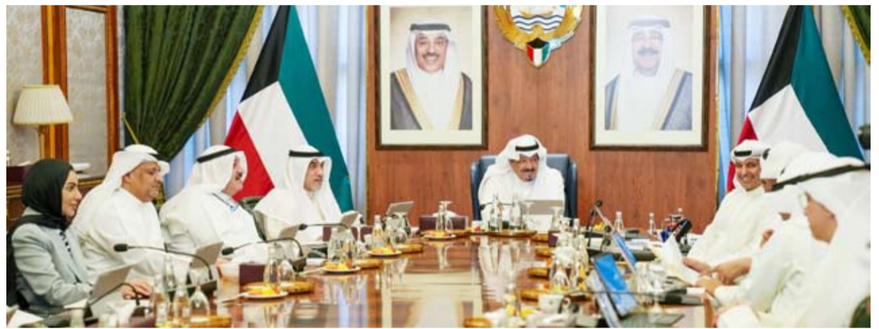
العبدالله يتراش اجتماع مجلس الوزراء أمس

◆ إلغاء مجلس شؤون الخبراء ونقل اختصاصاته إلى رئيس الإدارة العامة للخبراء