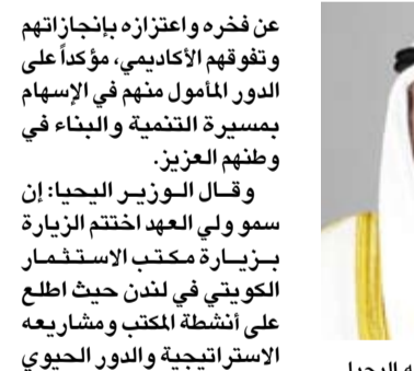
وزير الخارجية عبدالله الجحيا

أكد وزير الخارجية عبدالله الجحيا، أن العلاقات التاريخية الراسخة الممتدة لأكثر من 126 عاماً بين دولة الكويت والمملكة المتحدة الصديقة تحظى باهتمام متواصل للتطور والنماء في شتى المجالات بما يحقق المصالح والتطلعات المشتركة للبلدين الصديقين. وقال الوزير الجحيا لـ (كوئنا)، أمس، عقب زيارة سمو ولي العهد الشيخ صباح الخالد إلى المملكة المتحدة إن هذه العلاقات الوثيقة تظل نموذجاً للصدقة المتينة والتعاون البناء في مختلف المجالات. وأضاف أن الزيارة جاءت تجسيدا لأواصر الشراكة والصدقة التي تجمع البلدين حيث التقى سمو ولي العهد بصاحب السمو الملكي الأمير وليام ولي عهد المملكة المتحدة أمير ويلز في قصر