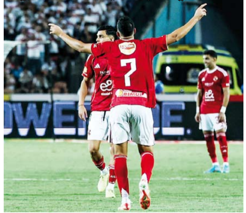
فوز منير للاحمر على غريمه الأبيض

قلب الأهلي تأخره بهدف إلى فوز 2-1 أمام ضيفه وغريمه التقليدي الزمالك، ضمن منافسات الجولة التاسعة من الدوري المصري الممتاز. وأشعل الأهلي المنافسة بفوزه على الزمالك في قمة الدوري المصري، إذ رفع رصيده إلى 15 نقطة من 8 مباريات في المركز الثالث، فيما تجرد رصيد الفريق الأبيض عند 17 نقطة من 9 مباريات ليبقى في صدارة الترتيب.