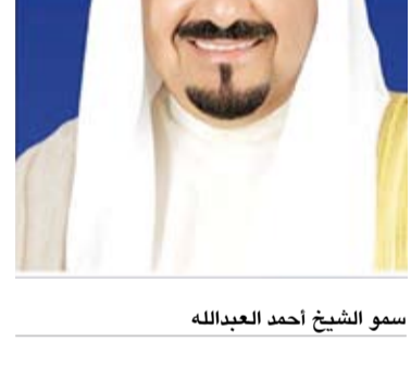
سمو الشيخ أحمد العبدالله