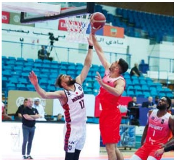
الكويت الكويتي يتغلب على المنامة البحريني

فاز فريق نادي القادسية الكويتي لكرة السلة على نظيره شعب حزموت اليمني (105 - 90) في ثالث مبارياته ضمن منافسات النسخة الـ37 من بطولة الأندية العربية لكرة السلة للرجال والمقامة في إمارة دبي.