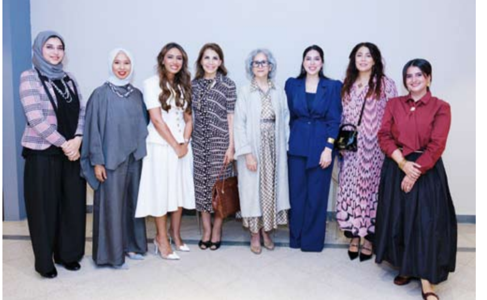
الشيخة حصة صباح السالم الصباح مع عدد من الحضور