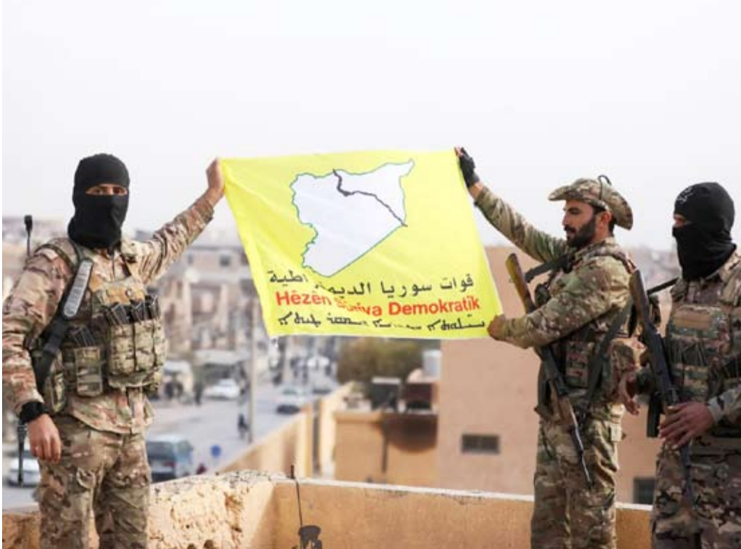
عناصر من «قوات سوريا الديمقراطية»

ذكر تقرير إعلامي أن «قوات سوريا الديمقراطية» (قسد)، نفذت، حملة اعتقالات واسعة في مدينة الرقة، وذلك بهدف التجنيد الإجباري. وأفاد «تلفزيون سوريا» بأن الحملة طالبت عشرات الشبان دون سن الأربعين، وذلك في إطار محاولات «قسد» المستمرة بتجنيدهم قسرياً في صفوفها. وتركزت حملات الاعتقال عند الحواجز المنتشرة على مداخل مدينة الرقة، وفي أسواقها وشوارعها، وسط انتشار كثيف لدوريات «قسد» المدججة بالعتاصر والمدرمات. وسبق أن اعتقلت «قسد»، قبل أيام، أكثر من 50 شخصاً، بينهم أطفال وكبار سن، خلال حملة نفذتها في قرية المويح التابعة لناحية الجرنية غرب الرقة.