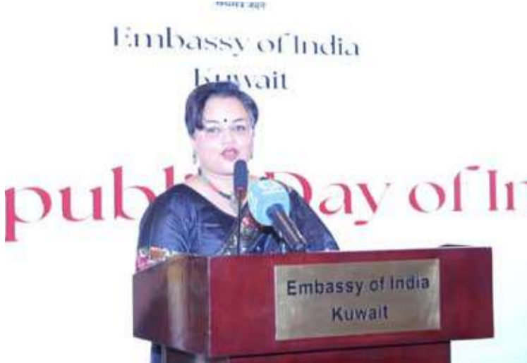
السفيرة الهندية متحدثة

سياسة تقوم على التعدد في الشراكات والاستقلالية الاستراتيجية، مع دور متمم في دعم قضايا التنمية المستدامة والعمل المناخي وتمثيل دول الجنوب على الساحة الدولية. وفيما يتعلق بالعلاقات الثنائية، لفتت إلى أن الروابط بين الهند والكويت تمتد عبر التاريخ، حيث شكّلت التجارة البحرية