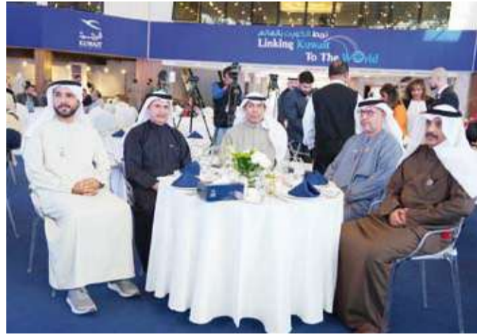
الاحتفاء بـ «أسبوع العلاقات الإماراتية - الكويتية»

الذي تقوم به «طيران الإمارات» لدعم مسيرة التعاون، ومؤكداً أن مثل هذه الفعاليات تفتح آفاقاً لمستقبل أكثر إشراقاً للبلدين.