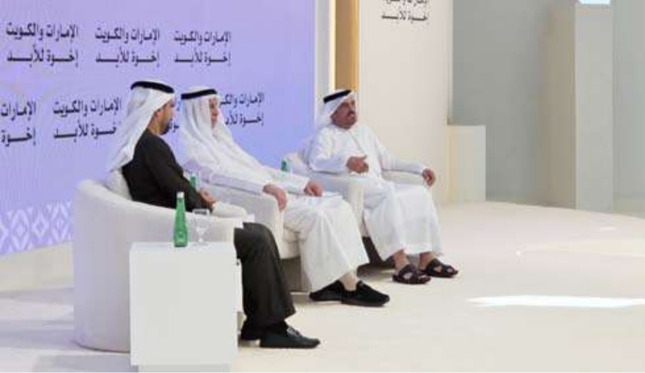
انطلاق فعاليات المنتدى