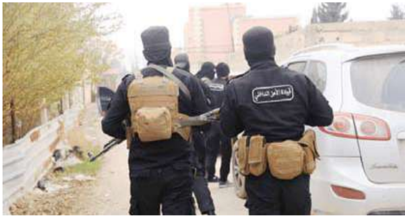
عناصر من وزارة الداخلية السورية خلال إحدى العمليات

إرهابية أخرى"، وفق تعبيرها. وأضاف البيان أن الموقوف: «يرتبط بشكل مباشر مع المجرم غيات دلة والعميد نورس مخلوف»، وأن العمليات الأولية للتحقيق «تؤكد تورطه في سلسلة من الانتهاكات بحق المدنيين خلال فترة النظام البائد»، على حد وصف الوزارة. وبحسب البيان، فإن صبيرة «بدأ نشاطه الإجرامي مع انطلاق الثورة السورية عام 2011، وشارك في قمع المظاهرات السلمية، قبل أن يتطوع عام 2014 في صفوف الفرقة الرابعة، ويشارك في العديد من المعارك إلى جانب النظام السابق للرئيس المخلوع بشار الأسد، واستمر نشاطه الإجرامي حتى التحرير».