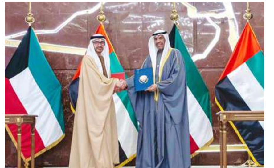
الجيا وعبد الله بن زايد ترأسا أمس الدورة السادسة من اللجنة العليا المشتركة في الكويت