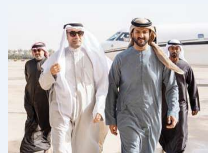
المحيسن مستقبلا المري أمس

عبد الرحمن المطيري وأمس وزير الاقتصاد والسياحة الإماراتي عبدالله المري لدى وصوله إلى البلاد في زيارة رسمية.