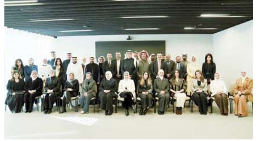
مشاركون في فعالية She L.E.A.D.S in STEM

اختتم بنك الكويت الدولي (KIB) مبادرة الرائدة She L.E.A.D.S in STEM بنجاح، مجدداً التزامه الراسخ بالاستثمار في رأس المال البشري وتعزيز جاهزية كوادره الوطنية لوكالة متطلبات المستقبل. وجاءت هذه المبادرة لتمكين الموظفات في المراحل الوظيفية المبكرة، من خلال تزويدهن بمهارات تقنية نوعية عبر تطبيق مجالات العلوم والتكنولوجيا والهندسة والرياضيات (STEM)، بوصفها تخصصات رئيسية تسهم في رسم ملامح مستقبل القطاع المصرفي والمالي في الكويت.