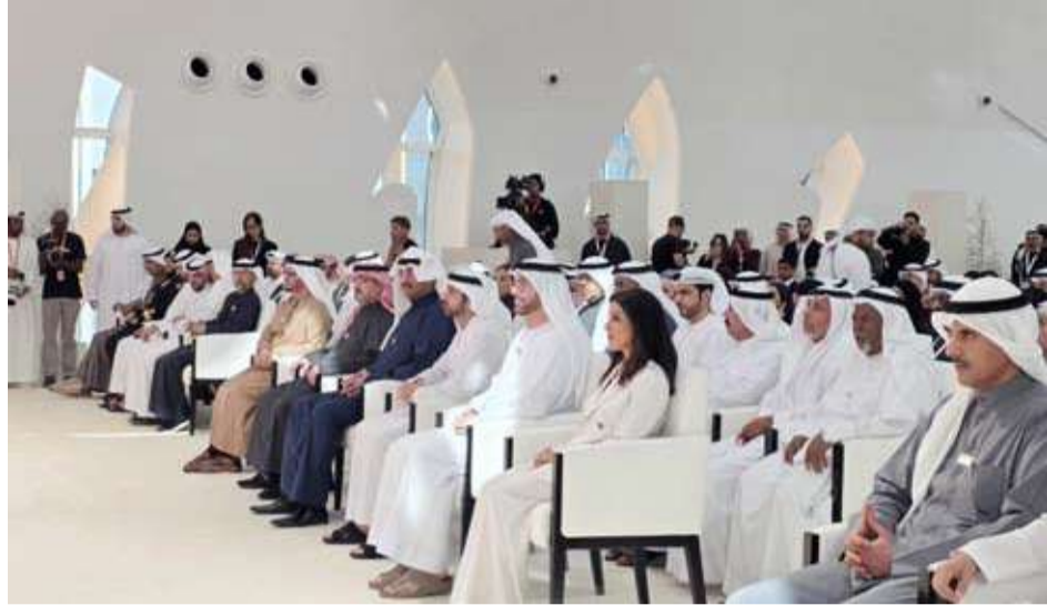
حضور كويتي إماراتي لافت

استهل أسبوع الإمارات والكويت.. إخوة للأبد فعالياتهما أمس بانطلاق أعمال المنتدى الإعلامي الإماراتي - الكويتي في متحف المستقبل بدبي بحضور وزير الدفاع الكويتي الشيخ عبد الله علي عبد الله السالم الصباح ونائب رئيس مجلس الوزراء وزير الدفاع الإماراتي ولي عهد دبي الشيخ حمدان بن محمد بن راشد آل مكتوم ومشاركة نخبة من القيادات الإعلامية والدبلوماسية والثقافية والعسكرية والرياضية والشبابية والفنية من البلدين الشقيقين.