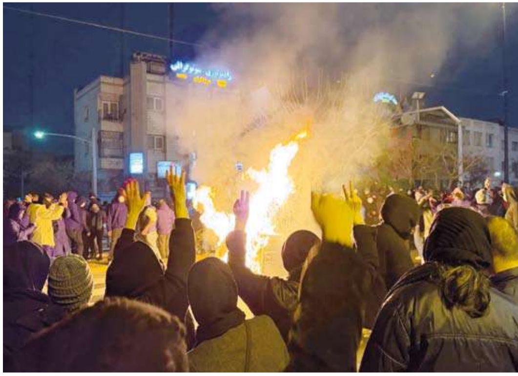
إيرانيون يتظاهرون ضد الحكومة في طهران

تأييدها إدراج «الحرس» في «لائحة الاتحاد الأوروبي للمنظمات الإرهابية»، في أكبر موجة معارضة يواجهها النظام منذ سنوات، ووقّعت منظمات حقوقية مقتل الآلاف، معظمهم من المتظاهرين، على يد قوات الأمن الإيرانية، في الاحتجاجات التي اندلعت في أواخر ديسمبر على خلفية تدهور الأوضاع المعيشية، وسرعان ما تحولت إلى حراك يرفع شعارات مناهضة لإيران. وأعلنت دول أوروبية عدة: أبرزها فرنسا وإيطاليا، في الأيام الماضية «داعش».