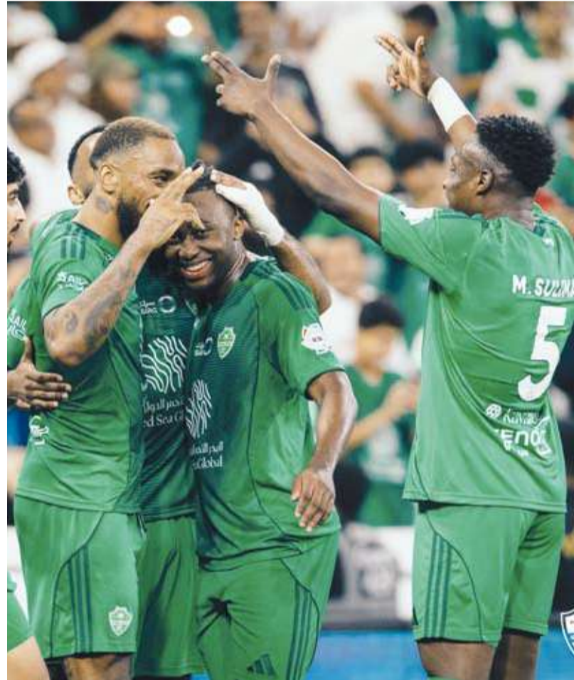
فرحة لاعبي الأهلي بالرعاية

العرض، الذي وُصف داخل محيط اللاعب بأنه «مهين»، اعتبر اقتفارا للاحترام، إذ إنه بحسب ما نُقل يعني عملياً «اللعب مجاناً»، باستثناء حقوق الصورة، ووفق ما كشفه «فوت ميركاتو»، قرر بنزيمة وضع نفسه خارج إطار فريقه في الاتحاد حتى إشعار آخر، في ظل عزز إدارة النادي عن التدخل أمام قرارات الرابطة التي تُعد صاحب العمل الفعلي للاعب. وتُمثل هذه التطورات ضربة فنية كبيرة لفريق المدرب سيرجيو كونسيساوي، الذي يفقد قائده وأحد أبرز صانعي ثنائية الدوري والكأس في الموسم الماضي.