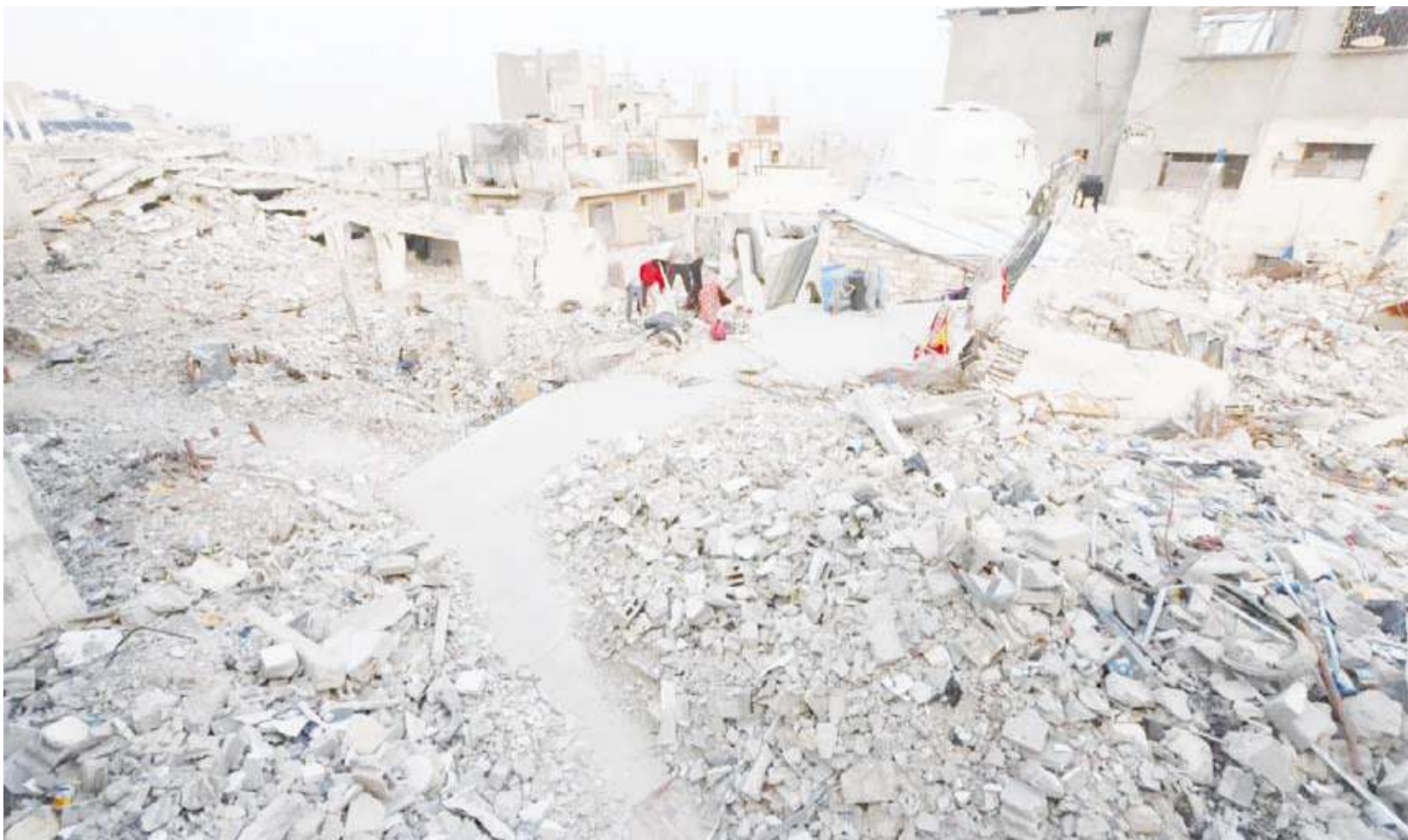
جانِب من الدمار جراء الغارات على غزة