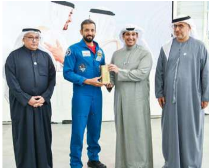
المطيري مكرما النيابي

قال وزير الإعلام والثقافة ووزير الدولة لشؤون الشباب عبدالرحمن المطيري في كلمته الافتتاحية «أفاق التعاون الإماراتي - الكويتي: رؤية مشتركة بقيادة الشباب» ضمن احتفالية أسبوع (الإمارات والكويت.. إخوة للأبد) وذلك بحضور وزير الدولة لشؤون الشباب الإماراتي الدكتور سلطان النيابي وسفير الإمارات لدى البلاد الدكتور مطر النيابي.