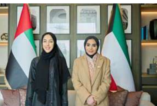
الحويلة والمزروعي خلال اللقاء

بحثت وزيرة الشؤون الاجتماعية وشؤون الأسرة والطبولة الدكتورة أمثال الحويلة أمس مع وزيرة تمكين المجتمع بدولة الإمارات العربية المتحدة الشقيقة شما المزروعي سبل تعزيز التعاون المشترك وتبادل الخبرات في مجالات العمل الاجتماعي والأسري.