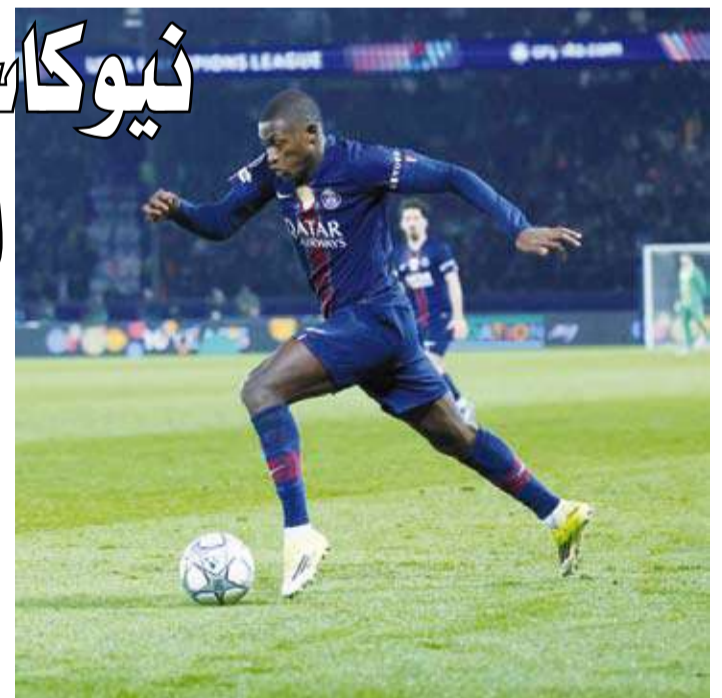
باريس وقع في فخ التعادل أمام نيوكاسل

ولجا لويس إترينيكي إلى مقاعد البدلاء بعد نهاية الاستراحة بحناء عن هدف الفوز، لكن رغم سيطرة سان جيرمان على الكرة فإن نيوكاسل ظل متماسكا وشكل تهديدا في الهجمات المرتدة، إذ اختير أنتوني