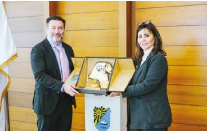
الميلم ومارسون خلال اللقاء أمس

جامعة الكويت الأكاديمية وتسهم في دعم التنمية الوطنية وتعزيز مكانة الجامعة كؤسسة تعليمية وبحفنة رائدة على