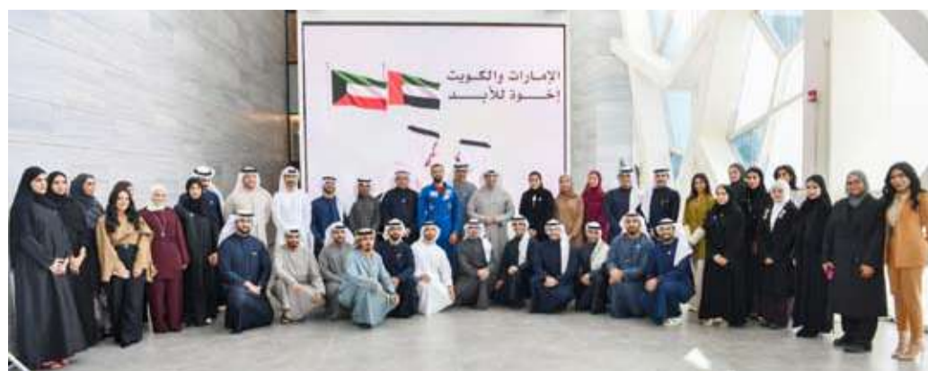
صورة جماعية للمشاركة

وقال إن الهيئة العامة للشباب أسهمت من خلال استراتيجيتها في بناء القدرات واحتضان المبادرات وتهيئة بيئة محفزة للإبداع فيما أدت مؤسسات المعرفة والبحث والموهبة دوراً محورياً في تحويل الأفكار الشبابية إلى نماذج نجاح قائمة على الابتكار بالشراكة مع القطاع الخاص والمجتمع المدني. وشدد على أن إبراز قصص نجاح