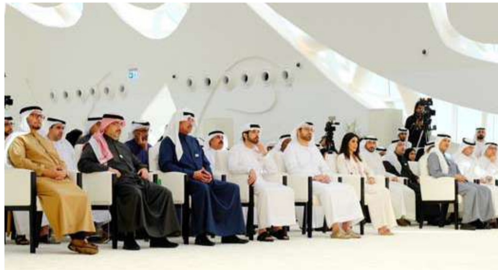
وزير دفاع البلدين خلال انطلاق فعاليات أسبوع الكويت والإمارات أخوة للأبد في دبي