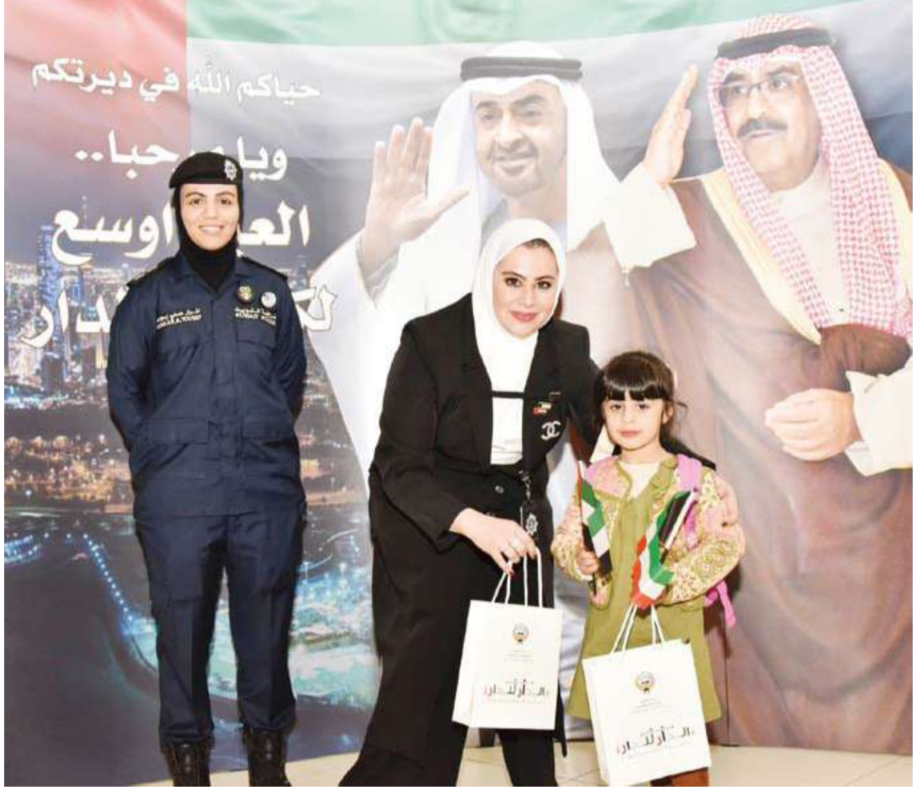
جانب من استقبال لقدامين من دولة الإمارات العربية المتحدة

أطلقت وزارة الداخلية مبادرة «من الدار إلى الدار» لاستقبال الأشقاء الإماراتيين القادمين إلى البلاد عبر مطار الكويت الدولي وذلك في إطار تعزيز أواصر الأخوة والتعاون بين دولة الكويت ودولة الإمارات العربية المتحدة الشقيقة وضمن المبادرات المجتمعية الهادفة إلى توطيد العلاقات الثنائية. وذكرت (الداخلية) في بيان صحفي أمس أن المبادرة الكويتية التي أطلقتها الإدارة العامة للعلاقات والإعلام الأمني بالتعاون مع الإدارة العامة لأمن المطار والطيران المدني تأتي تقديراً للمبادرة الإماراتية (الإمارات والكويت... إخوة لأبد) التي أطلقتها دولة الإمارات العربية المتحدة الشقيقة احتفاءً بعقود من الأخوة ولدة أسبوع. وأضافت أن هذه المبادرة تجسد عمق العلاقات التاريخية التي تجمع البلدين والشعبين الشقيقين إذ يشمل الاستقبال جميع الرحلات القادمة من دولة الإمارات العربية المتحدة إلى دولة الكويت خلال فترة المبادرة. وأكدت الداخلية أن هذه المبادرة تعكس متانة الروابط الأخوية بين دولة الكويت ودولة الإمارات العربية المتحدة الشقيقة وتعزز قيم التلاحم والتقارب الخليجي في إطار حرص المشترك على دعم المبادرات التي تجسد روح الأخوة والتعاون بين دول مجلس التعاون لدول الخليج العربية.