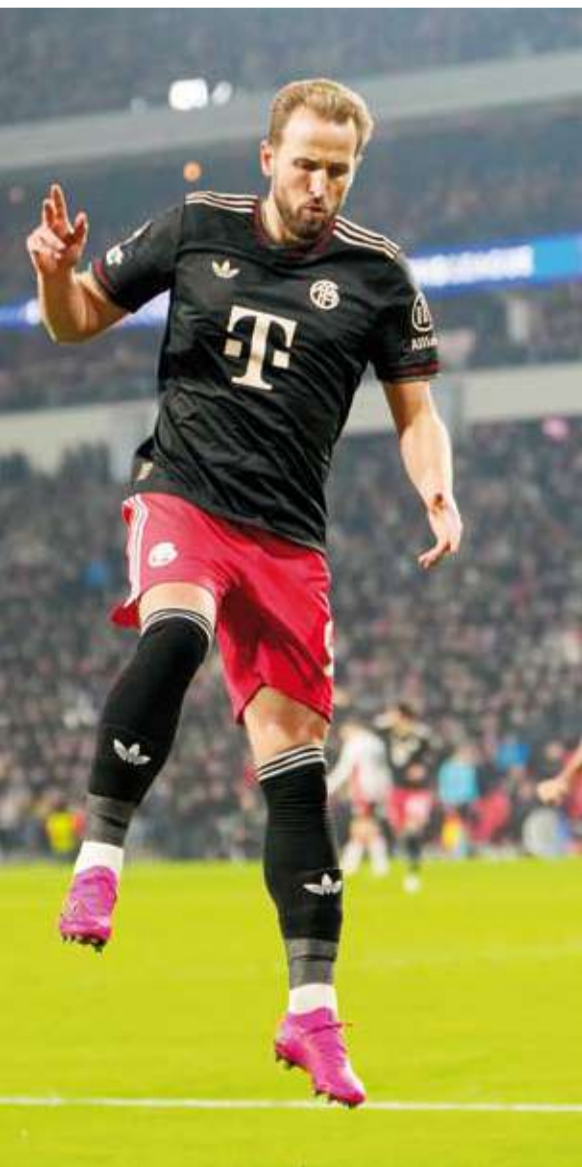
كين بعد تسجيله هدف الفوز للبايرن

شارك هاري كين من مقاعد البدلاء ليسجل هدفا في الدقيقة 84 للفوز 2-1 على مضيفه أيندهوفن، وانتزاع المركز الثاني في مرحلة الدوري ببطولة دوري أبطال أوروبا، بينما أنهى أمال الفريق الهولندي في الاستمرار بالبطولة.