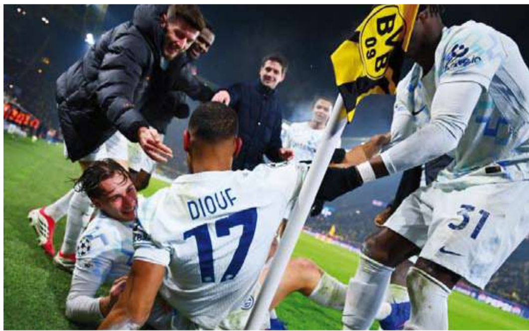
لاعبو الإنتر وفرحة الفوز على دورتموند

سجل إنتر ميلان هدفين قرب النهاية ليفوز 2-صفر على مضيفه بروسيا دورتموند في مباراتهم الختامية في مرحلة الدوري من دوري أبطال أوروبا، وتوجه الفريقان إلى الدور الفاصل المؤهل لدور الستة عشر.