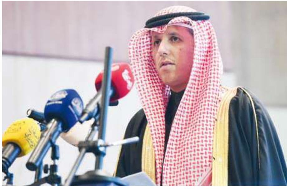
وزير الشؤون الإسلامية د.محمد الوسمي

قال وزير الأوقاف والشؤون الإسلامية الدكتور محمد الوسمي إن الاستثمار في أهل القرآن الكريم يعد الاستثمار الحقيقي والأسمي لمستقبل دولة الكويت وركيزة أساسية تبني عليها رفعة المجتمع وأمنه. جاء ذلك في كلمة ألقاها الوزير الوسمي مساء أمس الأول خلال حفل اختتام النسخة الـ 28 من مسابقة الكويت الكبرى لحفظ القرآن الكريم وتجويده التي جاءت تحت شعار "الكرام البررة" وأقيمت برعاية كريمة من لدن صاحب السمو أمير البلاد الشيخ مشعل الأحمد الجابر الصباح. وذكر أن الرعاية الأميرية السامية للمسابقة تأتي تأكيداً على أن رعاية كتاب الله هي الثابت الأصيل في وجدان القيادة الكويتية. وأضاف أن الأمانة العامة للأوقاف حققت إنجازات ضخمة ونقلة نوعية في مسيرة العمل الوافي محلياً ودولياً إذ تحتفي اليوم بتكريم 311 فائزاً وفائزة من مختلف شرائح المسابقة السبع من أصل 3416 متسابقاً ومتسابقة خاضوا غمار التصفيات النهائية. وبين أن عدد الفائزين من الذكور بلغ 155 فائزاً فيما بلغت أعداد الإناث 156 فائزة في توازن يعكس شمولية المسابقة لكافة فئات المجتمع. ومن عالياً الرعاية الأميرية السامية لأهل القرآن الكريم ولهذه المسابقة كما أعرّب عن الشكر إلى كافة القائمين على تنظيم المسابقة لإظهارها بصورة مشرقة تليق بمكانة دولة الكويت.