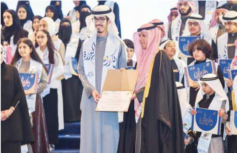
جانب من تكريم الفائزين