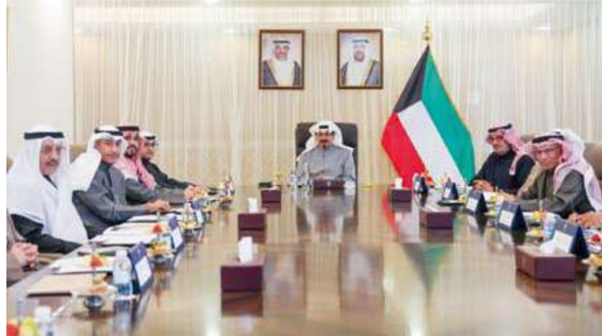
العبدالله بترأس اجتماع اللجنة

بالإنابة الشيخ خالد محمد الخالد الصباح ورئيس مجلس إدارة الجهاز المركزي للمناقضات العامة عصام داود والمرزوق ورئيس إدارة الفتوى والتشريع المستشار صلاح عتيق الماجد ووكيل وزارة الكهرباء والماء والطاقة المتجددة الدكتور عادل محمد الزامل ومساعد وزير الخارجية لشؤون آسيا وعضو ومقرر اللجنة الوزارية السفير سميح جوهري حيا.