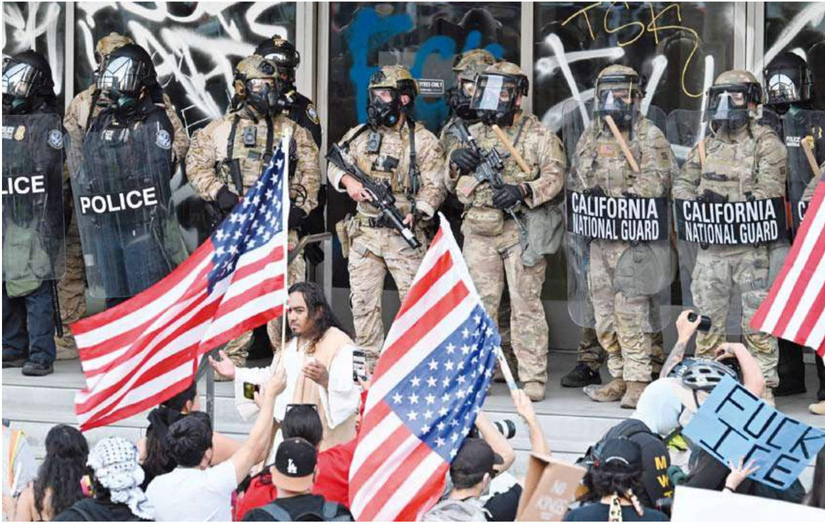
احتجاجات سابقة في لوس أنجلوس

قالت صحفية نيويورك تايمز إن التوتر الذي يعصف بمدينة مينيابوليس بولاية مينيسوتا، ومقتل مواطنين أمريكيين بايدي قوات تابعة لإدارة الهجرة والجمارك الفدرالية، كشف مجدداً مؤشرات على ترمق النسيج الاجتماعي في الولايات المتحدة، في أحدث طلح للخيط الرفيع أصلا الفاصل بين السياسة والعنف في البلاد.