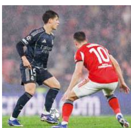
الريال فشل في تجاوز عقبة بنفيكا

بعدد الألقاب (15)، للمركز التاسع في دور المجموعة الموعدة، خارج المراكز الثمانية الأولى التي تضمن التاهل المباشر إلى ثمن النهائي. في المقابل، حجز بنفيكا الذي يشرف عليه مدرب النادي الملكي السابق جوزيه مورينيو بصعوبة المركز الرابع والعشرين الأخير المؤهل بفارق الأهداف، بفضل هدف سجله في الدقيقة الثامنة من الوقت بدلا من الضائع.