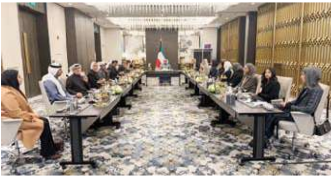
جانب من الاجتماع مع وفد منظمة الصندوق الدولي للمعالم

إعداد خطط الصون والإدارة والسرد التفسيري للقيمة العالمية الاستثنائية للموقع تمهيداً للبدء في إعداد ملف الترشيح لقائمة التراث العالمي. وأكد أن هذه المخرجات تتسجم مع استراتيجية المجلس الوطني للثقافة والفنون والآداب ومتطلبات منظمة الأمم المتحدة للتربية والعلم والثقافة (يونسكو) مشدداً على الالتزام بتحقيق توازن دقيق بين حماية التراث وتطوير السياحة الثقافية المستدامة وبما يضمن توافق أي استخدام للموقع مع خطط الصون والرؤية الثقافية المعتمدة.