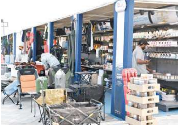
جانب من المشاركين في المعرض