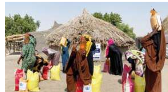
الناطق المستهدفة تعاني من شح الموارد وارتفاع معدلات الفقر

من خلال السلال الغذائية والذبائح وبين مشاريع كسب الحلال عبر توفير الأبقار بما يضمن للأسر مورداً مستداماً يساهم في تحسين مستوى معيشتها ويحفظ كرامتها. وأوضح الكندري أن المناطق المستهدفة تعاني من شح الموارد وارتفاع معدلات الفقر وصعوبة الوصول إلى الغذاء الكافي مؤكداً أن هذه التدخلات جاءت لتخفيف