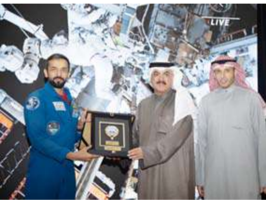
الطبيباني مكرما النيابي

استضافت وزارة التربية أمس بحضور وزير التربية سيد جلال الطبيباني وزير دولة لشؤون الشباب بدولة الإمارات المتحدة العربية الشقيقة الدكتور سلطان النيابي وذلك بمناسبة زيارته الرسمية للبلاد في إطار تعزيز أواصر التعاون وتبادل الخبرات في المجالات التربوية والشبابية وبحث سبل دعم المبادرات الشبابية.