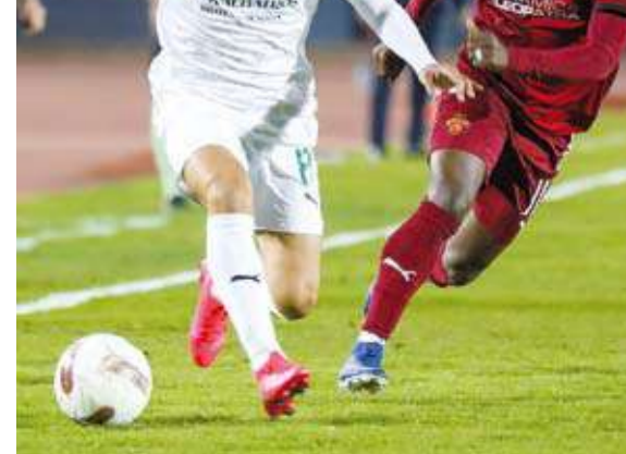
جانب من مباراة سيراميك كليوباترا والمصري