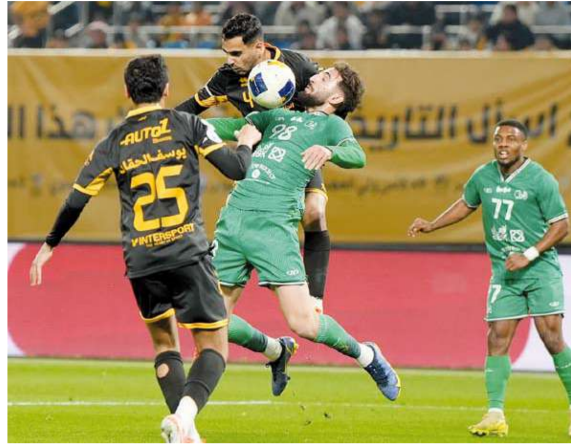
الإثارة حاضرة في ديربي العربي والقادسية