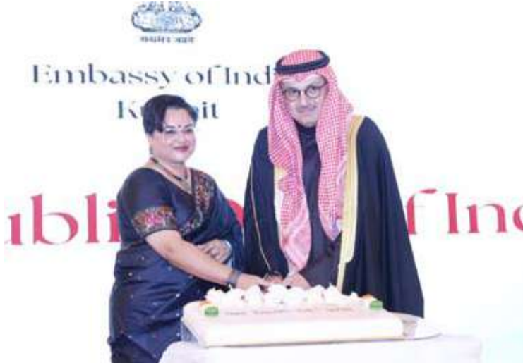
المخيزيم وتريباتي خلال تقطيع كعكة الاحتفال

وأشادت السفيرة بدور الجالية الهندية في الكويت، التي يتجاوز عددها مليون شخص، واصفة إياها بـ "الجسر الإنساني الحي" بين البلدين، ومثمّة دعم الحكومة الكويتية لرعاية أبناء الجالية. وفي ختام كلمتها، جددت السفيرة التزام بلادها بمواصلته العمل مع دولة الكويت لتعزيز الشراكة الاستراتيجية بما يخدم مصالح الشعبين الصديقين، ويسهم في تحقيق مزيد من التقدم والازدهار والاستقرار في المنطقة.