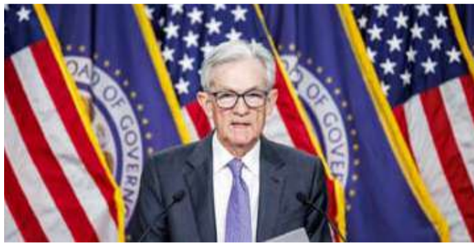
باول في مؤتمر الصحافي

المقول لسعر الفائدة المحايد». وحول سوق العمل، التي كانت مصدر قلق في الأشهر الماضية، أفاد باول بأن معدل البطالة بدأ يُظهر بعض علامات الاستقرار، مشيراً إلى أن التوظيف والوظائف الشاغرة ونمو الأجور لم تشهد تغيراً كبيراً، وهو ما قد يعني أن سوق العمل في طريقها إلى حالة من التوازن المنشود.