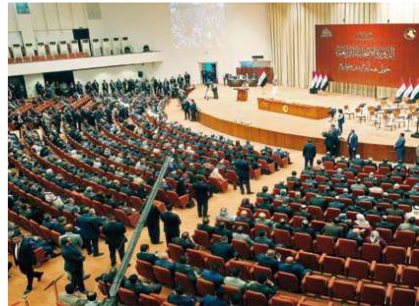
جانِب من جلسات البرلمان العراقي

دستوري مهم في دعوة مجلس النواب للائعقاد بعد الانتخابات، ويصادق على القرارات والمعاهدات والاتفاقيات الدولية التي يقرها المجلس.