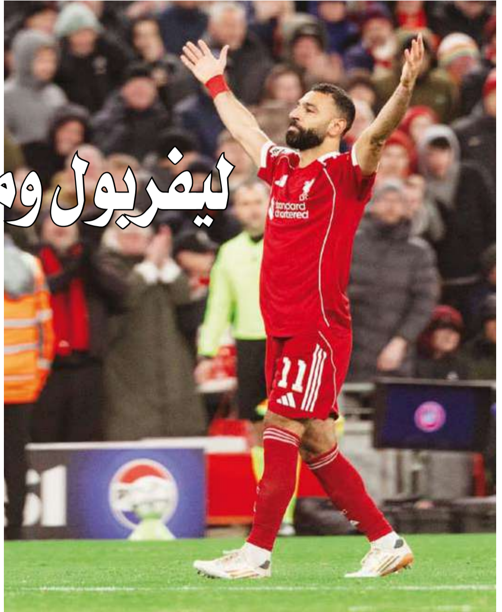
صلاح يعود للتسجيل