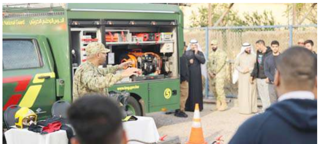
جانب من الفعاليات

وبين أن الحملة تتضمن سلسلة من المحاضرات التوعوية التي يقدمها ضباط ومختصون من كل وحدات الحرس الوطني تتناول مفاهيم الولاء والانتماء إلى جانب التعريف بمهام الحرس الوطني في حماية وتأمين المنشآت الحيوية كما تشمل ورش عمل تطبيقية في الأعمال الفنية منها إطفاء الحرائق ومبادئ السلامة والوقاية وصيانة السيارات والإسعافات الأولية.