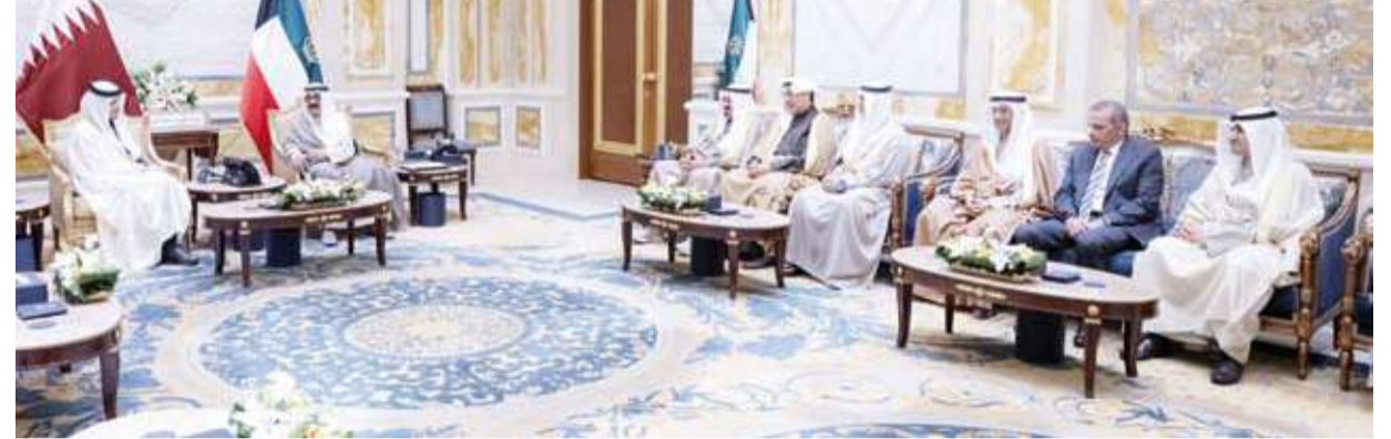
سمو أمير البلاد مستقبلاً رئيس مجلس الوزراء وزير الخارجية القطري

الوزراء وزير الخارجية بدولة قطر الشقيقة والوفد الرسمي المرافق، وذلك بمناسبة زيارته الرسمية للبلاد. حيث نقل لسمو ولي العهد تحيات وتقدير أخيه صاحب السمو الشيخ تميم بن حمد آل ثاني أمير دولة قطر الشقيقة وتمنياته لسمو بوفد الصحة ودوام العافية ولشعب دولة الكويت المزيد من التقدم والنماء. وقد حمله صاحب السمو أمير البلاد تحياته لأخيه صاحب السمو الشيخ تميم بن حمد آل ثاني أمير دولة قطر الشقيقة، متمنياً لسمو موفور