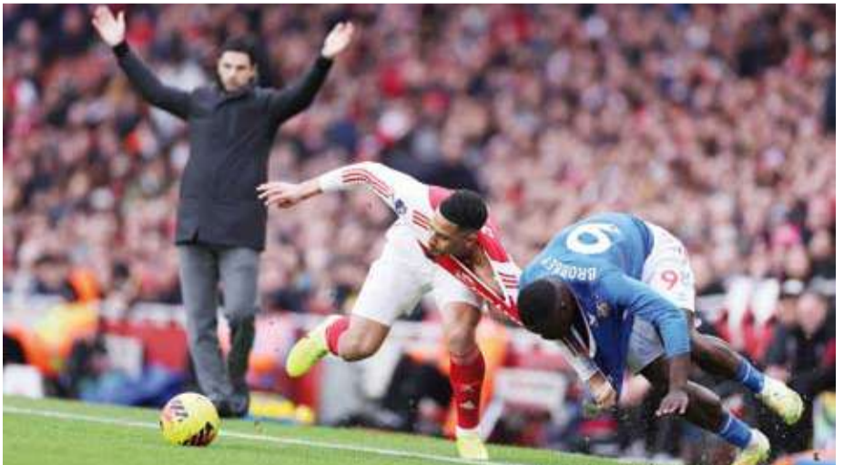
الجائز يحلق في الصدارة