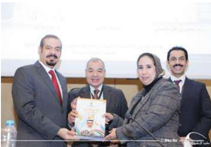
تسليم الإهداء الى المكتبة

وقد تسلّمت الإهداء الدكتورة مروة الوكيل، رئيس قطاع البحث الأكاديمي بمكتبة الإسكندرية، بحضور الأستاذ الدكتور يسري الجمل، وزير التربية والتعليم الأسبق ومستشار مؤشر المعرفة العالمي، إلى جانب الدكتور أحمد حسين الشبو، في تأكيد على أهمية التكامل بين المؤسسات الأكاديمية والقطاع الخيري، وتعزيز تبادل المعرفة المؤسسية في المنطقة. وأكد البسيس أن هذه الخطوة تمثل نموذجاً لدور الكويت الريادي في دعم المسؤولية المجتمعية وتعزيز التنمية المستدامة، مشدداً على أهمية توثيق التجارب ومشاركة المعرفة لتعظيم الأثر المجتمعي.