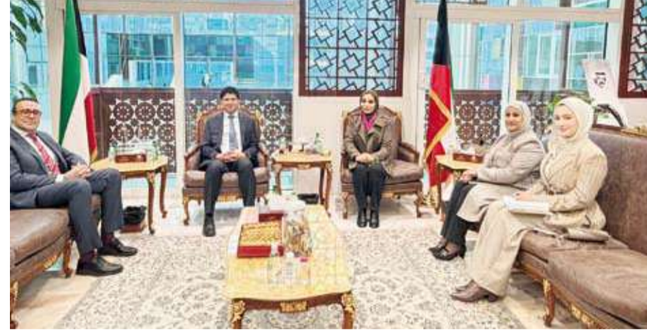
وزيرة الشؤون الاجتماعية مع سفير المملكة المتحدة

استعراض أبرز إنجازات الجهات وأوجه التنسيق القائمة مع الجهات الحكومية ذات الصلة مع التركيز بشكل موسع على قضايا المرأة وبرامج تمكينها ودعمها اجتماعياً. وأوضحت أن الجانبين ناقشا الجهود والخدمات التي تقدمها الوزارة لمختلف الفئات المستفيدة