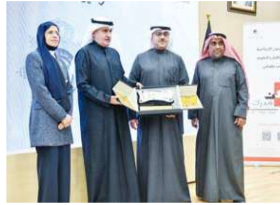
جانب من الفعالية

لما تسببه من أضرار صحية ونفسية وسلوكية فضلاً عن آثارها الخطيرة على استقرار الأسرة وتماسك النسيج الاجتماعي وأن تعزيز الوعي المجتمعي يمثل خط الدفاع الأول في مواجهة هذه الظاهرة. وأكد السويدي، أن الحملة مبادرة وطنية تهدف إلى ترسيخ ثقافة الوقاية وبناء وعي مستدام لدى الشباب بما يعزز قيم الانتماء والمسؤولية ويسهم في حماية المجتمع الكويتي من كل ما يهدد أمنه وسلامته.