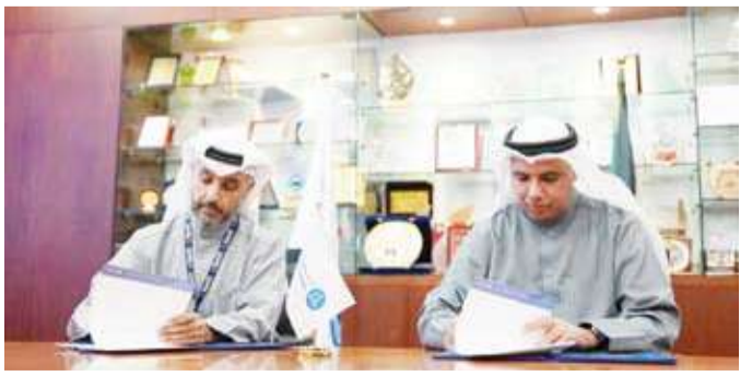
جانب من توقيع مذكرة التفاهم

مجلس أمناء كلية الكويت التقنية، قائلاً: يؤمن من كلية الكويت التقنية بأن التعليم الحقيقي يبدأ عندما يخرج الطالب من إطار القاعة الدراسية إلى مساحة التجربة العملية، بما يعكس رؤيتنا في ربط المعرفة بالواقع، وتمكين طلبةنا من عرض ابتكارهم والتطبيق العملي. وهذه الشراكة مع المركز العلمي تمثل امتداداً لدورنا في دعم المشاريع التعليمية والمجتمعية، وتعكس دورهم كشركاء في التنمية من خلال إتاحة الفرصة لاكتساب خبرات عملية حقيقية. ويأتي هذا التعاون في إطار التزام المركز العلمي بدوره الوطني في دعم التعليم التقني والتطبيقي، وتمكين الطلبة والشباب في مجالات العلوم والتكنولوجيا والابتكار، ما يتسجم مع رؤية الكويت 2035.