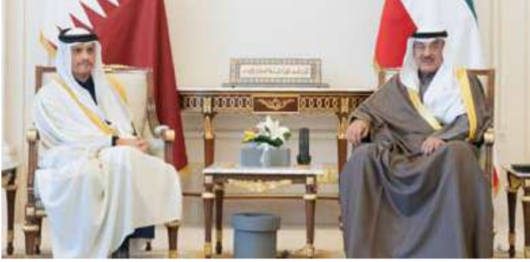
سمو ولي العهد يستقبل الشيخ محمد بن عبد الرحمن بن جاسم آل ثاني

استقبل سمو ولي العهد الشيخ صباح الخالد، بقصر بيان، صباح أمس، الشيخ محمد بن عبد الرحمن بن جاسم آل ثاني رئيس مجلس الوزراء وزير الخارجية بدولة قطر الشقيقة والوفد الرسمي المرافق، وذلك بمناسبة زيارته الرسمية للبلاد. حيث نقل لسمو ولي العهد تحيات وتقدير أخيه صاحب السمو الشيخ تميم بن حمد آل ثاني أمير دولة قطر الشقيقة وأخيه سمو الشيخ عبدالله بن حمد آل ثاني نائب أمير دولة قطر الشقيقة.