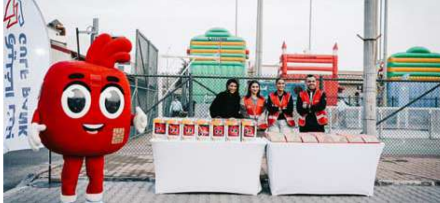
فريق بنك الخليج

يشارك في التوزيع فريق سواعد الخليج هو فريق تطوعي يضم مجموعة من موظفي البنك الذين