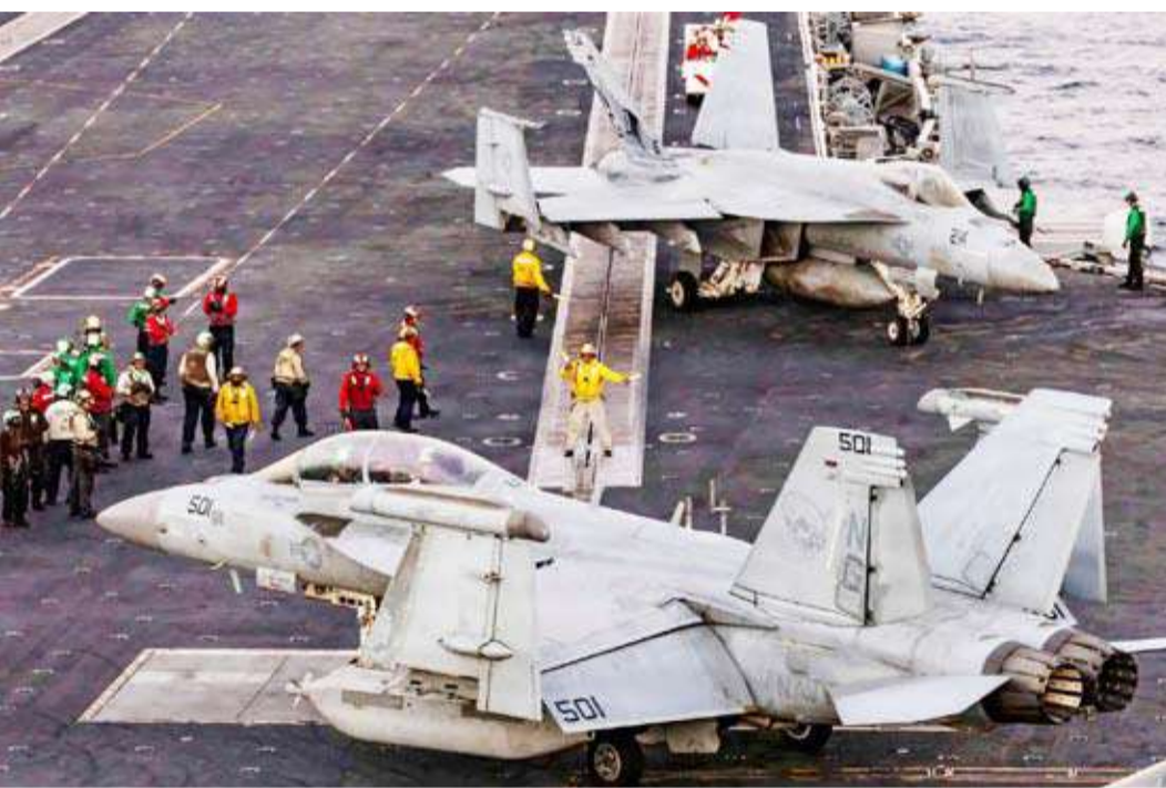
حامل الطائرات من فئة "بمبيز" في بحر العرب

بمهاجمة القواعد الأميركية في المنطقة إذا تعرضت إيران لهجوم، وأكد أن بلاده "مستعدة للحرب تماماً كما هي مستعدة لمنع وقوعها".