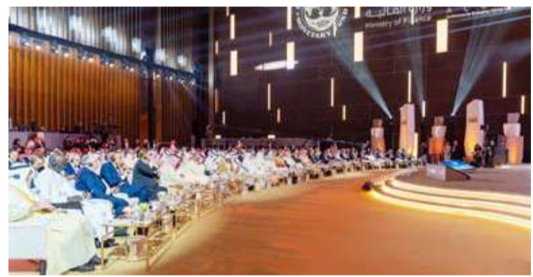
جانب من أعمال المؤتمر

معرية عن مخاوفها بشأن قدرة الاقتصادات على امتصاص الصدمات المستقبلية. ودعت إلى ضرورة إطلاق العنان للقطاع الخاص، وتمكين الشباب وتطوير مهاراتهم لقيادة قاطرة ريادة الأعمال.