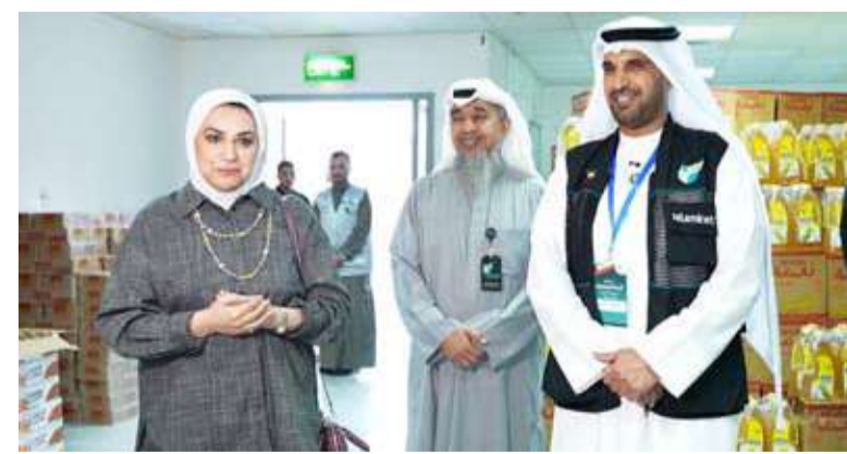
العنزي والعون خلال تدشين المشروع

الخيرية الإسلامية العالمية بالجهداء، وأكد أن السلة تضم مواد غذائية تكفي حاجة الأسرة طوال شهر رمضان المبارك سعياً من الجمعية في التخفيف عن كاهل الأسر وكهدية من الجمعية بمناسبة الشهر الفضيل، معرباً عن شكره لكل من ساهم في دعم المشروع وعلى رأسهم وزارتي الشؤون والداخلية والخيرين والداعمين الكرام والمتطوعين المساهمين في تعبئة وتوزيع السلة. مهتماً بالجمع بمناسبة قرب حلول شهر رمضان المبارك.