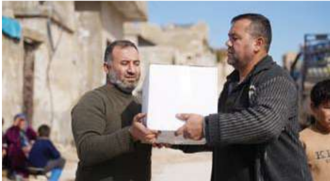
جانب من توزيع السلال الغذائية على السوريين في تركيا

داخل الخيام والمساكن المؤقتة. وأضاف أن السلال الغذائية التي قامت الجمعية بتوزيعها على الأسر السورية اللائحة تمثل دعماً حيوياً يساهم في تأمين الاحتياجات الأساسية من الغذاء في وقت أصبحت فيه كثير من العائلات عاجزة عن توفير ثقلها اليومي.