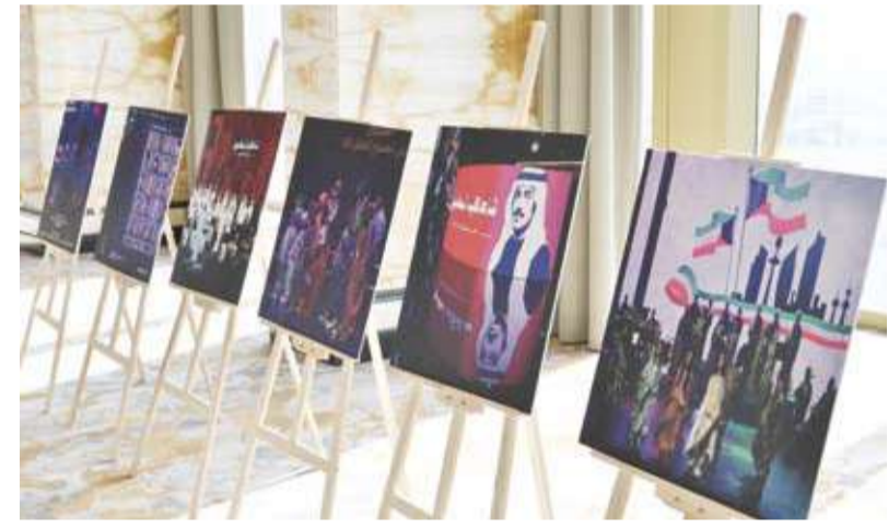
لقطات من معرض الصور المقام على هامش الندوة

انطلقت يوم أمس، جلسات الندوة الرئيسية لمهرجان القرين الثقافي الـ 31 تحت عنوان (من الإرث إلى الإبداع: الكويت ومسيرة الثقافة العربية) بمشاركة نخبة من الأكاديميين والمختصين وتستمر ثلاثة أيام. وقال الأمين العام للمجلس الوطني للثقافة والفنون والآداب الدكتور محمد الجسار في كلمة القاها نيابة عن وزير الدولة لشؤون الاتصالات وتكنولوجيا المعلومات ووزير الإعلام والثقافة بالوكالة عمر المعمر، في افتتاح الندوة: إن هذا المهرجان أصبح علامة مضيئة في المشهد الثقافي الكويتي والعربي ومنصة راسخة للحوار الفكري والتلاقي المعرفي وتبادل الرؤى حول قضايا الثقافة والهوية والإبداع.