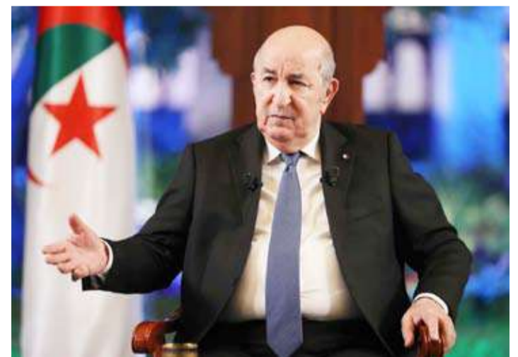
الرئيس الجزائري عبد المجيد تبون في لقاء إعلامي بثه التلفزيون الرسمي

وفي المجال الاقتصادي قال تبون إن الناتج المحلي الإجمالي للجزائر سيتجاوز 400 مليار دولار مع نهاية عام 2027 على أقصى تقدير.