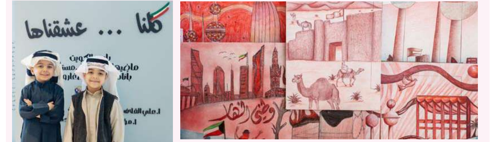
جانب من اللوحات المشاركة

وأكد الحمد أهمية هذه المعارض في دعم الهوية الوطنية وتعزيز قيم المواطنة والولاء لدى أبنائنا الطلبة، معرباً عن شكره لجميع القائمين على المعرض وتمنياً لهم دوام التوفيق والنجاح. وتنوعت اللوحات المعروضة في أساليبها الفنية وتقنياتها، إذ جسدت مشاهد من تاريخ الكويت ومعالمها الحضارية ورموزها الوطنية إلى جانب تعبيرات فنية تعكس مشاعر الولاء والانتماء في صورة تؤكد ما يتمتع به طلبة (التربية) من طاقات إبداعية ومواهب وأعدة.