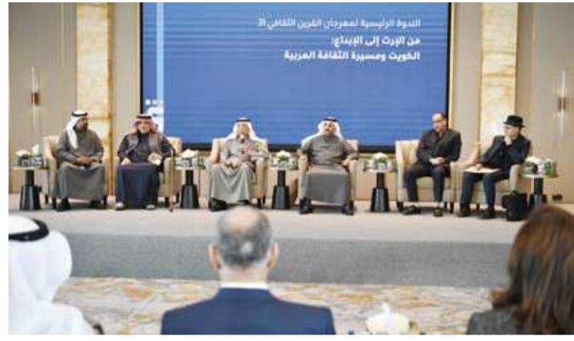
المندوبون في الندوة الرئيسية لمهرجان القرين الثقافي