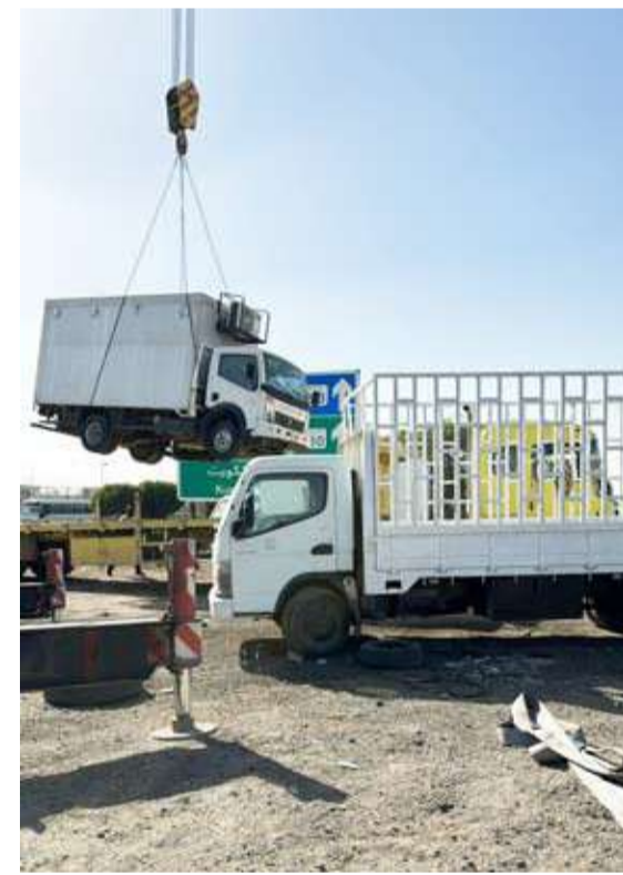
رفع إحدى السيارات المخالفة

عدم تهاون الفريق الرقابي في اتخاذ كافة الإجراءات القانونية حيال المخالفين للائحة النظافة العامة واشغالات الطرق. مبينا في هذا الخصوص وأشار إلى تواصل الجولات الميدانية من قبل الفريق الرقابي بإدارة النظافة العامة واشغالات الطرق، مبينا في هذا الخصوص