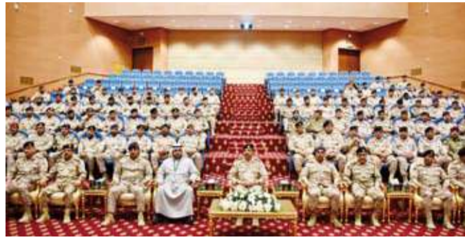
جانب من تدرين الاستراتيجية العسكرية الوطنية «2026-2030»