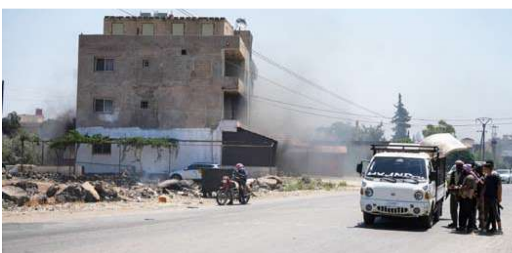
محافظة السويداء تشهد وفقاً لإطلاق النار منذ 20 يوليو

جنوب البلاد، بدءاً من 13 يوليو الماضي ولمدة أسبوع، اشتباكات بين مسلحين دروز ومقاتلين بدو، قبل أن تتحول إلى مواجهات دامية بعد تدخل القوات الحكومية ثم مسلحين من العشائر إلى جانب البدو. وتشهد محافظة السويداء وفقاً لإطلاق النار منذ 20 يوليو الماضي، عقب اشتباكات مسلحة بين عشائر بدوية ودروز، خلفت مئات القتلى والجرحى. لكن مجموعات تابعة لحكمت الهجري، أحد مشايخ العقول للدروز، خرقتهم مراراً واستهدفت نقاط عسكرية، رغم التزام الحكومة بالاتفاق وتسهيلها عمليات إجلاء الرعاغين، ودخول المساعدات الإنسانية.