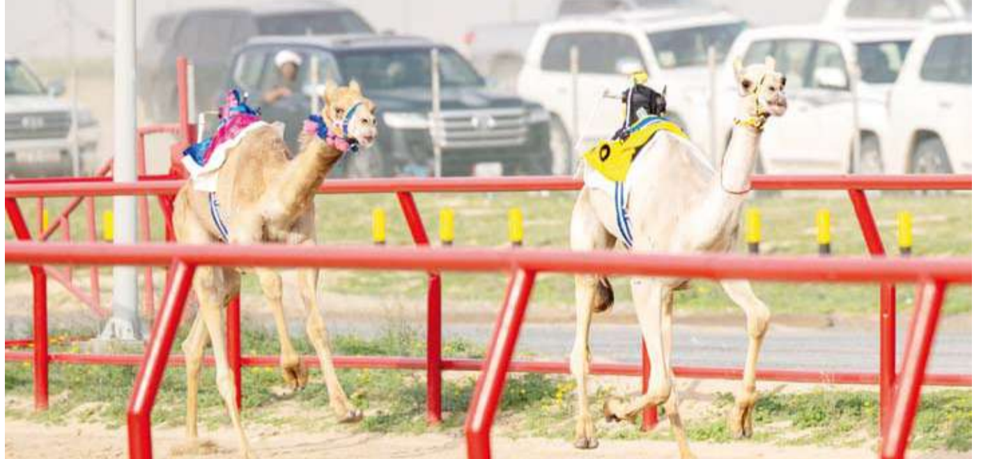
جانب من سباقات الهجن

المقبل. وذكر أن هجن الكويت حققت نتائج مميزة هذا اليوم ما يبشر بنتائج مماثلة للهجن الكويتية بالأيام المقبلة مقدما شكره لوزير الدولة لشؤون الشباب والرياضة الدكتور طارق الجلامه ومدير عام هيئة الرياضة بالتكليف بشار عبدالله على الدعم المستمر للبطولة وكذلك جهات الدولة ذات الصلة التي تبذل جهودا مقدرة لتسهيل التنظيم. وشهد اليوم الأول للبطولة إقامة 21 شوطا من أصل 78 مقررة بالبطولة منها 17 شوطا بالفرة الصباحية فيما جرت 4 أشواط رئيسية بالفرة المسائية تزامنا مع الافتتاح الرسمي للبطولة والتي خصصت جميعا للهجن (الحقائق) ذات الأعمار الصغيرة موزعة على (القعدان والإبكار) على مسافة 4 كيلومترات.