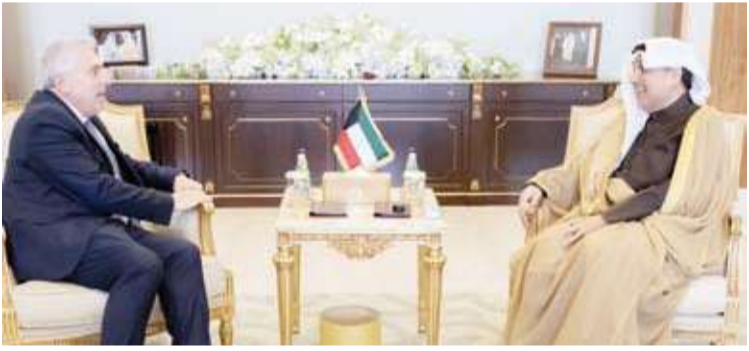
الشيخ حمد جابر العلي يستقبل سفير لبنان غادي الخوري

استقبل وزير شؤون الديوان الأميري الشيخ حمد جابر العلي، بقصر بيان، صباح أمس، سفير جمهورية جورجيا الصديقة لدى دولة الكويت نوسريفان لومياتيدرة. وجرى خلال اللقاء بحث العلاقات الطيبة التي تجمع البلدين والشعبين الصديقين وما شهدته خلال السنوات الماضية من تطور مستمر على مختلف الأصعدة والتأكيد على الحرص المتبادل على تنمية أطر التعاون الثنائي وتوسيع آفاقه ولاسيما في المجالات الاقتصادية والاستثمارية والسياحية بما يسهم في خدمة المصالح المشتركة ويعزز التوافق بينهما.