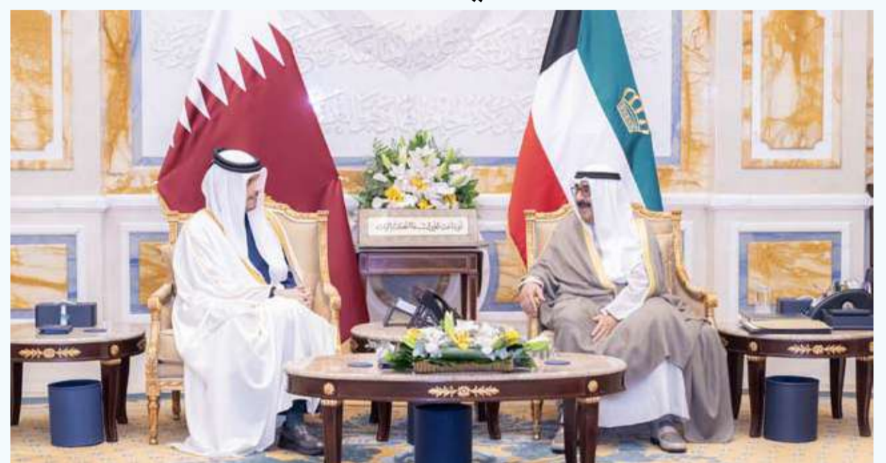
سمو الأمير يستقبل رئيس الوزراء وزير خارجية قطر

سمو أمير دولة قطر الشقيقة متمنيا لسموه موفق الصحة وتمام العافية سائلا سموه المولى عز وجل أن ينعم على دولة قطر وشعبها الشقيق بمزيد من الرقي والازدهار.