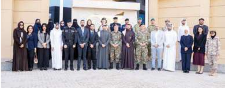
المشاركون ومنظمو دورة «أساسيات الشؤون العامة» في مركز (NIRC)

أكد مدير المركز الإقليمي لحلف شمال الأطلسي ومبادرة إسطنبول للتعاون (NIRC) المستشار عماد الكندي، حرص المركز على دعم القدرات وتطويرها وتعزيز تبادل الخبرات وتقريب وجهات النظر بين الدول الشريكة وحلف (ناتو) وتطوير الكفاءات الوطنية بمختلف المجالات ذات الصلة. جاء ذلك في تصريح أدلى به الكندي لـ (كونتا) أمس، على هامش استضافة المركز الدورة التدريبية الثانية لهذا الموسم (أساسيات الشؤون العامة) بالتعاون مع مركز الشؤون العامة الإقليمي التابع لحلف (ناتو) ومشاركة ممثلين من الدول الأعضاء في المبادرة ودول مجلس التعاون الخليجي.