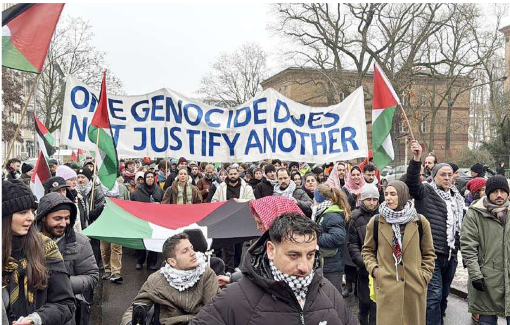
مظاهرون تجمعوا في برلين

استجابة لنداء جمعيات ومنظمات، شارك فيها مئات المظاهرين تعبيراً عن احتجاجهم على التمييز والقمع الذي تتعرض له شعوب فلسطين والسودان وفنزويلا. وأكد المظاهرون تضامنهم مع شعوب فلسطين والسودان وفنزويلا، رافعين بأيديهم لافتات كتبت عليها عبارات من قبيل "قاطعو إسرائيل"، وحاملين أعلام فلسطين وفنزويلا. وأتت المظاهرات في وقت تحرق فيه إسرائيل يومياً اتفاق وقف إطلاق النار في غزة الساري منذ أكتوبر 2025، وقد أدت خروقتها -حتى الآن- إلى استشهاد 576 فلسطينياً، كما أنها تمنع إدخال الكميات المتفق عليها من المساعدات الإنسانية إلى غزة. فيما تمنت حركة المقاومة الإسلامية (حماس) تعليق اتحاد عمال الموانئ في أكثر من 20 ميناء على البحر المتوسط العمل ليوم كامل، رفضاً لعمليات شحن الأسلحة إلى إسرائيل وتضامناً مع الشعب الفلسطيني. وأشادت الحركة، في بيان أصدرته، بالخطوة التي شملت موانئ عديدة ولا سيما في اليونان وإيطاليا وتركيا وإسبانيا والمغرب، تحت شعار "عمال الموانئ لا يعملون من أجل الحرب". وأوضحت حماس أن هذا التعليق يأتي رفضاً لشحن الأسلحة إلى "كيان الاحتلال الفاشي"، وتعبيراً عن التضامن مع الشعب الفلسطيني الذي يتعرض لـ"عدوان صهيوني متواصل".