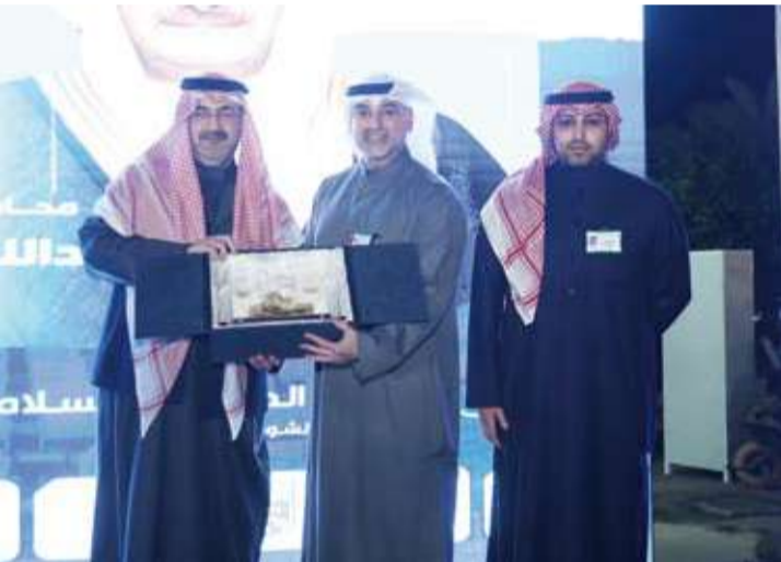
ممثلو البنك يتسلمون تكريماً من محافظ العاصمة

الخدمات المصرفية للأفراد على استقبال زوار المعرض، وتقديم الشرح الوافي حول حلول مصرفية، والإجابة عن جميع الاستفسارات المتعلقة بالعروض والمزايا، بما يضمن تجربة سلسلة وواضحة للعملاء.