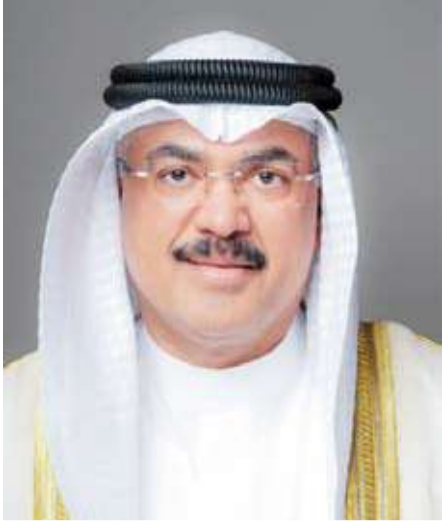
وزير التربية سيد جلال الطبطبائي

وترسيخ القيم، وشددت الوزارة على عدم التهاون مع أي تجاوزات أو ممارسات تمس أخلاقيات المهنة التعليمية أو تسيء إلى هيبة الرسالة التربوية، مؤكدة أن تطبيق القانون سيتم بحزم وعدالة على الجميع دون استثناء حفاظاً على مكانة التعليم وصونا لحقوق المتعلمين وتعزيزاً لنقطة المجتمع بالمؤسسة التعليمية. وأكدت استمرارها في اتخاذ كل ما يلزم لضمان بيئة تعليمية آمنة ومنضبطة قائمة على الاحترام والمسؤولية بما يرسخ مكانة التعليم ويحفظ كرامة المهنة ويعزز دور المعلم الحقيقي.