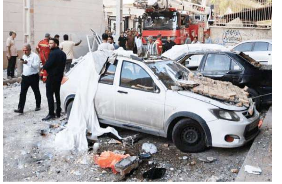
الانفجار وقع في مبنى مكون من ثمانية طوابق بمدينة بندر عباس

المصادر التركية قالت إن أنقرة تسعى لإنشاء قناة اتصال بين إيران والولايات المتحدة؛ لمنع وقوع حرب جديدة في المنطقة، وتنشيط جولات تفاوض جديدة بينهما، وقد نسع قريباً عن استضافة مفاوضات بينهما في العاصمة التركية، بهدف الوصول إلى حلول دبلوماسية، لتجنب خطر التصعيد العسكري الذي لن يستفيد منه سوى الاحتلال المجرم.