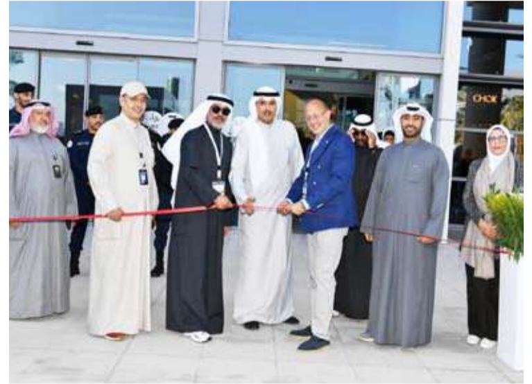
الجابر يفتتح المعرض

مبيناً أن هذا الملتقى في السوق الكويتي يعزز لدينا الثقة للمشاركة بمنشآت قطر في المعارض المستقبلية. وفي نفس السياق أكد د. عبدالعزيز الحرام أن السوق الكويتي من أهم الأسواق الخليجية لما لذي الشعب الكويت من اهتمامات كبيرة للحياة البحرية وأنشطتها، لافتاً إلى أن الشعب القطري يعشقون الترفيه والسياحة في الكويت وقد نتج عن إقامة المعرض توافد عدد كبير من القطريين إلى الكويت، مشيداً برعاية ميناء الدوحة القطري هذه المشاركة المتميزة.