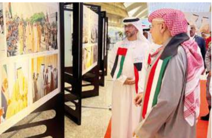
جولة بالمعرض للمصاحب