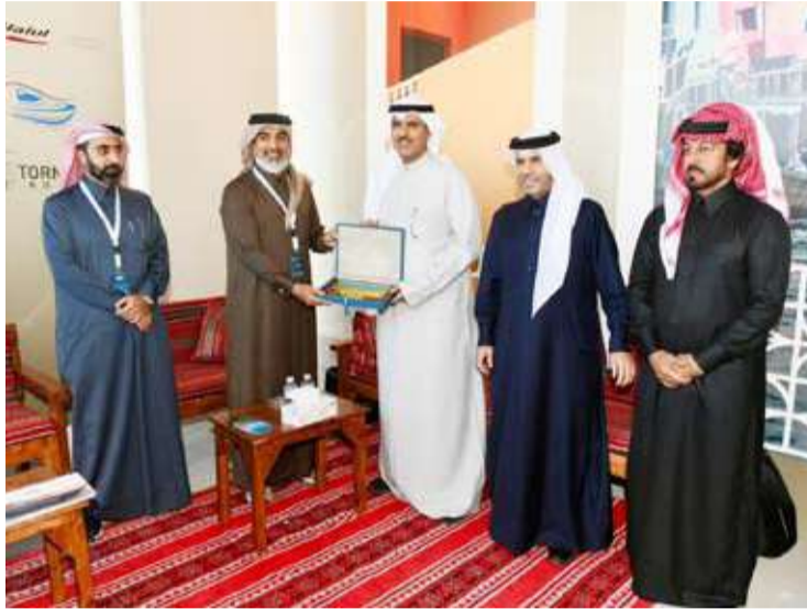
تكريم بحضور السفير القطري