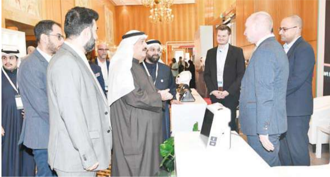
جولة على المعرض المصاحب

وأكد أن ما تحقق من تقدم في هذا المجال هو ثمرة للتكامل بين المؤسسات الصحية والتعليمية والبحثية وجهود الكفاءات الوطنية المؤهلة مشيراً إلى استمرار