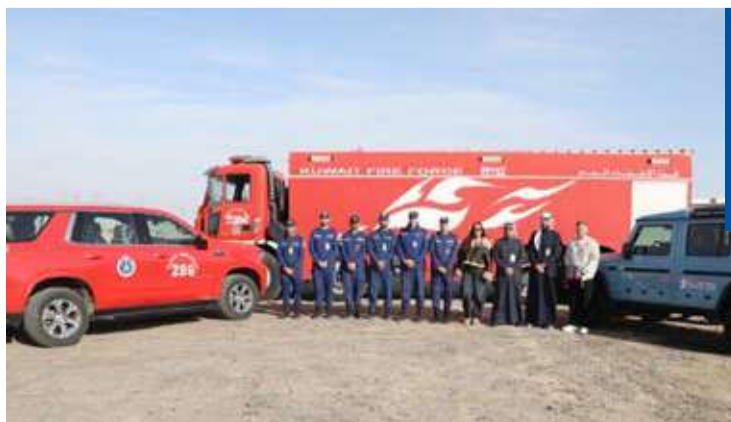
إحدى جولات القوة

أقامت قوّة الإطفاء العام، ممثلةً بإدارة العلاقات العامة والإعلام امس الأول حملة توعوية بالتعاون مع بنك برقان وذلك من خلال المشاركة في نقطة أمنية على جسر الشيخ جابر الأحمد، بالإضافة إلى جولات ميدانية على المخيمات بمنطقة الصبية حيث تم توزيع إرشادات السلامة ومعدات الوقاية من الحريق على مرطادي المناطق البرية والمخيمات بهدف رفع مستوى الوعي بإجراءات وإرشادات السلامة للحد من مخاطر ومسببات الحرائق والحوادث خلال هذا الموسم، وتعزيز الضوابط المتعلقة بسلامة مرطادي البر والمخيمات.