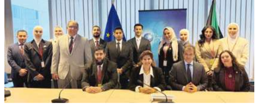
جانب من اللقاء بين الجانبين الكويتي والأوروبي

أكدت مساعد وزير الخارجية لشؤون حقوق الإنسان السفير الشيخة جواهر الصباح أمس أن تعزيز حقوق الإنسان وحمايتها يمثلان مسؤولية وطنية مشتركة بين مختلف مؤسسات الدولة في إطار من التنسيق المؤسسي وتكامل الاختصاصات. وقالت السفير الشيخة جواهر الصباح في كلمة لها خلال تروئها وفد دولة الكويت في أعمال الدورة السادسة للحوار غير الرسمي مع الاتحاد الأوروبي حول حقوق الإنسان الذي عقد في العاصمة البلجيكية بروكسل إن "انعقاد هذه الدورة يتزامن مع مرور 40 عاماً على إقامة العلاقات الدبلوماسية بين دولة الكويت والاتحاد الأوروبي بما يعكس مثانة الشراكة وأهمية استمرار قنوات الحوار المؤسسي المنظم». وأضافت أن "تشكيل وفد دولة الكويت الذي ضم ممثلين عن وزارات الخارجية والعدل والداخلية والإعلام والصحة والنيابة العامة والهيئة العامة للقوى العاملة يعكس النهج الوطني التشاركي في هذا الملف مستعرضة التطورات التشريعية والحقوقية في البلاد ومنها عملية المراجعة