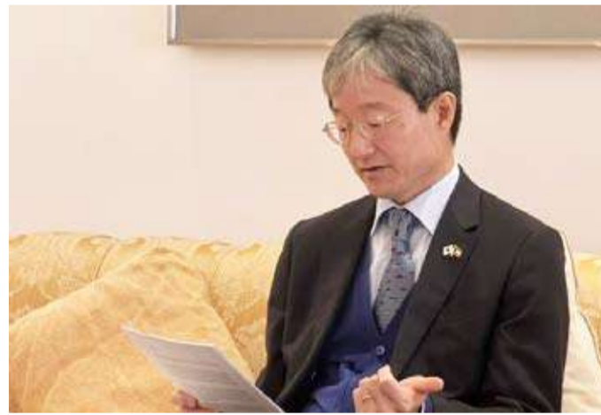
السفير الياباني متحدثاً

كينيتشيرو: اليابان تواصل التزامها الثابت بدعم الشعب الفلسطيني قُدمت مساعدات بنحو 2.6 مليار دولار منذ عام 1993