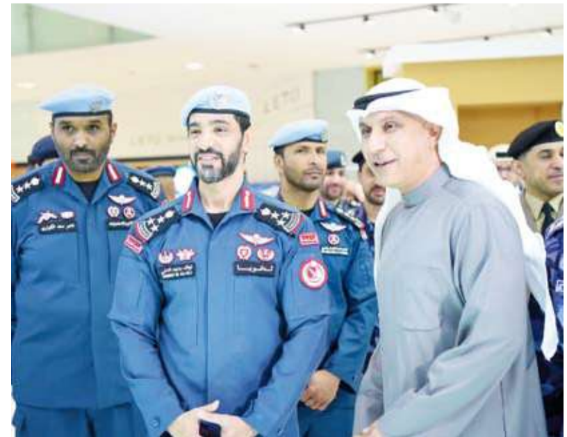
مسؤولو الكويت وقطر خلال الفعالية

افتتح أمس الأول في مجمع "قطر مول" بالعاصمة القطرية الدوحة المعرض الأمني للمصاحب للتمرين التعبوي المشترك للأجهزة الأمنية بدول مجلس التعاون لدول الخليج العربية (أمن الخليج العربي 4). وقبالت وزارة الداخلية الكويتية في بيان إن نائب رئيس اللجنة العليا للتمرين التعبوي (أمن الخليج العربي 4) ومدير التمرين العميد نواف العلي افتتح المعرض ويرافقه رئيس اللجنة العليا للقوة الكويتية المشاركة بالتمرين ورئيس قطاع شؤون المرور والعمليات العميد عبدالله العتيقي. وأضاف البيان أن المعرض الذي تنظمه الأمانة العامة لمجلس التعاون لدول الخليج العربية شهد حضور رؤساء اللجان العليا للتمرين بدول مجلس التعاون وعدد من القادة الأمنيين والضباط