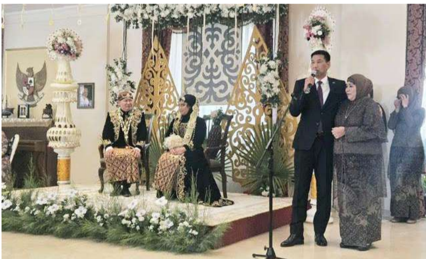
سفيرة قرغيزستان واندونيسيا بلبان كلمة المناسبة