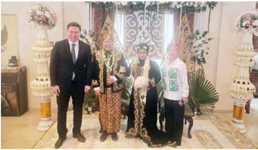
سفيرة كازاخستان مهنتا

والتفاهم. وأكدت أن هذا الزواج يمثل صورة مشرقة للانفتاح الثقافي والتواصل الإنساني، ويجسد العلاقات الودية بين الشعوب، مشيرة إلى أن مثل هذه المناسبات تعزز مفاهيم التقارب والتفاهم بعيداً عن أي اعتبارات جغرافية أو ثقافية.