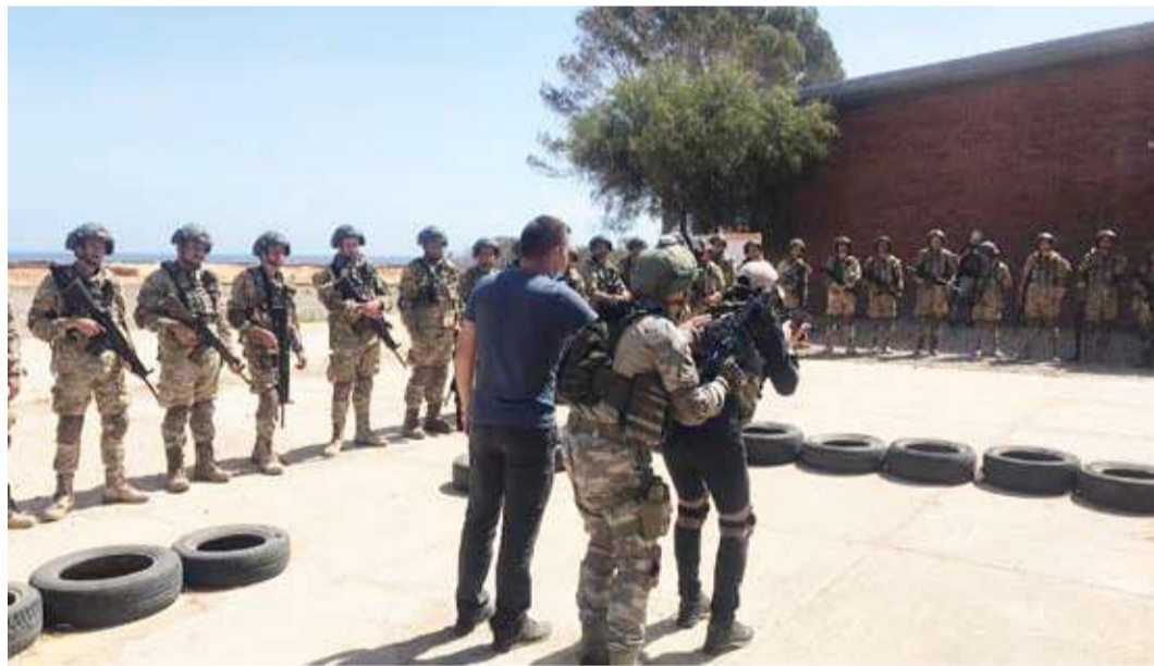
عناصر من اللواء 106 القوات الخاصة»

تُظهر تحركات جبهتي شرق ليبيا وغربها، سعياً ملحوظاً باتجاه التسلح وتعزيز القدرات العسكرية تدريباً واستعداداً، أكثر منه «تجاوباً» مع المسار الانتخابي، أو ما يعكس نيات حقيقية لإنهاء الانقسام الذي يفتت المؤسسات الحكومية.