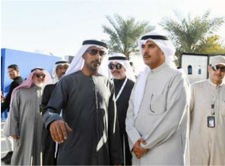
جانب من الجولة في المعرض