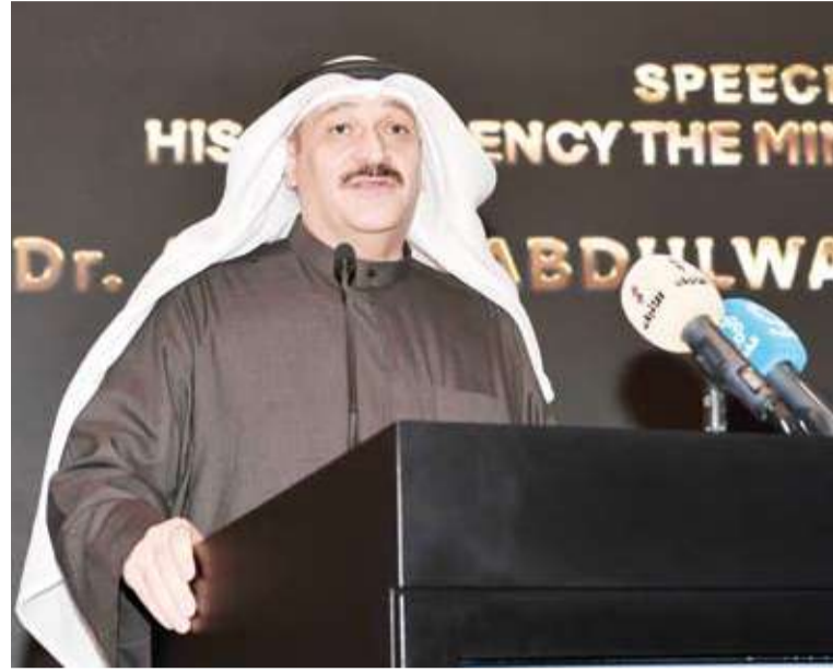
وزير الصحة متحدثاً في افتتاح المؤتمر

دعم وزارة الصحة للمؤتمرات العلمية المتخصصة لما لها من دور فاعل في رفع المستوى العلمي والمهني وتعزيز مكانة دولة الكويت كمرکز إقليمي للتخصصات الطبية الدقيقة.