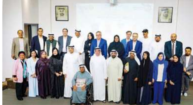
جانب من المشاركين في الجلسة