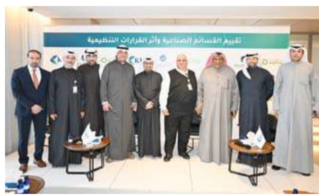
مشاركون في الجلسة الحوارية

مسار التطوير المهني لمهنة التقييم العقاري، وتعزيز التكامل بين القطاع المصرفي والمهني، بما يسهم في بناء بيئة أعمال أكثر كفاءة وشفافية في دولة الكويت. واتفقت الأطراف المشاركة في الحلقة النقاشية على توسيع آفاق التعاون المشترك خلال عام 2026، عبر تنظيم سلسلة من الجلسات الحوارية والمناقشات المتخصصة، وتبادل الدعم المعنوي والمؤسسي، بما يخدم نشر المعرفة المهنية، ويدعم تطبيق معايير التقييم الدولية، ويرتقي بمستوى الممارسات المعتمدة لدى المقيمين