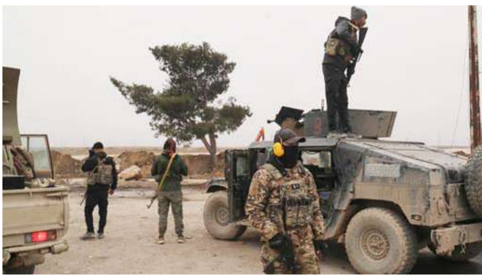
عناصر من «قسد» في الحسكة

نحو السلام والأمن والاستقرار، اعتبر المبعوث الأميركي لسوريا توم براك، أن الاتفاق «علامة فارقة» في مسيرة سوريا نحو المصالحة الوطنية والوحدة والاستقرار. أما الرئيس الفرنسي إيمانويل ماكرون، فأكد أن بلاده «ستواصل دعم سوريا والشعب السوري على طريق الاستقرار والعدالة وإعادة الإعمار». وأعلنت الحكومة السورية وقوات سوريا الديمقراطية (قسد)، التوصل إلى اتفاق «شامل» يتضمن قفاً شاملاً لإطلاق النار والبدء بعملية دمج متسلسلة» للمؤسسات والقوى العسكرية والأمنية والإدارية بين الطرفين. ويسمح الاتفاق، إذا ما نُفذ بدون عقبات، بجلي صفحة الصراع الدموي الأخير بين حكومة دمشق و«قسد» ويضع مناطق الإدارة الذاتية في شمال شرق البلاد تحت سلطة حكومة الرئيس أحمد الشرع.