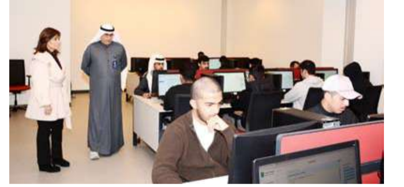
جانب من الاختبارات أمس

عقدت جامعة الكويت، أمس اختبارات القدرات الأكاديمية في مدينة صباح السالم الجامعية، حيث بلغ عدد الطلبة المتقدمين للاختبار 2931 طالباً وطالبة، وذلك وفق النظامين الورقي والإلكتروني. وتقدمت مديرة جامعة الكويت د.دينا اليليم سير الاختبارات في مواقعها المختلفة، حيث أطلعت على آلية تنظيمها، والتقت بالطلبة وأعضاء اللجان المشرفة، مؤكدة حرص الجامعة على تطوير منظومة التقييم والقياس بما يتوافق مع أحدث المعايير الأكاديمية.