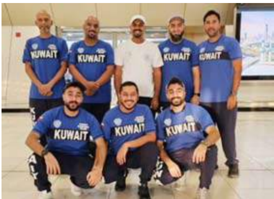
الفريق الكويتي لصيد السمك

الخاتمة، جاء بسبب ارتباط المنتخب الأول بمباريات ودية، ومشاركة المنتخب الأولمبي في