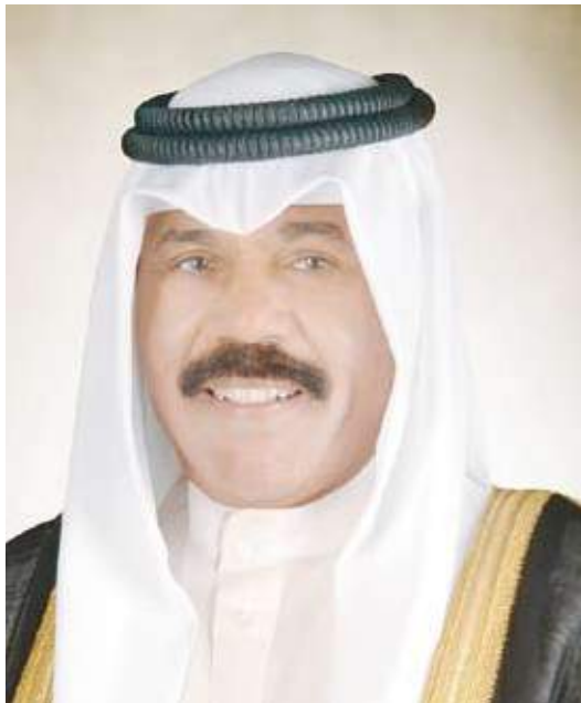
سمو أمير البلاد الشيخ نواف الأحمد

إحتضنه ثرى الوطن أعرب فيها سموه رعاه الله عن خالص تعازيه وصادق مواساته بوفاته مستذكرا سموه بكل الاعتزان تضحياته ودوره البطولي في الذود عن حمى الوطن العزيز وبذل دماائه الزكية في سبيل ترابه سائلا سموه الباري تعالى أن يتغمده بواسع رحمته ومغفرته ويسكنه فسيح جناته وينزله منازل الشهداء الأبرار وأن يلهم أسرته الكريمة جميل الصبر وحسن العزاء.