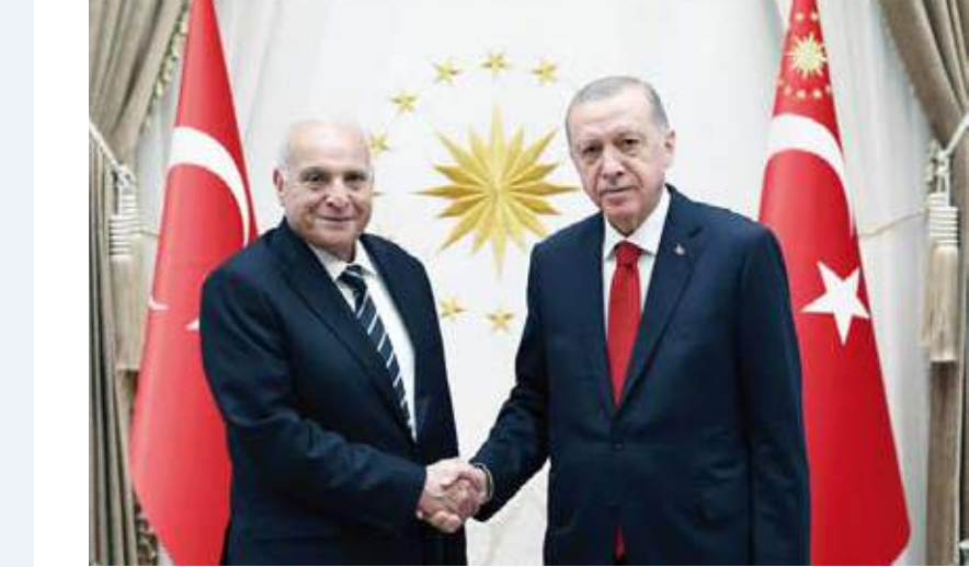
أردوغان مستقبلا وزير الخارجية الجزائري في أنقرة

وذكرت مصادر في وزارة الدفاع التركية أن أنقرة تتابع التطورات الجارية في مدينة دير الزور عن كثب، واصفة ما يحصل من اشتباكات بين العشائر العربية وقوات سوريا الديمقراطية منذ أيام بأنه مؤشر على صحة مسار تركيا تجاه حزب العمال الكردستاني والمنظمات التابعة له، وكانت وزارة الدفاع التركية قالت إن حزب العمال الكردستاني وامتداداته لا يشكل خطرا على تركيا وحدها، بل على شعوب المنطقة كلها. وأضاف بيان الوزارة أن الأحداث التي جرت في دير الزور هي عبارة عن ردة فعل أهالي المنطقة الذين اجتمعوا لحماية حقوقهم وأراضيهم في مواجهة نظام جديد يحاول حزب العمل الكردستاني وامتداداته إرساء هناك.