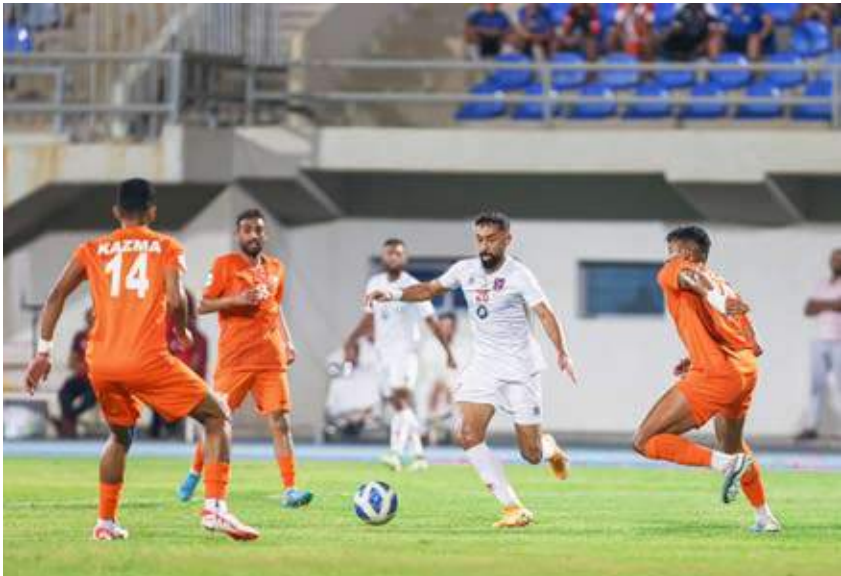
من منافسات الدوري الممتاز

جدير بالذكر أن مشاركة المنتخب الأولمبي الكويتي في الآسياد، قد تمتد لما بعد 27