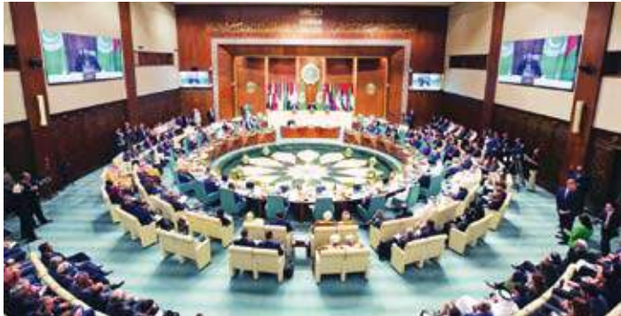
جانب من اجتماع وزراء الخارجية العرب

وكانت مندوبية الكويت لدى الجامعة قدمت مذكرة في أغسطس الماضي لادراج بند بشأن التعاون العربي في مجال استخدامات الذكاء الاصطناعي بين الجهات المعنية به وجرى مناقشته خلال اجتماعات مجلس الجامعة على مستوى المندوبين في اليومين الماضيين.