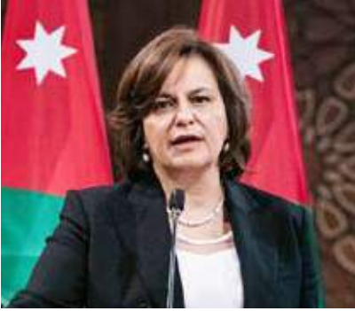
وزيرة الاستثمار الأردنية خلود السقاف

كشفت وزيرة الاستثمار الأردنية خلود السقاف، أول أمس الأربعاء، عن جهود “مكثفة” لبلادها؛ بهدف زيادة الاستثمارات القطرية بالمملكة. جاء ذلك في مقابلة للوزيرة الأردنية مع وكالة الأنباء القطرية “قنا” نشرت على موقعها الرسمي. وأكدت الوزيرة “أهمية الاستثمارات القطرية الكبيرة في الأردن، لاسيما أنها تتركز في قطاعي البنوك والطاقة”. وأضافت: “هناك جهود مكثفة حالياً للتواصل مع الجهات المعنية في الدوحة، لدراسة إمكانية زيادة الاستثمارات في الأردن، وذلك من خلال بيان الفرص والحوافز الاستثمارية المتاحة لرجال الأعمال القطريين”.