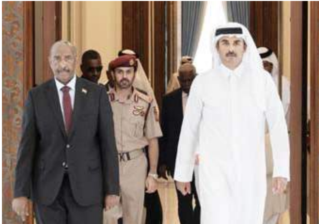
أمير قطر الشيخ تميم بن حمد آل ثاني مستقبلاً رئيس مجلس السيادة السوداني عبد الفتاح البرهان