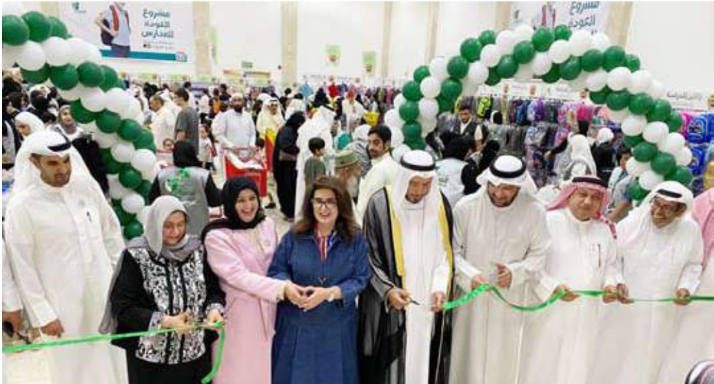
جانب من افتتاح المعرض

مرعاة العديد من الاعتبارات وأهمها عمر الطالب وجنسه إن كان طالباً أو طالبة، حتى يفرح أبنائنا وبناتنا أبناء الأسر المتعففة بالحقبة المدرسية ومحتوياتها والزي المدرسي.