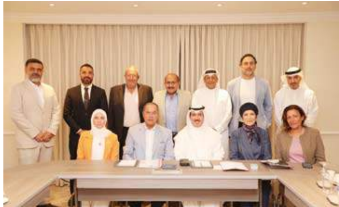
جانب من الحضور في اجتماع اتحادات التنس

الدولي للتنس والتي ستقام في المكسيك بنهاية شهر سبتمبر الجاري مؤكدا أهمية ودعم المرشحين العرب.