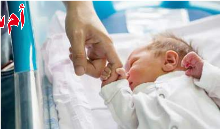
العملية القيصيرية استمرت ساعتين

تمكن فريق طبي في منطقة نجران السعودية امس الاول من إجراء تدخل جراحي عاجل لإنقاذ حياة مريضة حامل في شهرها التاسع توقف قلبها لمدة 3 دقائق في عملية قيصيرية استمرت ساعتين. وقالت الصحة السعودية أن فريق تخدير القلب بمركز الأمير سلطان للقلب بمستشفى الولادة والأطفال استقبل مريضة تعاني من اعتلال بعضلة القلب، بين الفحص السريري وجود