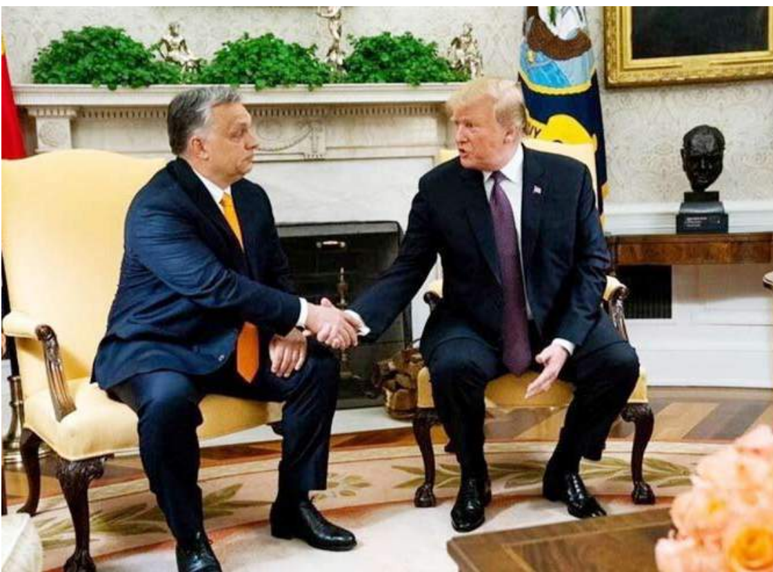
الرئيس الأمريكي السابق دونالد ترامب ورئيس الوزراء المجري فيكتور أوربان

الديمقراطية»، مشيراً إلى «التطورات السياسية الداخلية الأخيرة في الولايات المتحدة نفسها»، وأدان سبارتو، على وجه الخصوص، محاولات استبعاد الرئيس السابق للولايات المتحدة دونالد ترامب من السباق الرئاسي، وحث البيت الأبيض على الامتناع عن التصريحات «المتعالية»، بشأن الديمقراطية والمؤسسات في المجر. وأضاف سبارتو «إذا تمكنت الولايات المتحدة من استبعاد أحد المرشحين الرئيسيين، فإن المجر لن تعر أي انتقاد