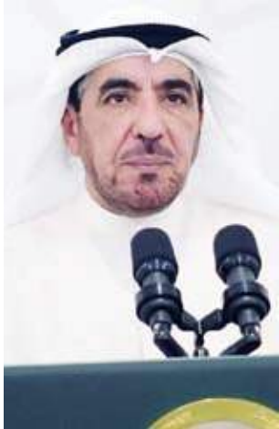
د. حسن جوهر

1. ما أسباب موافقتكم لوزير المالية بتنفيذ السياسة العامة للحكومة برئاسة سموكم فيما يتعلق بشؤون وزارته من خلال إصدار مجلس الوزراء قراره رقم (895) بتكليف نائب رئيس مجلس الوزراء ووزير الدولة لشؤون مجلس الوزراء ووزير الدولة لشؤون مجلس الأمة، بعد عرض كتاب وزارة المالية المؤرخ في 3 أغسطس 2023م على مجلسكم، باستعمال نظر مشروع القانون بشأن الضريبة الانتقائية وضريبة القيمة المضافة رغم عدم ورودها ضمن المتطلبات التشريعية في برنامج عمل الحكومة (2023 / 2027)؟