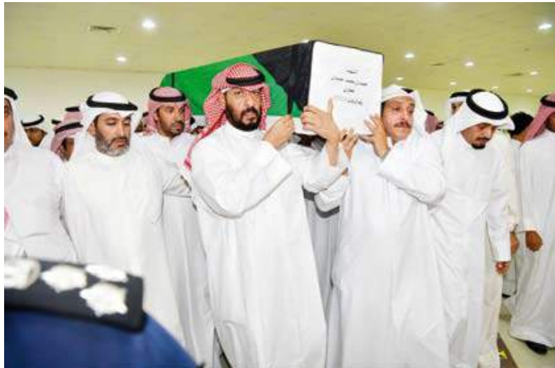
النائب الأول الشيخ طلال الخالد يشارك في جنازة الشهيد حمدان المطيري

شيعت دولة الكويت مساء الأربعاء بمراسم عسكرية الشهيد حمدان محمد المطيري الذي يعتبر ضمن شهداء الوطن الأبرار الذين ضحوا بأرواحهم خلال الغزو العراقي الغاشم عام 1990 وذلك بعد أن تم تسلم رفاته من العراق والتعرف على هويته بواسطة البصمة الوراثية. وتقدم جموع المشيعين النائب الأول لرئيس مجلس الوزراء ووزير الداخلية الشيخ طلال