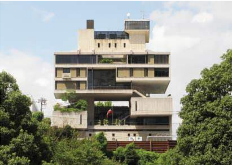
سفارة دولة الكويت في طوكيو

أهابت سفارة دولة الكويت في طوكيو بكافة المواطنين الكويتيين المتواجدين في اليابان بتوخي الحذر والاستزام بتعليمات وتحذيرات السلطات المحلية احترازا من إعصار يون يونغ Yun Yeung الذي من المتوقع أن يضرب الجانب الشرقي من المحيط الهادئ المحاذي لليابان بما فيها العاصمة طوكيو ويؤدي إلى رياح عنيفة وذلك خلال فترة عطلة نهاية الأسبوع يومي الجمعة والسبت. وأكدت السفارة في بيان لها امس الخميس على ضرورة متابعة المواقع الرسمية اليابانية ومراقبة جداول حركة القطارات والرحلات الجوية التي قد تتعرض للإلغاء أو تغيير المواعيد. وحثت السفارة المواطنين على التواصل معها في حالات الطوارئ على الأرقام التالية: ( +81334550361 ) هاتف الطوارئ: ( +819088849650 ) .