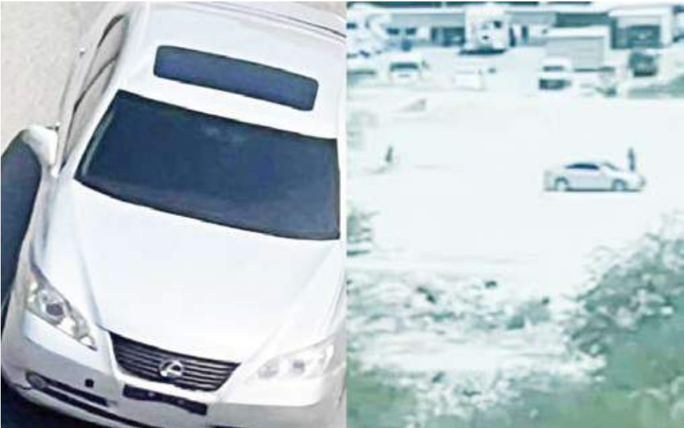
لقطات من الفيديو خلال سلب المارة رقم 112.

قالت وزارة الداخلية، امس، إن رجال الأمن الجنائي يباشرون عمليات البحث والتحري بعد رصد مقطع فيديو متداول يتضمن واقعة اعتداء بالضرب في منطقة المهبولة. ودعت «الداخلية» في بيان كل من لديه معلومات حول الواقعة التقدم إلى المخفر أو الاتصال على هاتف الطوارئ رقم 112.