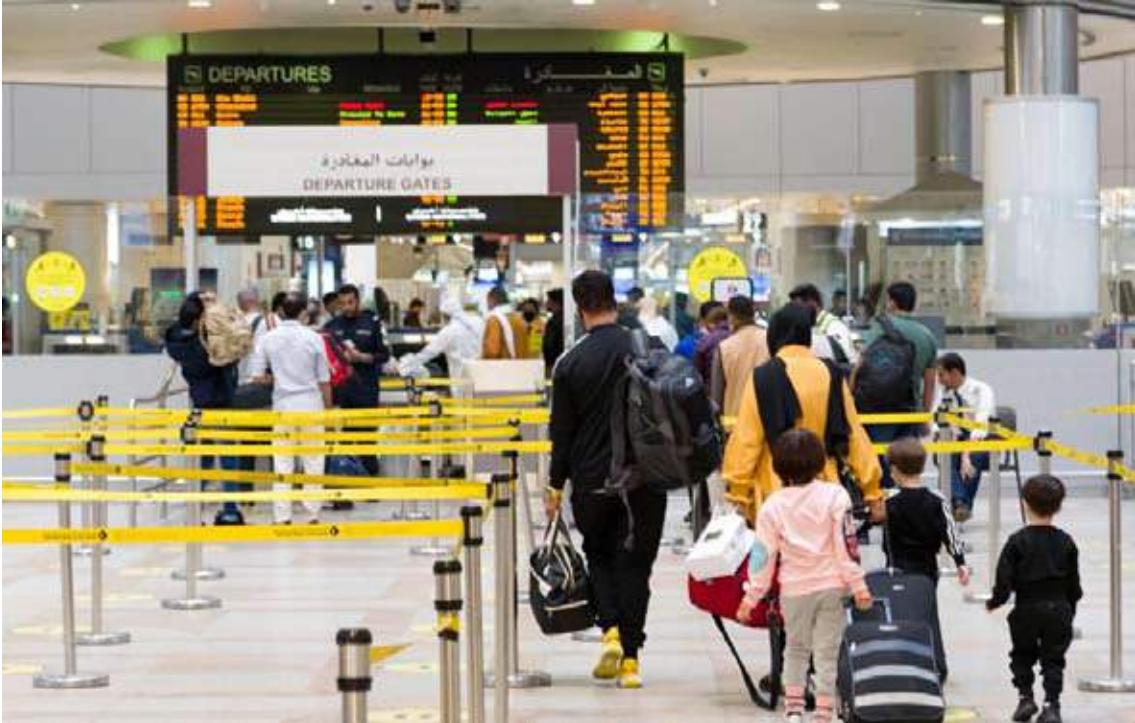
12819 رحلة خلال شهر أغسطس