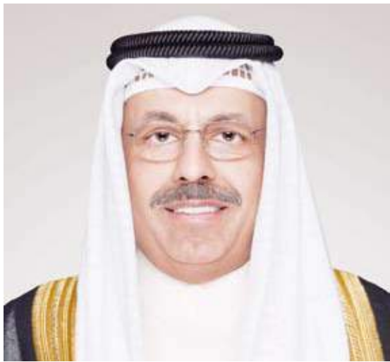
سمو الشيخ أحمد النواف