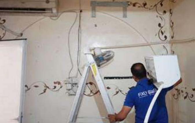
مشروع «برد عليهم» يترجم شعور إنساني كريم لأهل الخير تجاه الآخرين

ويتاي من فضل إعانة المسلم لأخيه المسلم وقضاء حوائجه مصداقاً لقول رسول الله صلى الله عليه وسلم "مَنْ