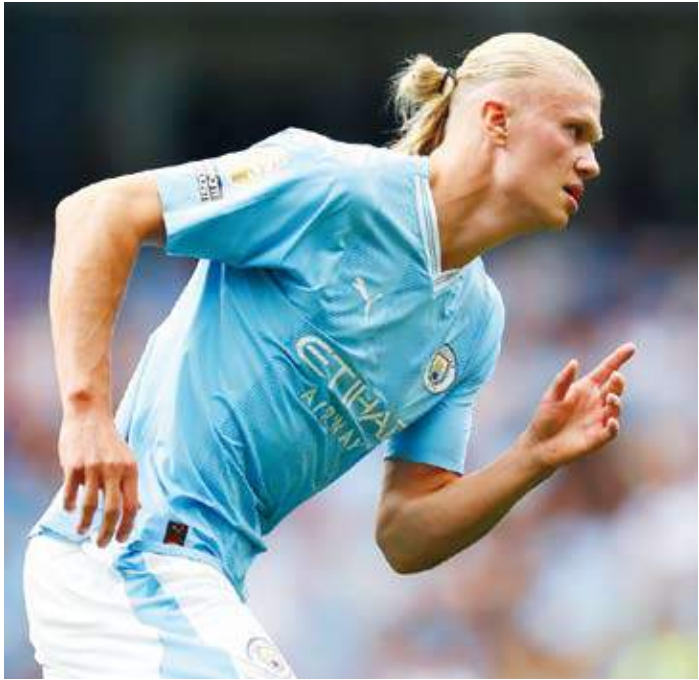
هالاند المنافس الحقيقي لميسي على الكرة الذهبية

قطر وأحرز لقب هدف النهائي، وزميل هالاند في سيتي البلجيكي كيفن دي بروين، على غرار بنزيمة الذي غادر ريال مدريد الإسباني هذا الصيف بعدما دافع عن ألوانه طيلة 14 عاماً من أجل الالتحاق بنادي الاتحاد السعودي.