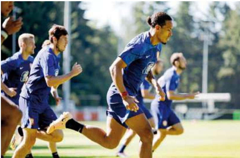
القائد فان دايك خلال تدريبات الريدز

وانهي ليفربول الموسم الماضي المحيط في المركز الخامس بالدوري الممتاز وغاب عن دوري أبطال أوروبا لأول مرة منذ موسم 2015-2016. وشدد فان دايك، الذي أصبح قائدا للليفربول بعد انتقال جوردان هندرسون للاتفاق السعودي في يوليو الماضي، إن دوره في الفريق يختلف عن المنتخب. وتابع: أشعر بالفخر، إنها مسؤولية كبيرة ولكن في منتخب هولندا نجتمع لأيام قليلة لذا فإن عدم مهام القيادة لا يكون كبيرا للغاية. «توجد ارتباطات أكثر مع النادي داخل وخارج الملعب، تشترك في كل شيء تقريبا». ويحتل ليفربول المركز الثالث في الدوري الإنجليزي بعشر نقاط من أربع مباريات، بفارق نقطتين خلف المتصدر مانشستر سيتي.