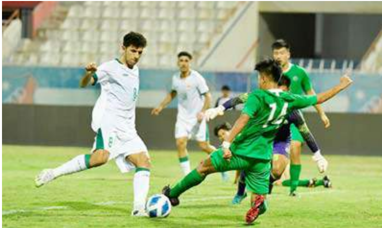
العراق سيطر على المباراة

وقال شنيشل في المؤتمر الصحفي عقب مباراة اليوم، إن غياب التركيز في بعض الأوقات أضاع على لاعبيه، المزيد من الفرص التي كانت سترفع نتيجة المباراة إلى 20 هدفاً. ولم يخف شنيشل أن المباريات مع المستوى الرابع لمنتخبات شرق آسيا، لا ثاني بالفائدة المطلوبة، من حيث الاحتكاك أو القوة المرجوة من اللقاءات الرسمية.