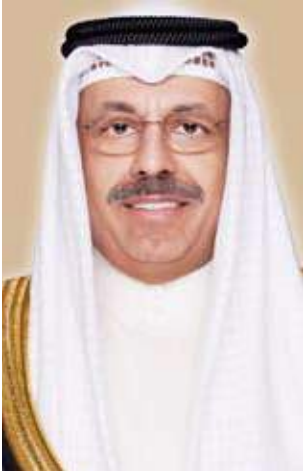
سمو الشيخ أحمد النواف

من جهة أخرى وجه جوهر سؤالاً إلى سمو رئيس مجلس الوزراء (نص السؤال) لما كان برنامج عمل الحكومة للفصل التشريعي السابع عشر (2023 / 2027)، والمقدم إلى مجلس الأمة بتاريخ 16 يوليو 2023، يتضمن مطلباً تشريعياً واحداً بشأن الضرائب لتحقيق رؤية الحكومة في استقرار المالية العامة لتتوسع إيرادات الدولة وزيادتها متمثلة في إنجاز الحكومة مع مجلس الأمة بإقرار مشروع قانون بشأن ضريبة الشركات. وبالنظر إلى كتاب الأمانة العامة لمجلس الوزراء، الصادر بتاريخ