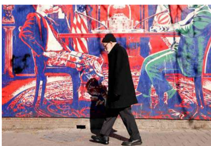
لوحة جدارية تصور طاولة مفاوضات ملطخة بالدماء

ذاته، لكنها ترفض توسيع جدول الأعمال ليشمل برنامجها الصاروخي أو دورها الإقليمي، مشدداً على أن أي مفاوضات يجب أن تقتصر حصراً على الملف النووي، قائلاً: «دعونا لا