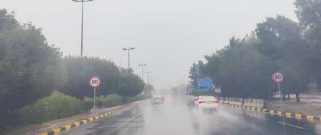
البلاد تشهد أمطاراً رعدية متفرقة