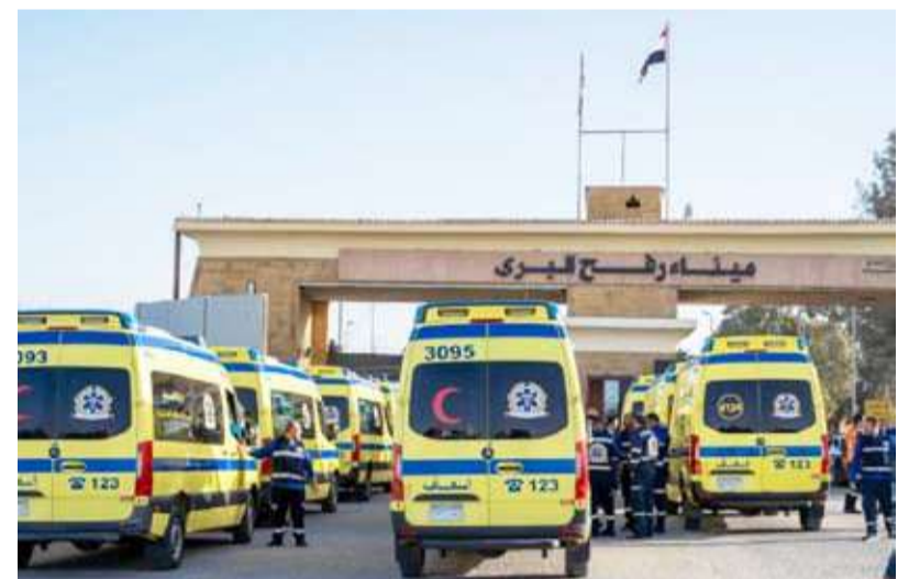
عشرات سيارات الإسعاف بانتظار خروج المرضى والمصابين من معبر رفح