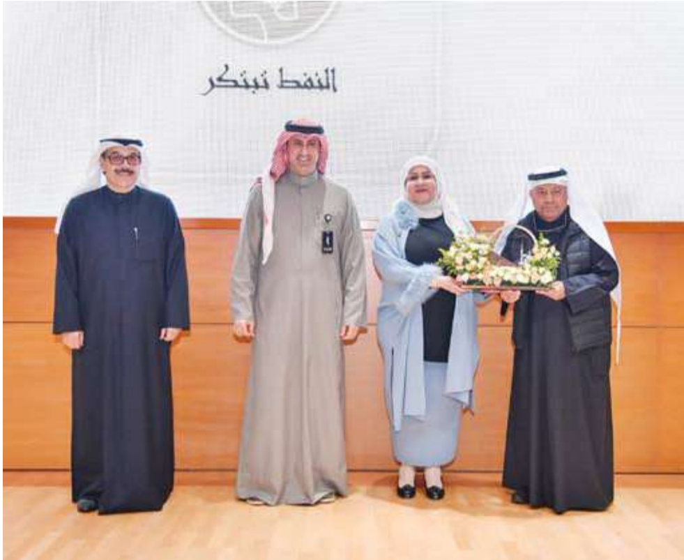
تكريم على هامش الفعالية