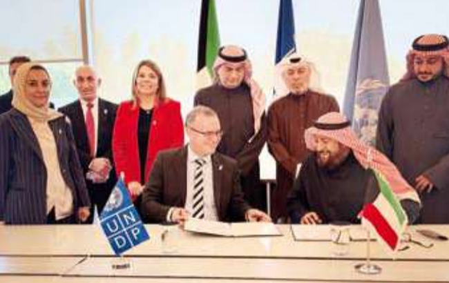
ممثلو المؤسسات الخيرية الكويتية يوقعون الاتفاقية مع برنامج الأمم المتحدة الإنمائي

الطاقة الشمسية المتجددة بما يوفر حلاً سريعاً ومستداماً للاحتياجات الإنسانية العاجلة. بدوره قال الممثل الخاص لبرنامج الأمم المتحدة الإنمائي برنامج مساعدة الشعب الفلسطيني جاكو سيلبيرز في تصريحه: إن دعم الوصول إلى مياه الشرب الآمنة يسهم في تعزيز الصحة العامة وصون الكرامة الإنسانية وتقوية قدرة المجتمعات على الصمود، مؤكداً أن وحدات التحلية المتنقلة العاملة بالطاقة الشمسية توفر حلاً مستدامة للفئات الأكثر ضعفاً.