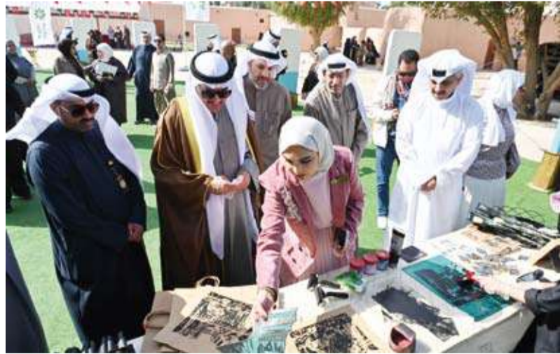
الإطلاع على بعض الاعمال المشاركة