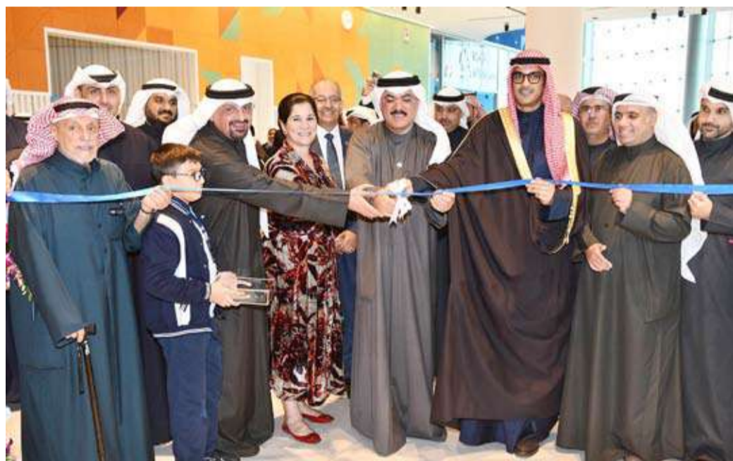
وزير التربية يفتتح المؤتمر

وأضاف أن هذا المؤتمر يمثل منصة وطنية للحوار وتبادل الخبرات كما يسلط الضوء على أحدث ما توصلت إليه تكنولوجيا التعليم وبحث سبل توظيفها بما يخدم العملية التعليمية ويرتقي بمخرجاتها. وأوضح الناصر أنه أن المؤتمر يركز على دعم التحول الرقمي في المؤسسات التعليمية وإبراز الابتكار في التعليم علاوة على تعزيز الشراكات بين الجهات الحكومية والخاصة ومناقشة دور التقنيات الحديثة والذكاء الاصطناعي في تطوير أساليب التعليم وتحسين كفاءة المعلم ورفع مستوى تفاعل الطلبة وتحقيق تعليم أكثر مرونة وجودة واستدامة.