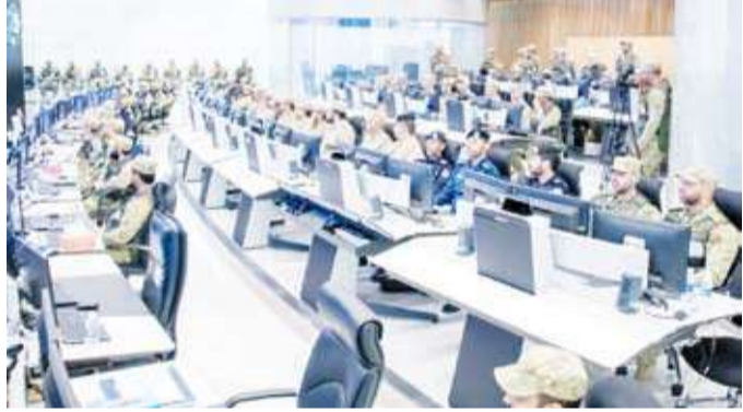
جانب من فعاليات التمرين