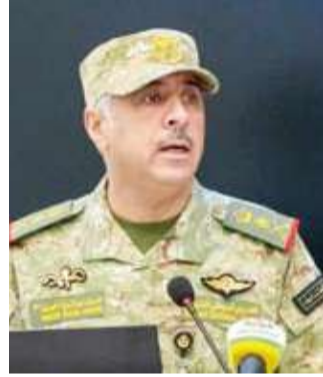
الفريق الركن حمد البرجس

الحرس الوطني ممثلة في رئيس الحرس الوطني الشيخ مبارك الحمود ونائب رئيس الحرس الوطني الشيخ فيصل النواف.