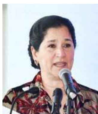
الشيخة انتصار الصباح

وأضاف أن هذا المؤتمر يمثل منصة وطنية للحوار وتبادل الخبرات كما يسلط الضوء على أحدث ما توصلت إليه تكنولوجيا التعليم وبحث سبل توظيفها بما يخدم العملية التعليمية ويرتقي بمخرجاتها. وأوضح الناصر أنه أن المؤتمر يركز على دعم التحول الرقمي في المؤسسات التعليمية وإبراز الابتكار في التعليم علاوة على تعزيز الشراكات بين الجهات الحكومية والخاصة ومناقشة دور التقنيات الحديثة والذكاء الاصطناعي في تطوير أساليب التعليم وتحسين كفاءة المعلم ورفع مستوى تفاعل الطلبة وتحقيق تعليم أكثر مرونة وجودة واستدامة.