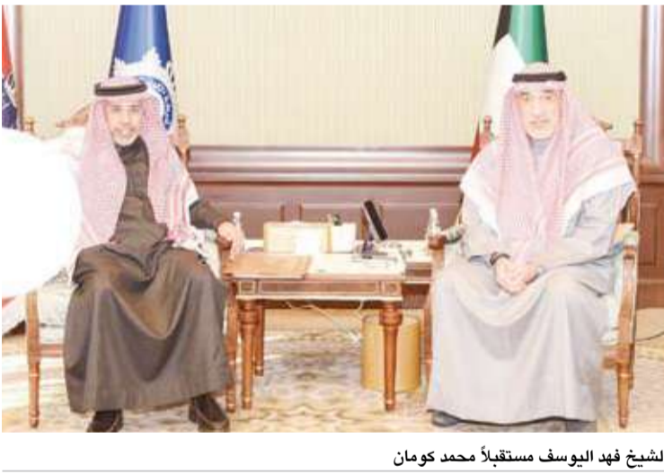
الشيخ فهد اليوسف مستقبلاً محمد كومان من جانبه، أعرب كومان وفق البيان عن بالغ شكره وتقديره على حفاوة الاستقبال، متممناً الدور الريادي لدولة الكويت في دعم العمل الأمني العربي المشترك، مؤكداً حرص الأمانة العامة على تعزيز آفاق التعاون والتنسيق بين الدول العربية الشقيقة. وجرى خلال اللقاء بحث عدد من الموضوعات ذات الاهتمام المشترك وسبل تعزيز التعاون والتسيق الأمني العربي المشترك بما يسهم في دعم الجهود الرامية إلى تعزيز الأمن والاستقرار في الدول العربية.