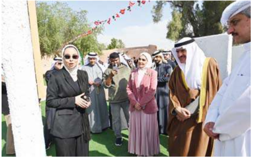
محافظ الجهراء حمد الحبشي خلال جولة في المعرض

برعاية وحضور محافظ الجهراء حمد الحبشي، أقيم معرض «حبر» الفني الذي نظمه توجيه التربية الفنية بمنطقة الجهراء التعليمية، وذلك بالتعاون مع المجلس الوطني للثقافة والفنون والآداب في القصر الأحمر، بحضور عدد من القيادات التربوية والفنانين والمهتمين بالشان الثقافي والفني. وأطلع المحافظ خلال جولته في المعرض على الأعمال الفنية المشاركة، التي عكست إبداعات فنية متنوعة مستلهمة من الهوية الوطنية والإرث الثقافي، مشيداً بالمستوى المتميز للأعمال وبالجهود المبذولة في دعم الحركة الفنية وتنمية المواهب. وأكد المحافظ أهمية إقامة مثل هذه الفعاليات الثقافية والفنية التي تساهم في تعزيز الوعي الجمالي وترسيخ القيم الإبداعية، مثنياً دور القائمين على المعرض في تنظيمه وإبرازه بصورة تليق بمكانة القصر الأحمر كمعلم تاريخي وثقافي بارز في محافظة الجهراء.