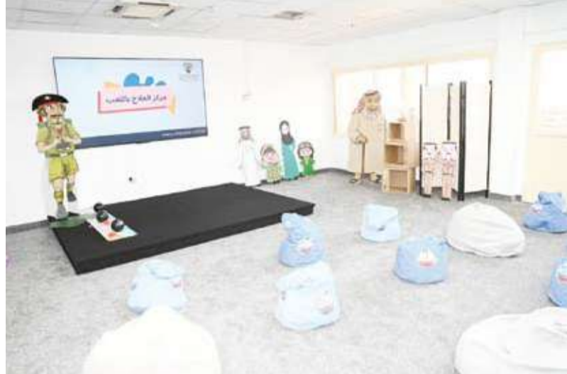
المركز إضافة نوعية لمنظومة الخدمات الاجتماعية والنفسية