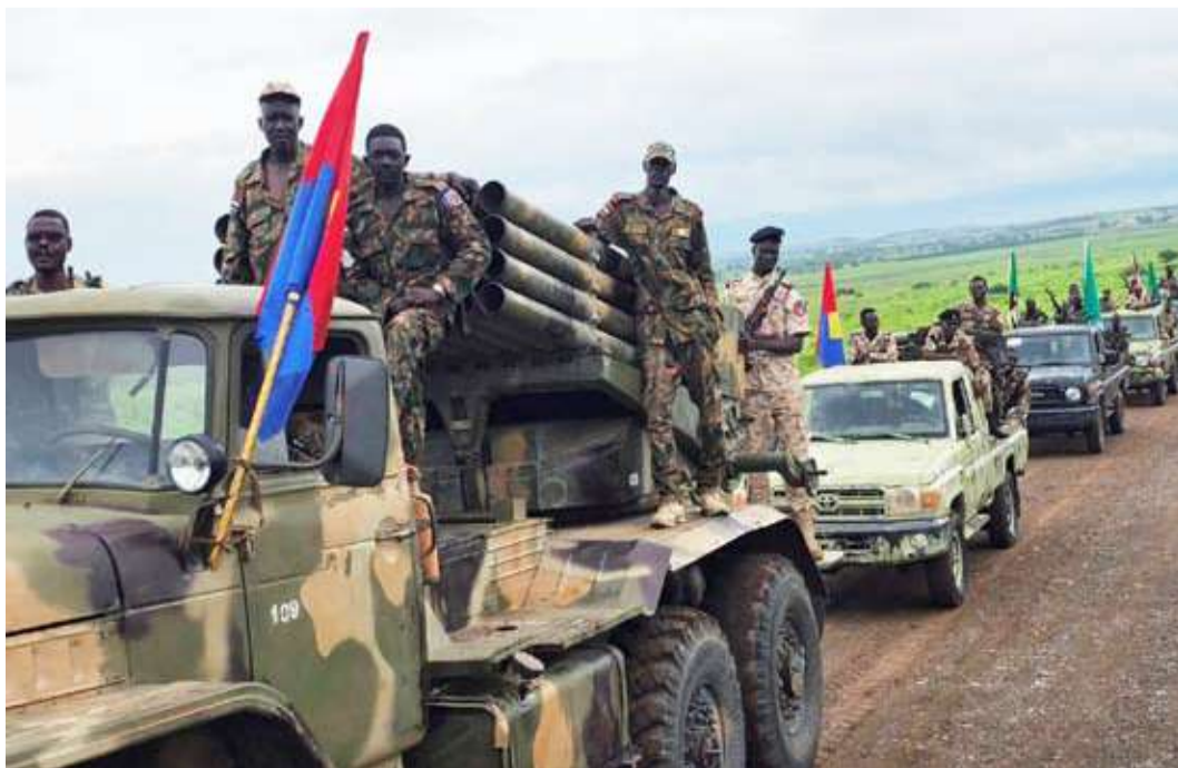
جنود تابعون للجيش السوداني

في الحرب السودانية، لم تعد السماء مسرحاً قتالياً ثانوياً يشرف على محاور القتال الأرضي، بل تحول القتال الجوي إلى محور قائم بذاته، تدار فيه معارك تعتمد على المعلومات والقتال بلا طيارين.