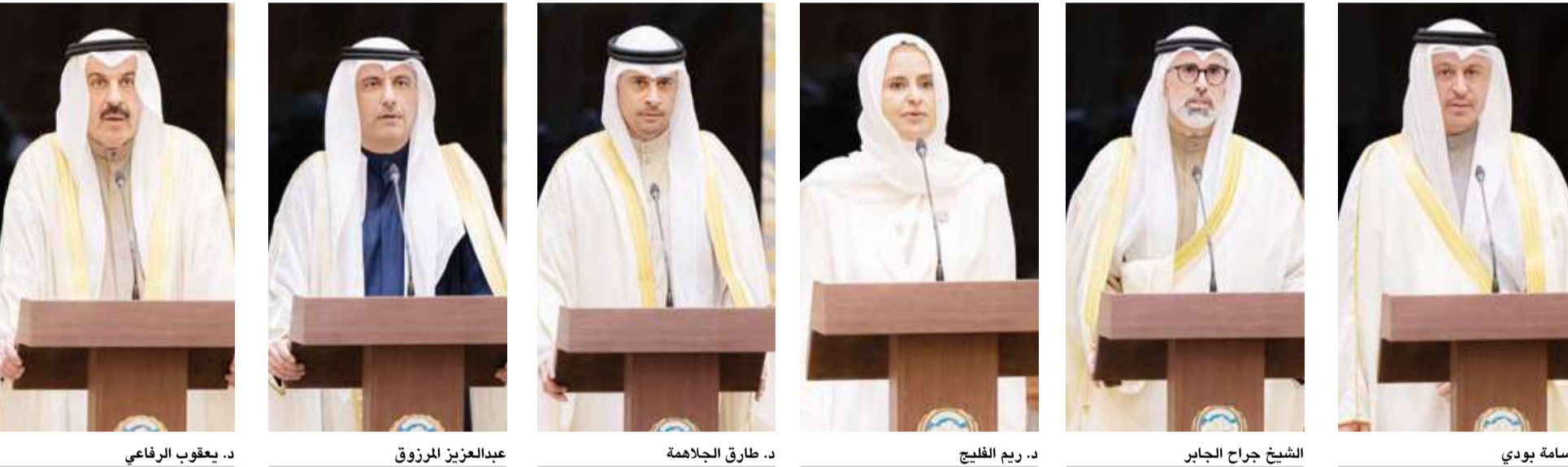
سمو أمير البلاد مستقبلاً بحضور سمو ولي العهد رئيس الوزراء والوزراء الجدد

استقبل صاحب السمو أمير البلاد الشيخ مشعل الأحمد، بقصر بيان، صباح أمس، وبحضور سمو ولي العهد الشيخ خالد، سمو الشيخ أحمد العبدالله رئيس مجلس الوزراء، حيث قدم لسموه الوزراء: أسامة بودي وزيراً للتجارة والصناعة، و جراح الجابر وزير الخارجية، ود. ريم الفليج وزير دولة لشؤون التنمية والاستدامة، و طارق الجلامه وزير دولة لشؤون الشباب والرياضة، وعبد العزيز المرزوق وزير دولة للشؤون الاقتصادية والاستثمار، ود. يعقوب الرفاعي وزيراً للمالية، حيث أدوا اليمين الدستورية أمام سموه بمناسبة تعيينهم في مناصبهم الجديدة. وحضر مراسم أداء القسم، النائب الأول لرئيس مجلس الوزراء ووزير الداخلية الشيخ فهد اليوسف ووزير شؤون الديوان الأميري الشيخ حمد الجابر وكبار المسؤولين بالديوان الأميري.