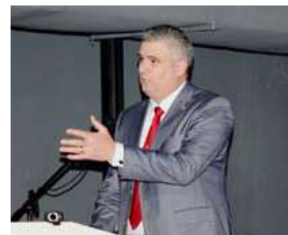
السفير الن بيرييس توريس متحدثاً

أكد سفير كوبا لدى البلاد، ألن بيرييس توريس، أن كوبا تُعد وجهة سياحية غنية بالتاريخ والثقافة والجمال الطبيعي، لافتاً إلى أن الزائر الكويتي يمكنه اكتشاف حكايات أسرة في كل زاوية من زوايا البلاد. جاءت تصريحات السفير على هامش مؤتمر سياحي كويتي نظمته سفارة كوبا، بهدف التعريف بأبرز المقومات السياحية التي تزخر بها الجزيرة، وتعزيز السياحة الكويتية إلى كوبا، بحضور عدد كبير من مكاتب السياحة في الكويت وبمشاركة سفراء من دول أميركا اللاتينية.