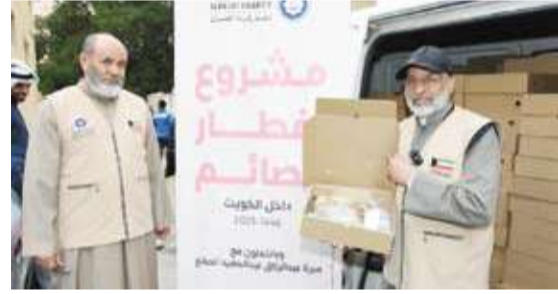
مشروع إفطار الصائم