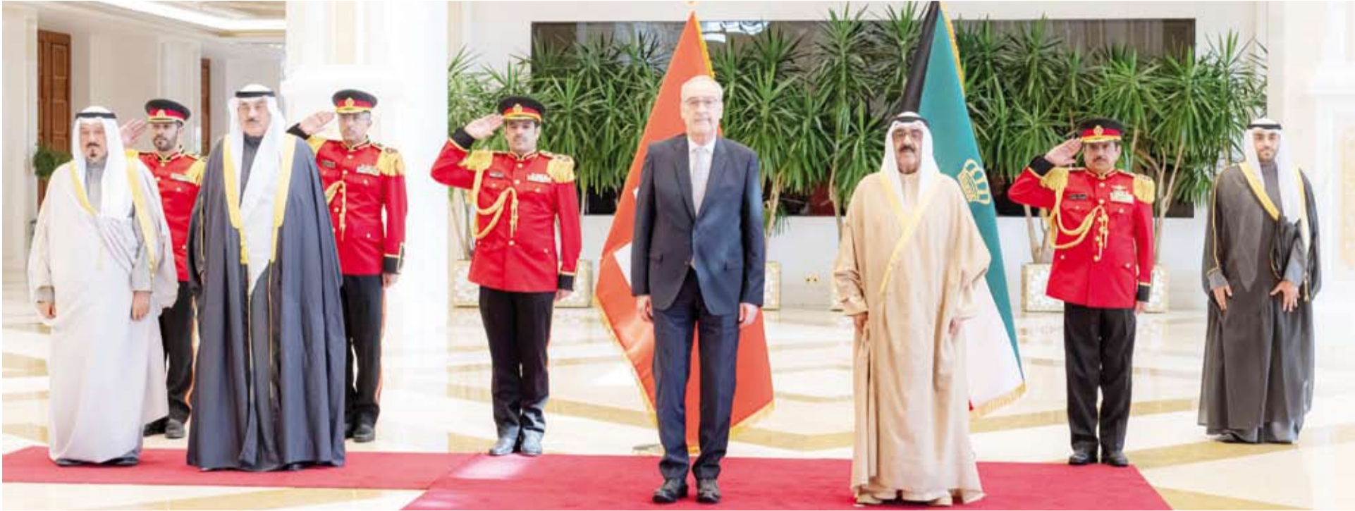
سمو الأمير وسمو ولي العهد خلال استقبال الرئيس في بارميلان

استقبل صاحب السمو أمير البلاد الشيخ مشعل الأحمد، بقصر بيان صباح أمس، الرئيس في بارميلان رئيس الاتحاد السويسري، وذلك بمناسبة زيارته الرسمية للبلاد وبحضور سمو ولي العهد الشيخ صباح الخالد وسمو رئيس الوزراء الشيخ أحمد العبدالله.