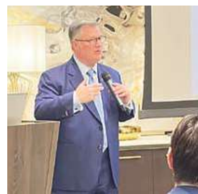
القائم بالأعمال متحدثاً

انظمت سفارة الولايات المتحدة الأميركية في الكويت، بالتعاون مع وزارة الزراعة الأميركية، فعالية "Taste of America: Bringing a Slice of Gulfcood to Kuwait" وذلك بحضور القائم بأعمال السفارة الأميركية السيد ستيف باتلر، ومشاركة ممثلي وسائل الإعلام، إلى جانب عدد من المستوردين، ورواد قطاع الأغذية، وممثلين عن الجهات الحكومية. وسلّمت الفعالية الضوء على المنتجات الغذائية الأميركية وما تتميز به من جودة عالية وابتكار وتنوع، في إطار دعم التبادل التجاري والديبلوماسية التجارية بين الولايات المتحدة ودولة الكويت. وجاء تنظيم الحدث عقب مشاركة الوفد الأميركي في معرض غلفوود 2026، حيث هدفت الفعالية إلى نقل جزء من هذه التجربة العائلية إلى السوق الكويتي.