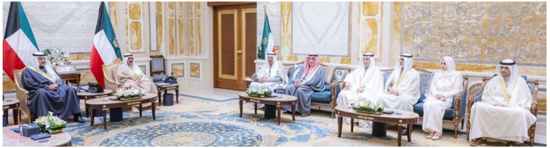
صاحب السمو الأمير وسمو ولي العهد خلال استقبال الوزراء الجدد

استقبل صاحب السمو أمير البلاد الشيخ مشعل بن بدران صباح أمس، وبحضور سمو ولي العهد الشيخ صباح الخالد، سمو الشيخ أحمد عبدالله رئيس مجلس الوزراء حيث قدم لسموه الوزراء كلا من: أسامة خالد عبدالله بودي وزيراً للتجارة والصناعة، جراح جابر الأحمد الصباح وزيراً للخارجية، د. ريم غازي سعود الفليح وزير دولة لشؤون التنمية والإستدامة، د. طارق حمد ناصر الجلامه وزير دولة لشؤون الشباب والرياضة، عبدالعزیز ناصر عبدالعزيز المرزوق وزير دولة للشؤون الاقتصادية والإستثمار، د. يعقوب السيد يوسف السيد هاشم الرفاعي وزير المالية، حيث أدوا اليمين الدستورية أمام سموه بمناسبة تعيينهم في مناصبهم الجديدة.