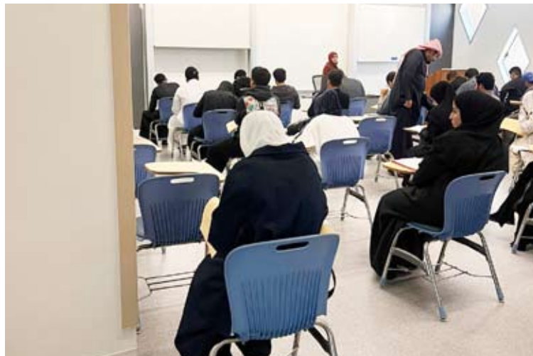
جانب من الاختبارات في كليات مدينة صباح السالم الجامعية

عقدت جامعة الكويت، أمس، اختبارات القدرات الأكاديمية للفرصة الثالثة في كليات مدينة صباح السالم الجامعية، بمشاركة 6380 طالباً وطالبة تقدموا لأداء الاختبارات في مجالات اللغة العربية، واللغة الإنجليزية، والرياضيات، وذلك بنظامها الورقي والإلكتروني. وانطلقت الفكرة الأولى من الاختبارات في سبعة مواقع داخل مدينة صباح السالم الجامعية شملت: كليات الهندسة والبترول، العلوم، العلوم الحياتية، العلوم الإدارية، التربوية، الآداب، ومبنى الإدارة الجامعية، أما الفترة الثانية، فقد شملت اختبارات اللغة الإنجليزية والرياضيات، إلى جانب الاختبارات الإلكترونية الموازية.