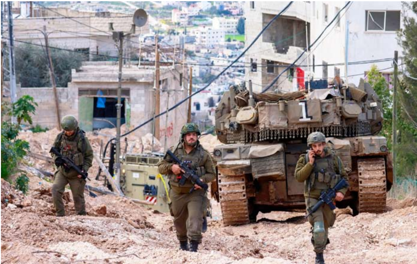
قوات الاحتلال تشن حملة اعتقالات يومية في الضفة

استشهد 14 فلسطينيا نتيجة الأمطار والبرد في غزة، وانهار أكثر من 15 منزلاً منذ بدء انخفاض بيرون الجوي، في حين اعتمدت الجمعية العامة للأمم المتحدة قراراً يطالب إسرائيل –باعتبارها قوة احتلال– بالسماح الفوري وغير المشروط بدخول المساعدات الإنسانية إلى قطاع غزة.