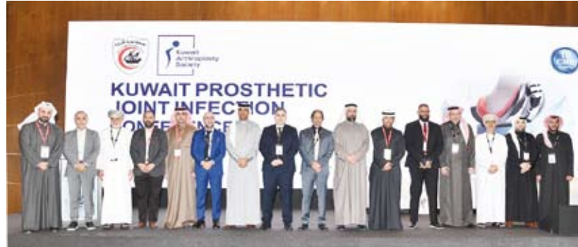
المشاركون في المؤتمر