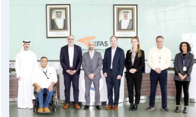
المشاركون في البرنامج التدريبي

نماذج التنبؤ الطبي وتقنيات الطب الدقيق. كما تناول البرنامج عدة مواضيع أخرى من بينها خصوصية البيانات في الذكاء الاصطناعي، وذلك وفق أفضل الممارسات العالمية والسياق الإقليمي لدول الخليج. وتضمن البرنامج ورشاً تطبيقية عملية مكنت المشاركين من بناء نماذج تنبؤية باستخدام بيانات مجهولة الهوية للمرضى دون الحاجة لخبرة برمجية، مع التركيز على أدوات تفسير النتائج لضمان دقة التوصيات الطبية. ويجدر بالإشارة إلى أن عدداً لاقتاً من المهتمين قد حضروا هذا البرنامج التدريبي، لاسيما من وزارة الصحة، معهد الكويت للاختصاصات الطبية، جامعة الكويت، جامعة عبدالله السالم والعديد من الجهات الحكومية والخاصة في هذا المجال. ويأتي هذا البرنامج ضمن استراتيجية دسمان للسكري لتعزيز الابتكار واستخدام التقنيات الحديثة في مكافحة السكري ودعم التحول الرقمي في مجال الرعاية الصحية في دولة الكويت، بما يواكب التطور العالمي المتسارع في هذا المجال.