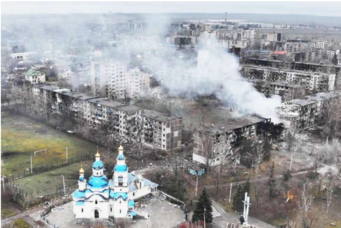
غارة روسية على بلدة في منطقة دونيتسك

أعلنت روسيا أنها ضربت منشآت للصناعة والطاقة في أوكرانيا الليلة الماضية بصواريخ فرط صوتية، في حين أعلنت كيف استعادة بلدتين بمنطقة خاركيف شمال شرقي أوكرانيا. وقالت وزارة الدفاع الروسية في بيان إنها نفذت "ضربة واسعة النطاق" على الجيش الأوكراني ومنشآت للطاقة باستخدام أسلحة –من بينها صواريخ فرط صوتية من طراز كينجال– رداً على "الهجمات الإرهابية الأوكرانية على أهداف مدنية في روسيا"، وفق تعبيرها.