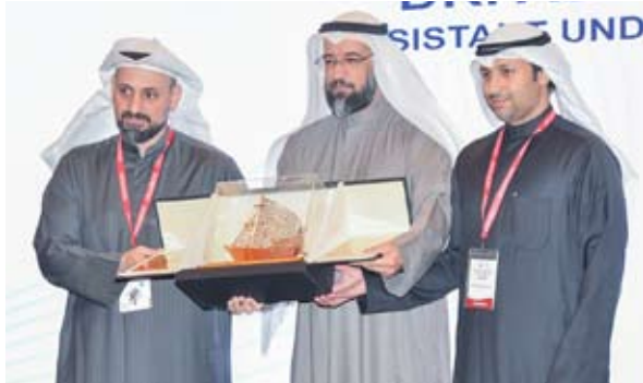
تكريم الوكيل المساعد لشؤون الصحة العامة د. المنذر الحساوي

وأضاف أن عدوى المفاصل الاصطناعية لا تقتصر على كونها من مضاعفات الجراحة بل هي تحدٍ يؤثر على النتائج الطبية والموارد المرحى. وأوضح أن هذا التحدي يتطلب تعاوناً بين مختلف القطاعات والأقسام الطبية بما في ذلك الجراحة والأمراض المعدية وعلم الأحياء الدقيقة والعلاج والتدريب في السياسات الإدارية. وأعرب عباد عن شكره لوزير الصحة الكويتي الدكتور أحمد العوضي على جهوده والتزامه بالتطوير المستمر لنظام الرعاية الصحية الكويتي، وبدوره قال رئيس الرابطة الكويتية لجراحة تبديل المفاصل الدكتور ثنيان العميري: إن التهاب المفاصل يعتبر معضلة ومشكلة أساسية لأي جراح البروتوكولات الكلينيكية الموحدة من أجل تعزيز مسار التعاون الخليجي المشترك وتحقيق التكامل الصحي. من جانبه قال رئيس المؤتمر الدكتور سلامة عباد: إن مؤتمر الكويت لعدوى المفاصل الاصطناعية يناقش أكثر المشاكل تعقيداً وتأثيراً في ممارسة جراحة العظام الحديثة.