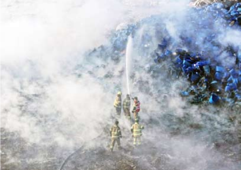
السيطرة على الحريق

سيطرت 6 فرق إطفاء صباح أمس على حريق شركة لمعالجة النفايات ( بلاستيك ) في منطقة أمفرة حيث باشرت الفرق بمكافحة الحريق والسيطرة عليه ولم يسفر الحادث عن اي اصابات تذكر.