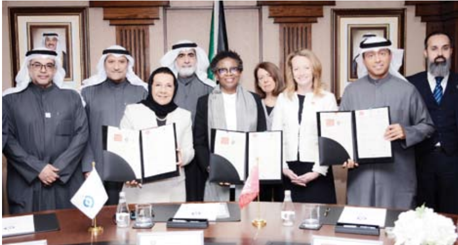
اتفاقية تعاون وشراكة بين جامعة عبدالله السالم وكلية كينجز البريطانية