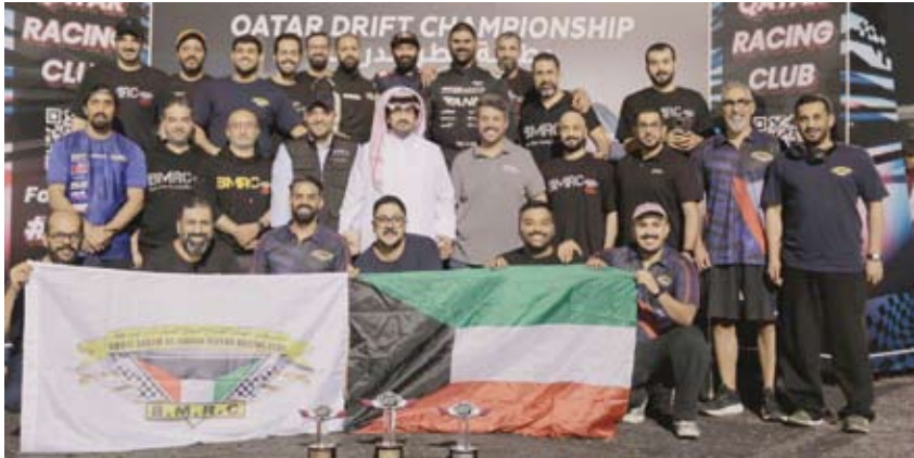
متسابقو نادي باسل الصباح يحققون مراكز متقدمة