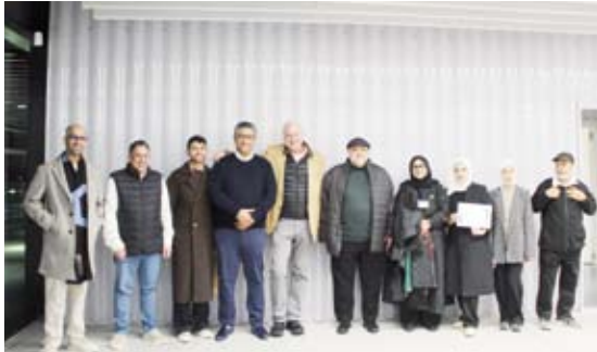
الوفد الكويتي المشارك مع بعض المسؤولين في جامعة «آي ايه»

ضمن جهود الريادية لتعزيز استخدام التقنيات الحديثة في البحث العلمي والممارسات الطبية، نظم معهد دسمان للسكري والذي أنشأته مؤسسة الكويت للتقدم العلمي برنامجاً تدريبياً مكثفاً على مدى يومين بعنوان "الذكاء الاصطناعي للباحثين والعاملين في القطاع الصحي"، وذلك يومي 13 و14 ديسمبر بمشاركة نخبة من الخبراء العالميين في مجال الذكاء الاصطناعي والعلوم الصحية من جامعة أوتاوا بكندا. وشهد اليوم الأول المخصص للباحثين استعراضاً شاملاً لاساسيات الذكاء الاصطناعي وتطبيقاته في البحث العلمي والكتابة والمراجعات العلمية واستخدام أدوات الذكاء الاصطناعي في إعداد خطط البحث وإجراء عمليات البحث العلمي بطريقة منهجية. أما اليوم الثاني المخصص للعاملين في الرعاية الصحية، فركز على التطبيقات العلمية للذكاء الاصطناعي، ومنها استخدامات التعلم العميق في تشخيص أمراض العيون، والكلبي والأمراض المرتبطة بالسكري. إضافة إلى