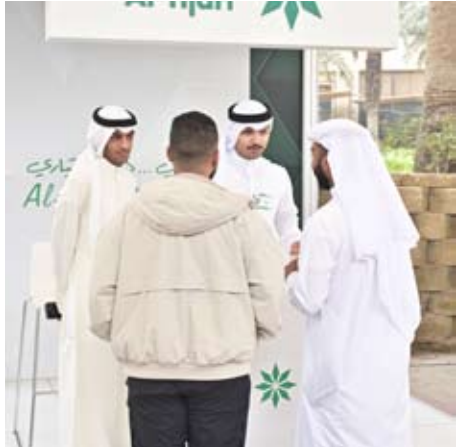
مشاركة البنك في المعرض

وتعدّهم لمواجهة التحديات العلمية والاجتمعية المستقبلية. وأكد البنك التجاري الكويتي أن مشاريعه ورعايته الرسمية لهذا الحدث تأتي انطلاقاً من إيمانه الراسخ بأهمية الاستثمار في الشباب باعتبارهم ركيزة أساسية في نبضة الكويت وتطورها، مؤكداً أن دعم المبادرات التعليمية والعلمية يمثل جزءاً ثابتاً من استراتيجيته للمسؤولية المجتمعية. وقد حرص البنك على إبراز حضوره في المعرض من خلال المواد التوعيفية الرسمية للفعالية التي حملت شعار البنك في أرجاء الجامعة، بما يعكس دوره كشريك رئيسي في دعم الطلبة.