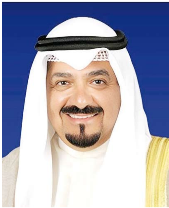
سمو الشيخ أحمد العبد الله