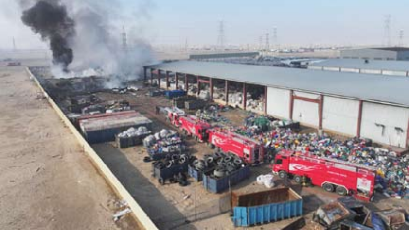
آليات الإطفاء في الموقع

سيطرت 6 فرق إطفاء صباح أمس على حريق شركة لمعالجة النفايات ( بلاستيك ) في منطقة أمفرة حيث باشرت الفرق بمكافحة الحريق والسيطرة عليه ولم يسفر الحادث عن اي اصابات تذكر.