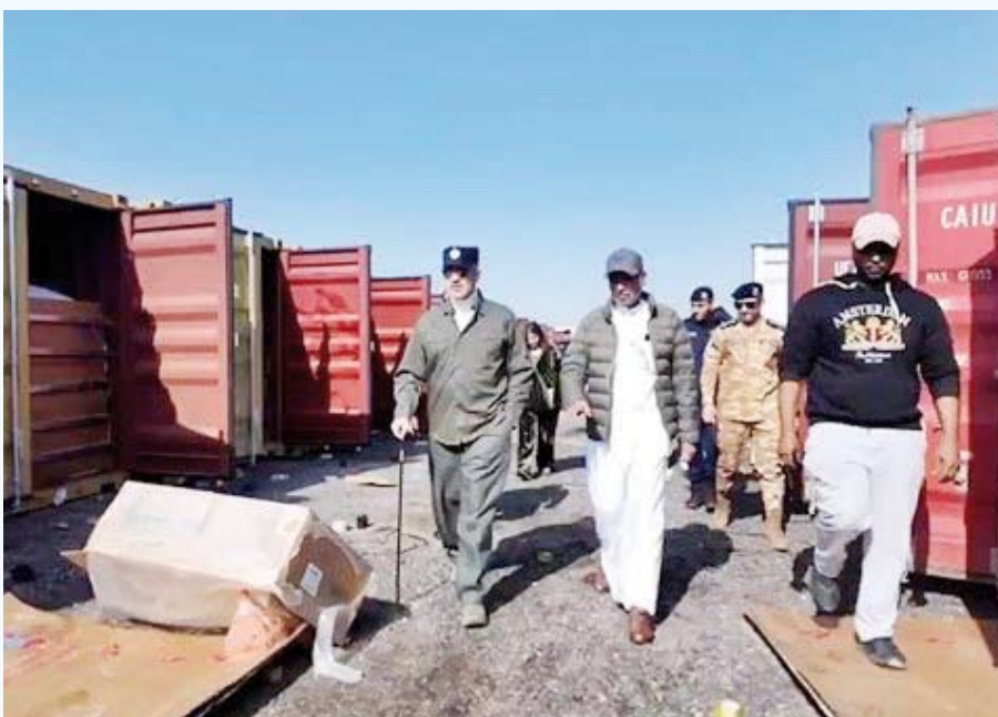
اليوسف يشرف على ضبط الحاويات قبل تهريب الديزل خارج البلاد

خلالها على سير العمل والإجراءات الأمنية المتبعة في حماية وتأمين الحدود البرية، كما شاهد عرضاً مرئياً تضمن توضيحاً حول تطوير النظام الجديد لمراقبة وحماية الحدود.