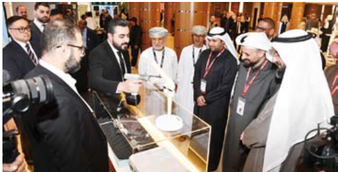
جانب من المعرض المصاحب للمؤتمر

وأضاف أن عدوى المفاصل الاصطناعية لا تقتصر على كونها من مضاعفات الجراحة بل هي تحدٍ يؤثر على النتائج الطبية والموارد المرحى. وأوضح أن هذا التحدي يتطلب تعاوناً بين مختلف القطاعات والأقسام الطبية بما في ذلك الجراحة والأمراض المعدية وعلم الأحياء الدقيقة والعلاج والتدريب في السياسات الإدارية. وأعرب عباد عن شكره لوزير الصحة الكويتي الدكتور أحمد العوضي على جهوده والتزامه بالتطوير المستمر لنظام الرعاية الصحية الكويتي، وبدوره قال رئيس الرابطة الكويتية لجراحة تبديل المفاصل الدكتور ثنيان العميري: إن التهاب المفاصل يعتبر معضلة ومشكلة أساسية لأي جراح البروتوكولات الكلينيكية الموحدة من أجل تعزيز مسار التعاون الخليجي المشترك وتحقيق التكامل الصحي. من جانبه قال رئيس المؤتمر الدكتور سلامة عباد: إن مؤتمر الكويت لعدوى المفاصل الاصطناعية يناقش أكثر المشاكل تعقيداً وتأثيراً في ممارسة جراحة العظام الحديثة.