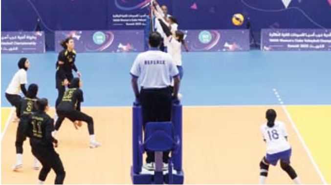
جانب من لقاء نادي الفتاة والنصر الأردني

بنتيجة أربعة أشواط بواقع (26 - 24) و(25 - 22) و(24 - 26) و(25 - 19). يذكر أن تحديد المراكز من الثامن