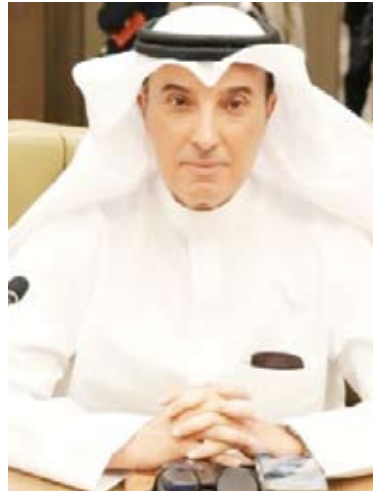
السفير طلال المطيري

أكدت دولة الكويت، أول أمس، حرصها على المشاركة في الفعاليات الداعمة لمسيرة العمل العربي المشترك في كل المجالات باعتبارها ركيزة أساسية لتعزيز التعاون وتبادل الخبرات وترسيخ الحضور العربي في المحافل الإقليمية والدولية.