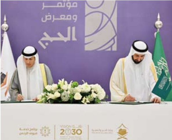
توقيع اتفاقية ترتيب شؤون حجاج دولة الكويت