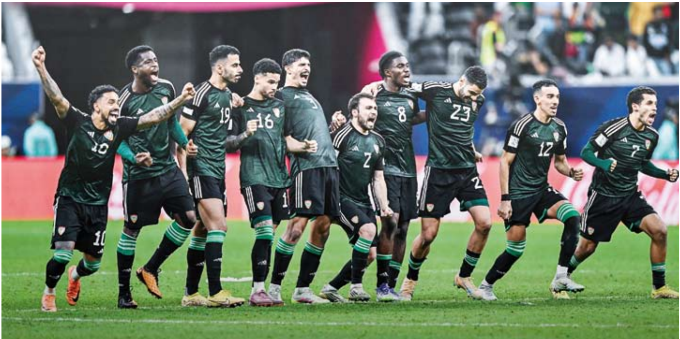
فوز مثير للابيض الإماراتي على حامل اللقب

جردت الإمارات الجزائر من لقبها بطلّة لمسابقة كأس العرب في كرة القدم عندما تغلبت عليها 7-6 بركلات الترجيح (الوقتان الأصلي والإضافي 1-1)، على ملعب البيت في الخور، وبلغت نصف النهائي.