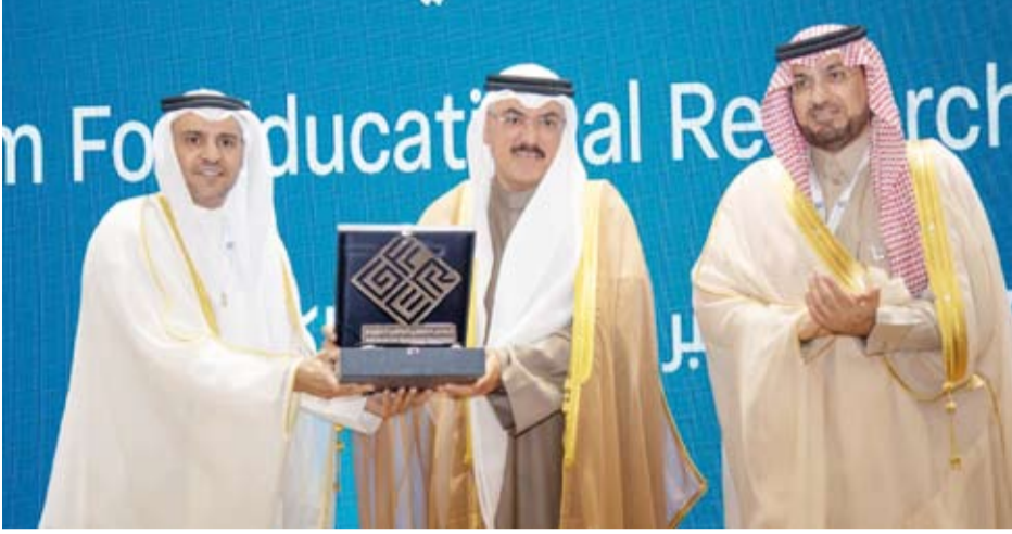
تقديم درعاً تذكارية لوزير التربية