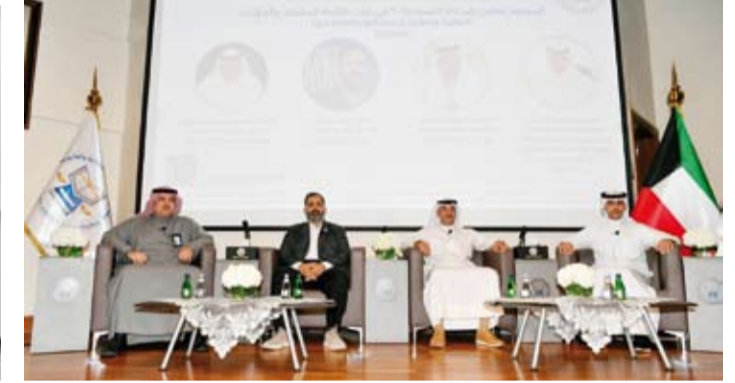
ندوة علمية للتعريف بمواد القانون