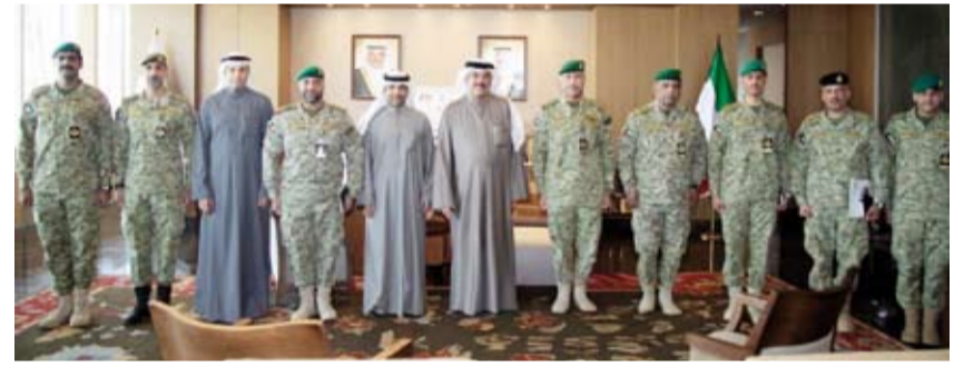
وزير التربية مستقبلاً وفد «الحرس الوطني»