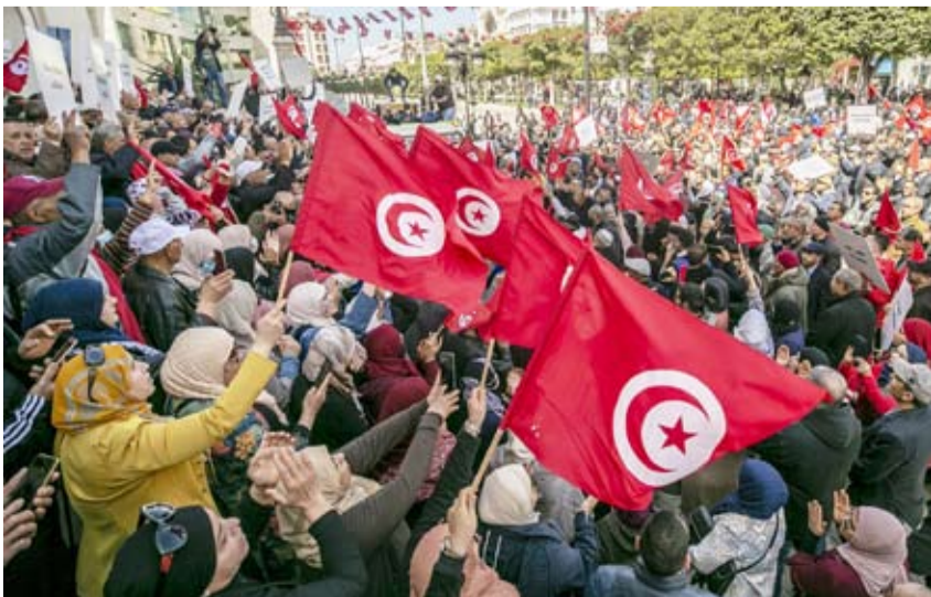
احتجاجات سابقة في تونس

نقلت رويترز عن شهود عيان أن اشتباكات اندلعت لليلة الثانية على التوالي بين الشرطة التونسية وشبان غاضبين في مدينة القيروان وسط البلاد، عقب وفاة رجل إثر مطاردة نفذتها الشرطة تلاها عتف ضده، وفق ما ذكرته عائلته. وأضاف الشهود أن المتظاهرين رشقوا الليلة الماضية قوات الأمن بالحجارة والزجاجات الحارقة والشمايح، كما أغلقوا الطرقات بإشعال الإطارات المطاطية، مما دفع الشرطة إلى تفريقهم باستخدام الغاز المسيل للدموع. وجسب أقارب المتوفى، كان الرجل يقود قبل أيام دراجة تارية من دون رخصة عندما طار دته سيارة للشرطة، قبل أن يتعرض للضرب وينقل إلى المستشفى الذي غادره لاحقاً، ليغارق الحياة بعد ذلك متأثراً بجزئ في الرأس. ولم يتسنّ الحصول على تعليق رسمي من السلطات بشأن الحادث حتى الآن. وفي محاولة لاحتماء التوتر، أفادت