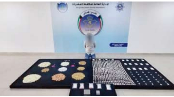
القانون يمثل حرب شاملة ضد تجار السموم

يتضمن دمجاً لقانوني مكافحة المخدرات والمؤثرات العقلية لتحقيق حزمة من الفوائد التي تسهم في حماية المجتمع