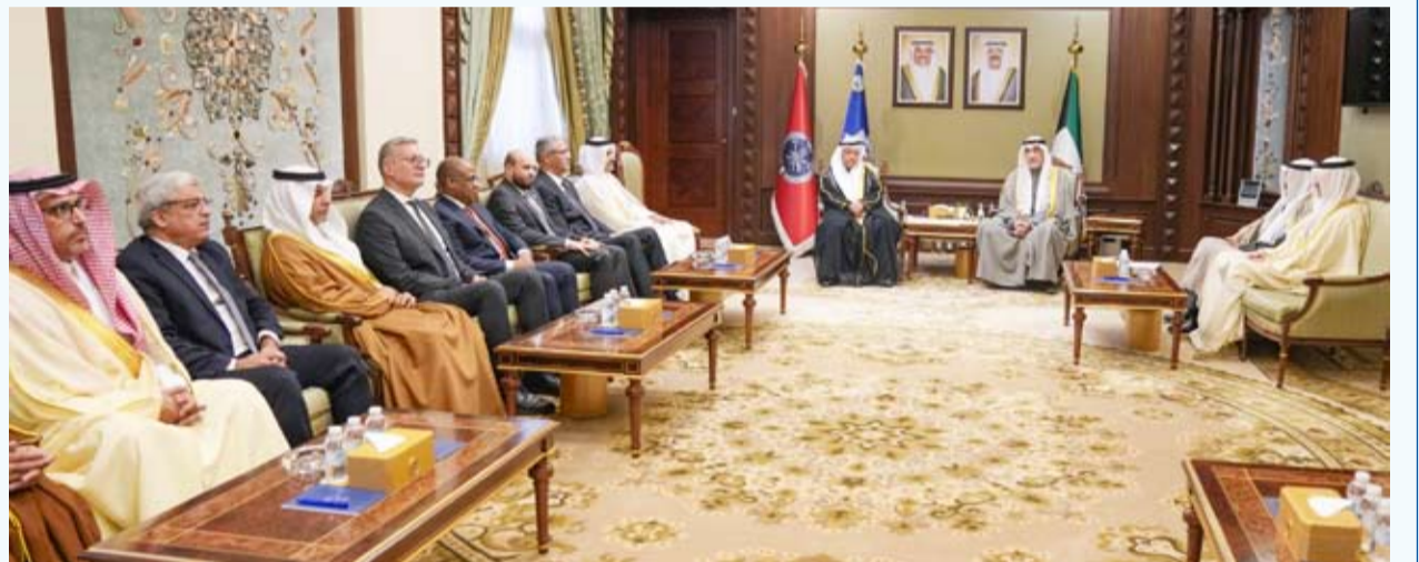
اليوسف مستقبلاً وزراء وممطي وزارات النفط والطاقة في «أوابك»

العثور على مستثمر. وكانت مجموعة أوكيو العمانية الحكومية للطاقة قد ذكرت أنها تجري محادثات مع شركاء محتملين جدد للمشروع بعد انسحاب شركة سابك السعودية.