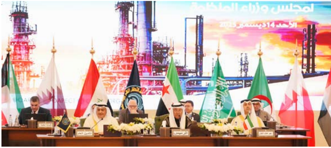
الرومي أثناء القائه كلمة افتتاحية

على العودة داعمين للجمهورية السورية متمنيا لسوريا الاستقرار والرخاء. وأوضح أنه مع كل الجهود التي تبذلها منظمة أوبك في السوق العالمي إلا أن المحافظة على الأسعار لم يكن سهلاً، منوهاً إلى أن المعايير التي تسير عليها أسعار النفط يصعب فهمها، متوقفاً أن تنهض أسعار الكويت خفضت طوعاً أو قهراً الزيادة في الإنتاج بداية من شهر يناير القادم وعلية يتم الاستمرار في إيقاف الزيادة أو تعويض الإنتاج الذي تم سحبه من السوق.