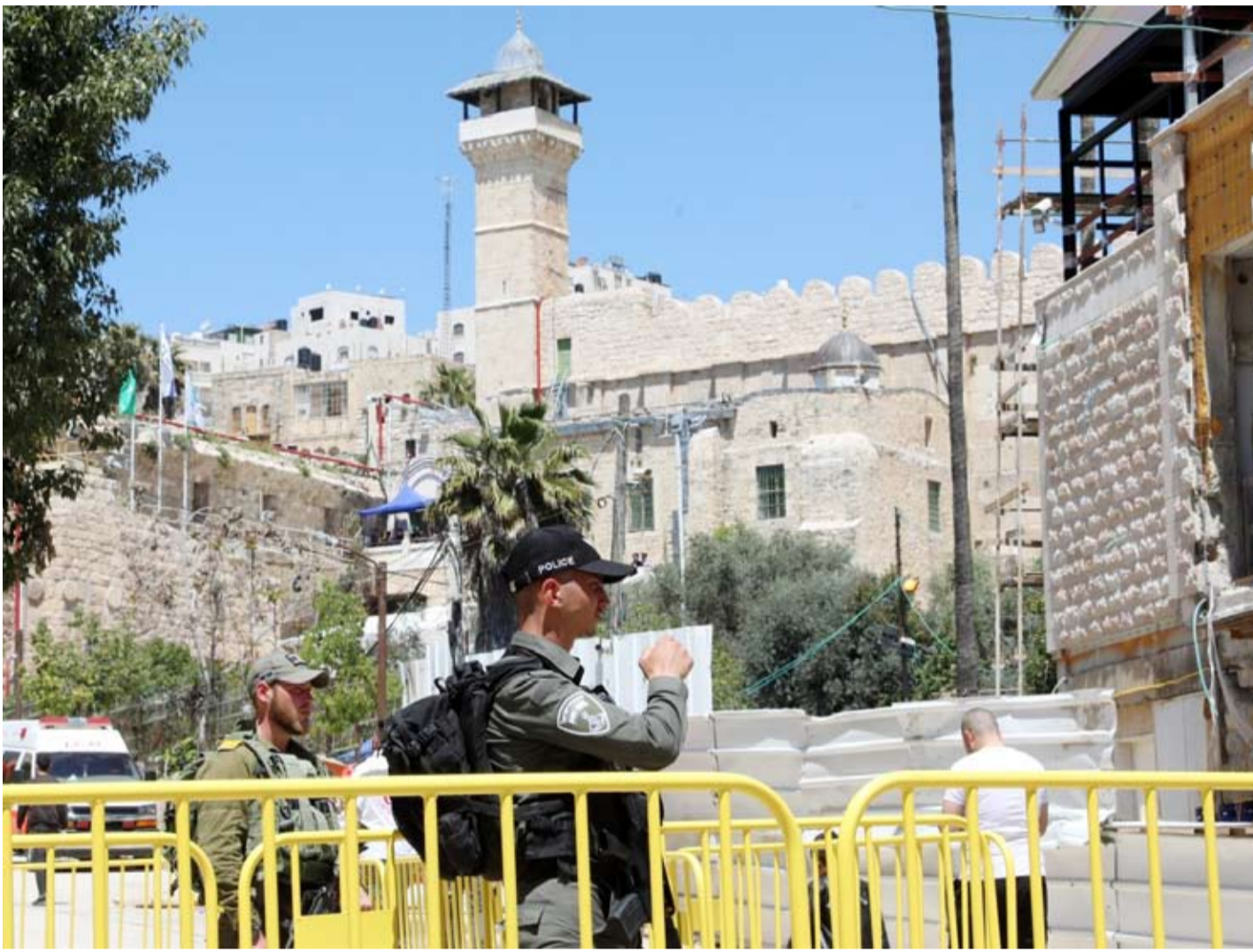
قوات الاحتلال خلال اقتحام سابق للحرم الإبراهيمي