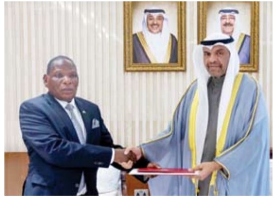
وزير الخارجية يتسلم الرسالة الخطية

تلقى صاحب السمو أمير البلاد الشيخ مشعل الأحمد، رسالة خطية من رئيس جمهورية ملاوي آرثر بيتر موثاريكا، تتعلق بأطر تعزيز العلاقات الثنائية الوثيقة التي تربط البلدين الصديقين وسبل تعزيزها وتنميتها في مختلف المجالات.