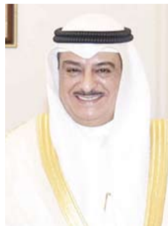
المستشار سعد الصفران

المجتمع لرفع الوعي بالجرائم الرقمية وبيان الإجراءات المتخذة حيالها بما يواكب تطور أساليب جرائم الاحتيال الإلكتروني. وأضاف أن هذه النيابة ستعمل على تفعيل مبادرات تعزز من القدرة على رصد الأنماط المستجدة لهذه الجرائم والتدخل السريع للحد من آثارها. ويعد هذا القرار خطوة مهمة في تأمين الاقتصاد الوطني وتعزيز سلامة المعاملات المالية للأفراد والمؤسسات وترسيخ بيئة اقتصادية مستقرة وآمنة. ومن المقرر أن يبدأ العمل في نيابة الشؤون المصرفية في عام 2026 إيماناً بمرحلة جديدة في مواجهة الجرائم المالية بحزم شديد واحترافية أعلى.