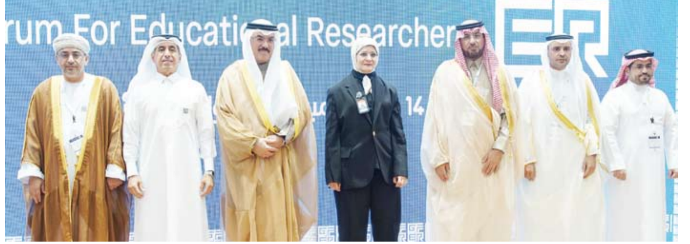
وزير التربية سيد جلال الطبطبائي مع بعض المشاركين في الملتقى