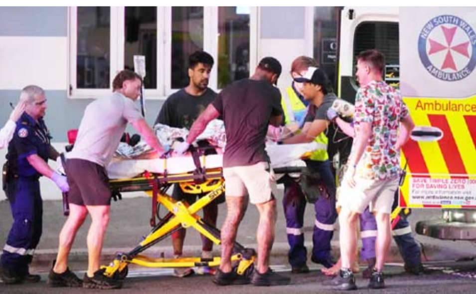
جانب من إجلاء المصابين وأغلبهم من اليهود