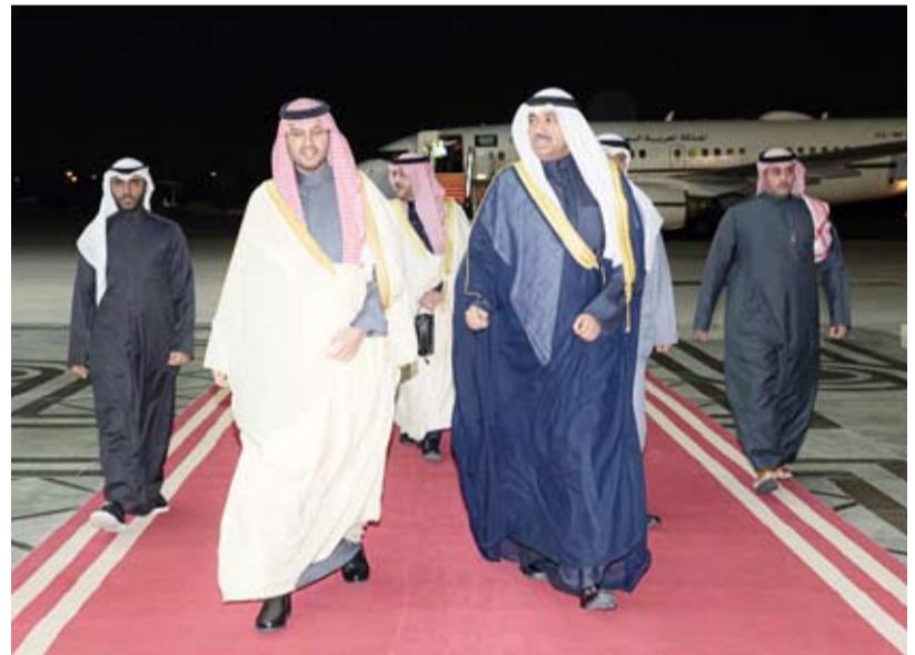
وزير الدفاع الشيخ عبدالله العلي مستقبلاً صاحب السمو الملكي الأمير تركي بن محمد

وصل إلى البلاد مساء أمس صاحب السمو الملكي الأمير تركي بن محمد بن فهد بن عبدالعزيز آل سعود وزير الدولة عضو مجلس الوزراء بالملكة العربية السعودية الشقيقة والوفد المرافق وذلك بمناسبة زيارته الرسمية للبلاد. وكان في استقباله وزير الدفاع ووزير الداخلية بالإتابة الشيخ عبدالله علي عبدالله السالم الصباح رئيس بعثة الشرف المرافقة.