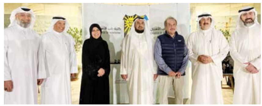
جانب من الحضور خلال الحفل