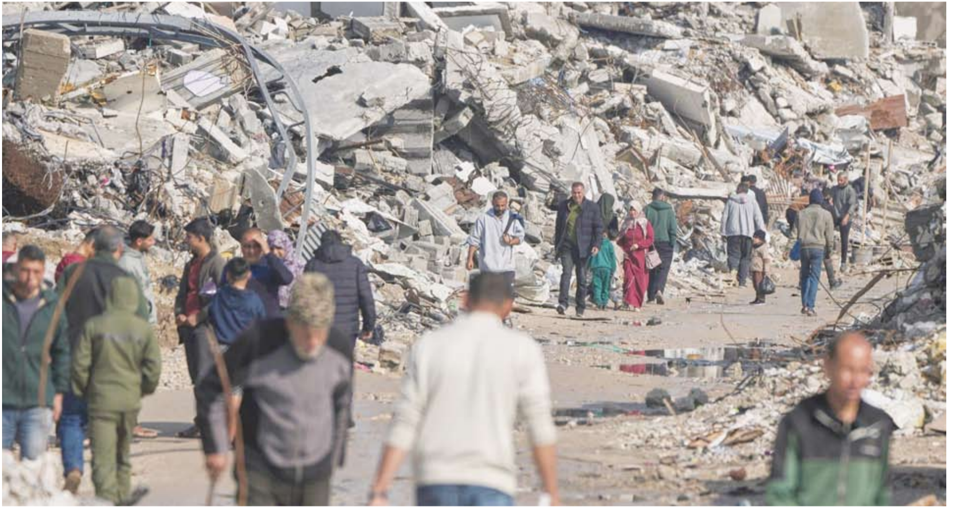
يعيش سكان القطاع وسط ركاب هائل