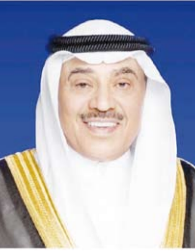
سمو ولي العهد الشيخ صباح الخالد

بعث سمو ولي العهد الشيخ صباح الخالد، ببرقية تهنئة إلى أخيه صاحب السمو الشيخ تميم بن حمد آل ثاني أمير دولة قطر الشقيقة، ضمنها سموه خالص تهانیه بمناسبة ذكرى اليوم الوطني لدولة قطر الشقيقة. مشيداً سموه بالإنجازات التنموية التي حققتها دولة قطر الشقيقة على كافة الأصعدة وبصورة ارتقت بمكانتها الرفيعة، متمنياً لسموه موفور الصحة وتمام العافية وللبلد الشقيق كل الرقي والازدهار في ظل قيادته الرشيدة. من جهة أخرى، بعث سمو ولي العهد الشيخ صباح الخالد، ببرقية تهنئة إلى الجنرال عبدالرحمن تياتي - رئيس المجلس القومي لحماية الوطن - رئيس جمهورية النيجر الصديقة، ضمنها سموه خالص تهانیه بمناسبة ذكرى يوم الجمهورية لبلادها. متمنياً سموه لفخامته موفور الصحة والعافية ولجمهورية النيجر وشعبها الصديق كل التقدم والازدهار.