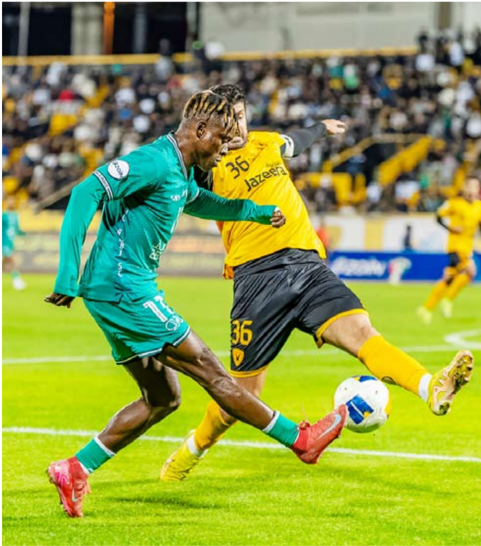
فوز عرباوي مستحق أمام القادسية