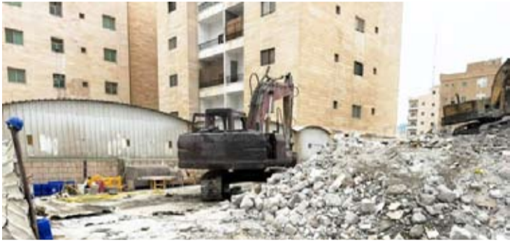
هدم المباني المخالفة