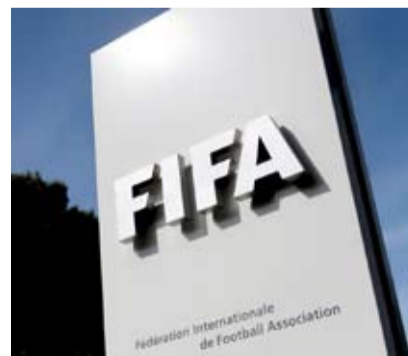
جوائز ضخمة للمشاركة في مونديال 2026

أعلن الاتحاد الدولي لكرة القدم فيفا عن تخصيص مبلغ قياسي قدره 727 مليون دولار أمريكي لتوزيعه على المنتخبات الـ 48 المشاركة في نهائيات بطولة كأس العالم 2026 المقررة في الولايات المتحدة وكندا والمكسيك. وأكد فيفا، في بيان عبر موقعه الرسمي، أن مجلسه أقر هذا القرار خلال اجتماعه على هامش نهائي بطولة كأس القارات للأندية FIFA قطر 2025 في الدوحة بين باريس سان جيرمان الفرنسي وفلامنغو البرازيلي، مشيراً إلى أن المبلغ سيشكل زيادة بنسبة 50% مقارنة بما تم تخصيصه في نسخة 2022 بقطر، وذلك تماشياً مع رفع عدد المنتخبات من 32 إلى 48.