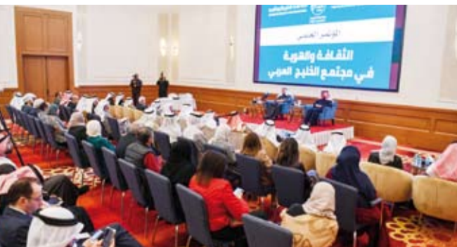
جانب من أعمال المؤتمر

وقال: إننا في دول مجلس التعاون الخليجي نجد أننا متقاربون جداً بالثقافة والفن ومختلف المجالات كوننا أصحاب بيئة مشتركة سواء أهل البادية أو حتى الذين عاشوا على شواطئ الخليج وترتبط بيننا علاقات وثيقة منجذرة منذ عقود طويلة. يذكر أن المؤتمر تناول مواضيع تعليمية وثقافية وهوية في المجتمع الخليجي من ناحية التعددية والتنوع الثقافي وتحرق إلى الرؤى القانونية والقضائية في مسألة الهوية إلى جانب قضايا البعد التاريخي والجغرافي والسياسي على مدى يومين بواقع 17 جلسة علمية مزامنة شارك فيها نخبة من الأكاديميين والباحثين من دول مجلس التعاون الخليجي.