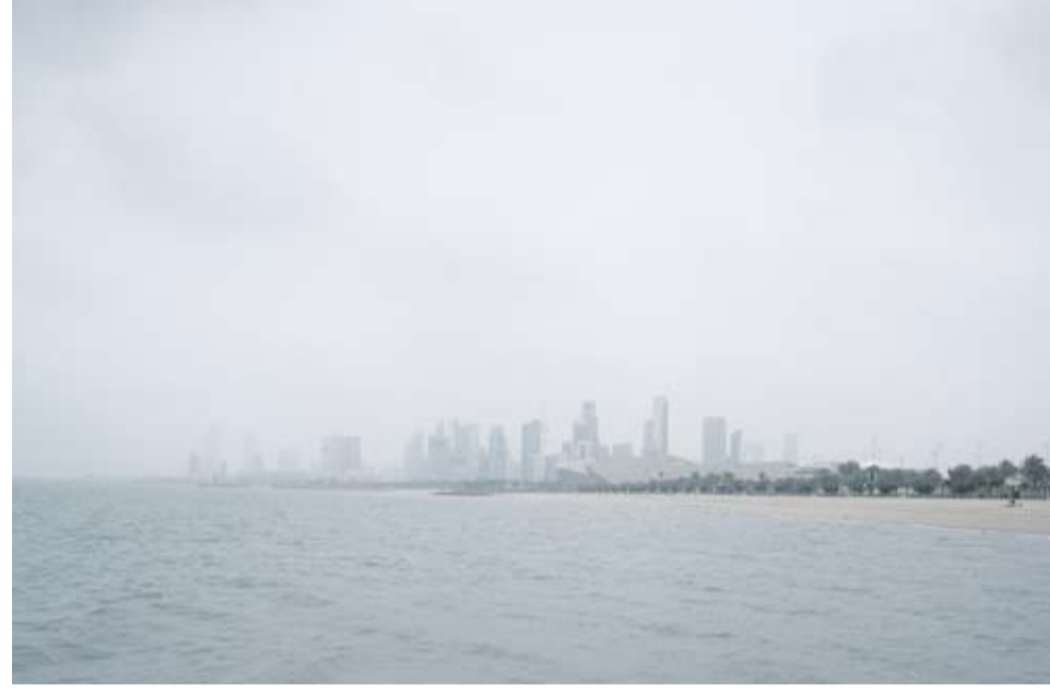
الطقس سيكون بارداً في عطلة نهاية الأسبوع وتتراوح درجات الحرارة العظمى المتوقعة ما بين 16 و 18 درجة مئوية ويكون البحر معتدلاً إلى عالي الموج ما بين 4 و 7 أقدام. ولفت إلى أن الطقس ليلاً يكون بارداً والرياح شمالية غربية خفيفة

إلى معتدلة السرعة ما بين 12 و 35 كيلومتراً في الساعة مع فرصة لتكون الضباب الخفيف على بعض المناطق، أما درجات الحرارة الصغرى المتوقعة فتتراوح ما بين 6 و 8 درجات مئوية ويكون البحر خفيفاً إلى معتدل الموج ما بين 2 و 4 أقدام. وعن الطقس نهار السبت قال العلي: إنه يكون مائلاً للبرودة والرياح شمالية غربية إلى متقلبة الاتجاه خفيفة إلى معتدلة السرعة ما بين 6 و 28 كيلومتراً في الساعة وتتراوح درجات الحرارة العظمى المتوقعة ما بين 16 و 18 درجة مئوية ويكون البحر خفيفاً إلى معتدل الموج ما بين 1 و 3 أقدام. وأشار إلى أن الطقس ليلاً يكون بارداً والرياح شمالية غربية إلى متقلبة الاتجاه خفيفة إلى معتدلة السرعة ما بين 8 و 30 كيلومتراً في الساعة وتظهر بعض السحب المتفرقة، بينما درجات الحرارة الصغرى المتوقعة ما بين 5 و 7 درجات مئوية ويكون البحر خفيفاً إلى معتدل الموج ما بين 1 و 4 أقدام.