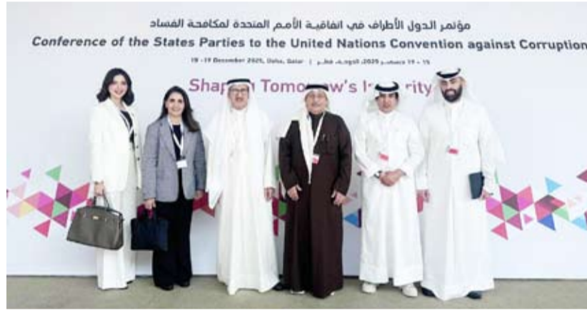
وقد الهيئة العامة لمكافحة الفساد المشارك في المؤتمر