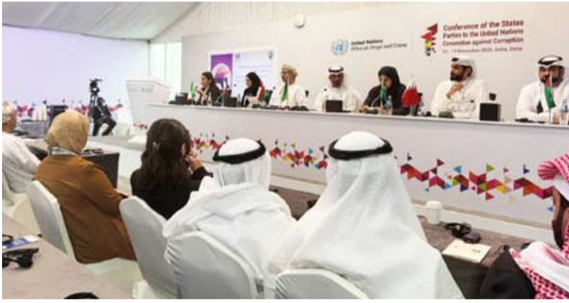
جانب من فعاليات مؤتمر الدول الأطراف