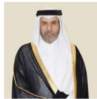
سفير قطر آل محمود

إنجازات تنمية شاملة في ظل القيادة الحكيمة لأمير قطر الشيخ تميم بن حمد آل ثاني. وقال السفير آل محمود: إن السياسة الخارجية القطرية تقوم على مبادئ ثابتة تركز على الحوار والدبلوماسية الوقائية وتسوية النزاعات بالطرق السلمية، لافتاً إلى الدور الفاعل الذي تضطلع به دولة قطر في مجال الوساطة الإقليمية والدولية ودعم جهود السلام والاستقرار والعمل الإنساني. وشدد على أن دولة قطر، ماضية في نهج التنمية المستدامة وتعزيز مكانتها الدولية من خلال سياسات اقتصادية متوازنة أسهمت في تحقيق مؤشرات متقدمة في التنمية والأمن وتنافسية الاقتصاد.