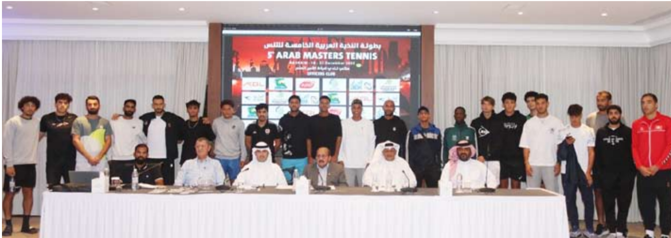
جانب من المؤتمر الصحفي بمشاركة اللاعبين

انطلقت في العاصمة البحرينية المنامة منافسات النسخة الخامسة من بطولة النخبة العربية للتنس، التي ينظمها الاتحاد العربي للتنس برئاسة الشيخ أحمد الجابر العبدالله الصباح بالتعاون مع الاتحاد البحريني، وذلك برعاية كل من البنك الأهلي الكويتي، وشركة KGL، والخطوط الجوية الكويتية، وشركة KDD، وبمشاركة نخبة من أبرز اللاعبين العرب المصنّفين في الاتحاد الدولي للتنس للمحترفين (ATP) والاتحاد الدولي للتنس للناشئين (ITF). وفي إطار الاستعدادات للبطولة، عقد الاتحاد العربي للتنس مؤتمراً صحفياً، تم خلاله استعراض الجوانب التنظيمية ونظام المسابقة، إلى جانب إجراء قرعة بطولة النخبة وقرعة البطولة العربية للناشئين تحت 16 سنة، التي يستضيفها الاتحاد البحريني للتنس بالتعاون مع بطولة النخبة.