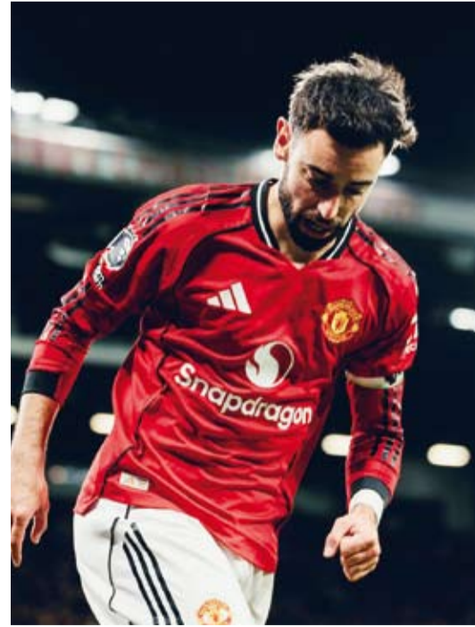
برونو قائد يوناييتد يحتفل بالتسجيل

دفعي للرحيل، وهذا يؤلمني، لأنني لاعب ليس لديهم ما يتقدموني عليه. أنا دائماً جاهز لكل مباراة، أقدم قصارى جهدي دائماً، سواء كان أدائي جيداً أم سيئاً، وعندما تنظر حولك وترى لاعبين لا يقدرهم النادي بقدر ما تقدرهم، ولا يدافعون عنه بنفس القدر، تشعر بالحزن».