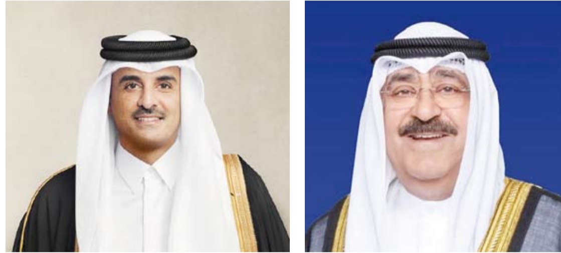
سمو الشيخ تميم بن حمد آل ثاني