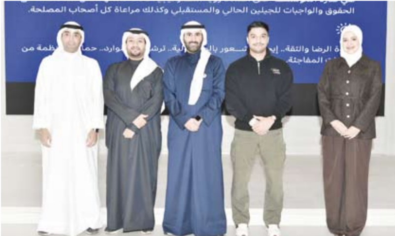
المشاركون في البرنامج التدريبي

وهدف البرنامج إلى تعزيز المهارات العملية للمشاركين وتمكينهم من إنتاج قصص إخبارية مصورة بالوسائط المتعددة باستخدام الهاتف المحمول فقط إلى جانب تنمية مهارات الكتابة الصوتية والإلقاء والتسجيل الصوتي بما يواكب التطورات المتسارعة في العمل الإعلامي الرقمي. ويعد مركز (كونا) لتطوير القدرات الإعلامية الذي أسس في ديسمبر 1995 من أهم مراكز التدريب الإعلامية وقدم مئات برامج التدريب في مجالات إعلامية مختلفة بهدف إلى تطوير القدرات والإمكانيات الشخصية الإعلامية والارتقاء بالعمل الإعلامي المهني.