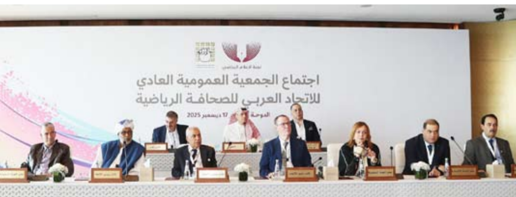
الجمعية العمومية للاتحاد العربي للصحافة الرياضية