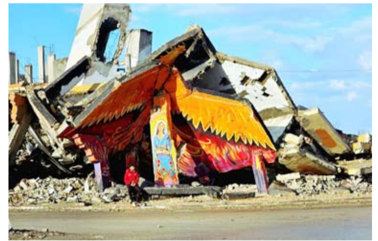
لوحات فنية من تحت انقاض غزة

كشف رئيس مجلس الوزراء، وزير الخارجية القطري الشيخ محمد بن عبد الرحمن بن جاسم آل ثاني عن عقد اجتماع يوم غد الجمعة بين جميع الوسطاء، لوضع التصور الكامل لكيفية الانتقال إلى المرحلة الثانية من اتفاق إنهاء الحرب في قطاع غزة. وخلال زيارته لواشنطن، قال آل ثاني إنه يتفق مع وزير الخارجية الأمريكي ماركو روبيو على مضاعفة الجهود للوصول إلى المرحلة الثانية من اتفاق وقف إطلاق النار في غزة. على سعيد متصل، أعلنت وزارة الصحة الفلسطينية في غزة، ارتفاع عدد الوفيات التي وصلت المستشفيات، نتيجة المنخفضات الجوية الأخيرة والبرد الشديد في قطاع غزة، إلى 13 حالة وفاة.