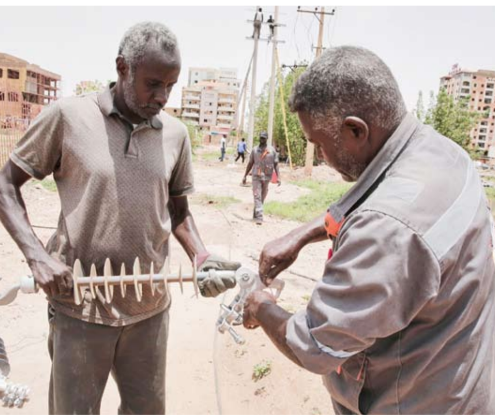
عمالان يحاولان إصلاح أسلاك كهرباء

الدعم السريع على دمج الأخيرة بالمؤسسة العسكرية للبلاد، مما تسبب بمقتل عشرات آلاف السودانيين ونزوح نحو 13 مليوناً، وفق تقارير أممية.