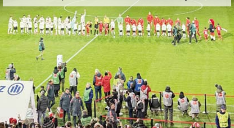
إشعال الألعاب النارية تسبب في معاقبة البايرن

تلقي بايرن ميونخ عقوبات قاسية في أحدث الإجراءات التأديبية التي أعلنها الاتحاد الأوروبي لكرة القدم (اليويفا)، إذ تلقي غرامات إجمالية قدرها 116 ألف يورو، مع إغلاق جزئي للملعب في المباراة المقبلة على أرضه في دوري أبطال أوروبا. ووجهت إلى بايرن تهمة إغلاق المدرج العام داخل الملعب، وإشعال الألعاب النارية خلال مباراته ضد سبورتنغ لشبونة في وقت سابق من هذا الشهر. ونتيجة لذلك أمر «اليويفا» بتنفيذ عقوبة تم تعليقها سابقاً، مما أدى إلى إغلاق جزئي للقطاعات من 111 إلى 114 في ملعب أليانز بمباراة بايرن