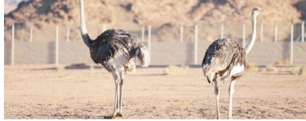
النعام ذو الرقبة الحمراء

كشفت محمية الأمير محمد بن سلمان الملكية، عن إعادة توطين المجموعة ذات الرقبة الحمراء (طائر الجمل) في المحمية، وهو نوع مهدد بالانقراض؛ ليكون بديلاً بيولوجياً عن نوع النعام العربي المنقرض، وذلك في خطوة مهمة نحو إعادة تأهيل الحياة البرية في الجزيرة العربية. وسبق أن شهدت الصحراء العربية انتشاراً واسعاً للنعام العربي، إلا أنه اتجه نحو الانقراض في مطلع القرن العشرين بسبب الصيد الجائر وفقدان الموائل. ويُعرف النعام ذو الرقبة الحمراء باسم نعام شمال أفريقيا، واختارته المحمية نظراً إلى التشابه الجيني بينه وبين النعام العربي، وقدرته على التأقلم في بيئة الصحراء القاحلة. وجرى إعادة توطين المجموعة المؤسسة المكوّنة من خمس نعامات ذات الرقبة الحمراء في المحمية، في إطار برنامجها المعتمد من مجلس الإدارة لاستعادة الحياة البرية؛ الذي يهدف إلى استعادة مستويات التنوع البيولوجي السابقة على امتداد مساحتها البالغة (24,500) كيلومتر مربع عبر النطاقين البري والبحري. ويعد النعام ذو الرقبة الحمراء النوع الثاني عشر من بين الأنواع الـ (23) التي كانت موجودة سابقاً وسيجري إعادة توطينها، كجزء من إستراتيجية إعادة تأهيل النظام البيئي للمحمية على المدى الطويل. وأوضح الرئيس التنفيذي لهيئة