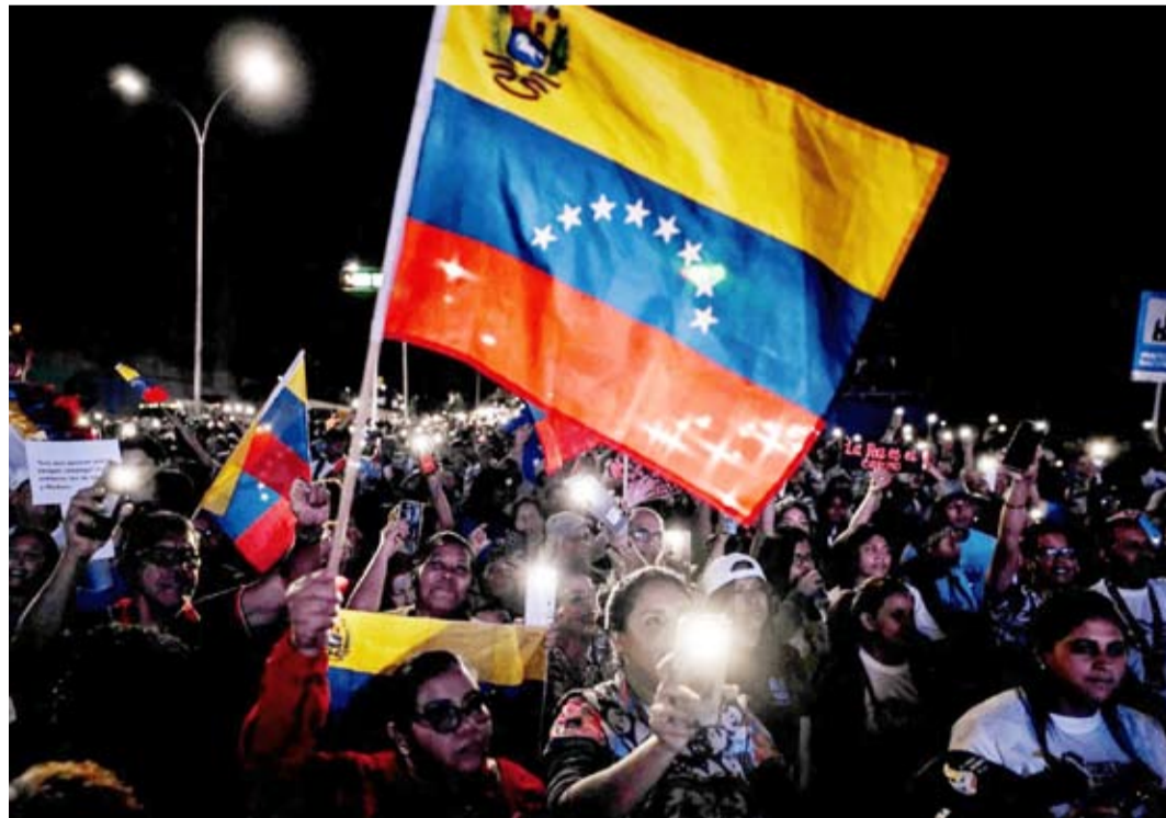
احتجاجات سابقة للشعب الفنزويلي

الأسبوع المقبل لبحث الوضع في فنزويلا، وربما في وقت أبكر حسب التطورات. ونقلت رويترز عن دبلوماسي أممي أن الاجتماع مرجح بناء على طلب كراكاس. وفي السياق، ذكرت صحيفة «بوليتيكو» أن شركات النفط الأميركية أبلغت إدارة ترامب بعدم رغبتها في العودة إلى فنزويلا حتى بعد رحيل مادورو، في حين بحثت الإدارة مع تلك الشركات إمكانية العودة في حال تغير النظام. كما أفادت بلومبرغ، أن مستودعات النفط في فنزويلا تقرب من الوصول إلى طاقتها القصوى، في ظل القيود الأميركية المفروضة على تصدير الخام.