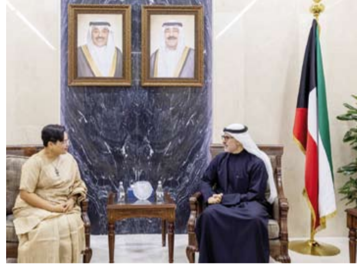
.. ويلتقي سفيرة الهند باراميتا تريباتي