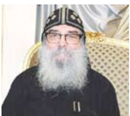
القص بيجول الأنبا بيشوي

الأولويات. وأضاف أن العامين الماضيين شهدا حرصاً واضحاً على تعزيز الاستقرار ودعم مسارات التنمية والتوجه نحو مشروعات حضارية كبرى، إلى جانب حضور كويتي فاعل في المحيطين الإقليمي والدولي، بما يرسخ مكانة دولة الكويت ويؤكد دورها الإنساني المقرر في مختلف المحافل. وأكد القص بيجول الأنبا بيشوي أن دولة الكويت تواصل ترسيخ نهجها الإنساني القائم على التعايش والتسامح واحترام التعدد، مشدداً على أن الكويت بقيادتها وشعبها ستظل واحة للخير والسلام، وأن رسالتها الإنسانية ممتدة ومحل تقدير.