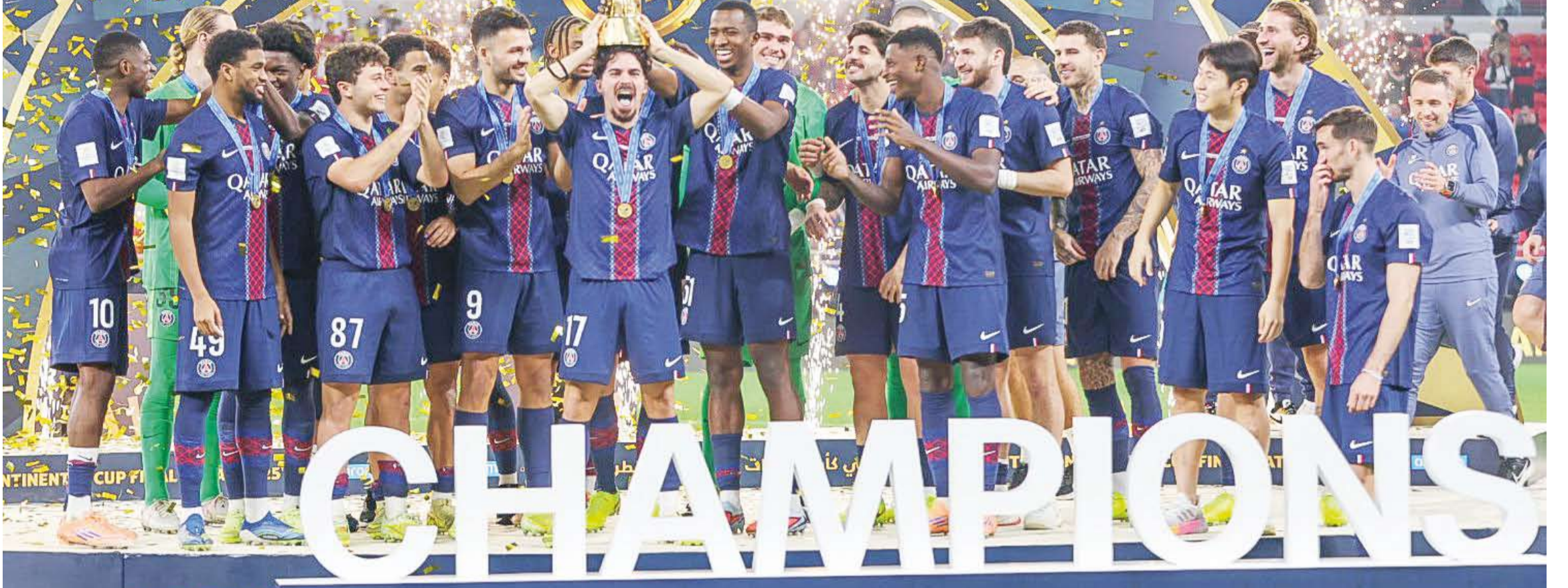
لاعب سان جيرمان خلال تتويجهم باللقب

أنهى فريق باريس سان جيرمان الفرنسي عامه الاستثنائي على أفضل وجه، بعدما توج بلقب كأس القارات للأندية (كأس إنتر كونتيننتال)، عقب فوزه 2-1 بركلات الترجيح، على فلانغو البرازيلي، في نهائي المسابقة العالمية، بالعاصمة القطرية الدوحة. وعلى ملعب «أحمد بن علي»، انتهى الوقتان الأصلي والإضافي بالتعادل 1-1، حيث بادر الجورجي خفيششا كفار لتسجيلها بالتسجيل لمصلحة سان جيرمان في الدقيقة 38، فيما تعادل الإيطالي جورجينيو فلانغو في الدقيقة 62 من ركلة جزاء. وعجز الفريقان عن هز الشباك خلال الوقت الإضافي، الذي بلغت