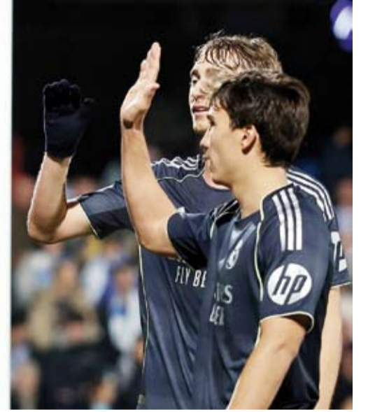
مبابي يحتفل بالهدف الأول