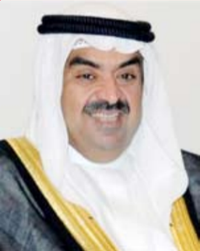
الشيخ خالد البدر الصباح

رفع رئيس الاتحادين الكويتي والأسبوي للألعاب المائية الشيخ خالد البدر الصباح باسمه ونيابة عن مجلس الإدارة وجميع منتسبي الألعاب المائية أسمى آيات التهاني والتبريكات إلى مقام حضرة صاحب السمو أمير البلاد المفدى الشيخ مشعل الأحمد الجابر الصباح حفظه الله ورعاه بمناسبة الذكرى الثامنة لتولي سموه مقاليد الحكم في البلاد.