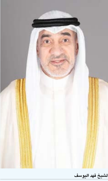
الشيخ فهد اليوسف

الكفاءة التشغيلية في كل قطاعاتها من خلال تحديث الإجراءات والارتقاء بالأداء وتبني الحلول التقنية الحديثة بما يسهم في دعم منتسبي الوزارة وتمكينهم من أداء مهامهم بكفاءة أعلى. وتقدم باسمي آيات الشكر والتقدير إلى جميع منتسبي وزارة الداخلية رجالاً ونساءً، مشيداً بدورهم في تعزيز الثقافة الأمنية وترسيخ قيم الالتزام بالقانون، مبيناً أن الوزارة ستواصل دعمهم والاعتراف بعبأتهم لما فيه خير الوطن وأمنه واستقراره.