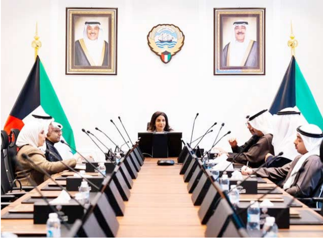
وزيرة الأشغال ترأست اجتماع اللجنة الوزارية لمتابعة المشاريع التنموية الكبرى

برعاية وحضور رئيس الوزراء وكبار المسؤولين في الشركة الصينية