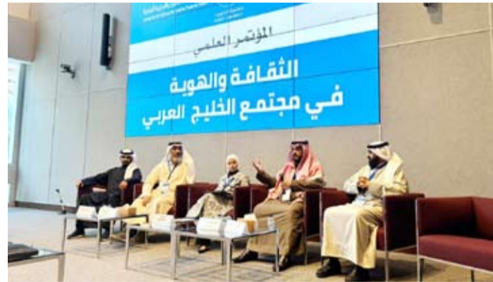
جانب من جلسات المؤتمر