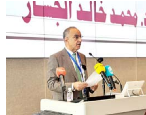
د. محمد الجسار متحدثاً

تحت رعاية الأمين العام للمجلس الوطني للثقافة والفنون والآداب، د. محمد الجسار، نظم مركز دراسات الخليج والجزيرة العربية بجامعة الكويت مؤتمراً علمياً بعنوان «الثقافة والهوية في مجتمع الخليج العربي»، بمشاركة نخبة من الأكاديميين والباحثين المتخصصين، وعقد المؤتمر على مدى يومين، 16 و 17 ديسمبر الجاري، في مدينة صباح المنهج الجامعية، في بيو المبنى المدرج الإداري، وبدأت فعالياته في تمام الساعة 9:00 صباحاً.