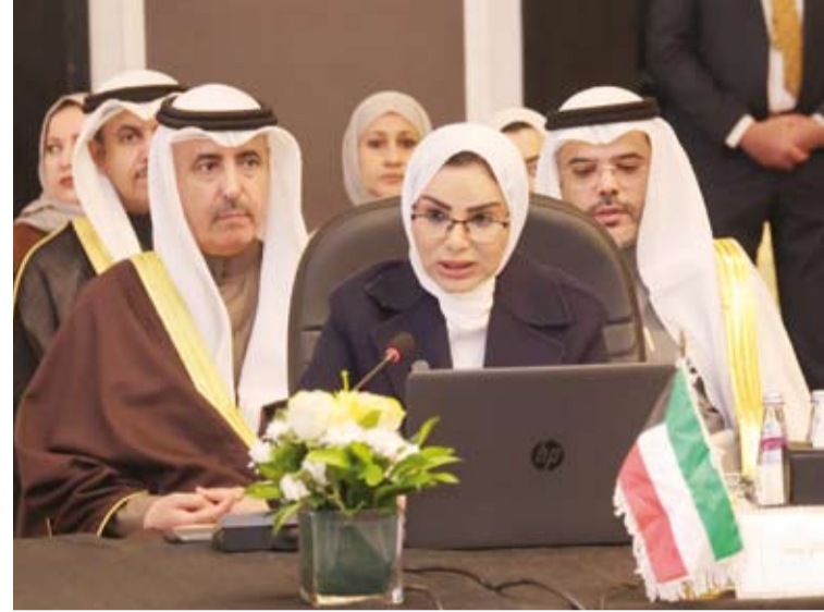
د. أمثال الحويطة خلال اللقاء كلمتها في اجتماع وزراء الشؤون العرب

أكدت وزيرة الشؤون الاجتماعية وشؤون الأسرة والطفولة د. أمثال الحويطة، أمس، أن دعم الأشقاء في فلسطين واجب عربي راسخ وليس التزاماً إنسانياً فحسب. جاء ذلك في كلمة للحويطة خلال اجتماع الدورة الـ 45 لمجلس وزراء الشؤون الاجتماعية العرب الذي انطلقت فعالياته بالعاصمة الأردنية عمان، أمس، بمشاركة عربية واسعة.