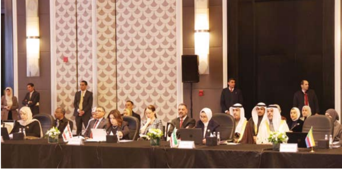
جانب من اجتماع مجلس وزراء الشؤون الاجتماعية العرب