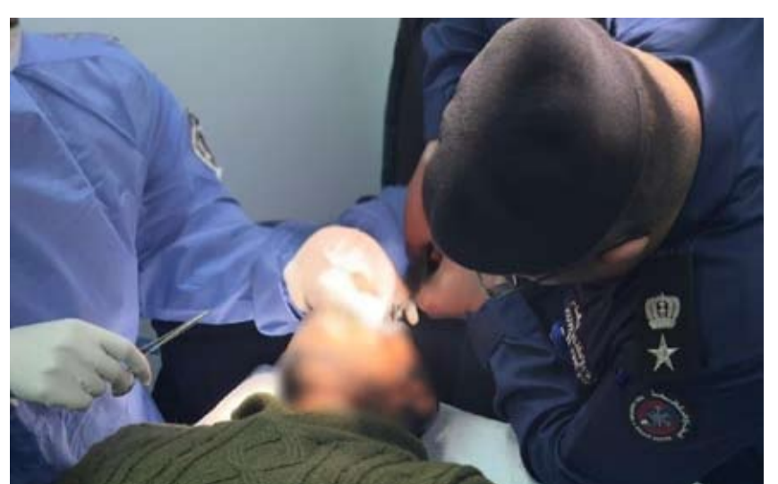
جانب من عملية الإنقاذ

نظمت قوة الإطفاء العام ممثلة بإدارة العلاقات العامة والإعلام بالتعاون مع وزارة الداخلية صباح أمس الخميس محاضرة توعوية في مبنى القوة، حيث تهدف المحاضرة إلى تثقيف وتوعية الموظفين عن قانون المخدرات والمؤثرات العقلية،