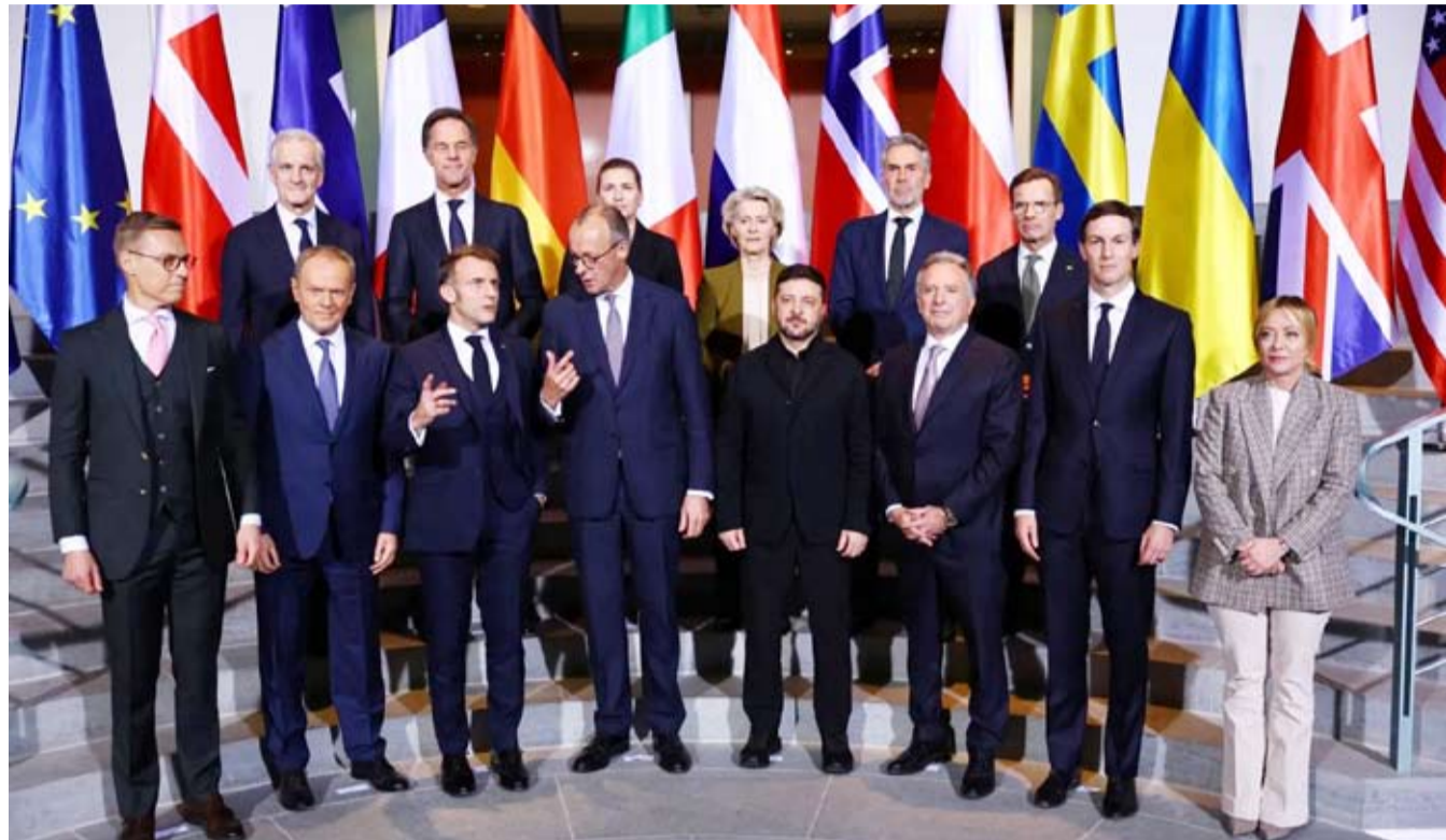
زيلينسكي محاطاً بقيادة أوروبيين ومفاوضين أميركيين

يجتمع مسؤولون أميركيون وروس في ميامي نهاية هذا الأسبوع لإجراء محادثات جديدة حول خطة الرئيس دونالد ترمب لإنهاء الحرب في أوكرانيا، وفق ما أفاد مسؤول في البيت الأبيض وكالة الصحافة الفرنسية.