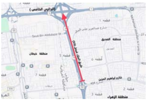
خريطة الطريق المغلق

أعلنت الإدارة العامة للمرور أنه سيتم إغلاق «كثف الطريق الأيمن والحارة اليمنى والحارة الوسطى» على طريق الملك فيصل «طريق 50»، من تقاطع شارع إبراهيم المزين حتى تقاطع الدائري الخامس، باتجاه مدينة الكويت، وذلك اعتباراً من مساء يوم غد الجمعة الموافق 19 ديسمبر، وحتى الانتهاء من أعمال صيانة الطريق. وأفادت الإدارة بأنه سيتم فتح الحارة اليسرى والحارة الوسطى السريعة أمام حركة المرور.