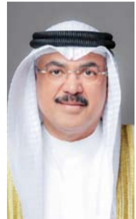
م. سيد جلال الغطيطاني

أصدر وزير التربية المهندس سيد جلال الغطيطاني، قراراً وزارياً يقضي باعتماد بطاقات الاختصاصات التفصيلية لهيكل التنظيمي الجديد لوزارة التربية، والمعروفة ببطاقات الوصف الوظيفي، وذلك استناداً إلى القرار الوزاري رقم (265) لسنة 2025 الصادر بتاريخ 23 يوليو 2025، والخاص بتعديل الهيكل التنظيمي للوزارة.