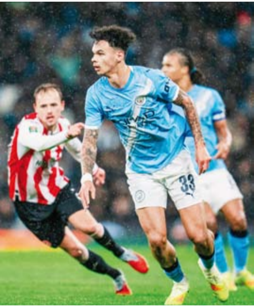
جانج من اللقاء

واصل مانشستر سيتي مسيرته في بطولة كأس رابطة الأندية الإنجليزية، بعدما تأهل للدور قبل النهائي في المباراة.