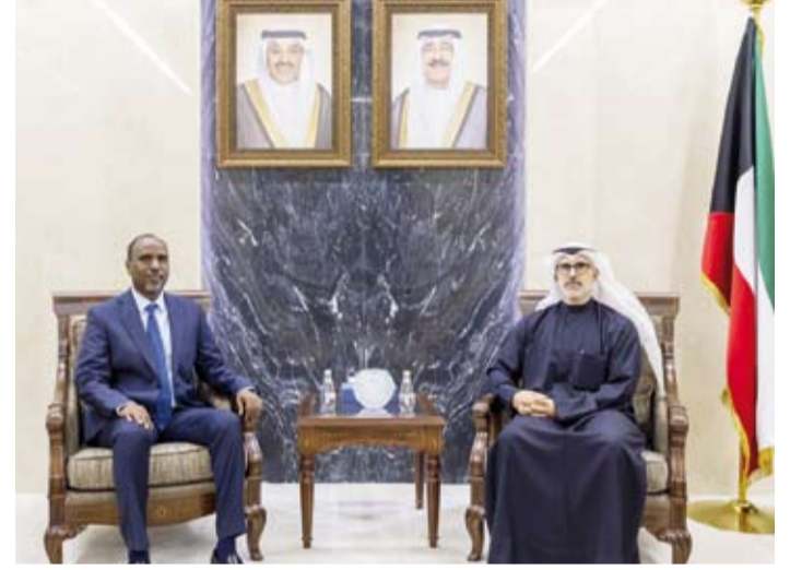
الشيخ جراح الجابر مع سفير جيبوتي عيسى خيرى روبله

حيث تم بحث العلاقات الثنائية وأبرز المواضيع على الساحتين الإقليمية والدولية.