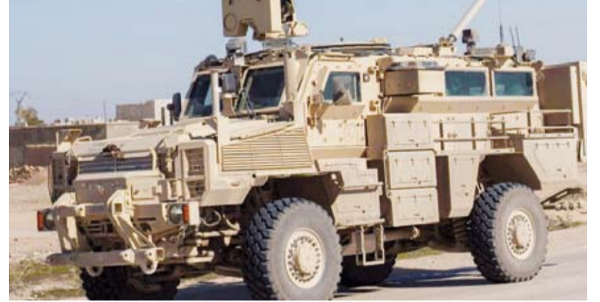
قافلة عسكرية أميركية في الحسكة

ونهاية شهر نوفمبر الماضي، أعلنت القيادة الأميركية تنفيذها عملية عسكرية مشتركة مع وزارة الداخلية السورية استهدفت أكثر من 15 مخزناً ومستودع أسلحة تابعاً لتنظيم الدولة في جنوب سوريا وريف دمشق. وقالت «سنكوم» إن القوات الأميركية شاركت مع وحدات من الداخلية السورية في الفترة بين 24 و 27 نوفمبر الماضي، في تدمير المخازن عبر ضربات جوية وعمليات ميدانية. يُشار إلى أن التحالف الدولي ضد تنظيم الدولة، الذي شارك فيه عشرات الدول منذ تأسيسه، نفذ خلال السنوات الماضية سلسلة واسعة من العمليات العسكرية ضد التنظيم في سوريا والعراق. في حين لم تكن الحكومة السورية طرفاً فيه قبل إعلان انضمامها الأخير.