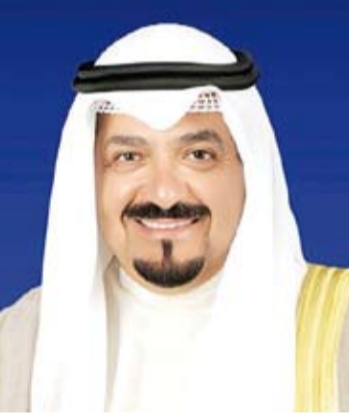
سمو الشيخ أحمد عبدالله

بعث سمو الشيخ أحمد عبدالله رئيس مجلس الوزراء، ببرقية تهنئة إلى صاحب السمو الشيخ تميم بن حمد آل ثاني أمير دولة قطر الشقيقة بمناسبة ذكرى اليوم الوطني لدولة قطر الشقيقة. كما بعث سمو الشيخ أحمد عبدالله رئيس مجلس الوزراء، ببرقية تهنئة إلى الجنرال عبدالرحمن تياتي - رئيس المجلس القومي لحماية الوطن - رئيس جمهورية النيجر الصديقة بمناسبة ذكرى يوم الجمهورية لبلادها.