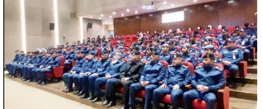
جانب من قوة الإطفاء