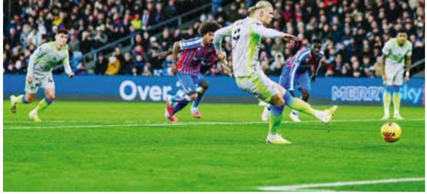
هالاند يحلق في صدارة الهدافين

وعاد هالاند لهز الشباك من جديد بعدما حول ركلة جزاء إلى داخل مرمي أصحاب الأرض قبل دقيقة من النهاية ليصل إلى هدفه السابع عشر في 16 مباراة من عمر المسابقة ويتصدر ترتيب الهدافين. وارتفع رصيده سيتي إلى 34 نقطة بفارق نقطتين عن المتصدر أرسنال، بينما بقي رصيده بالاس عند 26 نقطة في المركز الخامس.