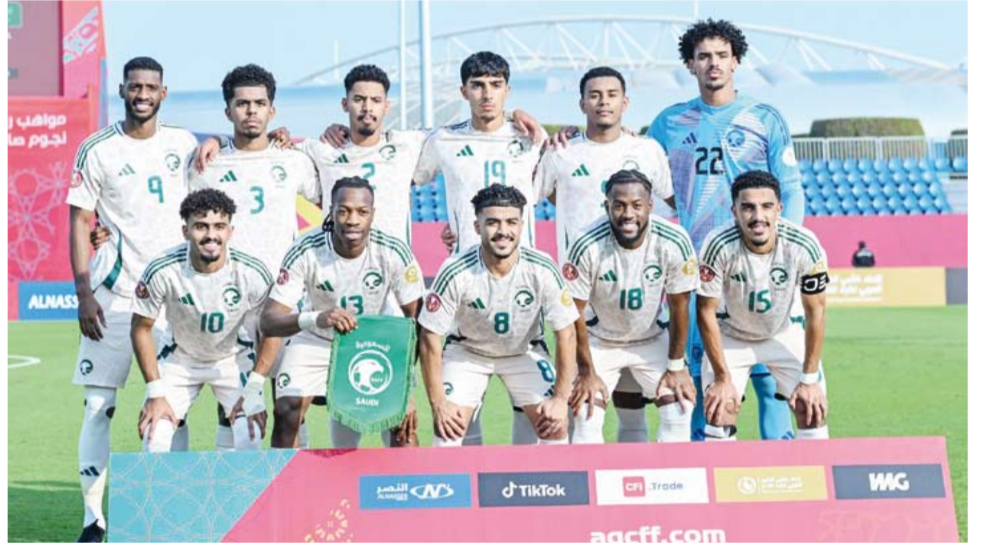
فريق الأخضر السعودي تحت 23 عاماً

والإمارات نجح المنتخب السعودي في تحقيق الفوز بنتيجة (2-0) ليتأهل لنهائي البطولة ويقابل المنتخب العراقي يوم الثلاثاء المقبل في المباراة النهائية التي ستقام على استاد (974). وشهدت البطولة مشاركة ثمانية منتخبات موزعة على مجموعتين تضم المجموعة الأولى منتخبات الكويت وقطر