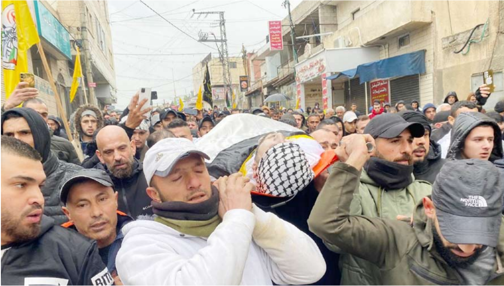
تشجيع أحد شهداء كتائب القسام

تحدثت مصادر في وسائل إعلام إسرائيلية عن استمرار ممانعة حكومة بنيامين نتانياهو في الانتقال إلى المرحلة الثانية من اتفاق وقف إطلاق النار في غزة رغم ضغوط أميركية، في حين أكدت حركة المقاومة الإسلامية (حماس) التزامها بالاتفاق. وقال مصدر أمني إسرائيلي لهيئة البث الرسمية إن تطبيق المرحلة الثانية «لا يزال بعيد المنال». وأشار إلى أنه لم توافق أي دولة في الوقت الحالي على الانضمام إلى قوة الاستقرار الدولية التي يفترض نشرها في غزة بحسب الاتفاق. وأضاف المصدر نفسه أن إسرائيل تواصل متابعة التطورات المتعلقة بالبحث عن جثة الأسير ران غولي، وهي آخر جثة تطالب إسرائيل باستعادتها من غزة. وفي السياق، قال موقع «والا» إن إسرائيل تواصل مقاومة ضغوط أميركية للتقدم السريع إلى المرحلة الثانية من اتفاق وقف إطلاق النار، إلى حين استعادة جثة غولي من جانبها، وقال رئيس الوزراء الإسرائيلي بنيامين نتانياهو، في تصريحات أدلى بها إن نهاية المرحلة الأولى من الاتفاق تقترب، لكنه أضاف