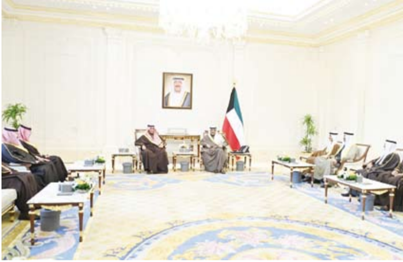
سمو ولي العهد يستقبل الأمير تركي بن محمد

استقبل سمو ولي العهد الشيخ صباح الخالد، بقصر بيان، صباح أمس، صاحب السمو الملكي الأمير تركي بن محمد وزير الدولة عضو مجلس الوزراء بالملكة العربية السعودية الشقيقة والوفد المرافق، وذلك بمناسبة زيارته الرسمية للبلاد. حيث نقل لسموه تحيات أخيه خادم الحرمين الشريفين الملك سلمان بن عبدالعزيز ملك المملكة العربية السعودية الشقيقة وأخيه صاحب السمو الملكي الأمير محمد بن سلمان ولي العهد رئيس مجلس الوزراء بالملكة العربية السعودية الشقيقة وتمنياتها لسموه بموفور الصحة ودوام العافية ولشعب دولة الكويت المزيد من التقدم والرفي.