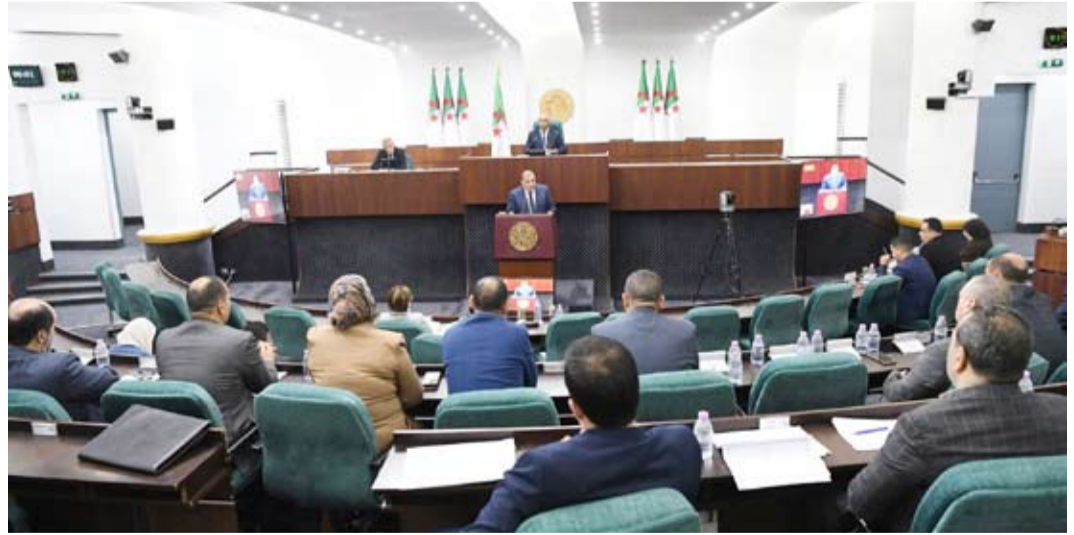
المقترح سيعرض للتصويت في 24 ديسمبر

الجزري، موضحاً أنها ستضمن مناقشة مقترح قانون يتضمن تجريم الاستعمار الفرنسي للجزائر، وتشمل تقديم المقترح والتقرير التمهيدي، إلى جانب تدخلات رؤساء المجموعات البرلمانية. وقال بوغالي، إن «هذه الخطوة تأتي تجاوباً مع إجماع كل التيارات السياسية حول هذا الموضوع، تكريماً لذاكرة أسلافنا الليبيين من جيل المقاومة إلى جيل ثورة التحرير الجديدة». وجرى تكين اللجنة من مستلزمات العمل للقيام بمهمتها، بما في