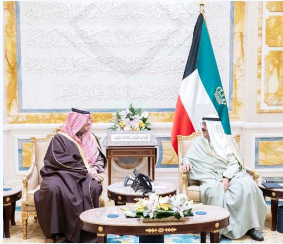
صاحب السمو الأمير مستقبلاً وزير الدولة السعودي أمس

استقبل صاحب السمو أمير البلاد الشيخ مشعل الأحمد بقرع بيان صباح أمس صاحب السمو الملكي الأمير تركي بن محمد وزير الدولة عضو مجلس الوزراء بالمملكة العربية السعودية الشقيقة والوفد المرافق وذلك بمناسبة زيارته الرسمية للبلاد.