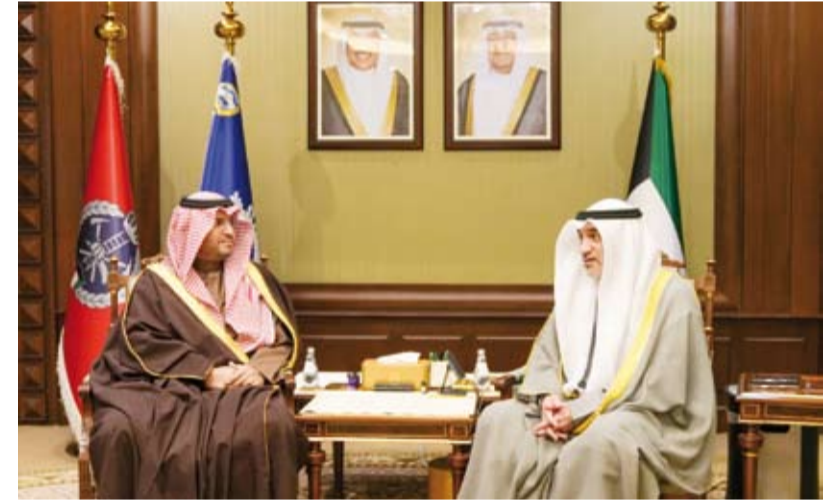
الشيخ فهد الجبير يستقبل الأمير تركي بن محمد بن فهد

استقبل رئيس مجلس الوزراء بالإنباء وزير الداخلية الشيخ فهد الجبير، في قصر بيان، أمس، صاحب السمو الملكي الأمير تركي بن محمد وزير الدولة عضو مجلس الوزراء في المملكة العربية السعودية الشقيقة والوفد المرافق له، بمناسبة زيارته للبلاد، وذلك بحضور وزير الدفاع رئيس بعثة الشرف المرافقة الشيخ عبدالله العلي.