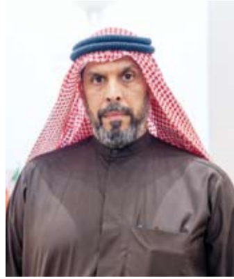
المستشار هيثم الرويشد