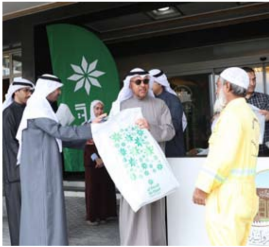
جانب من فعالية توزيع كسوة الشتاء

استمراراً للمبادرات والفعاليات الإنسانية التي تعكس التزام البنك التجاري الكويتي بمسؤوليته الاجتماعية وحرصه على دعم الفئات الجديرة بالرعاية قام البنك بالتعاون مع محافظة الفروانية بتوزيع كسوة الشتاء على عمال النظافة في مبنى المحافظة وقد جاءت هذه المبادرة تحت رعاية معالي محافظ الفروانية الشيخ عدي ناصر العدي الصباح، وبالتزامن مع دخول فصل الشتاء، حيث دأب البنك على تنظيم مثل هذه الفعاليات ضمن البرنامج الاجتماعي الذي أطلقه منذ عدة سنوات لرعاية الفعاليات الإنسانية والاجتماعية والثقافية والتربوية التي تنظمها محافظات الكويت ومؤسسات المجتمع المدني القائمة على خدمة الوطن والمواطن.