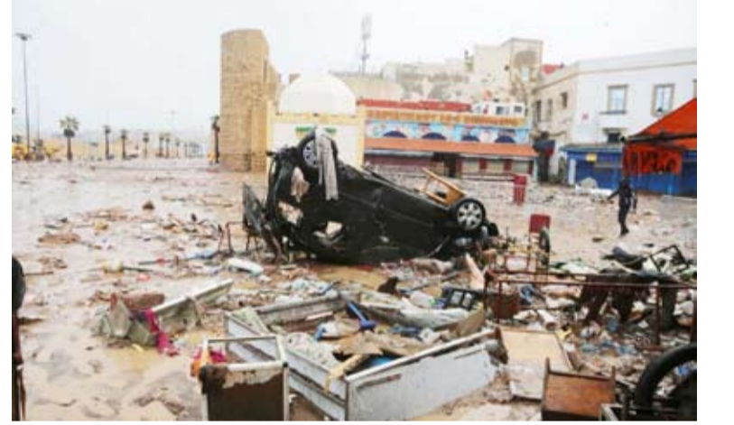
إقليم أسفي تعرض إلى فيضانات وسيول غير مسبوقة

أعلنت السلطات القضائية المغربية أمس أن النيابة العامة فتحت تحقيقاً بشأن وفاة 37 شخصاً جراء السيول والفيضانات المفاجئة التي شهدتها إقليم "سفي" مساء أمس الأول. وذكر الوكيل العام للملك لدى محكمة الاستئناف بإقليم أسفي في بيان أن النيابة العامة أمرت بفتح تحقيق تحت إشرافها بواسطة الشرطة القضائية للوقوف على الأسباب الحقيقية والكشف عن الظروف والملايسات التي أفضت إلى وقوع ضحايا مشيراً إلى أن الحصيلة تبقى مؤقتة في انتظار استكمال عمليات البحث والإنقاذ.