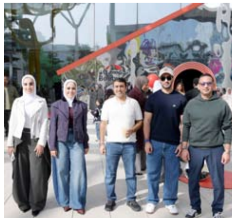
الحجج يتوسط فريق العلاقات المؤسسية في البنك

أعلن بنك بوبيان عن رعايته الرئيسية ومشاركته في الموسم الجديد من «قوت ماركت»، الذي انطلقت فعالياته السبت الماضي في مركز الشيخ عبدالله السالم الثقافي، بمشاركة واسعة من المبادرين ورواد الأعمال في العديد من المجالات والصناعات الغذائية، والمزارع، والحرف اليدوية. وتأتي رعاية بنك بوبيان الرئيسية لـ «قوت ماركت» في إطار حرصه على تعزيز حضوره في أبرز الفعاليات الداعمة لرواد الأعمال، لاسيما من فئة الشباب الكويتي، وإشراكهم في دفع عجلة التنمية الاقتصادية، إلى جانب التواصل المباشر مع مختلف شرائح المجتمع، بما يعكس دوره الريادي في دعم نمو قطاع المشاريع الناشئة والشركات الصغيرة والمتوسطة في دولة الكويت. ويعد «قوت ماركت» إحدى الفعاليات المدرجة ضمن رزمة الفعاليات السياحية في دولة الكويت، وتؤكد مشاركة بنك بوبيان للعام الثاني على التوالي التزامه بدعم المشهد السياحي الداخلي، والمساهمة في تشجيع النمو الاقتصادي المرتبط بالفعاليات النوعية التي تستقطب الجمهور وتدعم المبادرات الوطنية.