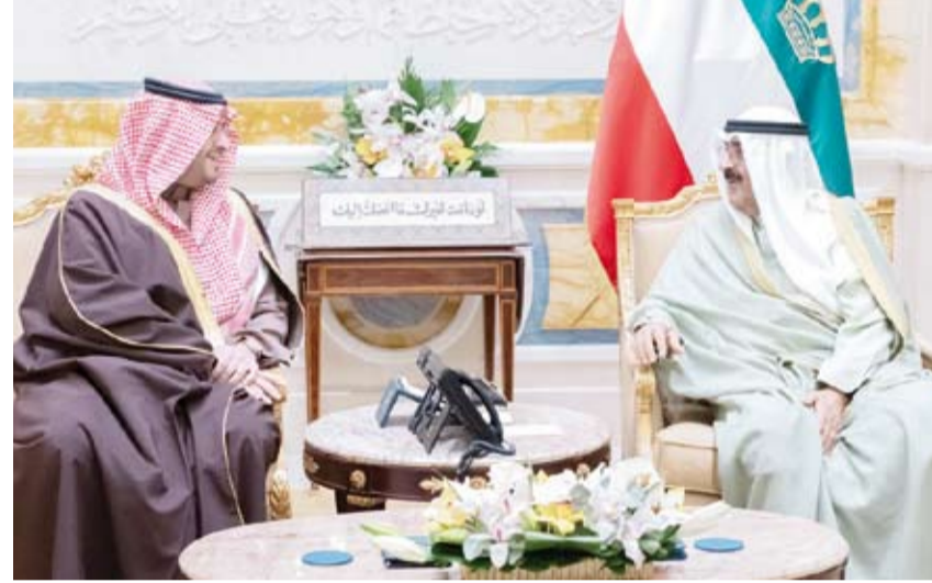
سمو أمير البلاد يستقبل الأمير تركي بن محمد

استقبل صاحب السمو أمير البلاد الشيخ مشعل الأحمد، بقصر بيان، صباح أمس، صاحب السمو الملكي الأمير تركي بن محمد وزير الدولة عضو مجلس الوزراء بالملكة العربية السعودية الشقيقة والوفد المرافق، وذلك بمناسبة زيارته الرسمية للبلاد. حيث نقل تحيات وتقدير أخيه خادم الحرمين الشريفين الملك سلمان بن عبدالعزيز ملك المملكة العربية السعودية الشقيقة وأخيه صاحب السمو الملكي الأمير محمد بن سلمان ولي العهد رئيس مجلس الوزراء وتمنياتها لسموه بوافر الصحة وتم العافية ولشعب دولة الكويت المزيد من التقدم والرفي.