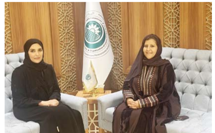
الشيخة جواهر الصباح مع مريم العطية

بحثت مساعدة وزير الخارجية لشؤون حقوق الإنسان السفيرة الشيخة جواهر الصباح، أمس، مع رئيس اللجنة الوطنية لحقوق الإنسان في دولة قطر عضو الهيئة الدائمة المستقلة لحقوق الإنسان لمنظمة التعاون الإسلامي مريم العطية سبل التعاون المشترك بين الجانبين بمجال حقوق الإنسان.