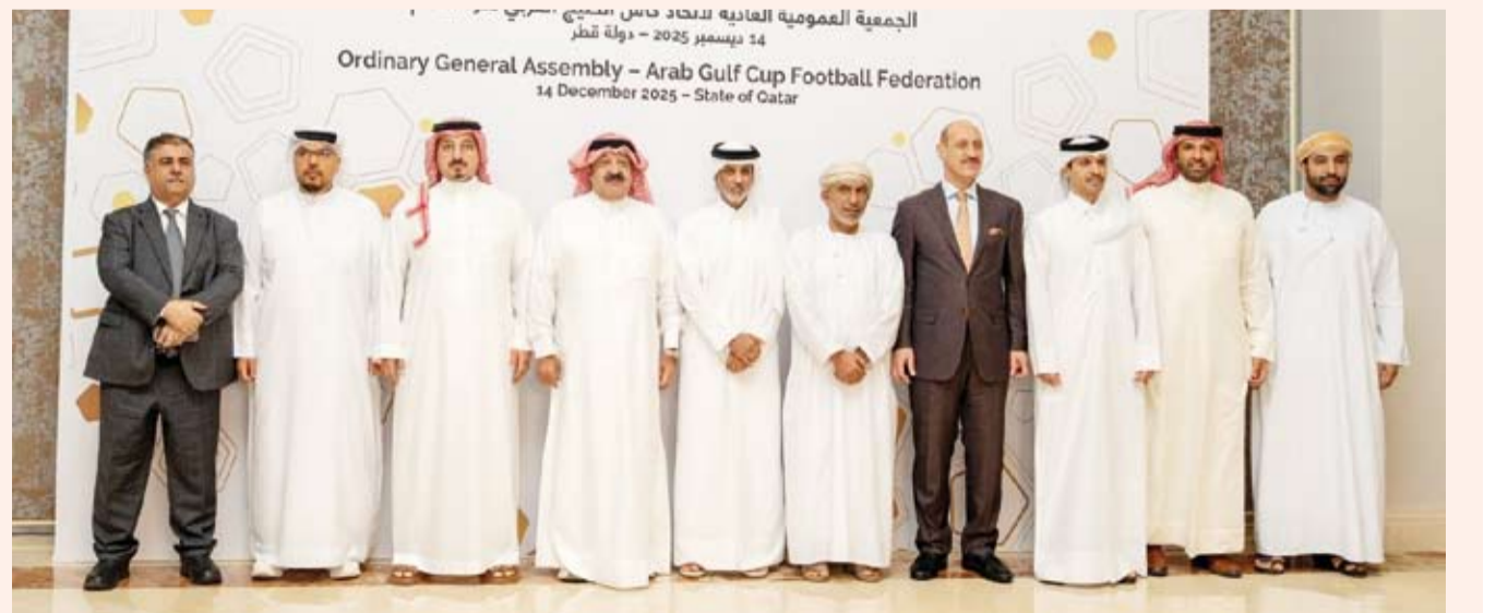
جانب من اجتماع الجمعية العمومية العادية

وشدد المكتب التنفيذي للاتحاد على ضرورة بذل المزيد من الجهود لمواصلة النجاحات التي عرفتتها كرة القدم الخليجية وكذلك تطوير البطولات المدرجة ضمن أجندة الاتحاد خاصة على الصعيد العمرية. وأشاد الاتحاد باستضافة دولة قطر الناجحة لبطولتي كأس الخليج تحت 17 و23 عاماً مبيناً أن التنظيم كان مميزاً للغاية وترك انطباعات إيجابية لدى جميع المنتخبين. ومن المقرر أن تقوم اللجنة التقديرية في الاتحاد بعدة زيارات إلى السعودية في المرحلة المقبلة كما جرت العادة لمتابعة التحضيرات والوقوف على جاهزية الدولة المستضيفة للبطولة المقبلة وكذلك متابعة جاهزية الدولة البديلة.