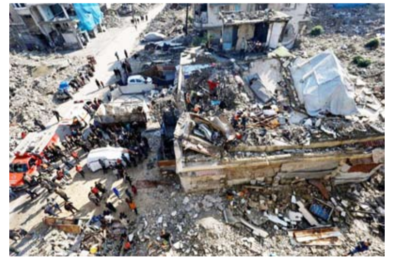
مجزرة حي التفاح طالت مدرسة تؤولي النازحين