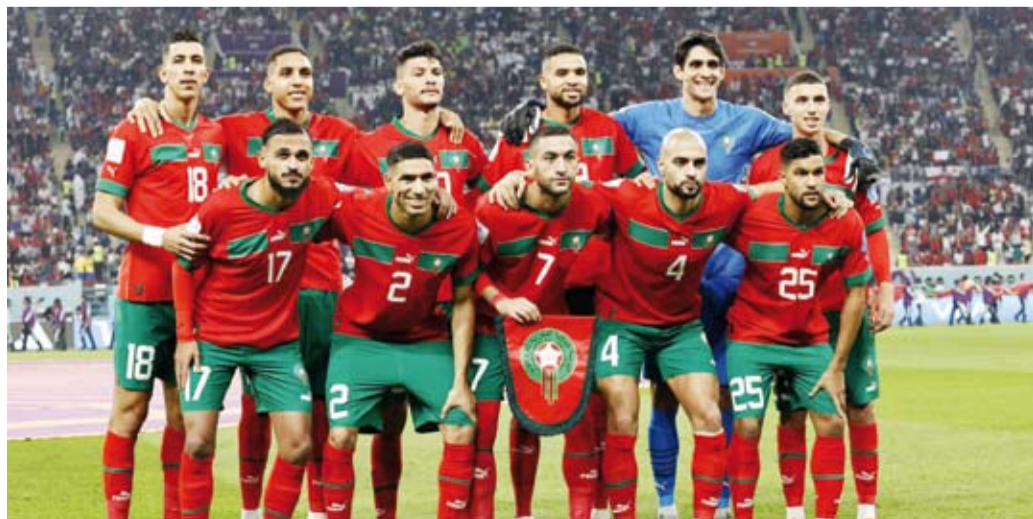
مهمة سهلة لأسود الأطلس في مباراة الافتتاح

استهل المنتخب المغربي مشواره في كأس أمم أفريقيا لكرة القدم على أرضه، بمواجهة نظيره منتخب جزر القمر في المباراة الافتتاحية للبطولة اليوم الأحد. وتعد هذه المواجهة الثانية بين المنتخبين في تاريخ النهائيات القارية، حيث يدخل «أسود الأطلس» اللقاء وهم في المركز الـ11 عالمياً، بوصفه أعلى منتخب أفريقي تصنيفاً، بينما يحتل منتخب جزر القمر المركز الـ108.