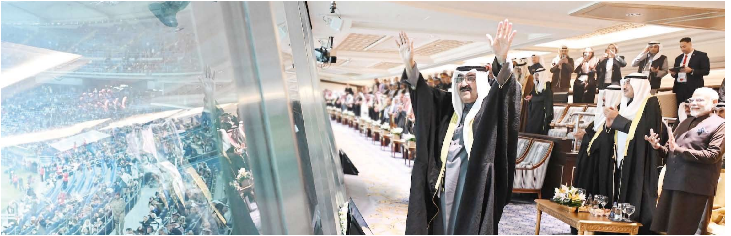
سمو أمير البلاد يشعل برعايته وحضوره حفل افتتاح بطولة «خليجي زين 26»

الكويت تواصل مسيرتها في ظل قيادة صاحب السمو نحو تحقيق رؤيتها التنموية «كويت جديدة 2035»