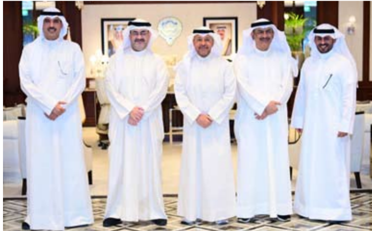
صورة جماعية للمحافظين

وأضاف أن دولة الكويت شهدت في عهد حضرة صاحب سمو أمير البلاد مرحلة مفضلية اتسمت بترسيخ سيادة القانون وتعزيز هيبة الدولة ومكانة مؤسساتها ورفع كفاءة الأداء الحكومي ودعم مسارات التنمية الشاملة وتحسين جودة الخدمات بما يعكس نهجاً قيادياً يوازن بين متطلبات الحاضر واستحقاقات المستقبل ويلبي تطلمات الشعب الكويتي. من جانبه رفع محافظ مبارك الكبير ومحافظ حولي بالتكليف الشيخ صباح بدر صباح السالم الصباح أسمى آيات التهاني والتبريكات وأصدقها لمقام سمو أمير البلاد مستحضرًا إيجابيات ما قام به سموه من حكمة ورؤية واضحة وما تحققت بالفترة الماضية من إصلاحات شاملة هدفت إلى تعزيز مسيرة الكويت ودعم الاستدامة الاقتصادية وتأكيد قيم الإنتماء والولاء للوطن وهي قيم راسخة حرص سموه على إحيائها وترسيخها بنفوس الجميع كما أسهمت بمبادرات سموه بدفع عجلة التنمية في مختلف القطاعات بما يلبي تطلمات المواطنين نحو مستقبل أكثر ازدهار ونماء.