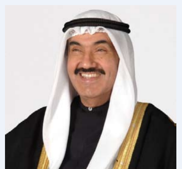
الشيخ ناصر المحمد

تلقى صاحب سمو أمير البلاد الشيخ مشعل الأحمد، رسالة تهنئة من أخيه سمو الشيخ ناصر المحمد، بمناسبة مرور عامين على تولي صاحب سمو أمير البلاد مقاليد الحكم. وقد بعث صاحب سمو أمير البلاد الشيخ مشعل الأحمد، رسالة شكر جارية إلى أخيه سمو الشيخ ناصر المحمد، ضمنها سموه، خالص شكره وتقديره على ما أعرب عنه سموه من مشاعر طيبة وتمنيات ودعوات صادقة بهذه المناسبة، مبهلاً سموه إلى الباري جلا وعلا أن يوفق الجميع لكل ما فيه خير وخدمة الوطن العزيز ورفع شأنه ويسد الخلل لتحقيق كل ما ينشده من رقي ونمو وأزدهار وأن يديم على سموه موفور الصحة والعافية.