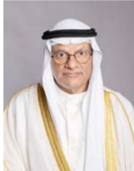
الدكتور نادر الجلال

رفع وزير التعليم العالي والبحث العلمي الدكتور نادر الجلال باسمه وباسم جميع منتسبي الوزارة وكافة الطلبة الدارسين في مؤسسات التعليم العالي داخل وخارج البلاد امس أسمى آيات التهاني والتبريكات إلى مقام سمو أمير البلاد الشيخ مشعل الأحمد بمناسبة الذكرى الثانية لتولي سموه مقاليد الحكم. وقال الوزير الجلال إن ما تحققت خلال مسيرة العامين الماضيين من إنجازات راسخة كانت شاهداً على رؤية سموه الواضحة في ترسيخ قواعد العمل المؤسسي ودعم مسارات النهضة والإصلاح وتعزيز التنمية الشاملة وتكريس مبادئ العدل