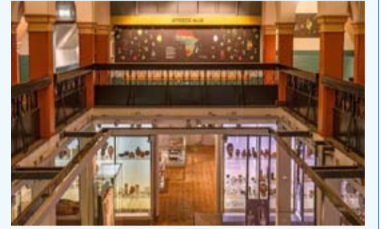
المعرض يضم آلاف القطع الأثرية