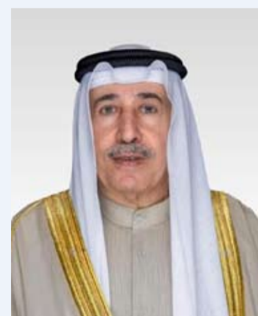
الشيخ مبارك الحمود

رفع رئيس الحرس الوطني الشيخ مبارك الحمود، أمس، إلى صاحب سمو أمير البلاد الشيخ مشعل الأحمد أمير البلاد، القائد الأعلى للقوات المسلحة، أسمى آيات التهاني والتبريكات بمناسبة الذكرى الثانية لتولي سموه مقاليد الحكم. وقال الشيخ مبارك الحمود في بيان صادر عن الحرس الوطني: إننا نعتد هذه