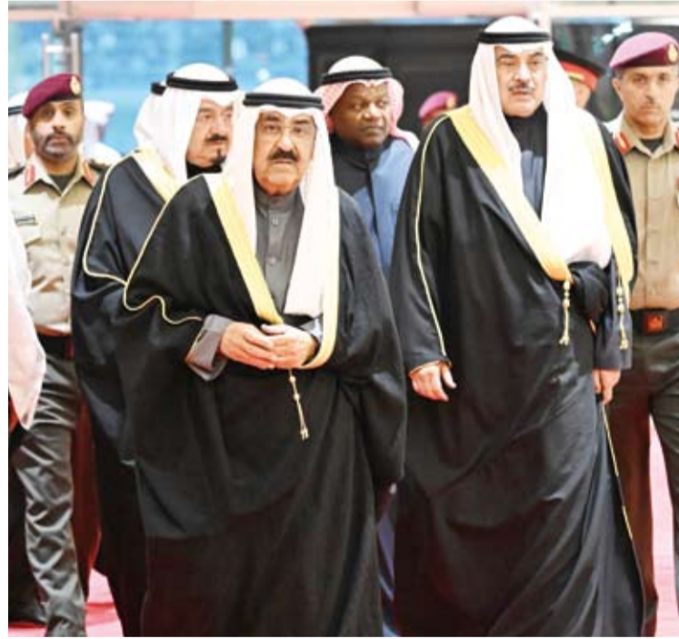
سمو أمير البلاد وسمو ولي العهد خلال حضور حفل افتتاح خليجي زين 26

وشهد عام 2025، إنجازات مهمة في مجال الصحة منها إجراء جراحات روبوتية نادرة