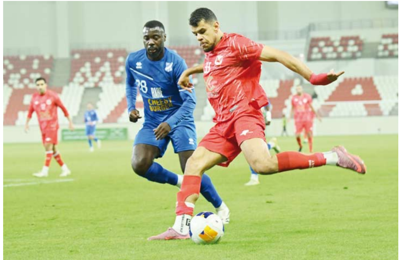
الفحجيل يبرق رصيدة إلى 13 نقطة