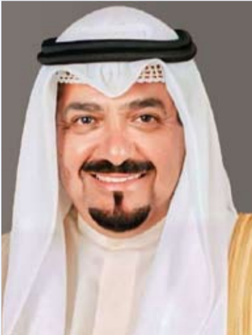
سمو الشيخ أحمد العبدالله

تلقى صاحب سمو أمير البلاد الشيخ مشعل الأحمد، رسالة تهنئة من سمو الشيخ أحمد العبدالله رئيس مجلس الوزراء، بمناسبة مرور عامين على تولي صاحب سمو أمير البلاد مقاليد الحكم. وقد بعث صاحب سمو أمير البلاد الشيخ مشعل الأحمد، رسالة شكر جارية إلى سمو الشيخ أحمد العبدالله رئيس