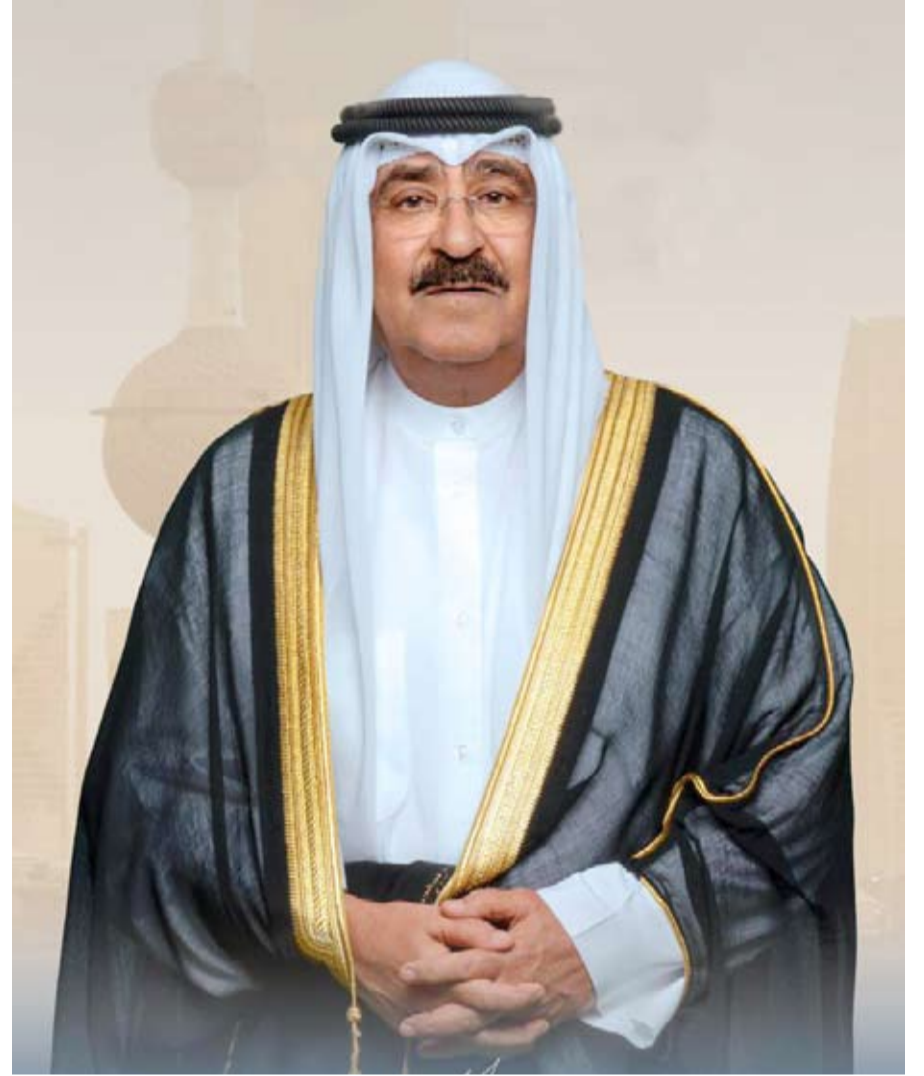
صاحب السمو أمير البلاد الشيخ مشعل الأحمد الجابر الصباح

«الشار»: البورصة من «المضاربة» الضارة، إلى «السيولة العاقلة»