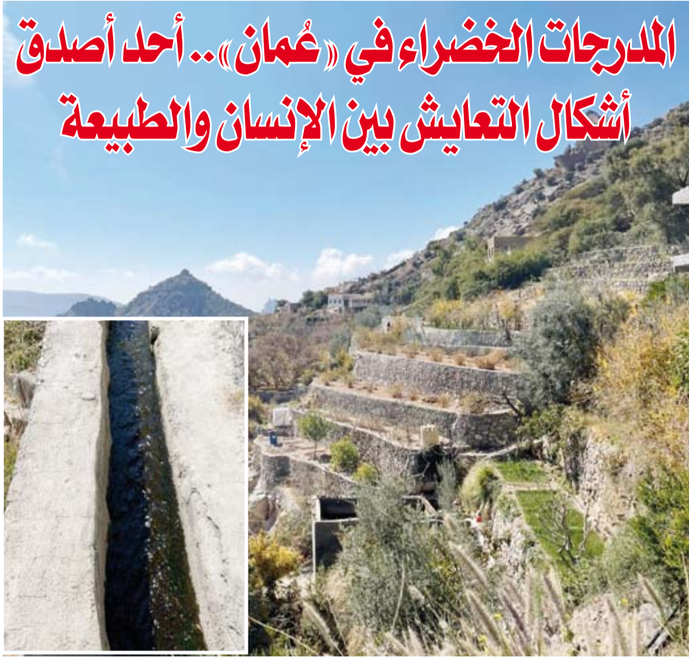
المرجحات الزراعية على سفوح الجبل الأخضر وفي الكادر صورة لمجرى مائي للري وتوزيع المياه

والعمل الجماعي داخل القرى الجبلية. وتحفظ هذه المدرجات - حتى اليوم - بدورها البيئي والزراعي إلى جانب حضورها السياحي، حيث أصبحت لوحة تعكس الأصالة العمانية وتجذب الزائر الباحث عن تجربة تتجاوز الصورة إلى الفهم، فهي شاهد حي على قدرة الإنسان على التلويح من دون إخلال، وعلى أن الحداثة يمكن أن تمر من المكان دون أن تحوّل ذاكرته التي تعد أحد أبرز ملامح الهوية العمانية المستمرة عبر الزمن. ترتسم المدرجات الزراعية، على امتداد سفوح جبال ولاية (الجبل الأخضر) التابعة لمحافظة "الداخلية" العمانية على بعد حوالي 150 كيلومتراً من العاصمة "مسقط" بوصفها أحد أصدق أشكال التعايش بين الإنسان والطبيعة. إذ اعتمد العمانيون على المدرجات لمواجهة عورة التضاريس وندرّة المياه، فحولوا الانحدارات الحادة إلى مساحات خصبة تروى عبر شبكة الأفلاج وتنتج محاصيل موسمية وأشجاراً مثمرة أسهمت في تحقيق الاكتفاء المحلي ورسخت قيم التعاون