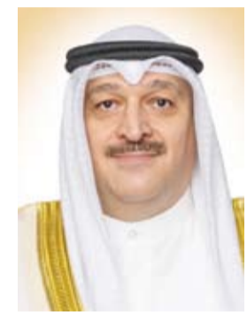
الدكتور أحمد العوضي

رفع وزير الصحة الدكتور أحمد العوضي أسمى آيات التهنية والتبريكات إلى مقام أمير البلاد الشيخ مشعل الأحمد بمناسبة مرور عامين على تولي سموه مقاليد الحكم معرباً عن بالغ الفخر والاعتزاز بما تحققت للكويت من إنجازات خلال العهد الميمون. وقال الوزير العوضي امس إن هذه المناسبة الوطنية تمثل صفحة مضيئة تصاف إلى سجل الكويت الحافل بالإنجازات وعنوانها الأمل وقوامها الطموح وغايتها رفعة الوطن وإزدهاره. وأضاف أن الكويت شهدت في ظل القيادة الحكيمة لسموه بشائر الخير والنهوض في شتى المجالات بما يجسد حكمة سموه وبصيرته السديدة في