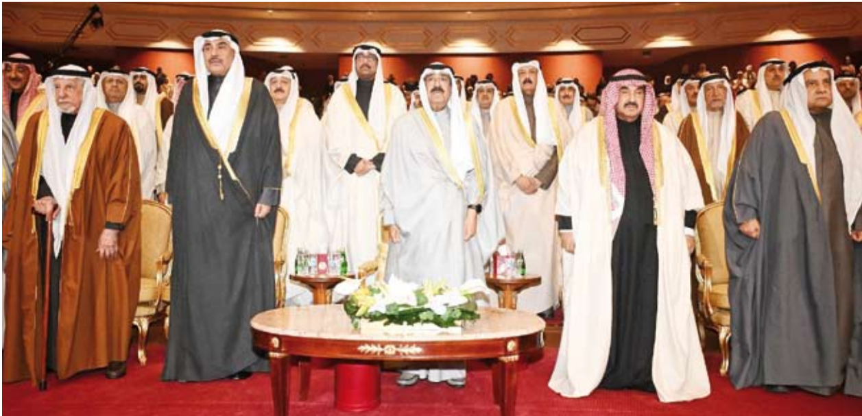
صاحب السمو أمير البلاد وسمو ولي العهد وكبار المسؤولين بالدولة خلال حفل الأوبريت الوطني «السور الخامس»

ويعد سموه أحد رجالات الكويت البررة الذين نشأوا في ظل عائلة آل صباح الكرام وتربوا على يد حكمائها ونهلوا من معين قاداتها وتعلموا الحكمة والإدارة من رجالاتها وخبروا شؤون الحكم وأساليب القيادة من سياسيينها، وقد عرف عن سموه الحكمة والإخلاص والتفاني في كل ما فيه رفعة الكويت وأمنها واستقرارها. وسمو أمير البلاد هو الابن السابع لحاكم الكويت المغفور له (بإذن الله) الشيخ أحمد