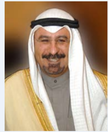
سمو الشيخ د. محمد الصباح

تلقى صاحب سمو أمير البلاد الشيخ مشعل الأحمد، رسالة تهنئة من سمو الشيخ د. محمد الصباح، بمناسبة مرور عامين على تولي صاحب سمو أمير البلاد مقاليد الحكم.