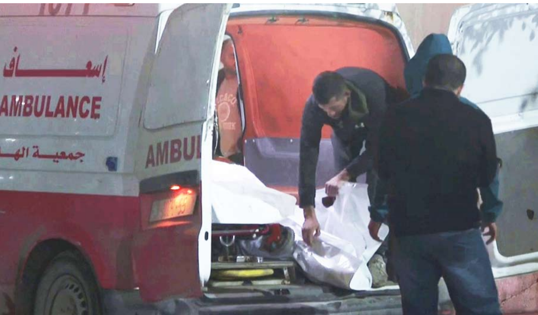
طواقم الإسعاف عند موقع القصف

قال وزير الخارجية الأميركي ماركو روييو إن العمل على تنفيذ المرحلتين الثانية والثالثة من اتفاق غزة سيستغرق فترة طويلة تتجاوز 3 سنوات، في حين سيعقد المبعوثان الأميركيان اجتماعاً آخر مع مسؤولين من قطر ومصر وتركيا بشأن غزة.