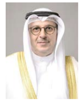
الدكتور صبيح المخيزيم

رفع وزير الكهرباء والماء والطاقة المتجددة ووزير المالية ووزير الدولة للشؤون الاقتصادية والاستثمار بالوكالة الدكتور صبيح المخيزيم أسمى آيات التهاني إلى مقام سمو أمير البلاد الشيخ مشعل الأحمد بمناسبة الذكرى الثانية لتولي سموه مقاليد الحكم. وأعرب المخيزيم عن بالغ اعتزازه بمسيرة الخير والنماء التي تشهدها دولة الكويت في ظل القيادة الحكيمة لسموه مثمناً الجهود المخلصة والعطاءات الدؤوبة التي يبذلها سموه في خدمة أبناء الكويت الأوفياء ورعاية مصالحهم بما