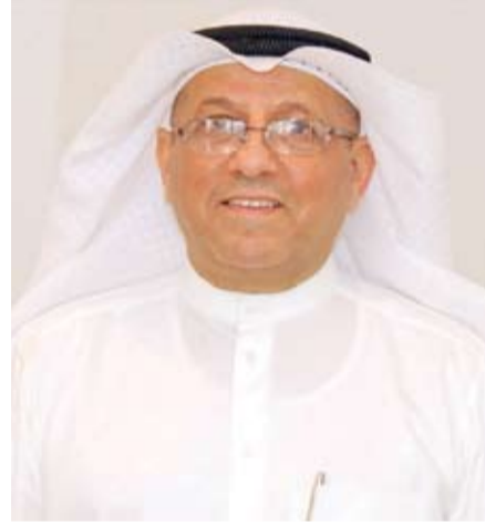
المستشار الدكتور عادل بورسلي

بعث رئيس المجلس الأعلى للقضاء رئيس محكمة التمييز المستشار الدكتور عادل بورسلي وأعضاء المجلس الأعلى للقضاء، وكافة أعضاء السلطة القضائية ببرقية تهنئة إلى صاحب سمو أمير البلاد الشيخ مشعل الأحمد، بمناسبة الذكرى الثانية لتولي سموه مقاليد الحكم في البلاد. وأكد رئيس وأعضاء المجلس الأعلى للقضاء وكافة أعضاء السلطة القضائية في البرقية أن الحكم الرشيد لسموه والقيادة الحكيمة للمسيرة المباركة وموصول العزة والمنعة والرخاء وضعت دولة الكويت الغالية على درب التنمية الشاملة.