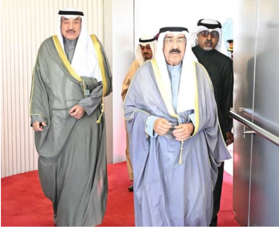
سمو أمير البلاد الشيخ مشعل الأحمد و سمو ولي العهد الشيخ صباح الخالد

بفضل من الله تعالى، ثم بعزم سموكم الراحلين وتوجيهاتكم السديدة: حيث يمضي وطننا الكريم بعقول وسواعد أبنائه المخلصين خلف قيادتكم الحكيمة نحو حاضر مشرق ومستقبل مزدهر. وأعتمد هذه المناسبة لأجدد لسموكم العهد بالسمع والطاعة والولاء، وبمواصلة العمل الجاد لتحقيق نهضة شاملة وتنمية مستدامة، يتمتع فيها شعبنا الوفي بالأمن والاستقرار. وقد بعث صاحب سمو أمير البلاد الشيخ مشعل الأحمد، رسالة شكر جارية إلى أخيه سمو ولي العهد الشيخ صباح الخالد جاء فيها: تلقينا ببالغ التقدير رسالة سموكم الكريمة المنضممة تهنئتمكم بمناسبة مرور عامين على تولينا سدة الإمارة ومشاعر طيبة ودعوات صادقة عكست إخلاصكم