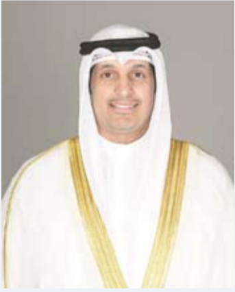
عبد الرحمن المطيري

قال وزير الإعلام والثقافة ووزير الدولة لشؤون الشباب عبد الرحمن المطيري: إن ذكرى تولي صاحب سمو أمير البلاد الشيخ مشعل الأحمد، مقاليد الحكم تمثل محطة وطنية غالية على قلوب أبناء الكويت نستحضر فيها معاني الوفاء والولاء.