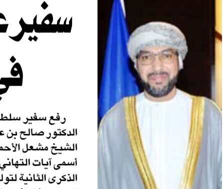
الدكتور صالح بن عامر الخروصي

رفع سفير سلطنة عمان لدى دولة الكويت الدكتور صالح بن عامر الخروصي إلى مقام سمو الشيخ مشعل الأحمد أمير دولة الكويت الشقيقة أسمى آيات التهاني والتبريكات بمناسبة حلول الذكرى الثانية لتولي سموه سدة الإمارة ومقاليد الحكم. وأضاف الخروصي: إن نعيم عن خالص تهنئتنا بهذه المناسبة الطيبة... فإننا نشيد بما