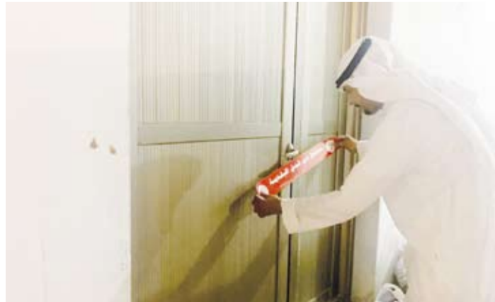
إغلاق أحد السرايب