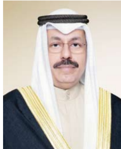
سمو الشيخ أحمد النواف

الغزيرة التي هطلت على مقاطعة تشينغهاي غربي الصين.