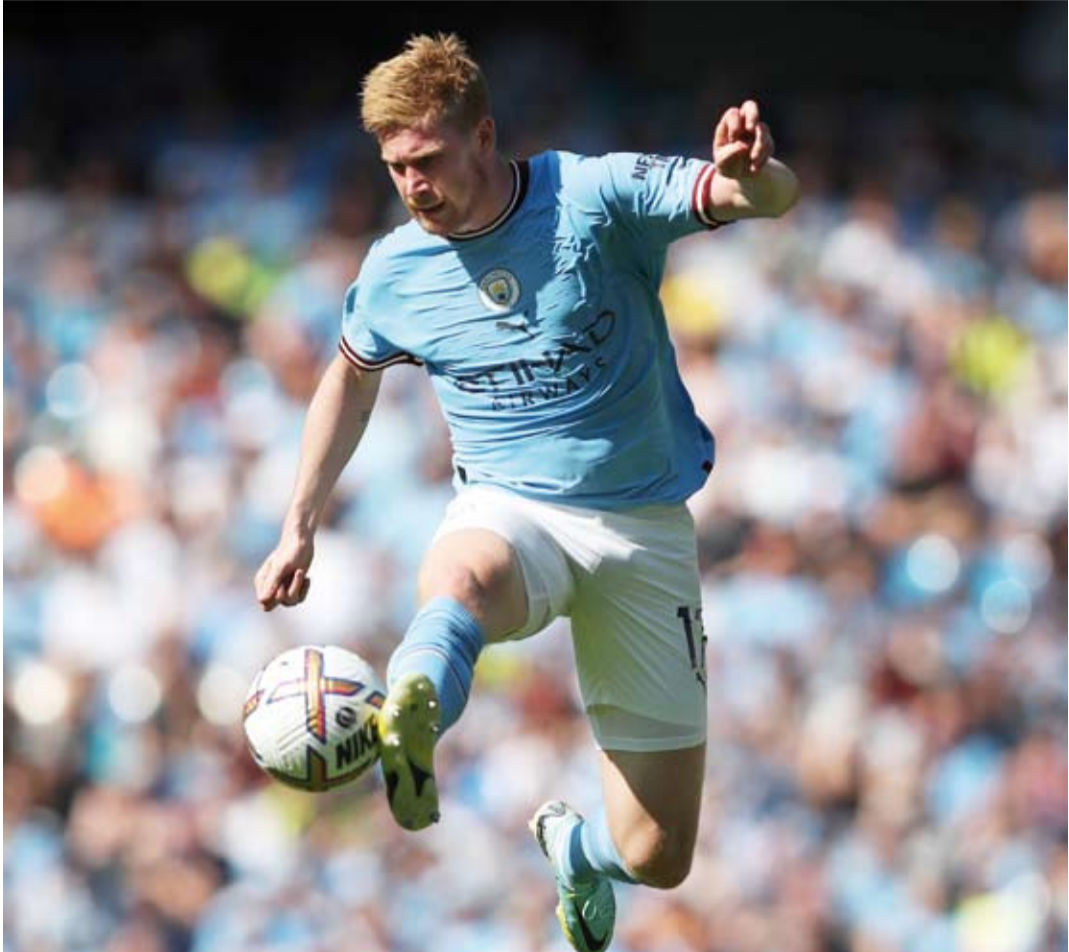
كيفين دي بروين قاد السيتي لحمل اللقب الأخير

وارتفعت إيرادات الدوريات الخمس الكبرى، الإنجليزي، الألماني، الإسباني، الإيطالي والفرنسي بنسبة 3% لتبلغ 15 ملياراً و 600 مليون يورو.