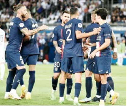
الخلافت تهدد باريس سان جيرمان

فرنسية في وقت سابق أن مبابي طلب من إدارة باريس سان جيرمان التخلي عن البرازيلي نيمار الذي انتقل إلى الفريق صيف 2017 مقابل 222 مليون يورو كأعلى صفقة في تاريخ كرة القدم. وكشفت تقارير إعلامية