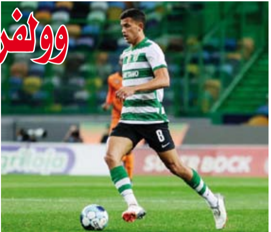
البرتغالي الدولي ماتئوس نونيز

أعلن وولفرهامبتون واندراز المنافس في الدوري الإنجليزي الممتاز لكرة القدم تعاقدته مع لاعب الوسط البرتغالي الدولي ماتئوس نونيز من سبورتنغ لشبونة. ولم يتم الكشف عن قيمة الصفقة، لكن وولفرهامبتون ذكر أنه رقم قياسي للنادي، وقدرت وسائل إعلام بريطانية المبلغ نحو 38 مليون جنيه إسترليني، لتتجاوز 35 مليون جنيه إسترليني التي دفعها النادي للمهاجم فايو سيلفا عام 2020. ووقع نونيز البالغ من العمر 23 عاماً عقداً لمدة خمس سنوات مع وولفرهامبتون مع خيار