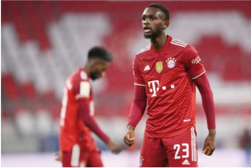
الفرنسي تانغوي نيازو

أعلن نادي بايرن ميونخ الألماني لكرة القدم بيع مدافعه الفرنسي تانغوي نيازو لفريق إشبيلية الإسباني مع بند يتيح له إعادة شراء اللاعب البالغ من العمر 20 عاماً. وضم بايرن اللاعب قادماً من باريس سان جيرمان منذ عامين، لكنه لم يقدم أداء مقنعاً، وكان دائماً على مقاعد البدلاء وأدى التعاقد مع المدافع ماتياس دي ليخت إلى تقليص فرص مشاركاته أكثر فأكثر. وقال حسن صالح حميدزينتش، المدير