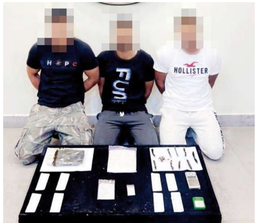
المتهمين مع المضبوطات

متهمين يروجون المخدرات في البلاد وبحوزتهم (2) كيلو من المواد المخدرة مختلفة الأنواع وتم احالتهم لجهات الاختصاص وذلك لاتخاذ اللازم بحقهم