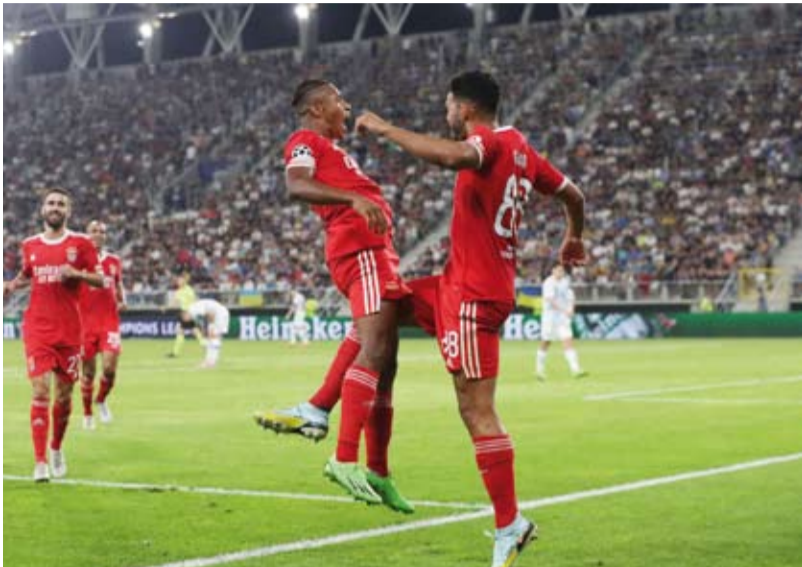
فرحة على الطريقة البرتغالية