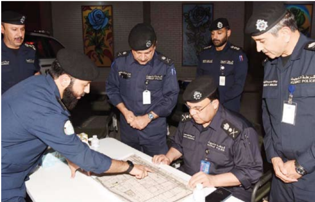
الفريق أنور البرجس يتابع مخطط الحملة

ذكرت الإدارة العامة للعلاقات والإعلام الأمني بوزارة الداخلية، أنه تنفيذاً لتوجيهات من نائب رئيس مجلس الوزراء ووزير الدفاع ووزير الداخلية بالوكالة الشيخ طلال الخالد، وبحضور ومتابعة من وكيل وزارة الداخلية الفريق أنور البرجس، ولليوم السادس على التوالي واصلت القطاعات الأمنية المختلفة مساء أمس الأول، حملتها الأمنية الواسعة من أجل فرض السيطرة الأمنية وبسط مظلة الأمن والأمان على كافة مناطق دولة الكويت، وبشكل مكثف على منطقتي جليب الشيوخ والمهبولة، وحملة مفاجئة على منطقة خيطان. وقد أسفرت الحملة على ضبط العديد من مخالفات قانون الإقامة والمطربين. وأكدت الإدارة العامة للعلاقات والإعلام الأمني على أن المؤسسة الأمنية مستمرة في جهودها الأمنية لضبط المخالفين ومحاربة الظواهر السلبية، وتدعو الجميع إلى ضرورة التعاون مع رجال الأمن وعدم إيواء أو التستر على أي مخالف لقانون الإقامة والعمل وضرورة حمل الأوراق الثبوتية.