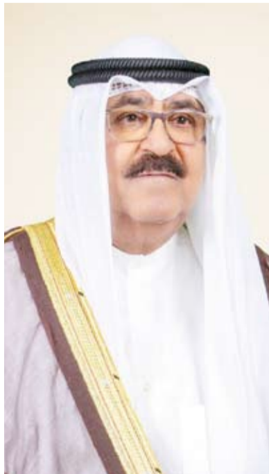
سمو ولي العهد الشيخ مشعل الأحمد

أعربت وزارة الخارجية عن تعاطف دولة الكويت ووقوفها إلى جانب الجمهورية الجزائرية الديمقراطية