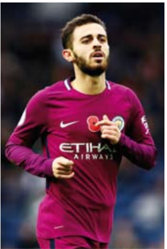
برناردو سيلفا نجم مانشستر سيتي

كشفت تقرير صحفي إسباني، عن حصول البرتغالي برناردو سيلفا نجم مانشستر سيتي، على وعد بالرحيل عن فريقه بنهاية الموسم المقبل. وكان برناردو سيلفا أحد أهداف برشلونة، خلال سوق الانتقالات الصيفية الحالية، لكن إدارة مانشستر سيتي رفضت التخلي عنه. وقالت صحيفة «سبورت» الإسبانية: «إدارة مانشستر سيتي حددت 100 مليون يورو للتخلي عن برناردو سيلفا، ورفضت تخفيض هذا المبلغ». وأضافت الصحيفة: «برناردو سيلفا تمكن من التوصل لاتفاق مع إدارة السيتي بأن سعره سيكون أقل بكثير العام المقبل، حيث سيتبقى عامان في عقده مع النادي الإنجليزي». وأشارت الصحيفة، إلى أن الوقت كان ضد رحيل برناردو سيلفا عن مانشستر سيتي، حيث لم يكن النادي الإنجليزي قادراً على ضم البديل، وبالتالي سيتاجل رحيل البرتغالي للعام المقبل.