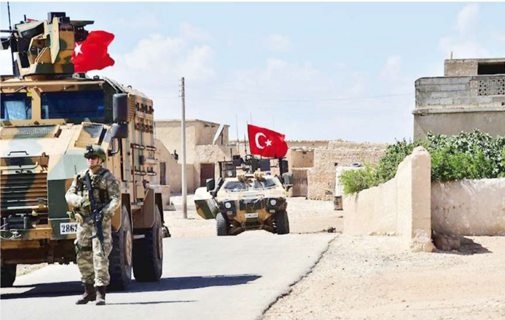
القوات التركية في سورية

دفع الجيش التركي بتعزيزات عسكرية ضخمة إلى مناطق عدة في أرياف محافظة حلب، على خلفية الهجمات المتبادلة التي وقعت بين القوات التركية و«قوات سوريا الديمقراطية» (قسد) في عين العرب (كوباني) بريف حلب الشرقي، وأدت إلى سقوط قتلى ومصابين من الجانبين.