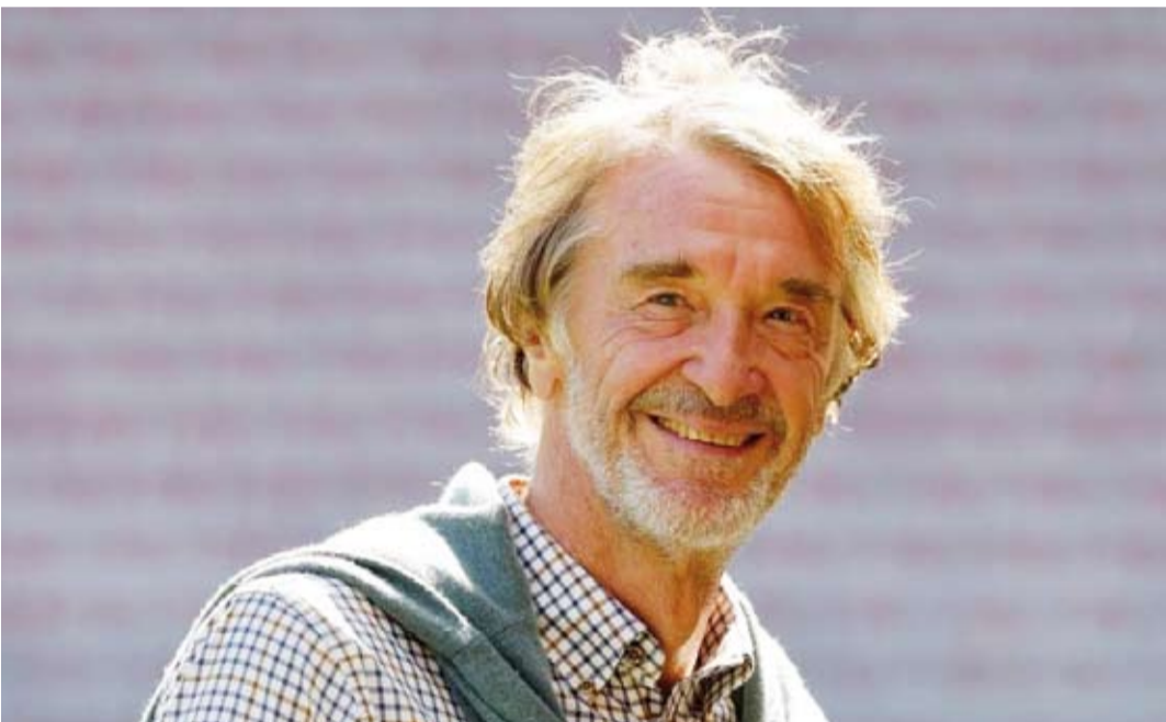
الملياردير البريطاني راتكليف

الماضي شراء نادي تشيلسي اللندني، لكنه لم ينجح في الحصول على ملكيته. وتملك شركة «إينيوس» ناديين أوروبيين، هما نيس الفرنسي وأف سي لوزان السويسري.