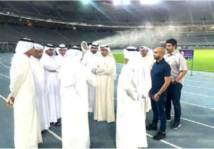
جانب من الجولة التفقدية لملاعب الكويت

جاهزية الكويت لاستضافة «خليجي 25» كدولة بديلة.