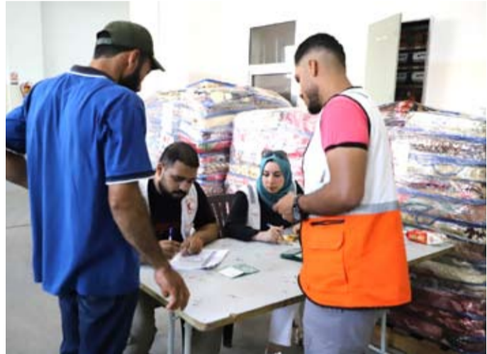
توزيع المساعدات على المتضررين

لمصلحة الشعب الفلسطيني في قطاع غزة ودعمه في وجه عدوان الاحتلال الإسرائيلي والتخفيف من معاناتهم. وبدأ عدوان الاحتلال الإسرائيلي على قطاع غزة في الخامس من أغسطس الجاري واستمر ثلاثة أيام وأدى إلى استشهاد 49 فلسطينياً وإصابة 360 آخرين إلى جانب تدمير نحو ألفي وحدة سكنية سواء بشكل كلي أو جزئي.