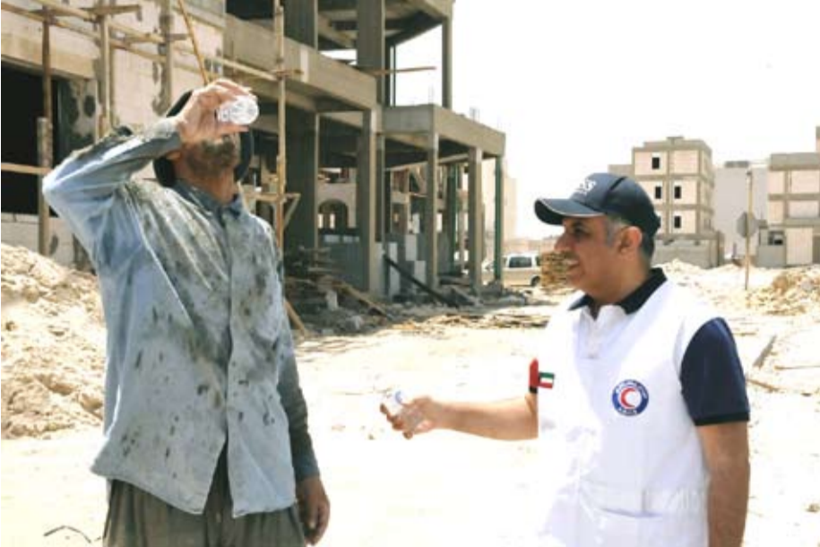
جانب من المساعدات الإنسانية