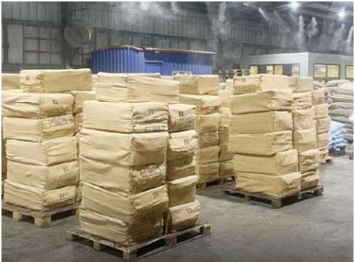
شحنة التبناك القادمة من جبل على مخبأة في حاوية أواني منزلية

إحباط إدخال 2 مليون حبة «تنباك» في ميناء الشعبية