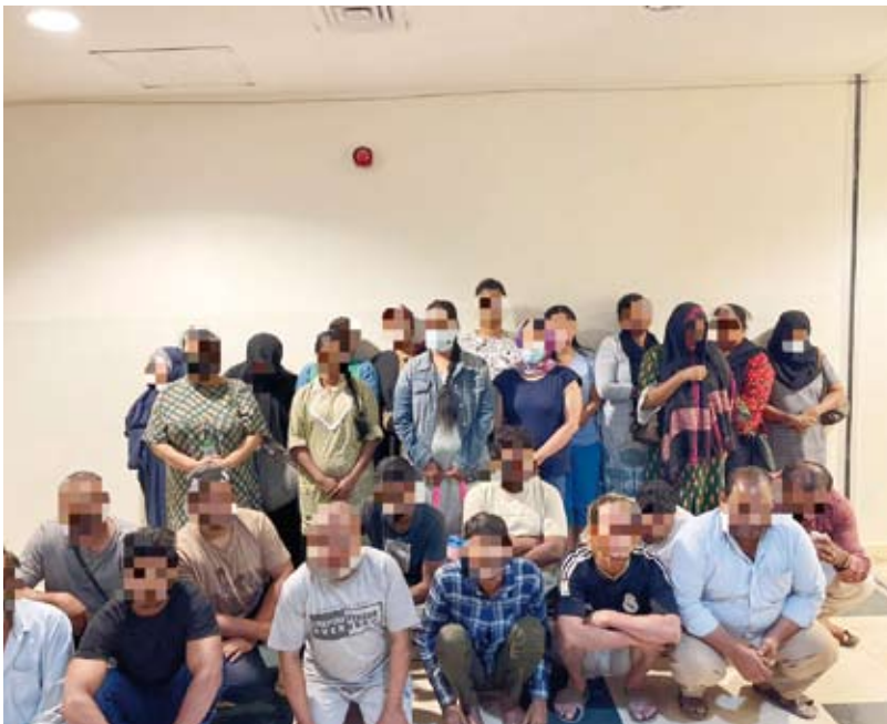
ضبط 26 مخالفاً

ذكرت الإدارة العامة للعلاقات والإعلام الأمني بوزارة الداخلية، أن الحملات الأمنية للإدارة العامة لمباحث شؤون الإقامة، أسفرت عن ضبط 6 مكاتب خدم وهمية، وعدد 26 مخالفين لقانون الإقامة والعمل من مختلف الجنسيات (تغيب – انتهاء إقامة – متسولين) على مستوى جميع المحافظات وتم إحالتهم إلى جهة الاختصاص لاتخاذ الإجراءات اللازمة بحقهم.