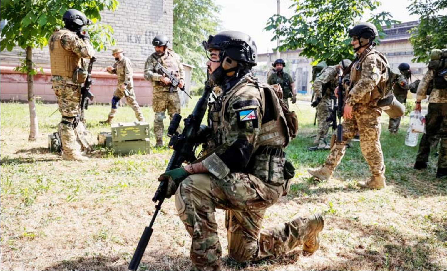
القتال في أوكرانيا

وفي إطار محاولات التصدي لمجموعات راجمات الصواريخ، قامت القوات الروسية وفقاً للمناطق بتدمير فصيل من راجمات الصواريخ المتعددة من طراز «إعصار» في مواقع إطلاق النار بالقرب من قرية كوستانتينوفكا في دونيتسك.