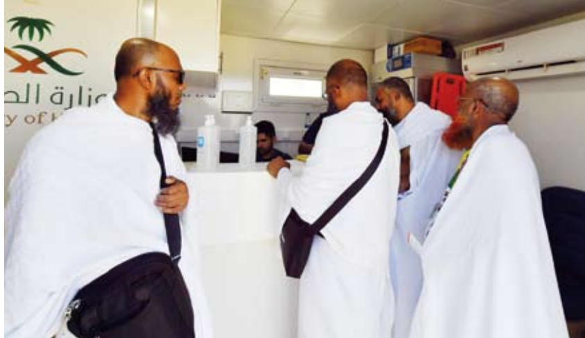
توافد الحجاج إلى المدينة المنورة

1444 هجري بدءاً من يوم أمس الخميس. وأوضحت الوزارة في بيان صحفي، أول أمس، أن بدء العمرة