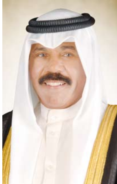
سمو أمير البلاد الشيخ نواف الأحمد

بعث صاحب السمو أمير البلاد الشيخ نواف الأحمد، ببرقية تهنئة إلى الرئيس إيمانويل ماكرون رئيس الجمهورية الفرنسية الصديقة، ضمنها عبر فيها سموه عن خالص تهانيه بمناسبة العيد الوطني لبلاده، متمنياً لفخامته وأفر الصحة والعافية. كما بعث سمو الشيخ صباح الخالد رئيس مجلس الوزراء، ببرقية تهنئة إلى الرئيس إيمانويل ماكرون رئيس الجمهورية الفرنسية الصديقة بمناسبة العيد الوطني لبلاده.