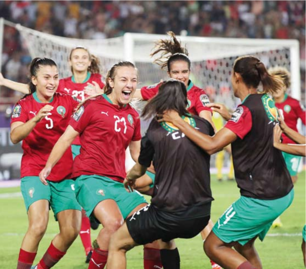
فرقة عارمة بالتأهل للمونديال

وغادر مسعود أوزيل فرنخبشة، بعدما توصل الطرفان لاتفاق لإنهاء العقد الذي ينتهي في 2024 بالتراضي، بعدما خرج لاعب خط الوسط المهاجم من التشكيل منذ 24 مارس الماضي. ولم يشارك أوزيل 33 عاماً مع فرنخبشة في أي مباراة منذ 20 مارس الماضي، وتأتي عملية فسخ عقده مع إدارة النادي بالرغم من إصراره على أنه كان متحمساً للاستمرار ومساعدة الفريق.