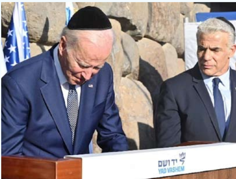
دعم أميركا المستمر لقتل أبيب وتعهده بعدم السماح لإيران بامتلاك سلاح نووي

«إعلان القدس».. تعهد أميركي بالتصدي لـ «نووي إيران»