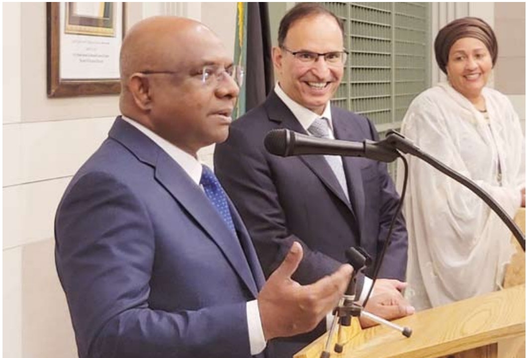
رئيس الجمعية العامة للأمم المتحدة عبدالله شامد يلقي كلمة خلال حفل التوديع في مقر وفد الكويت الدائم لدى الأمم المتحدة

المتحدة والمندوبين الدائمين للدول الأعضاء في المنظمة الدولية ومجموعة من الدبلوماسيين. وفي تصريح خاص لـ (كونا) وتلفزيون الكويت خلال الحفل قال الأمين العام للأمم المتحدة: إن «الكويت شريك رائع للأمم المتحدة وبلد سخي جداً ورمز للحكمة والسلام ووسيط نزيه وباني للجسور».