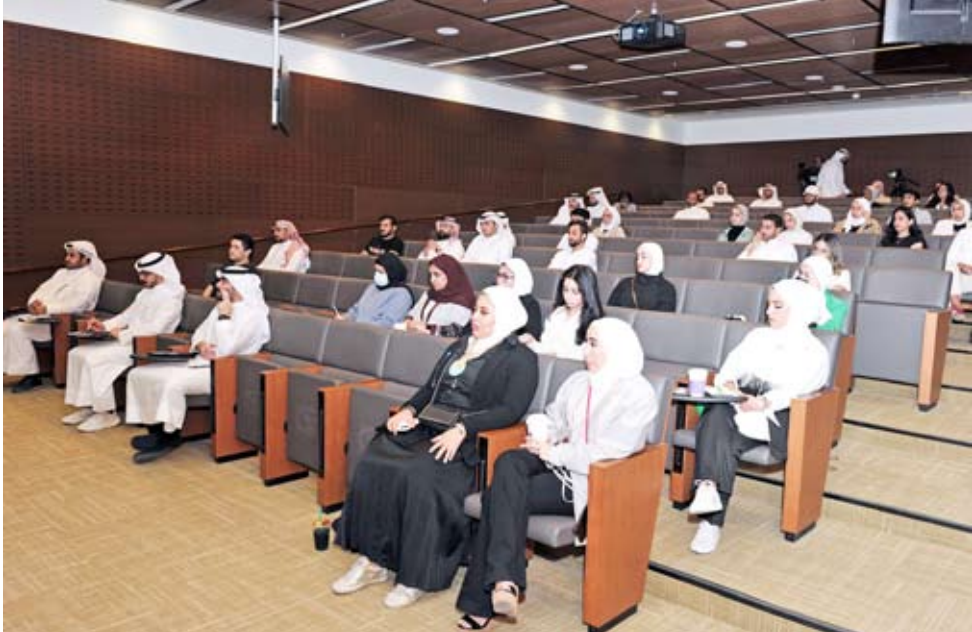
جانب من برنامج «إدارة المرافق والأمن والسلامة والبيئة»