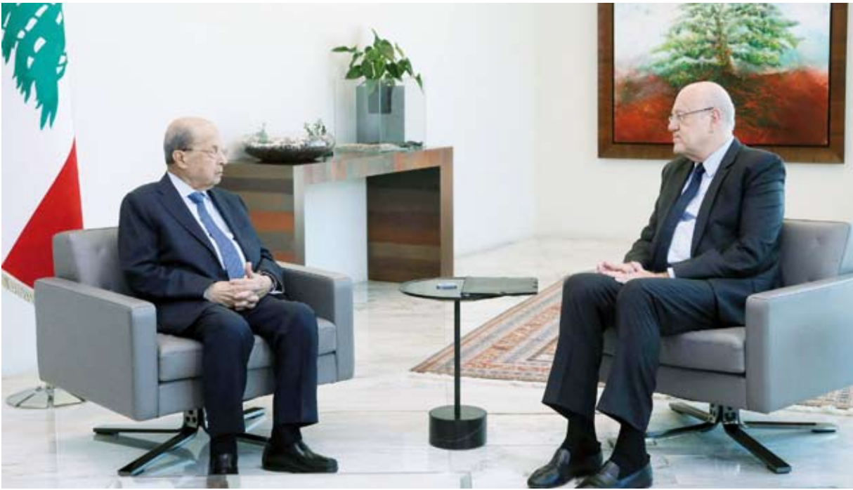
ميقاتي خلال اللقاء مع عون

ورأى أن «هذه التشكيكية هي الإطار المناسب للبحث مع فخامته خاصة أنها تتسجم مع مسؤوليته وطروحاته والأهداف الواجب تحقيقها في هذه المرحلة الضيقة جداً، وهذا العمل هو ما يقتضيه الدستور، حيث إن رئيس الوزراء هو من يتحمل المسؤولية أمام مجلس النواب».