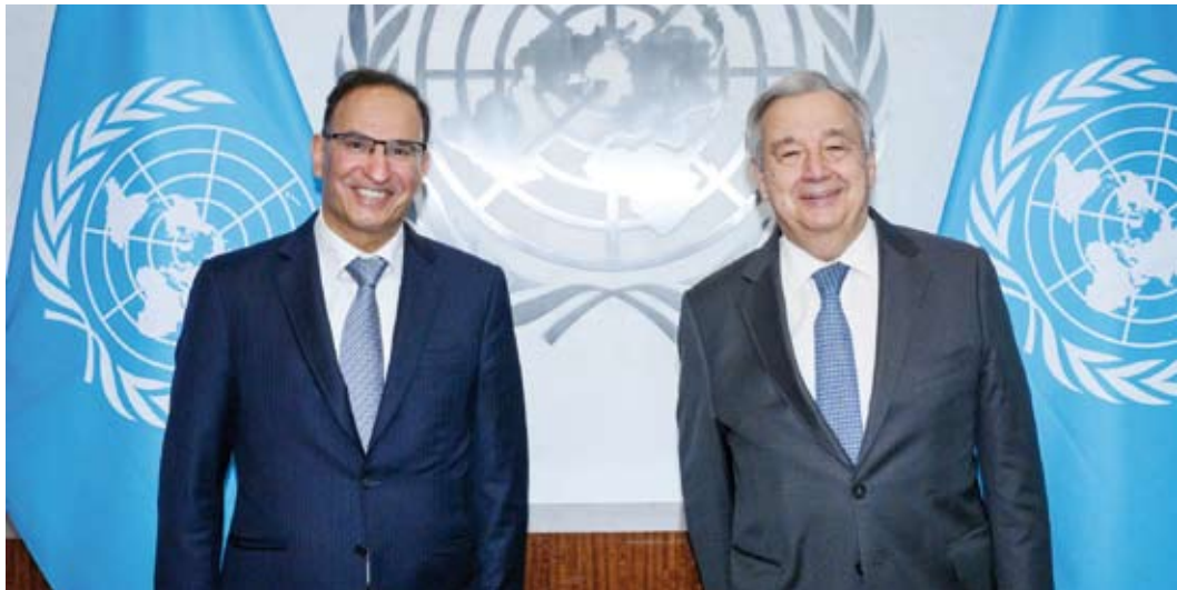
السفير منصور العتيبي مع الأمين العام للأمم المتحدة أنطونيو غوتيريس