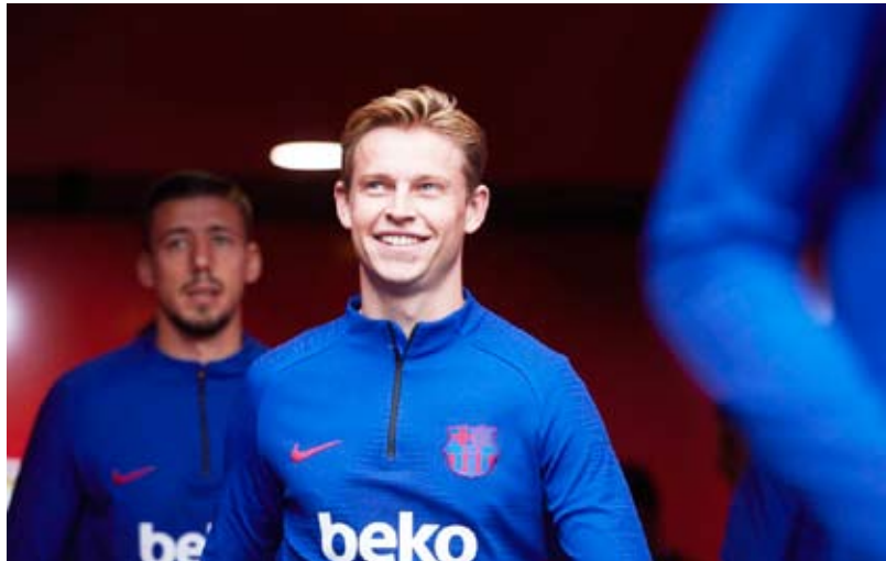
الهولندي فرينكي دي يونج

يونيغ على المستوى الرياضي، لكن رحيله أصبح ضروري على المستوى الاقتصادي، من أجل تسجيل الصفقات الجديدة». وأشارت الصحيفة، إلى أن دي يونج لا يرغب في الرحيل عن برشلونة، والإدارة تعرف ذلك، وإذا لم يتم حل مشكلة اللعب المالي الخفيف برحيل الهولندي، فهناك طرق أخرى مثل تخفيض الأجور والتخلص من بعض اللاعبين. وأفاد التقرير، أن إدارة برشلونة لم تطلب من دي يونج نفسه تقليل راتبه حتى الآن.