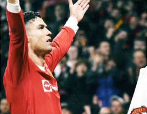
البرتغالي كريستيانو رونالدو

علق الألماني توماس توخيل، المدير الفني لتشيلسي، على إمكانية التعاقد مع البرتغالي كريستيانو رونالدو، نجم مانشستر يونايتد، خلال سوق الانتقالات الصيفية الحالية. وقال توخيل، في تصريحات نقلتها شبكة «سكاى سبورتس»، رداً على هذا الأمر: «لا أستبعد التعاقد مع مهاجم.. لكن الأمر ليس أولوية بالنسبة لنا، فالأولوية في الوقت الحالي للدفاع.. وهذا ليس سراً». وتابع: «لقد خسرتنا لاعبين رائعين (في الدفاع)، لذا نريد الآن تعويضهم بأخرين». وكانت تقارير صحيفة سابقة، قد ذكرت أن مالك تشيلسي الجديد، تود بولي، مهتم بضم النجم البرتغالي البالغ من العمر 37 عاماً، ويقال إنه التقى وكيله خورخي مينديز، الشهر الماضي، مع وجود اسم رونالدو على جدول الأعمال. وما زال «الدون» في إجازة «لأسباب عائلية»، حيث غيب عن جولة مانشستر يونايتد الصيفية في تايلاند وأستراليا.