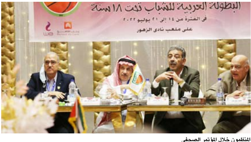
المنظمون خلال المؤتمر الصحفي