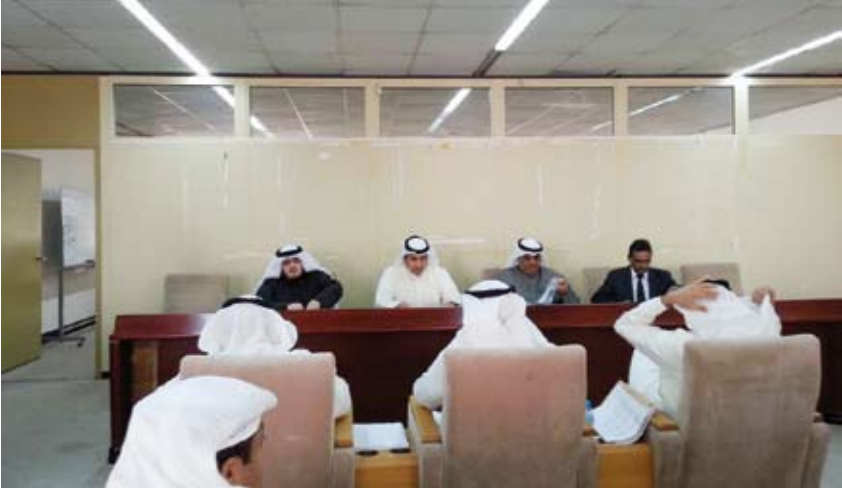
اجتماع سابق لشركة الوطنية الاستهلاكية

أعلنت شركة الوطنية الاستهلاكية القابضة انتهاء فترة الاكتتاب في زيادة رأس المال بعدد 210 مليون سهم عادي، وبقيمة 21 مليون دينار يوم الخميس الماضي.