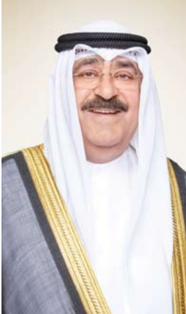
سمو ولي العهد الشيخ مشعل الأحمد