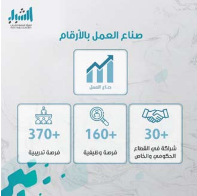
برنامج «صناع العمل»