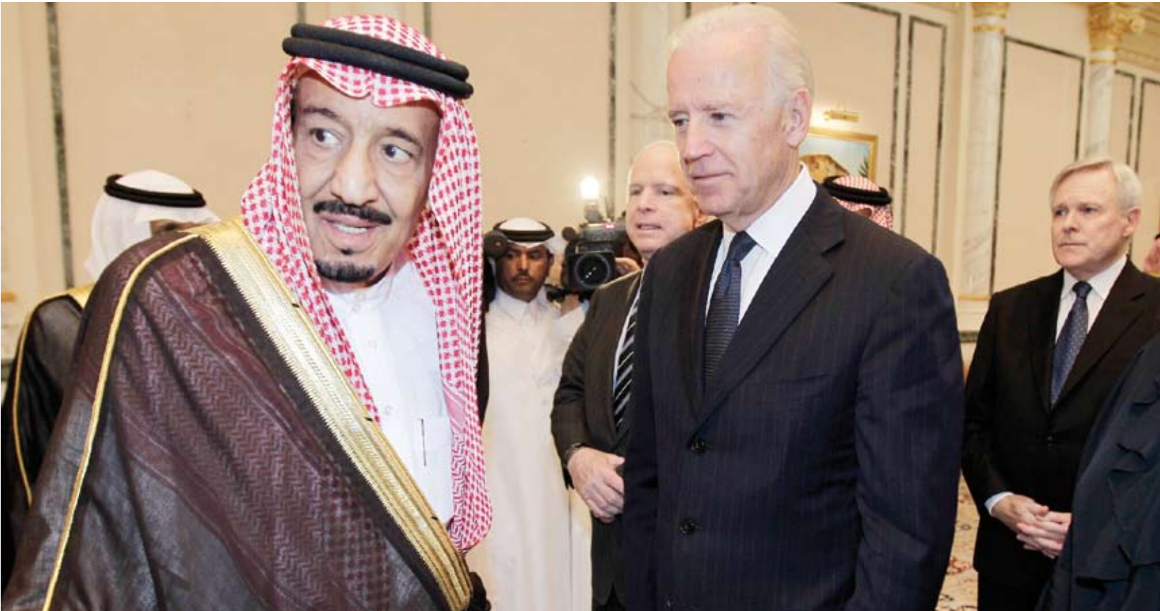
لقاء سابق بين الملك سلمان وبايدن

فعله رئيس الوزراء الأسبق بنيامين نتنياهو