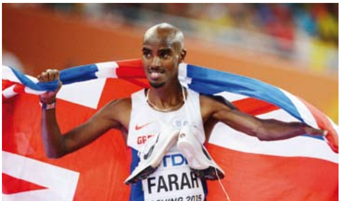
العداء محمد فرح

ونكرت وكالة الأنباء البريطانية «بي.إيه.ميديا» أنّ وزارة الداخلية في المملكة المتحدة لديها سلطة نزع الجنسية البريطانية من الأفراد إذا تم الكشف عن أنهم حصلوا عليها بشكل غير قانوني. وكانت الوزارة أكدت في وقت سابق أنها لن تقوم بأي إجراء على الإطلاق تجاه فرح. وقال المتحدث رسمي بمقر الحكومة البريطانية داو نينج ستريت عن البطل الأولمبي: «إنه بطل رياضي، إنه مصدر إلهام للناس عبر البلاد.» وأضاف: «إن هذا تذكير صادم بالأحوال التي يواجهها الناس عندما يتم