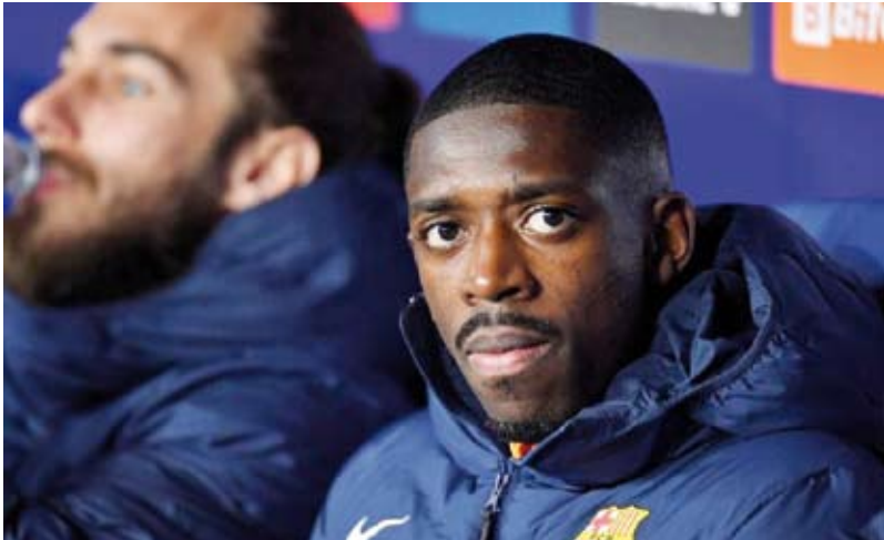
الفرنسي عثمان ديمبلي

32 هدفاً إضافة إلى 34 تمريرة حاسمة. وتعلّط مسيرة عثمان ديمبلي كثيراً مع برشلونة بسبب كثرة الإصابات، لكنه استعاد عافيته في الموسم الأخير منذ تولي المدرب تشافي هيرنانديز المسؤولية. يذكر أنّ العديد من التقارير أشارت إلى أنّ راتب ديمبلي سيكون أقل بـ40% من راتبه في العقد السابق، لكن يمكنه الحصول على العديد من المكافآت بناء على أدائه خلال الموسم.