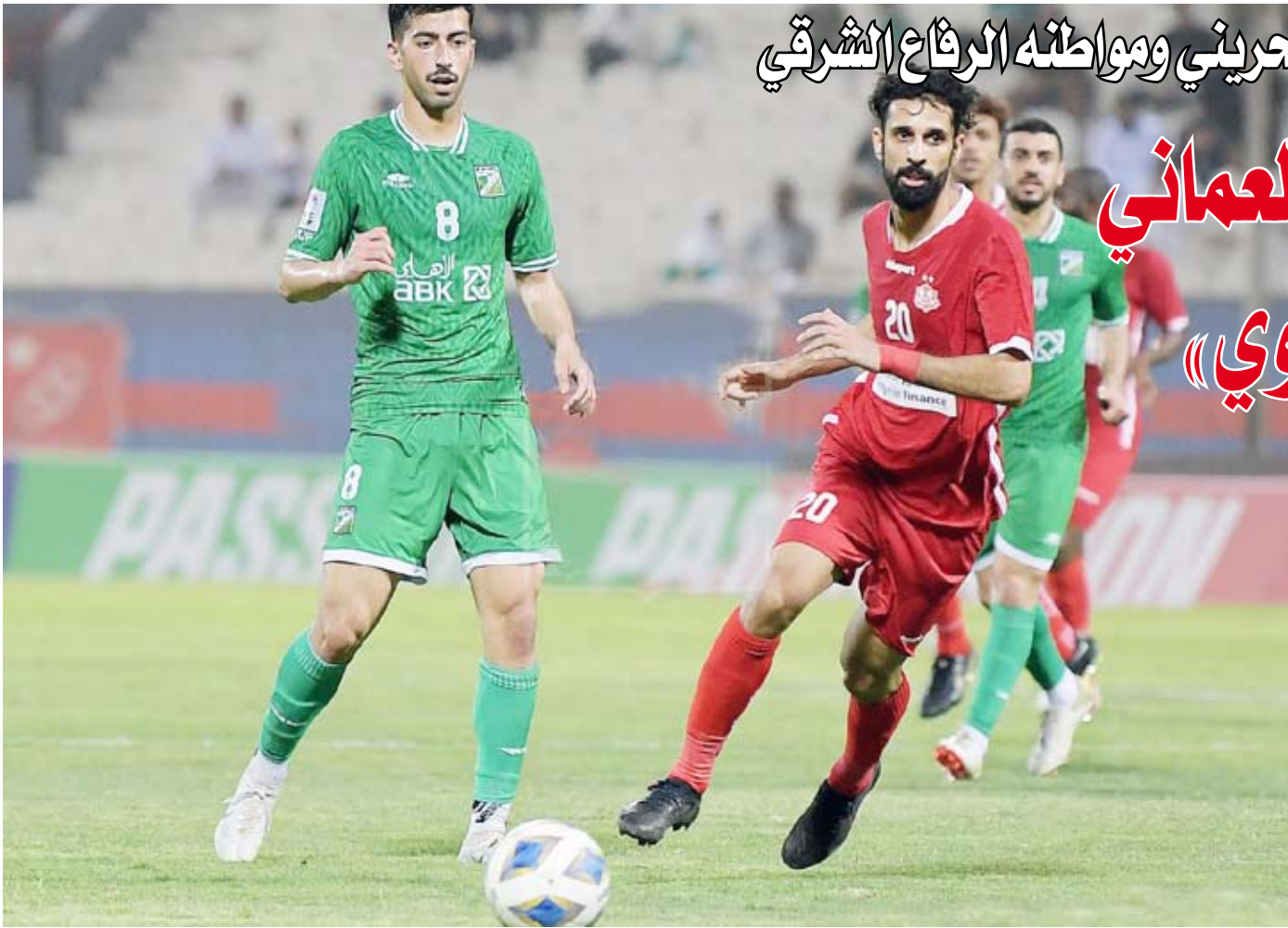
جانب من لقاء العربي ولفار العماني

قال الاتحاد الكويتي لكرة القدم إن مجلس إدارته اعتمد لائحة شؤون الاحتراف وأوضاع اللاعبين (2022-2023) مبيناً أن العمل في اللائحة سيكون اعتباراً من الأربعاء الماضي.