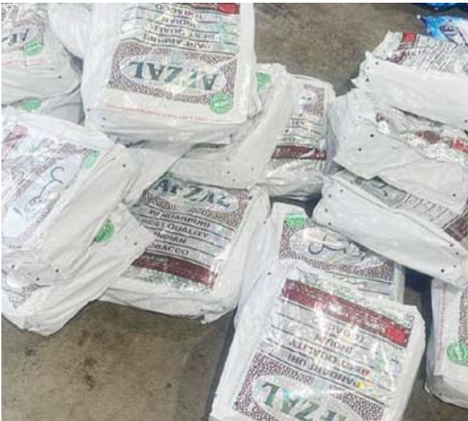
إحباط 2 مليون حبة من التبناك

تبعاً لتعليمات وزارتي التجارة والصحة، وتم اتخاذ الإجراءات الجمركية اللازمة. وحذرت الإدارة العامة للجمارك كل من تسول له نفسه تهريب المواد المخدرة والبضائع المحظورة بكافة أشكالها وأنواعها إلى البلاد، مشددة على أنه سيخضع نفسه للمساءلة القانونية واتخاذ الإجراءات الجمركية بحق.