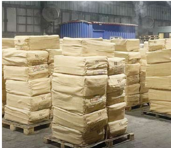
كميات من التبناك مخبأة في حاويات أدوات منزلية

الساحلية والرياح متقلبة الاتجاه إلى جنوبية شرقية خفيفة إلى معتدلة السرعة ما بين 8 و28 كيلومتراً في الساعة ودرجات الحرارة الصغرى المتوقعة ما بين 34 و36 درجة مئوية ويكون البحر خفيفاً إلى معتدل وارتفاع الموج ما بين 1 و3 أقدام. وقال البلوشي إن الطقس نهار غد السبت، يكون شديد الحرارة والرياح شمالية غربية إلى جنوبية شرقية خفيفة إلى معتدلة السرعة ما بين 10 و30 كيلومتراً في الساعة ودرجات الحرارة الصغرى المتوقعة ما بين 35 و37 درجة مئوية والبحر يكون خفيفاً إلى معتدل وارتفاع الموج ما بين 1 و3 أقدام. وأشار إلى أن الطقس السبت ليلاً يكون حاراً إلى مائل للحرارة ورطباً نسبياً على المناطق الساحلية والرياح شمالية غربية تتحول إلى جنوبية شرقية خفيفة إلى معتدلة السرعة ما بين 8 و28 كيلومتراً في الساعة ودرجات الحرارة الصغرى المتوقعة ما بين 35 و37 درجة مئوية والبحر يكون خفيفاً إلى معتدل وارتفاع الموج ما بين 1 و3 أقدام.