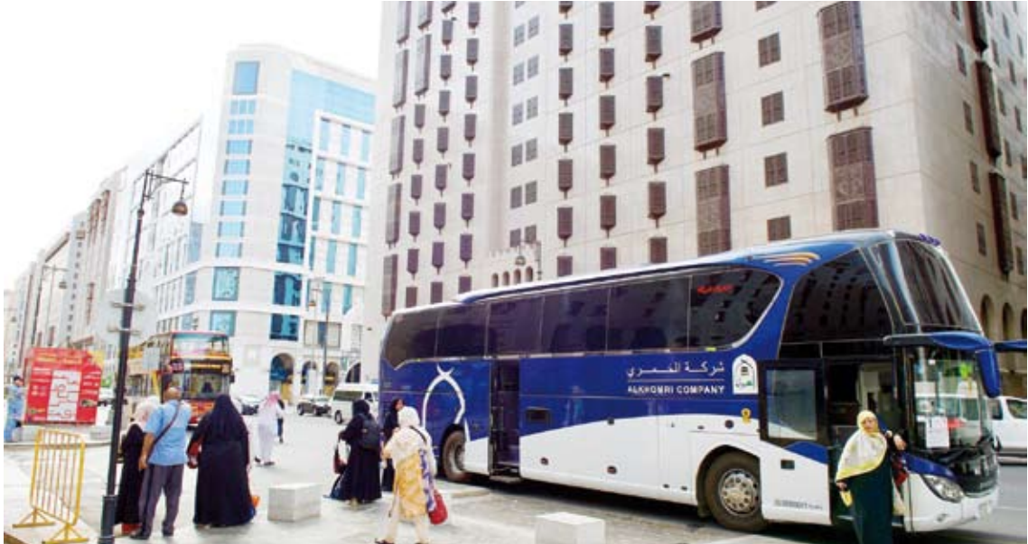
حافلات الحجاج تصل إلى المدينة المنورة

كشفت إحصائية وزارة الحج والعمرة لحركة استقبال ومغادرة الحجاج في المدينة المنورة، عن وصول 27360 حاجاً من جنسيات متعددة إلى المدينة المنورة حتى مساء الأربعاء، بعد أدائهم مناسك الحج هذا العام.