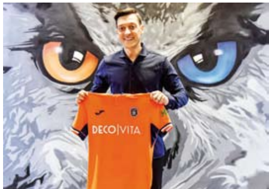
الألماني مسعود أوزيل

حيث نشر نادي فرنخبشة التركي بيان رسمي عبر موقعه الرسمي وحسابه على تويتر جاء فيه ، تقرر إنهاء العقد بين نادينا ومسعود أوزيل بالاتفاق المتبادل، نتمنى لـ مسعود أوزيل التوفيق لبقية حياته المهنية.