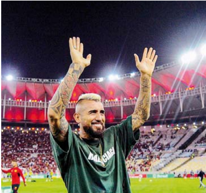
التشيلي أرتورو فيدال

وينتهي عقد فيدال مع إنتر نهاية الموسم المقبل لكن هناك رغبة من الطرفين للانفصال هذا الصيف. وخاض فيدال (35 عاماً) بقميص إنتر 70 مباراة مع جميع المسابقات سجل 4 أهداف وقدم 6 تمريرات حاسمة. وأسهم فيدال في تحقيق لقب الدوري الإيطالي وكأس إيطاليا والسوبر الإيطالي رفقة النيراتوري. وأصبح فيدال ثاني لاعب في إنتر ميلان ينضم إلى فلامنجو في غضون عامين بعد أن ختم جابريل باربوسا انتقاله إلى النادي مقابل رسوم غير معلنة في 2020.