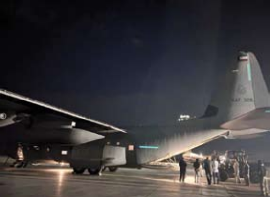
الطائرة العسكرية الكويتية في مطار العريش

عده الأمين الشيخ صباح الخالد وسمو الشيخ أحمد العبدالله رئيس مجلس الوزراء لمساندة الأشقاء الفلسطينيين في قطاع غزة.