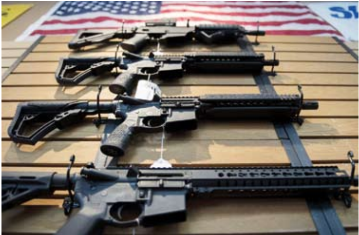
سويسرا تحاول التوصل لحل مع الإدارة الأمريكية بشأن الرسوم الجمركية

الأوروبي واليابان على تعرفات بنسبة 15 بالمئة، فيما حصلت بريطانيا على معدل يبلغ 10 بالمئة. تقول سويسرا إن هناك فائضا كبيرا لصالح الولايات المتحدة في ميزان الخدمات التجارية وإن معظم السلع الصناعية الأميركية تدخل سويسرا بدون أي رسوم جمركية.