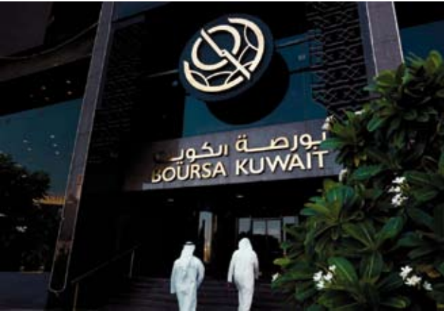
اللون الأخضر يسيطر على مؤشرات بورصة الكويت

ارتفعت أرباح شركة التجارية العقارية في الربع الثاني من عام 2025 بنسبة 2.21% سنوياً، بحسب بيان لبورصة الكويت. سجلت الشركة ربحاً بقيمة 5.97 مليون دينار في الثلاثة أشهر المنتهية بـ30 يونيو السابق، مقابل 5.84 مليون دينار ربح الربع الثاني من عام 2024. وحقت “التجارية” في الستة أشهر الأولى من العام الحالي ربحاً بقيمة 9.06 مليون دينار، بانخفاض 5.32% عن مستواها في النصف الأول من العام الماضي البالغ 9.57 مليون دينار.