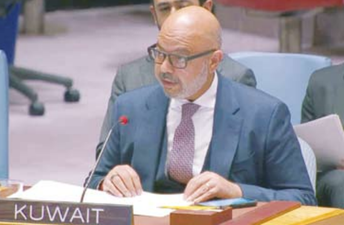
السفير طارق البنائي خلال جلسة مجلس الأمن الدولي

وأكد البنائي في ختام كلمة المجموعة الخلية، أن إفلات إسرائيل من المحاسبة لم يعد مقبولاً وأن استمرار العدوان على غزة يشكل اختباراً حقيقياً لمصداقية النظام الدولي وقدرته على حماية الشعوب والسلم والأمن الدوليين.