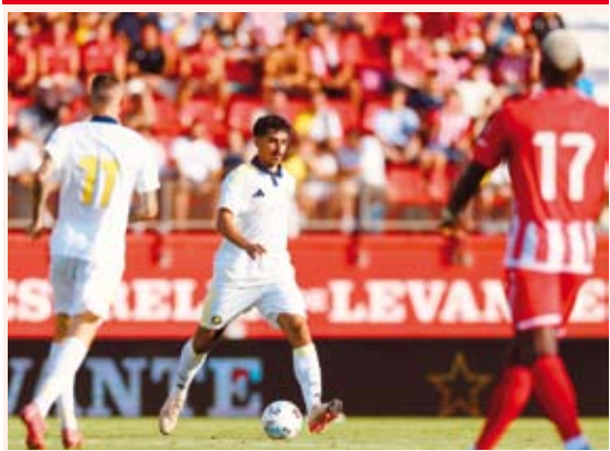
النصر يستعد للسوبر السعودي

خسر النصر السعودي آخر مبارياته الودية في معسكره الإعدادي الحالي أمام مضيفه الميريا الإسباني بثلاثة أهداف مقابل هدفين. وتقدم الميريا ”درجة ثانية“ مبكراً عبر لاعبه سيرجيو أربياس بعد 6 دقائق من البداية، لكن النصر قلب الطاولة بهدفين عن طريق كريستيانو رونالدو (17.39). لكن الميريا عاد إلى المباراة بفضل هدف التعادل من أندري إيمباربا قبل دقيقتين من نهاية الشوط الأول، وفي الدقيقة 61 سجل إيمباربا الهدف الثالث.