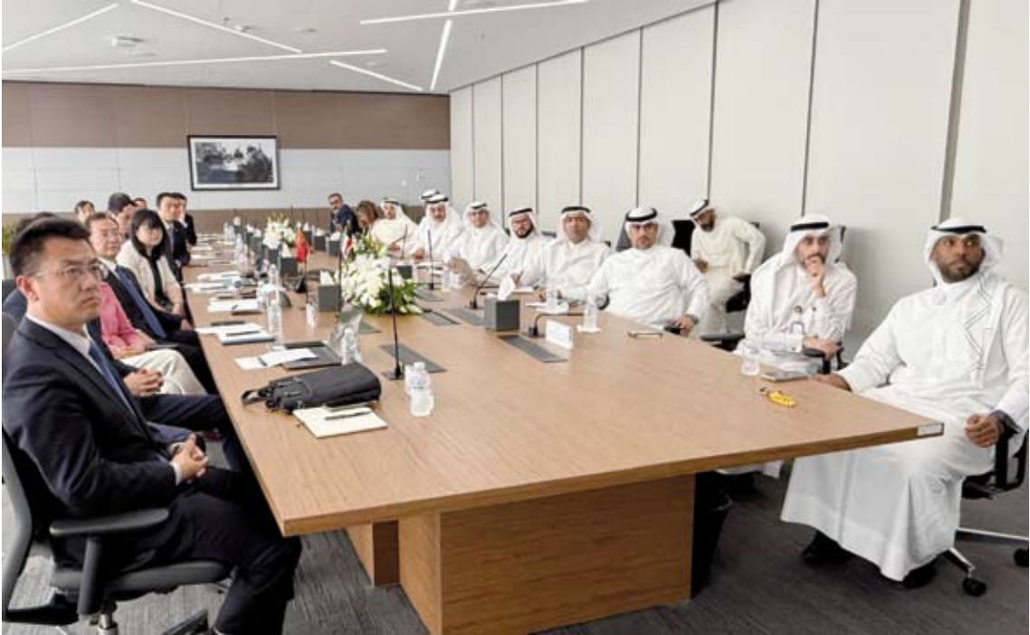
وزير الإسكان خلال الاجتماع التسيقي

مجلس الوزراء ومتابعة أعضاء اللجنة الوزارية. في سياق متصل، عقد الوزير المشاري اجتماعاً تنسيقياً رفيع المستوى مع ممثلي الشركتين الصينيتين الحكوميتين كلا على حده تم خلالهما مناقشة آليات التعاون الفني والاستثماري وتبادل الرؤى حول أفضل الممارسات العالمية التي يمكن تطبيقها لتطوير المشروعات المستهدفة. وذكرت المؤسسة العامة للرعاية السكنية في بيان صحفي أن الاجتماع جاء للتأكيد أهمية التكامل بين الجانبين وتفعيل التعاون الدولي وتطوير بيئة عمرانية حديثة تحقق الأهداف التنموية في مجالات الإسكان والتخطيط الحضري حيث جرى استعراض المعلومات والبيانات المرتبطة بالمشروعات المقرر تنفيذها.