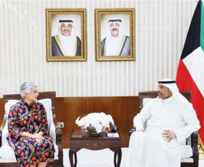
.. ويستقبل سفيرة كندا عليا مواني