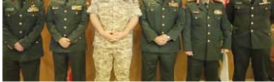
اللواء حقوقي عويد الهطلاني خلال المباحثات في مديرية القضاء العسكري

في مجال القضاء العسكري مميز وشهد تحديداً وتطوراً كبيراً، مبيها أهمية تعزيز الشراكة الاستراتيجية التي تربط جيشي البلدين الشقيقين. وذكر أن توجيهات القيادة العسكرية في الكويت حريصة على تبادل الخبرات وتعزيز التعاون المشترك بمختلف المجالات القانونية والعسكرية مع الأشقاء والأصدقاء لتطوير منظومة العمل في الجيش الكويتي.