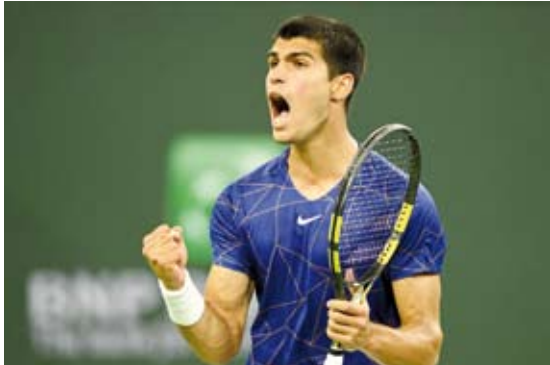
الإسباني كارلوس الكاراس

الأوكرانية مارتا كوستيوك، بينما فازت الأمريكية كوكو غوف على الصينية تشينغوانغ وانغ 3-6 و6-2.