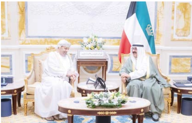
سمو أمير البلاد يستقبل وزير الداخلية العماني

استقبل صاحب السمو أمير البلاد الشيخ مشعل الأحمد، بقصر بيان، صباح أمس، وبحضور رئيس مجلس الوزراء بالإنابة الشيخ فهد اليوسف، حمود بن فيصل بن سعيد البوسعيد ووزير الداخلية بسلطنة عمان الشقيقة والوفد المرافق، وذلك بمناسبة زيارته للبلاد، حيث نقل لسموه رسالة شفوية تضمنت تحيات وتقدير أخيه صاحب الجلالة السلطان هيثم بن طارق المعظم سلطان عمان الشقيقة وتمنياته لسموه بموفور الصحة وتمام العافية ولشعب دولة الكويت المزيد من الرقي والنماء، كما تضمنت العلاقات الأخوية التي تربط البلدين والشعبين الشقيقين وسبل تعزيزها وتنميتها في مختلف المجالات.