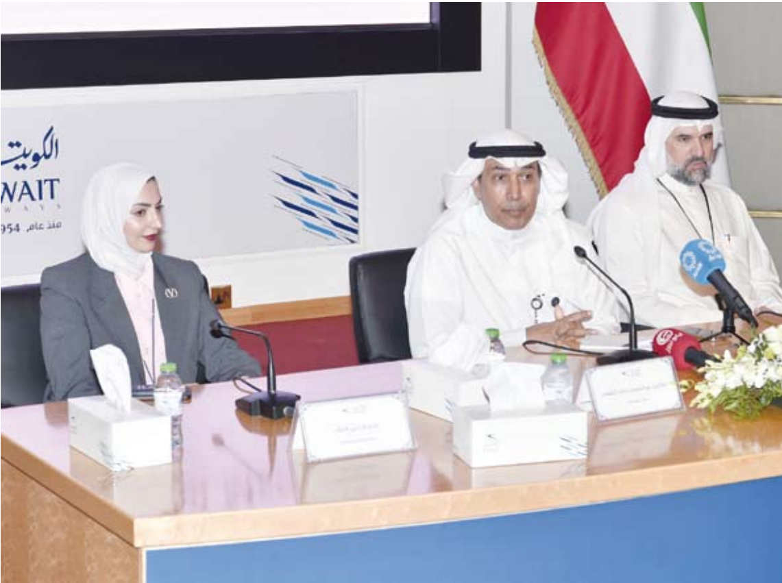
خطة طموحة لشركة الخطوط الجوية الكويتية

◆ حققنا في 2024 المركز الـ20 بين أفضل 109 شركات طيران حول العالم