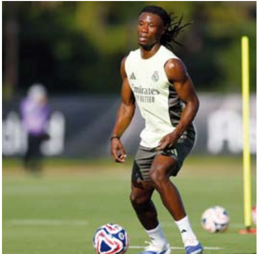
الفرنسي إدواردو كامافينغا

أعلن ريال مدريد، المنافس في دوري الدرجة الأولى الإسباني لكرة القدم، إصابة الفرنسي إدواردو كامافينغا بالتواء في الكاحل. وقال العملاق الإسباني في بيان عبر موقعه على الإنترنت: كشفت الفحوص التي أجراها الجهاز الطبي لريال مدريد على إدواردو كامافينغا، إصابة اللاعب بالتواء في كاحله الأيمن.