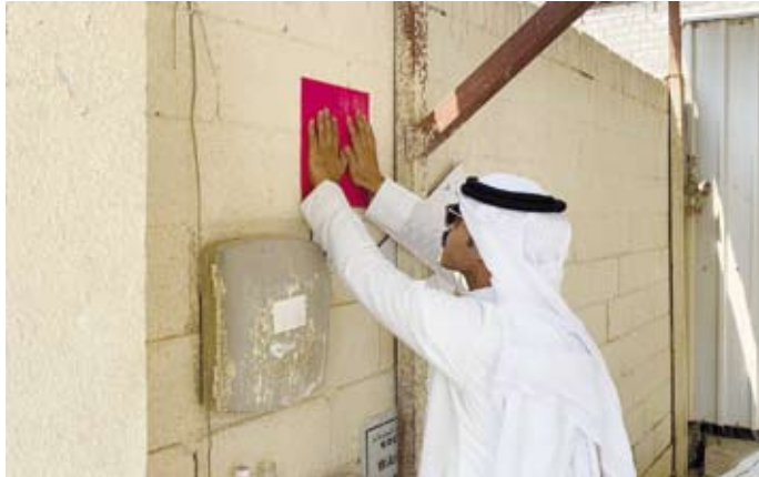
وضع ملصق مخالفة