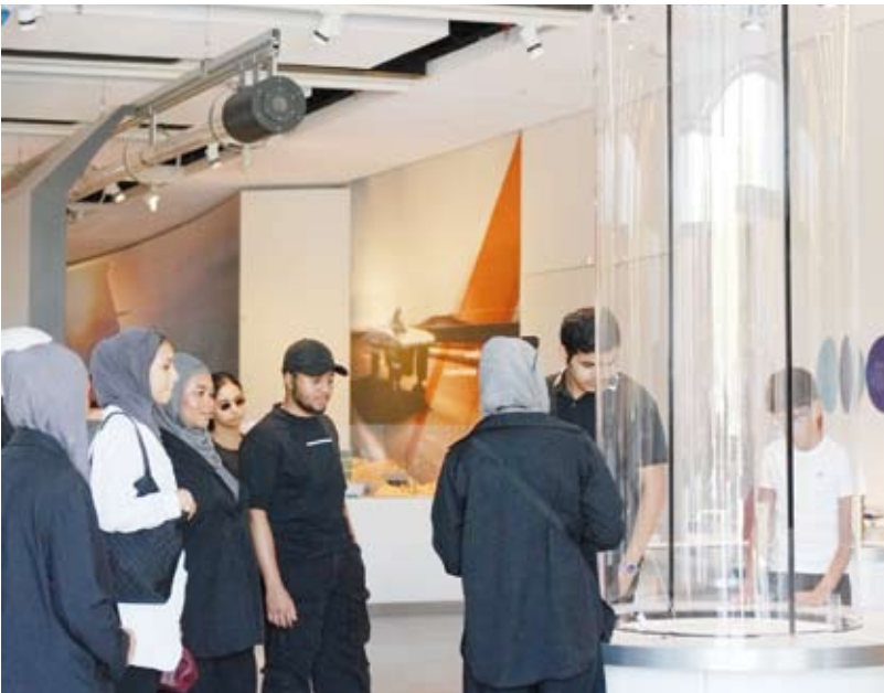
الإطلاع على مرفقات المركز

الدور التعليمي والتثقيفي عبر تنظيم الفعاليات وورش العمل بما يساهم في إيصال المعرفة إلى مختلف الفئات وتحسين تجربة الزوار. وأوضح المركز أن التعاون مع الهيئة العامة لشؤون القصر يعد الثاني من نوعه ويستمر على مدى شهر كامل يتم خلاله إشراك المتطوعين في مهام العاملين اليومية لترسيخ قيم المسؤولية المجتمعية في نشر الثقافة والعلوم مع قياس أثر