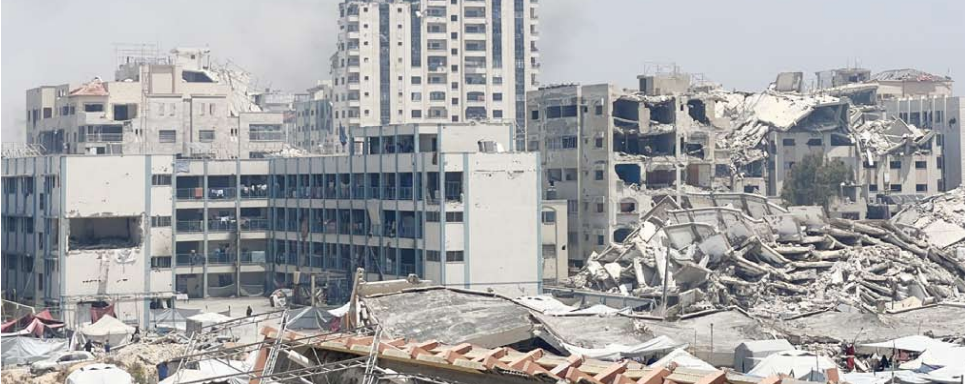
التنديد الدولي مستمر بالخطة الصهيونية للسيطرة على قطاع غزة

حُدّر مسؤول كبير في الأمم المتحدة الأحد من أن خطة إسرائيل للسيطرة على مدينة غزة قد تتسبب بـ “كارثة جديدة” مع تداعيات تتجاوز القطاع المحاصر والمدمر. وعقد مجلس الأمن الدولي اجتماعاً طارئاً بعدما أعلنت إسرائيل أن جيشها سيسيطر على مدينة غزة، بعد موافقة الحكومة الأمنية برئاسة بنيامين نتانياهو على هذه الخطة التي أثارت تنديداً دولياً. وقال مساعد الأمين العام للأمم المتحدة ميروسلاف جينكا أمام مجلس الأمن الدولي “إذا تم تنفيذ هذه الخطط، فقد تؤدي إلى كارثة جديدة في غزة، تتردد أصدائها في أنحاء المنطقة، وتتسبب بمزيد من النزوح القسري وعمليات القتل والدمار..” و أفساد مكتب الأمم المتحدة لتنسيق الشؤون الإنسانية (اوتشا) أن 98 طفلاً قُضوا جراء سوء التغذية المزمن منذ اندلاع النزاع في أكتوبر 2023، بينهم 37 طفلاً توفوا منذ يوليو بحسب السلطات في غزة. وقال راميش راجاسينغام مدير التنسيق في اوتشا “لم يعد هذا الأمر أزمة جوع وشيكة، إنها مجاعة بكل معنى الكلمة..” وقال السفير الفلسطيني لدى الأمم المتحدة رياض منصور إن “نحو مليوني ضحية يعانون احتصاراً لا يطاق”، واصفا خطة إسرائيل للسيطرة على مدينة غزة بأنها “غير قانونية وغير أخلاقية”، مطالبا بالسماح للصحافيين الأجانب بدخول القطاع.