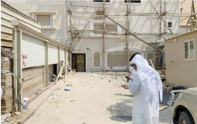
معاينة مبني مخالف

المروضة واتخاذ الإجراءات اللازمة بشأنها وقد أسفرت عن توجيه 8 انذارات للسكن الخاص وتحرير مخالفتين لأنظمة البناء ومخالفتين للسكن العزاب بمنطقة الواحة. وشددت ان الحملة الثانية ستبعتها عدت جولات ميدانية في جميع المحافظات حسب جدول زمني متضمنا مواعيد الحملات الميدانية الذي تم إعداده من قبل فريق ادارة العلاقات العامة بالتنسيق مع الإدارات المعنية لتنفيذ هذه الحملات طوال