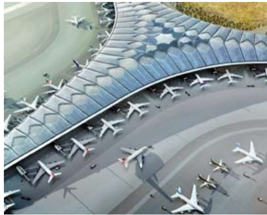
مبنى الركاب T2

وافق الجهاز المركزي للمناقصات العامة على طلب وزارة الأشغال العامة إصدار الأمر التغييري الثالث عشر لعقد ممارسة إنشاء وإنجاز وتثبيت وصيانة مبنى الركاب الجديد T2 في مطار الكويت الدولي، والمبّرم مع إحدى الشركات المنفّذة.