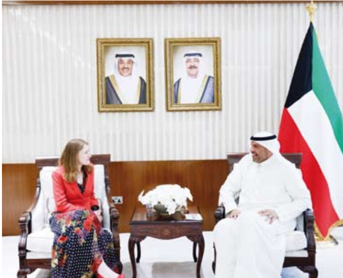
وزير الخارجية يستقبل سفيرة المملكة المتحدة بليندا لويس

السفيرة من جهود متميزة وإسهامات بارزة في تعزيز أواصر العلاقات الثنائية المتميزة بين دولة الكويت وكندا، معرباً عن شكره وتقديره لما قدمته من دعم لتطويع هذه العلاقات، وتمنياً لها التوفيق والنجاح في مهامها المستقبلية.