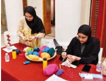
جانب من ورشة العمل

نظم بيت السدو، أول أمس، ورشة عمل بعنوان «التطريز بتقنية إبرة النفاش» ضمن فعاليات مهرجان «صيفي ثقافي 17» الذي ينظمه المجلس الوطني للثقافة والفنون والآداب.