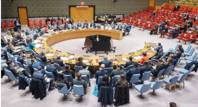
جانب من جلسة مجلس الأمن بشأن السويداء السورية

«كأننا ما كان انتماءهم العرقي أو الديني» مشددا على عدم إمكانية تحقيق التعافي الحقيقي في سوريا من دون تدابير حقيقية لتوفير الأمان والحماية للسوريين كافة. ورحب المجلس بالبيان الذي أصدرته السلطات السورية المؤقتة وأعلنت فيه إنهائها أعمال العنف واتخاذ إجراءات التحقيق فيها ومحاسبة المسؤولين عنها داعيا إلى ضمان إجراء تحقيقات موثوقة وسريعة وشفافة ونزيهة وشاملة وفق المعايير الدولية. وأكد في هذا المجال التزامه القوي بسيادة الجمهورية العربية السورية واستقلالها ووحدتها وسلامة أراضيها مهييا