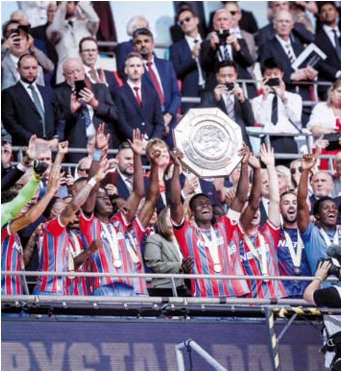
كريستال بالاس يحقق لقب درع الاتحاد الإنجليزي لأول مرة في تاريخه

فتح نادي توتنهام الإنجليزي لكرة القدم، مفاوضات مع مانشستر سيتي، لعب سافينيو على اللاعب الدولي البرازيلي سافينيو. وذكرت وكالة الأنباء البريطانية أن توتنهام في حاجة ماسة إلى تعزيز هجومه بعد رحيل سون هيونغ مين إلى لوس أنجلوس إف سي الأمريكي وإصابة جيمس ماديسون الخطيرة في ركبته، وفشلت محاولات توتنهام في ضم قائد فريق توتنهام فورست مورغان غيبس وأيت الشهر الماضي، ونقل توتنهام انتباهه إلى المهاجم سافينيو، متعدد المواهب، ولكن مانزال المفاوضات مع مانشستر سيتي في مرحلة مبكرة. وانضم الجناح البرازيلي سافينيو لمانشستر سيتي في صيف 2024 ولعب 48 مباراة في موسمه الأول تحت