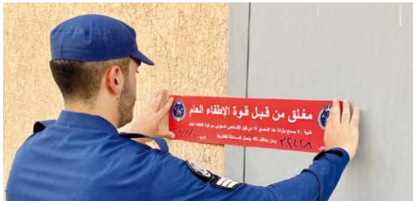
إغلاق محل مخالف من قبل الإطفاء

نفذت قوة الإطفاء العام صباح أمس حملة تفتيشية في منطقة صناعية الجهراء وذلك بالتعاون مع عدة جهات حكومية وهم وزارة الكهرباء والماء ووزارة التجارة والهيئة العامة للصناعة والهيئة العامة للبيئة وبلدية الكويت، وتهدف الحملة إلى رصد المباني والمنشآت المخالفة