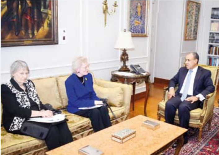
لقاء وزير الخارجية المصري مع وفد من (مجموعة الحكماء)

أرضهم وتصفية القضية الفلسطينية مشددا على أنه لا أمن ولا استقرار للمنطقة دون تجسيد الدولة الفلسطينية. واستعرض الجهود التي تبذلها مصر من أجل التوصل لإيقاف إطلاق النار في غزة