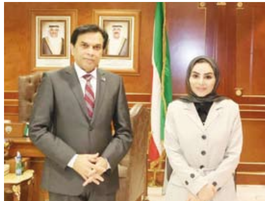
د. أمثال الحويلة وسفير باكستان د. ظفر إقبال

وقالت وزيرة الشؤون الاجتماعية وشؤون الأسرة والطفولة، الدكتورة أمس، مع سفير باكستان لدى دولة الكويت الدكتور ظفر إقبال، سبل تعزيز التعاون المشترك.