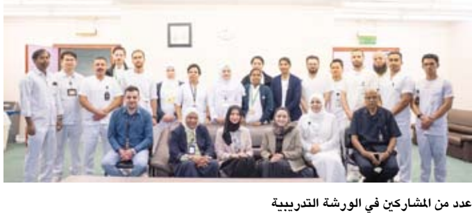
عدد من المشاركين في الورشة التدريبية

ذكرت وزارة الصحة في بيان لها، أن ورشة "تدريب الصحة النفسية والإدمان" تعقد بمشاركة أستاذة زائرة من الجامعة الأردنية لتكون فاني النفسية متخصصة في مجال الصحة النفسية تنظّمها الإدارة هذا العام ضمن خطة تدريبية تستهدف رفع كفاءة الكوادر التدريبية في مختلف المجالات التخصصية.