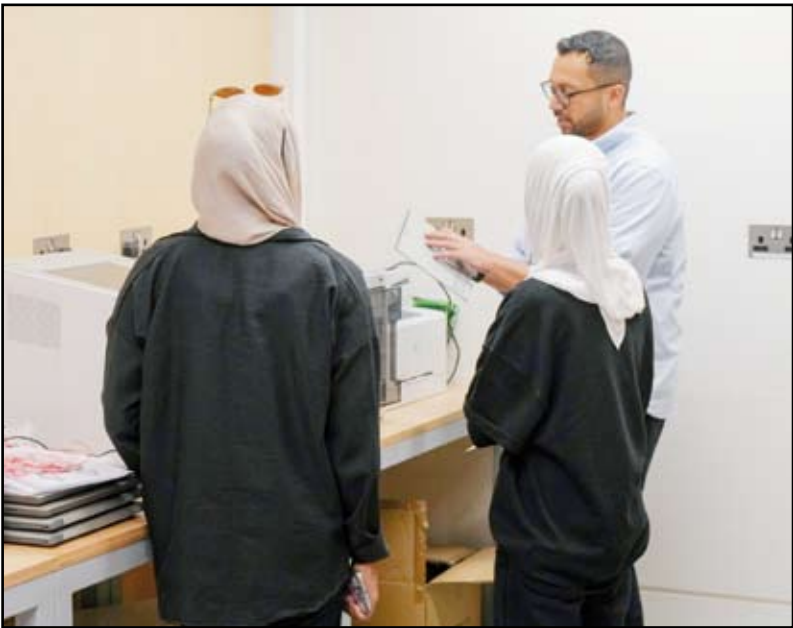
جانب من التدريب

سبب هذا التراجع اللافت يعود إلى التعديلات التي أجريت مؤخراً على قانون المرور، ورفع قيمة الغرامات لجميع المخالفات خاصة الجسيمة مثل تجاوز السرعة أو الإشارة الضوئية.