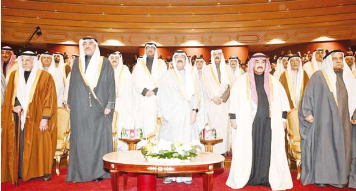
سمو أمير البلاد يتقدم الحضور