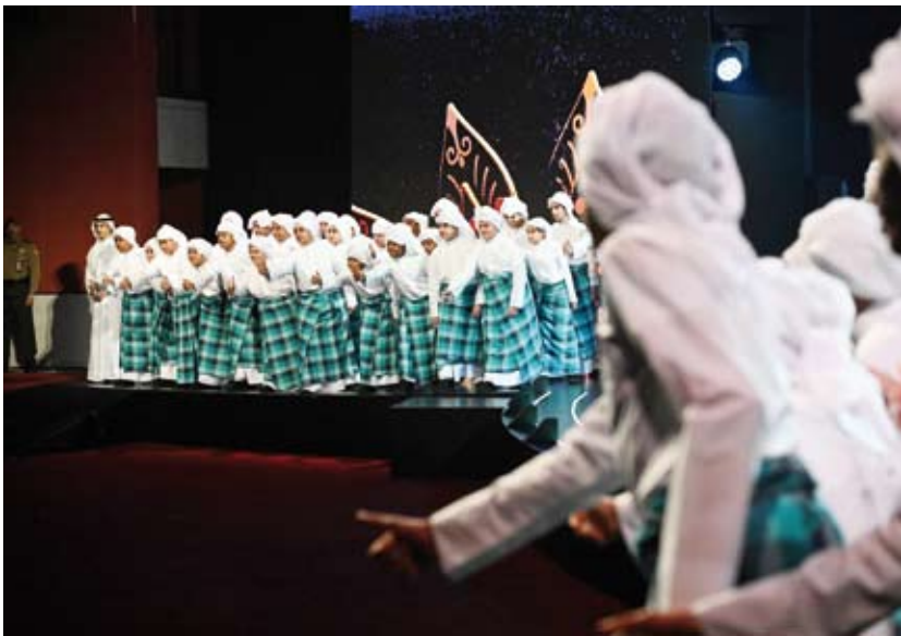
جانب من فقرات الأوبريت