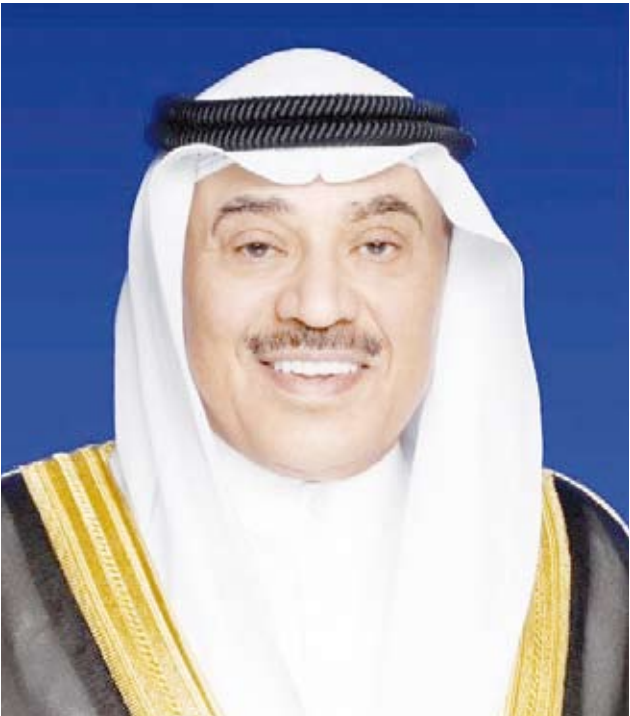
سمو ولي العهد الشيخ صباح الخالد