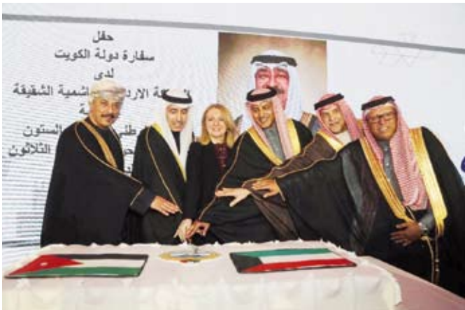
جانب من حفل الأعياد الوطنية لسفارة الكويت لدى الأردن