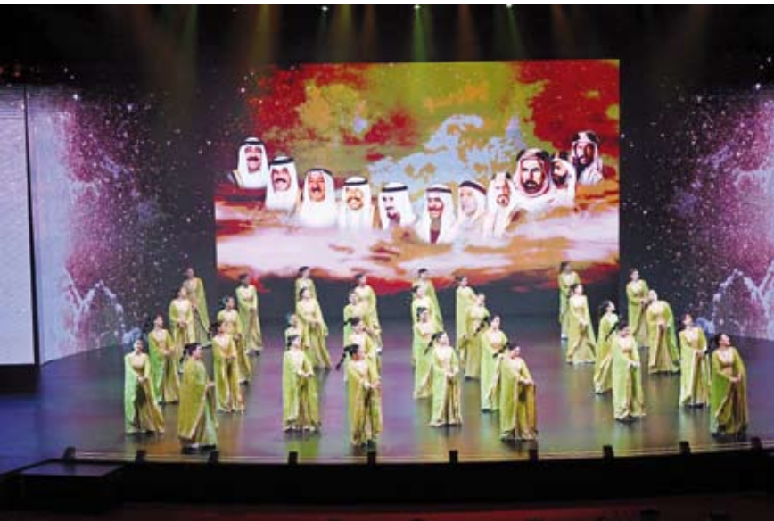
أوبريت السور الخامس

أنبأه بكل دفي و عطاء والذي استطاع بمواجهته لكافة التحديات والصعاب أن يثبت أنه وطن قادر على تجاوز المحن منذ بداية مسيرته ليظل رمزاً للخير والعطاء بفضل أسواره الثلاثة التي جسدت روح الوحدة الوطنية والانتماء للوطن، وسوره الرابع الذي مثل وثيقة الوفاء بين الحاكم والمحكوم بعد العدوان الغاشم على البلاد، وسور الوطن الخامس وحاميهِ والعين الساهرة لحفظ أمن وأمان هذا البلد صاحب السمو أمير البلاد الشيخ مشعل الأحمد. وقد تم تقديم هدية تذكارية لسموه بهذه المناسبة، وغادر سموه مكان الحفل بمثل سموه الذي يحتضن على مر العصور والتاريخ