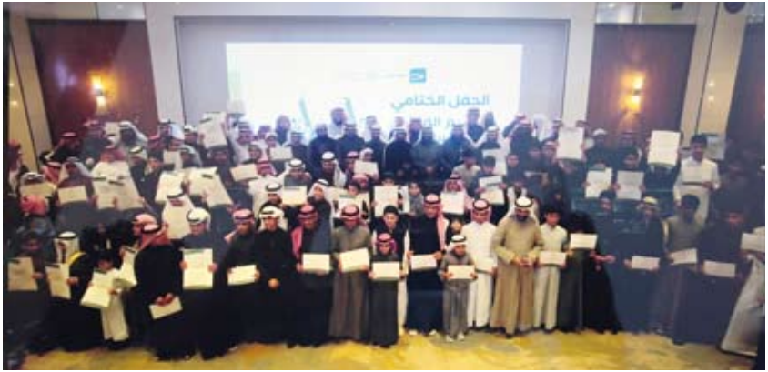
لقطة جماعية للمكرمين

بأخلاقه، ليتجلى أثر حفظه في سلوكه وحياته، مشيراً إلى أن من أعظم ثمار حفظ القرآن صلاح الأبناء وبرهم بوالديهم في حياتهم وبعد مماتهم. يذكر بأن الحفل أقيم في فندق ومركز مؤتمرات ميلينيوم برعاية كريمة من إدارته، وسط أجواء مفعمة بالفرحة والبهجة، حيث تم تكريم جميع المشاركين التكريمية للحفظ والمشاركين 38 عود، وشركة عطورات الطارش، الذين قدموا الهدايا التكريمية للحفظ والمشاركين في مركز الصفاء القرآني ومسابقة الكويت الكبرى لحفظ القرآن الكريم.