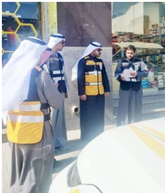
فرق البلدية في الشويخ الصناعية

المخالفات المرصودة واتخاذ الإجراءات اللازمة بشأنها وقد أسفرت عن توجيه 350 إنذار و تحرير 12 مخالفة وتم تعديل الوضع 82 محل والاستجابة للإنذار على مخالفات البناء على سكن استثماري في منطقة الشويخ الصناعية .