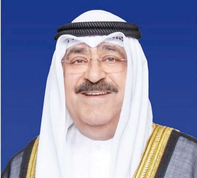
سمو أمير البلاد الشيخ مشعل الأحمد