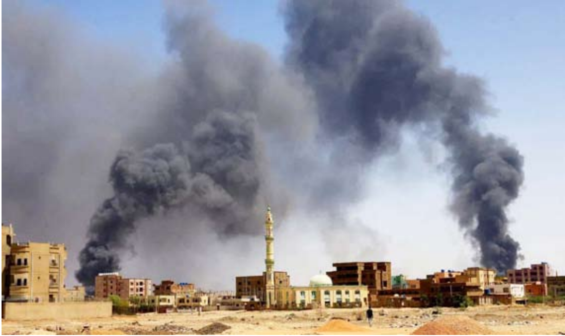
الجيش السوداني حرباً ضد «الدعم السريع» منذ عامين

وفق بيان للخارجية المصرية، أكد عبد العاطي، خلال الاتصالين، العلاقات الوثيقة التي تربط مصر بكل من جمهورية الكونغو الديمقراطية وجمهورية رواندا، والاهتمام الذي توليه مصر لتعزيز مسارات التعاون الثنائي في المجالات المختلفة مع البلدين الصديقين، والتطلع للارتقاء بمستوى العلاقات الثنائية. وأكد عبد العاطي ضرورة اتخاذ خطوات عملية لرفع المعاناة الإنسانية المتفاقمة عن سكان منطقة شرق الكونغو، منوهاً إلى استعداد مصر لتقديم أي دعم ممكن للتخفيف من حدة الأزمة.