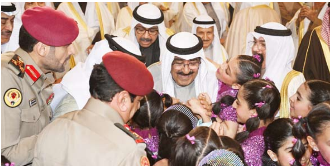
صاحب السمو حرص على تحية المشاركات في الأوبريت