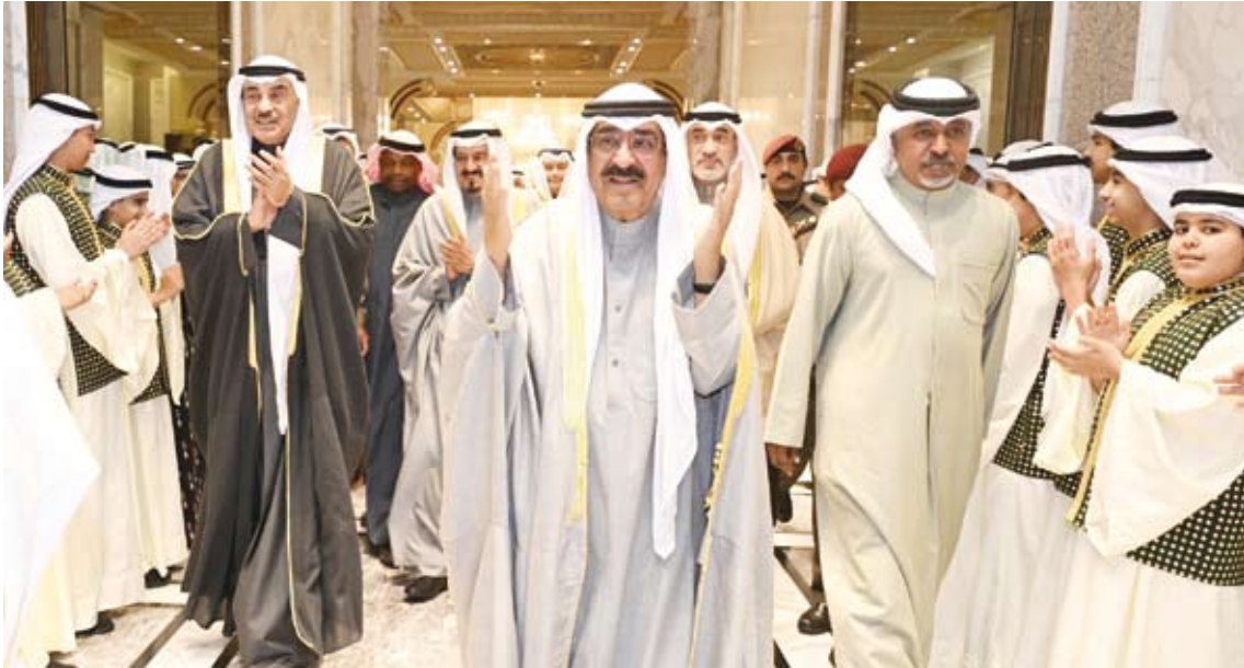
وسموه يحيي الحضور