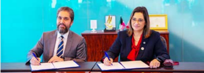
الحجاج وعلم الدين خلال توقيع الاتفاقية

ضمن مساعيها المتواصلة لتأهيل وتمكين الشباب، وباعتباره وجهة مفضلة للعمل في القطاع المالي الكويتي، وقع بنك الخليج اتفاقية شراكة استراتيجية مع جامعة الخليج للعلوم والتكنولوجيا (GUST) لتعزيز الفرص التدريبية والوظيفية للطلاب. بموجب الاتفاقية، سيقدم بنك الخليج برامج تدريبية متميزة لطلاب جامعة الخليج للعلوم والتكنولوجيا في مجالات مصرفية متنوعة، مما يمكنهم من تطبيق معرفتهم الأكاديمية في بيئة عمل حقيقية. بالإضافة إلى ذلك، سيأخذ بنك الخليج في اعتباره أفضل المواهب من جامعة الخليج للعلوم والتكنولوجيا لتوفير فرص عمل لهم في البنك بعد التخرج.