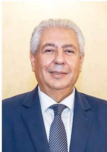
السفير اسامه شلتوت

أكد السفير المصري أسامة شلتوت، سفير جمهورية مصر العربية لدى دولة الكويت الشقيقة، أن الزيارة الرسمية التي قام بها رئيس مجلس الوزراء الدكتور مصطفى مدبولي إلى الكويت يومي 22-22 فبراير الجاري شهدت مناقشات مثمرة حول سبل تعزيز التعاون المشترك بين البلدين في مختلف المجالات، كما تناولت الزيارة عدداً من القضايا ذات الاهتمام المشترك، ما يعكس عمق العلاقات التاريخية والأخوية بين البلدين الشقيقين. وأعرب السفير شلتوت عن بالغ امتنانه لحفاوة الاستقبال وكرم الضيافة من الجانب الكويتي، معرباً عن تطلع مصر إلى مشاركة كويتية رفيعة المستوى في القمة العربية المقرر