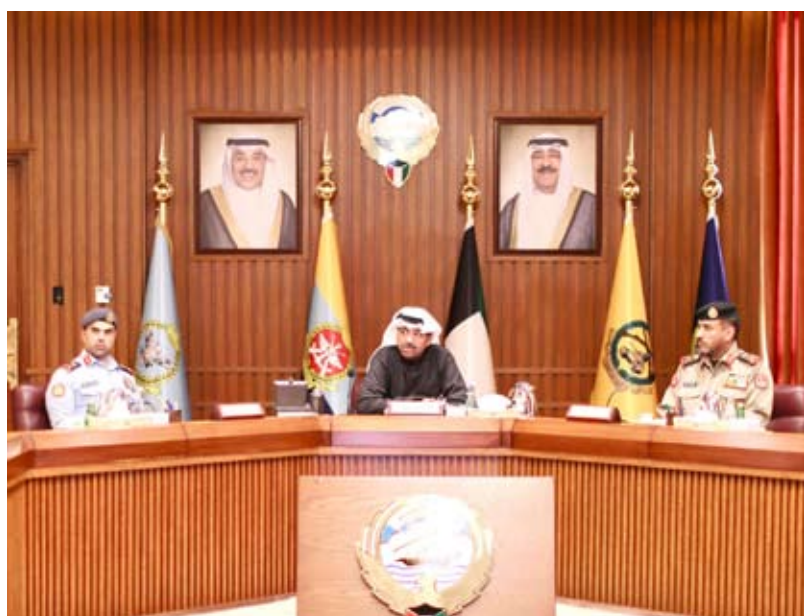
العلي خلال اجتماعه بكبار القادة العسكريين أكد ضرورة تعزيز التعاون وتسريع وتيرة الإنجاز

ترأس وزير الدفاع الشيخ عبدالله العلي أمس اجتماعاً ضم كبار القادة العسكريين بحضور نائب رئيس الأركان العامة للجيش الكويتي اللواء الركن طيار صباح جابر الأحمد حيث تم بحث واستعراض العديد من البرامج والخطط المعدة لمختلف القطاعات العسكرية. وأكد العلي في بيان صحفي صادر عن الوزارة حرص الدفاع على العمل وفق توجيهات صاحب السمو أمير البلاد ، داعياً إلى ترسيخ قواعد العدالة والحيادية واتخاذ الإجراءات القانونية للمحافظة على المال العام ، وتعزيز التعاون والتنسيق بين مختلف قطاعات الجيش الكويتي والحرص على مواكبة التطور الحاصل في مجال التسليح والتجهيز العسكري.