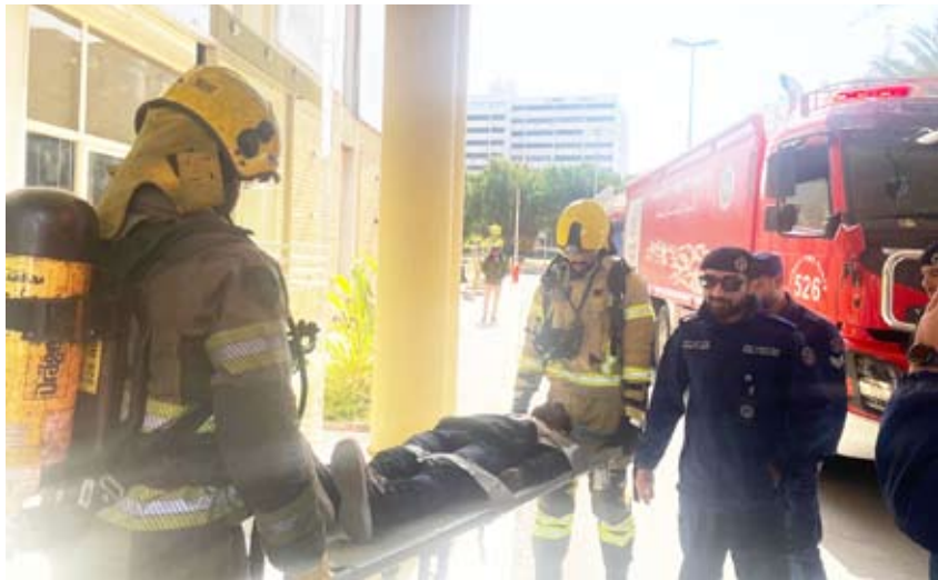
جانب من تمرين الإطفاء

ضمن سيناريو التمرين . وتأتي هذه التدريبات التي تقوم بها قوة الإطفاء العام للتعامل السريع مع مثل هذه الحوادث وذلك لحماية الأرواح والممتلكات وتحقيق الأمن المجتمعي في البلاد.