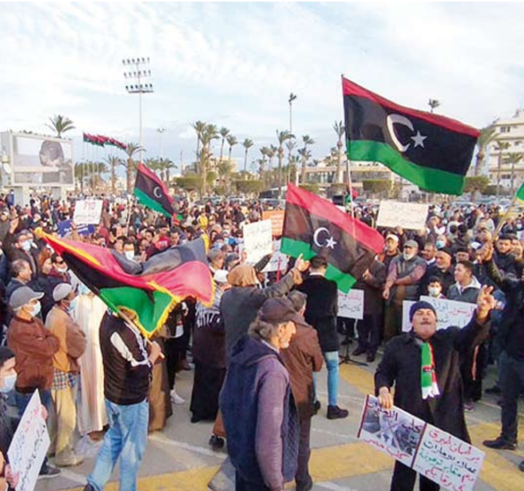
احتجاجات سابقة في ليبيا

دعا «حراك شبابي» ليبي، السلطة التنفيذية، إلى سرعة إجراء انتخابات نيابية في البلاد، مبدياً تسكعاً برحيل جميع الأجسام السياسية الحاكمة عن مناصبها «فسوراً». وأعلنت مجموعة شبابية أطلقت على نفسها «حراك شباب مصراتة»، و«تجمع ساحات الثورة» بالمدينة، أنها ستستأنف التظاهر السلمي في الشوارع والميادين الليبية، بعد توقفها عن ذلك لمدة شهر، رغبة منها في توحيد الأهداف، وصياغة مشروع حقيقي للوصول إلى الانتخابات.