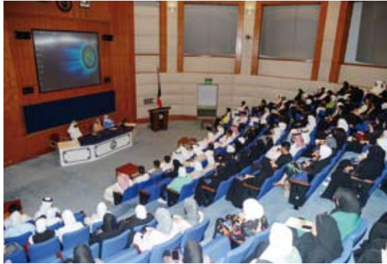
جانب من اللقاء التنويري

من شأنها تسهيل مهمة الطلبة الأكاديمية في الجامعة.