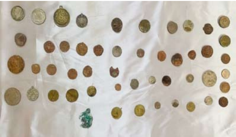
القطع أثرية ومسكوكات

وتسليمها والإبلاغ عنها للأجهزة المختصة للمحافظة عليها من السرقة والعبث بها. جدير بالذكر أن نينوى الأثرية هي مدينة أثرية قديمة، تعتبر من أقدم وأعظم المدن في العصر القديم، تقع في شمال العراق على الضفة اليمنى لنهر دجلة وكانت عاصمة الإمبراطورية الآشورية، وكانت من أكبر مدن العالم في فترة الإمبراطورية الآشورية الحديثة، وقد دمرت نينوى بعد معركة نينوى 612 ق.م.