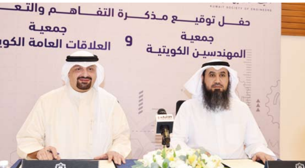
جانب من توقيع مذكرة التفاهم

الاتفاقية التزامات قانونية أو مالية بين الطرفين فهي تهدف إلى تسهيل وتطوير عملية تبادل الخبرات والاستشارات بين الطرفين.