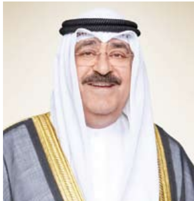
سمو ولي العهد الشيخ مشعل الأحمد

استقبل سمو ولي العهد الشيخ مشعل الأحمد، بقصر بيان، صباح أمس، سمو الشيخ أحمد النواف رئيس مجلس الوزراء، واستقبل سمو ولي العهد، نائب رئيس مجلس الوزراء ووزير الدفاع ووزير الداخلية بالوكالة الشيخ طلال الخالد.