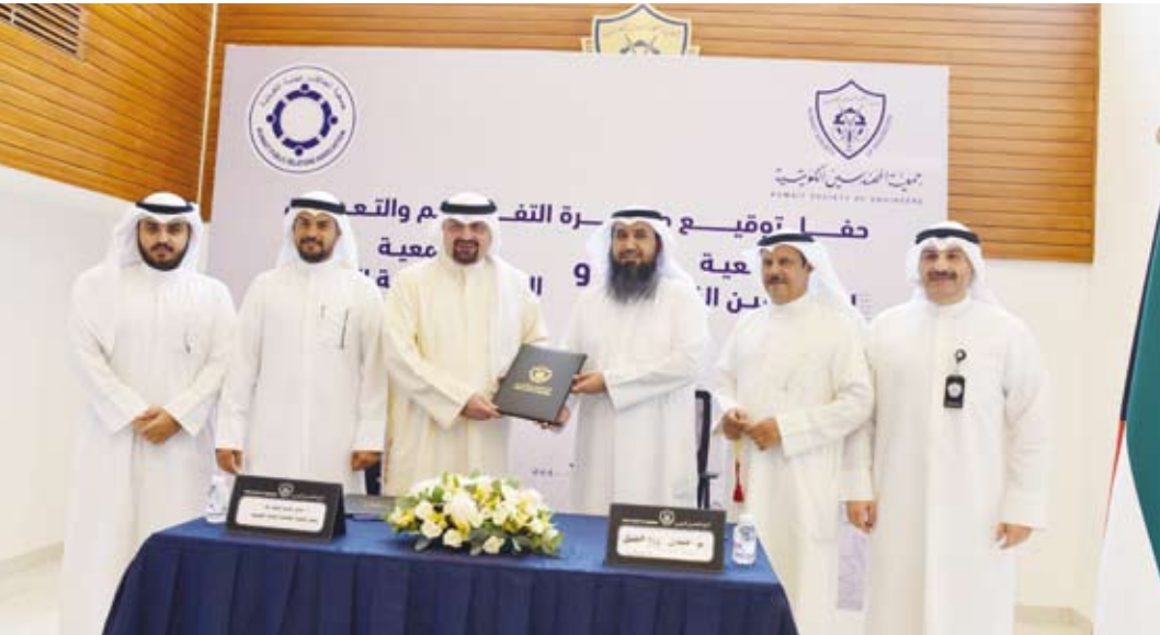
العتل والنصر يتبادلان وثائق المذكرة بمشاركة المهندسين