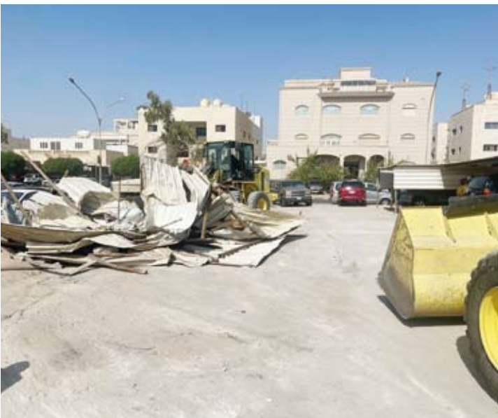
إزالة مخالفات على أملاك الدولة

من جهة أخرى، واصلت الفرق الرقابية حملة الكشف على سراديب مستغلة تجارياً عبر تكثيف جولاتها الميدانية في المناطق الاستعمارية، حيث نفذ الفريق الرقابي بمحافظة حولي جولة ميدانية، أسفرت عن غلق 3 سراديب قامو باستغلال العقار في غير الغرض المرخص له بمنطقة السالمية.