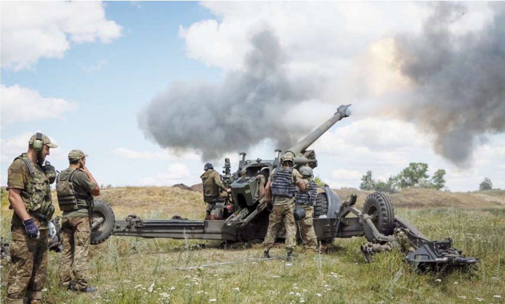
المعارك في أوكرانيا

تستهدف أوكرانيا الجنود الروس الذين يطلقون النار على أكبر محطة للطاقة النووية في أوروبا أو يستخدمونها قاعدة لإطلاق النار.