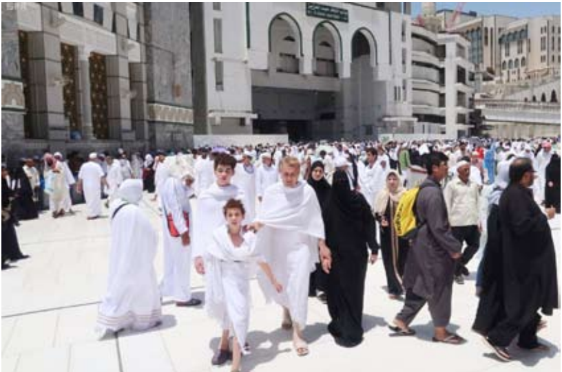
السماح باصطحاب الأطفال في العمرة

تزيد أعمارهم عن خمسة أعوام الحصول على تصريح عبر تطبيق «اعتمرنا»، وفقا للوزارة. وزفت الوزارة البشرى لضيوف الرحمن في إنفوجرافيك توضيحي نشرته على حسابها في «تويتر» لأطفالكم أقل من 5 سنوات، بإمكانكم اصطحابهم معكم دون الحاجة لاستخراج تصريح خاص بهم.