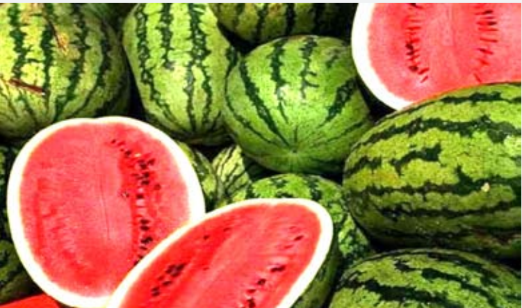
البطيخ كان مرّاً وقاتلاً

وأوضح الباحثون أن الدراسة وجدت أن تغير المناخ الذي يزيد من موجات الحرارة وفرص الحرائق والجفاف يمكن أن تكون له آثار سلبية على المحاصيل الغذائية، حيث إنه يمكن أن يزيد من إفراز مادة "كوكربيتاسين" في كافة الثمار القرعية مثل البطيخ والخيار والقرع والكوسة.