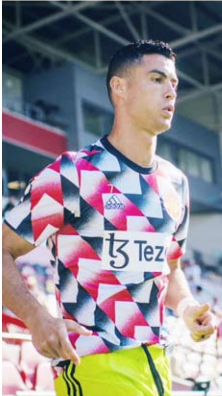
هزيمة ثانية قاسية لرفقاء رونالدو

وأصبح رصيد سيتي، الذي انتصر 2–صفر على وست هام يونايتد في الجولة الافتتاحية، ست نقاط من أول جولتين في صدارة المسابقة، مقابل الأخيرتان بفوز رايبو فاينكسو –1صفر. وقال بيب غوارديولا مدرب سيتي «نحن كفريق قدمنا أداء رائعاً. لقد دافع المنافس بشكل متكتل وبمسافات متقاربة».