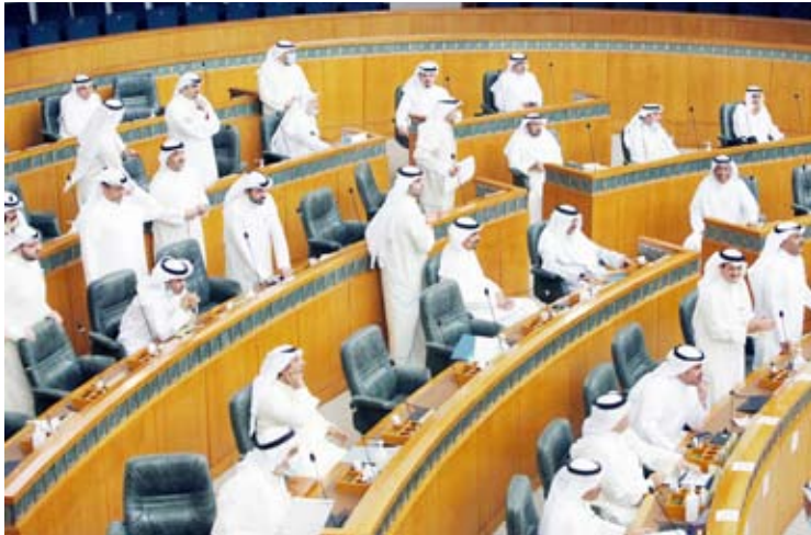
أحدى جلسات مجلس الأمة

توافر المواصفات الفنية العالمية لهذه المدن وتوافقها مع الاتفاقيات الدولية ومعايير حقوق العمال. دراسة قضية رفع أسعار الأعلاف المدعومة وغير المدعومة وآثار هذه الزيادة السلبية على الأمن الغذائي والاقتصادي، على أن تقدم اللجنة تقريرها خلال شهر. مناقشة موضوع الأمن الغذائي. متابعة إجراءات الحكومة نحو التوصيات الواردة في التقرير الأول للجنة الصادر في دور الانعقاد الرابع من الفصل التشريعي السابق، بشأن دعم المنتج الزراعي المحلي وزيادة قيمة الدعم المخصص للمزارعين.