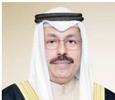
سمو الشيخ أحمد النواف

بعث سمو الشيخ أحمد النواف رئيس مجلس الوزراء، ببرقية تعزية إلى الرئيس عبدالفتاح السيسي رئيس جمهورية مصر العربية الشقيقة، ضمنها سموه خالص تعازيه وصادق مواساته لفخامته ولأسر ضحايا حادث الحريق الذي اندلع في كنيسة (أبوسيفين) غرب العاصمة القاهرة. من جهة أخرى، بعث سمو الشيخ أحمد النواف رئيس مجلس الوزراء، تهنئة إلى الرئيس الدكتور عارف علوي رئيس جمهورية باكستان الإسلامية الصديقة بمناسبة ذكرى استقلال بلاده.