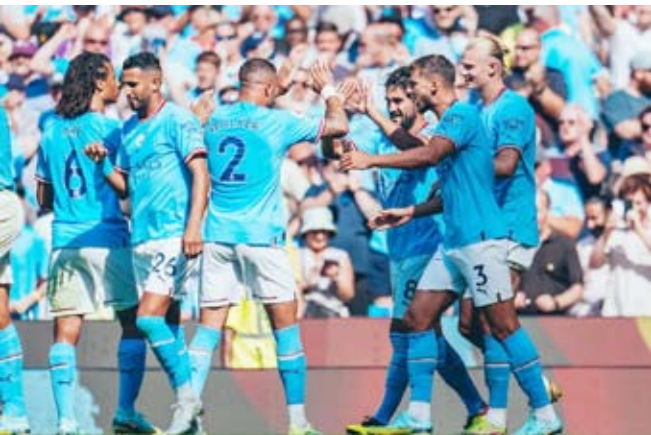
تألق كبير لأبناء غوارديولا

وأضاف «بدأنا بشكل رائع حقاً وصنعنا الفرص. لا يكون الأمر سهلاً في الطقس الحار لأسباب عديدة. تحركنا بشكل جيد بدون كرة، وعند الاستحواذ على الكرة تحليلنا بالصبر وصنعنا الفرص».