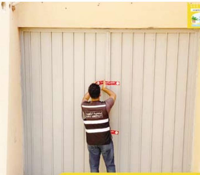
إغلاق أحد السراديب في منطقة السالمية