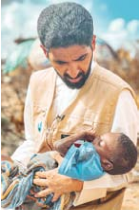
أهالي الصومال بحاجة إلى إغاثة عاجلة

للتخفيف من أعباء المحتاجين. وأوضح الشامري أن الصومال يعد من أكثر البلدان تأثراً بالجفاف في القرن الإفريقي، على مشارف أزمة مجاعة تهدد نحو 7.1 مليون شخص أي نصف سكان البلاد، وتسببت موجة الجفاف في إتلاف محاصيله الزراعية وتحويل أراضيه إلى مساحات قاحلة، فيما أجبر انعدام الغذاء أكثر من نصف مليون صومالي على النزوح بينما ارتفعت معدلات سوء التغذية لأعلى مستوياتها بين الأطفال دون السنوات الخمس، ليصل عدد الذين يهددهم خطر الموت لـ 1.4 مليون طفل. وحثت نساء الخيرية أهل الخير والمحسنين القيام بواجبهم الأخوي الإنساني من خلال التبرع لصالح إخوانهم المتضررين من الجفاف والإسهام في إنقاذ حياة هؤلاء الفقراء والمحتاجين من شبح الجوع وسوء التغذية والتخفيف من معاناتهم ومواصلة دعم جهود نماء الخيرية الميدانية العاجلة، داعية الله سبحانه وتعالى أن يتقبل من المحسنين صالح أعمالهم.