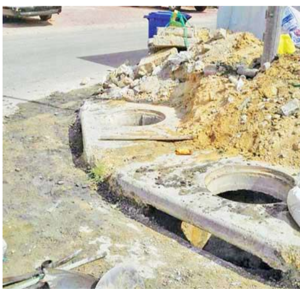
مخلفات في مناهيل

أهابت وزارة الأشغال العامة بالمواطنين والمقيمين رمي المخلفات في الأماكن المخصصة من أجل المصلحة العامة، ولتجنب إغلاق مناهيل الصرف الصحي.