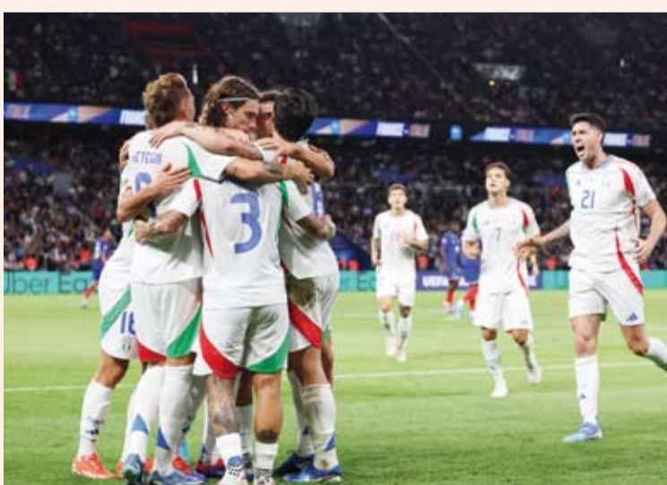
فوز تاريخي لإيطاليا على فرنسا

لينتهي الشوط الأول بالتعادل 1-1. وفي الشوط الثاني سجل المنتخب الإيطالي الهدفين الثاني والثالث عن طريق دافيد فراتسي في الدقيقة 51 وجاكومو راسبادوري وكانت آخر مباراة رسمية تواجها فيها إيطاليا مع فرنسا في عام 2008 في دور مجموعات كأس أوروبا حينها فازت بفئائية ولعب الفريقان بعدها 3 مباريات ودية جميعها خسرتها إيطاليا.