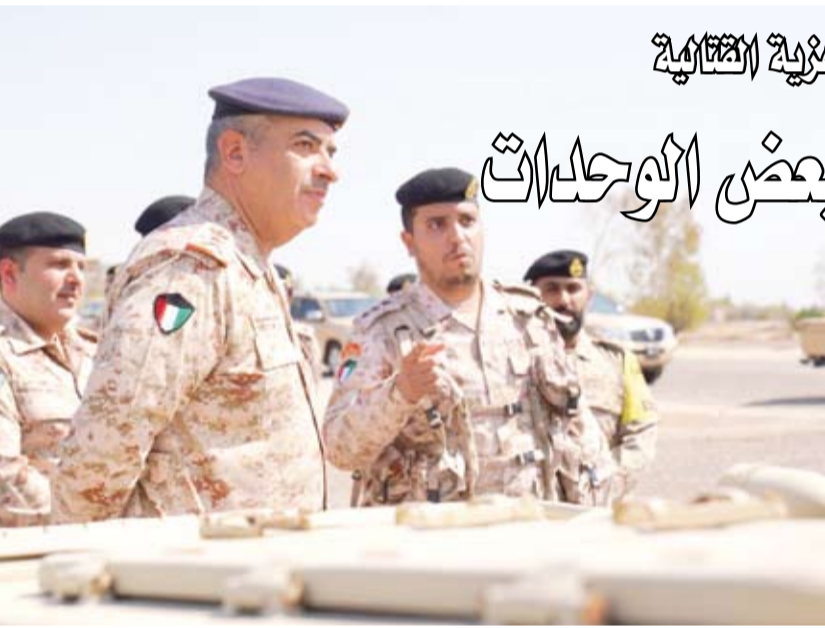
الفريق الركن طيار بنذر المزين في جولة تفقدية سابقة

بعث صاحب السمو أمير البلاد الشيخ مشعل الأحمد، ببرقية تهنئة إلى الرئيس لويس إيناسيو لولا دا سيلفا رئيس جمهورية البرازيل الاتحادية الصديقة، عبر خالص تهنئيه بمناسبة العيد الوطني لبلاده، متمنياً سموه لفخامته موفور الصحة والعافية ولجمهورية البرازيل الاتحادية وشعبها الصديق كل التقدم والازدهار.