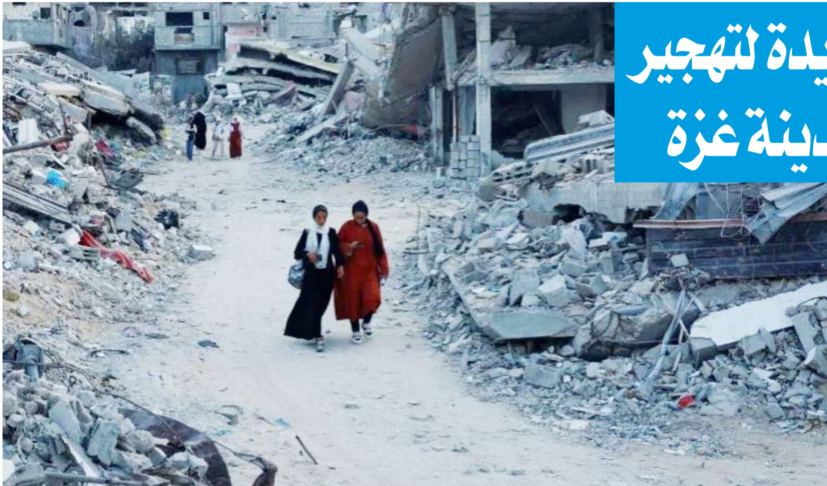
فلسطينيون يسبرون وسط أنقاض المباني التي دمرتها غارة إسرائيلية في خان يونس بجنوب قطاع غزة (رويترز)

قالت صحيفة يديوتس آحرنون الإسرائيلية إن الجيش يدرس خطة لتهجير ما تبقى من فلسطينيين شمال غزة، وذلك بهدف تضيق الخناق على المقاومة هناك ودفعها لمواجهة خيار الموت أو الاستسلام. ووفقاً للمراسل السياسي للصحيفة إيتيمار آيخزر، فقد عقد رئيس الوزراء بنيامين نتانياهو أمس جلسة نقاش إستراتيجي وعصف ذهني مع مسؤولين بالجيش من أجل تحقيق تقدم في الحرب على غزة، في ضوء استمرار تعثر مفاوضات صفقة الأسرى. وقال إن النقاش تناول «صفقة تبادل الأسرى، وعوامل الضغط التي تهتم إسرائيل بتوليها من أجل تحقيق أفضل المكاسب وزيادة الضغط على حماس، وفرض ثمن عليها بسبب موت الرهائن الستة الذين كانوا بحوزتها الأيام الماضية، بما في ذلك زيادة حدة وكثافة الهجمات ضدها على اعتبار أن ذلك ربما سيغريها إلى طاوله المفاوضات». وأكد المراسل أن «النقاش أثار احتمال أن يضطر الجيش إلى إعداد المرحلة الرابعة من خطته ذات المراحل الثلاث في غزة، إذ تركز المرحلة الحالية (الثالثة) من القتال على الغارات المتكررة على مقاتلي حماس والبنية التحتية لها، ويجري الآن النظر في مرحلة أخرى، وهي أساساً طرد السكان من شمال قطاع غزة ومن ثم محاصرة المقاتلين».