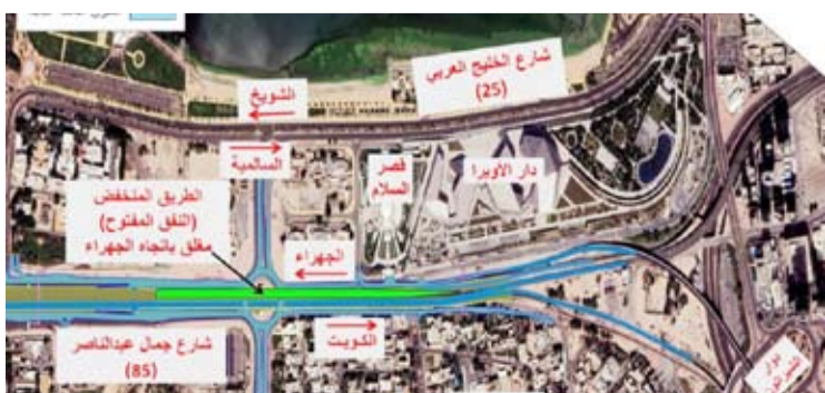
مخطط طريق جمال عبد الناصر

وحيث ظهرت الحاجة إلى الترخيص لمستثمري القسائم الصناعية لعمل مكاتب إدارية خاصة بهم في القسائم التي يستأجرونها، لذا فإنني أقترح الآتي: التنسيق بين البلدية وكل من الهيئة العامة للصناعة وقوة الإطفاء العام للسماح لمستثمري القسائم الصناعية بترخيص الطابق الأول من المبنى «مكتب إداري».