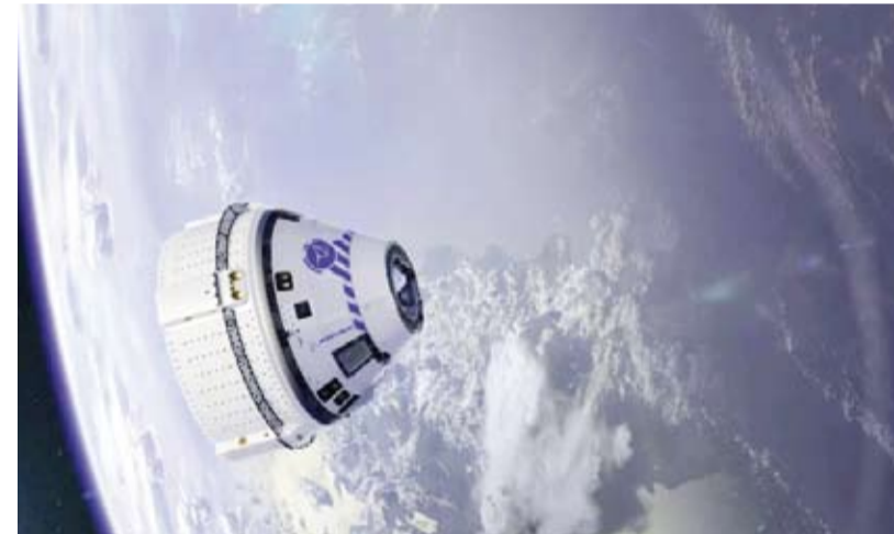
مركبة الفضاء «ستار لاينر»

محطة الفضاء الدولية في يونيو، بينما تسبب نفس نظام الدفع في حدوث عدة تسريبات للهيليوم والذي يستخدم لزيادة ضغط المحركات. وتأمل بوينج في استعادة كبسولة «ستار لاينر» بعد هبوطها في نيو مكسيكو ومواصلة تحقيقاتها في سبب فشل المحركات الدافعة في الفضاء.