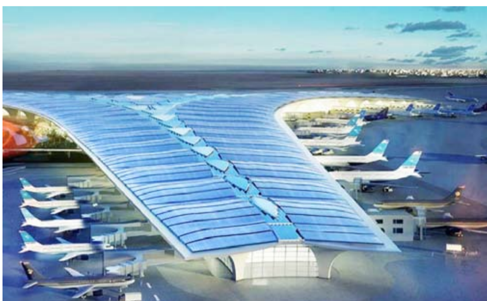
مبنى المطار T2

وصمم المطار لتسهيل عملية سير الركاب، فمن منطقة البهو المركزي إلى آخر نقطة تستغرق مشي ما بين 7 و10 دقائق، وكل ضلع يتكون من منطقة الأسواق الحرة التي تتكون من مطاعم ومحلات تجارية وفي الطابق الأعلى منطقة استراحة المسافرين. وتبلغ مساحة مبنى الركاب الرئيسي أكثر من 700 ألف متر