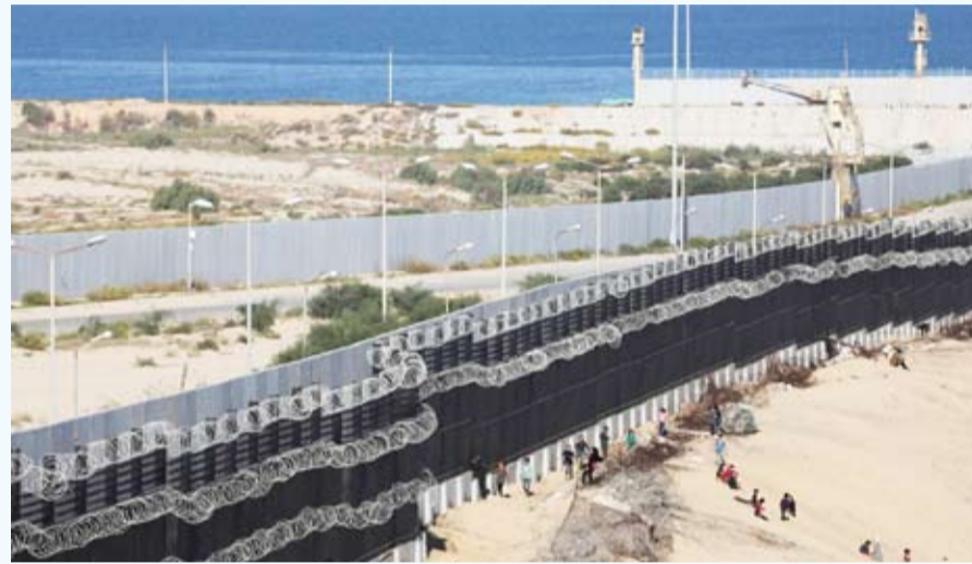
محور فيلادلفيا حجر عثرة أمام التوصل لاتفاق وقف إطلاق النار

يشكل الخلاف بشأن محور صلاح الدين أو فيلادلفيا حجر عثرة في طريق التوصل لاتفاق لوقف إطلاق النار بين الاحتلال وحرمة حماس في الحرب الدائرة منذ نحو 11 شهراً. ويقول رئيس وزراء الاحتلال بنيامين نتانياهو إنه يحتاج لإبقاء قوات في ذلك المحور كي لا يصبح شريان حياة لحماس من خلال تهريب الأسلحة لداخل القطاع. وأظهرت صور التقطت بالأقمار الاصطناعية قيام قوات الاحتلال بتعبيد طريق رئيسي في قطاع غزة على طول محور فيلادلفيا، الطريق يمتد لمسافة 6 كيلومترات ونصف تقريبا، انطلاقاً من الساحل على طول السياج الحدودي.