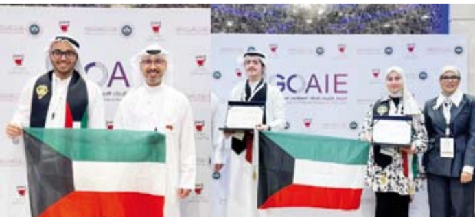
طالبة الكويت حققوا مراكز متقدمة للتعليم الخاص.

فلسطين التابعة لمنطقة حولي التعليمية. وقد تم تكريم جميع الفائزين بالمراكز الأولى من قبل وزير التربية والتعليم في مملكة البحرين ومدير مكتب التربية