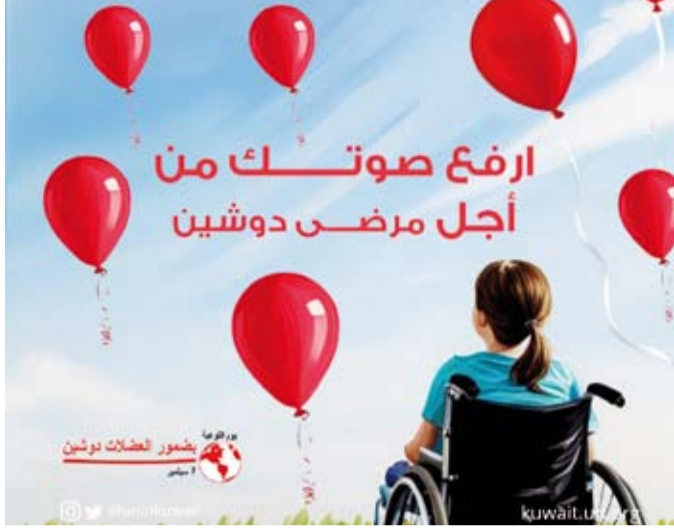
شعار الاحتفال باليوم العالمي للتوعية بمرض «دوشين»