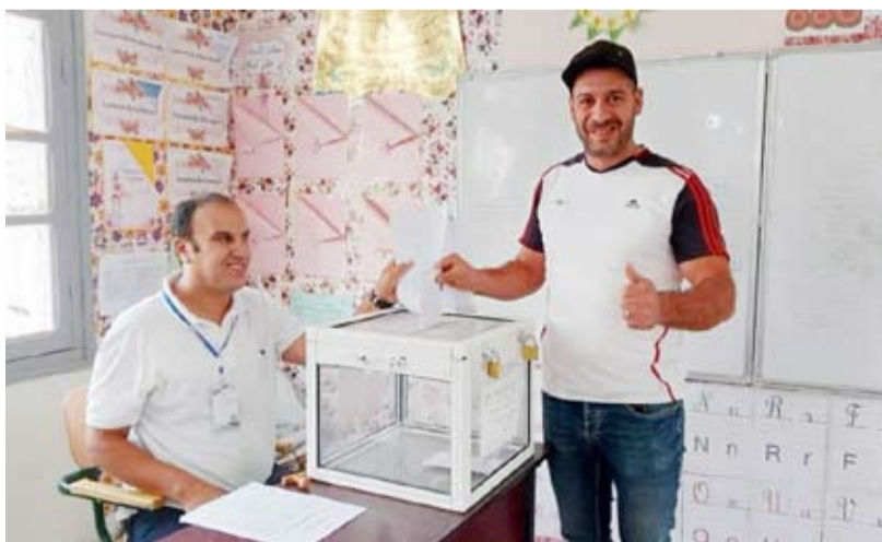
أحد الجزائريين مدلياً بصوته في الانتخابات الرئاسية

انطلقت عملية الاقتراع للانتخابات الرئاسية في الجزائر أمس والتي يتنافس فيها ثلاثة مرشحين بينهم الرئيس الحالي عبدالمجيد تبون الذي يسعى إلى ولاية جديدة مدتها خمس سنوات. وتشير بيانات السلطة الوطنية المستقلة للانتخابات إلى أن عدد الناخبين الذين يحق لهم التصويت في الانتخابات يقدر بنحو 24 مليون شخص بينهم 47 بالمائة إناثاً و53 بالمائة ذكورا. كما يتنافس في الانتخابات المرشحان عن حزب (جبهة القوى الاشتراكية) يوسف أوشيش وعن (حركة مجتمع السلم) عبدالعالي شريف بالإضافة إلى المرشح الحر تبون. وأكدت السلطة الوطنية المستقلة للانتخابات في وقت سابق استعدادها التام لتنظيم