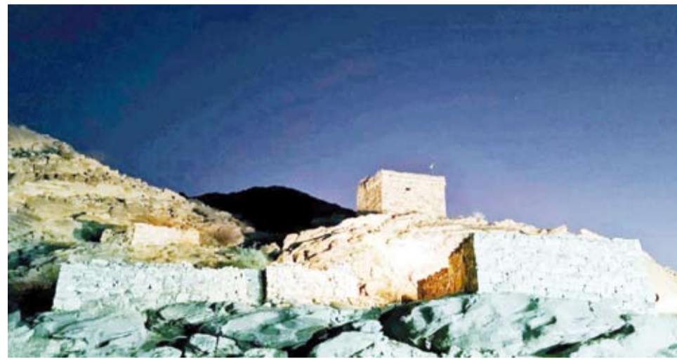
سوق جمعة بني هلال الأثري

تقف اطلال سوق جمعة بني هلال الأثري، في المملكة العربية السعودية، شاهدة على مكانة هذا السوق الواقع شرق محافظة الليث، ومعبره عن دوره الحيوي الذي يشكل رافداً اقتصادياً مهماً لأهالي المنطقة ومصدراً للرزق على مدار العام منذ 400 عام.