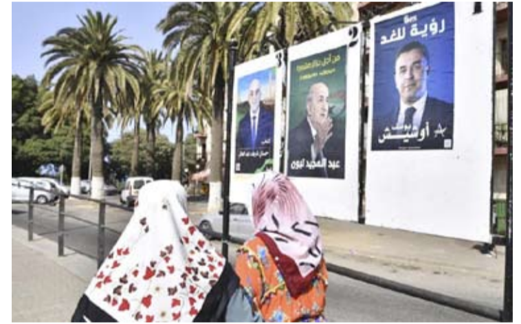
3 مرشحين يتنافسون على منصب الرئيس وتيون الأوفر حظاً

انطلقت عملية الاقتراع للانتخابات الرئاسية في الجزائر أمس والتي يتنافس فيها ثلاثة مرشحين بينهم الرئيس الحالي عبدالمجيد تبون الذي يسعى إلى ولاية جديدة مدتها خمس سنوات. وتشير بيانات السلطة الوطنية المستقلة للانتخابات إلى أن عدد الناخبين الذين يحق لهم التصويت في الانتخابات يقدر بنحو 24 مليون شخص بينهم 47 بالمائة إناثا و53 بالمائة ذكورا. وانطلقت عملية التصويت للجزائريين بالخارج يوم الاثنين الماضي في 117 لجنة (18 لجنة بفرنسا و30 لجنة بباقي الدول الأوروبية و22 بالدول العربية و21 بالدول الإفريقية و26 بكل من آسيا وأمريكا).