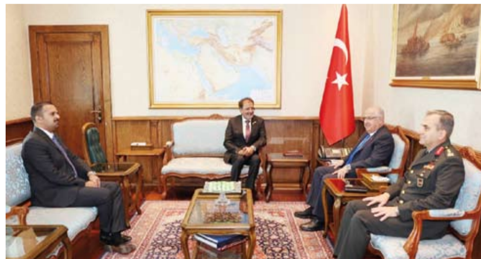
السفير وائل العنزي يلتقي وزير الدفاع التركي

أشاد سفير دولة الكويت لدى تركيا، وائل العنزي، الخميس الماضي، بمتانة العلاقات بين البلدين في شتى المجالات، مشيراً إلى أن زيارة صاحب السمو أمير البلاد الشيخ مشعل الأحمد إلى تركيا ساهمت بدعمها على الأصدقاء كافة.