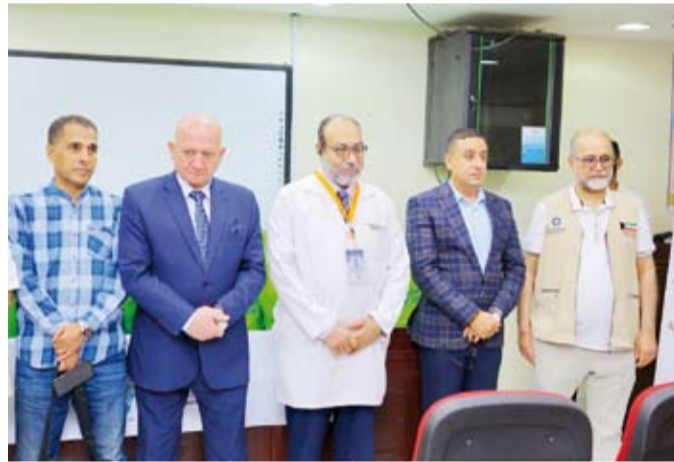
افتتاح توسعات مبادرة «قدم صحيح» في مستشفيات جامعة أسوان