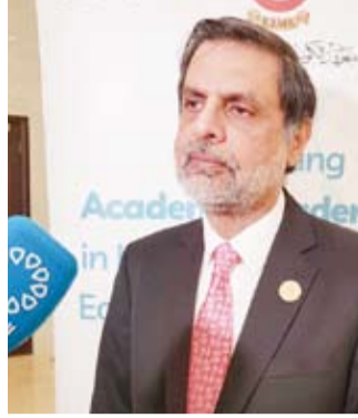
د. أسد حفيظ

أشادت منظمة الصحة العالمية، أمس، بالجهود التي تبذلها دولة الكويت في سبيل التوعية بمرض (دوشين) الذي يتسبب في ضمور العضلات بمختلف المحافل بهدف دعم التقدم في مجالات العلاج والرعاية للمرضى الذين جاء ذلك في بيان أصدره ممثل منظمة الصحة العالمية لدى دولة الكويت الدكتور أسد حفيظ بمناسبة إحياء اليوم العالمي للتوعية بمرض (دوشين) الذي يصادف السابع من سبتمبر من كل عام. وذكر البيان أن دولة الكويت لعبت دوراً بارزاً في الترويج للاحتفال باليوم العالمي للتوعية بمرض (دوشين) في مختلف المحافل بما في ذلك الأمم المتحدة في نيويورك بهدف تعزيز الفهم العميق للأضرار الجينية النادرة وتشجيع التشخيص المبكر ودعم التقدم في مجالات العلاج والرعاية. وأكد أن هذه الجهود تتجاوز الحدود الوطنية، حيث تنضم الكويت إلى المجتمع الدولي في السعي لتحسين حياة الأفراد المصابين بهذا المرض والأمراض الجينية المماثلة التي رغم أنها نادرة فإنها تؤثر بشكل كبير على جودة الحياة وتعرض تكاليف صحية كبيرة. ووصف ممثل المنظمة الأممية الدكتور أسد حفيظ، اليوم العالمي للتوعية بالمرض