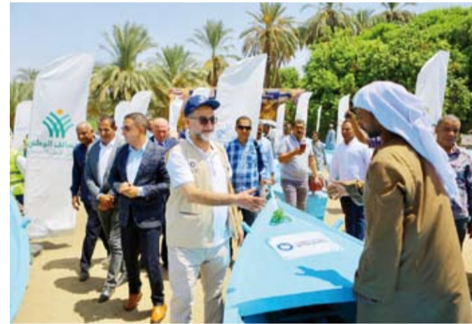
جانب من توزيع مركب الصيد

وتطوير حرفتهم عبر تزويدهم بمعدات حديثة تساعدهم على زيادة إنتاجهم وتحسين مستوى معيشتهم. مؤكداً أن الجمعية تعمل على تقديم الدعم النوعي الذي يسهم في تحسين حياة الأسر المتعففة. وأكد الأنصاري على عمق الروابط بين الشعبين الكويتي والمصري، مشيراً إلى أن جمعية النجاة الخيرية ستواصل دعمها للمشاريع التنموية والإنسانية في مصر بالتعاون مع شراكها، لتحقيق أقصى فائدة ممكنة للفئات المستحقة.