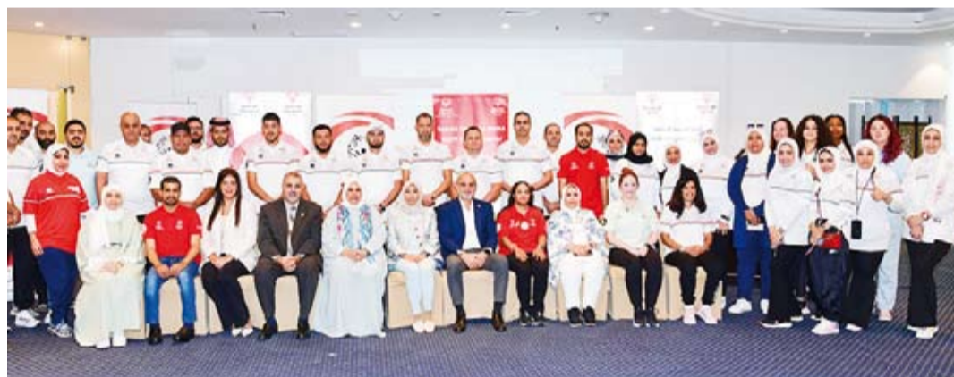
المشاركون بالدورة التدريبية

حد سواء". وأشادت جهود كوادر (نادي الطموح) و(الأولمبياد الخاص الكويتي) التي تزخر بالإمكانات اللافتة لرفع اسم البلاد في المحافل الدولية والعالمية.