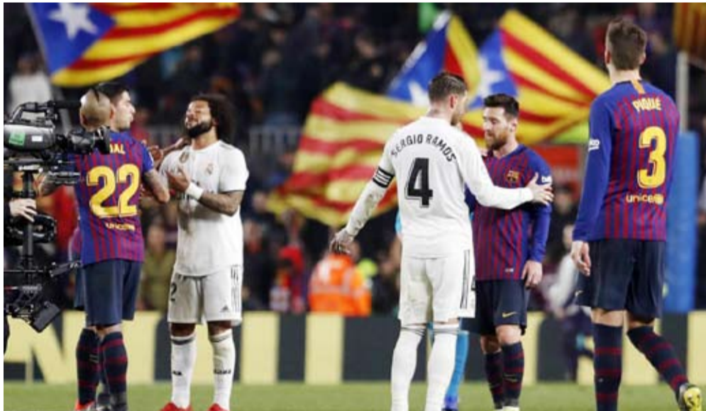
مطالبات بنقل الكلاسيكو خارج إسبانيا

وأُسفرت الاحتجاجات عن إصابة العشرات من المواطنين وأكثر من 40 من عناصر الشرطة وقوات الأمن.