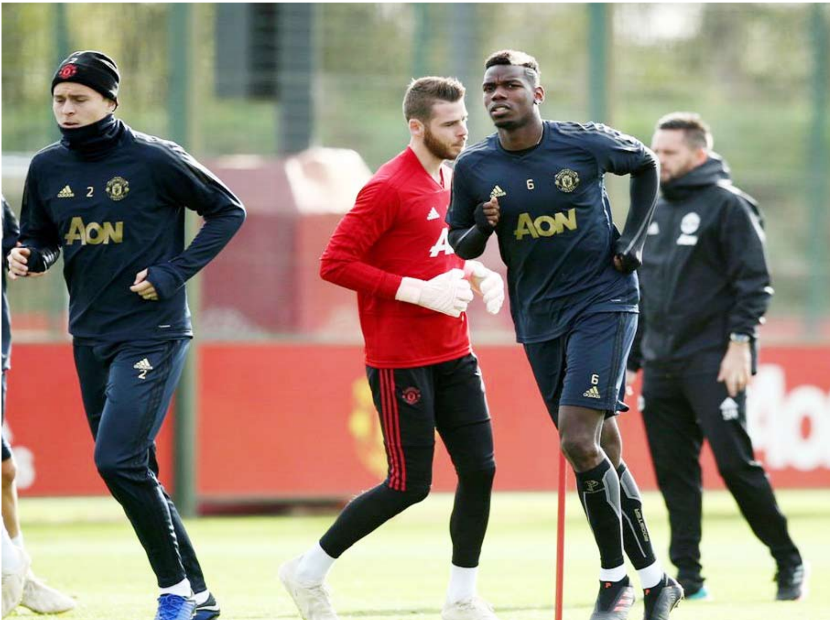
الإصابة تبعد دي خيا وبوغيا عن مانشستر يونايتد أمام ليفربول

على المشاركة. وكانت بداية ليفربول مغالية هذا الموسم بعد أن جمع 24 نقطة من ثماني مباريات وسيتمتع لمعادلة رقم مانشستر سيتي القياسي الذي يضم 18 انتصاراً متتالياً في دوري الأضواء عندما يحل ضيفاً على يونايتد في أول ترافورد.