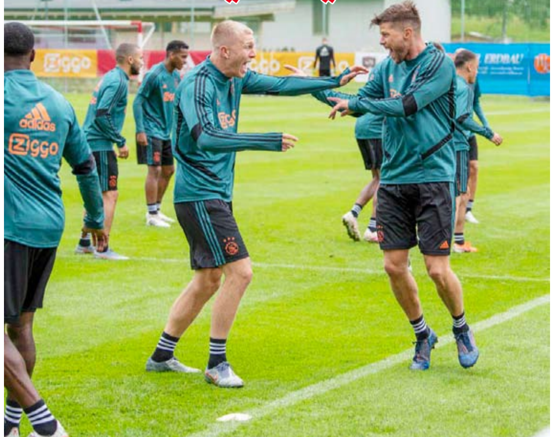
جانج من تدريبات اياكس

سيكون أياكس أمستردام الذي وصل إلى الدور نصف النهائي الموسم الماضي، أمام اختبار صعب في الدور التمهيدي الثالث من مسابقة دوري أبطال أوروبا موسم 2019-2020 بعدما أوقعت القرعة التي سحبت الإثنين، بمواجهة بطل اليونان باوك نيسالونيك. ورغم تنويجه بطلا للدوري الهولندي للمرة الـ44 وحصوله على فرصة جديدة لمحاولة الفوز بلقبه الخامس في دوري الأبطال الموسم الماضي قبل أن ينتهي مشواره في دور الأربعة على يد توتنهام الإنجليزي بالخسارة على أرضه 2-3 بعد أن فاز ذهاباً 1-0 صفر، لا يتأهل أياكس لتقافيا إلى دور المجموعات بسبب تصنيف الدوري الهولندي.