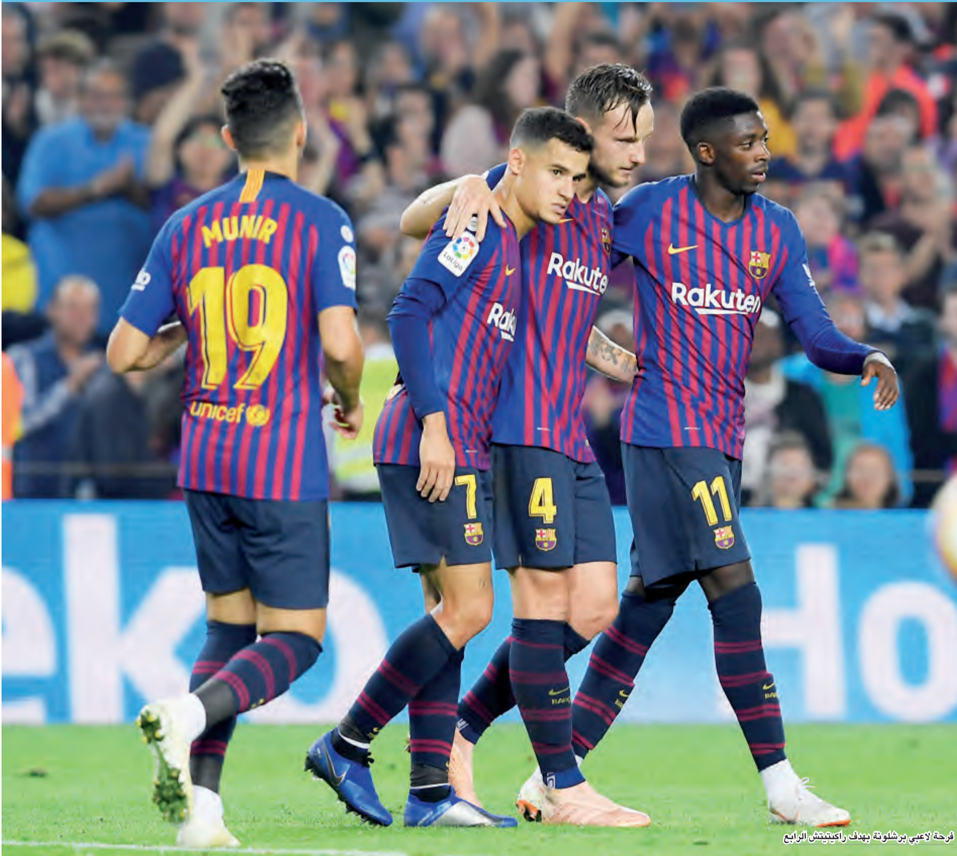
فرحة لاعبي برشلونة بهدف راكيتيش الرابع

أنهى برشلونة مسلسل عدم انتصاره في أربع مباريات بدوري الدرجة الأولى الإسباني لكرة القدم بالفوز 4-2 على أرضه على إشبيلية منافسه على الصدارة يوم السبت ليعود للقمّة على الرغم من أن هذا الانتصار أفسده خروج ليونيل ميسي مصاباً في ذراع.