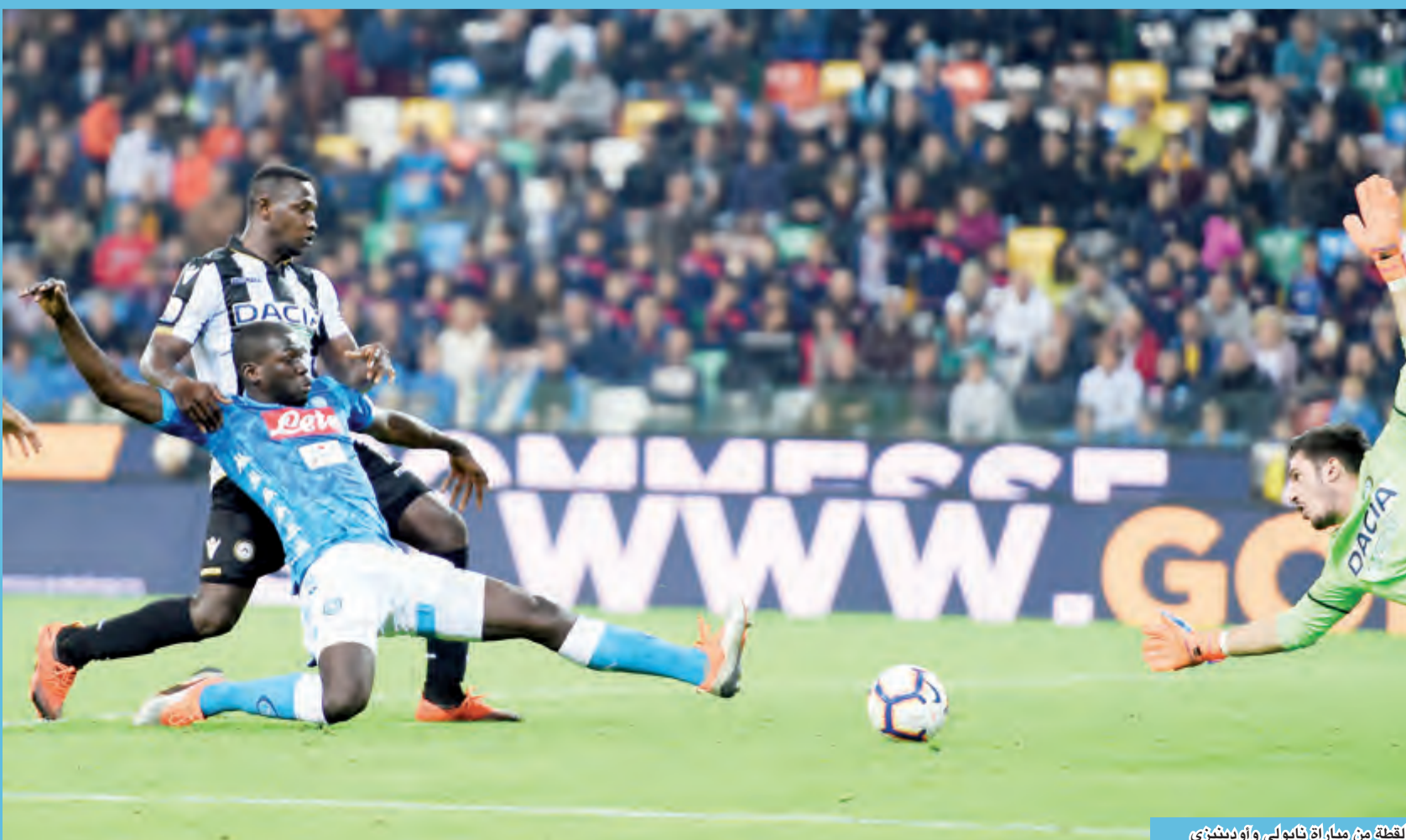
لقطة من مباراة نابولي وأودينيزي

يُعلم تعثر منافسه ليحصل على فرصة نادرة لتقليص الفارق.