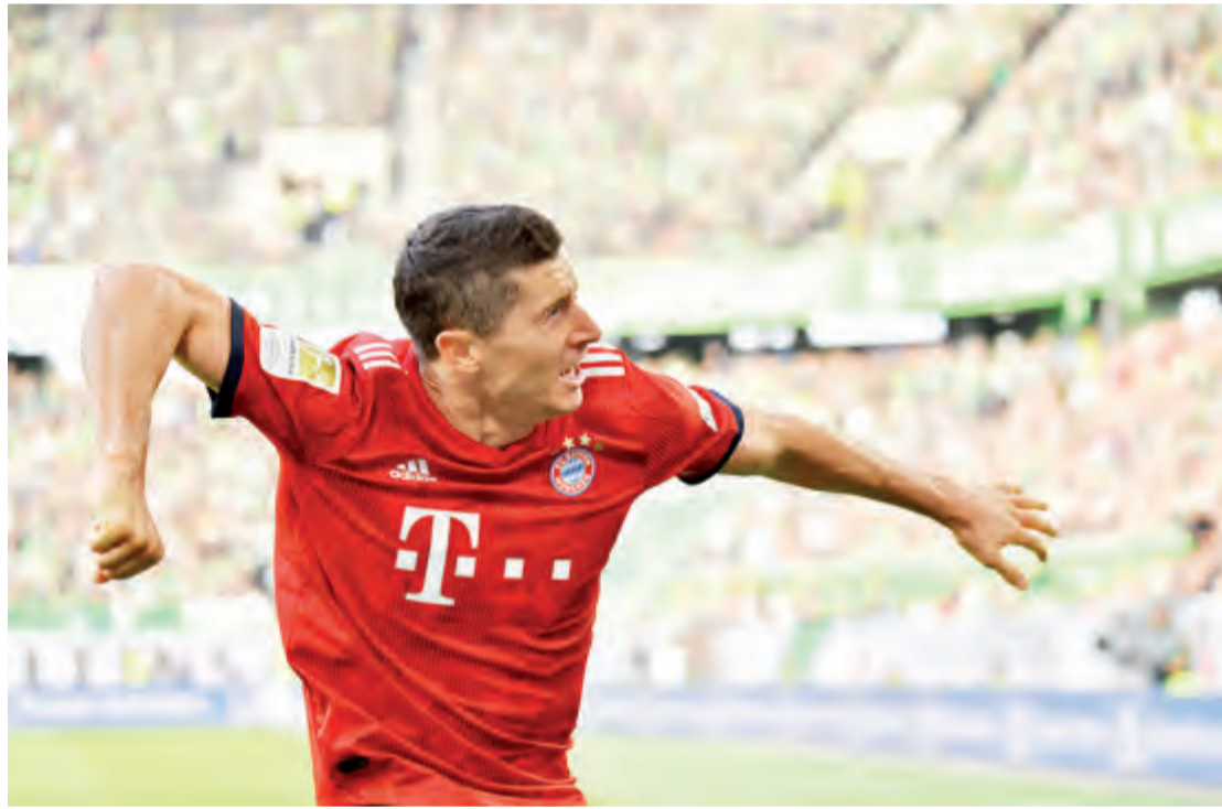
ليفاندوسكي ورقة بايرن الراجعة

يتطلع بايرن ميونخ الألماني إلى تكريس عودته للانتصارات، عندما يحل ضيفا على أينا أينا اليوناني اليوم الثلاثاء في الجولة الثالثة من دور المجموعات لدوري أبطال أوروبا في كرة القدم.