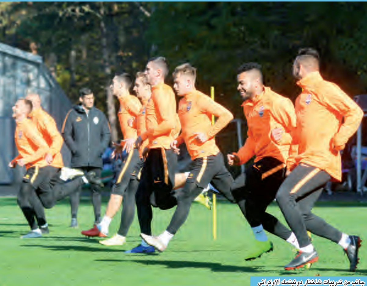
جانب من تدريبات شاختر دونيتسك الأوكراني

باولو فونسيكا فيعاني من عدم اليقين حول جهوزية إيفان أوردتس والبرازيلي تايسون. والتقى الفريقان الموسم الماضي في دور المجموعات حيث فاز شاختر على أرضه ذهابا 2-1 ورد سيتي الاعتبار إيابا بثلاثية نظيفة سجلها دي بروين وستيرلنج.