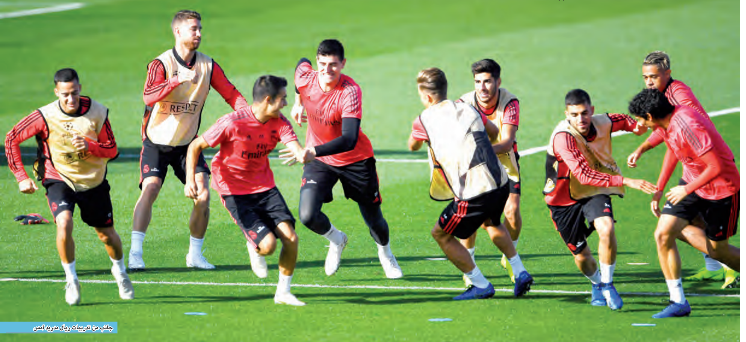
جانب من تدريبات ريال مدريد أمس

الذي سيفتقد الأرجنتيني لونييل ميسي المصاب. وقال لوبيتيغي بعد مباراة ليفانتي أنه يتفق بفرقه «أكثر من أي وقت»، مشيراً إلى أن مستقبله هو «آخر ما أفكر فيه». ما يشغلي حقا هو مساعدة الشبان (اللاعبين) على استعادة التوازن سريعا. تنتظرنا مباراة مهمة جدا بعد ثلاثة أيام في مسابقة دوري أبطال أوروبا. يتعين علينا مواصلة العمل والثقة بقدراتنا والإصرار، هذه هي الطريقة الوحيدة لتغيير الديناميكية».