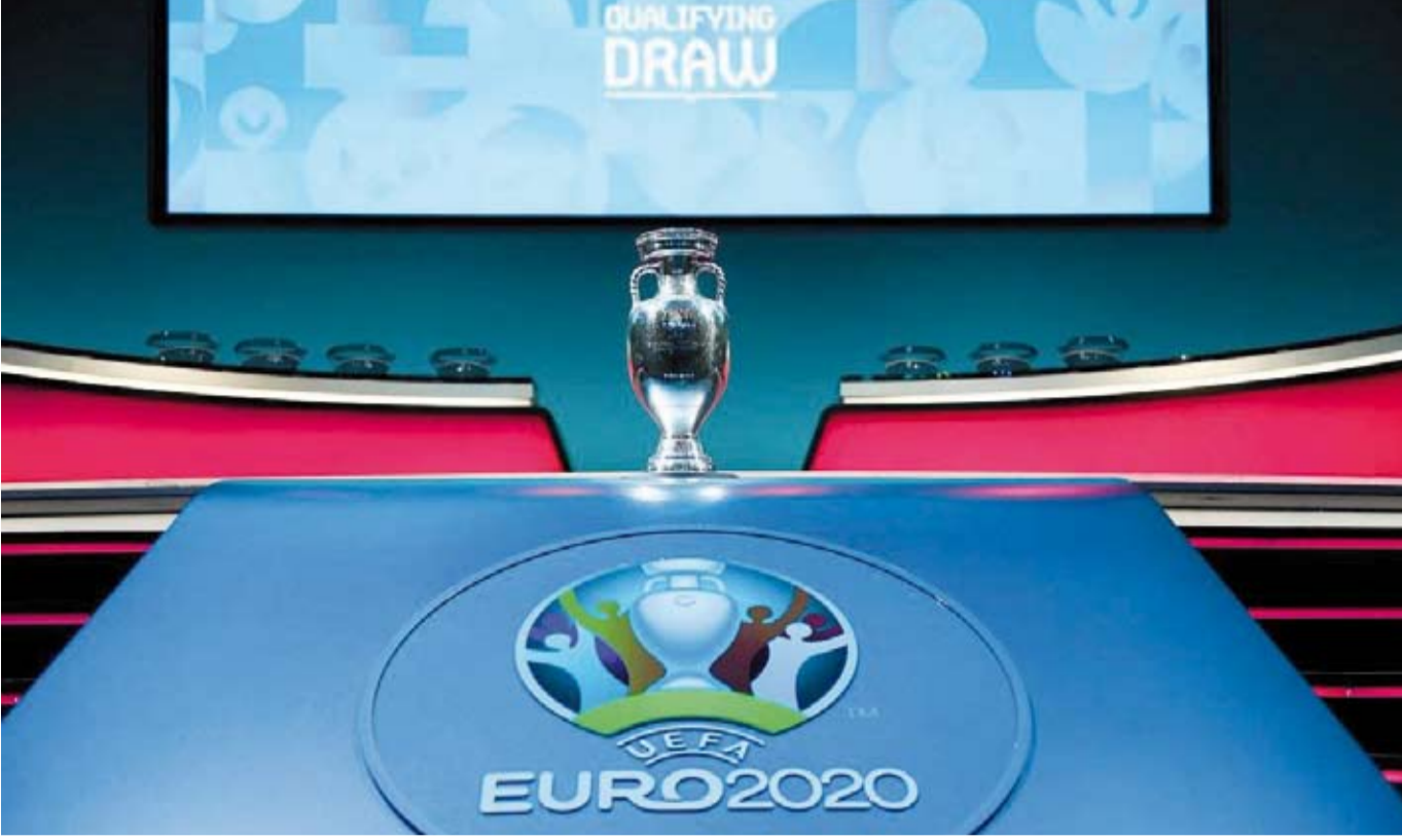
تصفيات يورو 2020 تنطلق اليوم

كما يلتقي المنتخب الجورجي نظيره السويدي، ومنتخب جبل طارق مع نظيره الإيرلندي في المجموعة الرابعة السبت المقبل.