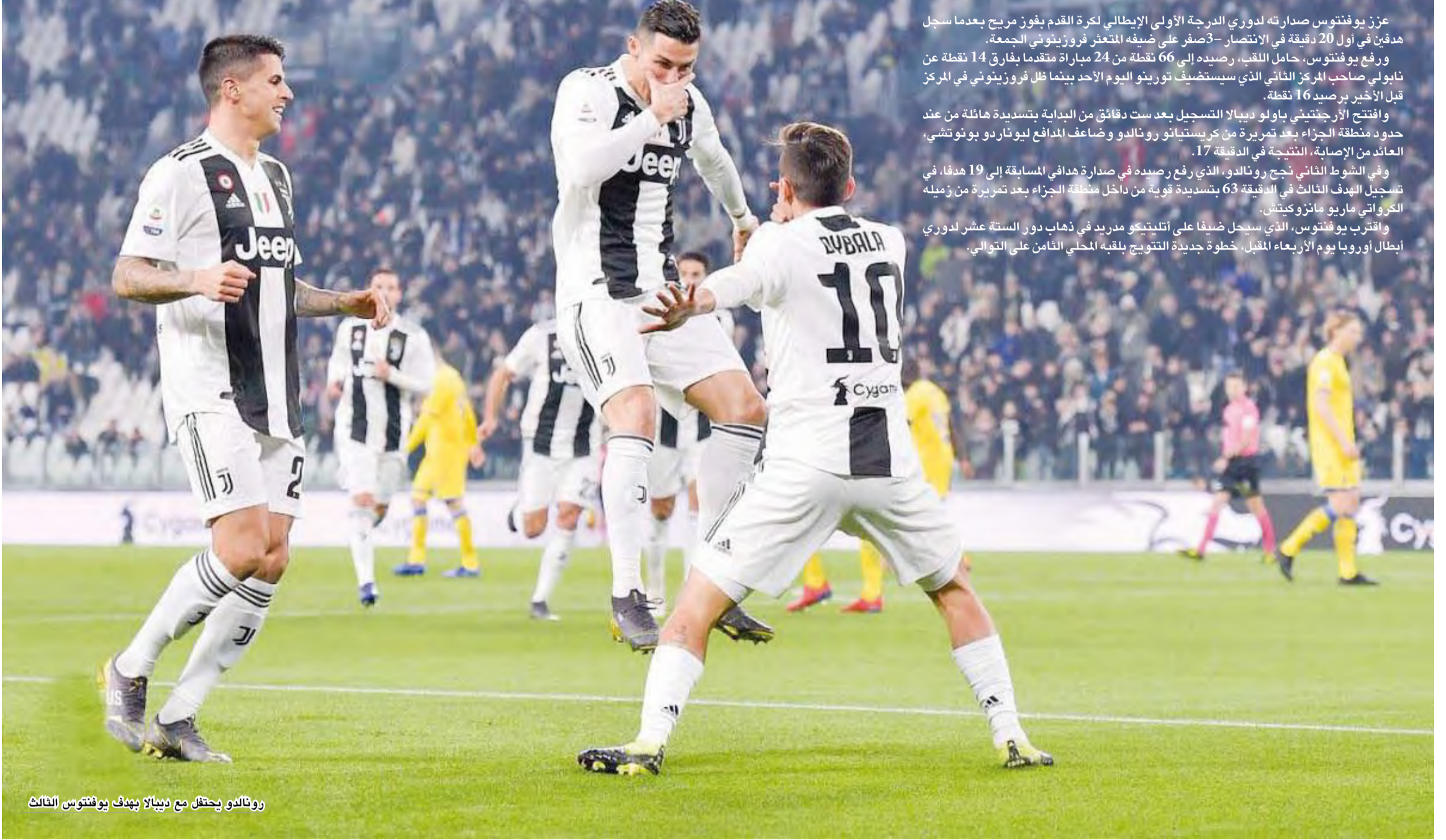
رونالدو يحتفل مع دييالا بهدف يوفنتوس الثالث

عزز يوفنتوس صدارته لدوري الدرجة الأولى الإيطالي لكرة القدم بفوز مريح بعدما سجل هدفين في أول 20 دقيقة في الانتصار 3-0 على ضيفه المتعثر فروزينوني الجمعة. ورفع يوفنتوس، حامل اللقب، رصيده إلى 66 نقطة من 24 مباراة متقدماً بفارق 14 نقطة عن نابولي صاحب المركز الثاني الذي سيستضيف تورينو اليوم الأحد بينما ظل فروزينوني في المركز قبل الأخير برصيد 16 نقطة. وافتتح الأرجنتيني باولو دييالا التسجيل بعد ست دقائق من البداية بتسديدة هائلة من عند حدود منطقة الجزاء بعد تمريرة من كريستيانو رونالدو وضاعف المدافع ليوناردو بونوتشي، العائد من الإصابة، النتيجة في الدقيقة 17. وفي الشوط الثاني نجح رونالدو، الذي رفع رصيده في صدارة هدافي المسابقة إلى 19 هدفاً، في تسجيل الهدف الثالث في الدقيقة 63 بتسديدة قوية من داخل منطقة الجزاء بعد تمريرة من زميله الكرواتي ماريو مانزوكيتش. واقترب يوفنتوس، الذي سيحل ضيفاً على أتلتيكو مدريد في ذهاب دور الستة عشر لدوري أبطال أوروبا يوم الأربعاء المقبل، خطوة جديدة للتتويج بلقبه المحلي الثامن على التوالي.