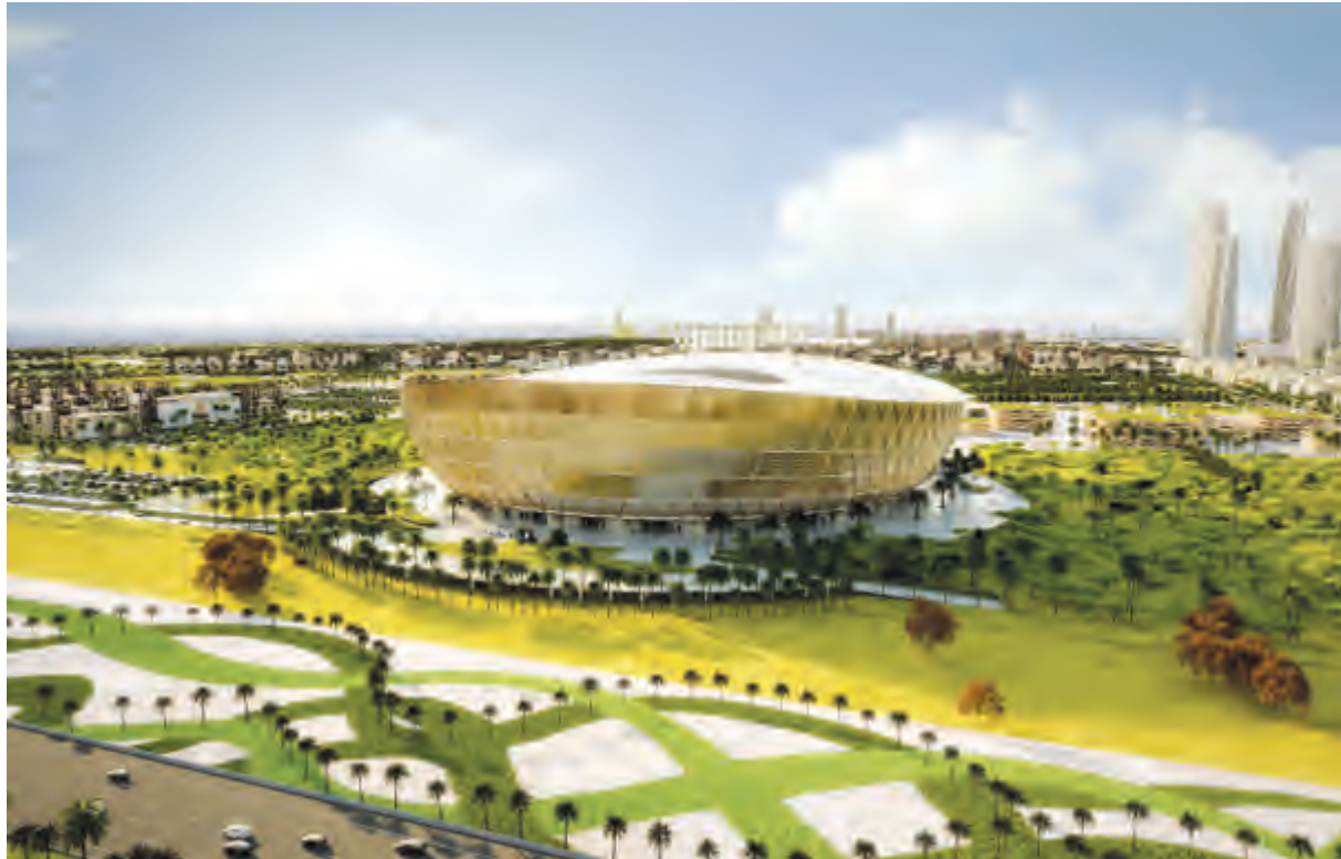
الشكل النهائي بعد اكتمال تصميم ملعب لوسيل