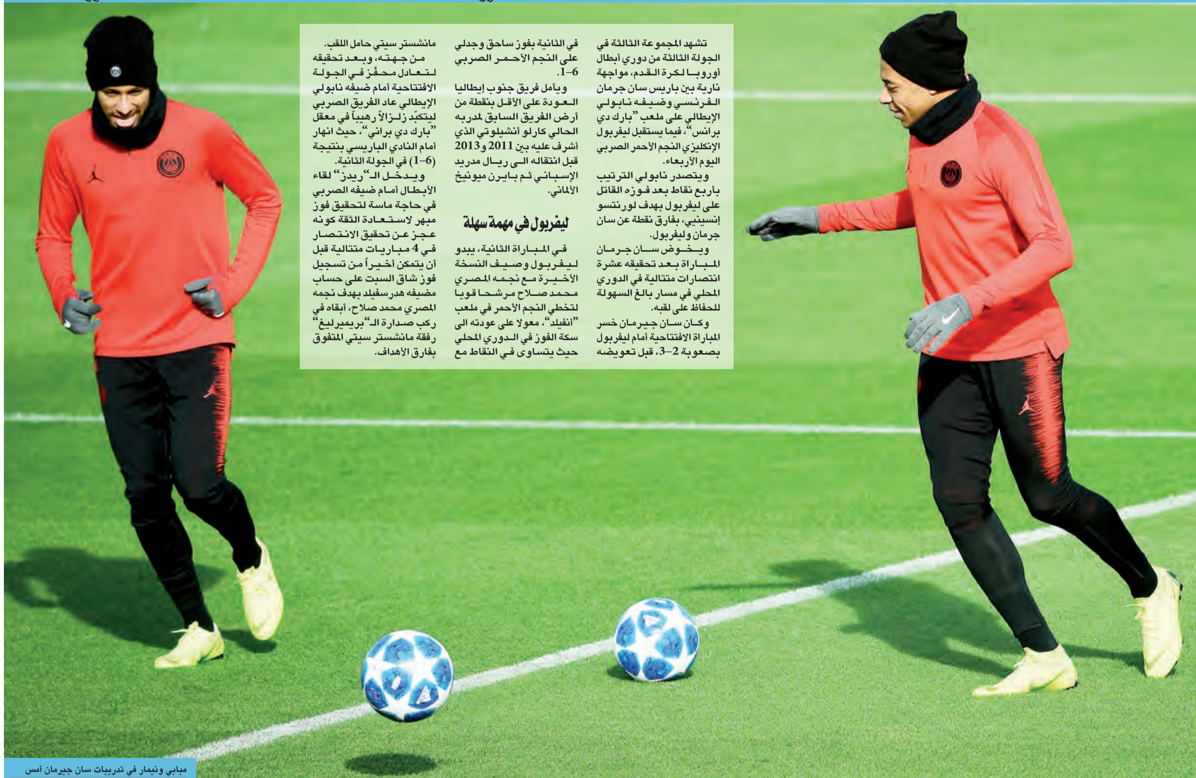
مباي ونيمار في تدريبات سان جيرمان أمس

مانشستر سيتي حامل اللقب. من جهته، وبعد تحقيقه لتعادل محفّز في الجولة الافتتاحية أمام ضيفه نابولي الإيطالي عاد الفريق الصربي ليتكبّد زلزالاً رهيباً في معقل "بارك دي براني"، حيث أنهار أمام النادي الباريسي بنتيجة (1-6) في الجولة الثانية. ويدخل الـ"ريدز" لقاء الإبطال أمام ضيفه الصربي في حاجة ماسة لتحقيق فوز مبهز لاستعادة الثقة كونه عجز عن تحقيق الانتصار في 4 مباريات متتالية قبل أن يتمكن أخيراً من تسجيل فوز شاق السبت على حساب مضيفه هيرسفلد بهدف نجمة المصري محمد صلاح، إبقاه في ركب صدارة الـ"بريميرليغ" رفقة مانشستر سيتي المتفوق بفارق الأهداف.