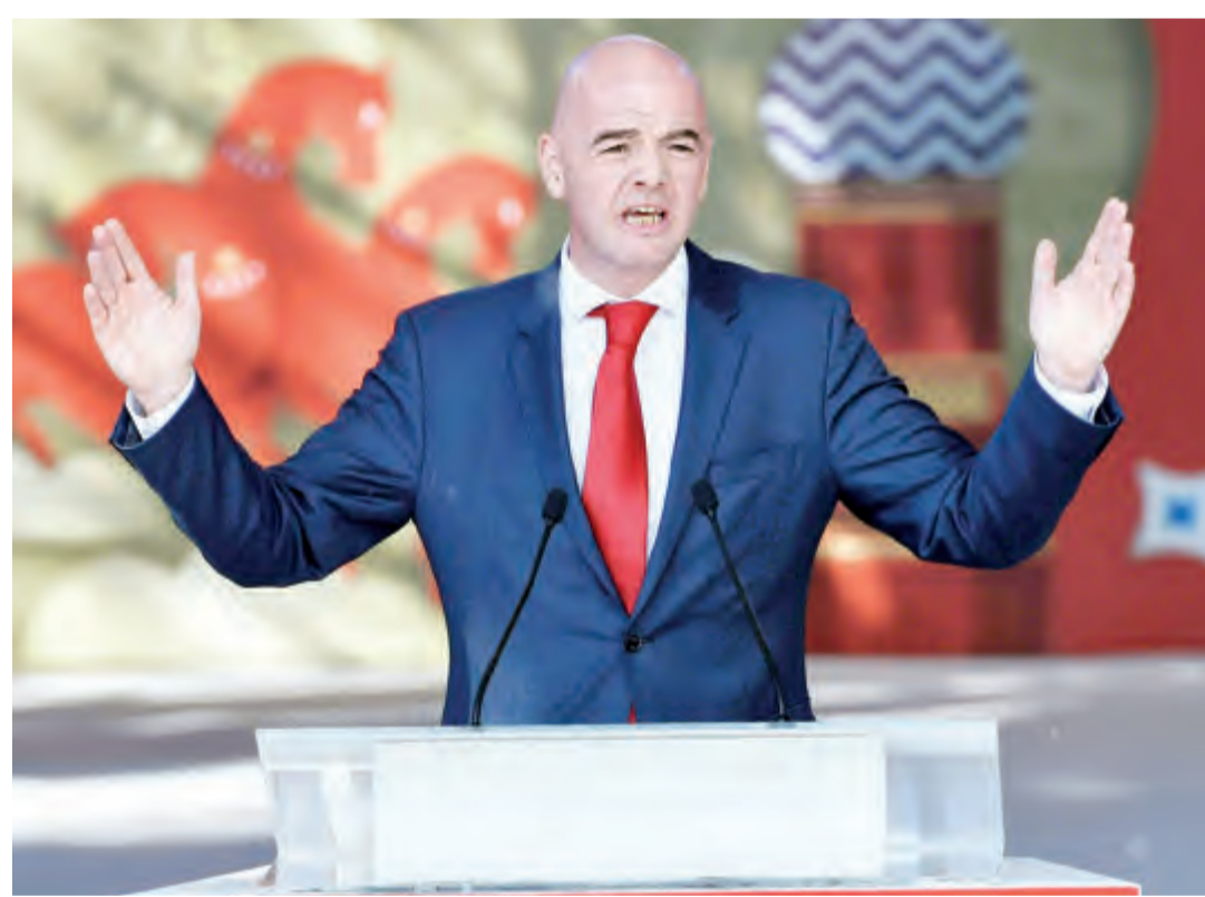
جيانى إنفانتينو رئيس الاتحاد الدولي لكرة القدم

«معبية ويغلب عليها الطابع التجاري» واتهم الفيفا ببيع روح اللعبة. ولم تكن هذه المقررات ضمن جدول أعمال المؤتمر السنوي للفيفا الذي عقد في موسكو في يونيو.