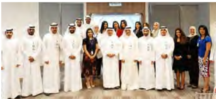
الهيئة تكرم موظفيها

ومما يلي احتياجات المتدربين. تهيئهم لسوق العمل، وفي ختام الحفل تم تكريم المتدربين والبالغ عددهم 19 متدرب ومتدربة، وتم تسليم شهادات اجتياز البرنامج التدريبي.