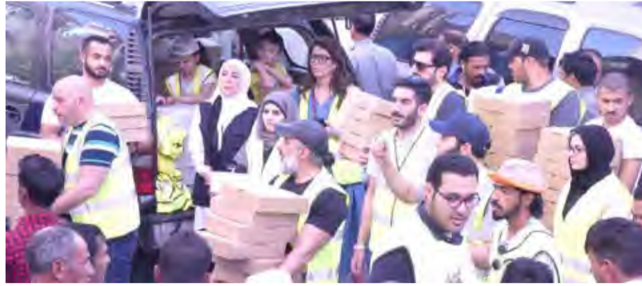
فريق المتحد التطوعي يوزعون المجاملة

بتوزيع المجاملة على الأسر الأكثر احتياجاً خلال شهر رمضان المبارك لنؤمن لهم مؤونة شهر رمضان وفقاً لأفضل المواصفات الغذائية مما يقلل من الهدر في الطعام في حال توزيع وجبات جاهزة للإفطار. هذا بالإضافة إلى أن توزيع المؤونة يوفر للمحتاجين على أفضل إعداد الطعام في بيوتهم بأنفسهم مما يحفظ لهم كرامتهم. وأضافت دشنتي نحن فخورين بالجهد الذي بذله الفريق التطوعي من موظفي البنك والذين أبدوا حماساً كبيراً للمشاركة في تجهيز وتغليف صناديق المجاملة وتوزيعها قبيل الإفطار في مناطق مختلفة من الكويت ومنها صباحان وجليب الشيوخ، وغيرها.