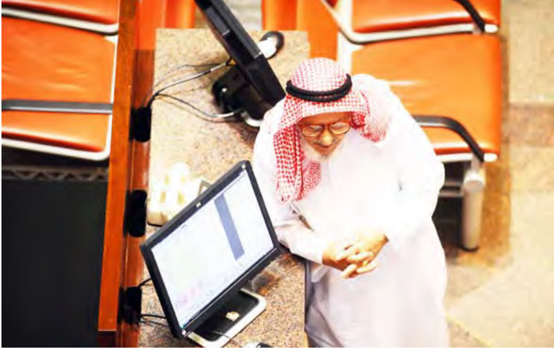
مداول في البورصة

رفع الأسعار إلى الأعلى ثم عملية التصريف ومن ثم عملية الهبوط والضغط على الأسهم للجمع مرة أخرى.