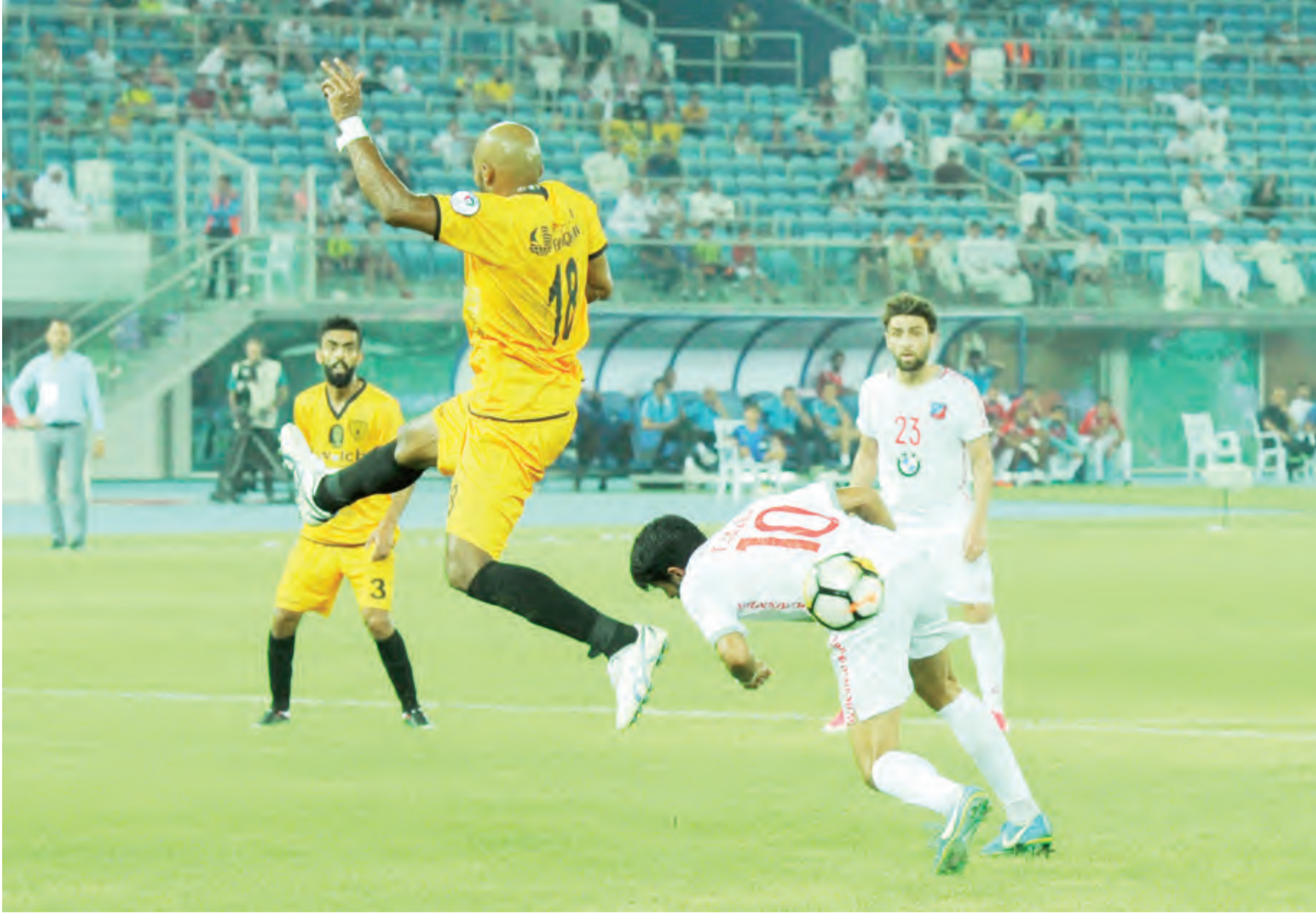
لقطة من مواجهة سابقة بين الكويت والقادسية