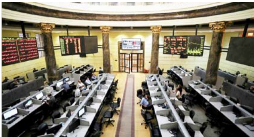
البورصة المصرية في القاهرة

قال مسؤول في المجموعة المالية هيرميس إن الشركة تعمل على طرح شركتين من القطاع الخاص ببورصة مصر "بين الربع الثالث والربع من 2019، إحداهما بقطاع التكنولوجيا".