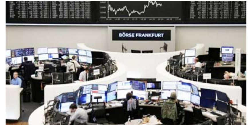
متعاملون في بورصة فرانكفورت

قادت شركات التكنولوجيا تراجعاً في الأسهم الأوروبية أمس الخميس مع إعلان ساب للبرمجيات عن نتائج ضعيفة في أحدث إشارة إلى تداعيات حرب التجارة الطويلة بين الولايات المتحدة والصين على نتائج الشركات. ونزل سهم شركة التكنولوجيا الأوروبية الأعلى قيمة 6.9 بالمائة بعد أن أبلغت المستثمرين أن عليهم الانتظار حتى العام القادم من أجل تحسين كبير في هوامش الأرباح مع إعلان مجموعة برمجيات