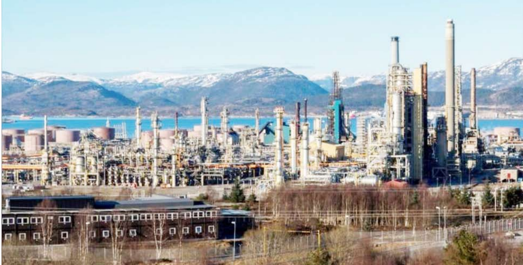
مصفاة نفط في النرويج

تباين اتجاه أسعار النفط أمس الخميس مع مواصلة الخام الأميركي خسائره بعد أن انخفض في الجلسة السابقة عقب بيانات أظهرت ارتفاع مخزونات الولايات المتحدة من المنتجات مثل البنزين بقوة الأسبوع الماضي، مما يشير إلى ضعف الطلب خلال موسم الرحلات الصيفية.